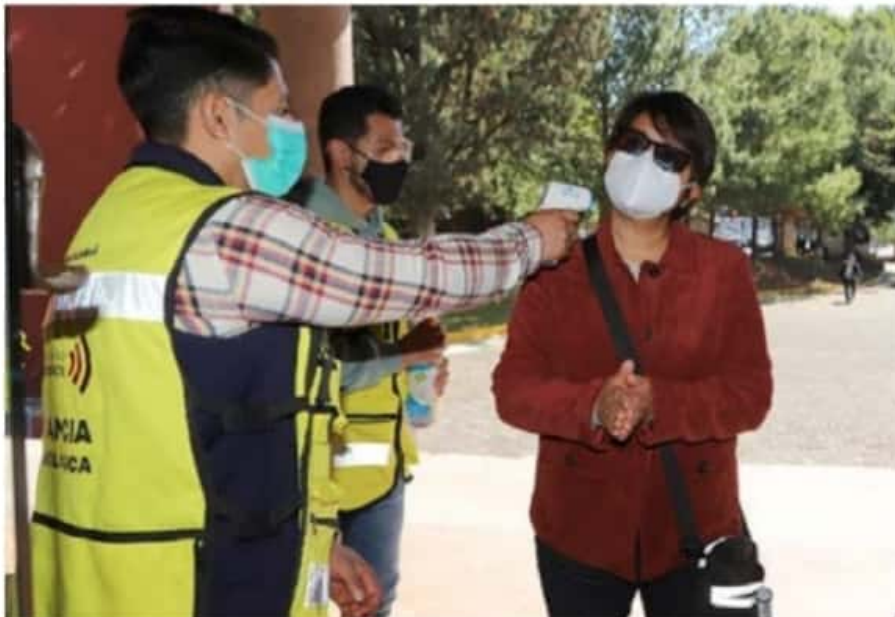
Según la SSM, Lázaro Cárdenas y otros seis municipios, son pieza clave para evitar una tercera ola de contagios de COVID-19.