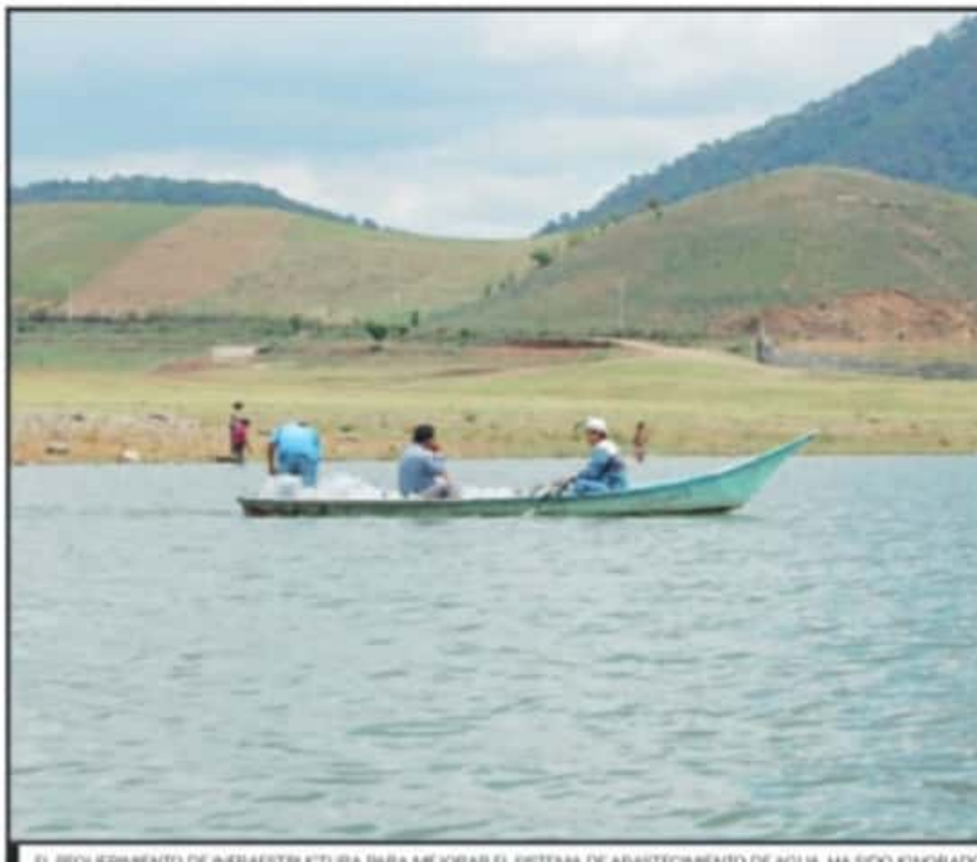
EL REQUERIMIENTO DE INFRAESTRUCTURA PARA MEJORAR EL SISTEMA DE ABASTECIMIENTO DE AGUA, HA SIDO IGNORADO

Al respecto, el Gobierno de Michoacán se pronunció preocupado por la gran demanda que tienen los embalses locales para suministrar el vital líquido a otras regiones del país. En voz del Gobernador Silvano Aureoles Conejo, a pesar de que se ha solicitado a la federación por vía de la Comisión Nacional del Agua mayores aportaciones para el