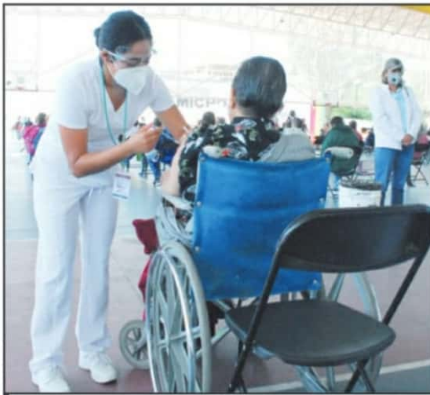
PERSONAL MÉDICO DE LOS MÓDULOS DE APLICACIÓN DE LA VACUNA CONTRA COVID-19. LABORARÁN HASTA EL JUEVES.

"Los eventos supuestamente atribuibles a la vacuna se han reportado a nivel nacional, se han atendido y no hemos tenido ningún problema en su atención. Se han ido a casa sin mayor complicación. Se sesiona posterior al reporte para tipificarlos y dar una indicación para cada una de estas personas. El primer caso que tuvimos en una trabajadora de salud de Nueva Italia, la indicación después de la sesión con Epidemiología Nacional fue no poner la segunda dosis y así se va a analizando cada uno de los casos", concluyó.