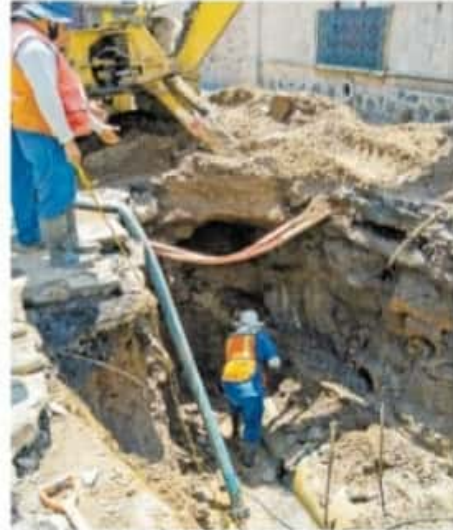
El OOAPAS ha estado haciendo diferentes mejoras en cuestión de gestión del agua

Argumentó que del 50 por ciento de pérdida del agua, podrían llegar a sólo un 20 por ciento una vez reparadas las fugas