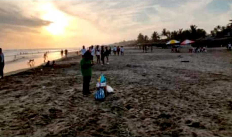
CD. LÁZARO CÁRDENAS, MICH.- La Comisión Estatal contra Riesgos Sanitarios, dio a conocer que las playas michoacanas están libres de enterococos.