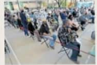
A Michoacán llegarán 77 mil vacunas CanSino

Apuntó que en Michoacán los municipios con mayor número de muertos por Covid-19 son Morelia con mil 341, Uruapan con 455 y Lázaro Cárdenas con 394.