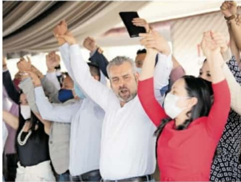
Ramírez Bedolla explicó que no han recibido la notificación por parte del INE / NAN ARIAS