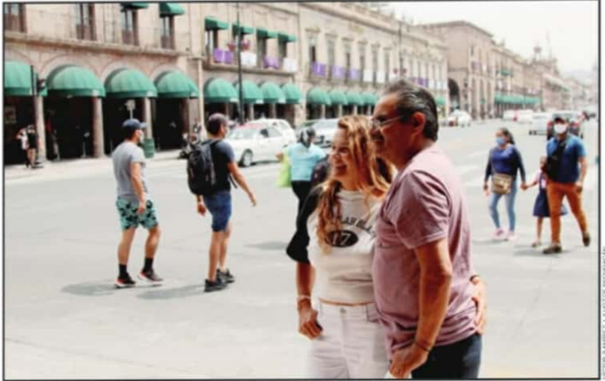
AUTORIDADES DE PROTECCIÓN CIVIL LLAMAN A LOS VISITANTES A TOMAR EXTREMAS MEDIDAS DE PRECAUCIÓN AL SALIR DE CASA Y CUIDARSE DE LA COVID-19.