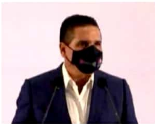
MORELIA, MICH.- El gobernador afirmó que está cumpliendo la mayor parte de los compromisos, porque el tiempo ya se agota y los periodos se terminan.

En materia de educación, informó que este martes sostendrá la primera reunión con la nueva titular de la Secretaría de Educación Pública (SEP) "para revisar los pendientes que hay con Michoacán y el compromiso del presidente con los maestros. "Dejaremos una infraestructura mejor con más de 4 mil nuevas escuelas"