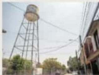
Hará falta el agua para los morelianos en los próximos meses

Agregó que lo resta de este mes, a abril