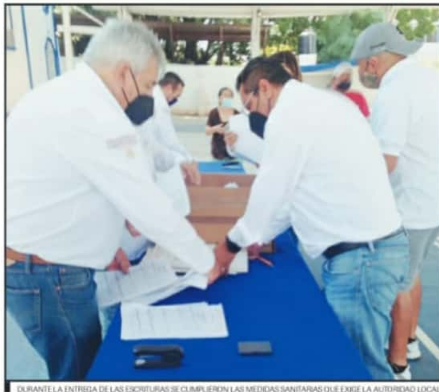
DURANTE LA ENTREGA DE LAS ESCRITURAS SE CUMPLIERON LAS MEDIDAS SANITARIAS QUE EXIGE LA AUTORIDAD LOCAL

Mora Figueroa, reveló que un ejemplo de la dificultad del proceso es el inadecuado resguardo y orden de su documentación de los colonos, como se pudo constatar en esta entrega, afirmó, ya