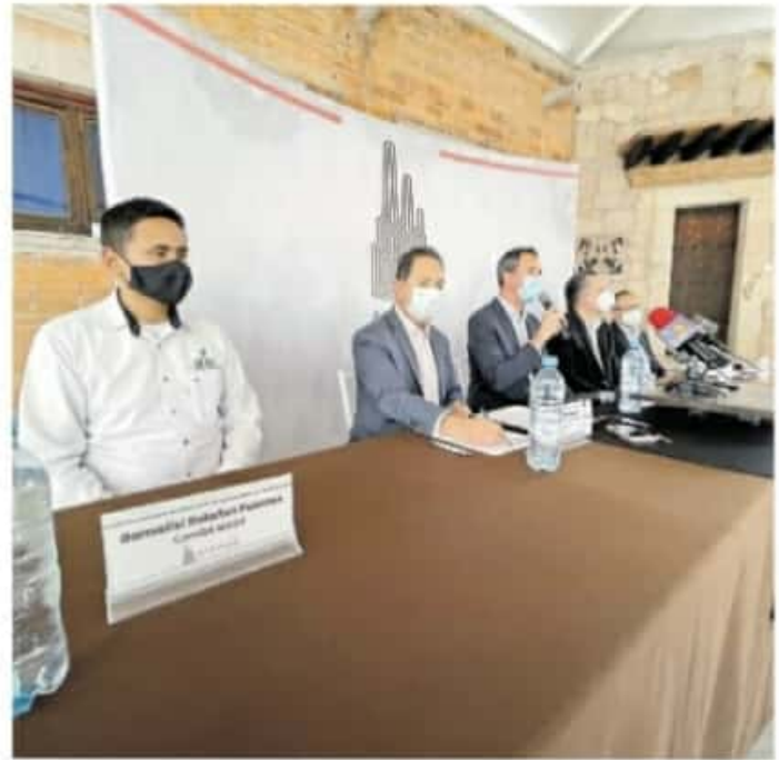
AIEMAC es un organismo empresarial representante de los principales industriales en Michoacán. / ANA MARÍA CANO

"Ambas normas van de la mano, no pueden ir separadas, son normas internacionales que acatan 163 países y que hablan de la calidad del servicio que se ofrece al cliente y la responsabilidad que del producto a ofrecer, pero deben acatar las