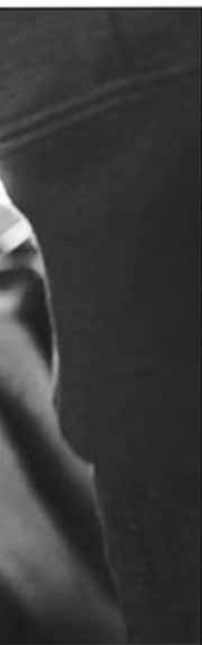
ADO DURANTE LOS ÚLTIMOS AÑOS.

entre sus prioridades atender esta problemática.