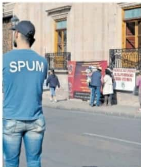
Se convocará una Asamblea General Extraordinaria para elegir al Comité 2021-2024.