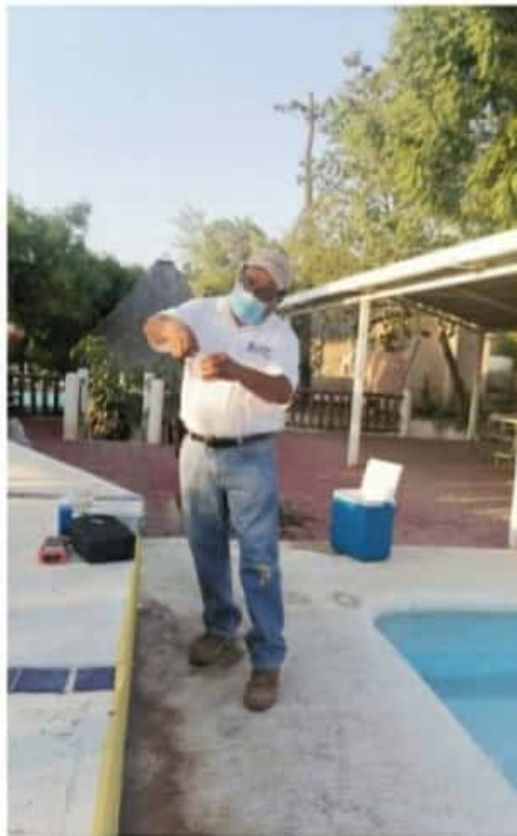
APATZINGÁN, MICH.- Tras la detección de amiba en el muestreo de agua de uno de los balnearios más grandes de la región, la Coepris suspendió su funcionamiento.

Finalmente, el coordinador de Coepris, precisó que a partir se mantendrán las supervisiones en los balnearios del municipio, no sólo para cuidar se cumplan las medidas sanitarias por el Coronavirus, también que la calidad en el agua esté en buenas condiciones y con higiene.