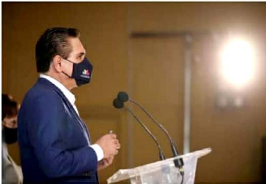
Llama Gobernador a la responsabilidad personal y familiar de las y los michoacanos.

"Las cifras son alentadoras, el índice de contagios bajó, eso es un buen dato, en la tabla nacional regresamos al 14, la ocupación hospitalaria está de 19 a 20 por ciento, en marzo se ha dado una disminución muy significativa, pero hay que tomarlo con reserva, no hay que echar campanas al vuelo", apuntó.