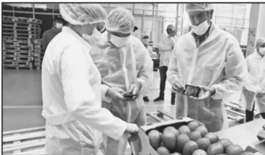
AGRONEGOCIOS RECONOCEN LA IMPORTANCIA DE LA CERTIFICACIÓN PARA AMPLIAR LA VENTA DE SUS PRODUCTOS.

formales en el estado, del sector industrial