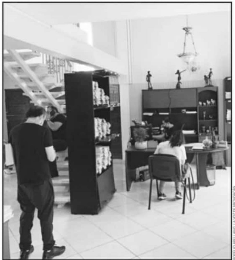
LA DEFENSORÍA REGIONAL DEL TRIBUNAL DE JUSTICIA ADMINISTRATIVA TENDRÁ APOYO DE NUEVO JUZGADO EN LA MATERIA.

TITULAR DE LA DEFENSORÍA EN ESTA REGIÓN DEL ESTADO