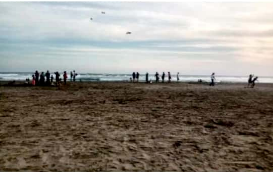
CD. LÁZARO CÁRDENAS, MICH.- Para esta Semana Santa, Lázaro Cárdenas forma parte de las siete regiones claves en el estado para evitar una tercera ola de contagios masivos de Covid-19.

Hasta el 28 de marzo, la dependencia estatal de salud posicionó al municipio costero como la tercera con más defunciones, al registrar 394 fallecidos. Con fecha de corte al día de ayer, Lázaro Cárdenas registra 6 mil 275 casos confirmados, 94 activos, 419 defunciones, una letalidad del 6.68 por ciento y una positividad del 47.7 por ciento.