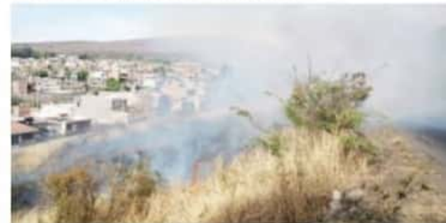
ZAMORA, MICH.- Para el Ayuntamiento, es prioridad estar de manera permanente con una estrategia de control de fuego.

Agregó que las brigadas han estado atendiendo los llamados de productores agrícolas y población en general para combatir incendios en áreas cerriles, campos y caminos agrícolas.