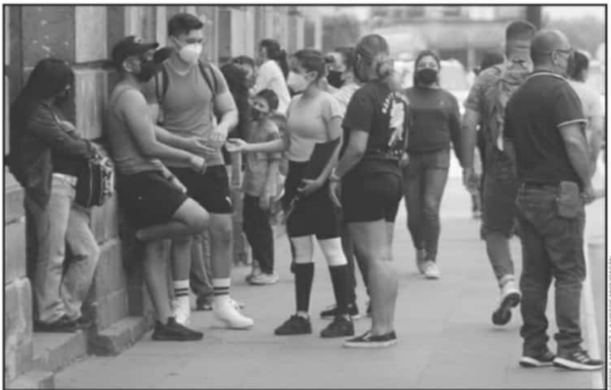
LOS JÓVENES TIENEN ALTO RIESGO DE INFECCIÓN, SOBRETODÓ DURANTE ESTE PERIODO VACACIONAL: SE LES EXHORTA A QUE EVITEN LAS AGLOMERACIONES.

la variable más importante de la pandemia y debe mantenerse por debajo de 1, actualmente es de 0.84. Además, el estado presenta 10 puntos en el semáforo epidemiológico nacional por COVID-19 y una ocupación camas del 20 por ciento de las camas dedicadas a esta enfermedad. Sin embargo, en los últimos 28 días, se han registrado 563 defunciones por esta causa.