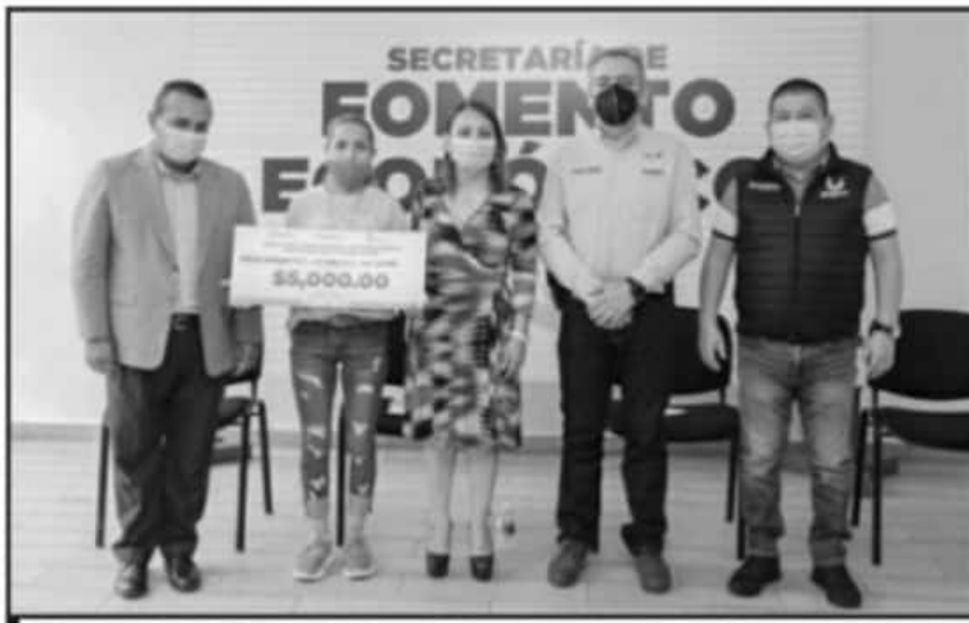
DURANTE EL EVENTO, EN EL AUDITORIO DE LA UNIDAD DEPORTIVA SE ENTREGARON CRÉDITOS PALABRA DE MUJER