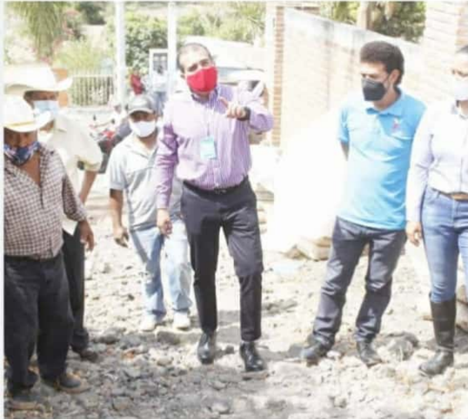
IXTLÁN DE LOS HERVORES, MICH.- El edil de Ixtlán, comentó que esta obra no sería posible sin el apoyo y colaboración de la ciudadanía.

Esta obra cuenta con recurso propio del ayuntamiento y se espera que esté concluida en aproximadamente un mes, pues en ella trabajarían desde personal de obras públicas y ciudadanos comprometidos.