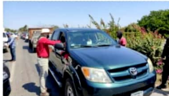
CD. LÁZARO CÁRDENAS, MICH.- El Comité Jurisdiccional de Seguridad en Salud de Lázaro Cárdenas determinó implementar filtros sanitarios jueves, viernes, sábado y domingo, en este periodo vacacional de Semana Santa.