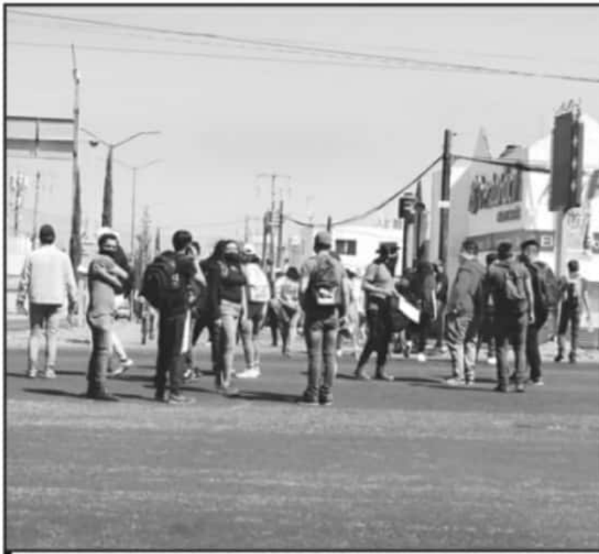
LA ONOEM MANIFIESTA QUE SEGUIRÁN LAS ACTIVIDADES DE PRESIÓN PARA LOGRAR QUE PETICIONES SEAN ESCUCHADAS.

El vocero expuso que existe mucha necesidad de maestro en los niveles, "con base a nuestra información exigimos un número mayor, mil 250 espacios es lo que exigimos a la autoridad,