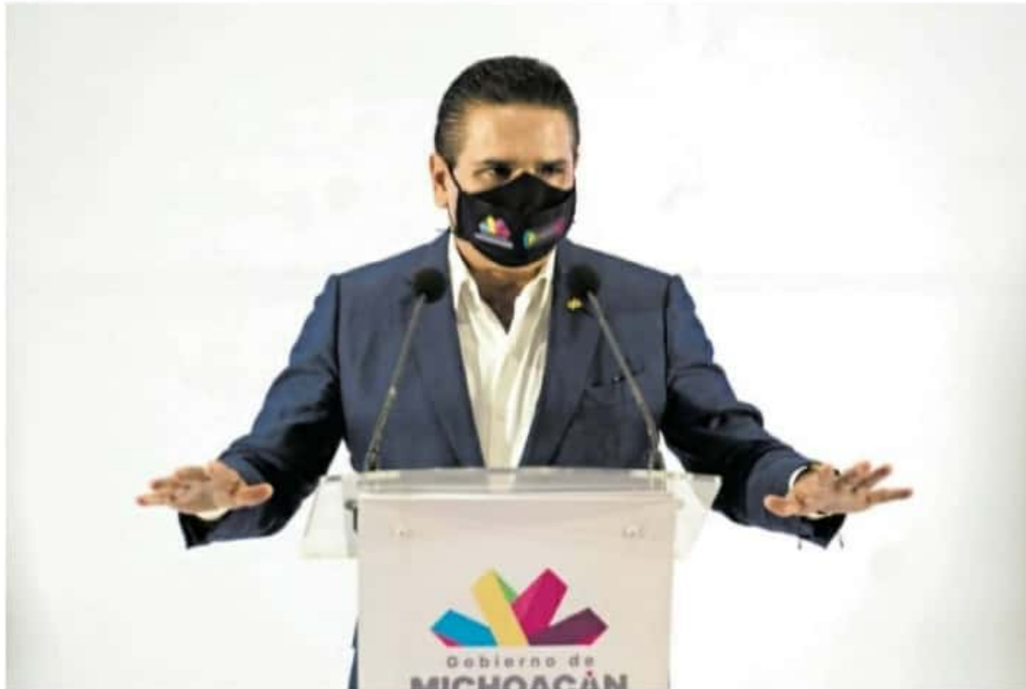
Silvano Aureoles, gobernador del estado, a un paso de dejar el cargo