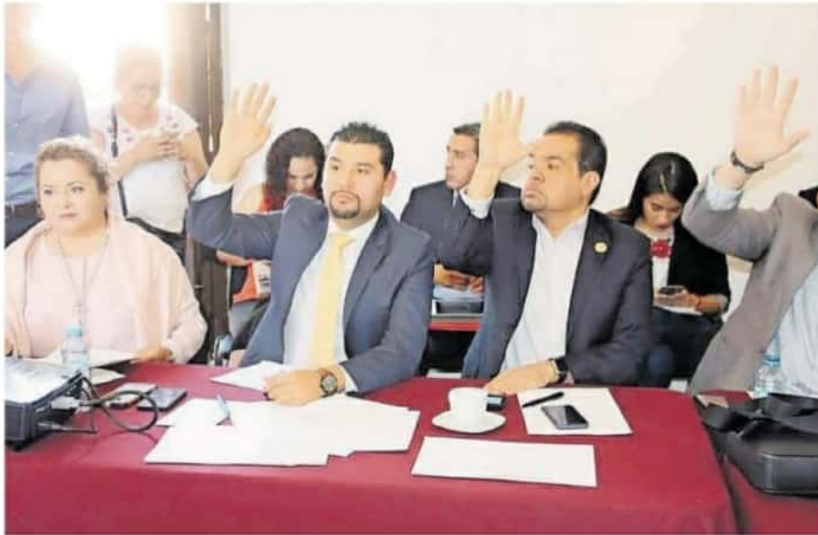
Entre las iniciativas que esperan su análisis se encuentra una para ser Ley el Uso Obligatorio del Cubrebocas