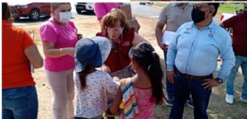
CD. LÁZARO CÁRDENAS, MICH.- Con la finalidad de combatir el trabajo infantil y la violación de los derechos de los menores, el Sistema DIF Municipal implementó un operativo en los diferentes semáforos del municipio.