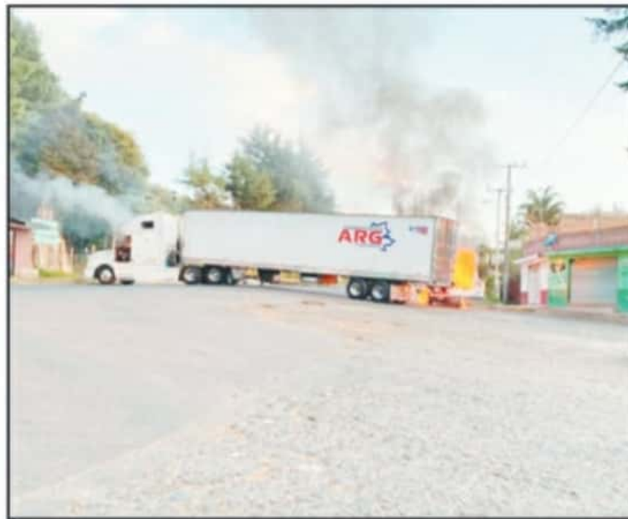
EL MUNICIPIO DE SALVADOR ESCALANTE A SIDO UN FOCO DE ALERTA ANTE LA VIOLENCIA Y LOS NARCOSBLOQUEOS

Silvano Aureoles, GOBERNADOR DE MICHOACÁN