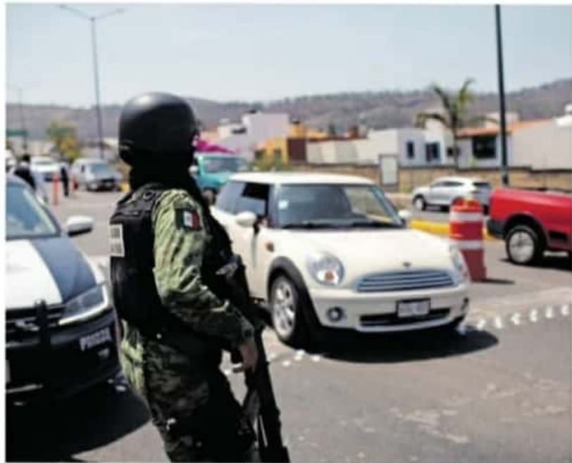
Aún no se completa la primera semana del 2021 y Michoacán ya registró múltiples episodios violentos. IVAN ARIAS

La FGE confirmó que los crímenes presuntamente fueron perpetrados por civiles que viajaban a bordo de una motocicleta.