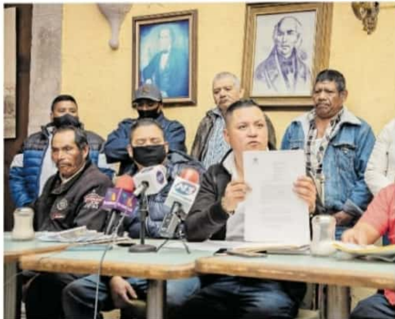
Destacó que el CSIM haya presentado ante el INE un acta con 33 firmas de habitantes de Sevina y cuatro de Nahuatzen. CARMEN HERNÁNDEZ

"Le pedimos al Consejo Supremo que no intervenga en los temas administrativos de nuestras comunidades y así evitar generar más conflictos. A nuestros paisanos que forman parte de algún consejo indígena les decimos que tienen todo el derecho de pensar distinto, pero los invitamos a resolver las diferencias apelando a los tribunales, no más agresiones entre nosotros, entre las familias y nues-