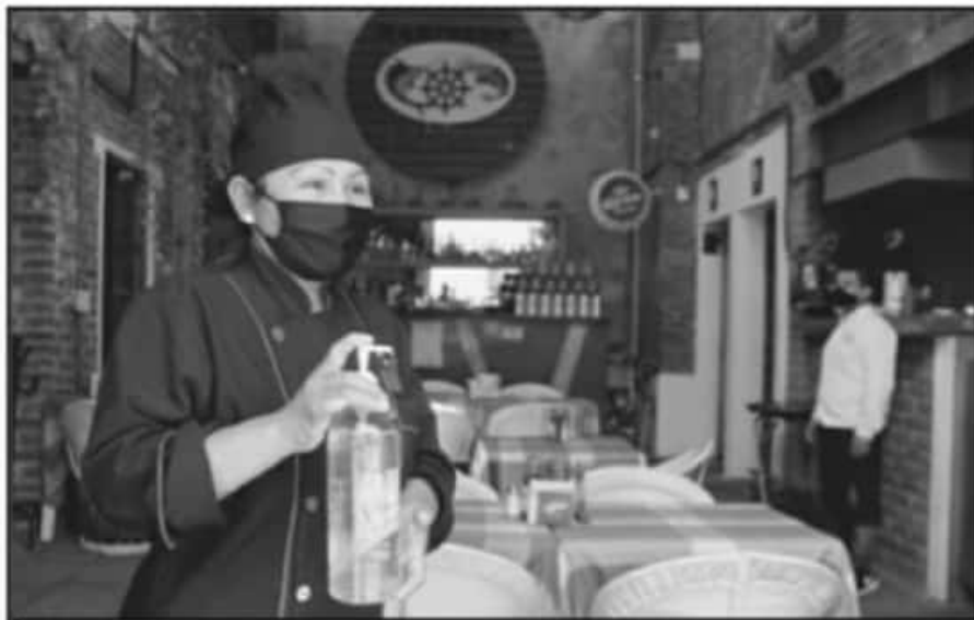
EL SECTOR RESTAURANTERO ES DE LOS MÁS AFECTADOS CON LAS NUEVAS MEDIDAS DE CONFINAMIENTO.

medida el ingreso del personal de cocina y los meseros.