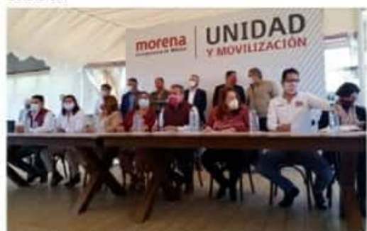
MORELIA, MICH.- Diputados federales y estatales de Morena se suman al llamado de unidad.