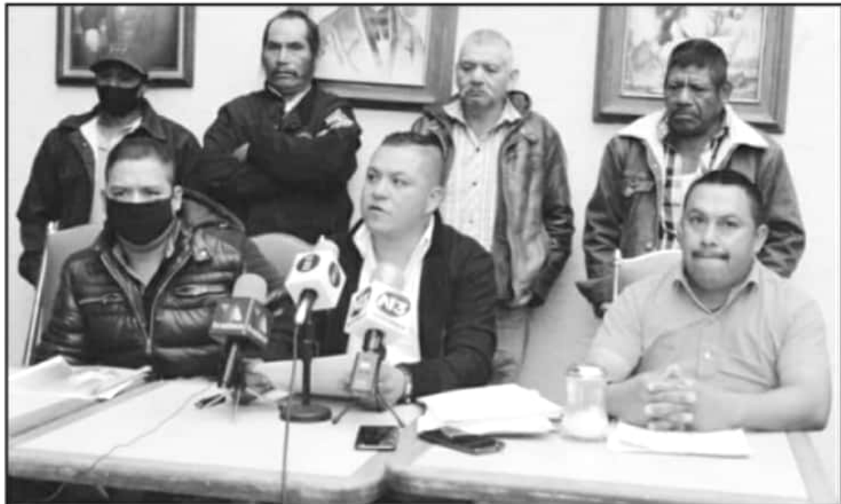
RECONOCEN QUE A CINCO AÑOS DE QUE SE OTORGÓ LA AUTONOMÍA A LA PRIMERA COMUNIDAD, EL DESVÍO DE RECURSOS CONTINUA SIENDO UN TEMA LATENTE.

"Apelamos a nuestra propia autonomía, también le exigimos al Consejo Supremo Indígena que saque la mano de nuestros pueblos y nos deje organizarnos a nosotros mismos, tal como lo establece el convenio de 1969 de la Organización Internacional del Tratado sobre los Pueblos Indígenas