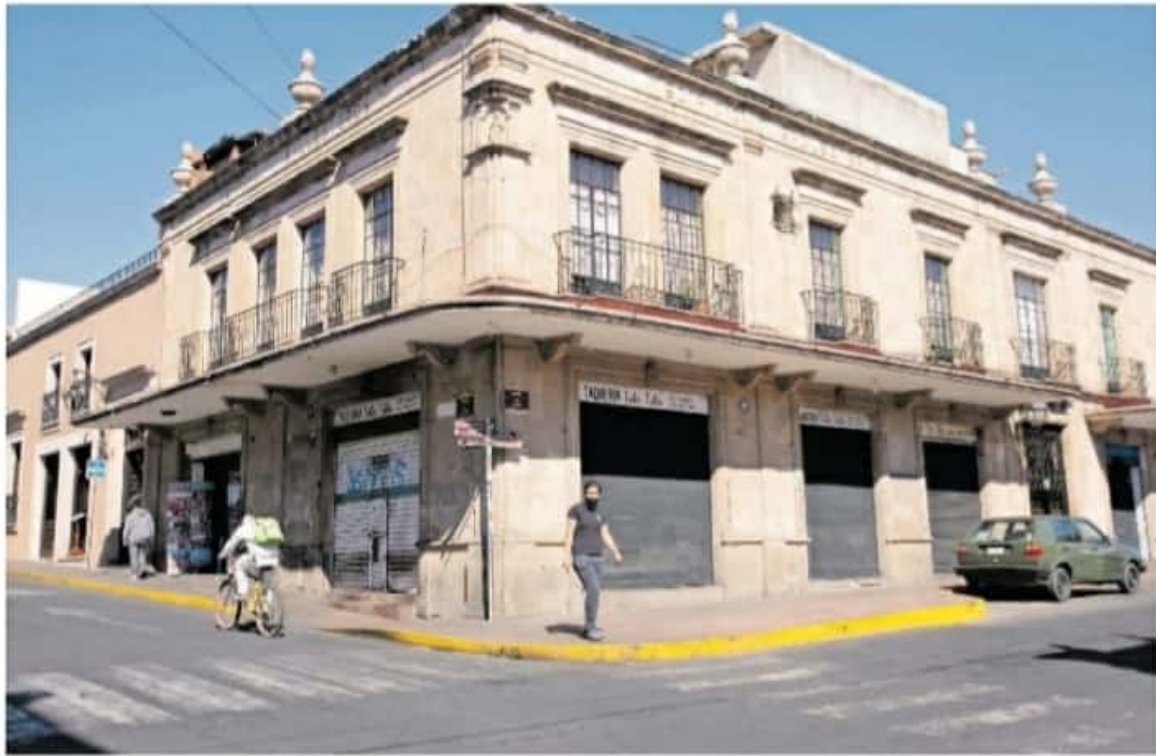
Exigieron que la medida sea aplicada también a comerciantes informales /IVÁN ARBAS

Las comunidades se deslindaron del Consejo Supremo Indígena de Michoacán y de su determinación de no permitir que se realice el proceso electoral. Pág. 7