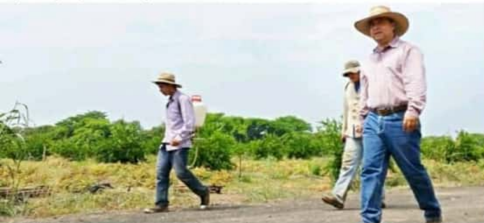
APATZINGÁN, MICH.- El comercializador de limón recordó que el precio se mantuvo en un nivel inferior e incluso hubo momentos en los que no se recuperaban siquiera los costos de producción.

"Sólo de ese modo será posible impulsar de manera sostenida la producción de este frutal en la zona citrícola más importante del país y generar una mayor riqueza que permita mejorar la economía regional en todos los sentidos, cuya base es precisamente la producción y comercialización de limón mexicano", precisó Ochoa Vázquez.