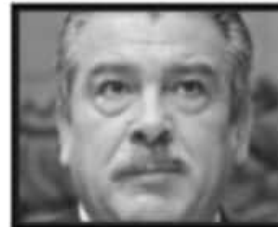
Esperanza. Si el presidente López Obrador sostiene una reunión con Raúl Morón es el respaldo deseado.