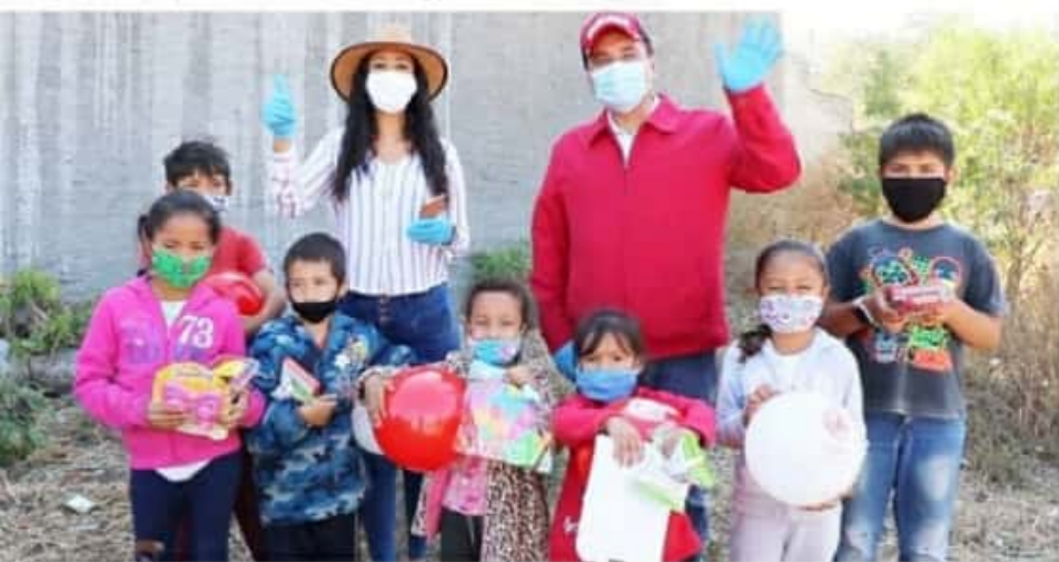
ZAMORA, MICH.- Los funcionarios zamoranos acudieron a visitar de manera personal a pequeños que viven en situaciones de vulnerabilidad.

En la visita los funcionarios les hablaron de las medidas sanitarias que debemos seguir para evitar enfermarnos del coronavirus, se aplicó gel con alcohol, y se pidió a los pequeños grupos de niños tomar su distancia y portar de manera adecuada su cubre bocas.