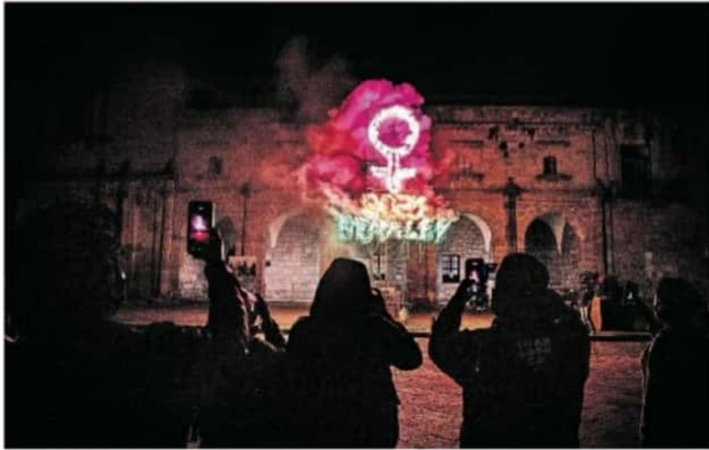
Un grupo de 10 feministas arribaron a la plaza Valladolid para exigir el aborto