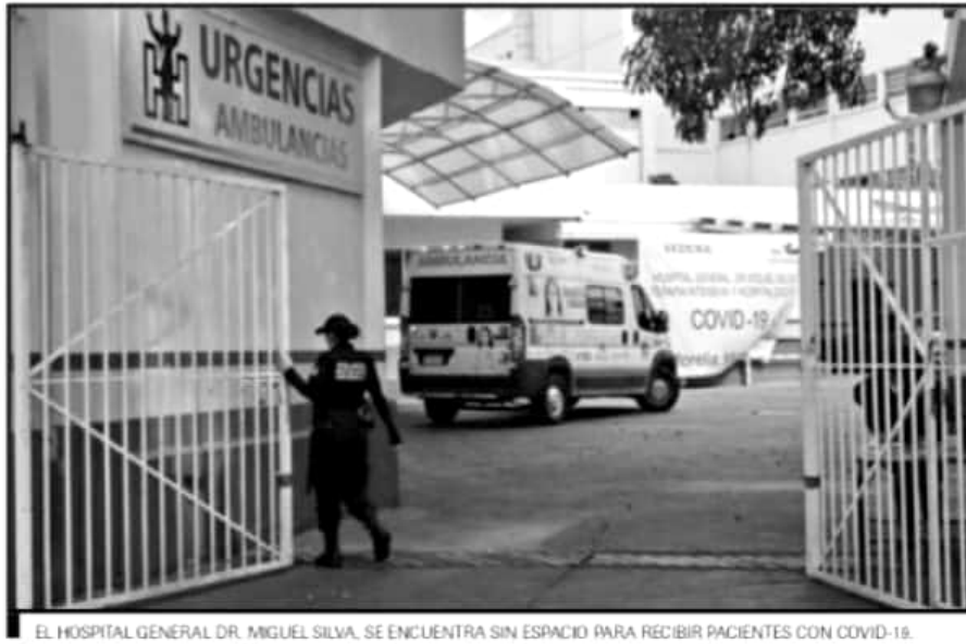
EL HOSPITAL GENERAL DR. MIGUEL SILVA, SE ENCUENTRA SIN ESPACIO PARA RECIBIR PACIENTES CON COVID-19.

Por lo anterior, las autoridades sanitarias han lanzado el exhorto para que siga este lineamiento, ya que será de esta manera como se coordinará el acceso a la atención médica de emergencia, toda vez que, de lo contrario, el paciente deberá permanecer en el exterior del Hospital Civil en tanto se libere un espacio, con todo el riesgo que ello implica.