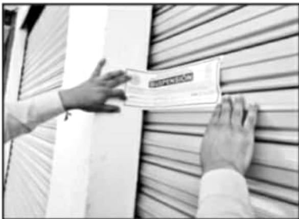
LAS ACTIVIDADES DE VIGILANCIA Y FOMENTO SANITARIO SE HAN LLEVADO A CABO EN 190 MIL 207 ESTABLECIMIENTOS EN EL ESTADO DE MICHOACÁN

siguieron los comités municipales de seguridad en la salud sesionaran con carácter de urgente, en este municipio no se ha anunciado si este órgano instalará la sesión solicitada por el ejecutivo estatal o si, de modo propio, algunos de sus integrantes han tomado directrices para frenar la cadena de contagios.