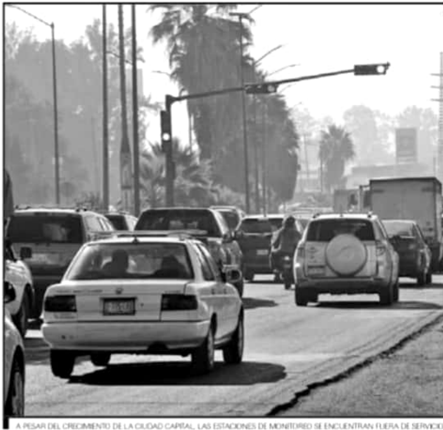
A PESAR DEL CRECIMIENTO DE LA CIUDAD CAPITAL, LAS ESTACIONES DE MONITOREO SE ENCUENTRAN FUERA DE SERVICIO.

ciembre y enero forman parte de los meses de mayor contaminación para la ciudad de Morelia. Los días 25 y 1 de enero se consideran de altos niveles de emisiones por las fogatas y chimeneas que se encienden por parte de miles de personas en las fiestas de fin de año. En esta ocasión no hubo tales mediciones y se desconoce en este sentido el impacto de las fogatas tradicionales, medición que incluso pudo haber servido para comparar con la actividad comparada con otros años, en términos de llamado a la población a evitar este tipo de actividades por el tema de la pandemia