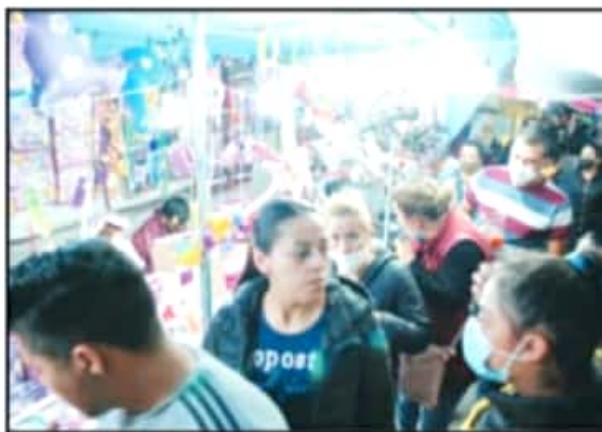
EN VARIOS PUNTOS DE LA CIUDAD CAPITAL SE REGISTRARON AGLOMERACIONES.