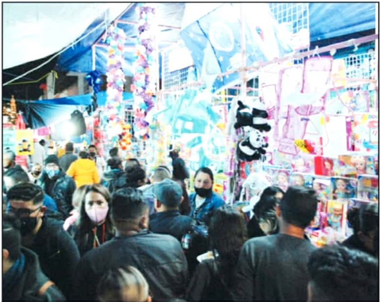
MELCHOR, GASPAR Y BALTASAR SATURARON LOS CENTROS COMERCIALES Y ESPACIOS DE VENTA DE TODA LA CIUDAD DE MORELIA, PARA ENCONTRAR LOS JUGUETES IDEALES.