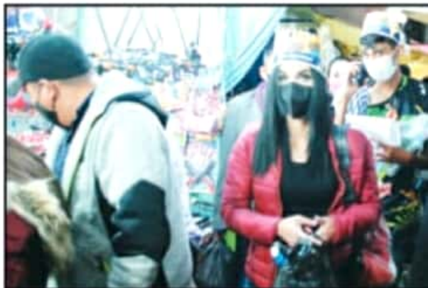
RECURRIRON AL USO DE CUBREBOCAS, CARETAS Y GEL ANTIBACTERIAL.

Cabe destacar que a nivel estado, son al menos 1 millón de niños los que esperan la llegada de los reyes magos, mineras que solo en Morelia, son más de 200 mil los menores que esperan con ansias la llegada de Melchor, Gaspar y Baltazar.