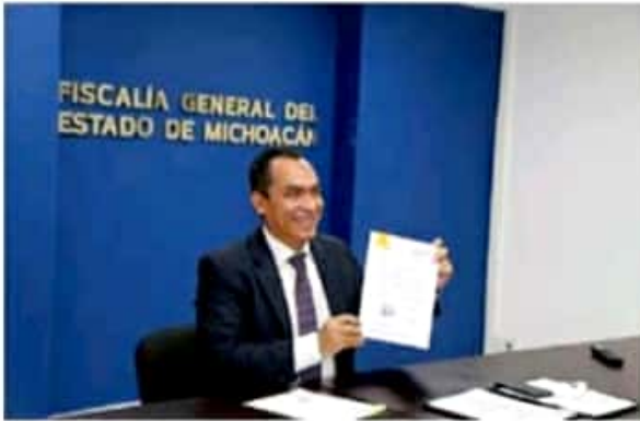
Adrián López Solís, titular de la FGE.

La población que requiera tramitar una Carta de No Antecedentes Penales ante la Fiscalía General del Estado (FGE) ahora lo puede hacer a través de la página web choacan.gob.mx/cartas .