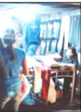
PERSONAS EN LAS CALLES, COMO AÑOS PASADOS.