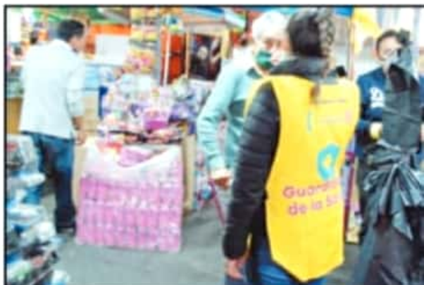
EN TIANGUIS SE COLOCARON FILTROS PARA PRESERVAR LAS MEDIDAS SANITARIAS.