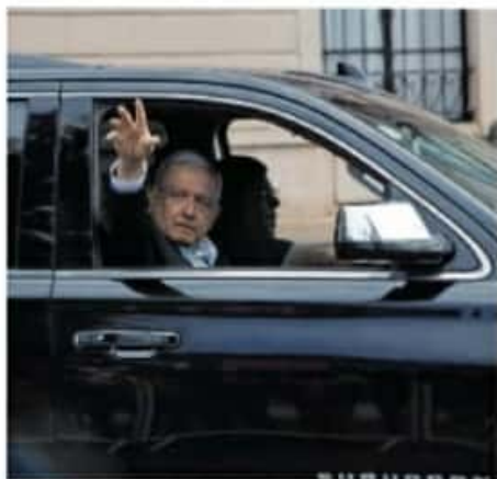
Andrés Manuel López Obrador visitará Michoacán este viernes y sábado.

Según reportes, la cabecera municipal estuvo sitiada por los atacantes.