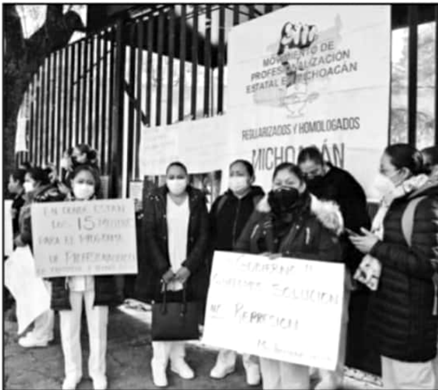
PARA LAS ENFERMERAS LAS JORNADAS DE TRABAJO SE HAN INTENSIFICADO Y EL INGRESO NO HA MEJORADO

mantiene ocupada en hacer compras y reuniones sociales sin cumplir las medidas sanitarias difundidas durante más de nueve meses, hay enfermeras que han mantenido una lucha contra la COVID-19 a lo largo de todo el año y aun temen un colapso de los servicios públicos.