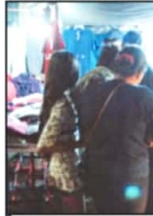
TODO TIPO DE PRODUCTOS SE ENCONTRARON EN LOS TIANGUIS.