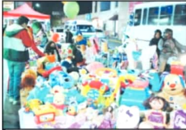
TODOS LOS ESPACIOS DE VENTA CONTARON CON LA PRESENCIA DE COMPRADORES.