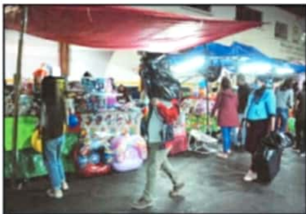
PUESTOS AMBULANTES REGISTRARON ALTOS AFOROS DE PERSONAS.