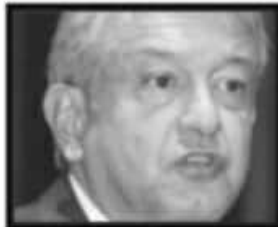
Regaño. La vista de AMLO no es a cortar cabezas, sino raíces que no acepten la decisión de Morena.