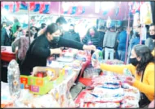
PUESTOS DE AGUINALDOS, DE LOS MÁS CONCURRIDOS POR LOS REYES MAGOS.