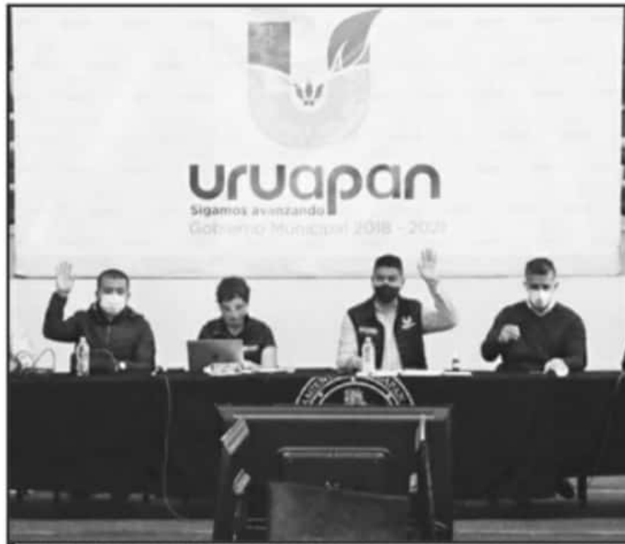
EL SECTOR COMERCIAL DE URUAPAN FUE EXHORTADO A CUMPLIR NUEVAS MEDIDAS POR LA EMERGENCIA SANITARIA.

La propuesta del gobierno es la intermitencia, indicó la funcionaria, luego de informar que se trata de cierres parciales para romper las cadenas de contagio, por ejemplo, jueves, viernes y sábado suspensión de la actividad comercial a partir de las 19 horas, en tanto que el domingo sea total, acción que en Uruapan involucra más de 15 mil comercios en su mayoría micronegocios que son esenciales para el sustento familiar diario.