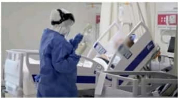
MORELIA, MICH.- El Hospital General "Dr. Miguel Silva", ha llegado a su máxima capacidad en la atención para pacientes Covid-19, según informó la Secretaría de Salud de Michoacán.

MORELIA, MICH.- La Secretaría de Salud de Michoacán (SSM), informa que el Hospital General "Dr. Miguel Silva", ha llegado a su máxima capacidad en la atención para pacientes Covid-19, en tanto los hospitales particulares que les auxiliaban informaron que ya no pueden hacerlo. Debido a la saturación hospitalaria, los pacientes positivos o sospechosos deberán llamar al 911 o al 800 123 2890 para que a través del Centro Regulador de Urgencias Médicas (CRUM), se evalúe su condición para su referencia a la unidad más cercana con capacidad y recibirlo.