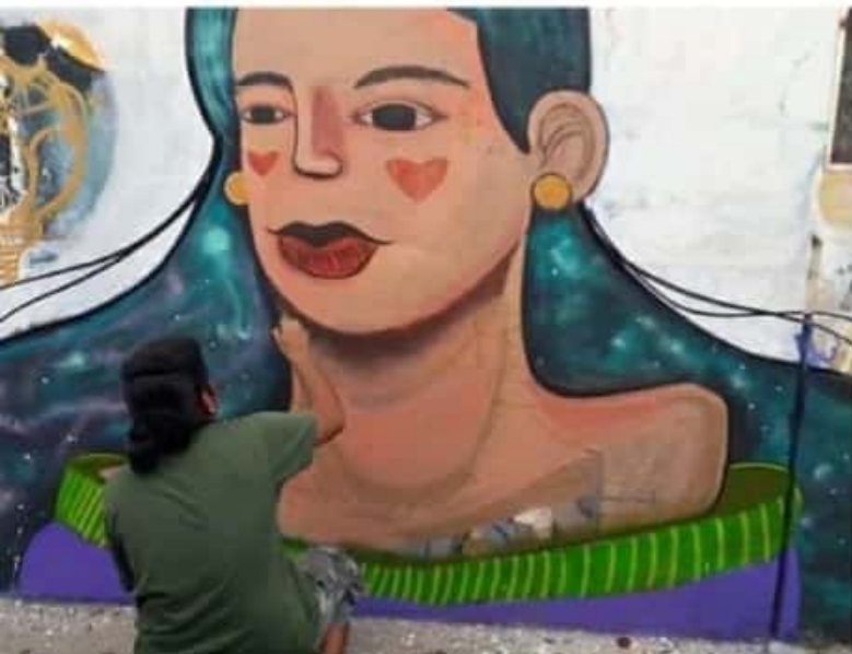
D. LÁZARO CÁRDENAS, MICH.- Este fin de semana comenzaron los trabajos de restauración de murales en playa "El Bejuco".