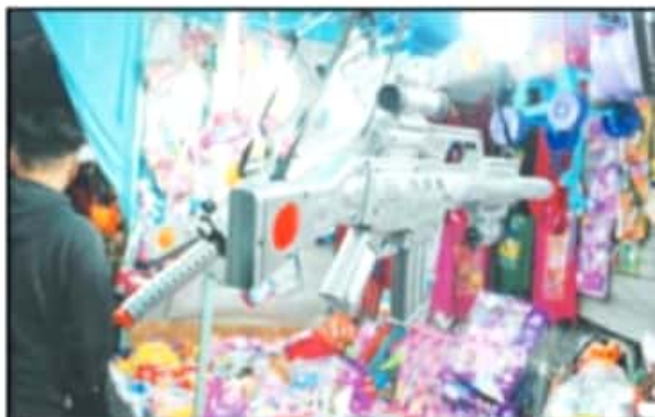
AHORROS ALCANZARON PARA CUBRIR LOS ENCARGOS DE MILES DE NIÑOS.