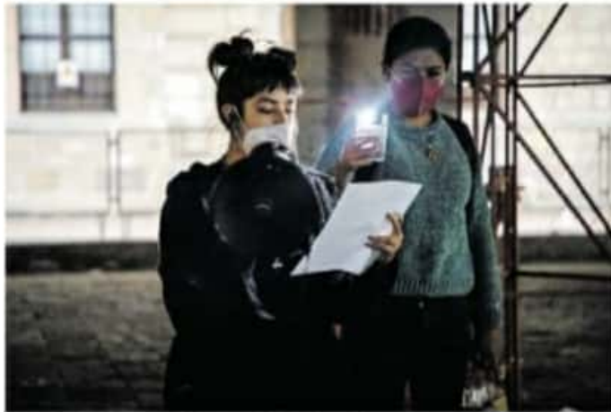
La postura fue a través de un comunicado que leyeron previo al encendido del castillo

Según las mujeres, el tema del aborto es una cuestión de salud pública que afecta directamente al sector femenino, debido a que ponen en riesgo su vida porque se hace en la clandestinidad y en hospitales que no son regulados.