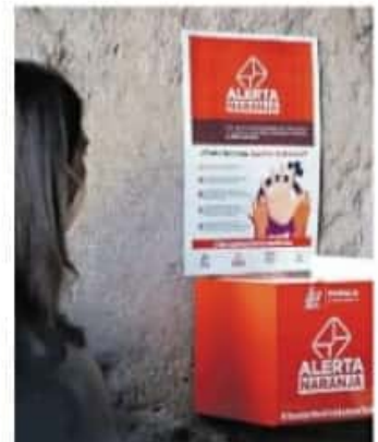
La aplicación comenzó a operar el 01 de noviembre de 2020

Las alertas llegan al centro de comando, donde cinco personas por turno reciben los llamados y envían las unidades al lugar de los acontecimientos, con lo cual se ha podido dar respuesta oportuna a las solicitudes hechas por la ciudadanía.