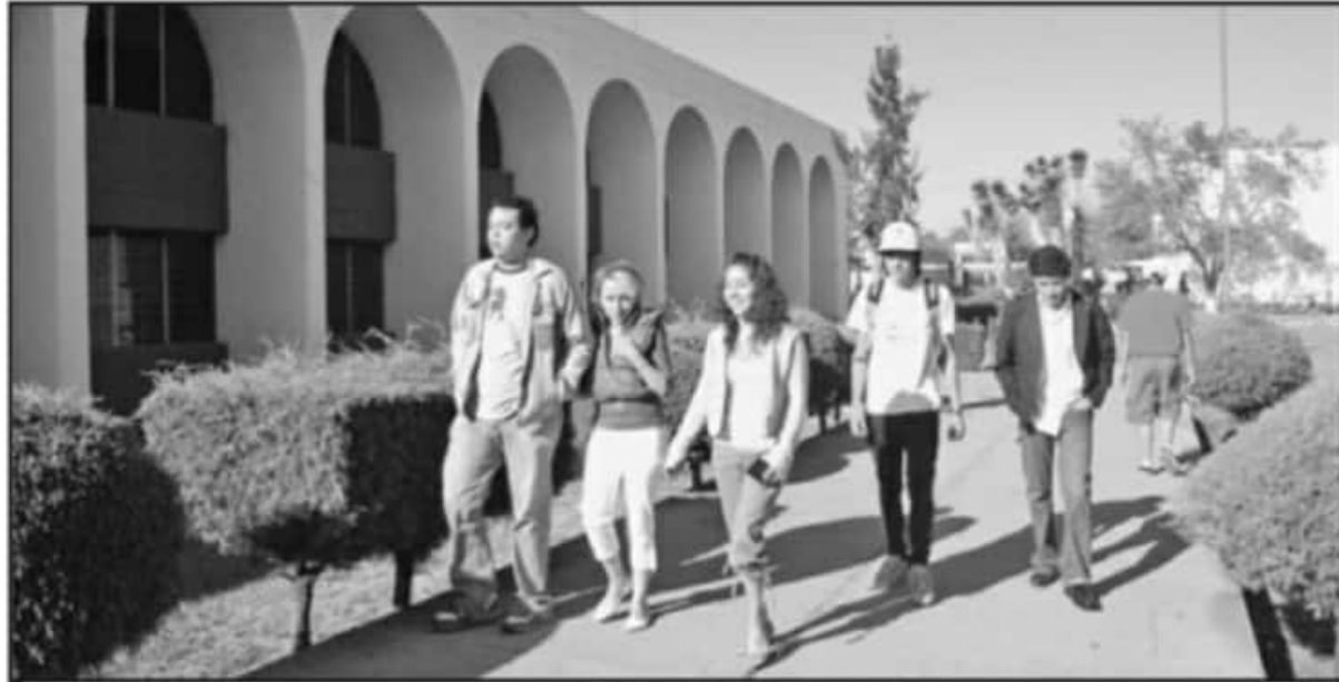
LA UNIVERSIDAD MICHOACANA DE SAN NICOLÁS DE HIDALGO RECIBIÓ ESTE AÑO UN AUMENTO DE POCO MÁS DEL 6 POR CIENTO FRENTE AL AÑO ANTERIOR.

Durante la última sesión plenaria del año pasado, los integrantes aprobaron un aumento presupuestal para la UMSNH, lo anterior, a consecuencia de las gestiones realizadas por el rector de la casa de estudios que en las últimas semanas se reunió con los integrantes de la Junta de Coordinación Política (Jucopo), con los integrantes de las Comisiones Unidas de Programación, Presupuesto y Cuenta Pública, y de Hacienda y Deuda Pública, así como