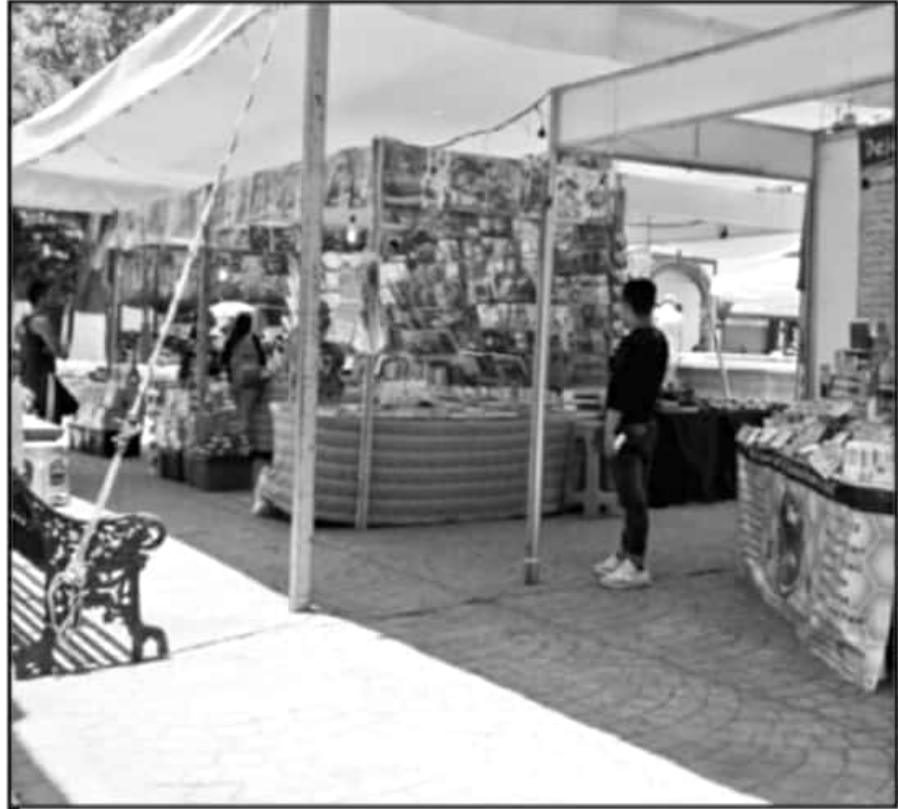
LOS LOCATARIOS DEL MERCADO ZARAGOZA CULPIERON DEL INCREMENTO DE CONTAGIOS A NEGOCIOS ESTABLECIDOS.

"Me fían la carne, vendo mi comida y al final del día pago que la carne, las verduras, el refresco, la mayoría trabajamos así, no somos grandes comerciantes como para