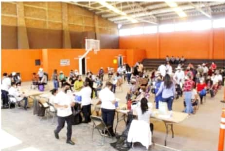
IXTLÁN DE LOS HERVORES, MICH.- Se logró al momento la vacunación de un millar de personas mayores de 60 años de edad.

La aplicación se llevó desde temprano en el auditorio municipal, para ello, se logró la participación de diferentes instancias como el Ayuntamiento Municipal, Seguridad Pública, los servidores de la nación, la Sedena y el personal de la segunda Jurisdicción Sanitaria que fueron los encargados de su aplicación.