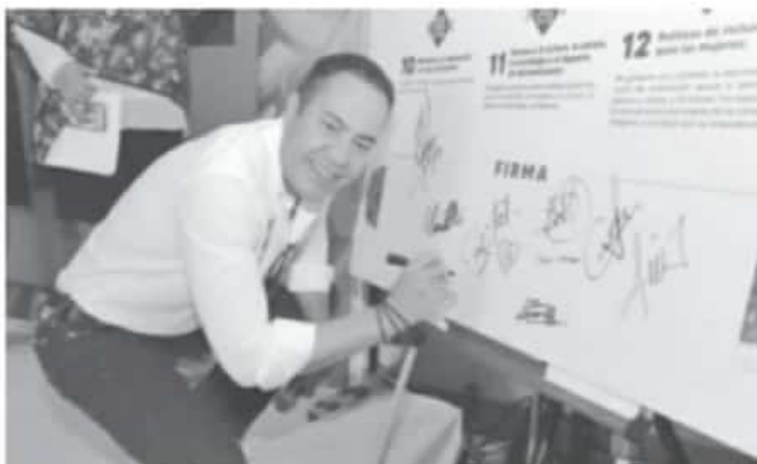
El candidato común del PRI, PAN y PRD aseguró que en su gobierno, el 50 por ciento del gabinete serán mujeres, además se comprometió a reactivar y robustecer el programa de Estancias Infantiles.

*El candidato del Equipo por Michoacán firmó doce compromisos puntuales que cumplirá con las mujeres michoacanas.