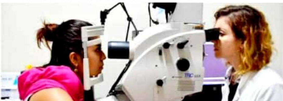
APATZINGÁN, MICH.- Se practican exámenes de la vista gratis y se entregan lentes graduados de calidad a bajo costo.

Expuso el dirigente que el costo mínimo de los lentes es de 399 pesos e incluye el examen de la vista, aunque los aditamentos son de calidad.