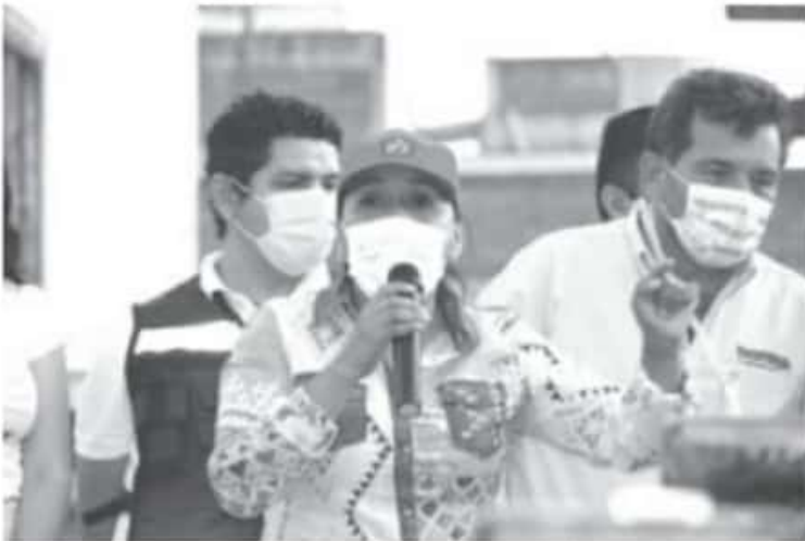
"Las y los habitantes del distrito 03 no quieren un retroceso en las políticas de bienestar" y los invito a cerrar filas en pro de la transformación el próximo 6 de junio.

- Las y los habitantes del distrito 03 no quieren un retroceso en las políticas de bienestar