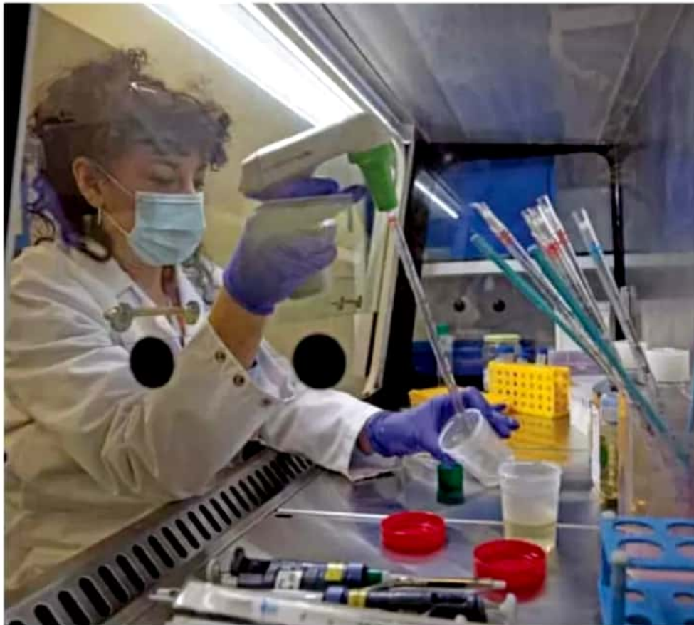
Avance. Sólo entre 10 y 20% de los desarrollos vacunales que se inician llegan a la fase 1 de ensayo clínico.