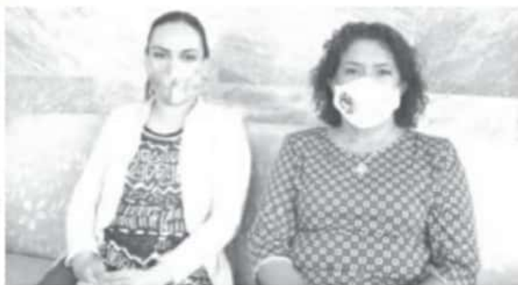
Este ejercicio que realiza el DIF Municipal en Coordinación con la Junta Distrital del INE el año pasado se canceló y este 2021 se trata de recuperar, pero bajo una dinámica diferente.

El 30 de abril será la toma de protesta en el Auditorio Municipal Samuel Ramos, luego el presidente y regidores por un día tendrán la sesión de cabildo. Durante esta actividad que será presencial se tomarán todas las medidas de seguridad y sanitarias. Asimismo quienes se inscriban quedan sujetos a los cambios de la convocatoria según se comporte la pandemia que atraviesa el mundo entero.