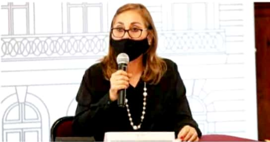
APATZINGÁN, MICH.- Precisó la legisladora que se mantendrá atenta y participativa a las campañas de los candidatos de la alianza.

Dijo que debido a la pandemia por Covid-19, ha realizado gestiones para personas que necesitan la intubación o la atención urgente en centros de salud y hospitales de gobierno, como es el IMSS y el Issste, ya que en estos casos es cuánto se puede hacer como legisladora, así como mantener vigente y al día la información a la sociedad para que cuide su salud, pues la ola de contagios no ha terminado "así que todos debemos seguirnos cuidando al acatar al cien por ciento las recomendaciones que se emiten, como es el lavado de manos, la utilización de cubrebocas, aplicación del gel antibacterial, no saludar de mano, beso ni abrazo, entre otras medidas".