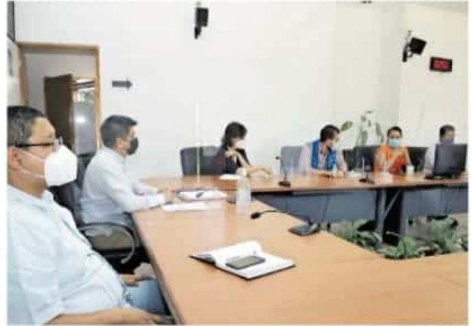
Se resaltó la importancia de incentivar el voto en la sociedad, en especial para lograr la participación de la población joven

Algunas de las actividades que realizarán serán divulgar la cultura política democrática entre la ciudadanía, y un programa de sensibilización a los agremiados