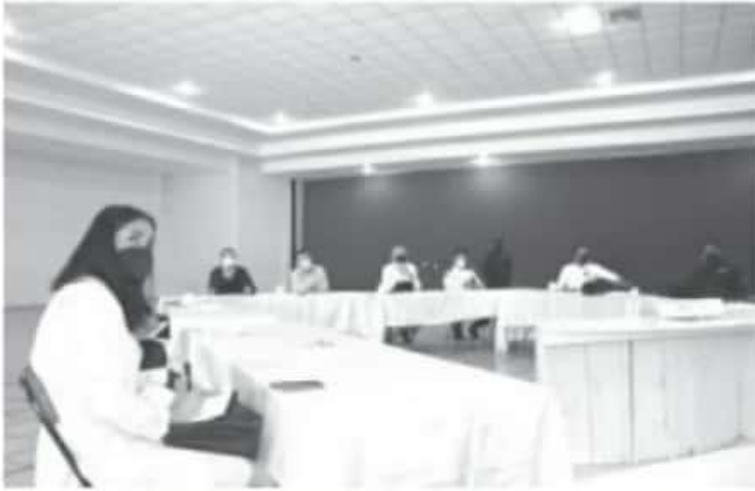
El porcentaje de la positividad en el municipio es de 44.92, existen cerca de 2 mil personas infectadas acumuladas y un aproximado de 200 muertos por la infección, 60% adultos mayores.