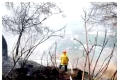
Morelia. Más de 24 horas duró un incendio en la zona de Altozano, en la capital del estado.

Morlia es el municipio más afectado, con 41 siniestros en lo que va del año