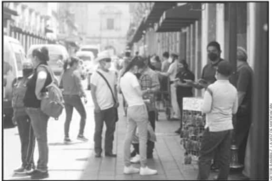
LA CIUDAD CAPITAL SE ENCUENTRA ENTRE LOS MUNICIPIOS EN BANDERA AMARILLA, POR SU ALTO RIESGO DE CONTAGIO.

Las acciones de este programa son públicas, ajenas a cualquier partido político. Queda prohibido el uso para fines distintos a los establecidos en el programa.