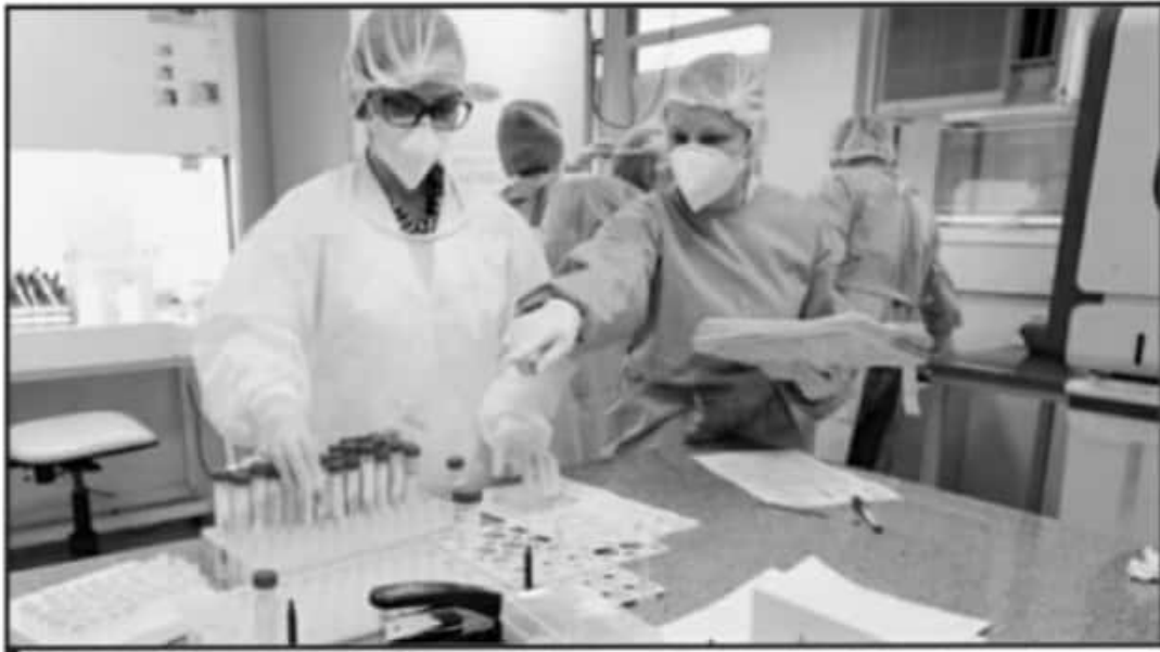
CADA VEZ SON MÁS LOS LABORATORIOS EN EL PAÍS LOS QUE REALIZAN LA PRUEBA COVID-19. ANTE ELLO PUEEN ELEGIR LA IDÓNEA.