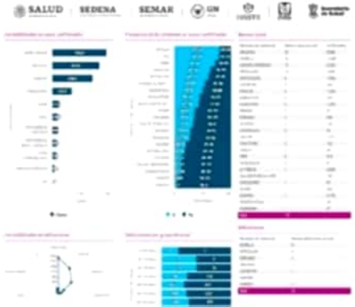
Ayer el municipio de LC registró otros 10 nuevos casos positivos de COVID-19.

Se dijo también que hasta anoche había 18 enfermos de COVID-19 hospitalizados y que el número de enfermos recuperados era ya de 5,863.