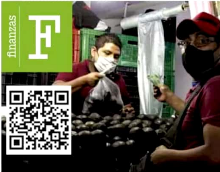
Dato. El alza de productos de la canasta básica es la que más afecta a los mexicanos.

Bolsillo. Los productos básicos se encarecieron más de 57%, mientras que 65% de la población no tiene para comprar lo indispensable