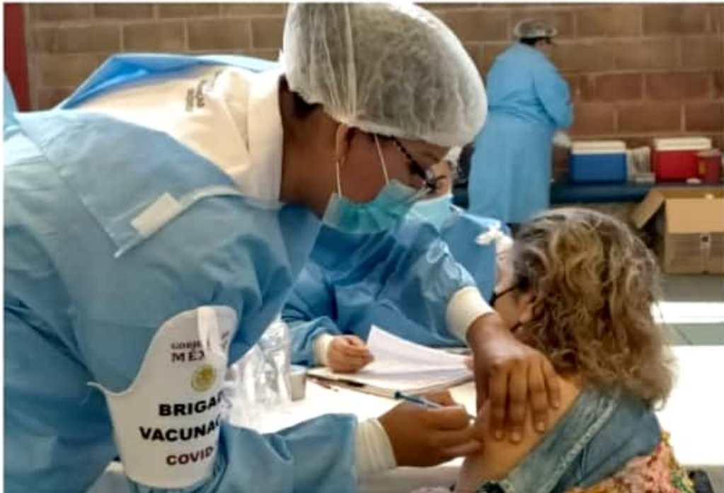
ZIRACUARETIRO, MICH.- Desde muy temprano la población mayor de 60 años de edad acudió a vacunarse contra el Covid-19: el módulo de vacunación estará funcionando durante dos días.

Reconoció que ayer, el primer día, fue complicado, por lo que evalúan la actividad para mejorar la respuesta hacia la ciudadanía, pues muchas personas acudieron sin esperar llamado, sin respetar el día o la hora; por ello, van a trabajar durante toda la campaña de vacunación y el horario que corresponda.