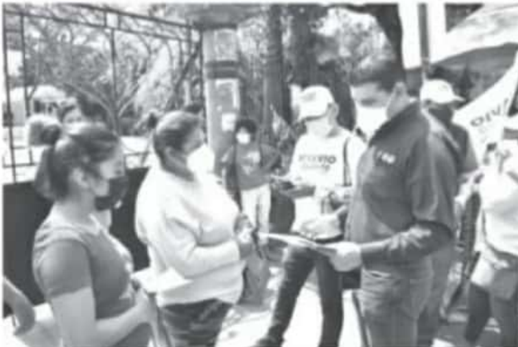
Ante había programas sociales en los que los beneficiarios acudían periódicamente a revisiones médicas, pero esta prestación fue desaparecida y que hoy mucha gente ha quedado vulnerable en su salud.

Por último, enfatizó Ocampo Córdova en que combatir la corrupción no puede ser la causa para desaparecer aquello que funciona, sino se debe sancionar a quienes han cometido alguna irregularidad y mejorar las políticas públicas que han tenido un beneficio social realmente