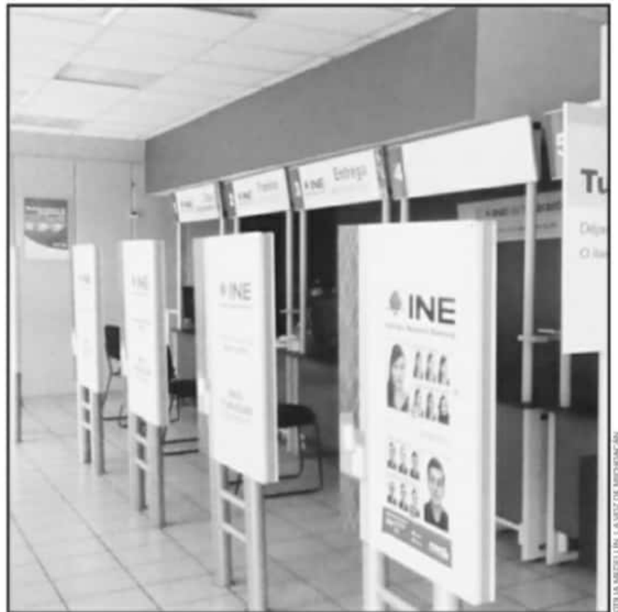
QUIENES TRAMITARON SU CREDENCIAL PARA VOTAR Y NO LA RECOPIERON, PODRÁN HACERLO PASANDO LAS ELECCIONES.

Gerardo Álvarez Magaña, REGISTRO FEDERAL DE ELECTORES