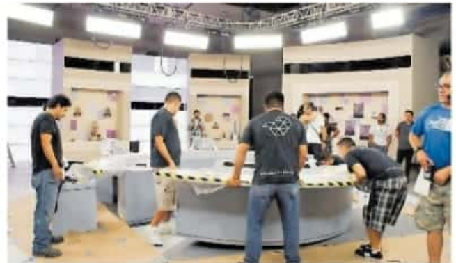
Los temas serán: economía, salud y educación / CUARTOSURIO

Ciudadanos de Michoacán tienen hasta el 15 de abril para mandar preguntas de cara al primer encuentro entre aspirantes a la gubernatura