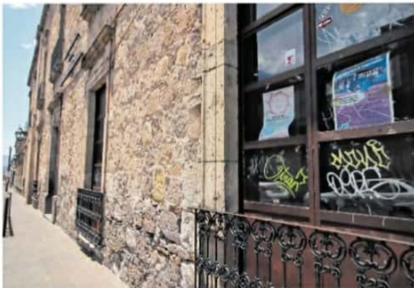
En algunos planteles hay grafitis y ventanas rotas

Hernández Gutiérrez puntualizó que la condición de las escuelas es variada, que algunas de ellas están más deterioradas que otras y que otras han podido mante-