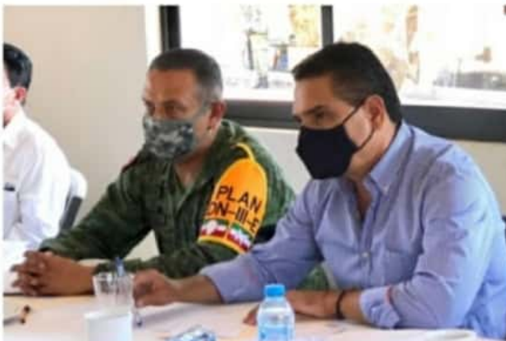
AGUILILLA, MICH.- Aureoles Conejo encabezó en este municipio la reunión con el Grupo de Inteligencia Operativa.

Participaron representantes de todas las fuerzas de seguridad, como son: la Secretaría de Seguridad Pública de Michoacán, la Fiscalía General del Estado, la Fiscalía General de la República, Sedena, Guardia Nacional y la Marina, así como la Secretaría de Gobierno de Michoacán.