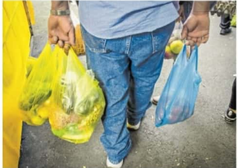
Los establecimientos mercantiles tienen 24 meses para desincentivar el uso de las bolsas

También indica que el gobierno estatal deberá elaborar un programa basado en la economía circular, con la metodología para separar, reducir, reciclar y reutilizar