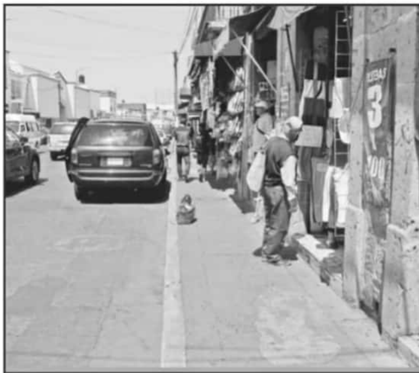
UN CIERRE MÁS A LOS NEGOCIOS "SERÍA UN GOLPE MORTAL", MANIFESTARON LOCATARIOS A LAS AUTORIDADES.

Sobre esa línea, hicieron referencia a que la rehabilitación de la avenida Madero Poniente tuvo cerca de un año de retrasos en su fecha de entrega y llevó a la quiebra a decenas de negocios. También señalaron otras obras cercanas a la zona que no cumplieron el periodo de entrega en tres meses de labores. Una de las