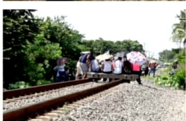
CD. LÁZARO CÁRDENAS, MICH.- Los maestros de Poder de Base, amagaron con regresar a una toma de vías, si en los próximos días no se alcanzan acuerdos con el gobierno federal.