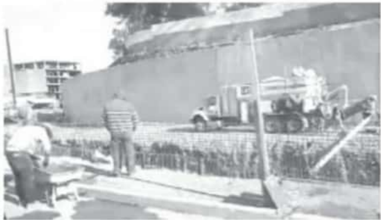
Octavio Castro dijo que la autoridad nunca ha cumplido, no hay apoyo económico, y les prometieron que les iban a condonar el impuesto predial y las licencias municipales.