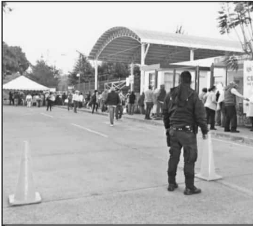
SE PRECISÓ QUE NO SE LES APLICARÁ LA VACUNA A LOS ADULTOS MAYORES QUE NO SEAN CITADOS PREVIAMENTE.

Otros municipios como Taretan, Ziracuaretiro, Gabriel Zamora, Nuevo San Juan, Tancitaro, Cherán y Angahuan, iniciaron este martes con la aplicación de una única dosis de la vacuna Cansino, proceso que se reportó sin mayores incidentes y que se prolongará hasta el próximo 16 del presente mes.