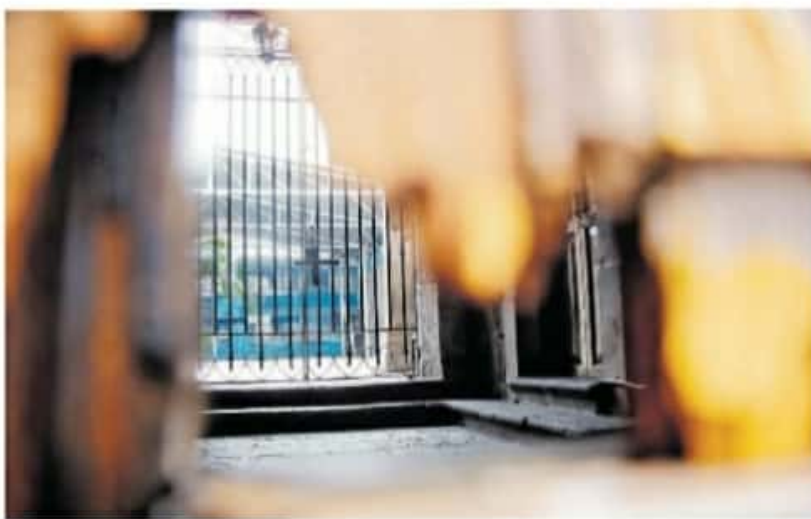
Los reportes de robo se han presentado en municipios como Morelia, Huetamo, Uruapan y Zacapu