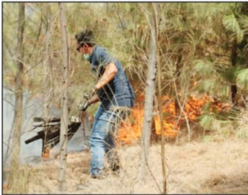
EL INCENDIO EN LA LOMA DE SANTA MARÍA YA ESTÁ BAJO LAS INVESTIGACIONES PERICIALES PARA CONOCER EL MOTIVO.

Desde hace más de una década, se advirtió que la mayoría de los incendios registrados en la zona de la Loma de Santa María son provocados por intereses de particulares. El ANP se encuentra rodeada de desarrollos habitacio-