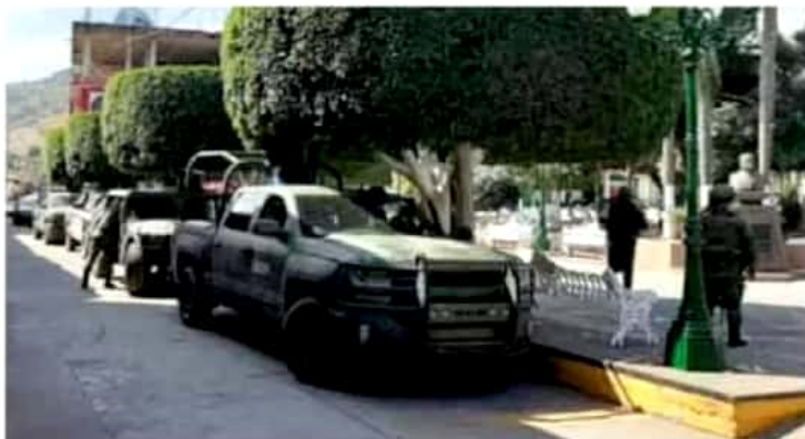
Riesgo. Comunidades de Aguililla podrían convertirse en pueblos fantasma.

Habitantes de esa localidad piden la intervención de los gobiernos y las organizaciones internacionales, por las afectaciones que ocasiona la presencia de grupos delictivos