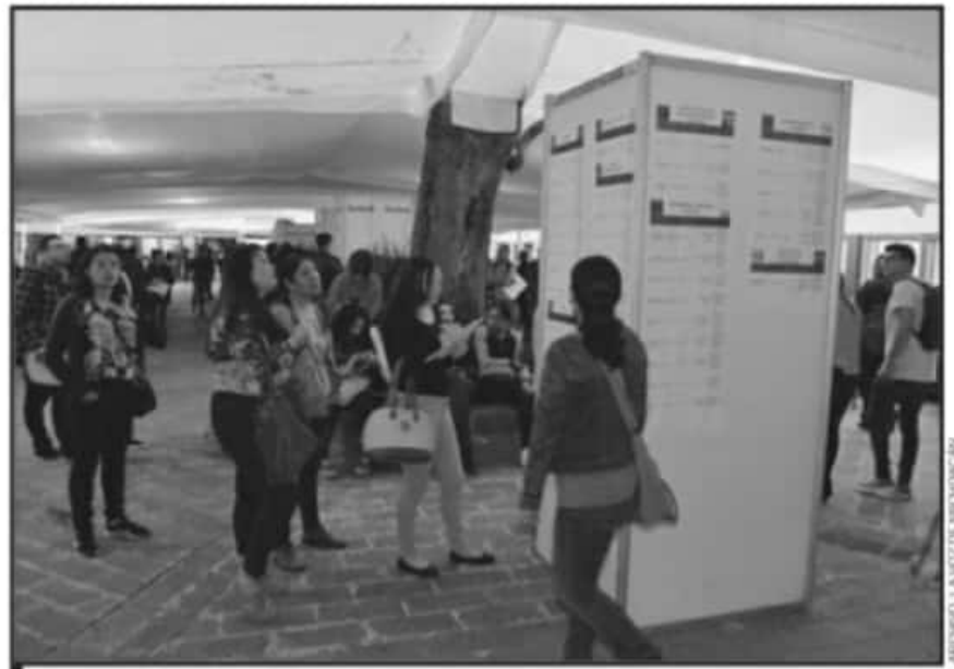
EL TRABAJO TEMPORAL SERÁ UNA TENDENCIA QUE PERSISTIRÁ, DEBIDO A LA CRISIS QUE VIVEN EMPRESAS Y NEGOCIOS.