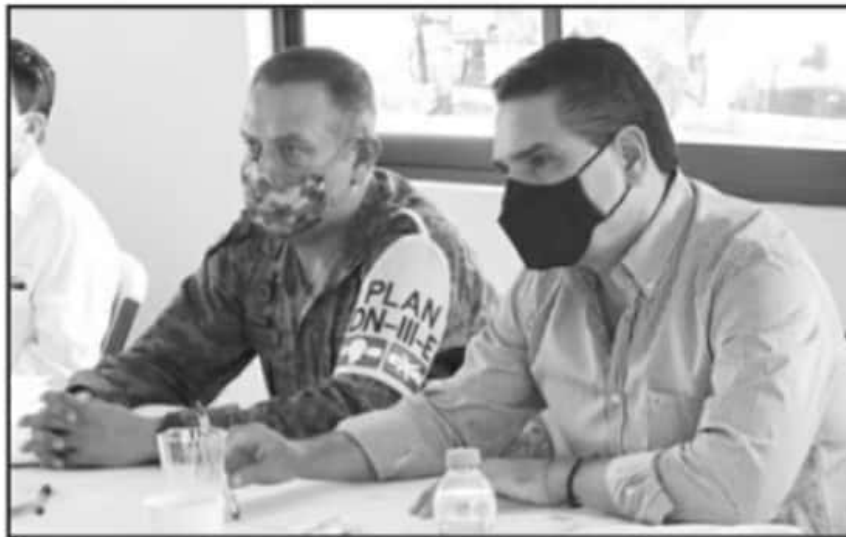
SILVANO AUREOLES REÚNE A AUTORIDADES FEDERALES ACCIONES PARA SACAR DE LA DELINCUENCIA LA ZONA DE AGUILILLA.

clen a la ciudadanía", explicó el mandatario michoacano.