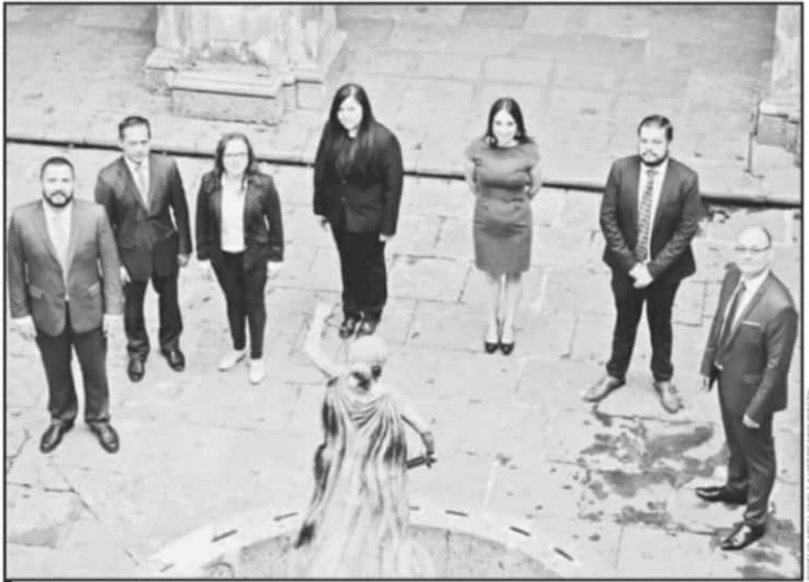
TRAS LA MESA DE ANÁLISIS, SE DESTACÓ QUE LAS RESPECTIVAS LEYES ELECTORALES ES UNA MATERIA QUE ACTUALMENTE POCOS ABOGADOS DOMINAN.

Lo anterior se traduce en que antes, durante y después de los procesos electorales para elegir representantes populares en los tres niveles de gobierno, los candidatos y sus equipos de asesores deban enfrentar la ley, sobre todo por desconocimiento de la misma, lo que se traduce en omisiones desde