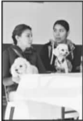
EL PROYECTO ANUNCIADO VA ENFOCADO HACIA LOS MACHOS.