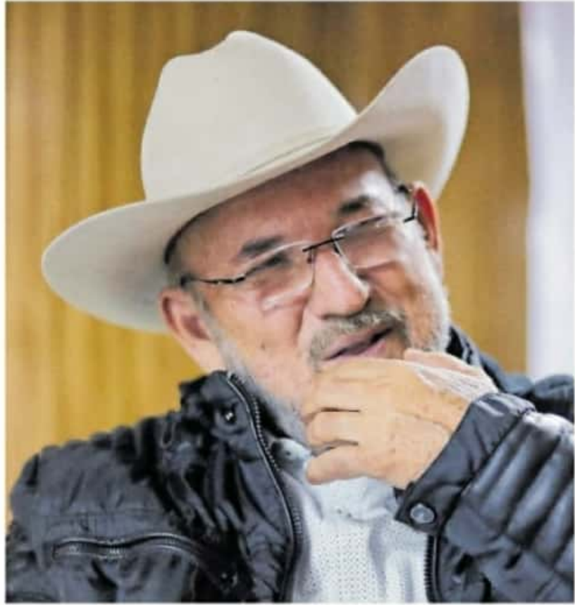
Mora Chávez consideró que para garantizar la paz en Michoacán urge una depuración de las instituciones de seguridad

Si la autoridad los abandona y se alía con el crimen organizado, los ciudadanos tienen el derecho a defenderse y tomar las armas”