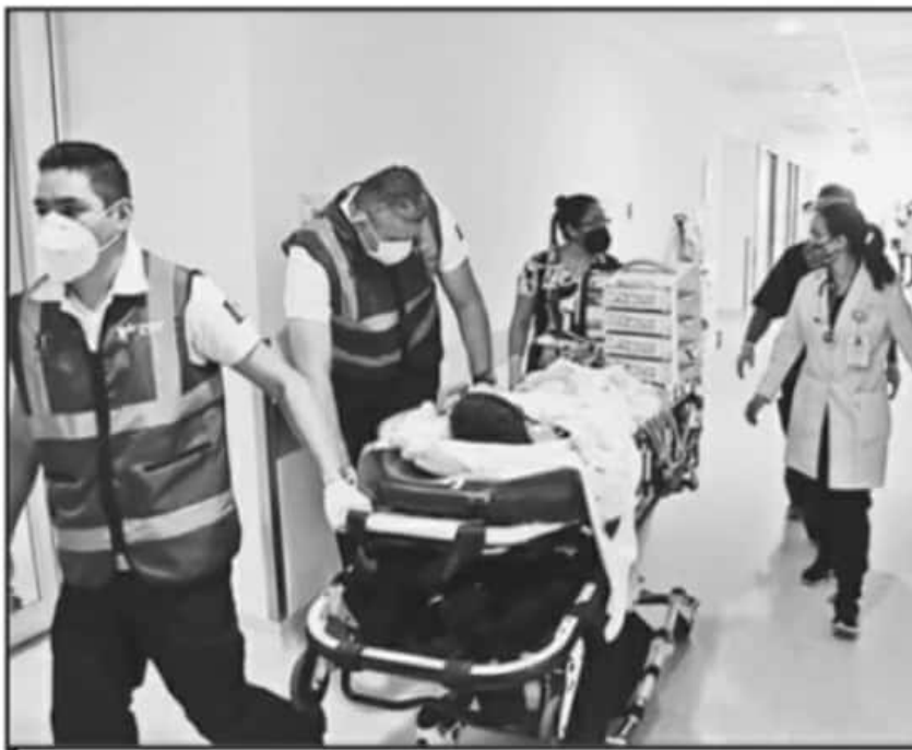
UNA RECOMPENSA A SU LABOR, LA HOMOLOGACIÓN DE SALARIOS PARA TRABAJADORES DE LA SECRETARÍA DE SALUD.

al inicio de su administración se contó con un sector descontento en materia de Salud, pues se enfrentaba un importante déficit en la nómina que llevaba a incumplimiento en los pagos, así como la dependencia también adeudaba el pago de otras prestaciones de sus trabajadores.