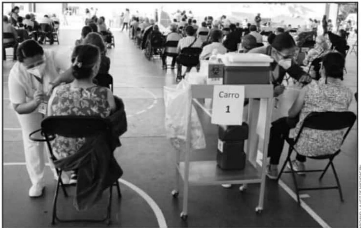
AUTORIDADES DE SALUD SEÑALAN QUE EL BIOLÓGICO ESTÁ DISPONIBLE PARA LOS ADULTOS MAYORES QUE FALTAN DE VACUNA Y QUE DESEEN SER INMUNIZADOS.

Previamente, el gobernador del estado, Silvano Aureoles Conejo, abordó el tema de que un porcentaje de michoacanos mayores de 60 años no sería inmunizado debido a diversas causas. "En promedio creo que se va a estar vacunando al 60 por ciento, porque muchos no están registrados o no tiene credencial o no pudieran registrarse en la vacuna,