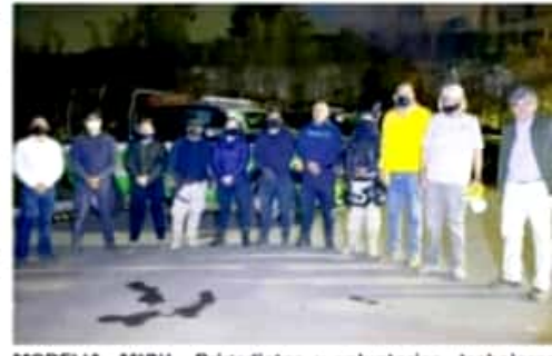
MORELIA, MICH.- Brigadistas y voluntarios, trabajaron durante varias horas, para controlar y liquidar el incendio.

Exhorta, además, para denunciar actos que pudieran constituir algún delito ambiental, ya que las estadísticas indican que cerca del 90 por ciento de los incendios forestales son provocados por la mano del hombre.