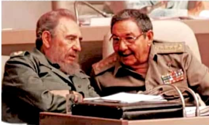
Futuro. Raúl Castro dejará el poder a Díaz-Canel, quien tiene un duro camino por delante.

24 de febrero 2008 Es elegido presidente del Consejo de Estado de Cuba por los diputados de la Asamblea Nacional del Poder Popular, sucediendo a su hermano Fidel Castro en la presidencia de Cuba.