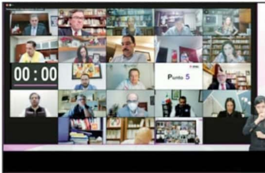
POR UN APRETADO 6-5 EL INE NUEVAMENTE EMITIÓ UN FALLO CONTRA LOS CANDIDATOS DEL PARTIDO MORENA.