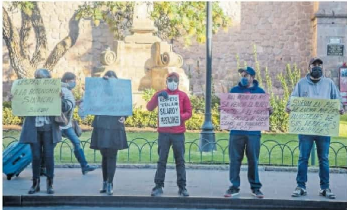
La huelga que tiene programada el SEUM sigue sin concretarse