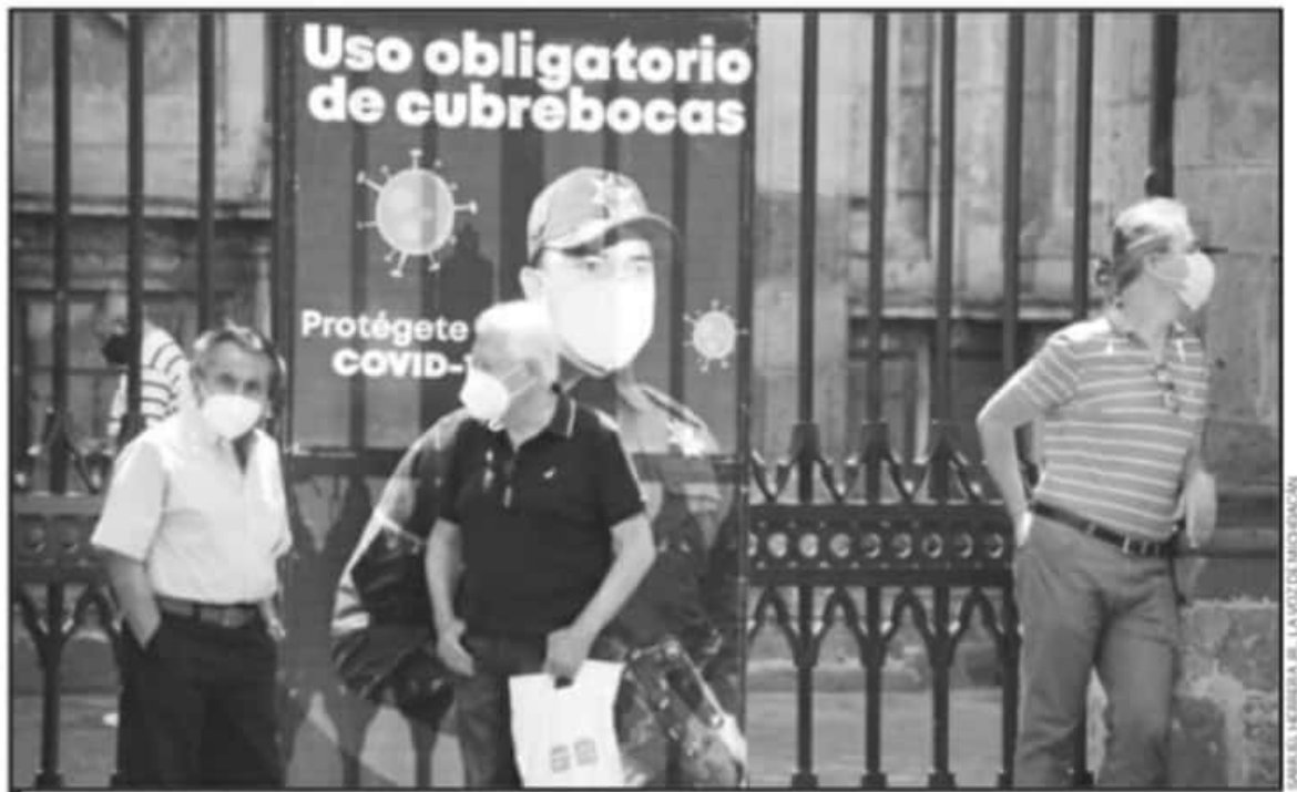
LA VACUNACIÓN A ADULTOS MAYORES DE MORELIA ES UNA DE LAS MÁS ESPERADAS Y LA QUE PLANTEA MÁS RIESGOS DE DESORGANIZACIÓN

"Ese es el protocolo que queremos precisar, entiendo que si (se les va a llamar por teléfono), pero todavía estamos viendo si es de que lleguen y se apunten, si será por apellido, todavía no