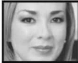
Valiente. Mercedes Calderón abanderará a Movimiento Ciudadano para ser la primera alcaldesa de Morelia.