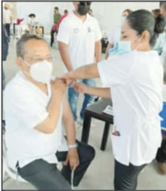
ACTUALMENTE YA SE INICIÓ LA VACUNACIÓN CONTRA COVID-19 EN DOS DE LOS CINCO MUNICIPIOS PRIORITARIOS DE MICHOACÁN.

Actualmente ya se inició la vacunación contra COVID-19 en dos de los cinco municipios prioritarios de Michoacán por su alta cantidad de contagios y defunciones, mientras que todavía se mantienen pendientes las ciudades de Pátzcuaro, La Piedad y Morelia,