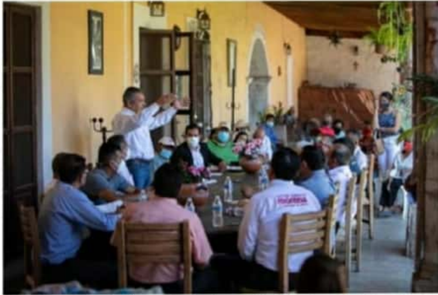
Raúl Morón continúa gira de unidad y movilización en los municipios de Zinapécuaro, Queréndaro y Tlalpujahua.