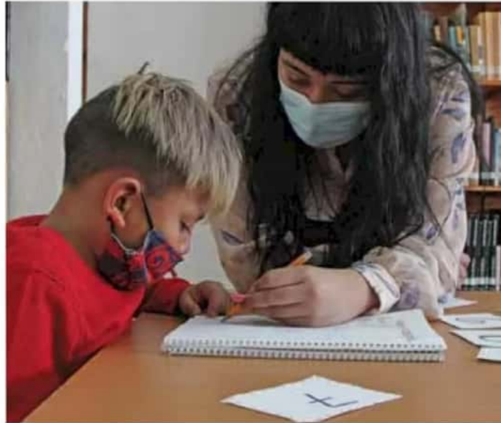
Retorno. Los planteles que retomaron clases presenciales suman 700 en todo el país.

Cuestionado sobre si se tomarán medidas adicionales luego de las vacaciones de Semana Santa, explicó que están en constante comunicación con los alumnos y sus padres para poder atender cualquier situación de riesgo y frenar