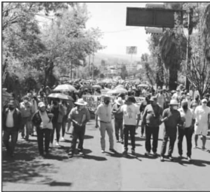
MAESTROS DE LAS DOS EXPRESIONES SINDICALES DE LA CNTE SE HAN MANIFESTADO EN LAS ÚLTIMAS SEMANAS

mente no ha cumplido con todos los compromisos realizados con los maestros en torno a los pagos pendientes de prestaciones y recursos que, de acuerdo a la información del Gobierno de la República, la parte que corresponde a la Federación ya ha sido radicada faltando sólo la de la administración michoacana.