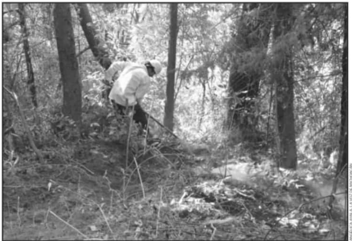
ESTE AÑO SE ESTÁ TRABAJANDO CON CINCO BRIGADAS INTEGRADAS POR 10 ELEMENTOS, TODAS CONVENIDAS CON SUS RESPECTIVOS AYUNTAMIENTOS.

Este año, dijo, se está trabajando con cinco brigadas integradas por 10 elementos, "faltaba iniciar la de Salvador Escalante, por eso estamos aquí, explicando y detallando la información a los brigadistas, en Quiroga la iniciamos desde el 25 de febrero, en Pátzcuaro el primero de marzo Erongaricuaru y Tzintzuntzan", todas son convenidas con los respectivos ayuntamientos.