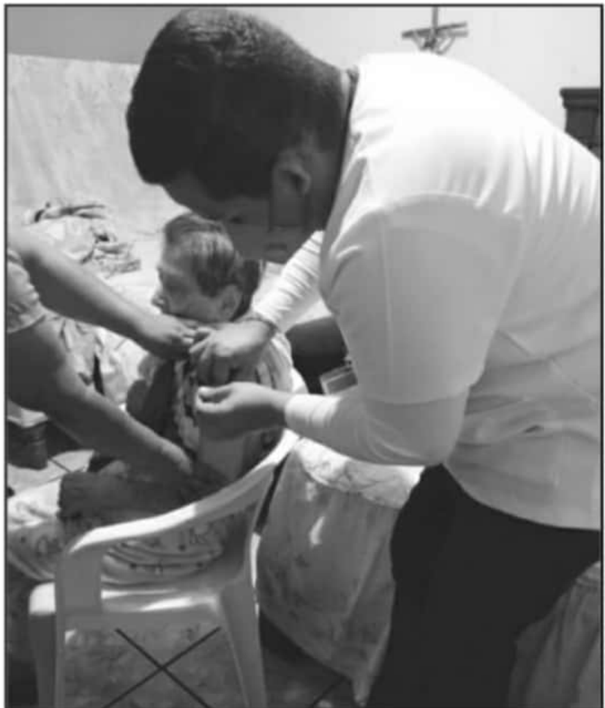
EL PERSONAL ENCARGADO DE APLICAR LAS VACUNAS A DOMICILIO SE HEZO ACOMPAÑAR DE LA GUARDIA NACIONAL.

JEFE DE LA JURISDICCIÓN SANITARIA 05 DE LA SSM