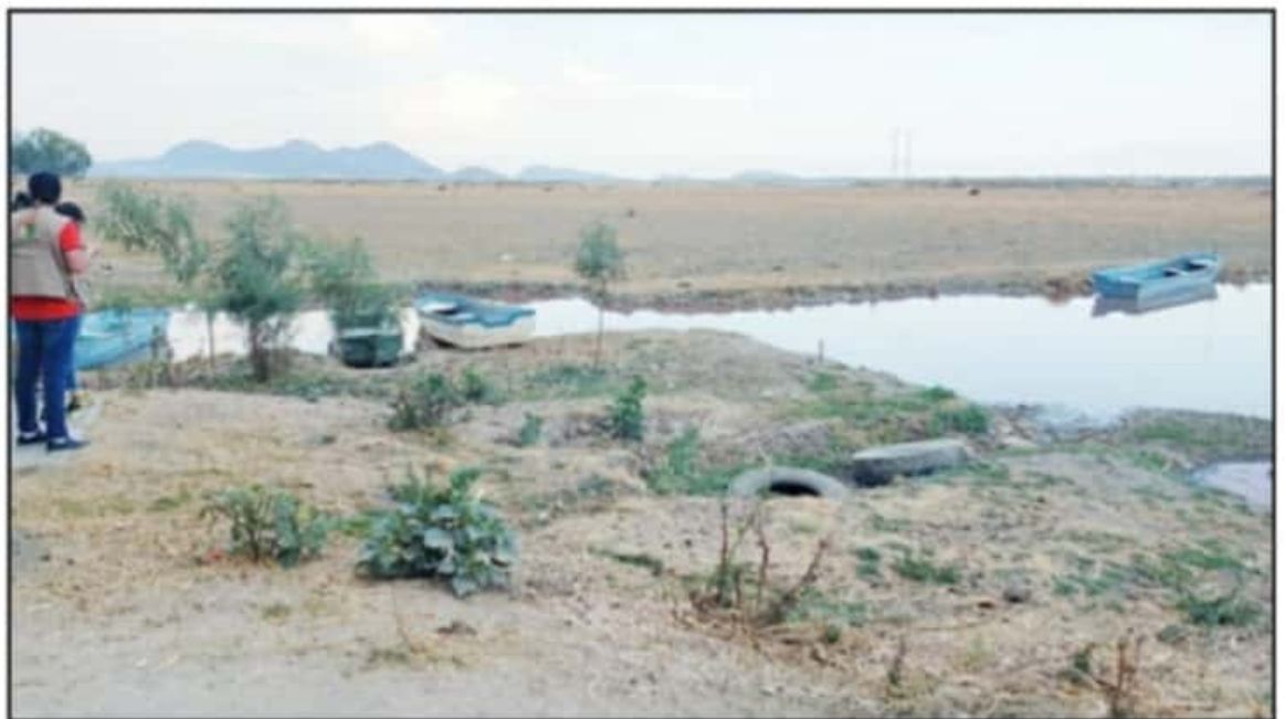
EL ESCENARIO ES DESIOLADOR ACTUALMENTE, SITUACIÓN POR LA QUE SOLAMENTE EN TRES SEMANAS SE LOGRARON CONSEGUIR 20 MIL FIRMAS PARA SU RESCATE.

Desde el 2018, incluso se ha manifestado que tanto la Secretaría de Medio Ambiente y Recursos Naturales (Semarnat) como la Procuraduría Federal de Protección al Ambiente (Profepa) en sus delegaciones en el estado operan únicamente con encargados de despacho impedidos en facultades y capacidad real de decisión; no han tenido representación en