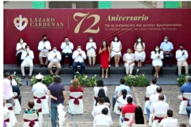
CD. LÁZARO CÁRDENAS, MICH.- Autoridades municipales conmemoraron la instalación del primer Ayuntamiento en el municipio de Melchor Ocampo, hoy conocido como Lázaro Cárdenas.