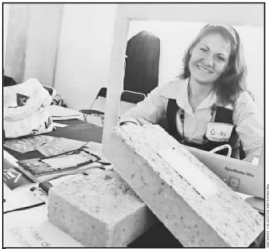
EL PROGRAMA PALABRA DE MUJER SIGUE VIGENTE Pese A LOS RECORTES DE RECURSOS QUE HACEN LAS AUTORIDADES.

cual se les reintegrará cuando termine el proceso de crédito y es acumulable para futuros créditos. Por ejemplo, si solicitan 3 mil pesos, aportarían 300 pesos; si quieren incrementar en el siguiente ciclo a 5 mil pesos, tendrían únicamente que pagar 200 más.