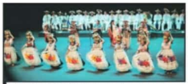
UNAS 120 PERSONAS PRESENTARON BAILABLES DE VARIAS REGIONES DEL ESTADO.