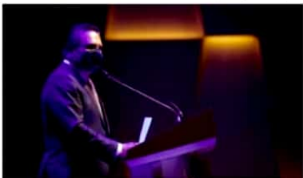
MORELIA, MICH.- El mandatario estatal deseó que este día sea recordado como "un triunfo de Michoacán", al destacar que el llegar a este día significó el esfuerzo de muchas personas.

Abierto a la comunidad artística de la entidad, al público en general, visitantes y turistas, el Teatro Matamoros albergará en una primera fase dos eventos semanales, de marzo a septiembre, con un aforo inicial del 50 por ciento de su capacidad, que es de 544 butacas y 484 para sala de conciertos.