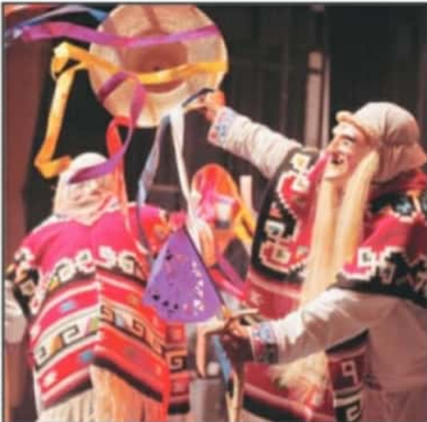
LA TRADICIONAL DANZA DE LOS VIEJITOS ALEGRÓ A LOS ASISTENTES AL TEATRO.