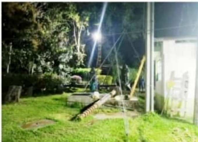
URUAPAN, MICH.- Durante el pasado fin de semana y en los primeros días de esta, se presentaron problemas en el sistema de bombeo de agua potable "El Pescadito".