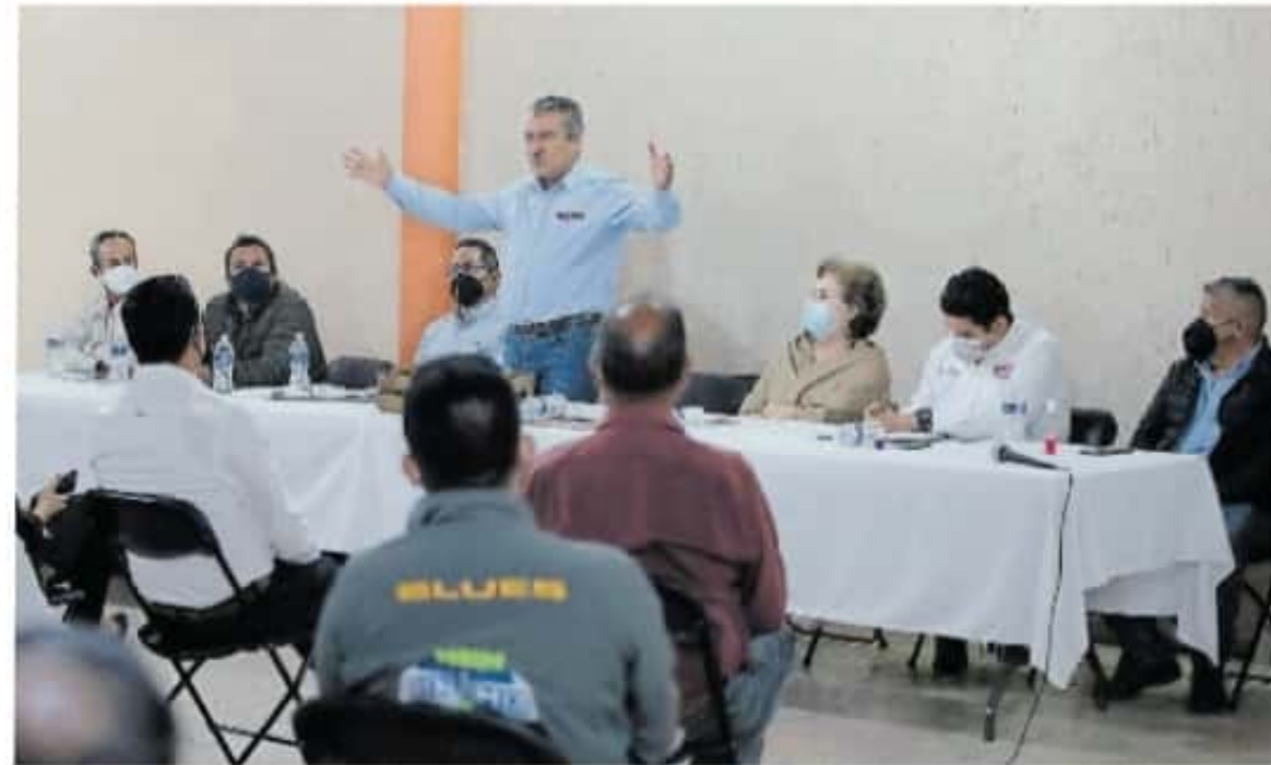
En total, la coalición Juntos Haremos historia irá en 86 de los 112 municipios