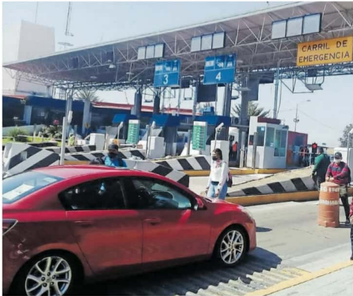
La CNTE ha emitido mensajes que dictan realizar actividades de boteo en las casetas de las Autopistas Siglo XXI

Indicó que los representantes del Comité Ejecutivo siguen sin tener comunicación con los demás miembros del sindicato y por ende se desconoce la informa-