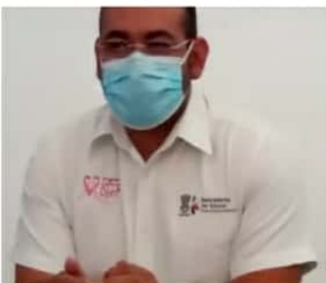
CD. LÁZARO CÁRDENAS, MICH.- Ya se planea un operativo para que no incrementen los contagios de Covid, por arribo de paseantes durante la Semana Santa, informó el jefe de la Jurisdicción Sanitaria.