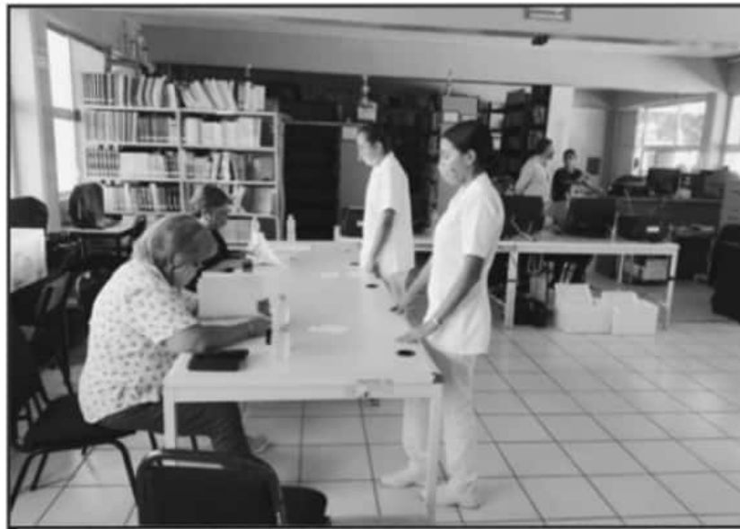
PARA NO ATRASAR LOS CURSOS Y AVANZAR CON LOS ESTUDIANTES, EL CONALEP PREPARA CLASES LOS SÁBADOS

Salazar García indicó que la intención del subsistema y con las