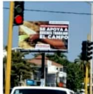
MORELIA, MICH.- Están violando la Constitución y cometiendo abierta y claramente delitos electorales sancionados con prisión preventiva oficiosa.

Manifestó que los espectaculares colocados a lo largo y ancho de Michoacán por Morena trastocan también el texto legal del artículo 242 de la Ley General de Instituciones y Procedimientos Electorales, así como los diversos 1, 169, 229, 240, 246 y 254 del Código Electoral del Estado, por tratarse de propaganda electoral usando los programas sociales.