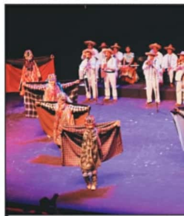
LA ALEGRÍA DE LAS DANZAS TRADICIONALES ABRÍÓ LAS PUERTAS DEL TEATRO M...

La capital del estado de Michoacán, ahora podrá presumir del recinto que, con la arquitectura, los acabados y la tecnología que tiene, podrá competir con los teatros y auditorios más importantes de toda la República Mexicana