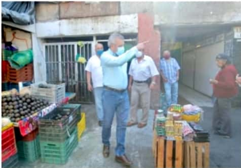
MORELIA, MICH.- La vacunación de los adultos mayores reducirá hasta en 80% la mortalidad por Covid 19.

Si el Gobierno Federal trae la coordinación de la estrategia en salud, las autoridades locales en los estados y los ciudadanos debemos asumir la responsabilidad que nos toca, y hacer lo que esté a nuestro alcance para que las actividades productivas y comerciales vuelvan a la normalidad en menos tiempo, concluyó Ramírez Bedolla.