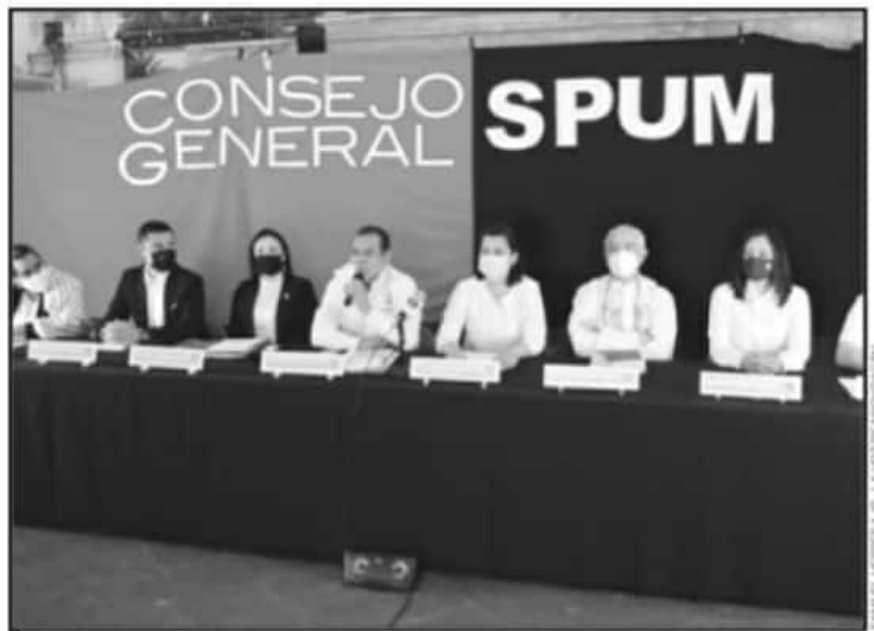
DOCENTES NICOLAÍTAS DISIDENTES PRESENTARON SU PROPIO EMPLAZAMIENTO A HUELGA, Pese a ACUERDO SINDICAL.