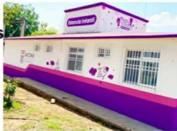
JACONA, MICH.- Se encuentra casi lista para recibir a las y los pequeños que deseen formar parte de esta guardería que garantiza mayor seguridad.