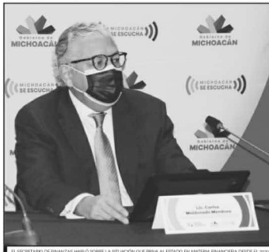
EL SECRETARIO DE FINANZAS HABLÓ SOBRE LA SITUACIÓN QUE PRIVA AL ESTADO EN MATERIA FINANCIERA DESDE EL 2020.

Durante el año 2020, a partir del mes de mayo y junio, las parti-