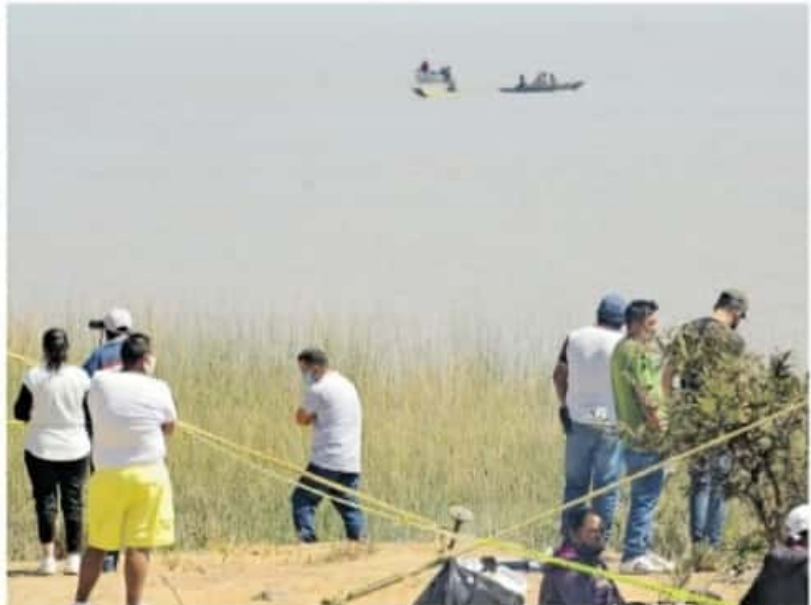
Personal de la Fiscalía Regional se encargó del traslado del cadáver a la morgue del Semefo

AYER por la mañana, un equipo de buzos y pescadores encontraron el cadáver flotando y lo sacaron del agua