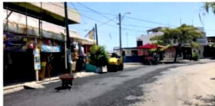
CD. LÁZARO CÁRDENAS, MICH.- La Secretaría de Obras Públicas Municipales, inició los trabajos de reencarpentamiento de la Avenida Belisario Domínguez, en el tramo del cruce con las avenidas Melchor Ocampo hasta Francisco Noyola.