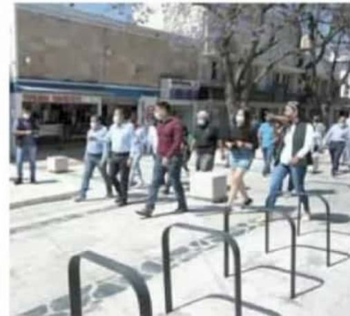
Obra. El edil inauguró la renovación del espacio público.

mdp se invirtieron en la obra, que incluye la rehabilitación de casi 4 mil metros cuadrados de banquetas y plataformas, limpieza de cantera, 250 metros de ciclovia segregada, entre otros.