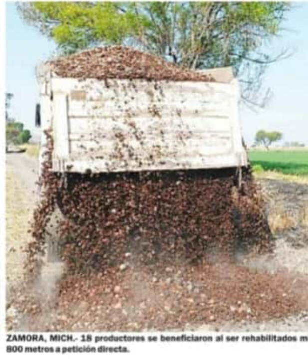
ZAMORA, MICH.- 18 productores se beneficiaron al ser rehabilitados mil 800 metros a petición directa.