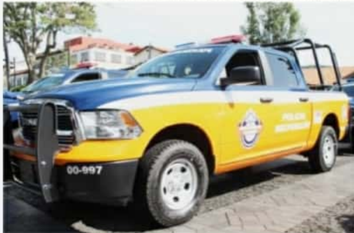
URUAPAN, MICH.- En lo que va de este año, la Unidad Naranja de la SSPTyVM, especializada en la atención en Uruapan a mujeres, niñas y niños violentados, ha otorgado más de 80 servicios integrales.

Al día, se registran un promedio de 10 reportes, ya sea por violencia familiar o de género en el municipio, que mediante la Unidad Naranja se atienden, brindando en alguno de sus casos seguridad y resguardo.