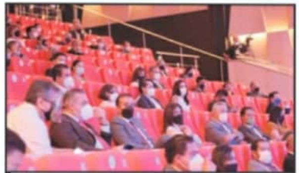
CON LA SANA DISTANCIA, UNOS 200 INVITADOS ASISTIERON A LA REAPERTURA.

Fueron 120 personas las que participaron en las presentaciones de los municipios de Chilchota, Tingambato, Erongaricuaru, Turicato, Aquila, Quiroga, Nuevo Parangaricutiro, Sahuayo, Patamban, Zitácuaro, Charo y Pátzcuaro. Y aunque muchos no se consideran artistas de profesión compartieron este día un pedacito de los festejos tradicionales de distintas regiones de Michoacán.