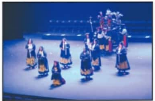
CON GRAN MISTICISMO MUJERES INDÍGENAS REPRESENTARON SUS TRADICIONES.