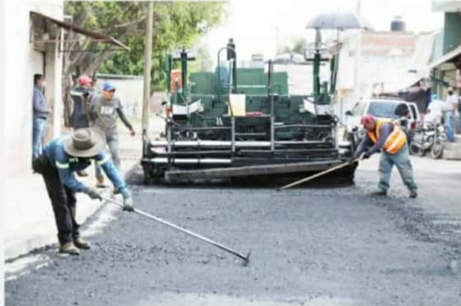
ZAMORA, MICH.- La obra cubre 2 mil 921 metros cuadrados entre las calles Ferrocarril y Precursores de América.