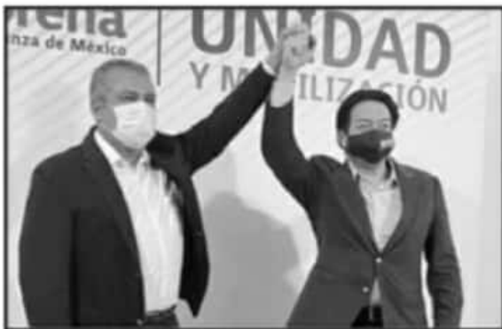
AL INSCRIBIRSE, CANDIDATOS DEBERÁN LLEVAR SU DECLARACIÓN PATRIMONIAL.

Nadie mostró los resultados de la nueva encuesta fantasma.