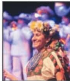
LUCIERON VISTOSOS ATUENDOS.