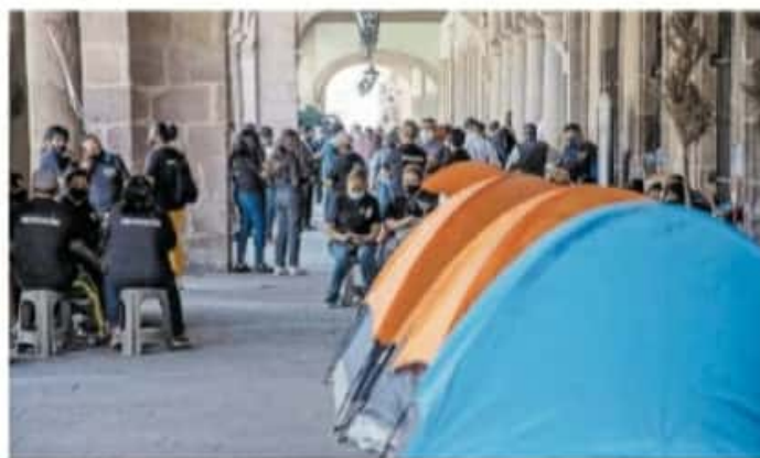
Desde hace dos semanas, el portal Matamoros de la capital michoacana fue tomado por los trabajadores

de empleados del hotel —que a su vez pertenecen a la Confederación de Trabajadores de México (CTM)—, el funcionario dijo desconocer "cuál sea el estatus específico" del conflicto, sin embargo se compromi-