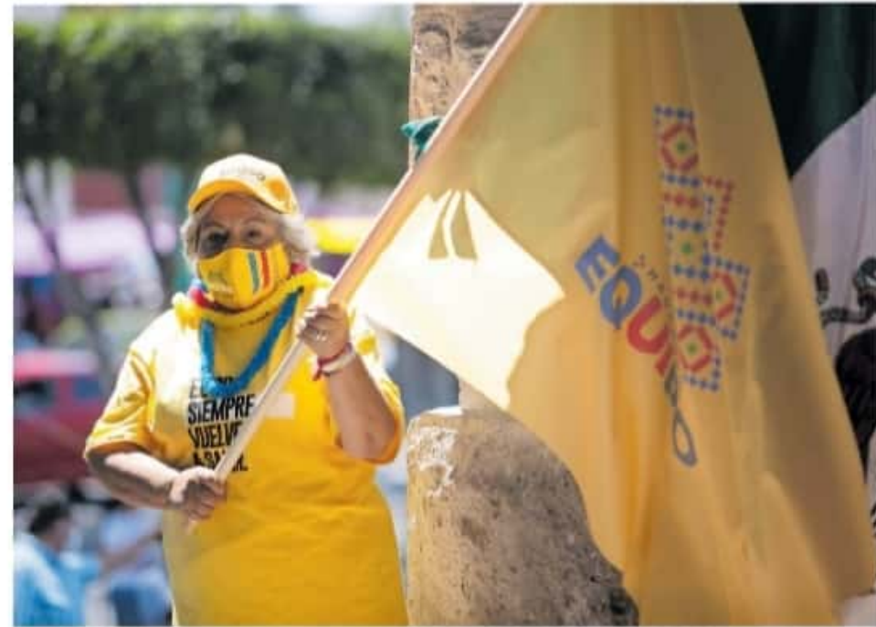
Es necesario que los partidos tomen decisiones sanitarias en sus campañas

El INE necesitaría tener un cuerpo de policía sanitaria detrás de cada político para ver si cumple con las normas"