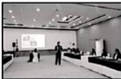
MUJERES PROMUEVEN NEGOCIOS EN MICHOACÁN

Agregó que como empresarias y mujeres, "tenemos las mismas oportunidades y derechos que los hombres". Por ello agregó que "seguirán trabajando, para con ellas ser tomadas en cuenta en esta parte de toma de decisión, "afortunadamente y a veces ganando lugar en estos espacios y es por el bien de todos".