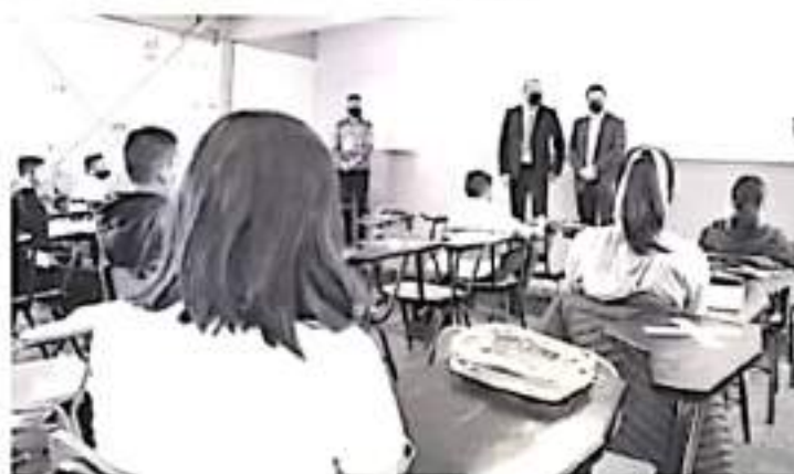
El combate a la pandemia es parte de la vida cotidiana pero con responsabilidad y atendiendo las medidas sanitarias se establecerán espacios educativos libres de Covid.

de baños que lo requieran, señalética y balizamiento para sus accesos, material para sanitizar, entre otros a mediano plazo, en la Secundaria Uno, resolvió también un módulo de lavamanos y mantenimiento del domo de sus canchas.