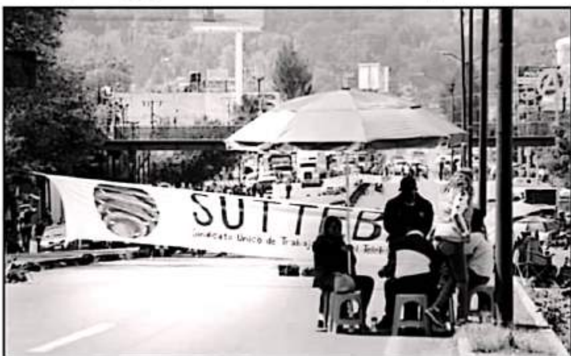
MAESTROS DEL SUTTEB SE MANIFIESTAN BLOQUEANDO LA SALIDA A PÁTZCUARO, ACCIÓN QUE AL MENOS SIRVIÓ PARA LIBERAR UNA DE LAS QUINCENAS.

El líder dijo que seguirán movilizados en caso de que este mes no puedan cubrirse los pagos, "si no lo conseguimos para nosotros movilizamos también es difícil porque significa dejar las tareas que tenemos e incluso hacer gastos para venir a Morelia".