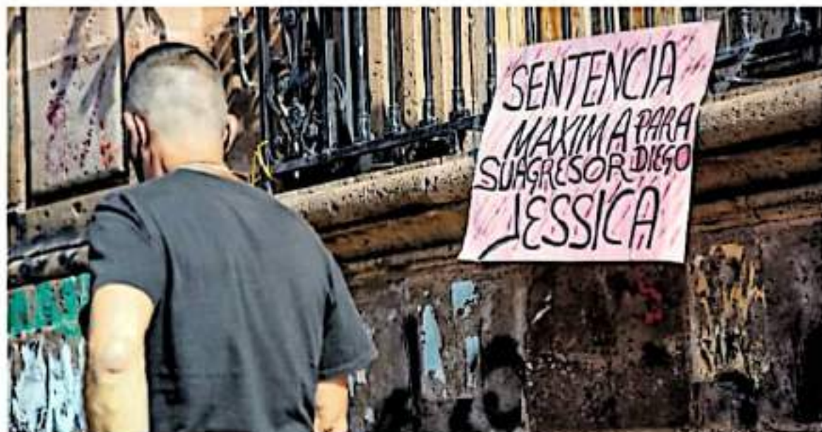
Se informó que se investiga a tres personas por el delito de encubrimiento

Productores de papa de la pequeña propiedad en Huarachani, padecen escasez debido a la migración de jornaleros agrícolas. Pág. 16