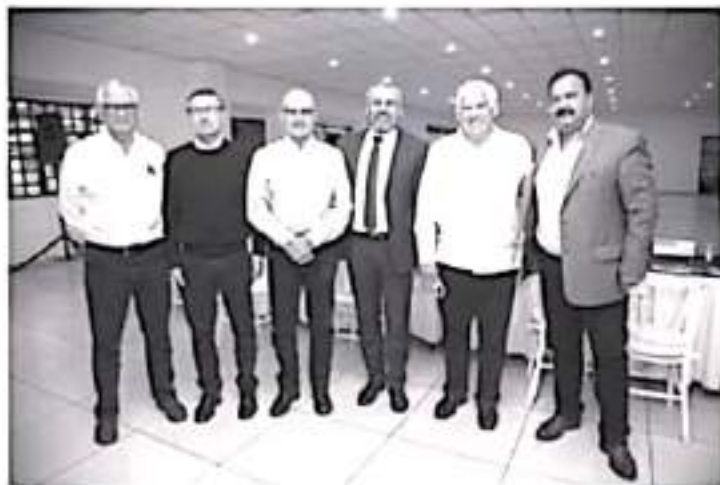
Con el respaldo del Gobierno de México será posible dar impulso a otros productos en los que Michoacán tiene potencial, como la lenteja, y también la producción acuícola.

Pátzcuaro, Michoacán, 20 de septiembre del 2021 - La Secretaría de Agricultura y Desarrollo Rural (Sader), y el equipo de transición del gobernador electo Alfredo Ramírez Bedolla, acordaron integrar una