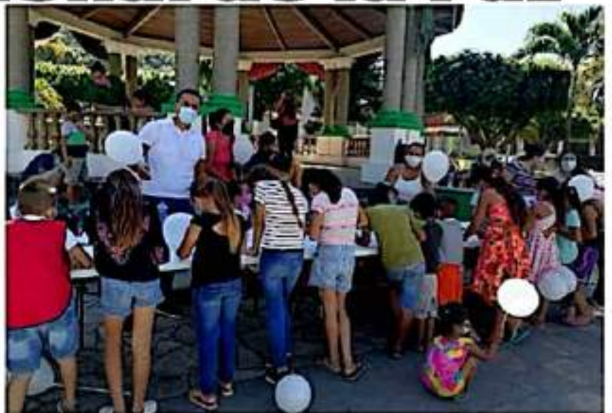
Ayer en Aguila, niñas y niños conmemoraron, pintando, el Día Internacional de la Paz.