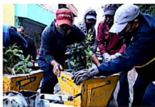
MORELIA, MICH.- El alcalde consideró que estos, además de ser muy feos, no cumplían con la función para la que fueron concebidos, aunado a la constante queja de los ciudadanos, así como los múltiples accidentes como choques de autos y derribo de ciclistas.

En ese sentido, dijo que "a las administraciones que recién arrancamos, nos corresponde cerrar el año, no esperen cosas nuevas o muy novedosas porque ya estamos cerrando lo que otros arrancaron; no hay presupuestos nuevos, ni recurso, ni sistema, no esperen que los baches se acaben mañana".