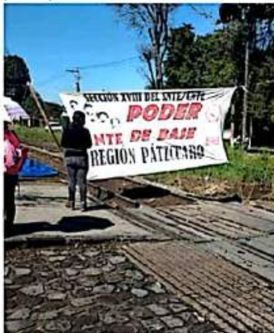
No hay falta de actividad. Al momento avanzaban los trabajos al tren.