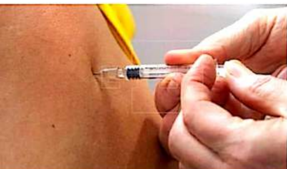
APATZINGÁN, MICH.- Solamente se vacunará a personas de Apatzingán que hayan recibido la primera dosis entre el 30 de agosto y 6 de septiembre.

■ Para el grupo etario de 18 a 29 años de edad