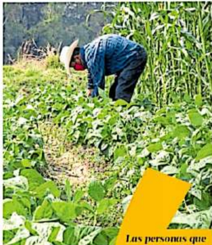
Productores encuentran mano de obra en otros municipios - con engaño

Aseguró que los jornaleros también buscan mejorar por la falta de respuesta de las autoridades en cuanto a la calidad de servicios médicos, educativos, guarderías