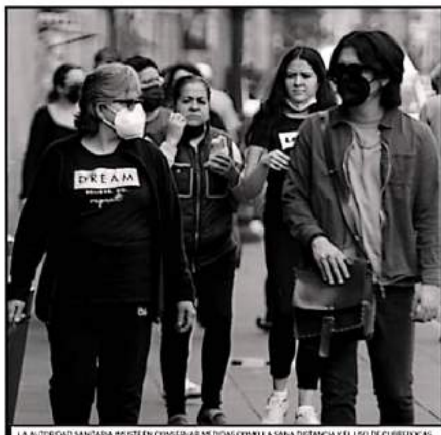
LA AUTORIDAD SANITARIA insiste en conservar medidas como la sana distancia y el uso de cubrebocas

MUNICIPIOS en Bandera Amarilla, entre ellos Morelia