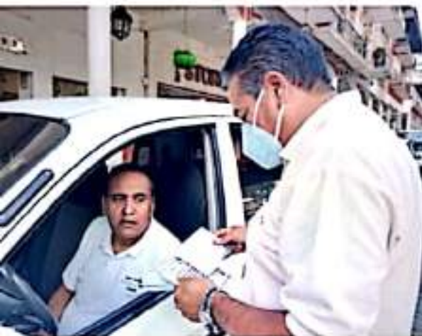
JRUAPAN, MICH. - Ayer, inspectores de la Cocotra realizaron un operativo de verificación de documentos y de medidas sanitarias a unidades de transporte público en su modalidad de taxis.