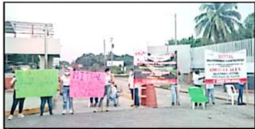
SON UNA TREINTENA DE PROVEEDORES Y PRESTADORES DE SERVICIOS LOS QUE RECLAMAN ADEUDO A DOS EMPRESAS.