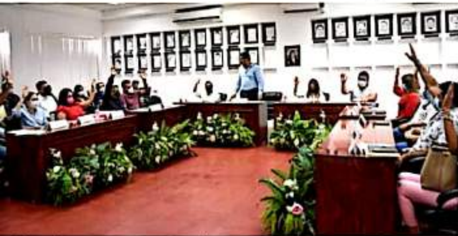
CD. LÁZARO CÁRDENAS, MICH.- Integrantes del Órgano de Gobierno aprobaron la donación de un predio para la construcción de un Banco del Bienestar en la tenencia de La Mira.