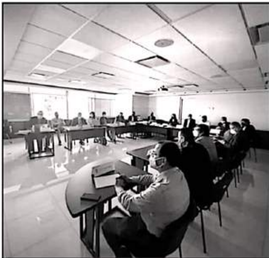
ENLACES PARA CUMPLIR CON ENTREGA-RECEPCIÓN, NO SE VAN RATIFICAR COMO TITULARES DE LAS DEPENDENCIAS