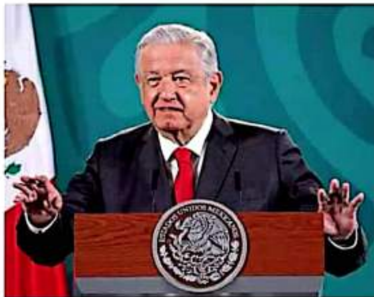
Mañanera. El presidente Andrés Manuel López Obrador fue cuestionado sobre el juicio al ex presidente Calderón en la Corte Penal Internacional. JCIAMOSCOTRO

— Los procesos de este tipo pueden durar muchos más años, pero relacionándonos con el caso que se mencionó (Felipe Calderón) y de México, no ha empezado todavía. En este caso, no resulta en la base de datos de la Corte Penal Internacional actual-