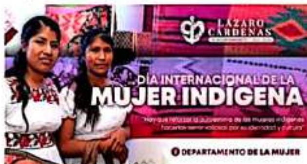
CD. LÁZARO CÁRDENAS, MICH.- El Departamento Municipal de la Mujer convoca a las mujeres de Lázaro Cárdenas para conmemorar el Día Internacional de la Mujer Indígena.

El evento, el 1 de octubre, en el patio central del Palacio Municipal