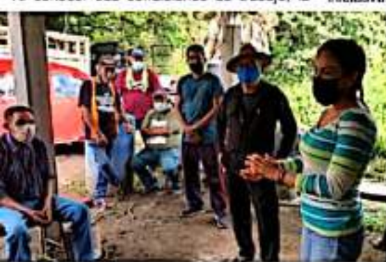
APATZINGÁN, MICH.- La diputada integrante del grupo parlamentario del Partido de la Revolución Democrática (PRD) en la 75 Legislatura local, escuchó las necesidades de los trabajadores.

"Agradezco el respaldo que me han brindado para ser su voz en el Congreso del Estado, ahora yo con acciones y compromiso daré resultados, impulsando las propuestas legislativas que requieren para mejorar sus condiciones de vida y atendiendo también las solicitudes en materia de gestión", finalizó.