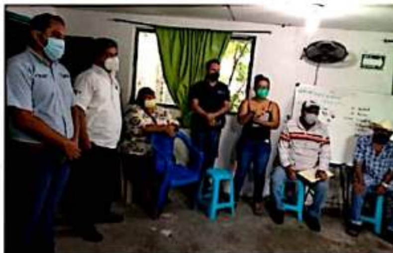
CD. LÁZARO CÁRDENAS, MICH.- Afectados por las lluvias de diversas tenencias del municipio piden apoyo a los tres órdenes de gobierno.