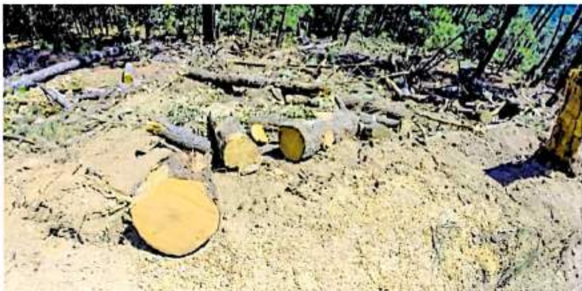
El cambio del uso de suelo implica un aumento en los casos de desgajamientos de los cerros y contribuye a la crisis de agua.