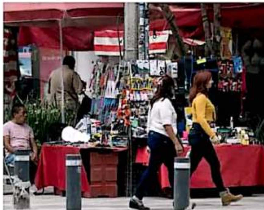
Desprotegidos. En el mercado informal, los trabajadores carecen de prestaciones.

Mientras que del lado de la formalidad apenas fueron contabilizados 220 mil empleos, con una tasa de crecimiento mensual de 0.09%, que es 47 veces inferior al repunte de 4.2% observado en