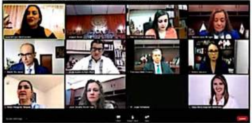
A través de la plataforma digital del IEM, se participó en el evento: "Las acciones afirmativas para incorporar candidaturas de personas de la diversidad sexual y en situación de discapacidad en el Proceso Electoral 2020-2021: Alcances y Retos".