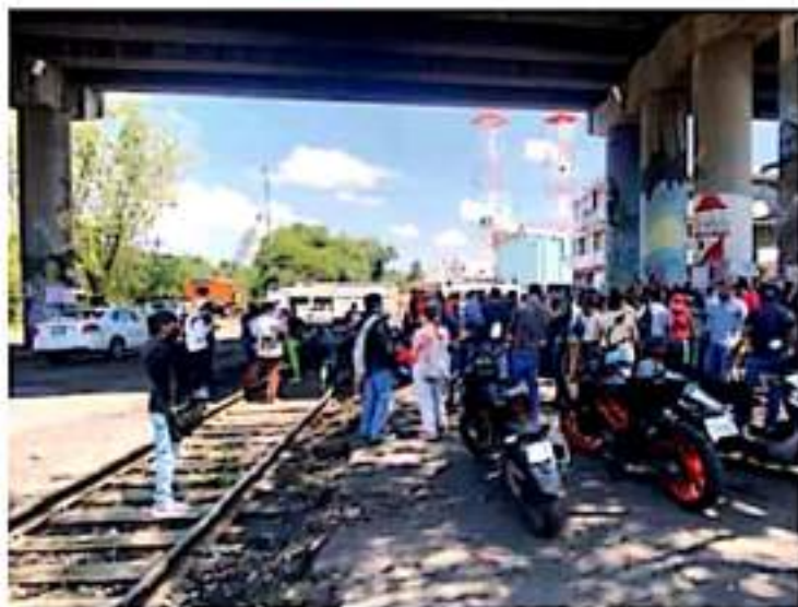
2021. Se han acumulado 72 días de bloqueos en las vías del tren en el estado. / COMESA