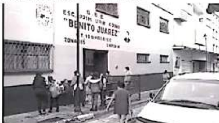
Entre las primarias que iniciarán actividades este lunes están: Leona Vicario, Carmen Sordán, Amado Nervo, Francisco J. Múgica, entre otras.

Agregó que con las jornadas de vacunación realizadas, hasta ahora se ha vacunado en el municipio al 70% de la población de mayores de 18 años, lo que indica un buen avance. En caso de rezagados de otros rangos de edad, aseguró que cuando haya solicitudes se harán las gestiones necesarias, ya que la vacuna es un derecho universal.