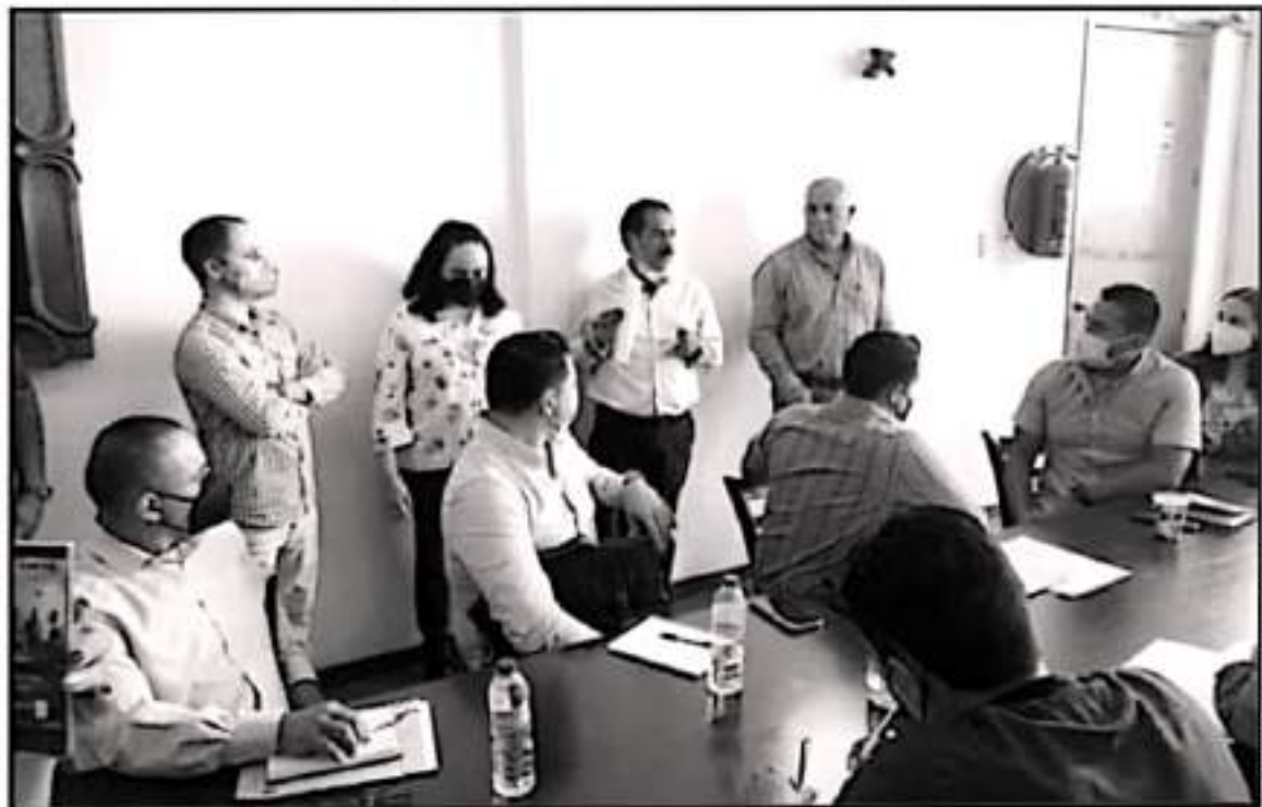
ES LA SEGUNDA OCASIÓN QUE LA AUDITORÍA SOLICITADA POR EL MSH ES APROBADA PAVTO POR LA ANTERIOR COMO POR LA ACTUAL ADMINISTRACIÓN

"Hay un documento en el que la presidencia paga entre 850 o 900 mil pesos por un proyecto para una alberca que no se hizo y que no se sabe a hacer y así otro tipo de cosas, me voy a referir a la última de las cosas que se dieron en el Ayuntamiento, cuando algunos de los regulares presentaron facturas del gasto de un millón y casi 400 mil pesos y que la tesorería no supo donde gasto ese dinero, el presidente municipal tampoco supo donde quedó ese