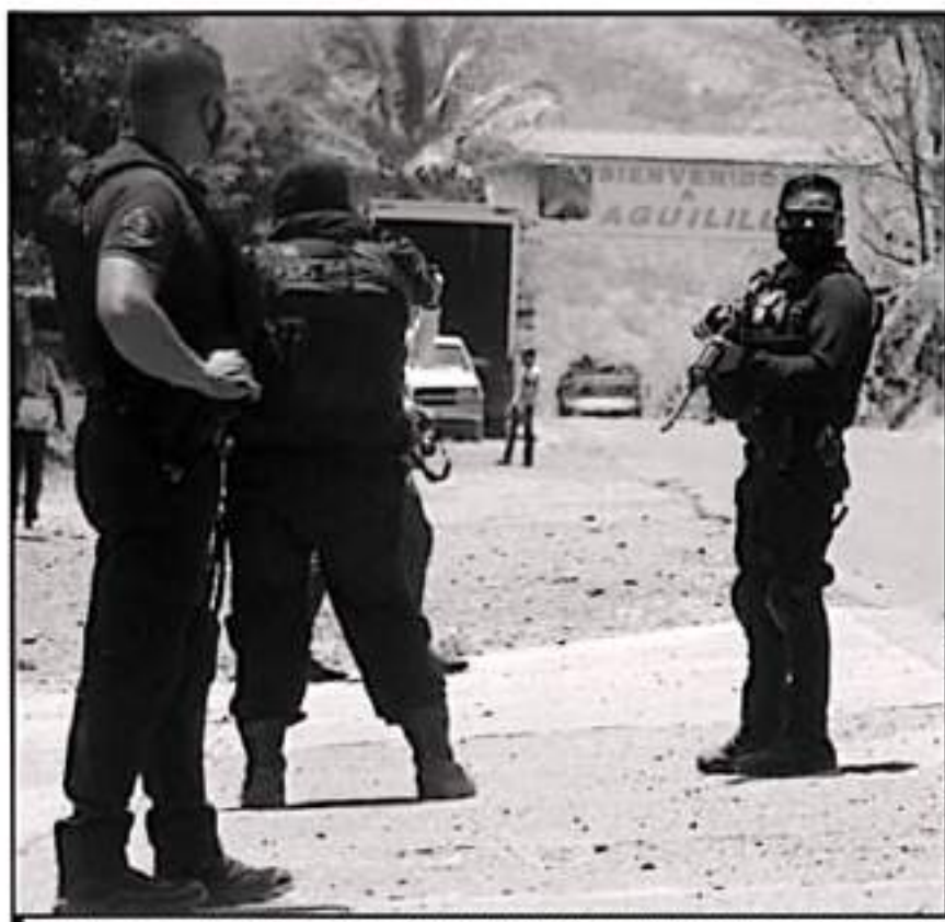
TRAS EPISODIOS VIOLENTOS ENTRE GRUPOS CRIMINALES, FAMILIAS ENTERAS SON REFUGIADAS A HORAS DE SUS PUEBLOS

En lo que refiere al municipio de Tepalcatepec, se tiene un total de 500 desplazados de la población de Mesas del Terrenate, 100 de La Limonera, 20 de Truchas; 200 de Cuchis, 20 de Tamarindos;