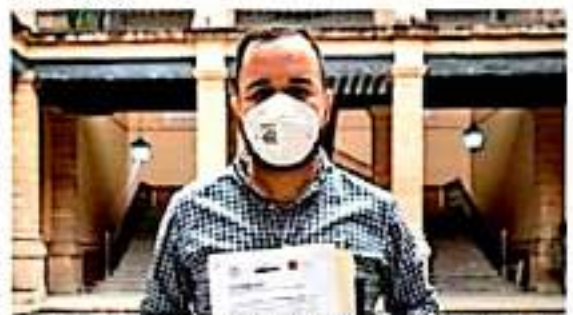
El legislador pedraza ya presentó un punto de acuerdo para apoyar a municipios en desastre tal como lo que prevé la Ley de Egresos del Estado.