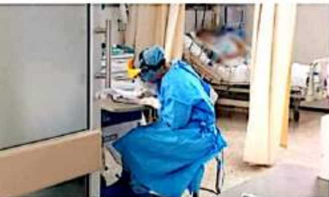
CD. LÁZARO CÁRDENAS, MICH.- La ocupación de camas reconvertidas para la atención IRAG, se encuentra al 49.9 por ciento en hospitales de Lázaro Cárdenas.

CD. LÁZARO CÁRDENAS, MICH.- La ocupación de camas reconvertidas para la atención de infecciones Respiratorias Agudas Graves (IRAG), se encuentra al 49.9 por ciento en hospitales de Lázaro Cárdenas.