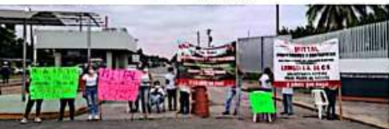
CD. LÁZARO CÁRDENAS, MICH.- Proveedores y prestadores de servicios locales adheridos a la Canaco, se manifestaron en el acceso principal de la planta de ArcelorMittal, debido a los