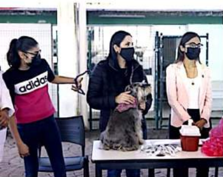
URUAPAN, MICH.- Coordinándose, el Sistema DIF Uruapan y la Secretaría de Salud, realizan la

Además, la presidenta del DIF indicó que en esta oportunidad la jornada de vacunación está abierta para perros y gatos, y es parte de una estrategia general de acciones dirigidas a la prevención de enfermedades, entre los sectores más sensibles y vulnerables de la población.