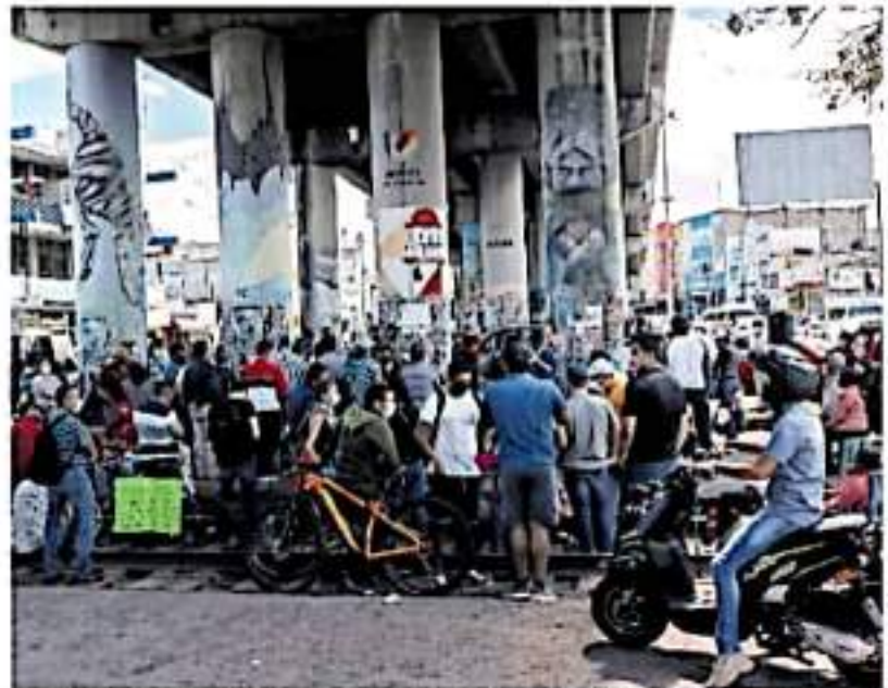
Los docentes se apostaron de nuevo en el camino ferroviario de Tres Puentes.

en el camino ferroviario antes de las 12:00 horas, colocando mantas en las que rechazaron la reforma educativa, las Unidades de Mejoría y Actualización (UMAS), la Unidad del Sistema de Carrera de las Maestras y los Maestros (USCAMM) y el pago diferencial, además de estabilidad laboral y salarial.