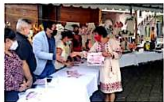
SAN JUAN NUEVO PARANGARICUTIRO, MICH. - Ante autoridades municipales y eclesásticas, se realizó el XXXV Concurso de Artesanos de este municipio.