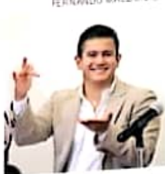
Victor Hugo Zurita Ortiz, diputado local.