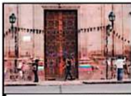
UNA DE LAS LONAS FUE RETIRADA POR AUTORIDADES