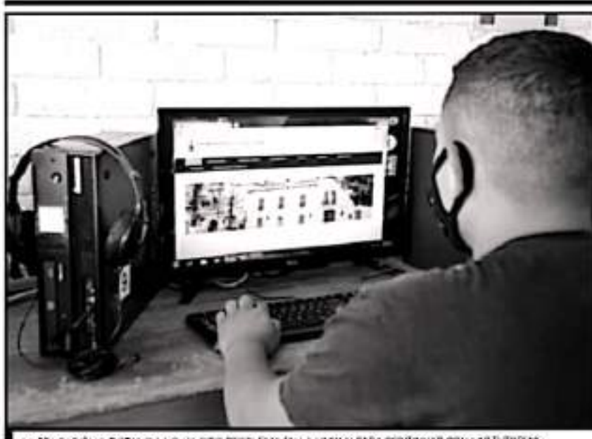
LA EDUCACIÓN A DISTANCIA NO HA SIDO PROBLEMA EN LA UMSNH PARA CONTINUAR CON LAS TUTORÍAS.

se identifica a los jóvenes que requieren más apoyo para la tutoría individual o incluso atención psicológica".