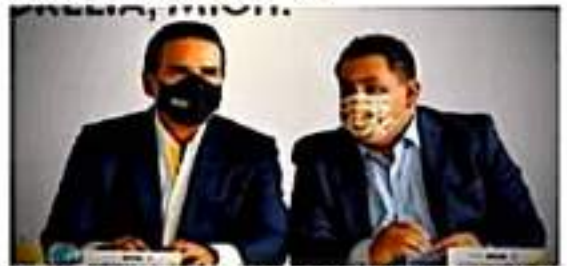
Con el gobierno de Silvano Aureoles se generó estabilidad social: Víctor Manríquez.

En ese sentido, el líder partidista, recalcó que desde el Partido de la Revolución Democrática (PRD) hay un respaldo absoluto al Gobernador Silvano Aureoles Conejo, en la Cruzada por la legalidad y la paz de Michoacán y de México, en su lucha por la democracia y la defensa de las instituciones.