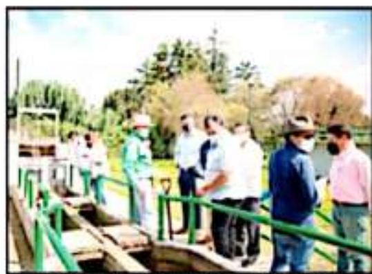
EL ALCALDE DE PATZCUARO AGRADECIÓ EL TRABAJO REALIZADO