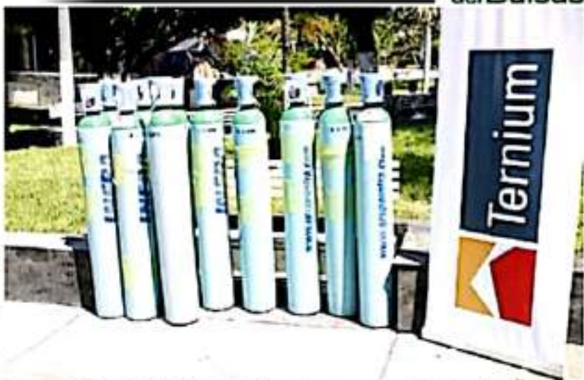
La empresa Ternium por fin atendió la petición de los aquilenses, y aunque no dio autorización para construir la clínica Covid que están demandando, donó cilindros de oxígeno medicinal.