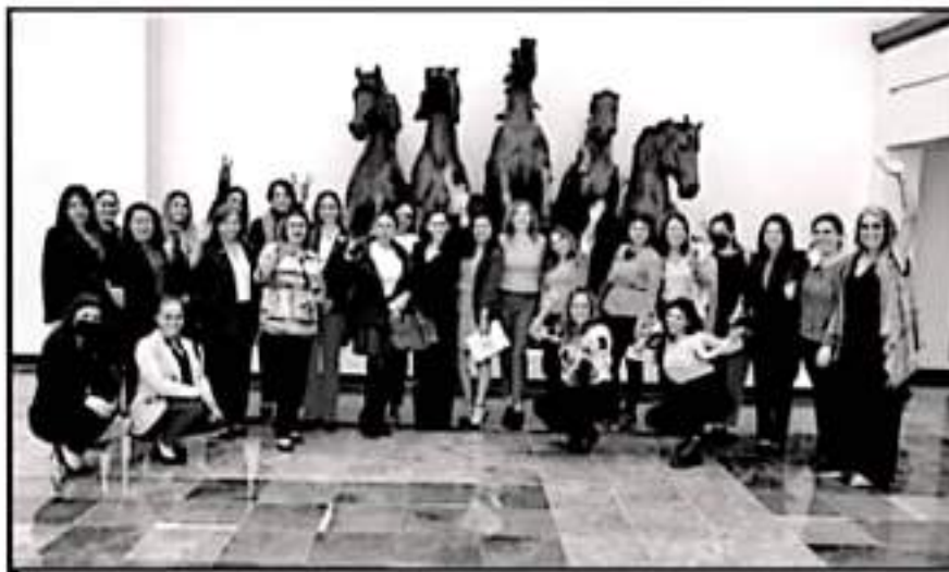
LAS PARTICIPANTES DESTACARON QUE SU PARTICIPACIÓN EN EL ENTORNO EMPRESARIAL ES CLAVE PARA EL DESARROLLO

para generar proyectos grandes, que nuestras empresas tengan crecimiento, que puedan trascender y no se queden en un experimento".