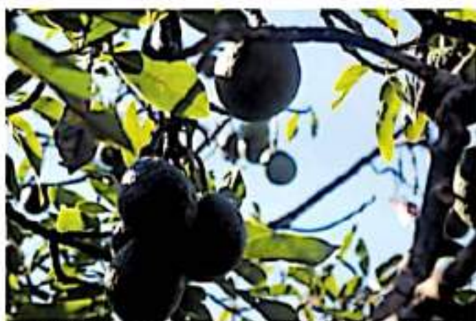
La producción de aguacate es la que más impacto económico tiene en Michoacán, genera cada año alrededor de 40 mil millones de pesos.

Además de la siembra del fruto, detrás del consumo de los bosques michoacanos se encuentra el crecimiento urbano, evidente con la proliferación de nuevos fraccionamientos y colonias. También tienen a alterar la naturaleza de dichos espacios