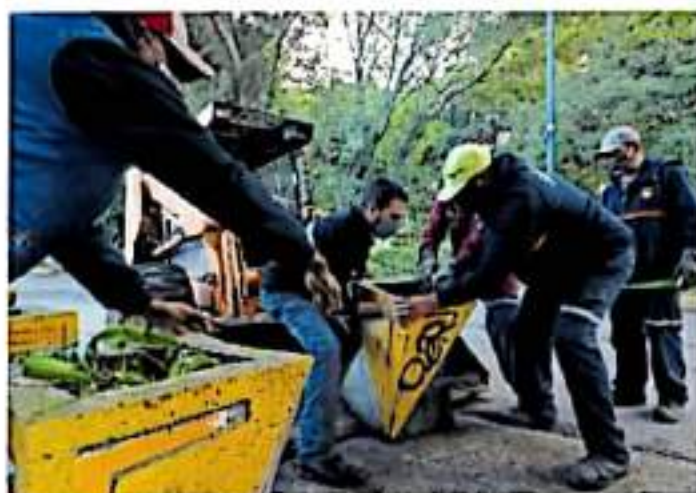
Están hechos de cemento y son un foco rojo para la proliferación de moscos

gas. Sin tener una proyección presupuestal definida, el alcalde explicó que cambiar el colector del manantial de San Miguel a los filtros, en donde se fugan 80 litros por segunda, tiene un costo de 20 millones de pesos, mientras que cambiar el colector de la red principal de agua de los filtros de la ciudad que baja por Virrey de Mendoza, se calcula en 50 millones de pesos. 'Son distintos proyectos, ahora son costos estimados porque vamos a tener una cantidad real, una vez que se tengan los proyectos definidos y en eso estamos', finalizó.