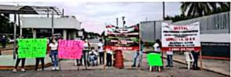
CD. LÁZARO CÁRDENAS, MICH.- Proveedores y prestadores de servicios locales adheridos a la Canaco, se manifestaron en el acceso principal de la planta de ArcelorMittal, debido a los adeudos de Consorcio Total, S.A. de C.V. y Lomcci, S.A. de C.V.