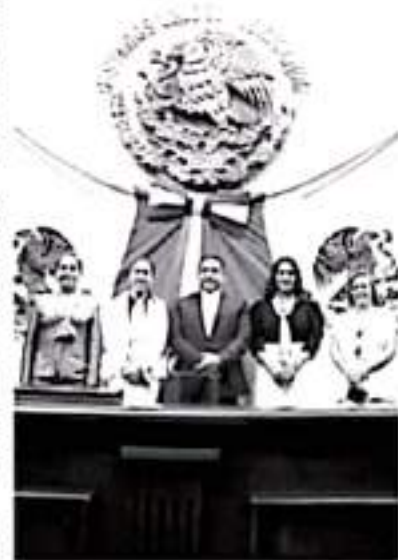
El líder de la bancada señaló que como PRD priorizarán los temas de interés social, mismos que se encuentran plasmados en la agenda de la Alianza Legislativa.

Recordó que el PRD siempre se ha caracterizado por defender los temas de interés social, gracias a lo que se logró la conquista de derechos sociales, humanos y políticos en nuestro país y que desde la bancada perredista aportará todo el esfuerzo a la estabilidad política, y desarrollo de las y los michoacanos.