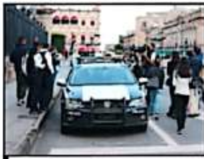
POLICÍAS ESTUVIERON PRESENTES A LA MANIFESTACIÓN

“A las instituciones les duele que les digan que con ellos los responsables de que esto siga ocurriendo. Las personas que están encargadas de prevenir no están haciendo su trabajo. Si la Fiscalía dice que está lista pues que lo demuestre en el juicio, si realmente quieren llegar hasta ese momento ahí lo van a demostrar a la opinión pública cuando llegren años de sentencia.