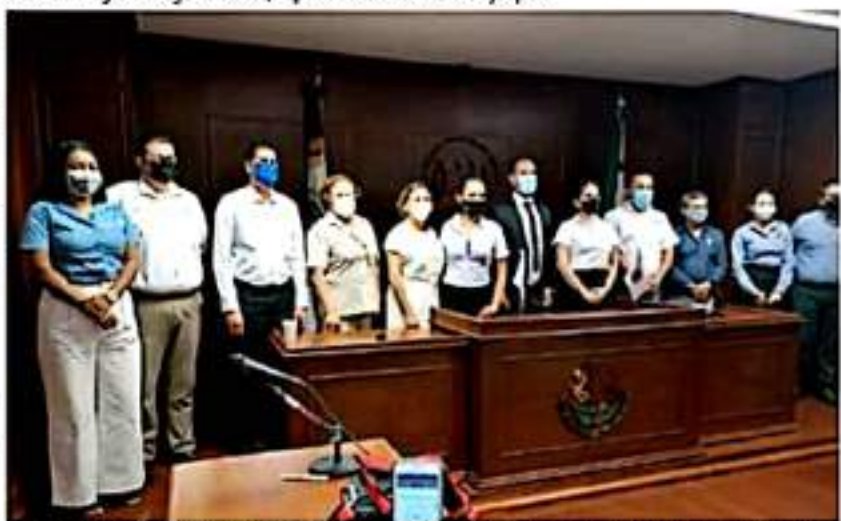
La grid fice del recuerdo de todos los asistentes al evento de firma de convenio de colaboración entre la Universidad Vizcaya de las Américas, Campus LC y Mujeres de Acero.

que los contrataron, no se trata nada más de estirar la mano y cobrar su quincenta, ellos son los que tienen que limpiar el camino para que la alcaldesa no se esté confrontando con medio mundo, independientemente de quien tenga la razón, los políticos del ayuntamiento deben de empezar a hacer política, de lo contrario las aspiraciones de muchos se verán truncadas por el golpeo interno y externo de que está siendo objeto Irzé Camacho, esto apenas comienza pero ya vemos el rumbo que están tomando las cosas y de seguir así, veremos confrontaciones por todos lados, ¿no lo ve así patrón? Hasta la próxima.