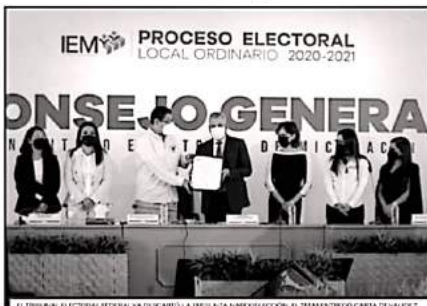
EL TRIBUNAL ELECTORAL FEDERAL VA DESCARTAR LA PRESENTA NULACIÓN, EL JEM ENTREGÓ CARTA DE VALIDEZ