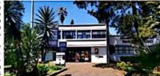
URUAPAN, MICH.- La Facultad de Agrobiología "Presidente Juárez" inicia en este ciclo escolar la Licenciatura en Agronegocios, nueva carrera recién aprobada por el Consejo Universitario.

dado que también participa FIRA (Fideicomiso Institutos en Relación con la Agricultura), lo que hace que sea un programa importante.