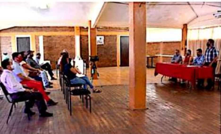
CD. LÁZARO CÁRDENAS, MICH.- Este martes, se llevó a cabo una mesa de trabajo con representantes del área de cultura y los regidores que manejan dicha comisión, para acordar un nuevo plan de trabajo que atienda y promueva las actividades artísticas culturales que se realizarán en la Casa de la Cultura "José Vasconcelos".