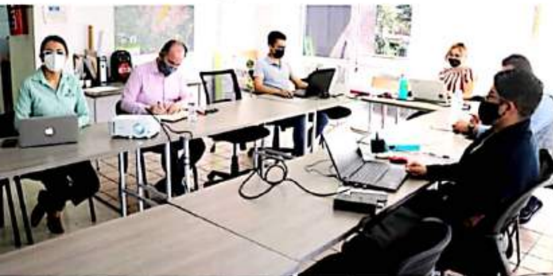
URUAPAN, MICH.- La administración municipal y el Instituto Municipal de Planeación avanzan en la elaboración del Plan Municipal de Desarrollo, que se nutre con propuestas ciudadanas.