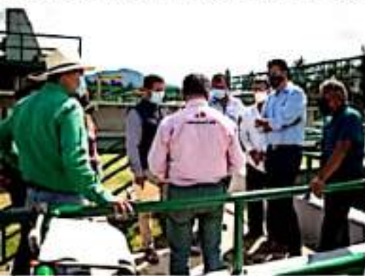
PÁTZCUARO, MICH.- El presidente municipal de Pátzcuaro, Julio Arreola Vázquez, agradeció a nombre de los habitantes de este municipio el trabajo realizado por el gobierno encabezado por Silvano Aureoles Conejo.

Luego de su recorrido, el alcalde señaló que se buscará un equilibrio en la infraestructura urbana, a fin de que se cumpla con la función de seguridad para los transeúntes, así como el ágil tránsito de automovilistas; proyectos que se encuentran en definición.