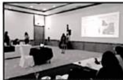
LAS PARTICIPANTES EN LA AMEXME CREAN ACUERDOS