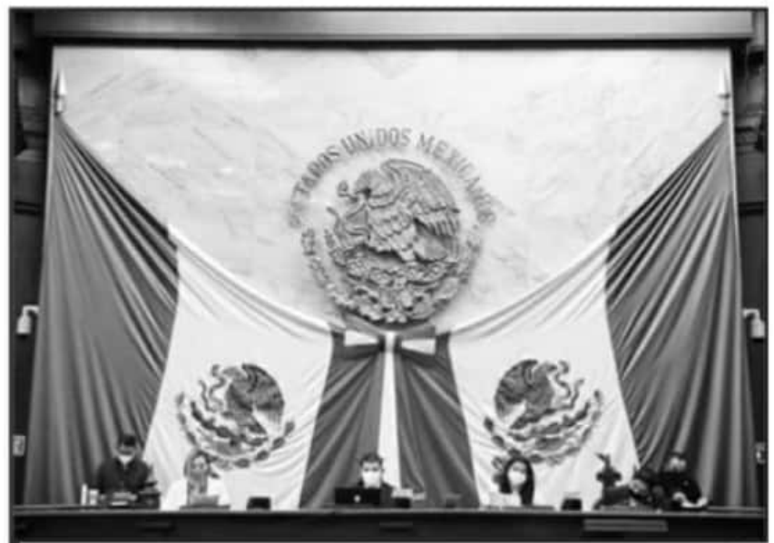
NUEVAMENTE REALIZÓ SESIÓN EL CONGRESO DEL ESTADO A PUERTA CERRADA ANTE EL TEMA DE LA PANDEMIA.