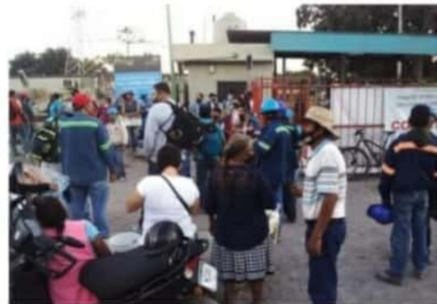
CD. LÁZARO CÁRDENAS, MICH.- Los trabajadores relacionados a la contratista Coconal, exigen el pago de liquidaciones conforme a la ley, además de incrementos salariales, pago de vacaciones, equipos de seguridad y cese de

Hasta el momento, ArcelorMittal no se ha pronunciado al respecto ni otras organizaciones sociales ligadas a los movimientos por la defensa de los derechos de trabajadores.