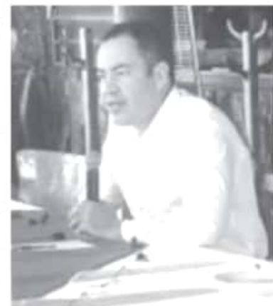
"Más allá de los partidos, más allá de las cuestiones de poder, como político, yo llego a buscar cómo mejorar las cosas y caminar del lado de la gente, pues es lo más importante y es posible hacerlo".

Una de sus fortalezas, es que, como Coordinador de Estrategia, escucha y atiende las militancias de los 3 partidos, región por región. "Estoy agradecido de que caminemos juntos. Recorrer Michoacán, ha sido una gran