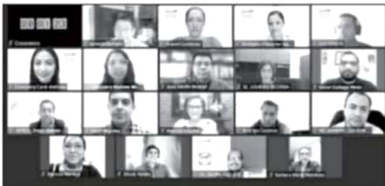
Quienes decidan ejercer el derecho a ser reelegidos en sus mismos cargos no estarán obligados a renunciar a los mismos, por lo cual, quienes decidan permanecer en su función no podrán dejar de acudir a las sesiones o reuniones.