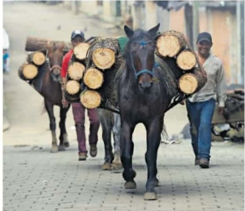
El pueblo, de menos de 3 mil habitantes, se localiza en la Meseta Purépecha y es municipio de Nahautzen

En la edición del 2020, el corto ganador fue Iahpinkua , de Edgar Crisóstomo Ramírez. Para la convocatoria, UNAM Morelia solicitó que los participantes fueran jóvenes que vivan o sean originarios de la comunidad y tengan entre 13 a 25 años de edad. Los videos, grabados en formato de