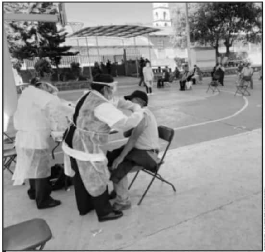
EN LOS MUNICIPIOS EL PERSONAL MÉDICO TRABAJA A MARCHAS FORZADAS PARA CUMPLIR EN FECHA LA VACUNACIÓN.

de la Salud en Morelia cinco establecimientos fueron suspendidos por no cumplir con las normas y los lineamientos que marca la ley para la Nueva Convivencia. Fueron 89 los establecimientos supervisados en este municipio, por parte de la Secretaría de Salud de Michoacán a través de la Comisión Estatal de Protección contra Riesgos Sanitarios (Coepris)", se informó en el corte al día sábado.