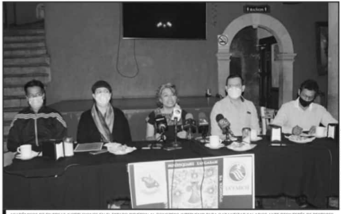
ACADÉMICOS DE DIVERSAS INSTITUCIONES EN EL ESTADO PIDIERON AL CONGRESO INTERVENIR PARA GARANTIZAR SALARIOS ANTE DESINTERÉS DE RECTORES.

Asimismo, expuso que la Federación ha señalado que los recursos para la universidad han sido enviados para cubrir adeudos y que, en este sentido, hasta el momento desconocen si retención del pago sea responsabilidad de la administración estatal