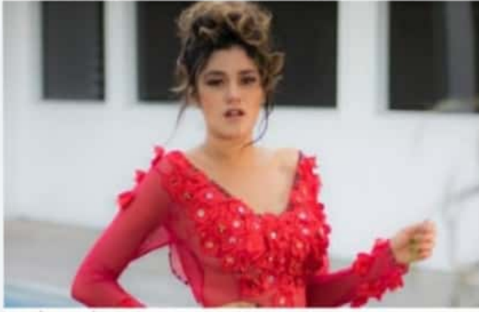
CD. LÁZARO CÁRDENAS, MICH.- La belleza femenina de este Puerto acude a los eventos de representación del estado; esta vez en el certamen Señorita México 2021.