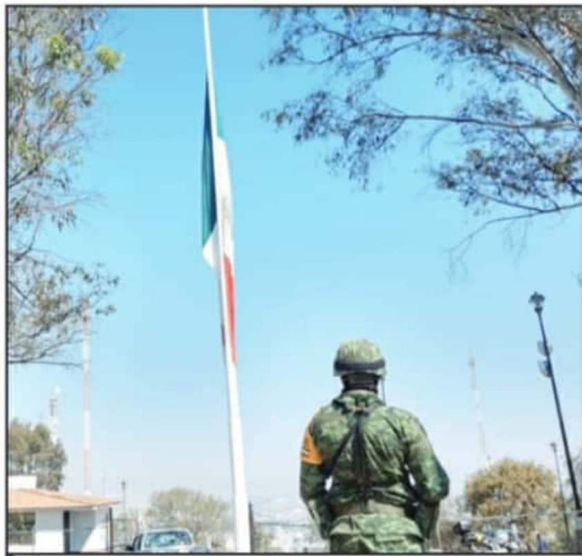
COMO CADA AÑO, HOY LA PLAZA DEL ASTA BANDERA ESTARÁ CONCURRIDA, PERO LUEGO OTRA VEZ SERÁ OLVIDADA.

Pero desde el 2017 fue víctima directa del robo y saqueo; 22 placas y bustos fueron saqueados y los mismos no han sido repuestos