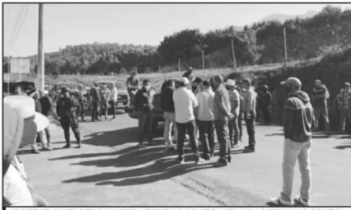
HORAS DE TENSIÓN SE VIERON ENTRE LOS AGUACATEROS Y AUTORIDADES QUE LOS EXHORTABAN A DESALOJAR LA VÍA DE COMUNICACIÓN EN TANCÍTARO.

3 PESOS precio que le pusieron los 'coyotes'