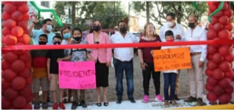
CD. LÁZARO CÁRDENAS, MICH.- El gobierno de Lázaro Cárdenas trabaja en la rehabilitación de estos espacios, de la mano con la ciudadanía, en esta ocasión, se rehabilitó el área verde ubicada en la Colonia Ampliación Jarene, dentro de la cabecera municipal.