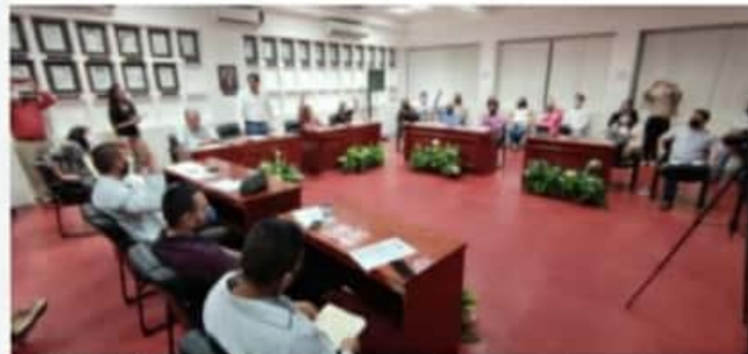
CD. LÁZARO CÁRDENAS, MICH.- El Cabildo aprobó por mayoría de votos, modificaciones al Presupuesto de Ingresos y Egresos del Ejercicio Fiscal 2021, así como la ampliación PAI 2021, en el rubro del ramo 33, fondo IV.