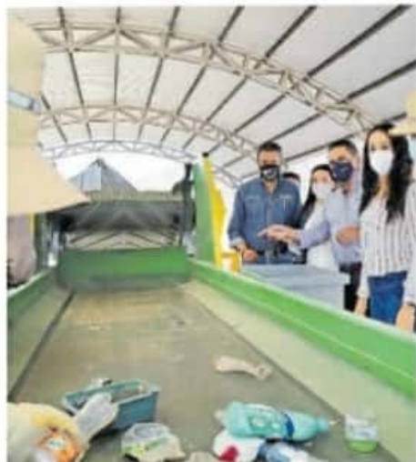
Puede manejar más de 176 toneladas diarias de residuos

El pueblo, de menos de 3 mil habitantes, se localiza en la Meseta Purépecha y es municipio de Nahautzen. En abril de 2017 sus habitantes organizaron una protesta como consecuencia de añejos conflictos de tierras, pero fueron reprimidos por la policía, un caso que dejó ejecuciones extrajudiciales y cuyo caso activistas niegan a que sea cerrado.