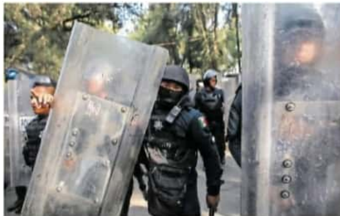
En la cuenta pública 2019, el Secretariado Ejecutivo del Sistema Estatal de Seguridad Pública de Michoacán no destinó recursos del FASP 2019 / NAIARIAS

En materia de seguridad, la ASF audió el Fondo de Aportaciones para la Seguridad Pública de los Estados y del Distrito