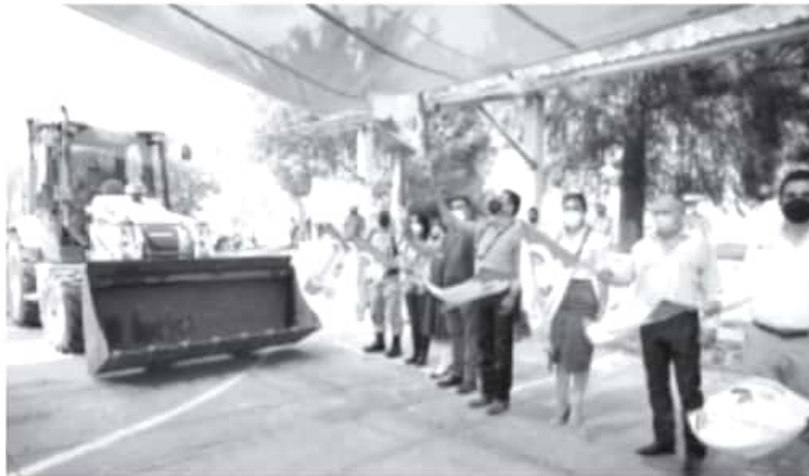
Se mejora la comunicación entre la localidad de Los Guajes y Rancho Viejo, lo que acorta los tiempos de transporte de productos agrícolas y ganaderos que se producen en la zona.

-Inaugura Gobernador pavimentación de la calle de acceso a la comunidad de Rancho Viejo, con una inversión de 7.7 mdp -Arranca la construcción de la techumbre y remodelación de la cancha de basquetbol de la Escuela Secundaria Vicente Guerrero; también entrega apoyos para el DIF Municipal