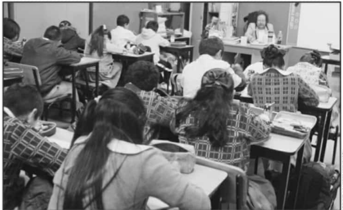
SE ESTUDIA TAMBIÉN UN MODELO HÍBRIDO: LA MITAD DE ALUMNOS RECIBIRÍAN CLASES UN DÍA DE FORMA PRESENCIAL Y EL OTRO DE FORMA VIRTUAL.

Cuestionada sobre si la vacunación de todos los docentes sería un punto crucial para permitir el regreso a clases presenciales, respondió que dicha estrategia depende de las autoridades federales, mientras que a nivel local se debe analizar el número de personas que se pueden