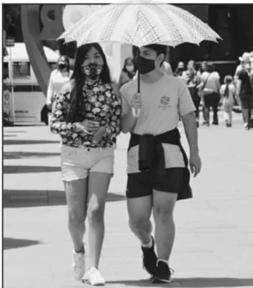
ESPECIALISTAS ADVIERTEN QUE LA CONCENTRACIÓN CONTAMINANTES GENERARÁ ESTRAGOS EN LA SALUD DE LA GENTE

En la temporada invernal pasada, los indicadores de contaminación y de Partículas Finas transportadas en el aire, se marcaron en color naranja, un grado antes del rojo que indicaría niveles peligrosos para la salud de los morelianos. Ha trascendido que uno de los puntos en donde se concentra mayor contaminación es el Centro Histórico de esta ciudad.