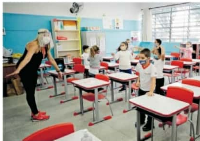
La condición de regresar es que se tenga el semáforo epidemiológico verde

ponibilidad de las vacunas, por lo cual no hay certeza de que pronto estén vacunados los profesores de la entidad.