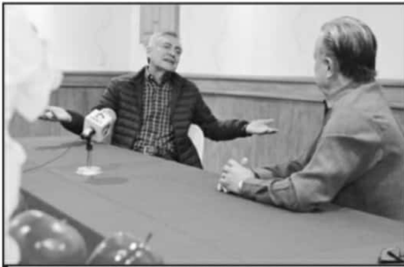
EL ASPIRANTE CONSIDERÓ QUE EL PRIMERO DE ESOS EJERCICIOS DEBE GIRAR EN TORNO A LA HISTORIA DE MÉXICO.