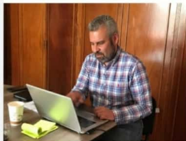
MORELIA, MICH.- Presentó las observaciones que la Comisión de Seguridad Pública y Protección Civil hizo al último informe de gobierno.

2) No comparto la forma de gobernar del Presidente Obrador, pero como una vez dije los partidos no gobiernan, son las personas las que traicionan la confianza de los ciudadanos, o hacen malos gobiernos y hoy en Michoacán y Zitácuaro las cosas no están bien y mucho menos tienen rumbo.