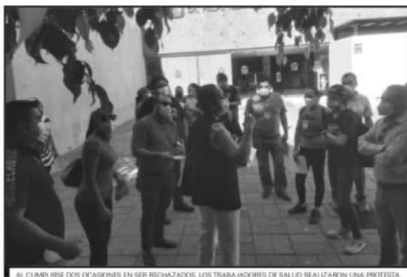
AL CUMPLIRSE DOS OCASIONES EN SER RECHAZADOS, LOS TRABAJADORES DE SALUD REALIZARON UNA PROTESTA.