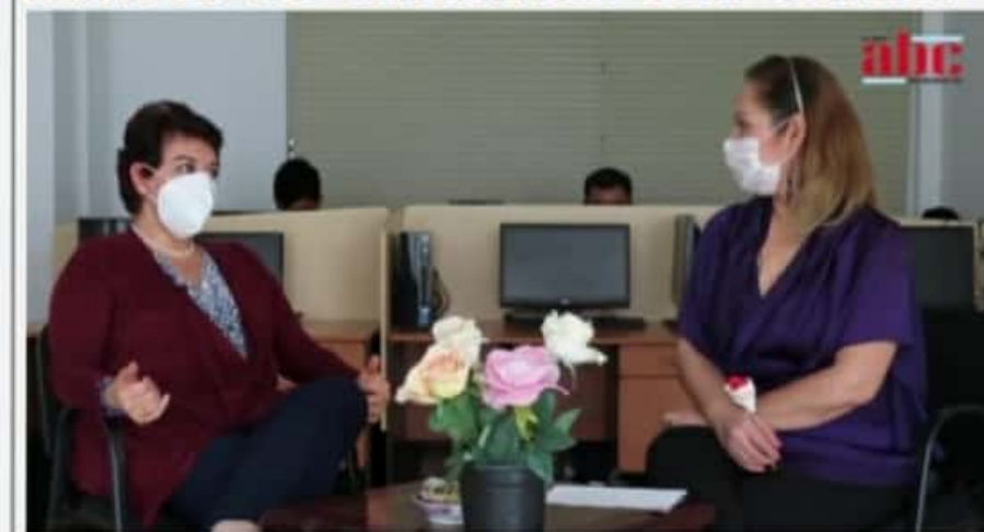
MORELIA, MICH.- Se pueden registrar por un pago de 200 pesos en 3, 10 o 21 kilómetros e infantil.