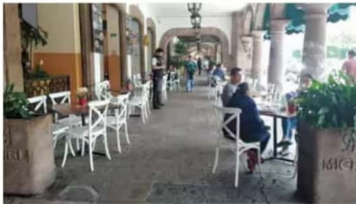
Propósito. Impulsar la reactivación económica y mantener la reducción de contagios.

También contempla que sigan cerradas las plazas públicas, que los bares sigan operando hasta las 23 horas, mantener una estrecha vigi-