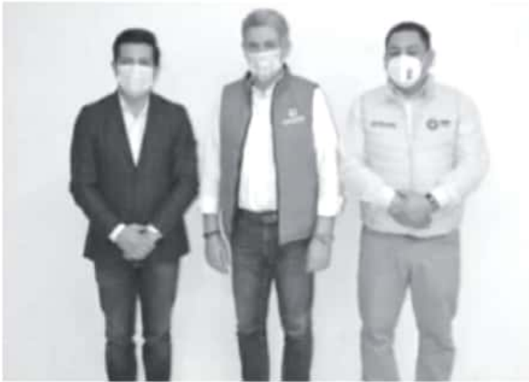
Cuando se revisa la lista de perfiles, liderazgos y propuestas de Morena para sus candidaturas, hay comunes denominadores: corrupción, hartazgo, ocurrencia, reciclaje y mentiras.

-Perfiles de Morena llenos de corrupción, hartazgo y mentiras