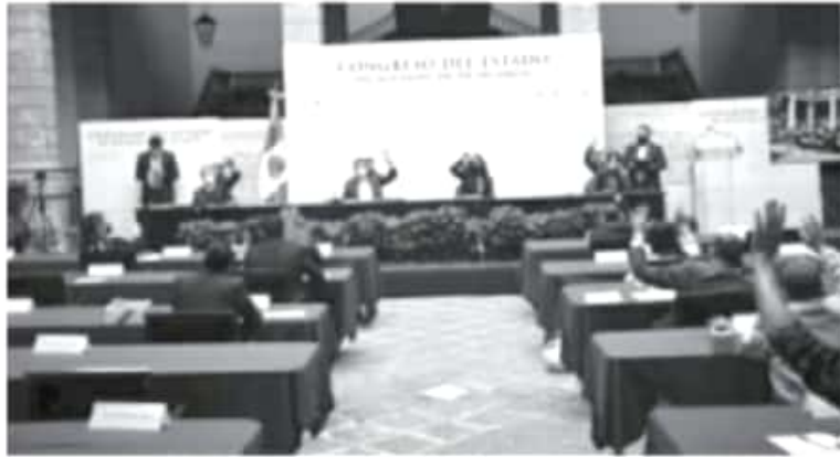
La aprobación de la nueva Ley Orgánica Municipal por parte de la LXXIV Legislatura, en la que se contempla una visión renovada del municipio como eje articulador del desarrollo estatal y nacional.

Morelia, Michoacán, 22 de febrero de 2021.