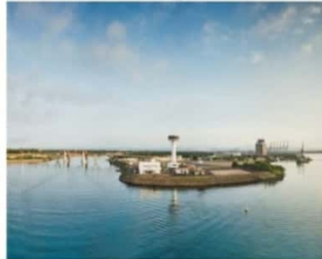
CD. LÁZARO CÁRDENAS, MICH.- La Auditoría Superior de la Federación, en su informe de revisión a la Cuenta Pública 2019, señala irregularidades en el proyecto de instalación de líneas subterráneas del Puerto de Lázaro Cárdenas, en concreto por la falta de su inclusión en el Programa Anual de Obra Pública y Servicios 2019 de la Apilac.

En estos casos, las irregularidades tienen que ver con pagos en exceso en algunos contratos, obras pagadas que no fueron ejecutadas e incluso la falta de firma del contratista en algunos documentos.