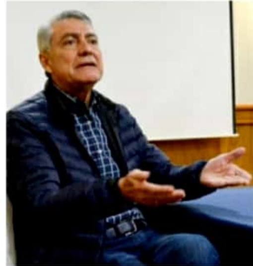
MORELIA, MICH.- Consideró que no se puede aspirar a gobernar si se ignora cómo se dieron los grandes movimientos que transformaron a nuestro país.