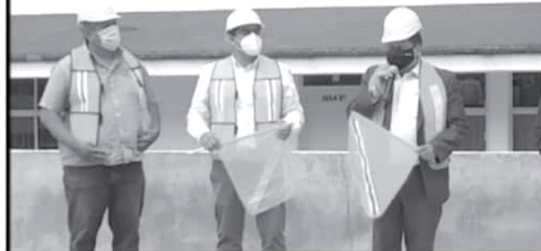
Las dos aulas estarán en la parte de arriba del edificio E, también el centro de cómputo se ampliará para mejorar la atención hacia los alumnos. El costo de la obra será de 760 mil pesos.

Dijeron estar dispuestas a que las reubiquen en otro lugar pero que sea en el centro de la ciudad, por ejemplo la calle 5 de mayo, entre Ocampo y Lerdo, incluso el Jardín Constitución; no que las envíen a la Casona porque allá las ventas son muy bajas para cualquier comerciante que se coloque en este lugar.