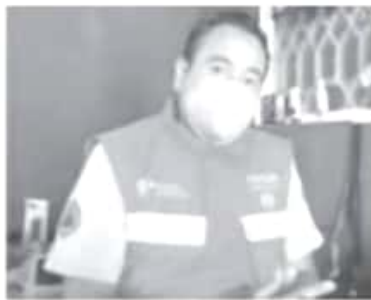
Recomendó tomar todas las precauciones necesarias, en la utilización de anafres pero de forma responsable con ventilación adecuada para evitar la intoxicación con dióxido de carbono.

Agregó que por la pandemia, personal de esta corporación continúa con varias acciones para concientizar a la población sobre el virus, por ejemplo se realiza perifoneo, la entrega de cubrebocas y el monitoreo de oxígeno a nivel local.