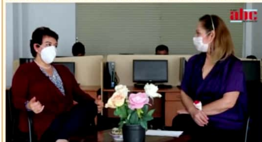
MORELIA, MICH.- Se pueden registrar por un pago de 200 pesos en 3, 10 o 21 kilómetros e infantil.