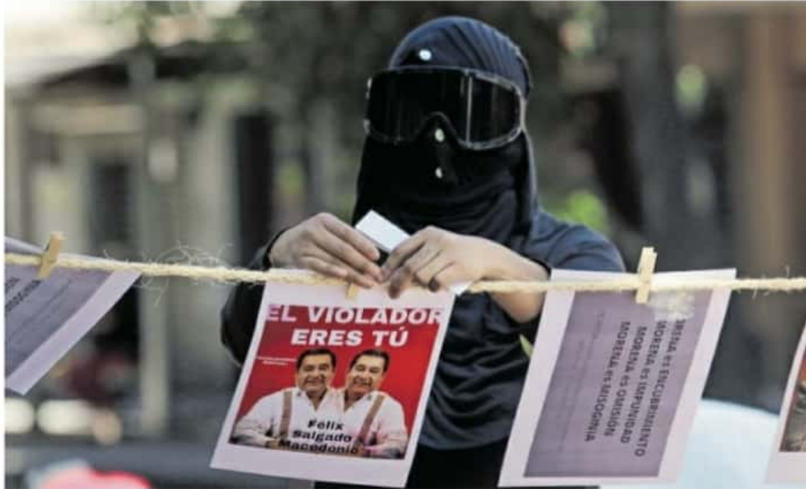
Integrantes de Incendiarías y representantes de Humanas sin Violencia alzaron la voz