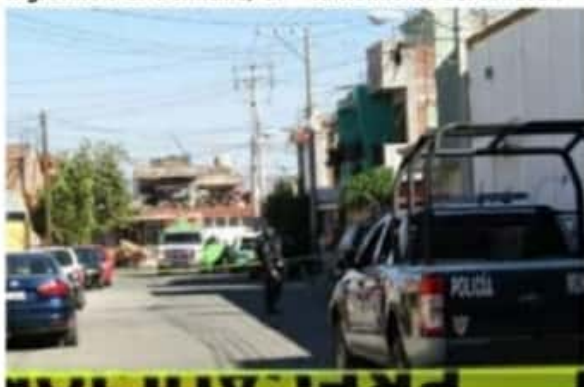
En la azotea de una vivienda ayer fue localizado el cadáver putrefacto de un lava coches, al cual tenía impactos de bala.

También llegó el personal de la Fiscalía de Michoacán que inició la carpeta de investigación y realizó el levantamiento del cadáver.