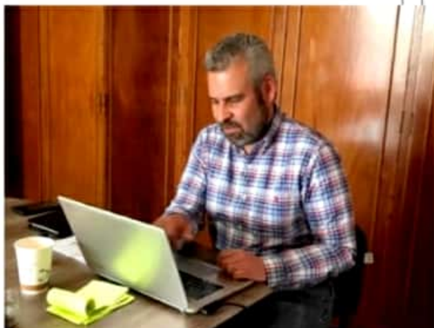
MORELIA, MICH.- Presentó las observaciones que la Comisión de Seguridad Pública y Protección Civil hizo al último informe de gobierno.

2) No comparto la forma de gobernar del Presidente Obrador, pero como una vez dije los partidos no gobiernan, son las personas las que traicionan la confianza de los ciudadanos, o hacen malos gobiernos y hoy en Michoacán y Zitácuaro las cosas no están bien y mucho menos tienen rumbo.