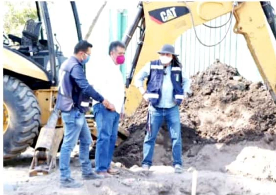
APATZINGÁN, MICH.- El alcalde constató que la obra presenta un 30 por ciento de avance, y aseguró que será entregada en la última semana del mes de mayo.

Al respecto, dijo que Apatzingán es el centro recolector de la economía regional, "por ello merece ser dignificado y embellecido y la mejor forma de hacerlo es modernizando la avenida principal de la ciudad".