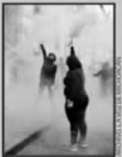
BUENA PARTE DE MUJERES ABOGA POR DESPENALIZAR.

Los michoacanos —expuso— enfrentan la etapa más cruda, más cruel y quizá la más incomprensible de la pandemia, sin bajar las fiestas clandestinas, fiestas patronales y la desobediencia de muchos. Ayer el Congreso de Michoacán se convirtió "en pionero" en solicitar la intervención de Profeco en todo el país para imponer sanciones ante el cobro desmedido en la venta y renta de tanques de gas médico.