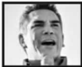
Visita. Alejandro Moreno, líder del PRI, visitará Michoacán esta semana, donde le va a reclamar medio partido.

Viene Alejandro Moreno El dirigente nacional del PRI, Ale-