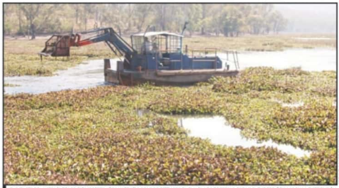
EL IMPACTO DE LA SEQUÍA DE LOS ÚLTIMOS TRES AÑOS HA TRAÍDO CONSIGO RETRASOS EN EL LLENADO DE PRESAS, POR LO QUE SE PREVE FALLAS EN LA DISTRIBUCIÓN.

Pero ya hay avances notables. En voz del especialista y funcionario de la Conagua, uno de los embalses que está por concluirse es la presa del Chihuero, en la región antes mencionada, y el cual se ha