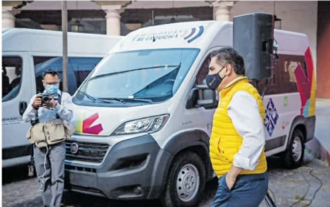
Hallan inadecuado manejo del recurso para Fondo para la Accesibilidad en el Transporte Público para las Personas con Discapacidad / CARMEN HERNÁNDEZ

MIL 822 pesos que no se pagaron al término del calendario de ejecución de los proyectos