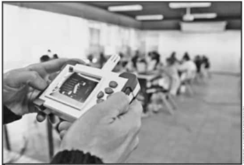
LA COLOCACIÓN DE MEDIDORES DE DIÓXIDO DE CARBONO AYUDARÍA A REDUCIR LOS RIESGOS DE CONTAGIOS.