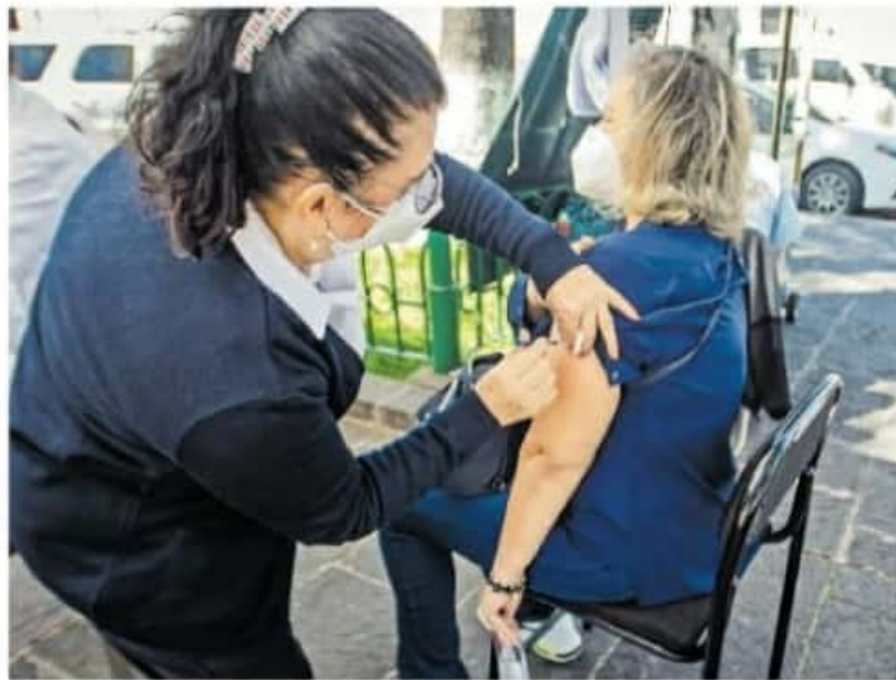
El 13 de enero inició la primera fase de vacunación

Mientras que la tercera fase contempla a las personas de 16 a 59 años con comorbilidades, así como a los profesores de educación básica, lo cual será hasta finales de este año, sin embargo, a nivel estatal, la SSM ha recalorado que el proceso de vacunación se realizará conforme a la dis-