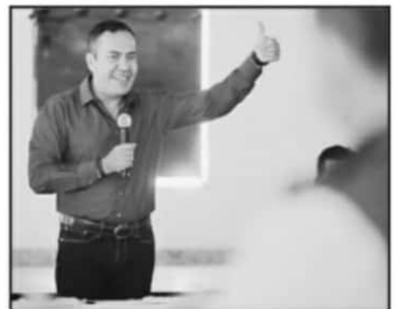
RECORDÓ QUE ESCUCHANDO A LAS MILITANCIAS DE EQUIPO POR MICHOACÁN SE HA LOGRADO CONSTRUIR UN PROYECTO DE UNIDAD EN SECTORES.

"Sin militancia en ningún partido político, he tenido una trayectoria y oportunidad de hacerle de todo. Profesionista, comerciante, empresario, dos veces alcalde de Zitácuaro y secretario de Gobierno, que nos ha permitido idear estrategias para solucionar problemas sociales", indicó.