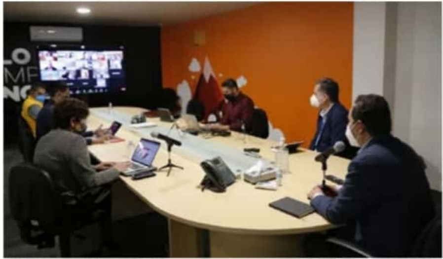
La propuesta deberá ser aprobada por el Comité Estatal de Seguridad en Salud, y por el Comité Municipal de Salud.

Uruapan, así como de la Cámara Nacional de la Industria de las Artes Gráficas, entre otros.