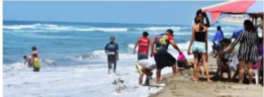
CD. LÁZARO CÁRDENAS, MICH.- El Comité Jurisdiccional de Seguridad en Salud anunció que en conjunto con el sector educativo se trabaja en una propuesta para reactivar la economía local y regional, tras los impactos del Covid-19.