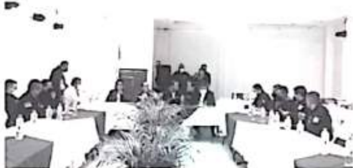
Los dispositivos de seguridad se realizarán en toda esta parte de la entidad por medio de patrullajes y filtros de inspección vehicular en los tramos carreteros y en los sitios de mayor afluencia.

La SSP no baja la guardia en su tarea de garantizar el bienestar de los michoacanos, en caso de ser víctima o presenciar algún delito, denuncia a las líneas telefónicas de emergencias 911 y 089.