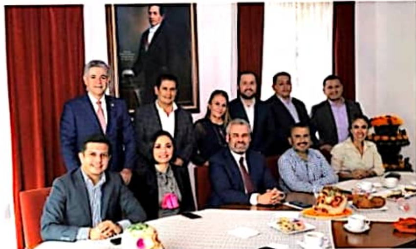
MORELIA, MICH.- El gobernador, Alfredo Ramírez Bedolla, pidió a los diputados respaldar la iniciativa de reforma a la Ley de Ingresos.

La expectativa es que se apruebe la iniciativa antes del próximo 10 de noviembre para que el decreto sea publicado en el Periódico Oficial del estado y cobre vigencia.