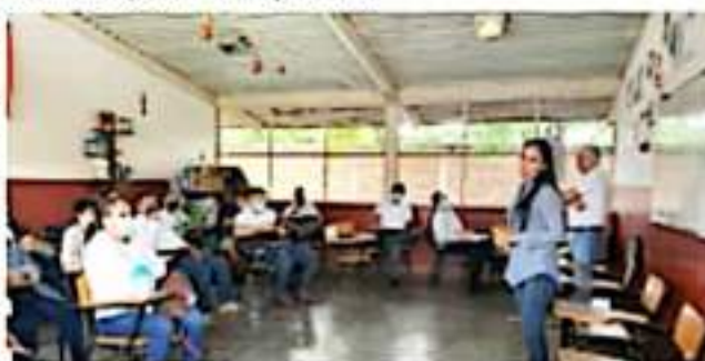
APATZINGÁN, MICH.- El fortalecimiento del sector educativo, afirmó la diputada local por el Distrito de Apatzingán, es una prioridad en su agenda de trabajo.

Finalmente, resaltó la importancia de que se fortalezca el sector educativo, lograr que cada vez sean menos los jóvenes que abandonan los estudios y garantizar la calidad en los métodos de enseñanza, aunado a brindarles todo el apoyo por parte de las autoridades a los maestros y personal docente, así como a padres de familia y alumnos.