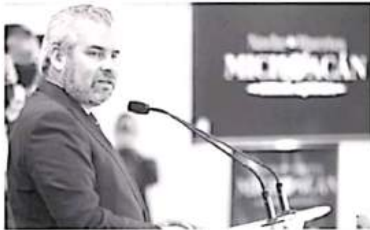
La intención es que, del 15 de noviembre al 17 de diciembre, se abra el periodo para la regularización de los trámites y con ello, obtener ingresos de hasta 466 millones de pesos.

Por otra parte, el gobernador agregó que se solicitará a la Secretaría de Hacienda y Crédito Público incluir a Michoacán en la regularización de automotores usados procedentes del extranjero, luego de que el pasado 18 de octubre se publicó en el Periódico Oficial de la Federación el acuerdo de importación definitiva.