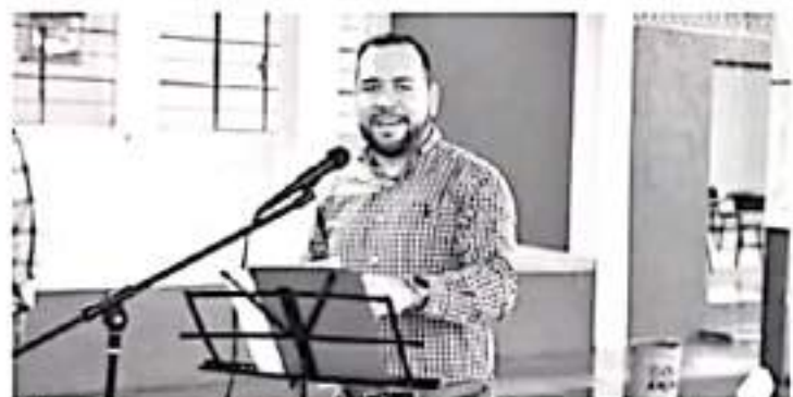
El diputado dijo que se aprovechará que para el 2022 habrá un incremento de más del 6 por ciento de presupuesto para la entidad en comparación con el presente año.

-IT buscará mayores recursos para infraestructura física en la entidad, aseguró el legislador