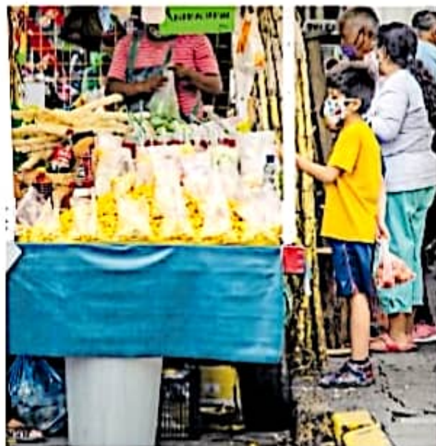
La entidad ocupa el noveno lugar de empleos informales

El sector informal acumula actualmente alrededor de un millón 300 mil trabajadores en el estado