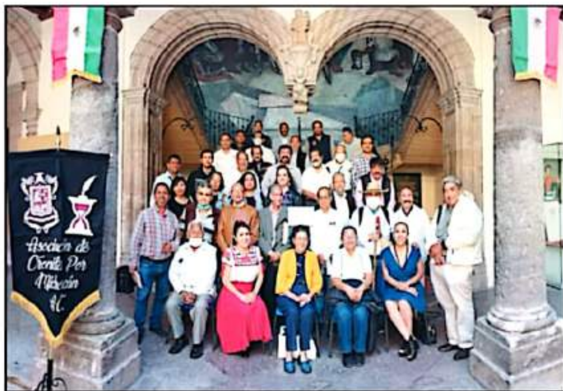
CRONISTAS CONTINUARÁN CON RECRETOS QUE CONLLEVEN AL RESCATE, PRESERVACIÓN Y DIFUSIÓN DE LAS TRADICIONES Y LA HISTORIA DE LAS COMUNIDADES

Asimismo, dieron a conocer el séptimo libro que ha editado de manera conjunta, en esta ocasión es el escrito "Efemérides de los municipios de Michoacán", mismo que es un trabajo conjunto de los cronistas de los municipios de Acuitzio, Alvaro Obregón, Angamucutini, Apatzingán, Buena Vista, Cutzaro, Hidalgo, Huandicáran, Huilamo, Jacoma, Jagulpan, La Piedad, Lagunillas, Morelos, Muguira, Pátzcuaro, Queréndaro, San Andrés Corra, Santa Ana Amaya, Tacámbaro, Tangamandapio, Tingambato, Uruapan, Yurécuaro, Zacapu,