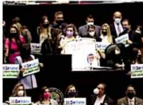
Protesta. Exigieron el regreso del Seguro Popular.

“Existe un rezago de médicos generales y de especialidades, así como en la preparación de enfermeras”