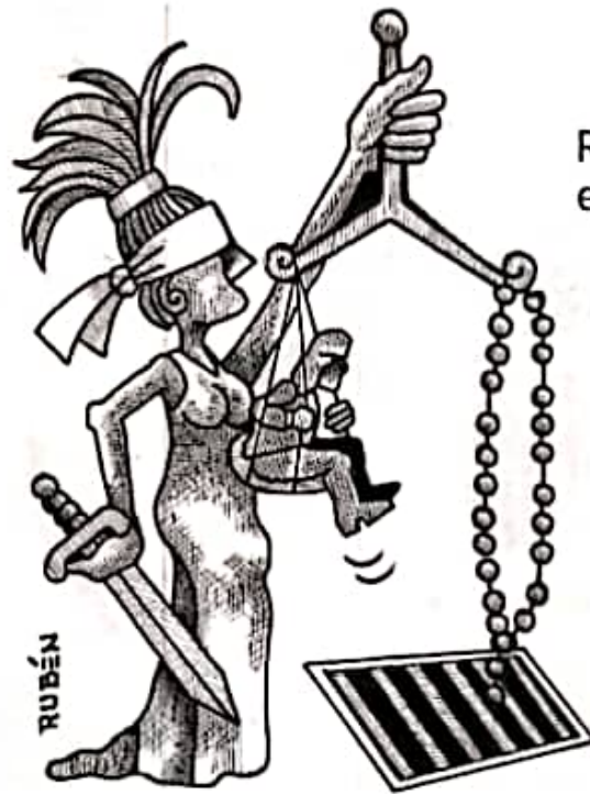
Rosario en la reja