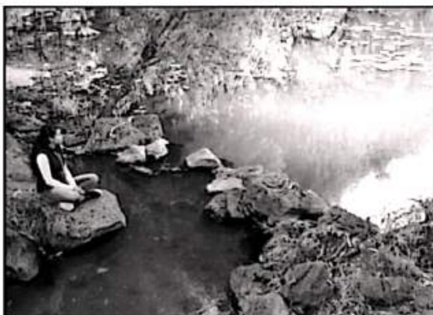
EL MANANTIAL SE HA VENIDO DEGRADANDO POR LA INVASIÓN DE FRACCIONADORAS EN LAS ZONAS ALEDANAS

meses, en marzo y abril, sus niveles estaban en mínimos históricos, y por ello el Organismo Operador de Agua Potable Alcantarillado y Saneamiento de Morelia (OOSMAPAS) tuvo que también el servicio e intentar satisfacer la demanda de la ciudadanía mediante pipas", dijo.