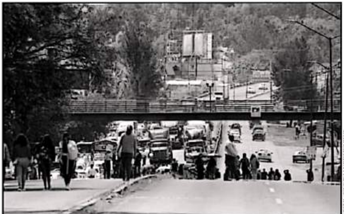
REGRESARON LAS ACCIONES DE PRESIÓN DE EGRESADOS NORMALISTAS, ANTE LO QUE CONSIDERAN COMO UN COMPORTAMIENTO INSENSIBLE DESDE LA SEE.

bleto de los nombramientos no era válido ya que el nuevo gobierno ya lleva 20 días en el ejercicio de sus funciones, sin embargo, no se ha resuelto el tema o al menos darle seguimiento.