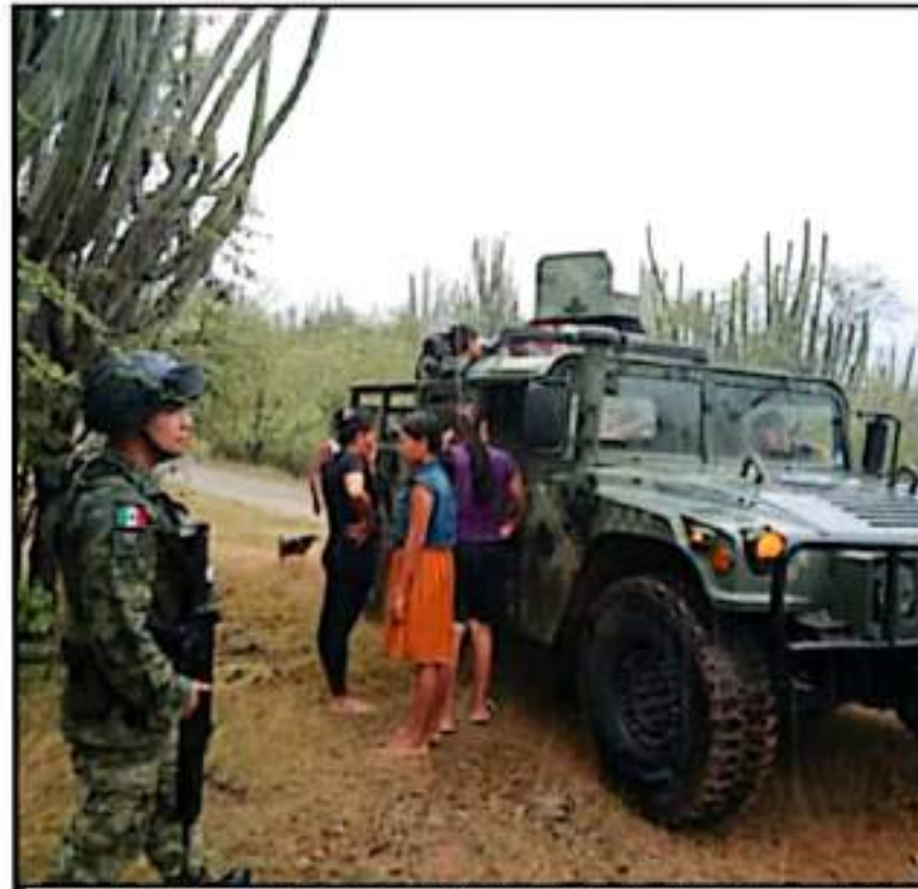
LOS PUNTOS INCOMUNICADOS EN LAS DISTINTAS REGIONES SIGUEN COMPLICANDO LA CUANTIFICACIÓN DE LOS DAÑOS