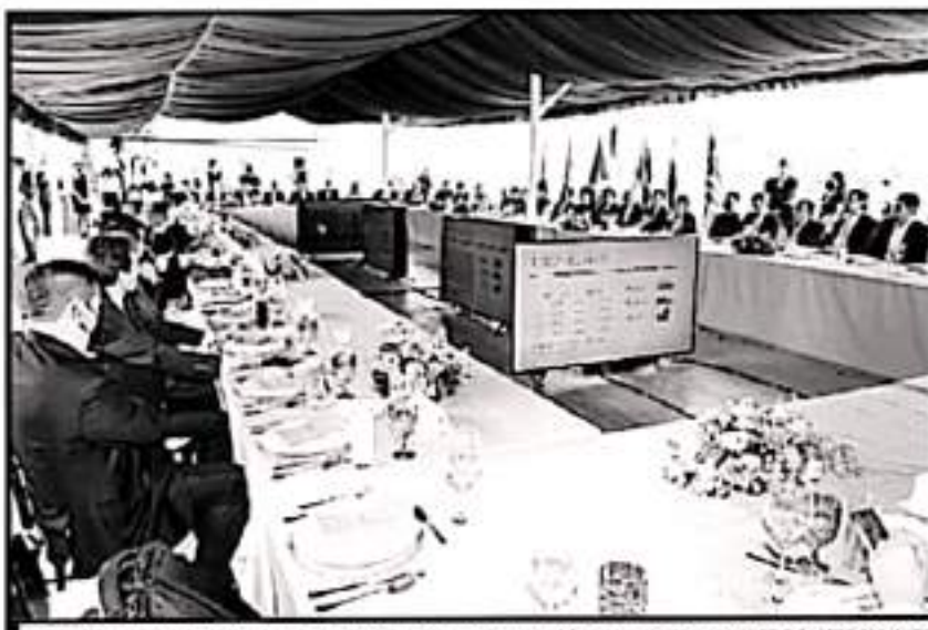
DESTACAN DEL INTERCAMBIO COMERCIAL ENTRE ASEAN Y MÉXICO PUNTO DE 28 MIL MILLONES DE DÓLARES ANUALES

colaborar en las áreas que ustedes tengan en sus países en productos a desarrollar, materias primas, tenemos con qué hacer un gran equipo", agregó.