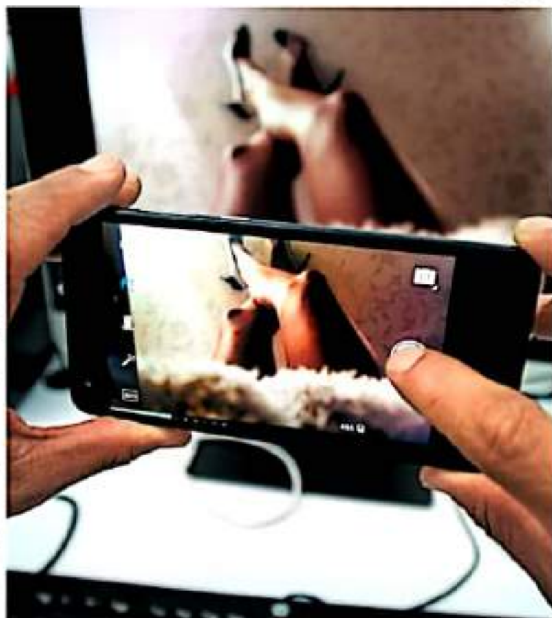
La Cámara de Diputados aprobó una legislación contra el acoso digital.

"La difusión de imágenes íntimas sin consentimiento es una de las formas de violencia de género digital más comunes en el país, es un acto de objetualización sexual a través de las tecnologías que atenta contra la vida íntima, la sexualidad