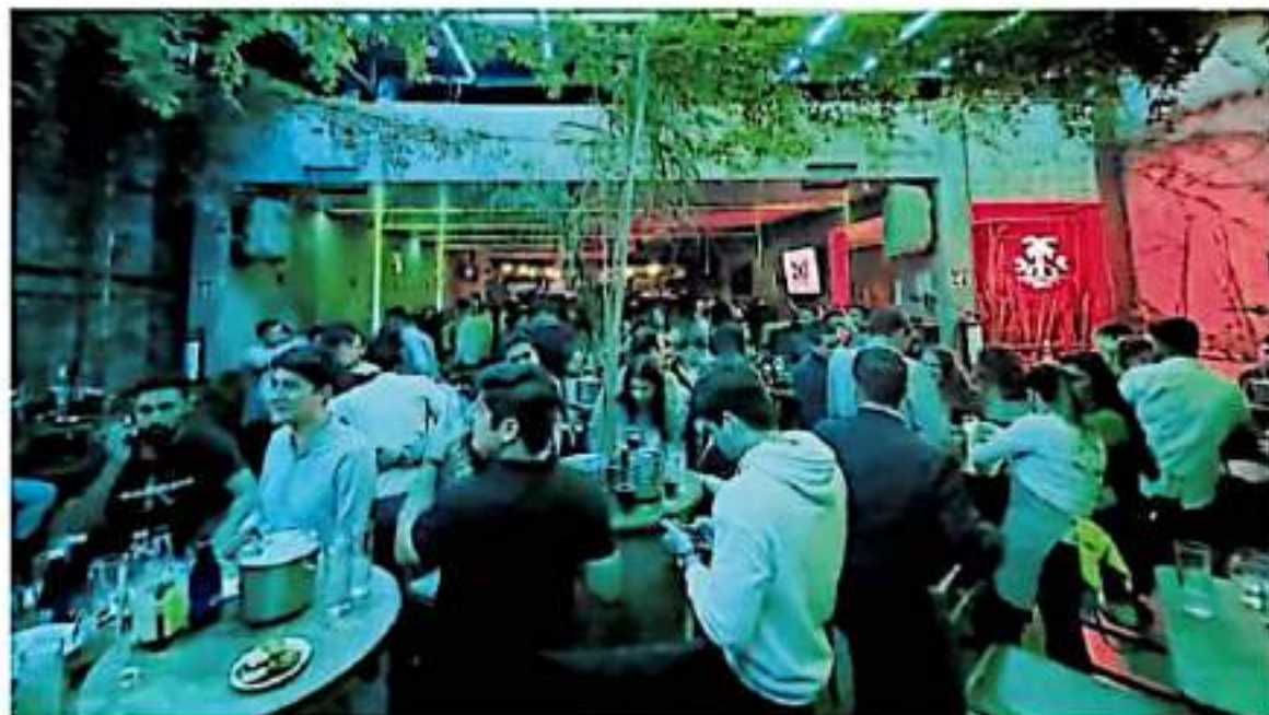
Vecinos piden la revisión de los expedientes de los locales a los que se les dio el permiso, pues aseguran que las anuencias vecinales tienen irregularidades.

El 92% de los recursos que recauda el gobierno del estado es aportado por los empresarios michoacanos, dio a conocer el presidente de la Asociación Nacional de Especialistas Fiscales, Javier Elliot Olmedo Castilla. Pág. 8