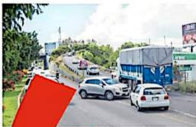
El bloqueo generó caos vial en La Huerta

Hoy es de la semana pasada, los egresados se manifestaron en la avenida Servo de la Nación cerca de la Secretaría de Educación del Estado (SEEF), donde utili-