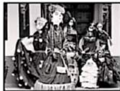
VERBANTES DISFRUTAN DE LOS EVENTOS CULTURALES