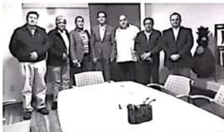
Los principales proyectos son la rehabilitación de la Central de Abastos, posicionar al municipio como la nueva ruta económica, entre otros planes expuestos por el edil zitacuareño.

-Sostiene reunión director de la dependencia municipal con el titular de la Secretaría de Desarrollo Económico en el Estado.