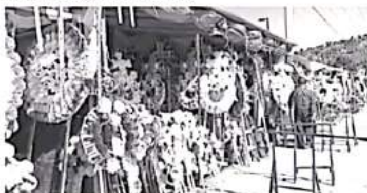
Aunque los insumos han subido un poco, ellos dan buenos precios, hay de todos los tamaños, por ejemplo la corona más grande no pasa de 400 pesos.

Agregó que desde hace varios años la actividad ya no deja buenos ingresos, esto se debe a que hay mucha competencia. "Antes era diferente solo los coroneros las vendían, ahora donde hay poca venden coronas, donde hay plásticos venden coronas y todos tratan de meter estos productos en esta temporada", dijo.