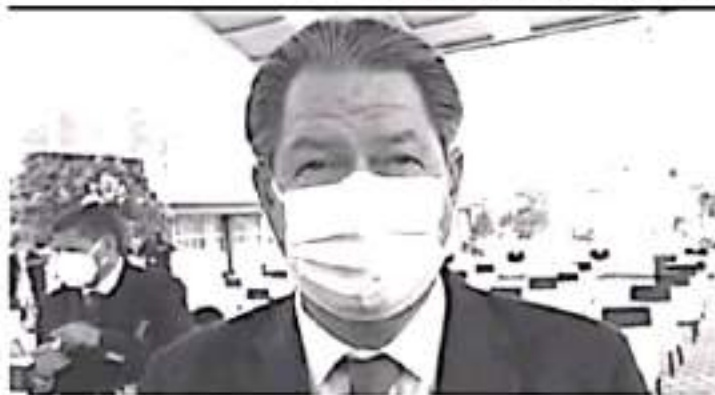
En los casos específicos de preescolar, primaria y secundaria, la situación que ha motivado más el no regreso a clases presenciales, ha sido la falta de pago de maestros estatales.

Añadió que en estos días se captará la información de todos los centros educativos, sobre la forma en que trabajan y modalidad, esta será enviada a la Ciudad de Morelia para que se establezcan las acciones a seguir y que aumente el regreso a clases presenciales.