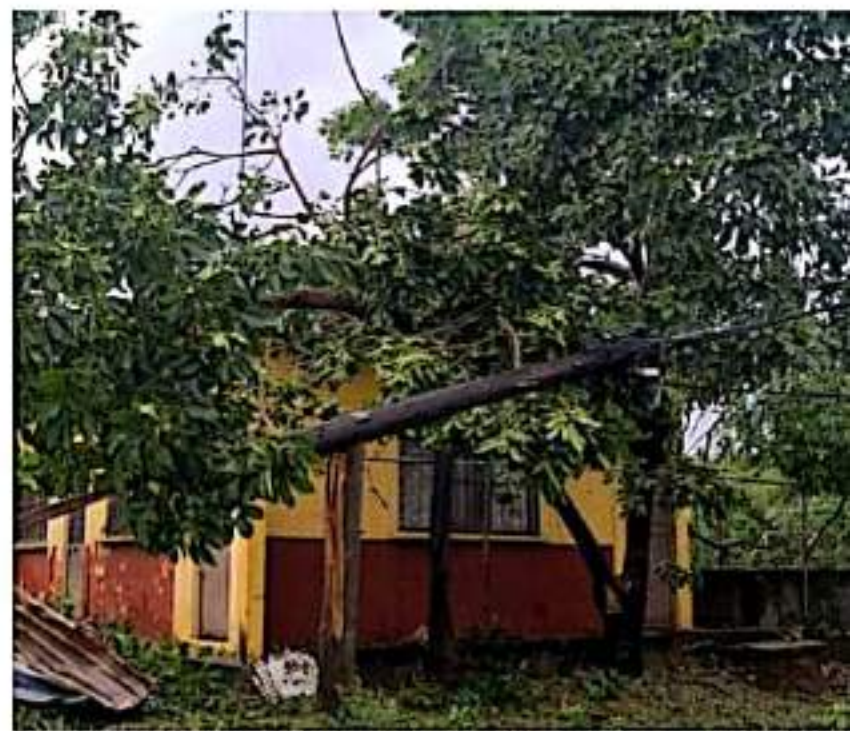
CD. LÁZARO CÁRDENAS, MICH.- De acuerdo al reporte emitido por la Comisión Federal de Electricidad, quedó restablecido el suministro al 98% de los usuarios afectados.

La CFE, a través del Sistema Nacional de Protección Civil, se mantiene en estrecha coordinación con la Secretaría de la Defensa Nacional, la Secretaría de Marina, Comisión Nacional del Agua, Secretaría de Salud, gobiernos estatales y municipales, para la atención de esta contingencia.