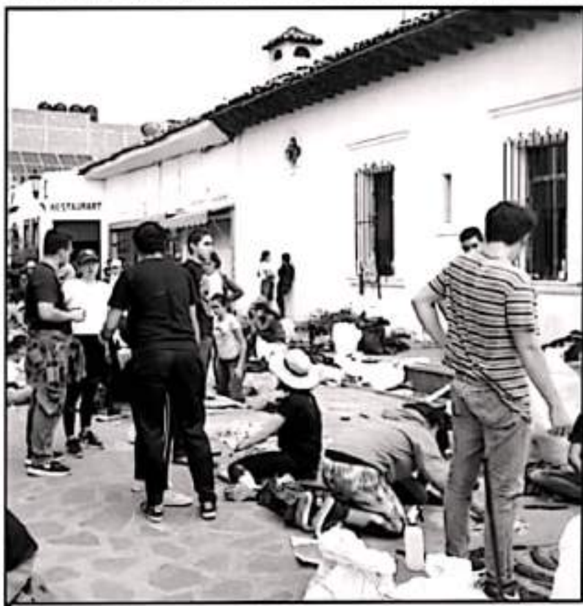
EN CERCANÍAS LOS COMERCIOS SE HAN ESTADO PREPARANDO PARA EL AFLUJO DE TURISTAS POR EL DÍA DE MUERTOS

En lo que hace a la entidad, de acuerdo con datos el Banco de México (Banxico) durante el primer semestre de este año Michoacán se colocó como la segunda entidad con mayor captación de remesas ya que al mes de junio de este año se habían recibido 2 mil 317.9 millones de dólares por este concepto lo que indica un crecimiento en