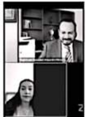
EL TRIBUNAL ELECTORAL DE MICHOACÁN SESIONÓ DE FIRMA VIRTUAL

Paralelamente, el coordinador rechazó que las negociaciones con Morena hayan sido una aventura amorosa a espaldas del PAN y PRD. "La alianza es una hermandad firme y sólida", aseveró