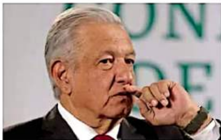
¿Amenaza? Ante la resolución de la SCJN, el presidente López Obrador dijo que todavía es tiempo para que se reforme el Poder Judicial.

Sin embargo en México, dijo, “desde hace mucho tiempo hemos abusado de la prisión preventiva, muchas veces se detiene para investigar y esto ha afectado sobre todo a miles de personas po-