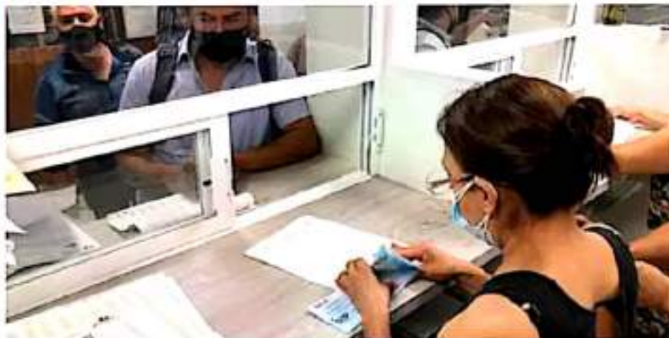
Finanzas. La tarde de este martes iniciaron los pagos a los docentes estatales.

"Hoy martes pagaremos la primera quincena atrasada, que es la número 15, mañana miércoles otra y el jueves, fi-