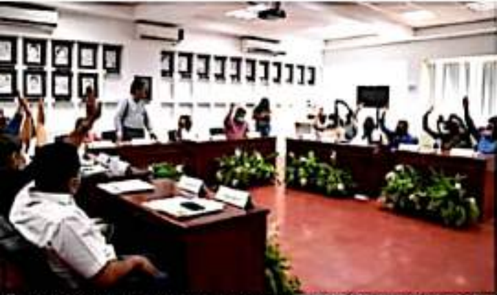
CD. LÁZARO CÁRDENAS, MICH.- En sesión ordinaria de Cabildo, se aprobó iniciar los trámites para la recuperación de áreas verdes en la tenencia de Playa Azul.

■ A petición de los habitantes y dueño de los predios