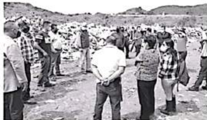
El proyecto de Taño Istálhuac es edificar un renovado centro de captación de desechos, que cuente con estándares de sanidad, vanguardia, tecnología y destino apropiado de la basura.

A nivel local participarán 10 empresas, las cuales van a ofertar aproximadamente 60 vacantes de distintos niveles operarios. Van desde gerente hasta empleado de piso o mostrador.