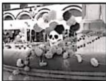
LA REGIÓN COMENZÓ A VESTIRSE DE FLORES Y ADORNOS

Datos del primer semestre del 2021 de la Dirección Municipal de Atención al Migrante establecen que mensualmente en este municipio se reciben remesas por el orden de los 20 millones de pesos, cifra equivalente a los 20 millones de pesos que entrega el Gobierno Federal en la misma localidad de manera bimestral por los programas federales de apoyo