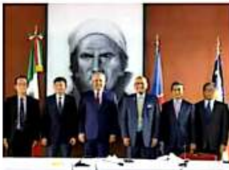
Trabajo. El gobernador se reunió con embajadores de Vietnam, Indonesia, Tailandia, Malasia, Filipinas.

Alfredo Ramírez enfatizó que el puerto de Lazaro Cárdenas puede potenciar aun más el valor del intercambio comercial, ya que representa el ingreso al mercado norteamericano, y del sur de América, además de que es un recurso portuario con una reserva territorial de 2 mil 600 hectáreas, por lo que es el que tiene mayor capacidad de crecer.