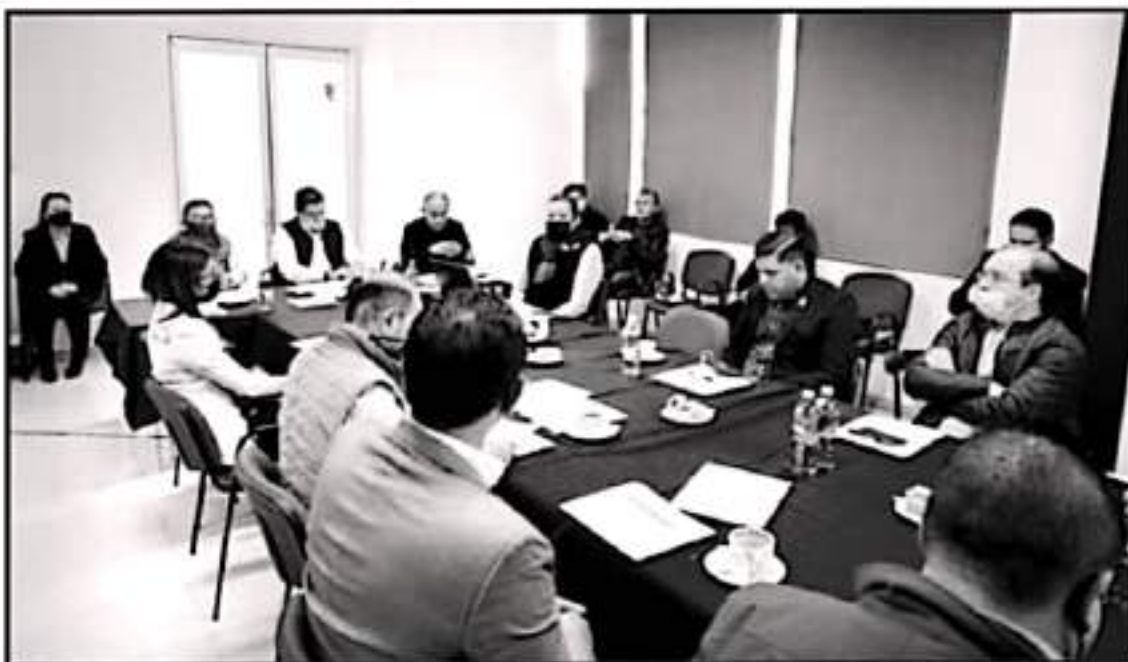
DURANTE LA SESIÓN SE PRESENTÓ EL MONTO O DÉFICIT QUE REPRESENTAN LAS MULTAS, RECARGOS Y OTRAS SANCIONES POR PARTE DE LOS MOROSOS.

Se modificarán los criterios para otorgar descuentos en tarifas a grupos vulnerables a partir del 2022