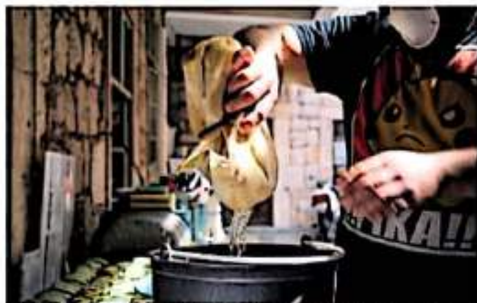
El evento es cien por ciento familiar con entrada gratuita

El evento es cien por ciento familiar con entrada gratuita, habrá presentación de una banda originaria del municipio, puestas en escena alusivas al Día de Muertos, presentaciones de canto, teatro de petate, ballet folklórico, concurso de