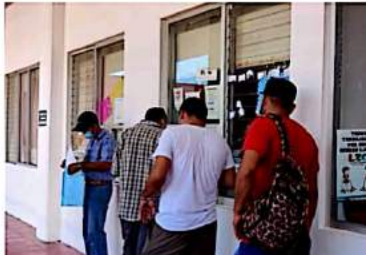
CD. LÁZARO CÁRDENAS, MICH.- El Órgano de Gobierno aprobó por unanimidad que el último día para el registro de candidatos a jefes de tenencia y encargados del orden sea el 28 de octubre.

Para mayor información sobre la Convocatoria, consultar en la página oficial del H. Ayuntamiento de Lázaro Cárdenas, www.lazaro-cardenas.gob.mx .