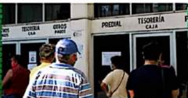
CD. LÁZARO CÁRDENAS, MICH.- El Órgano de Gobierno aprobó la aplicación del 100 por ciento de descuento de multas y recargos en el pago del impuesto predial para personas físicas.

Es importante señalar que durante la aplicación del descuento, y ante la afluencia de contribuyentes que se espera en esta campaña, el Departamento de Catastro estará respetando las medidas sanitarias para salvaguardar la salud y bienestar de las personas, por lo que se pide asistir con cubrebocas, usar gel antibacterial y mantener la sana distancia.