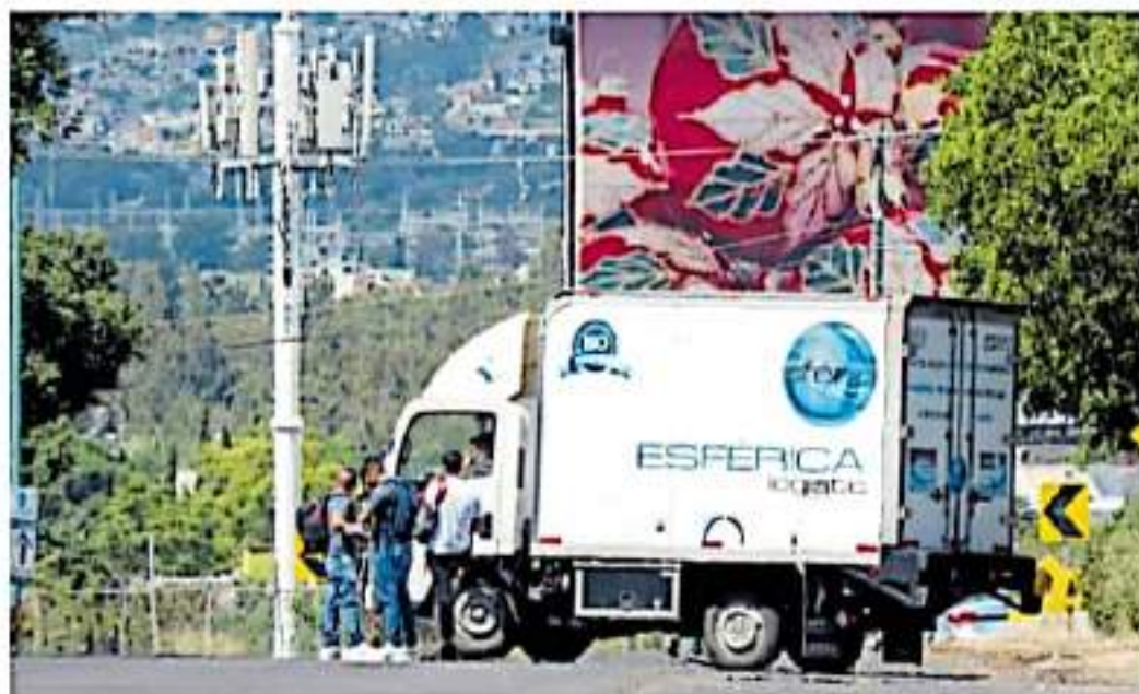
Retuvieron camiones en las vialidades de la zona sur

EXIGEN PLAZAS AUTOMÁTICAS Y PAGO DE BECAS