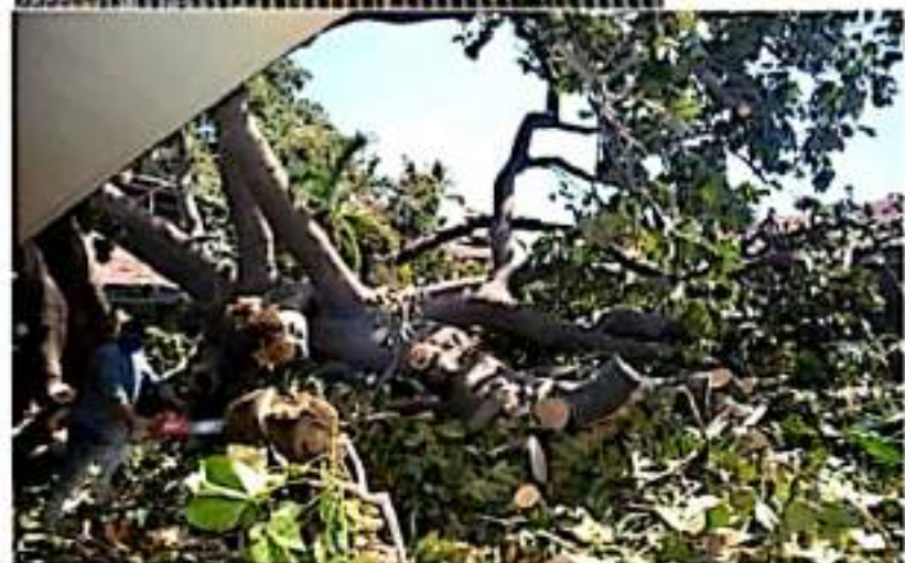
CD. LÁZARO CÁRDENAS, MICH.- El árbol al interior del hospital general, que se trozó por el impacto de los vientos, este es una especie única que no se puede apreciar en la región y quizá ni en el país, se estima que lo trajeron de Cuba hace más de 50 años.