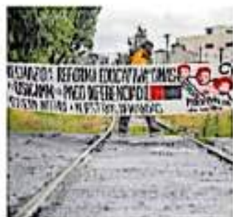
Bloqueo de las vías del tren en Tres Puertos

Mencionó que las pérdidas ya superan los 3 mil millones de pesos, además de la importante fuga de inversiones que hay en el estado.