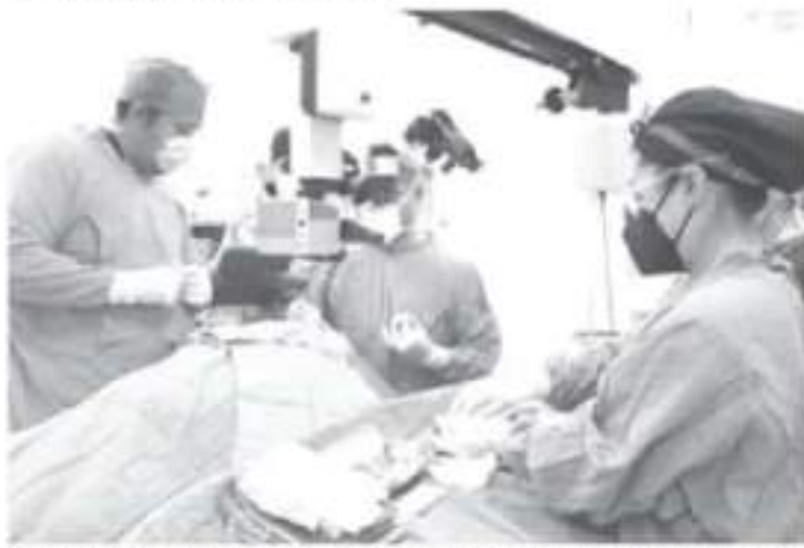
Desde las ocho de la mañana y hasta pasado el mediodía, un equipo médico quirúrgico encabezado por el cirujano oftalmólogo responsable del trasplante de córnea, efectuaron con éxito estos procedimientos.

-El Instituto Mexicano del Seguro Social (IMSS) en Michoacán, realizó trasplantes de córnea exitosos, con lo que se devolvió la vista a personas.