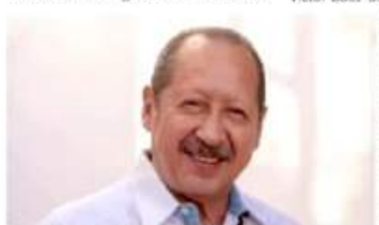
MORELIA, MICH. - El ex gobernador Leonel Godoy Rangel busca imponer al perfil que sustituya al candidato a la gubernatura.

Esta imposición se convalida sin tomar en cuenta, otra vez, el sentir de la militancia de Morena registrada en las encuestas.