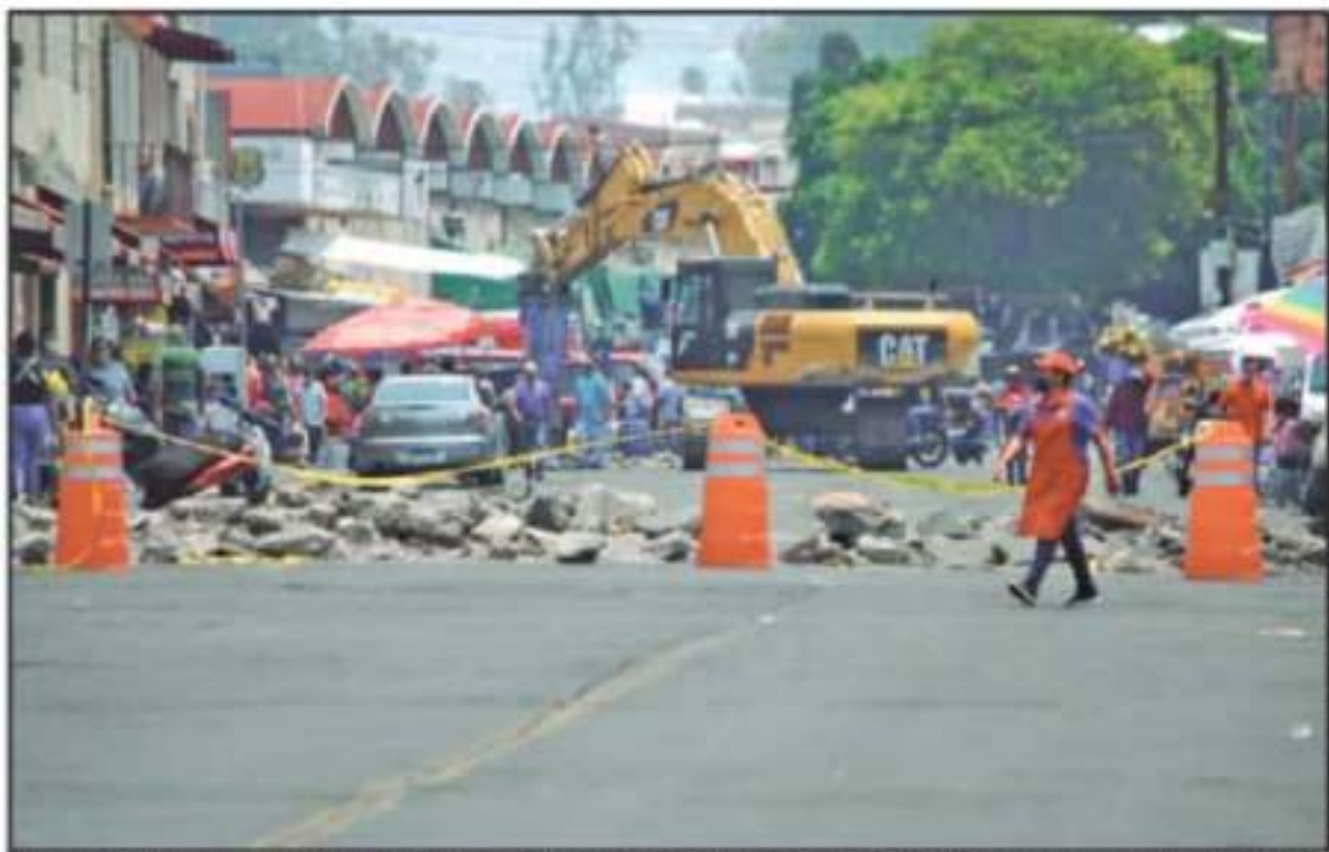
AL INICIO LOS TRANSPORTISTAS YA TENÍAN VIALIDAD ALTERNAS, SEGUEN BLOQUEANDO LA OBRA EN LA AVENIDA LÁZARO CÁRDENAS EN PROTESTA POR LA REMODELACIÓN

"Sobre todo las calles de Vicente Santa María y Lago de Patcuaro serán intervenidas para que funcionen en doble sentido mientras la obra esté trabajando, esto para ayudar a desfogar el transporte público los camiones que son de mayor tamaño y así estaremos ha-