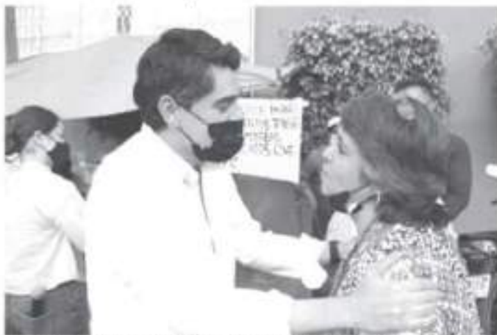
Que el Gobierno Municipal entienda que desde la secretaría más modesta hasta su servidor debemos atenderlos como ustedes se merecen.