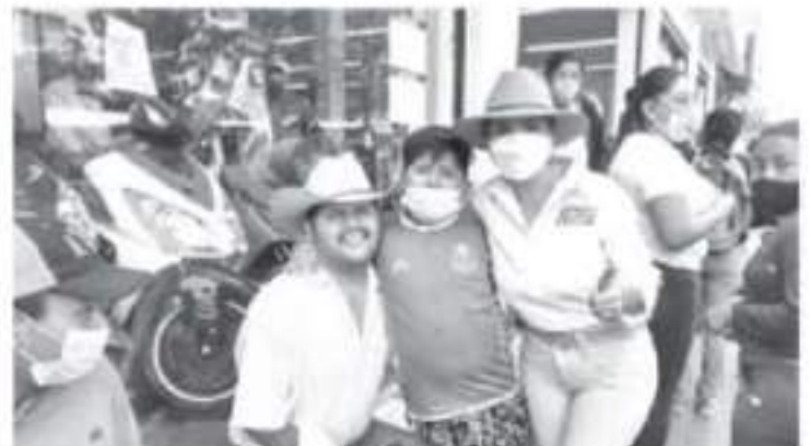
La Contadora Salinas sigue transmitiendo la esperanza de que un mejor futuro para todos los zitacuareños es posible.