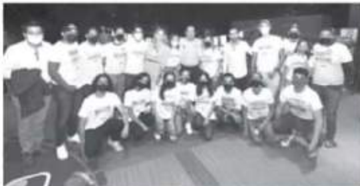
"Habrá trabajo para todos y todas las emprendedoras, con la participación de una barra completa de empresarios que fundearán proyectos".

-El candidato del Equipo por Michoacán dialoga con jóvenes emprendedores.