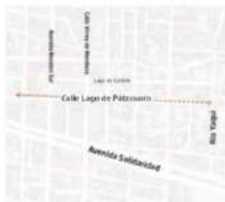
Lago de Patzcuaro es una alternativa para desahogar el tráfico vehicular