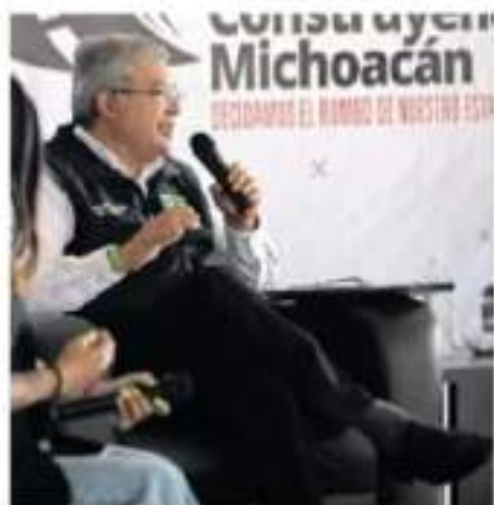
El candidato aseguró que las obras serán para constructores del estado

Su proyecto de gobierno, también busca atender el tema que más reclama la población la seguridad, concluyó que esta, se encuentra relacionada a la economía, salud y medio ambiente, y es necesaria para reconstruir el bienestar del estado.