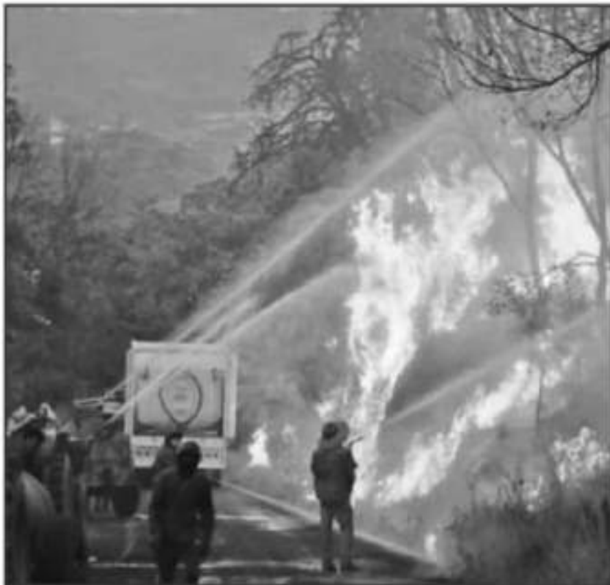
ESTA SEMANA INICIA EL EJERCICIO DE RESTAURACIÓN FORESTAL, CON EL FIN DE EVITAR EL CAMBIO DE USO DE SUELO.

Luego de la sesión del Comité Estatal del Manejo del Fuego celebrada el día de ayer martes por la tarde, las autoridades locales acordaron que, con base a las cifras oficiales, en que más del 80 por ciento de los incendios es provocado, se debe ir más allá de las simples medidas administrativas y legales que se han acordado