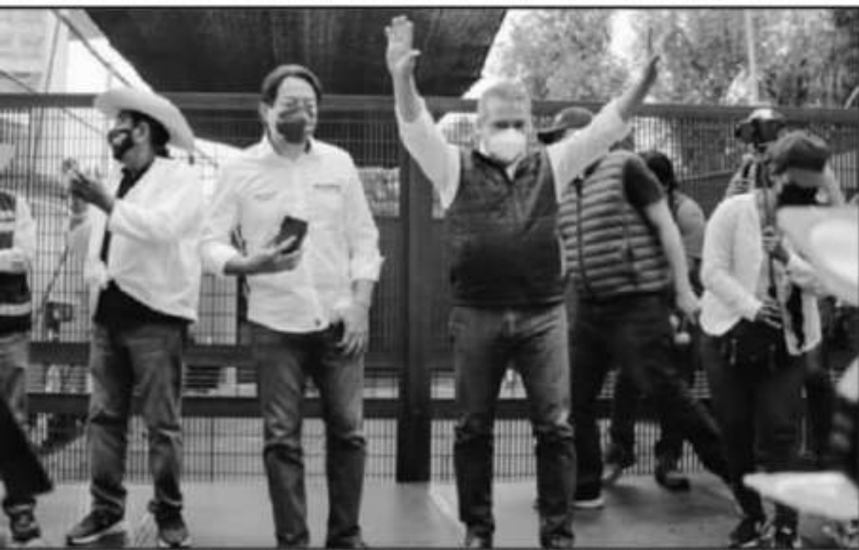
LISTAS DE AÑO: AHORA MORENA TIENE QUE BUSCAR NUEVOS ASPIRANTES PARA SUSTITUIR A AMBOS CANDIDATOS PARA LAS GUBERNATURAS