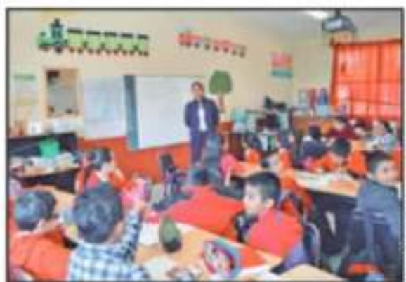
EL SNTE BUSCA QUE LAS PENSIONES SEAN MÁS JUSTAS PARA LOS MAESTROS Y QUE SU INGRESO AL MOMENTO DE RETIRARSE SEA MUCHO MÁS JUSTO.

"Que en todas las escuelas tengan los servicios necesarios para atender a sus alumnos, buses de transporte para aquellos que tengan que trasladarse a la secundaria, preparatoria o a la universidad, vamos a continuar con el servicio gratuito de transporte a Morelia para todos nuestros alumnos que se están preparando allí", destacó Herrera, tras ofrecer mejorar espacios públicos.