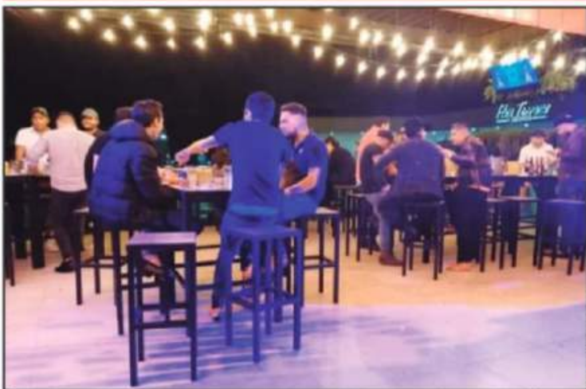
LOS BARES, ENTRE LOS NEGOCIOS QUE TENDRÁN BENEFICIOS COMO AMPLIACIÓN EN SU HORARIO DE SERVICIO, PERO TAMBIÉN DEBEN SEGUIR CON MEDIDAS DE SALUD.