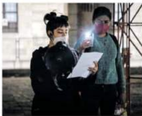
Feministas de Michoacán dieron a conocer su postura a través de un comunicado por escrito.

El domingo 25 de abril, el analista Reysal Solís se posicionó contra la reinstalación de la Antimonumenta al pie de Las Tarascas y denunció la falta por los derechos de las mujeres señalando entre otras cosas que ellas "ya tienen más que los hombres". Todo esto dirigido a personas feministas que dedicamos esta escultu-