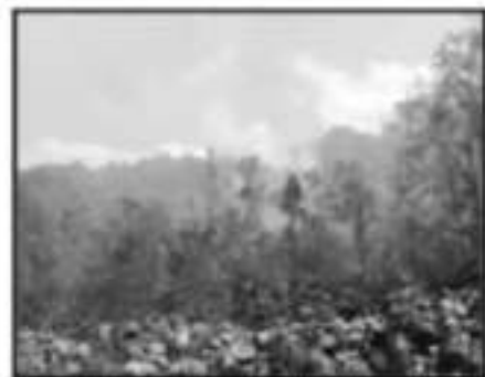
DOS BRIGADAS DE GUARDABOSQUES HAN PROTEGIDO EL PARQUE NACIONAL "BARRANCA DEL CUPATITZÁN".

los bosques como parte de un avance hacia una mejor cultura de protección a los recursos naturales o bien son menos las masas forestales que existen y se atienden de manera inme-