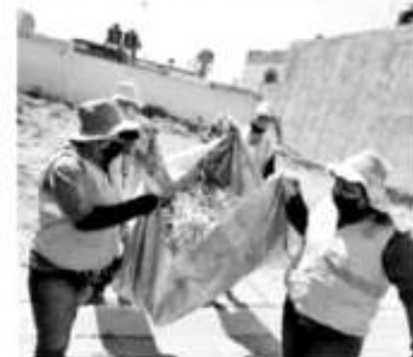
ZAMORA, MICH.- La estadística de contagios de dengue confirmados fue aproximada a 15 mil 926 casos.

No existe actualmente una cura para el dengue o la fiebre hemorrágica del dengue.