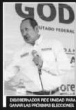
EXGOBERNADOR PDE ENCADA PARA GANAR LAS PRÓXIMAS ELECCIONES

cia de “respetar las leyes y cumplir los reglas que permiten que exista la democracia en este país”. Y remató diciendo que su campaña es de propuestas, de soluciones y sigue su rumbo, “sumando cada vez más con una clara tendencia ganadora”. Esto último respecto a que, en los últimos días, cuadros de Morena y los comités que dicen representar se han venido sumando a su campaña.