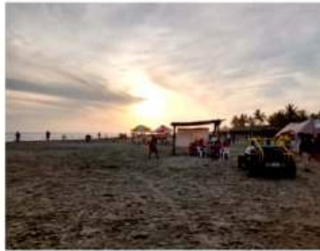
CO. LAZARO CÁRDENAS, MICH.- El centro turístico de Playa Azul, es punto con mayor incidencia en casos positivos de Coronavirus.