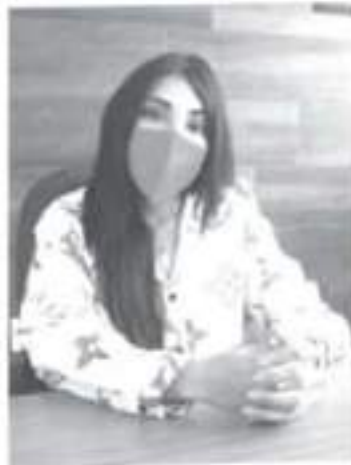
Por el peligro del aumento de casos de Covid 19 durante esta última semana de abril, este retorno queda pendiente, no será posible.

Si ocurre un repunte considerable en estas fechas, esto también podría suspenderse, no se instalarán y tendrán que buscar otra forma de vender sus productos.