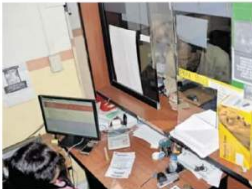
La finalidad es certificar su simplificación y modernización

La entidad fue reconocida por ser la que más ha avanzado en Materia Regulatoria, al contar con un avance notable. Ocupaba el lugar 30 en 2019 y ahora es el 1 en este último reporte