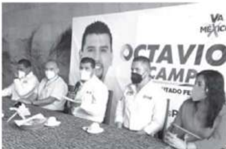
El candidato fue a conocer una de las iniciativas a presentar en San Lázaro, que será una reforma a la Ley General para la Atención y Protección a Personas con la Condición del Espectro Autista.

-Se debe garantizar el acceso a los derechos a la salud y a la educación para personas con la condición de Trastorno del Espectro Autista (TEA).