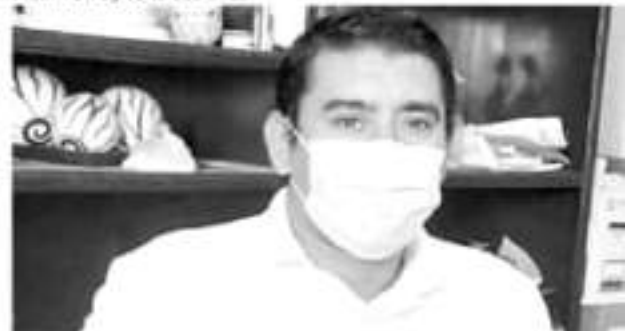
JACONA, MICH.- Es trascendental que la ciudadanía no baje la guardia y siga acatando todas las recomendaciones al pie de la letra.

Refirió que con todo y que los fallecimientos por la enfermedad antes mencionada van en descenso, es trascendental que la ciudadanía no baje la guardia y siga acatando todas las recomendaciones al pie de la letra. Señaló que es importante que se siga cuidando y tomando las medidas necesarias, con la finalidad de evitar una nueva ola de contagios y decesos, todo ello con todo y la vacunación. Advirtió que debido a que persiste el riesgo, en el Registro Civil no se ha bajado la guardia y enfatizó que se sigue aplicando todos los protocolos requeridos. Dijo que entre ellos es evitar el ingreso de una considerable cantidad de personas en la oficina, para evitar la aglomeración, además de que a los ciudadanos que se les atiende siempre utilizando el cubre bocas. Explicó que con lo anterior se contribuye a romper la cadena de contagios del Covid-19 que gradualmente se va logrando, sin embargo, remarco que es necesario que la población siga con los cuidados correspondientes. Sobre los servicios, detalló que se ofrecen registro de nacimientos, defunciones, así como la expedición de actas de matrimonio y certificaciones.