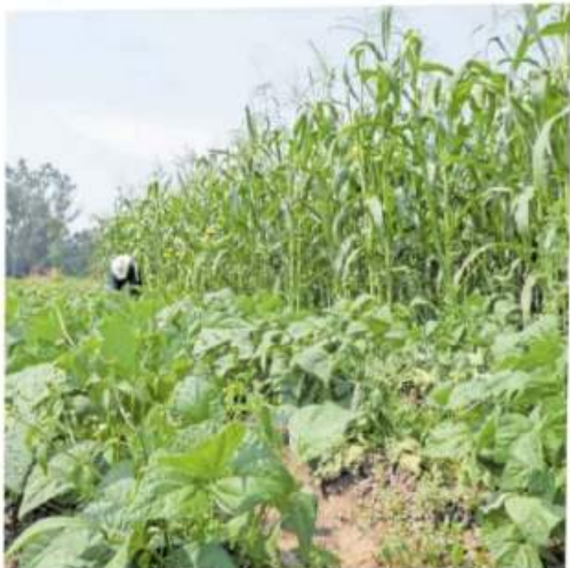
Michoacán ocupa también el sexto lugar de acuerdo a su aportación económica a México

Sin embargo las cifras con las que se cuentan son previas a la pandemia. De 2020 aún no se tiene la estadística detallada, no obstante, se sabe que hubo un decrecimiento muy significativo de 8.2%