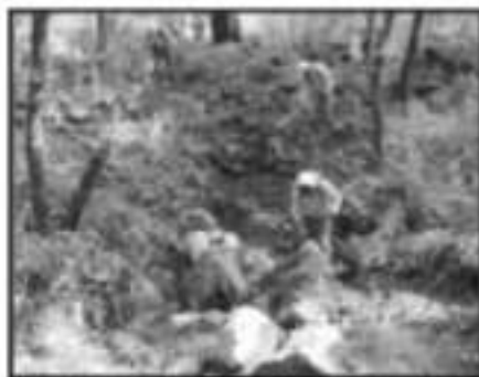
LA MÁS RECIENTE CONFLAGRACIÓN SE REGISTRÓ EN LA ZONA CONOCIDA COMO EL ZAPÍN, EN URUAPAN.