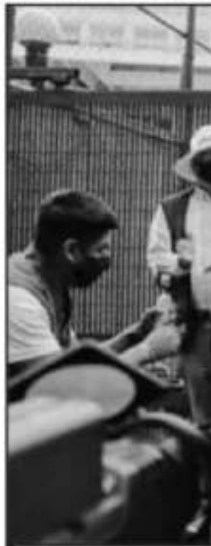
ATRAS QUEDARON LAS SEÑALES TR

soma, cualquier equipo de trabajo que quiera sumarse es bienvenido. Nosotros queremos hacer las cosas bien y cualquiera que quiera hacer equipo con nosotros, creo que nos puede salir mejor”.