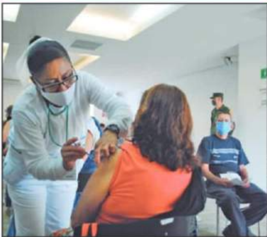
ADULTOS MAYORES QUE NO HAN RECIBIDO LAS DOSIS CONTRA LA COVID-19 DEBERÁN ESPERAR LA ETAPA FINAL DEL

Cuestionada sobre cuál será el procedimiento a seguir en el municipio, afirmó que "El esquema que se va a seguir con el personal docente tiene que ver con la estrategia nacional y lo que nos marca la Secretaría del Bienestar. Es importante mencionar que ya está operando la plataforma "Mi Vacuna" para aquellas personas de 50 a 59 años que ya deseen registrarse para recibir su vacunación".