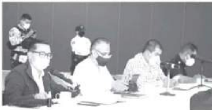
Tras recibir la solicitud de apertura del Parque de la Estación, este seguirá con sus puertas cerradas con la finalidad de evitar brotes de contagio entre los menores de edad.

Finalmente, el comité solicitó que el próximo martes se integre personal del INE y del IEM a la mesa de salud, para que informen sobre las medidas sanitarias que se estén tomando en relación a las campañas políticas, y para que asuman su responsabilidad como órgano regulador en las mismas.