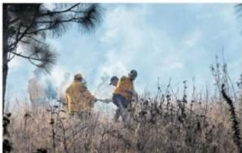
La brigada está conformada por 19 personas

Morelia dar precisamente el apoyo adicional, porque pues para que sea algo más considerable", mencionó el director de Parques y Jardines.