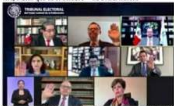
Los 7 magistrados integrantes del TEPJF, de los cuales ayer 5 de ellos votaron por la ratificación impuesta por el INE en contra de Raúl Morón Orozco.

Finalmente, sostuvo que, independientemente de la persona que el partido Morena designe como candidato a la Gubernatura del estado, el proyecto de Carlos Herrera seguirá creciendo en el corazón de las y los michoacanos.