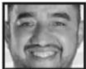
Preocupa. No ha sido sólo un asunto sino un ataque directo contra César Palafox al ocurrir en Los Reyes.

entre controvección la impugnación en tribunales contra su correligionario, el alcalde de Morelia con licencia.