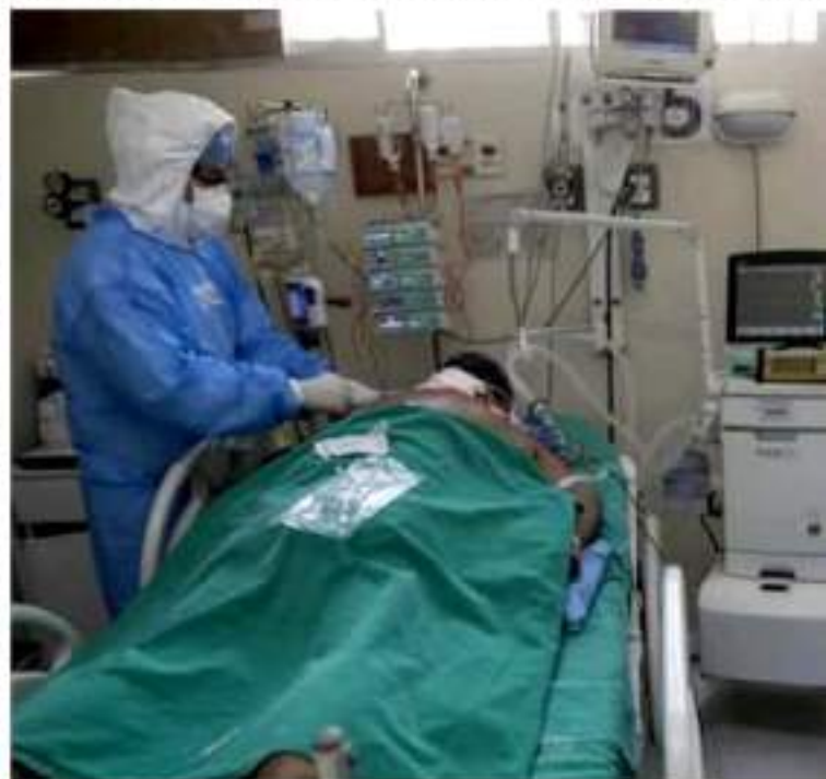
CD. LÁZARO CÁRDENAS, MICH.- El sector salud dio a conocer que Lázaro Cárdenas aporta 6 mil 571 casos positivos de Covid-19.

Eduardo CHÁVEZ CD. LÁZARO CÁRDENAS, MICH.-