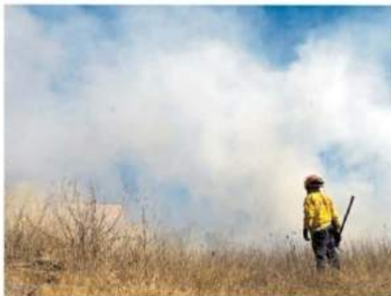
El brigadista con menos experiencia lleva 14 años combatiendo el fuego