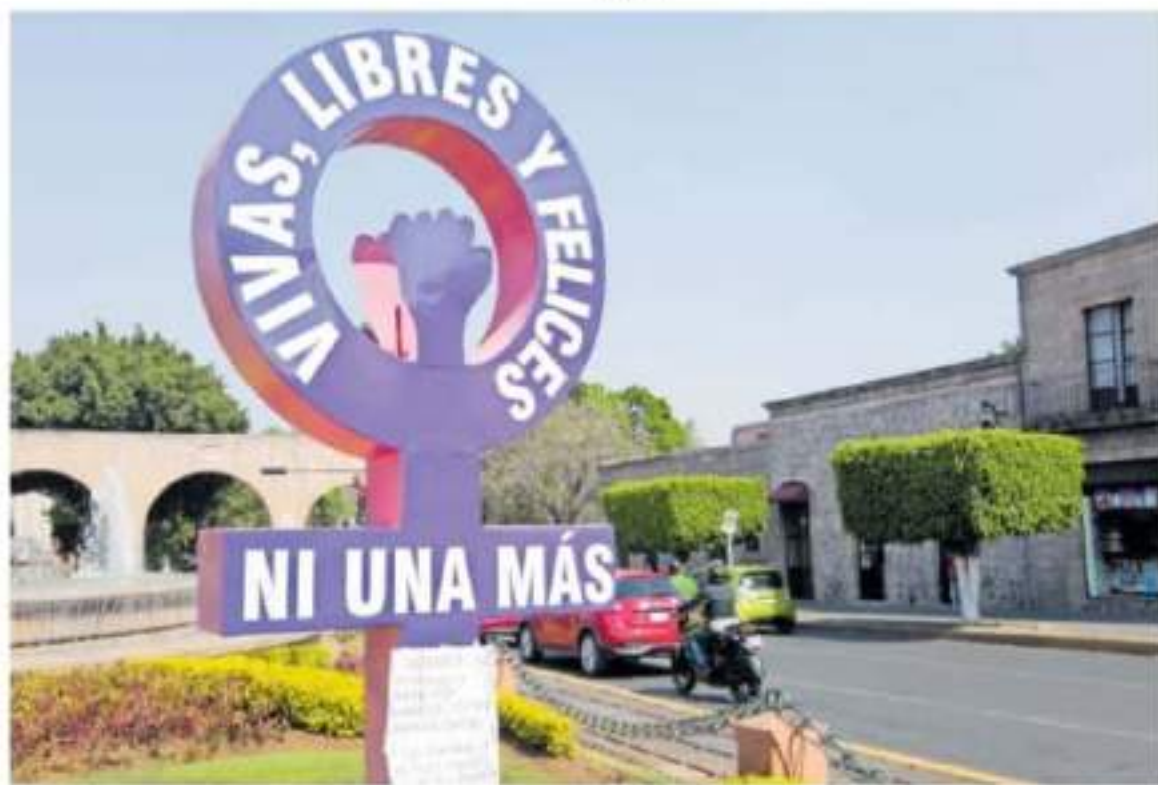
La reinstalación de la Antimonumenta en la Fuente de las Tarascas también fue objeto de crítica. / ROY JIMÉNEZ

FEMINISTAS DE MICHOACÁN Es inadmisible que un medio de comunicación permita y replique esos comentarios en pleno siglo XXI