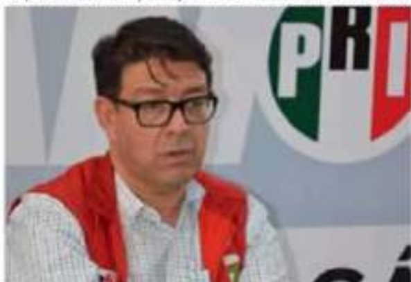
"El respeto y cumplimiento de las leyes es fundamental para el desarrollo de la democracia", señaló el dirigente estatal del PRI.