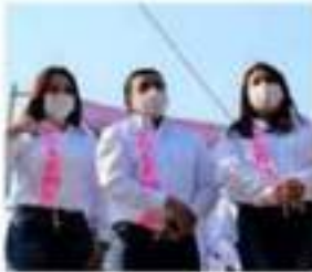
Integrantes de la planilla FxM

Ofreció el candidato a presidente municipal dar prioridad a constructores locales en la ejecución del programa operativo anual de obras, por lo que también pidió que el sector de la construcción se comprometa a emplear a