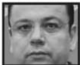
Oportunidad. El senador Germán Martínez Cárdenas, quien, aunque no tiene la fuerza de otros nombres.