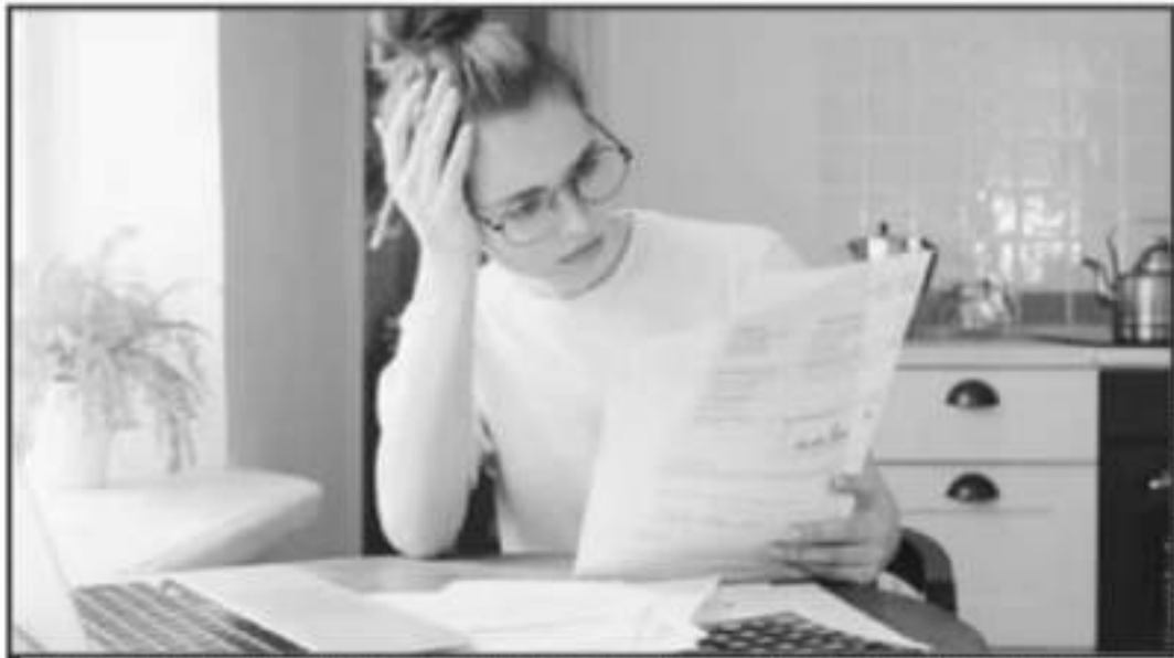
LOS CRÉDITOS MUCHAS VECES REPRESENTAN ABSORBIENDO PARTE DE LOS INGRESOS LABORALES Y NO PUEDEN TENER UN FINAL.

■ FINANZAS ■ ADMINISTRA BIEN TUS INGRESOS