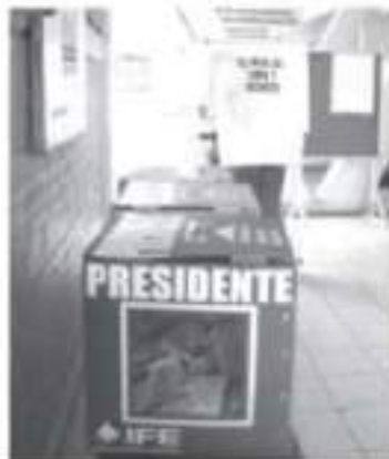
Las comunidades en conflicto son: Crescencio Morales, Francisco Serrato, Chimusá, Carpinteros, El Tigre, Cuarta manzana de Guadalupe, La Barranca, Donaciano Ojeda, donde no se instalarán 17 casillas.

Agregó que la última oportunidad de integrar las mesas directivas de casilla en estos lugares es antes del 10 de mayo, pasada esta fecha, sería imposible por todo el proceso que tienen que pasar las boletas electorales destinadas para cada casilla.