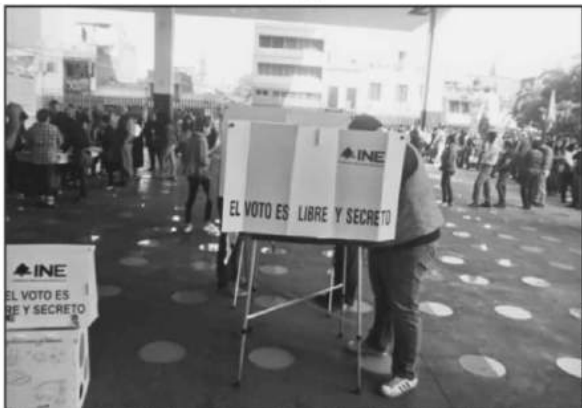
UNA VEZ TERMINADO EL PROCESO ELECTORAL, EL COMITÉ DE PARTICIPACIÓN CIUDADANA RETOMARÁ EL TEMA DE LAS MODIFICACIONES A LAS LEYES LOCALES.