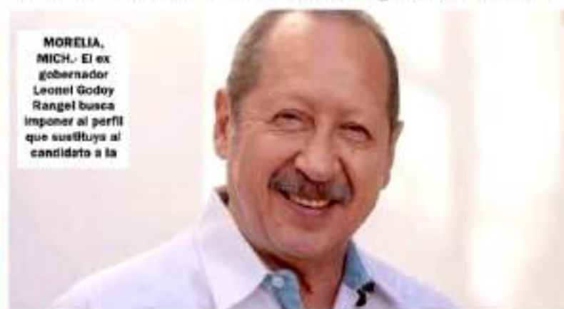
MORELIA, MICH.- El ex gobernador Leonel Godoy Rangel busca imponer al perfil que sustituya al candidato a la

Esta imposición se conjura sin tomar en cuenta, otra vez, el sentir de la militancia de Morena registrada en las encuestas.