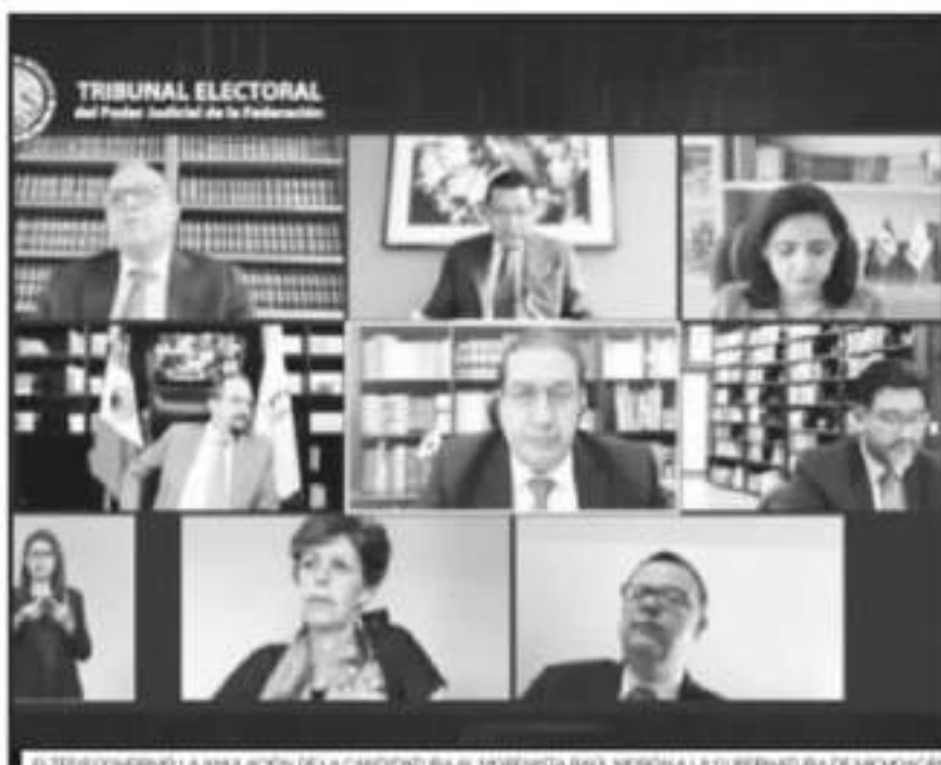
EL TEPJF CONFIRMÓ LA ANULACIÓN DE LA CANDIDATURA AL MORENISTA RAÚL MORÓN A LA GUBERNATURA DE MICHOACÁN

Bajo el argumento de que al no presentar informes de gastos se obstaculiza la facultad fiscalizadora del órgano electoral, examinada a garantizar la