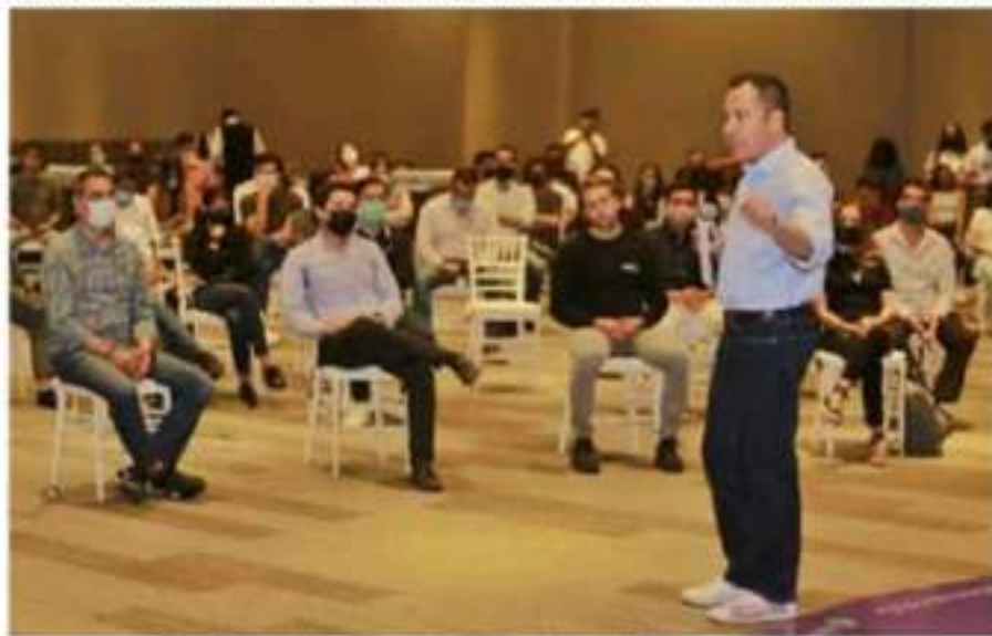
El candidato del Equipo por Michoacán dialoga con jóvenes emprendedores.

El diálogo fue circular y se habló sobre estrategias para atender el feminicidio, el urbanismo, turismo, alianzas estratégicas, desarrollo agrícola, relación con el gobierno federal, proyectos de reinserción social, construcción de paz, vocación forestal, crecimiento regional, sectores sociales olvidados, todo bajo las preguntas de las y los jóvenes en un rango de edad de 18 a 34 años, cuya visión de vida los ha llevado a dejar de la lado la participación política, pero con Herrera Tello se encuentra #LaGeneraciónQueDecide.