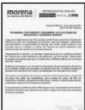
MORENA EXHORTA A CERRAR FILAS