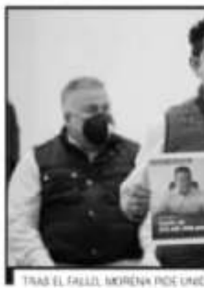
TRAS EL FALLO, MORENA PIDE UNIRSE