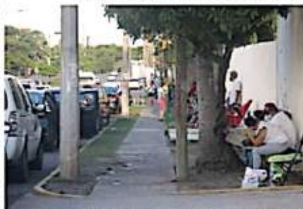
CD. LÁZARO CÁRDENAS, MICH.- Ciudadanos se han empezado a formar en las afueras del Tecnológico, lugar donde se aplican las dosis contra

En los cinco días programados para la jornada, se prevén aplicar cerca de 29 mil vacunas, para posteriormente atender al grupo de rezagados.