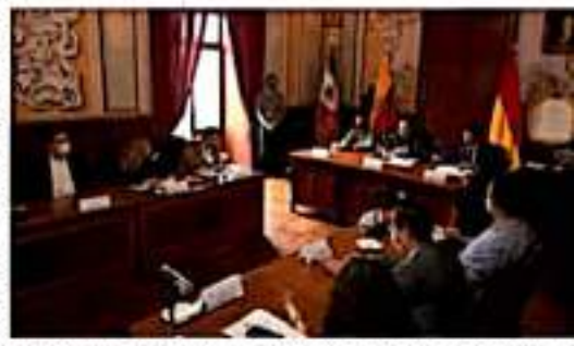
MORELIA, MICH.- Con el aval de los regidores, este martes se completaron expedientes de los acuerdos tomados en el Cabildo de Morelia.

Ante la oposición de al menos trece regidores, se exhortó a aprovechar la disponibilidad con al que se cuenta para el aprovechamiento del terreno, toda vez que existe coordinación con el ayuntamiento, Silvano Aureoles Conejo, según el dicho del propio alcalde de Morelia, Alfonso Martínez Alcázar.