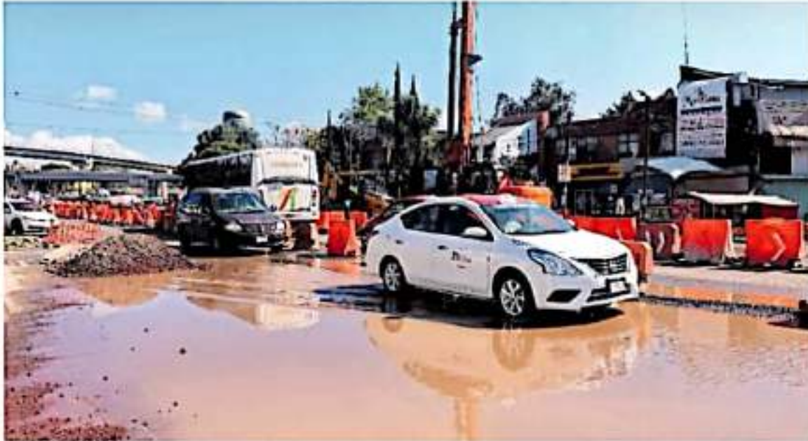
En la zona faltan letreros malos para guiar a los conductores.

Integrantes de las 22 regiones de Michoacán exigen al Presidente de México una reunión para dialogar sobre el adeudo de salarios, prestaciones y bonos devengados. Pág. 6