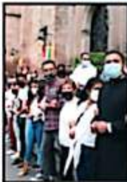
PREVENIA FORMARON CADENA HUMANA PARA EVITAR PINTAS

Tras la tormenta, la calma la multitud se dispersó, a la espera de la siguiente cita para reunirse y recordarle a las autoridades que las están vigilando en esto y otros asuntos sobre los que todavía hay sentados pendientes para las michoacanas.