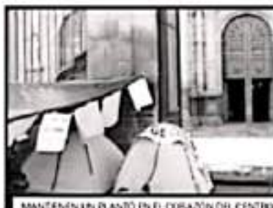
MANTIENEN EN PLÁNTON EN EL CORAZÓN DEL CENTRO