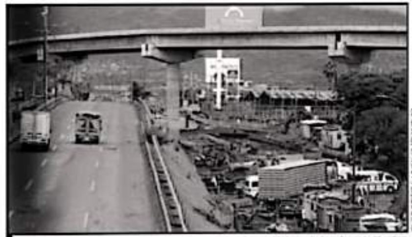
COLONOS ADVIERTEN LENTITUD EN EL DESARROLLO DE LA ESTRUCTURA Y AFECTACIONES ECONÓMICAS Y PELEGRINAS