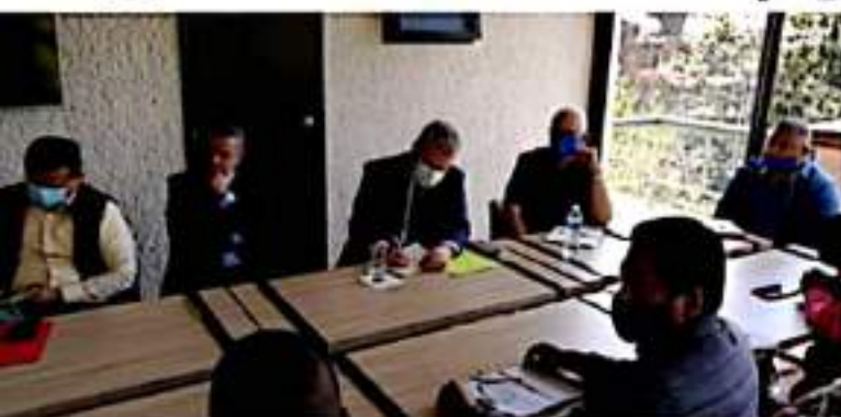
MORELIA, MICH.- Durante la mesa de negociación con el equipo de Alfredo Ramírez Bedolla, gobernador electo.