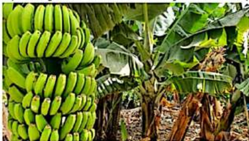
Productores de plátano de Coahuayana, acordaron defender el precio de garantía del producto.

lidad vale más y que por esta ya hay ofrecimientos de comercializadores de pagar a 4 pesos con 50 centavos el kilo libre al productor en caja de madera.