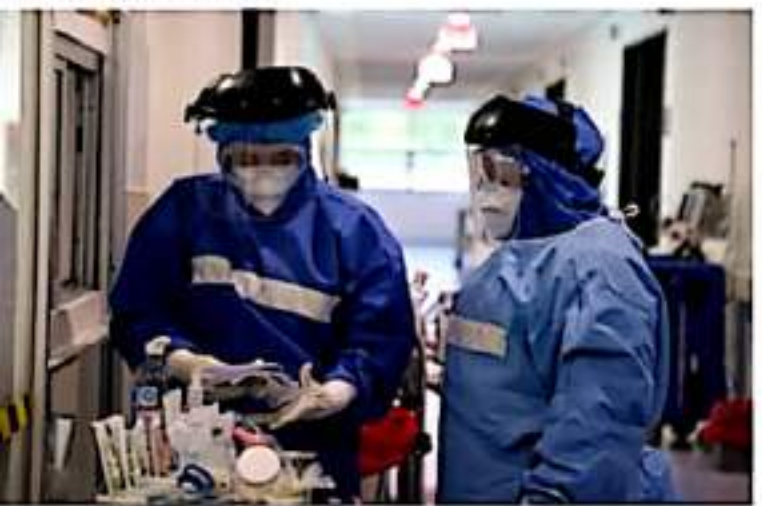
CD. LÁZARO CÁRDENAS, MICH.- Los hospitales del municipio costero, registran una baja en su ocupación hospitalaria de camas Covid-19.

Hasta la fecha, la Jurisdicción Sanitaria de Lázaro Cárdenas registra 14 mil 716 casos confirmados de Covid-19, de los cuales 198 se encuentran activos; así como 398 defunciones por lo que es importante el uso del cubrebocas, mantener sana distancia, lavar y desinfectar manos de manera constante con gel antibacterial y no saludar de beso, mano y abrazo.