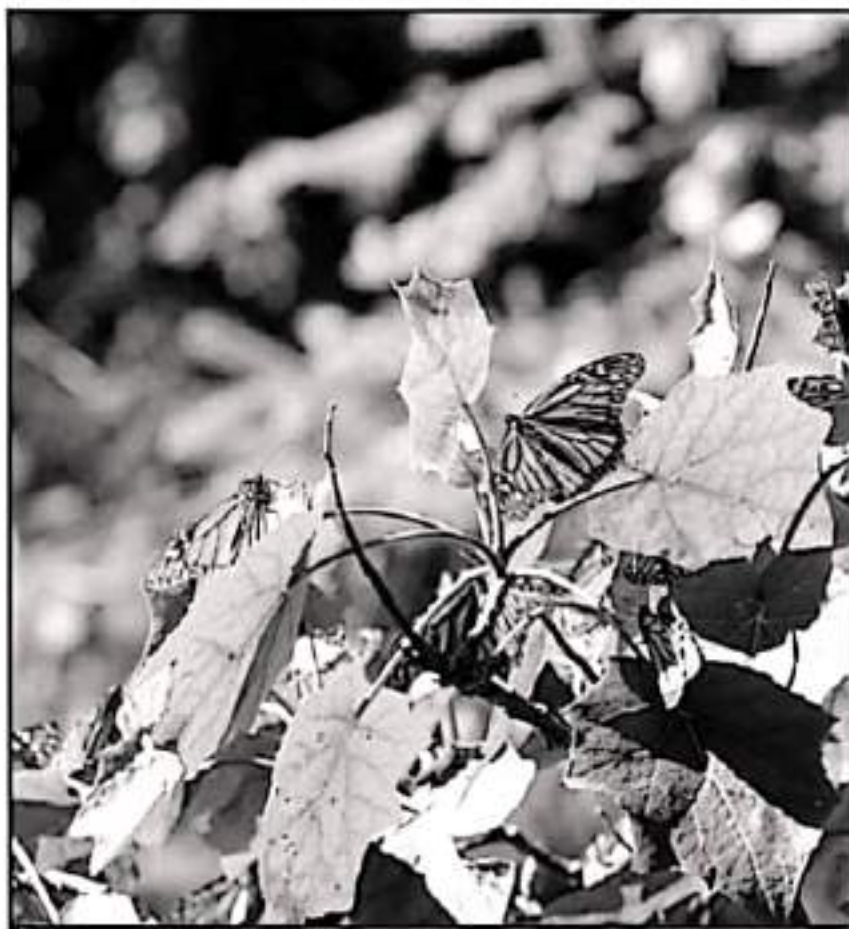
LA LLEGADA DE MÁS MARIPOSAS PARA ESTE 2021 REPRESENTARÍA UN RESPALDO PARA LA ACTIVIDAD TURÍSTICA DEL ESTADO

Mariposa Monarca de Presidencia Mexicana A.C. organización de activistas y especialistas llamaron a la población y regio-