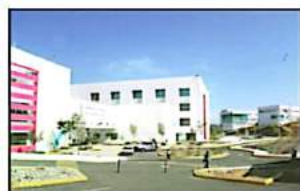
PUDO CONCLUIR ESTE GOBIERNO POR FIN EL COMPLEJO DE CIUDAD SALUD