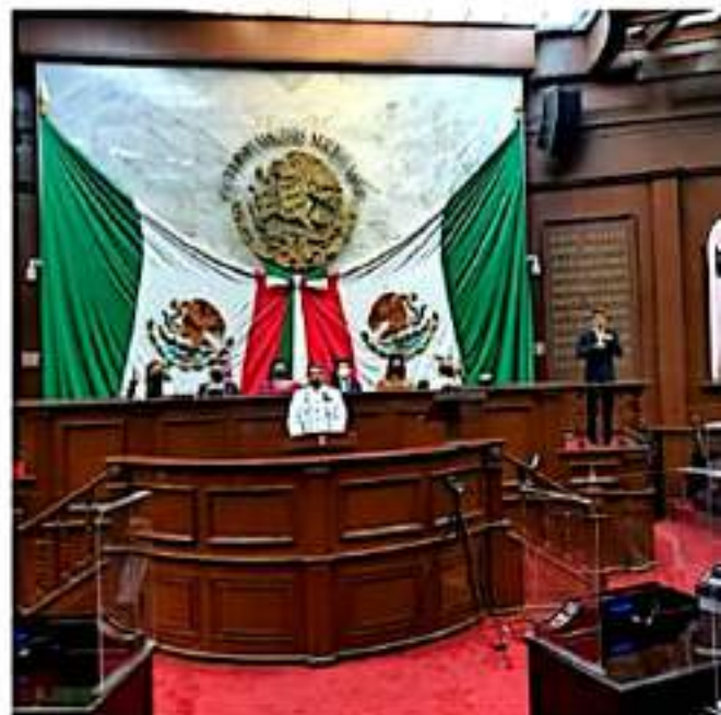
CD. LÁZARO CÁRDENAS, MICH.- En el marco de la celebración del Bicentenario de la Creación de la Armada de México, en Sesión Solemne fue inscrita con letras doradas la leyenda "2021 Bicentenario de la Creación de la Armada de México", en el frontispicio del Honorable Congreso del estado de Michoacán.