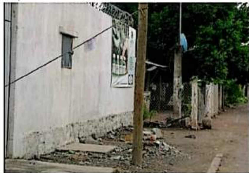
Vecinos de Coahuayana solicitaron públicamente a Telmex ayuda a reparar este poste dañado y que está a punto de caerse.