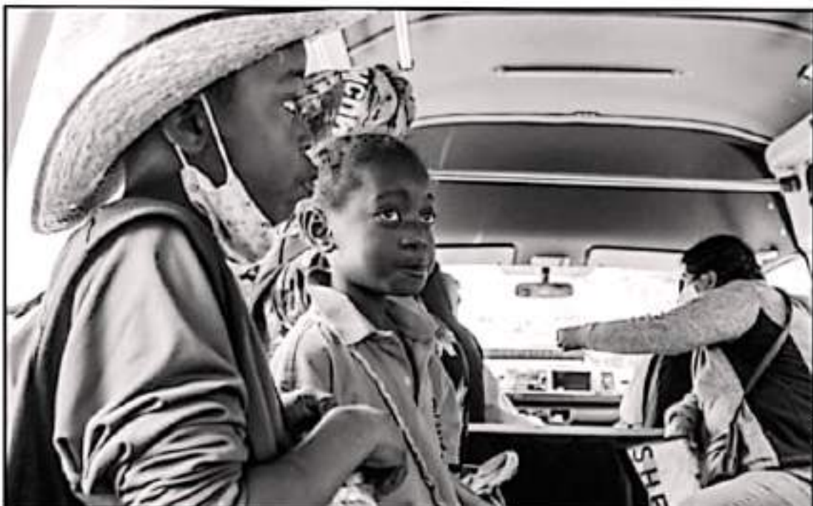
DIAMANTE EN LA CIUDAD DE MORELIA Y OTROS PUNTOS DEL ESTADO SE ADVIERTEN MIGRANTES CENTROAMERICANOS CON DESTINO A LA FRONTERA NORTE.

Por lo anterior, explicó que para este 2021 se volverá a plan-