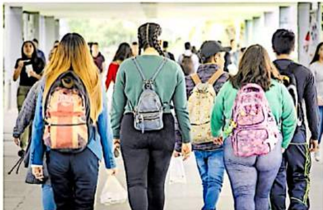
Dicha norma aún no entra en vigor, pero busca proteger a estudiantes, asegura Mexicanos Primero. LARSEN HERNÁNDEZ