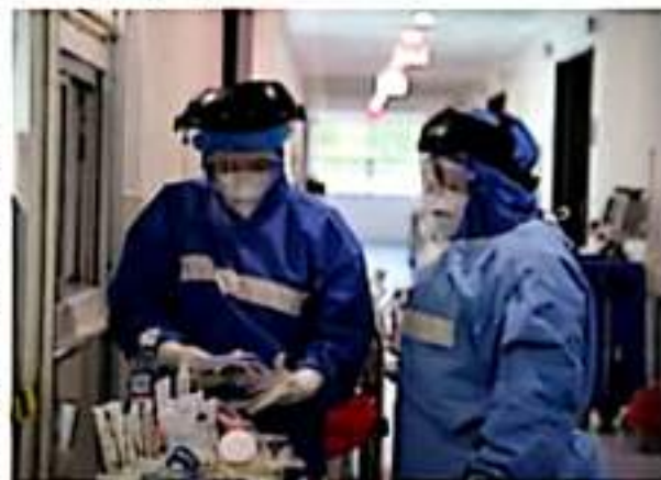
De acuerdo con el sector salud, Michoacán se mantendrá en bandera amarilla, en la semana del 27 de septiembre al 03 de octubre próximo.

"Nuestro reconocimiento por su abnegación y valentía. Quede patente nuestro agradecimiento a través de este acto, que no por su modestia