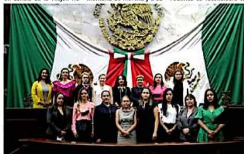
Las diputadas del PAN, PRI y PRD se unieron para solicitar un alto a la violencia contra las mujeres por parte del también diputado morenista Fidel Calderón Torreblanca.

Se precisó que la atenta súplica a Telmex es por la situación de riesgo que representa el poste dañado, motivo por el cual se apela a la responsabilidad social de la empresa telefónica.