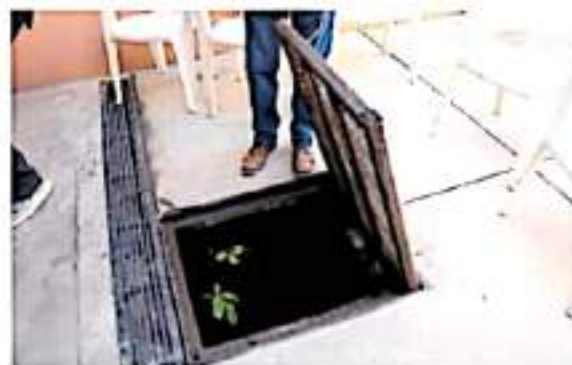
Uno de los afectados dijo que ha presentado quejas ante el OOPAS y SCOP.

Las que se rompieron al hacer los trabajos de obra, además de otros tubos de agua potable que también se rompieron, lo que mantiene estancados en la zona.