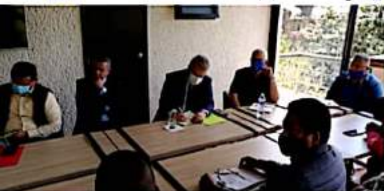
MORELIA, MICH.- Durante la mesa de negociación con el equipo de Alfredo Ramírez Bedolla, gobernador electo.