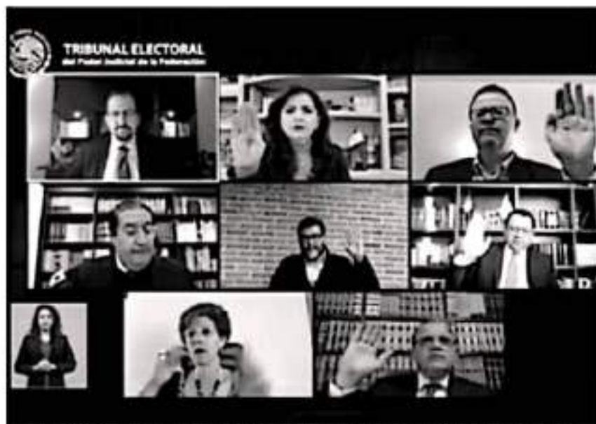
DE LOS MÁS DE 50 ASUNTOS QUE ANALIZABA EL TRIBUNAL FEDERAL MICHOACÁN ESTARÁ A MITAD DE LA LISTA.