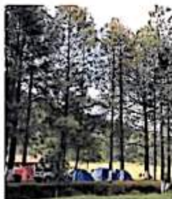
Suma 13 mil 265 68 hectáreas protegidas

El programa de Rancho Viejo también busca poder tener un aprovechamiento sustentable, toda la superficie para un uso ecoturístico, forestal y de conservación.