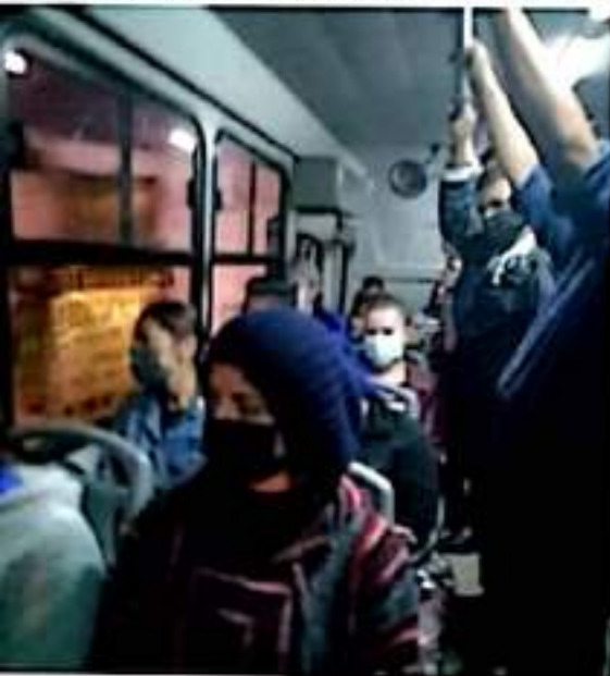
URUAPAN, MICH.- Camiones con sobrecupo, sin que se respeten las medidas para frenar la ola de contagios diarios de Covid-19, es el común en esta ciudad, que hoy por hoy es la de mayor riesgo de adquirir el Covid-19, en Michoacán.

Y aunque estemos en bandera amarilla, los eventos masivos siguen sin estar autorizados, lo que pareció no importar mucho a los vecinos del barrio de San Miguel, quienes para festejar hoy a su Santo Patrono, desde ayer tenían alrededor de su capilla una auténtica romería, que incluyó bandas de música, juegos mecánicos y vendimias de alimentos, "como en los viejos tiempos, y sin que algún inspector los molestara".