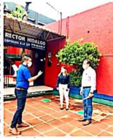
CD. LÁZARO CÁRDENAS, MICH.- Personal de SEE y JSN recorren colegio particular, para verificar protocolos.

Cabe destacar que en Lázaro Cárdenas regresan a clases en modalidad semi-presencial 195 escuelas privadas y públicas de educación básica, media superior y superior, de los cuales equivalen a un apumado de 18 mil 350 alumnos.