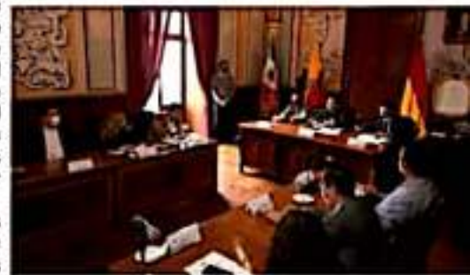
MORELIA, MICH.- Con el aval de los regidores, este martes se completaron expedientes de los acuerdos tomados en el Cabildo de Morelia, de

Ante la oposición de al menos tres regidores, se exhortó a aprovechar la disponibilidad del terreno, toda vez que existe coordinación con el ayuntamiento, gobernador, Silvano Aureoles Conejo según el dicho del propio alcalde de Morelia, Alfonso Martínez Alcázar.