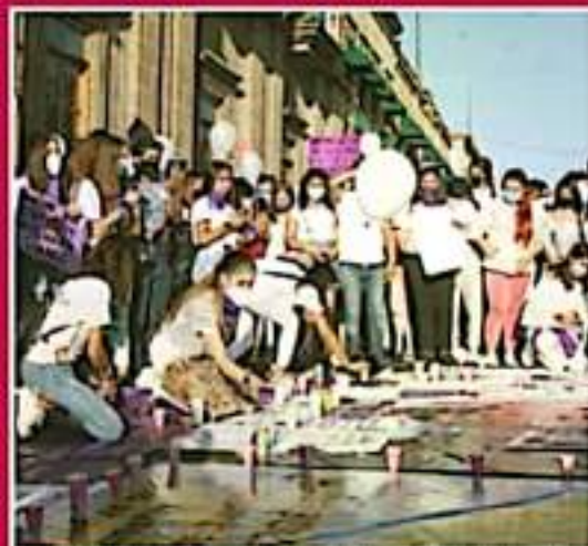
EL FEMINICIDIO DE JESSICA ES EL RETRATO DEL FRACASO DE ESTRATEGIAS EN MATERIA DE PREVENCIÓN Y ATENCIÓN A VIOLENCIA DE GÉNERO.

Después de varias administraciones que fueron controladas por la Coordinadora Nacional de Trabajadores de la Educación, en este sexenio hubo mayor notoriedad desde el gobierno. Sin embargo, graves momentos marcharon y mostraron que la corrupción sigue presente, después de que hicieron trampa en desarrollo de ingresos a las normales en el ciclo anterior. Hasta ahora, todo sigue en la impunidad. Se intentó recuperar la mayoría de las normales, pero fue imposible. Ocuparon la titularidad tres personas. Hoy, la política sindical está en severa crisis debido a la división interna que prevalece, pero la CNTe sigue con el poder.