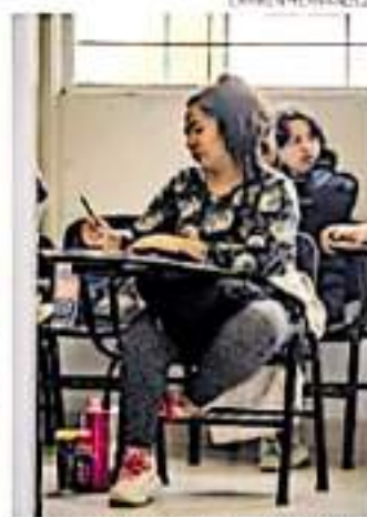
La norma permitirá verificar si instituciones funcionan adecuadamente.

Los negocios de escuelas privadas en el estado han proliferado, pese al decrecimiento de la economía y la demanda durante el periodo de pandemia