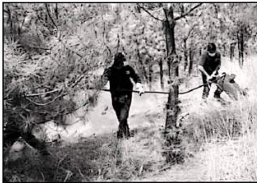
SE DESTACÓ QUE LA CEFOR Y LA CONAFOR SIMULAN TRABAJAR UNIDAS, DEJANDO SIN CUBRIR NECESIDADES AMBIENTALES.

coordinación interinstitucional. No hay trabajos que unifique intereses de las instituciones, esto es real. Cada dependencia corre por caminos diferentes y asumen su propio compromiso, pero no existe coordinación en este tema que podría abarcar recursos, que recordemos que es algo de lo que más falta”, destacó.