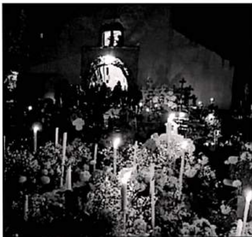
EN EL MUNICIPIO DE TZINTZUNTZAN SE REALIZAN DIVERSOS EVENTOS MINUS QUE DEBEN CUBRIR LA SANA DISTANCIA

En aquella ocasión se limitó el aforo al 50 por ciento en hoteles y establecimientos y se prohibieron prácticamente todos los eventos especiales públicos, pero el mayor golpe fue por la decisión de varias comunidades de cerrar sus puertas a los visitantes ante el riesgo de infección.