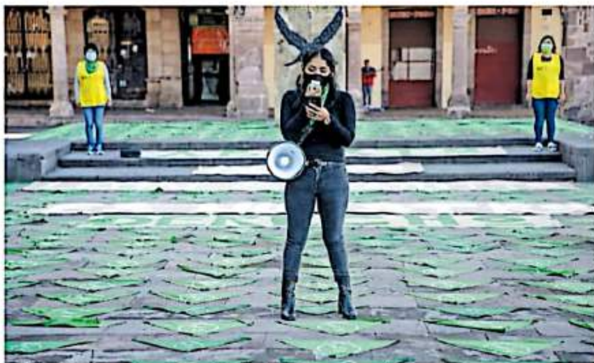
Feministas reiteraron su posicionamiento por el derecho a decidir sobre sus cuerpos en la plaza Benito Juárez

Finalmente, la activista destacó que contar con 25 mujeres diputadas en el Congreso local no garantiza que la despenalización del aborto en el estado vaya a homologarse, pues "las posturas ideológicas siguen pesando sobre los derechos de la mayoría". La pasada legislatura desestimó abordar el tema pese a las iniciativas que se presentaron desde diferentes frentes. La apuesta será, insistió, "aumentar el costo político