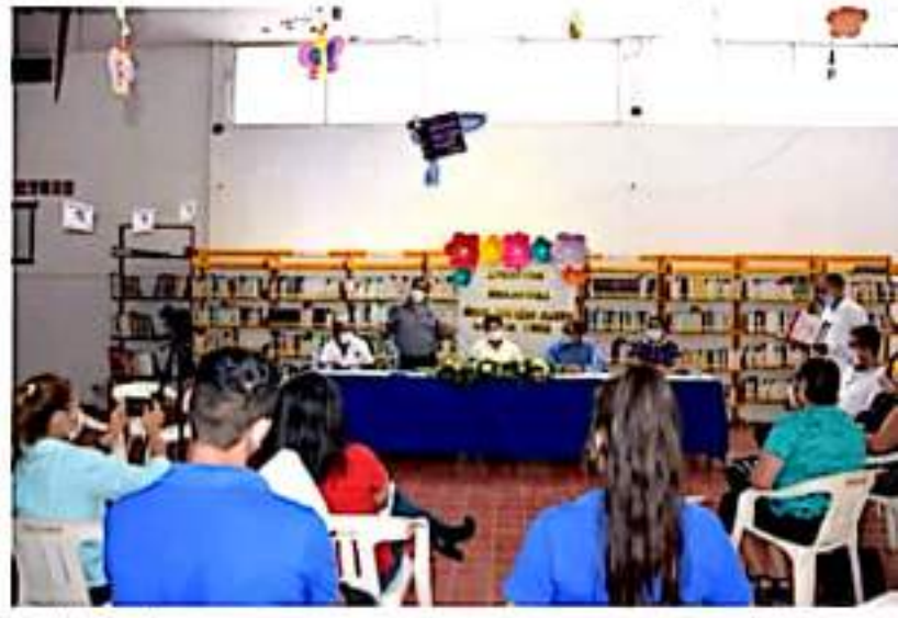
CD. LÁZARO CÁRDENAS, MICH.- Este martes se dio apertura a las bibliotecas públicas municipales, evento que tuvo la asistencia de representantes de centros culturales y comunitarios.

A partir de este día entran en función la Biblioteca Pública en Lázaro Cárdenas, Las Guacamayas, La Mira, Playa Azul, El Habilidad y Coleta de Campos en horario de atención de lunes a viernes de 9 am a 19 horas y sábado de 9 am a 2 pm; asimismo, se hace una invitación a los artistas locales a participar en exposiciones artísticas en estos espacios.