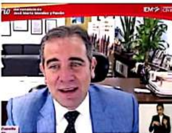
MORELIA, MICH.- Lorenzo Córdova Vianello, presidente del Instituto Nacional Electoral (INE).

Finalmente, recalcó la importancia de la herencia de Morelos desde la articulación de la democracia constitucional, la división de poderes con la autonomía de los órganos autónomos, entre muchas más aportaciones a la vida pública y política de la nación.