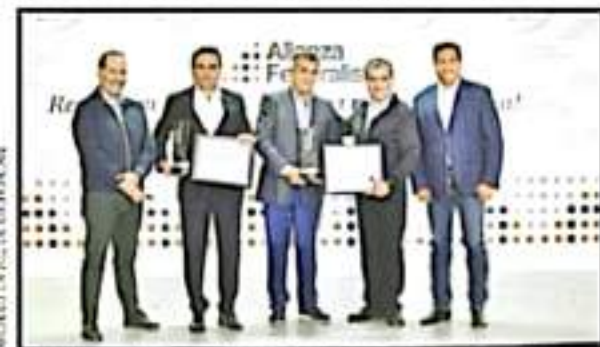
JURISTICTION DE LOS GOBERNADORES. FORMO UN GUERRA CRUCIAL A ANEJO