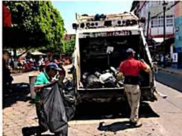
ZAMORA, MICH.- La limpieza de la ciudad se está realizando, a pesar de que no están funcionando 7 vehículos por la falta de mantenimiento desde la pasada administración.

Mientras que en la zona norte la colonia Ejidal, Aurora I y II, Las Delicias, Villas del Magisterio,