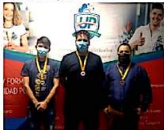
Los jóvenes estudiantes universitarios de LC que participaron en un evento internacional.