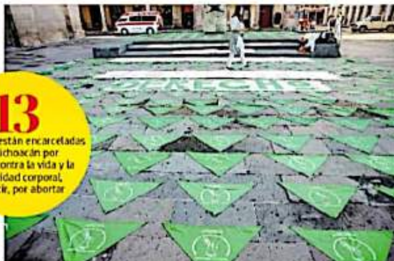
Un contingente de mujeres realizó acciones enmarcadas en el Día de Acción Global para el Acceso al Aborto Legal y Seguro

13 MUJERES están encarceladas en Michoacán por delitos contra la vida y la integridad corporal, es decir, por abortar