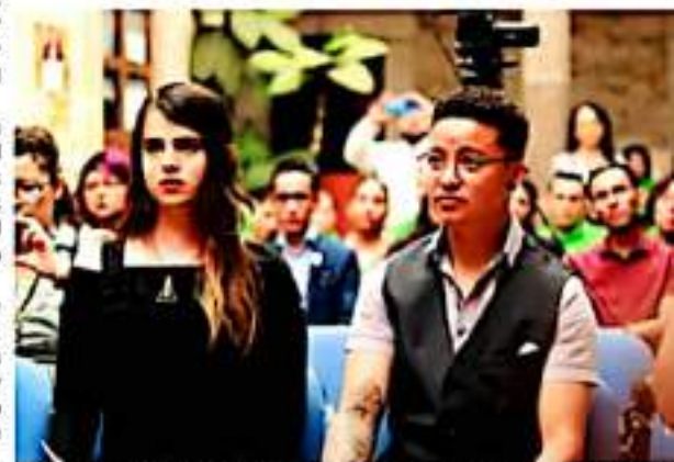
MORELIA, MICH.- Este proceso que se reduce a realizarlo administrativamente en las oficinas del Registro Civil, es parte de los compromisos del Ejecutivo.

Al corte de agosto de 2021, Michoacán reconoció ampliamente los derechos de la comunidad LGBT+, al haberse realizado durante la actual administración, 289 trámites de reasignación de identidad de género.