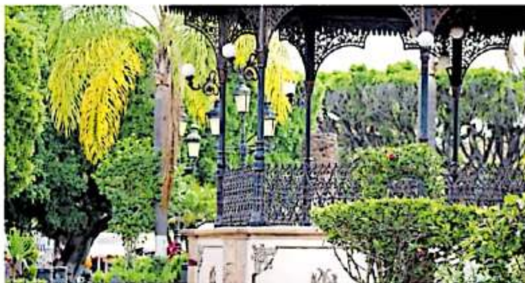
El edil indicó que se enfocan en combatir la corrupción

ENTRE LAS IRREGULARIDADES HAY 7 MDP EN COMBUSTIBLE