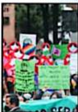
EXIGEN AL CONGRESO LOCAL NO REPETIR ERRORES PASADOS