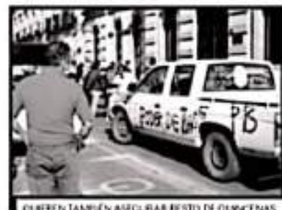
QUIEREN TAMBIÉN ASEGURAR RESTO DE QUINCENAS.

MARINA LÁZARO CÁRDENAS 2021 Año de la Independencia