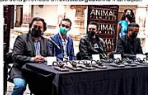
MORELIA, MICH.- Con sede en el Palacio Clavijero, el teatro "José Rubén Romero" y la página oficial del festival.

Leyendas, pesadillas y experiencias paranormales, llevadas al séptimo arte, en 21 filmes internacionales y 29 mexicanos, de los cuales 7 son michoacanos, más charlas y diversas actividades, son parte del programa que puede consultarse a través de www.animalfilmfest.com , espacio para la difusión de los contenidos durante la jornada.