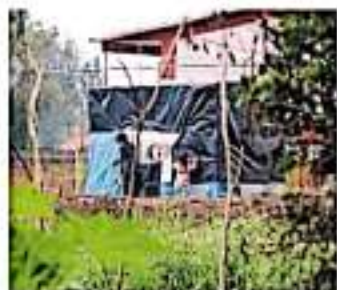
Se acumulan 14 casas irregulares