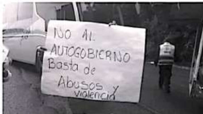
A nombre del Presidente municipal, agradecieron la buena voluntad de los habitantes de los Pueblos Originarios, quienes permitieron que los vehículos continuaran hacia sus destinos.