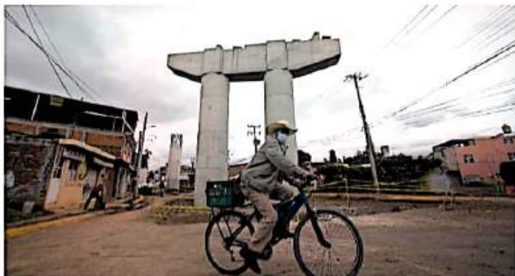
Los vecinos aseguran que ya cerraron todos los negocios de la zona