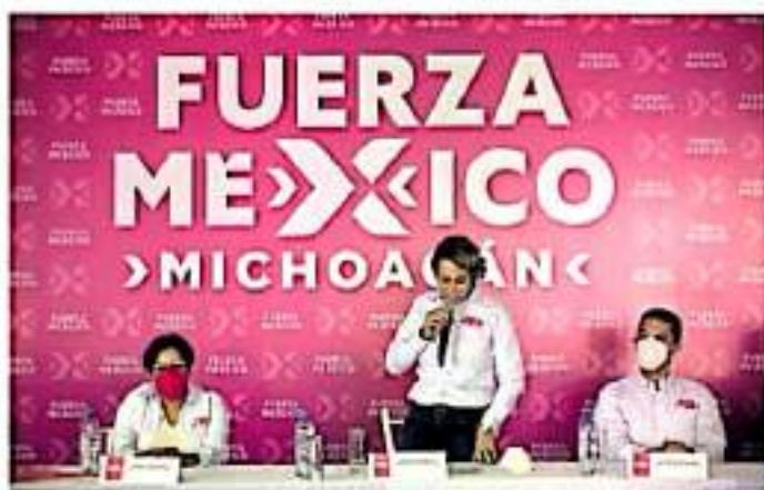
El partido Fuerza por México destinó sólo el 37.70 por ciento

El partido Fuerza por México destinó sólo el 37.70 por ciento, dejándolo sin efecto que sus candidatas recibirán 216 mil 399 pesos. En este caso la sanción que se le