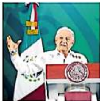
El mandatario lo informó en la conferencia de prensa matutina.

Un día antes de tomar protesta como gobernador, Ramírez Bedolla aseguró que tiene la intención de visitar municipios de la Tierra Caliente michoacana con el jefe del Ejecutivo federal. "Estamos en diálogo porque también queremos que el presidente de la República nos acompañe", dijo, en referencia específica a Aguililla, Tepicotepec y Guadalupe.