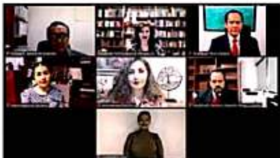
"Continuaremos con nuestras tareas, en pro de la justicia electoral y democrática en Michoacán", señaló el nuevo presidente del TEEM.