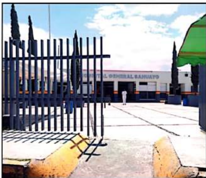
ESPERAN QUE EL GOBIERNO ESTATAL PONGA LA MBRADA ANTE LAS DEFICIENCIAS QUE TIENE EL HOSPITAL GENERAL.

propios pacientes y sus familias. "Recientemente se han registrado casos en que los hospitales han incrementado más del 100 por ciento y hasta 200 por ciento los costos al paciente".