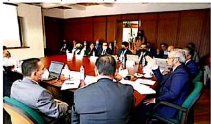
El Gobernador aseguró que el proyecto económico no contemplará deuda pública a largo plazo.

A la vez de que anticipó, en esta semana se realizará una reunión con la Secretaría de Hacienda y Crédito Público para revisar datos e información generada por la dependencia estatal a fin de aterrizar apoyos federales para Michoacán.