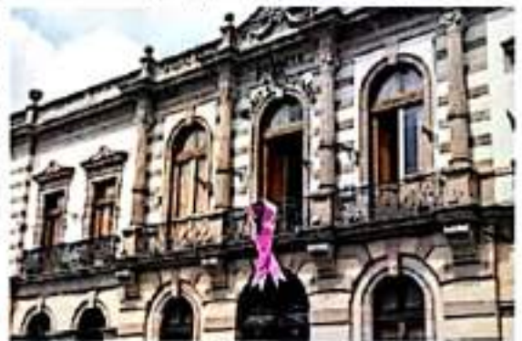
Colocar moño rosa en fachada de su edificio a fin de concientizar la importancia de su detección temprana.