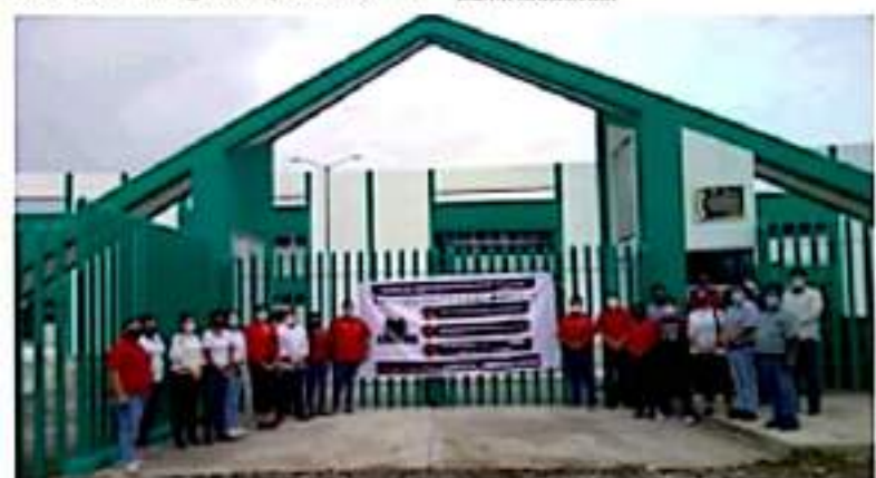
CD. LÁZARO CÁRDENAS, MICH.- La UPLC cuenta con un nuevo frente sindical, denominado CESTES.