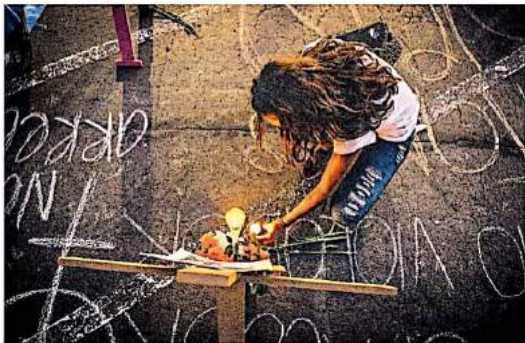
Esta es la cuarta marcha que se realiza para reclamar justicia por la joven