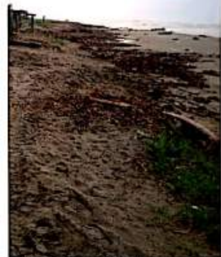
CD. LÁZARO CÁRDENAS, MICH.- La basura en el mar afecta el proceso de anidación de la tortuga marina.