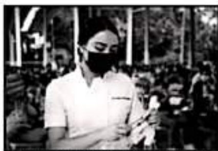
AUTORIDAD MANIFIESTA QUE HAY SUFFICIENTES DOSIS