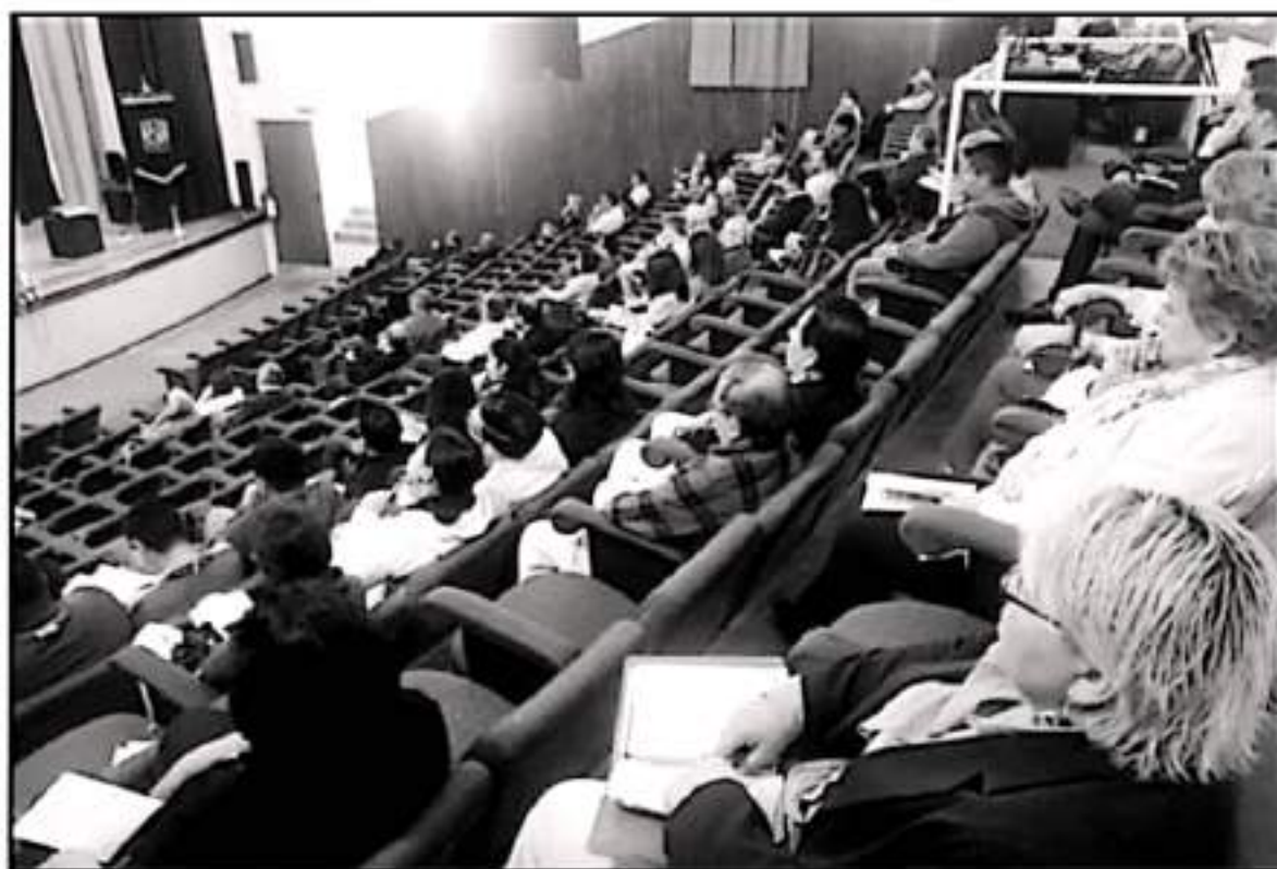
PREVIO A LA PANDEMIA, LAS JORNADAS DE HISTORIA DE OCCIDENTE SE HABIAN LOGRADO CONSOLIDAR COMO UNO DE LOS ATRACTIVOS EN MATERIA DE TURISMO

Abordarán en sus disertaciones con temas como la sociedad mexicana: preludio de un colapso; el lequeno en Mezo América y la Nueva España; los tlaxcaltecas en el exilio; San Martín Totolán, comunidad de antiguo asentamiento; La acción política de los partidos en el Siglo XVIII: la organización comunitaria y acción política en las rebeliones; comunidades acedadas; gobiernos autónomos en comunidades purépechas; la comunidad en la educación pública de México; evolución del Ejido; el Centro