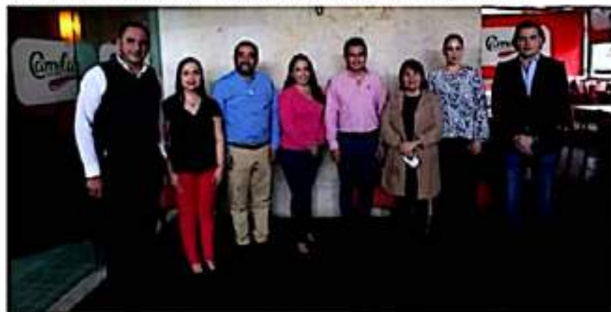
Acción Nacional defendió en todo momento a la población al garantizar que no desaparecieran secretarías y programas de apoyo necesarios para el desarrollo económico y social.

Se logró especificar las atribuciones de la Consejería Jurídica y de la Coordinación de Comunicación Social. De origen, no se incluían y se dejaban a discreción en un Reglamento.