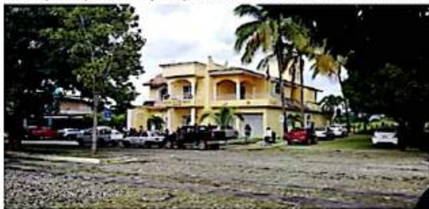
La Procuraduría Agraria está obstruyendo la justicia dictada a favor de la Comunidad Indígena de Aquila.

Por lo anterior, es que "el grupo mayoritario de la Comunidad Indígena de San Miguel Aquila integrado por el 85 por ciento de los comuneros reconocidos, rechazamos las actitudes contrarias a la ley asumidas por los funcionarios agrarios denunciados, y respetuosamente pedimos al Presidente de México, Andrés Manuel López Obrador, al gobernador de Michoacán, Alfredo Ramírez Bedolla, a las cámaras de senadores y diputados, y a la Sedatu, su inmediata intervención para que la autoridad correspondiente, en este caso la Procuraduría Agraria, proceda a emitir y publicar la convocatoria respectiva como lo ordena el TUA 38 para efectos de nombrar o elegir las autoridades de representación comunal, interviniendo y estando presentes en el proceso respectivo representantes de SEGOB Federal, del Honorable Congreso de la Unión y del Titular del Ejecutivo Federal, propiciando una elección democrática en la que participen las planillas que así presenten los grupos interesados", concluyó.