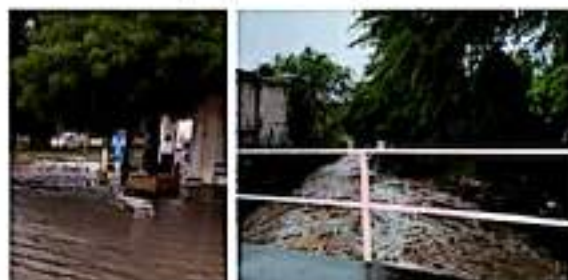
APATZINGÁN, MICH.- Hubo recorridos por las diferentes colonias de la ciudad.