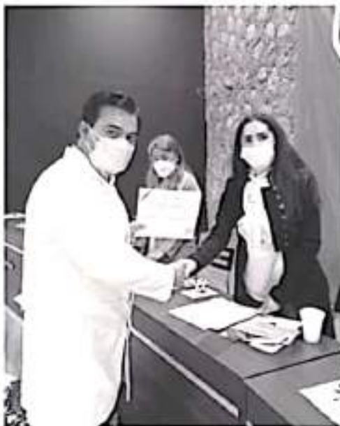
La presidenta del DIF municipal, recomendó emprender actividades deportivas, evitar el sedentarismo, comer mejor en la cantidad y calidad, proporcional a cada persona.

La presidenta del DIF entregó un reconocimiento al médico Alejandro Omedo González, por su destacada intervención como conferencista; asimismo entregó esta distinción a regideoras, quienes también participaron en la charla.