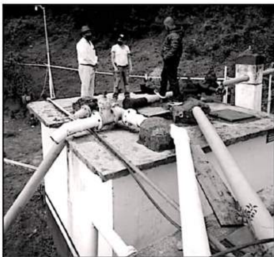
UN PROBLEMA ES LA INEFICIENCIA DE LAS BOMBAS DEL AGUA, LAS QUE CONSUMEN DEMASIADA ENERGÍA ELÉCTRICA.