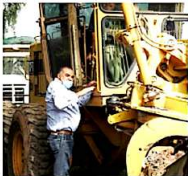
JACONA, MICH.- Las puertas del ayuntamiento están abiertas para todos los ciudadanos e invitó a todos los agricultores a que sean parte de este proyecto.