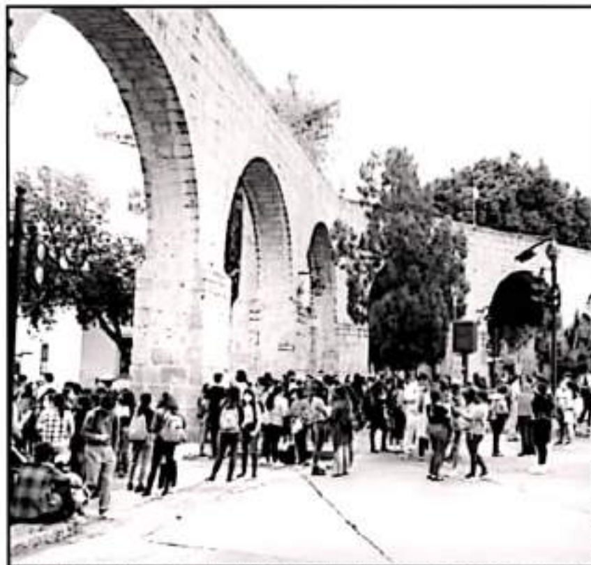
COMO DE COSTUMBRE, EXIGEN SOLUCIÓN AL TEMA DE LAS PLAZAS, BECAS Y APOYOS PARA EGRESADOS NORMALISTAS