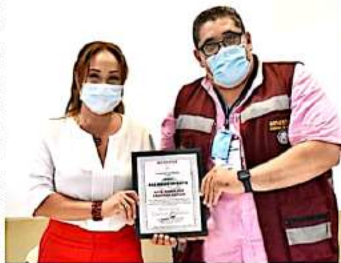
CD. LÁZARO CÁRDENAS, MICH.- Ayer fue reconocido el ayuntamiento de Lázaro Cárdenas por su participación en las Jornadas de Vacunación contra el Virus SARS-CoV-2, para la prevención de la Covid-19 en México, como integrante de las Brigadas Correcaminos.

poblacional en este municipio, siendo la última jornada de vacunación destinada a personas de 18 a 29 años de edad. En el evento también se hizo entrega de reconocimientos a la Secretaría de la Defensa Nacional, Secretaría de Marina, Guardia Nacional, DIF Municipal, Policía Municipal, Policía de Tránsito Estatal, Regimientos Municipales, así como a funcionarios municipales y a la Secretaría de Salud de Michoacán a través de la Jurisdicción Sanitaria 08, IMSS e Issste.