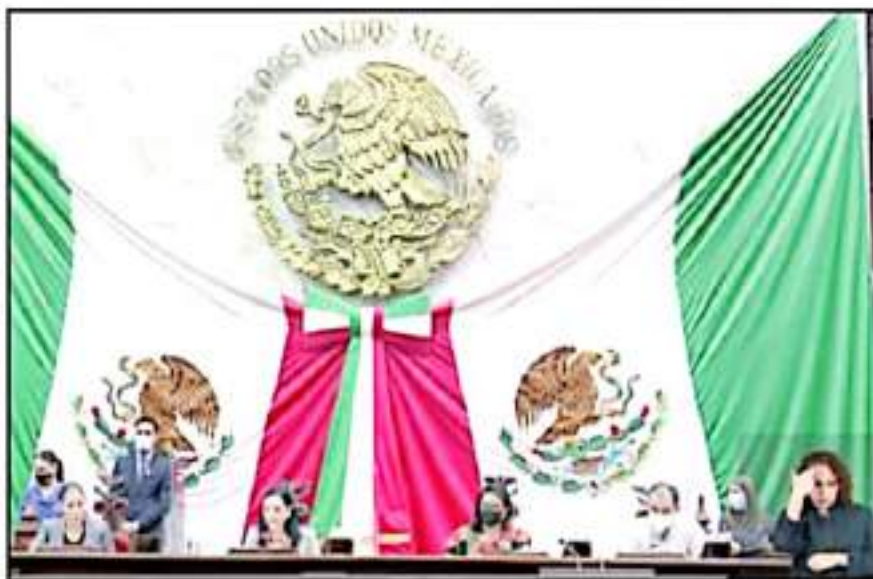
SESIÓN SE EXTENDIÓ HASTA LA MADRUGADA, DESPÉS DE QUE LOS DIPUTADOS NO INICIARON A LA HORA PACTADA.