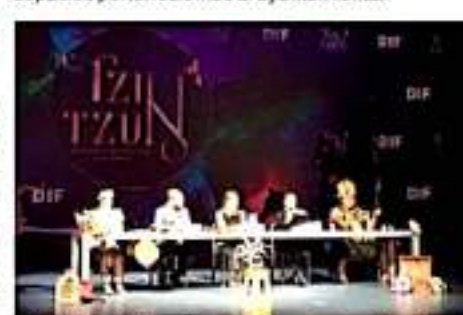
MORELIA, MICH.- "Tzintzún" ofrecerá una función especial con causa en coordinación con el DIF Municipal.

El proyecto para la creación del centro aún está en investigación para ver costos de creación y funcionamiento, para lo cual se están revisando espacios pertenecientes al ayuntamiento.