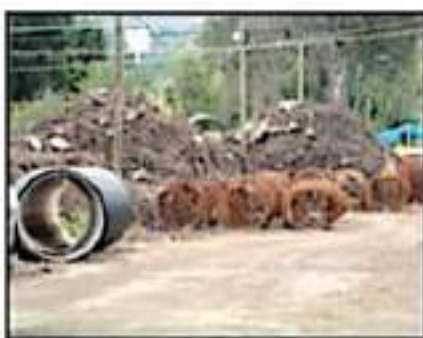
ASEGURAN QUE EL LUGAR REPRESENTA UN PELIGRO...