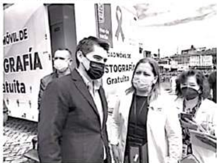
Esta labor se lleva a cabo en el marco del Mes de Concientización del Cáncer de Mama, de manera coordinada en las unidades de salud en Michoacán y el apoyo del DIF municipal.

La vigencia de la campaña es hasta el próximo 22 de octubre, en las instalaciones del DIF, en un horario de 8:30 am a 2:00 Pm. y de 3:00 Pm. a 5:00 Pm., de lunes a viernes.