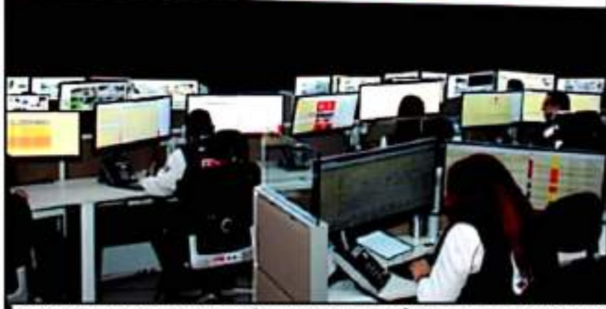
SE REVISARÁ LA CONSTRUCCIÓN, CONTRATACIÓN E INCLUSO EL PROPIO DISEÑO DEL EDIFICIO, EL CUAL TIENE GOTERAS

raciones militares que operan en la capital michoacana tampoco tienen acceso de "espeja" a las imágenes generadas por las cámaras del estado, mismas que podrían servir de apoyo a la Guardia Nacional en términos de inteligencia.