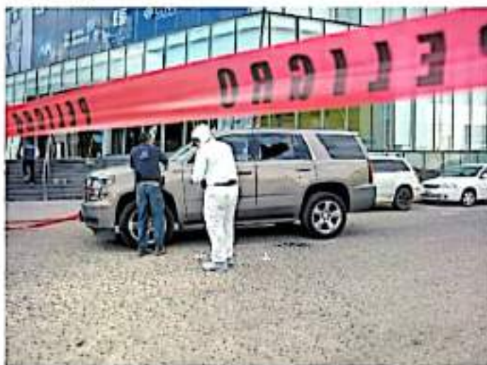
La estadística indica que el mayor porcentaje de comunicadores asesinados cubrían la fuente policiaca.

ENTRE diciembre de 2018 y septiembre de 2021 fueron asesinados 94 defensores de los derechos humanos, seis de ellos en Michoacán