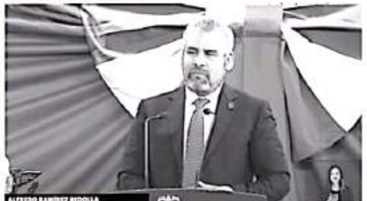
La instrucción del gobernador tiene como propósito cancelar el uso de helicópteros para trasladar funcionarios, y que sean destinados de manera prioritaria para la atención de emergencias.

pie y foto ordena gobernador gov. La instrucción del gobernador tiene como propósito cancelar el uso de helicópteros para trasladar funcionarios, y que sean destinados de manera prioritaria para la atención de emergencias.