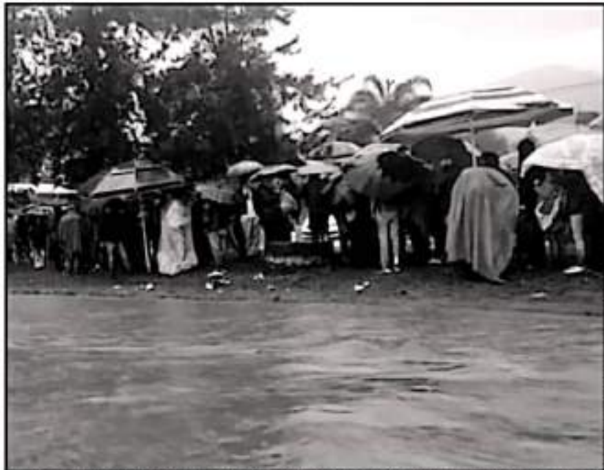
SE PUDO OBSERVAR QUE LAS PERSONAS LLEVABAN CONSIGO CASAS DE CAMPAÑA, SOMBREROS Y HASTA LONGAS POLÍTICAS

de crear una prolongada fila para ser de los primeros en ser atendidos este miércoles a partir de las 6 de la mañana. "Como se que no va a repetirse lo de la primera dosis en que se suspendió la vacunación por la falta de vacunas", dijo uno de los jóvenes.