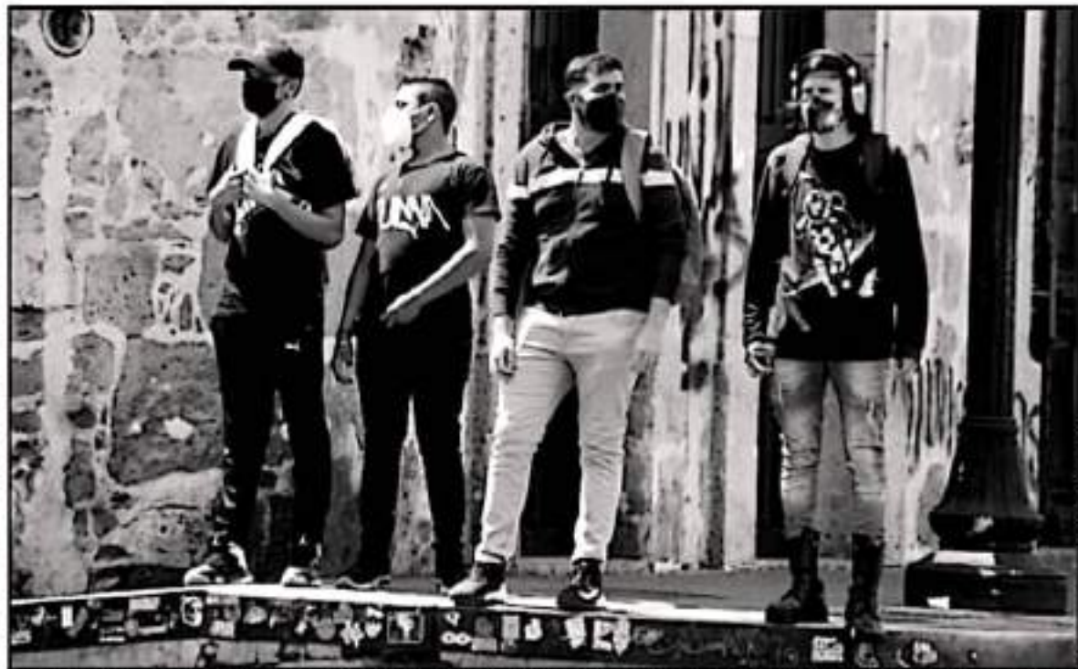
SE DESTACÓ QUE EL 65 POR CIENTO DE LA POBLACIÓN MICHOACANESA EN EDAD HA SIDO inmunizada CON LAS DISTINTAS DOSES DISPONIBLES A NIVEL NACIONAL.

Las principales enfermedades que agravan los casos de COVID-19 son la hipertensión, diabetes y obesidad, pues 3 mil 498 de las personas que murieron por coronavirus tenían problemas de presión arterial, es decir, 46 por ciento de todos los decesos, mientras que 2 mil 743 eran diabéticos, más de la tercera parte, y mil 778 padecían obesidad, lo que representa