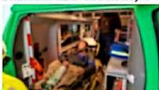
Paramédicos de una ambulancia a cargo de auxiliar a un hombre atacado a balazos en la colonia Valencia Segunda Sección de Zamora.

Al lugar, llegaron los paramédicos y lo trasladaron a un hospital, donde recibe atención médica y se reporta su estado de salud como grave.