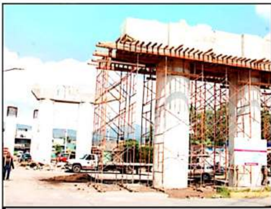
HASTA EL MOMENTO NO HAY UNA FECHA CLARA PARA QUE SE REANUDEN LOS TRABAJOS DE CONSTRUCCIÓN DEL PUENTE.

El impacto no ha sido solo al tema de movilidad y economía, desde hace meses, los asaltos se han disparado en agravio de los trabajadores de la zona y de las personas que acuden a hacer sus compras.