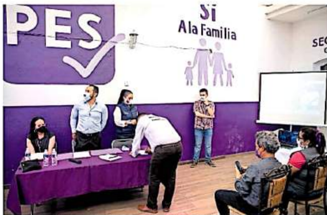
PES se hace acreedor a una sanción que le reducirá su ministración mensual por 139 mil 998 pesos / CARMEN HERNÁNDEZ