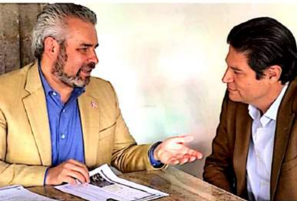
MORELIA, MICH.- Alfredo Ramírez y Alfonso Martínez, gobernador de Michoacán y alcalde de Morelia, respectivamente.

"La campaña ya pasó, ahora nos corresponde trabajar por Morelia y Michoacán; agradecer la buena relación y comunicación que habrá desde el principio".