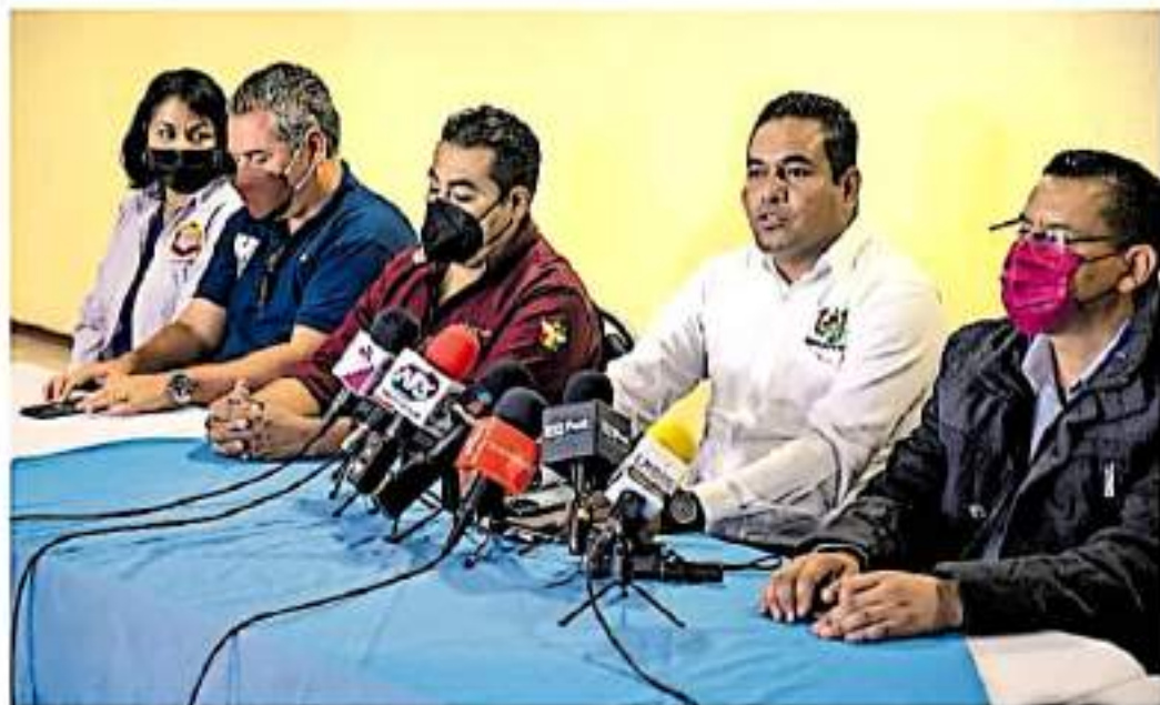
Dieron a conocer que también tomarán los planteles de todo el estado donde tienen presencia.