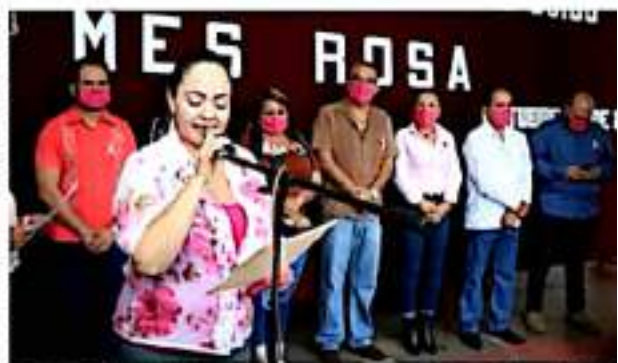
APATZINGÁN, MICH.- El gobierno municipal, a través de la Dirección de la Mujer y DIF Municipal, así como las autoridades de Salud, iniciaron las actividades.