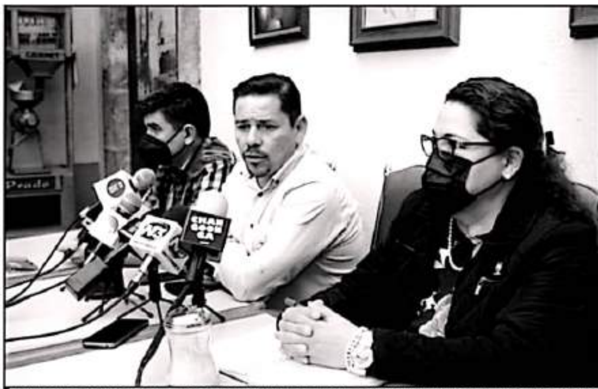
SEÑALARON LA NECESIDAD DE QUE EL NUEVO GOBIERNO ESTATAL PUEDA DIÁLOGAR SOBRE LAS DESIGNACIONES EN LOS SUBSISTEMAS DONDE NO HAY ENCARGADOS.

líder del CESTES que esto puede ser debido a los acuerdos con los gremios en el marco de la búsqueda de apoyos en la contienda por la gubernatura, pero sin duda representará una herencia muy pesada para la siguiente administración.