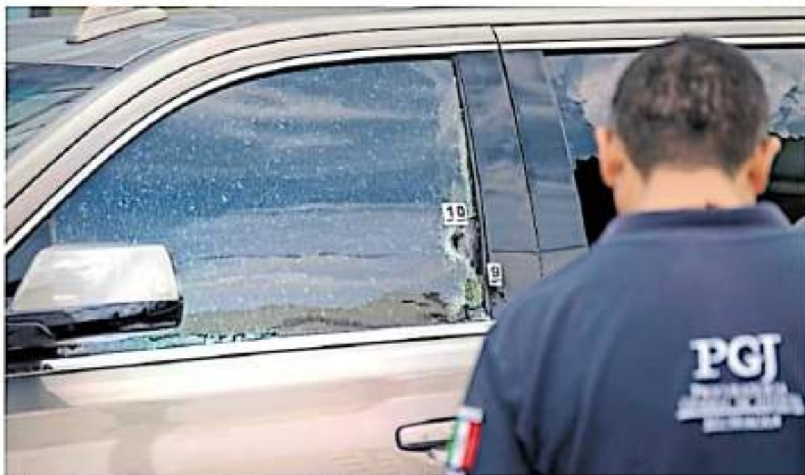
El crimen más reciente contra un periodista ocurrió el 19 de julio en Morelia.

ESTADO, ENTRE LOS MÁS PELIGROSOS PARA EL PERIODISMO