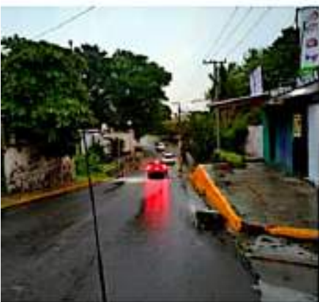
APATZINGÁN, MICH.- La lluvia que cayó la mañana de ayer provocó la movilización de elementos de Protección Civil Municipal.

El río Apatzingán incrementó su caudal al cincuenta por ciento de su capacidad límite. La lluvia persistió durante cinco horas y media continuas (05:45-11:15 horas), aunque la parte intensa del principio se prolongó durante una hora y después se redujo.