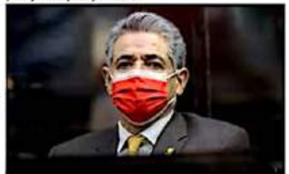
El coordinador de los diputados priistas en el Congreso del estado aclaró que el trabajo legislativo se realiza sin énfasis económicos, como pretende acusar el gobierno estatal.

minaciones se harán con responsabilidad.