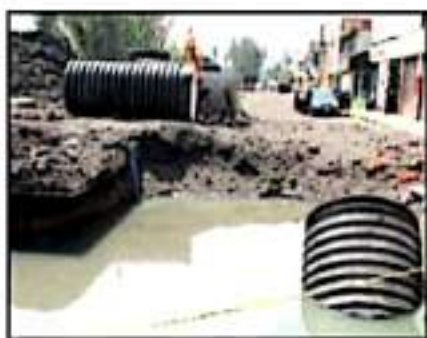
LA OBRA SE HA AGRAVADO PORQUE EL MEDIO ENTORNO...