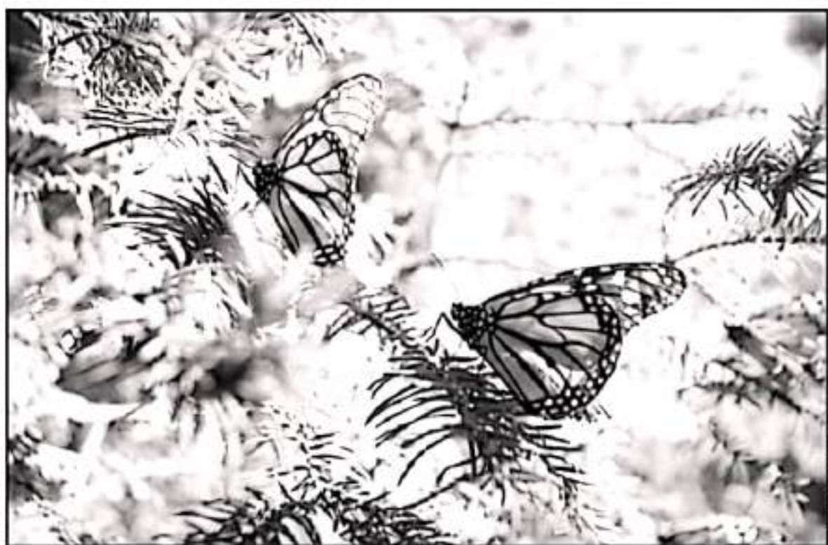
EXPLORAR QUÉ LO QUE SE QUIERE PLASMAR ES EL TRABAJO QUE HACEN LOS INVESTIGADORES Y LA UNIVERSIDAD MICHOACANA ES MUY IMPORTANTE.

"Pensamos que a veces las investigaciones únicamente quedan en los artículos de revistas especializadas e incluso publicados en otros idiomas, hasta el tema de la falta de lectura", dijo,