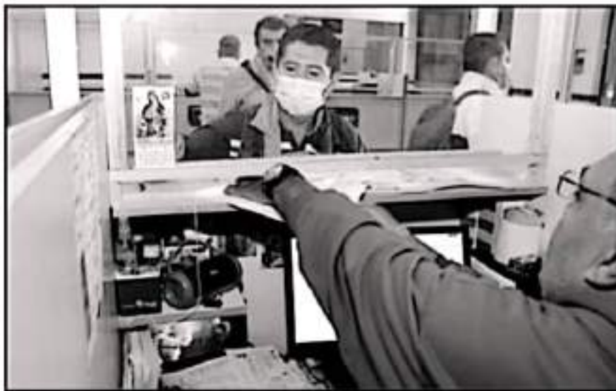
POR LAS MALAS CONDICIONES DE RECAUDACIÓN DE IMPUESTOS LOCALES, EL ESTADO OSTENTA DEPENDENCIA FEDERAL.

Alfredo Ramírez, GOBERNADOR DE MICHOACÁN