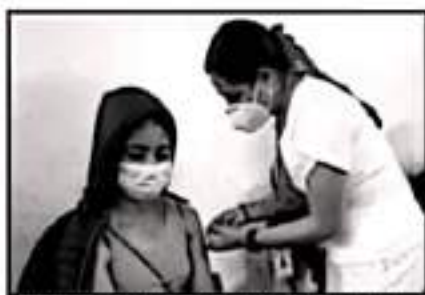
EN LA SEDE OPERAN 18 PAREJAS DE VACINADORES

Sin embargo, dicho llamado no fue atendido y ayer mismo luego de que se anunció el cierre del puesto de vacunación, un número indeterminado de personas decidió iniciar una nueva espera a través de repetir el fenómeno