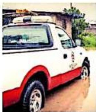
Hasta el momento no se han reportado víctimas.

En los taponamientos encontraron una falta de esbozo, artículos de cocina como cazuelas, platos de PTL, residuos como ramas de árboles y azulejo.