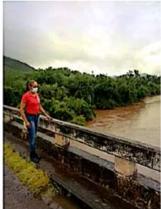
APATZINGÁN, MICH.- El río Apatzingán incrementó su caudal al cincuenta por ciento.