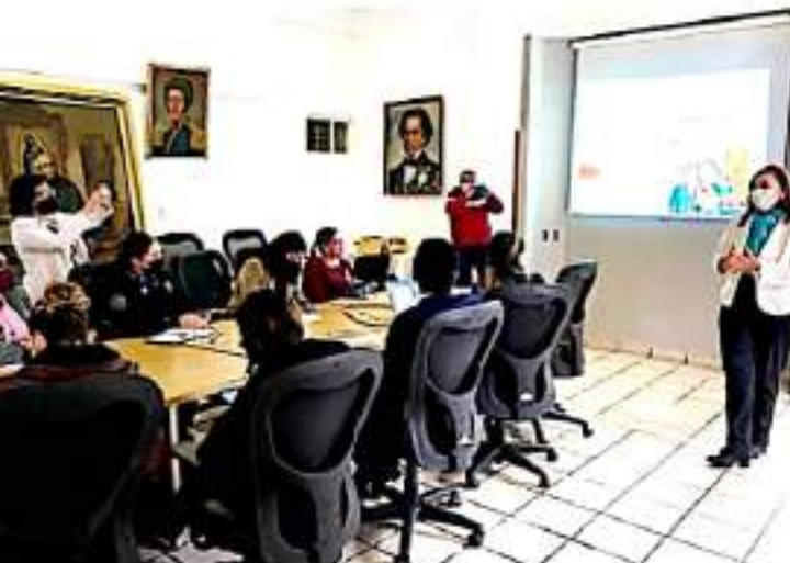
URUAPAN, MICH.- Se capacita a funcionarios municipales para que se sumen al combate a la violencia contra la mujer.