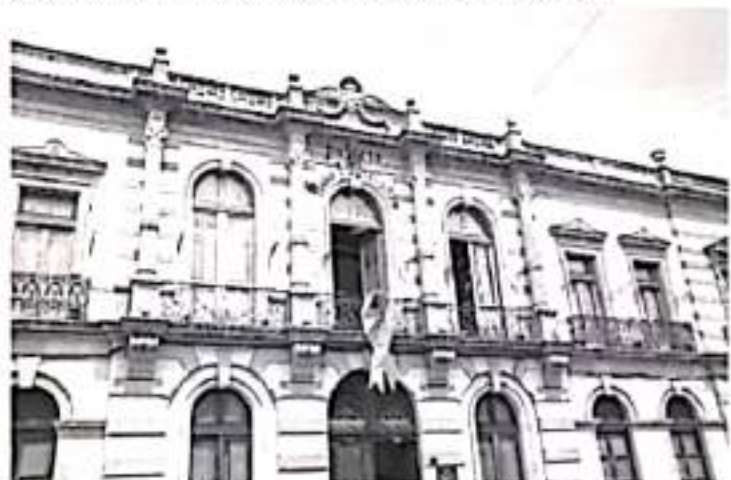
La legislatura hizo un llamado tanto a las autoridades de los distintos niveles de gobierno como a la sociedad en general a fin de cerrar filas en torno al cáncer.