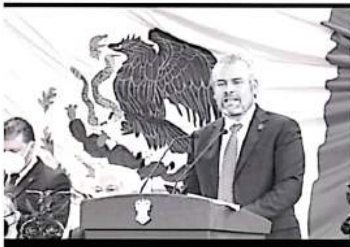
Insistirá en las gestiones para que la Casa de Hidalgo sea reconocida por el Gobierno de México como universidad nacional, y en consecuencia pueda acceder a mejores aportaciones económicas.

-El gobernador solicitará apoyo a la federación para mejorar las condiciones financieras de la institución nicolaita_