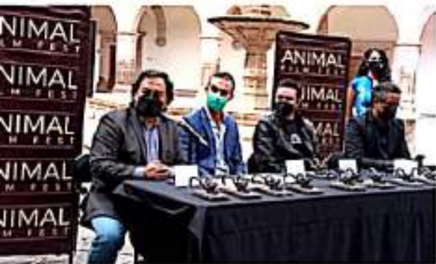
MORELIA, MICH.- Con sede en el Palacio Clavijero, el teatro "José Rubén Romero" y la página oficial del festival.