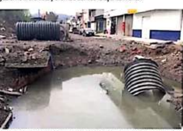
MORELIA, MICH.- Colonos exigen al presidente municipal de Morelia, Alfonso Martínez Alcázar, la reactivación y conclusión de la obra abandonada al término de la anterior administración.

Iniciada en diciembre de 2020 con el compromiso de concluir entre 5 a 6 meses, han pasado diez meses, ahora con trabajos interrumpidos por la conclusión del contrato de la constructora con el gobierno morenista y el arribo del nuevo ayuntamiento.