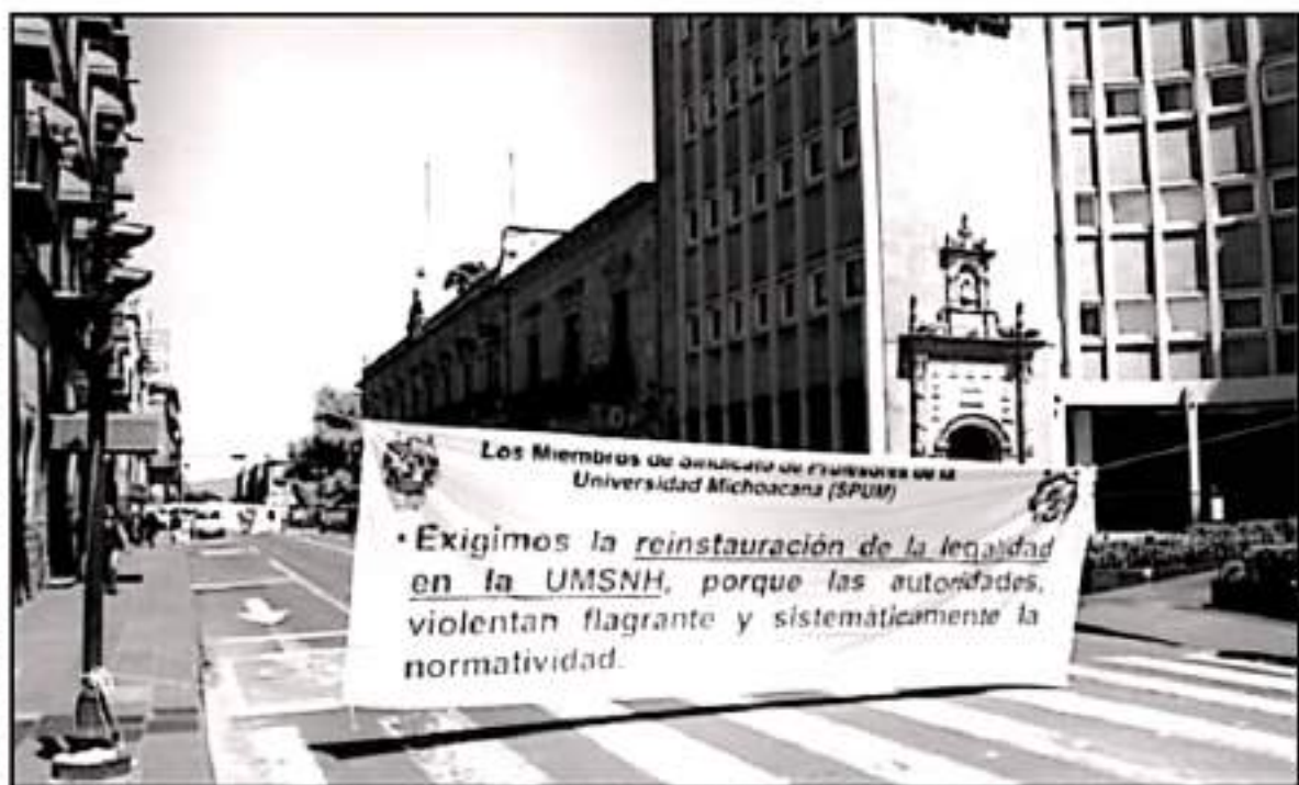
LARGA LUCHA MANTIENEN LOS DOS GRUPOS POR EL CONTROL DEL GREMIO QUE ESTÁ EN PUERTAS DE RENOVAR SU DIRIGENCIA EN NOVIEMBRE.

Manifiesto que precisamente el árbitro laboral, la Junta Local de Conciliación y Arbitraje, ha dejado muchos temas pendientes, no solamente del SPUM, sino