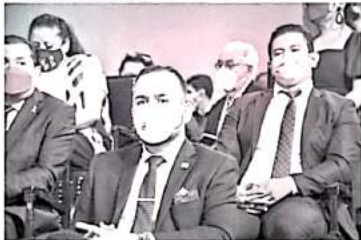
Celebro la propuesta hecha por el gobernador, Alfredo Ramírez, para hacer un ejercicio de austeridad en la administración y a la vez efficientar el gasto público.

"Estamos en la mejor disposición de revisar y enriquecer el acuerdo que envió el gobernador, no compartimos la idea de que en esta nueva era de gobierno se realice un ejercicio integral de austeridad y que se haga eficiente lo cual ha sido una demanda constante de nuestra gente en el estado", concluyó el diputado.