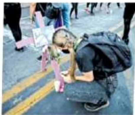
Por este feminicidio la Fiscalía del estado pidió la penal máxima

dad, Israel N. hizo saber sus derechos a guardar silencio.