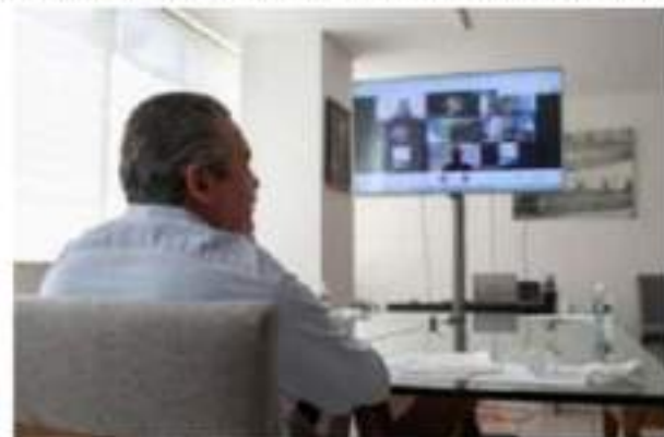
RMO desahoga audiencias con magistradas y magistrados del Tribunal Electoral, para defender derechos político-electorales de las y los michoacanos.

Se debe decir que el llamado permanente de la autoridad ha sido a que la población sea corresponsable y mantener sus entornos limpios, con acciones concretas como lavar, tapar, desinfectar y voltear cubetas, botes, llantas o envases, para evitar la proliferación del mosquito.