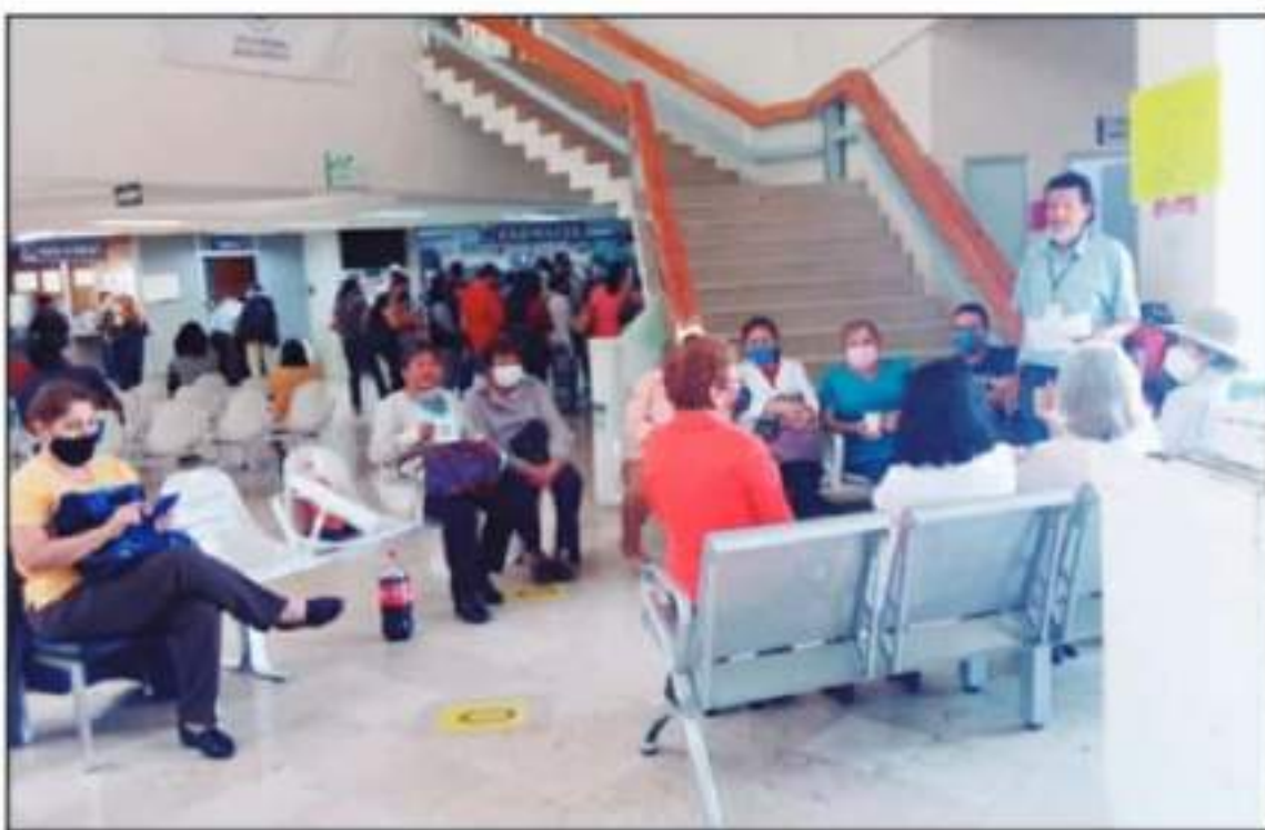
SINDICALIZADOS SEÑALAN QUE LA ATENCIÓN QUE SE DA A LOS DERECHOHABIENTES SE VE DAÑADA DEBIDO A LA PROBLEMÁTICA AL INTERIOR DE LA INSTITUCIÓN

mos las pruebas contundentes para responsabilizarla de la muerte de al menos tres compañeros sindicalizados que han fallecido tras contagiarse del coronavirus, así y probablemente en sus centros de trabajo, tras ser obligados a regresar a sus trabajos al día pasado cuando todavía no se procedió a inmunizarlos, sin embargo, la falta de empatía o sensibilidad, demuestra que no está capacitada para desempeñar dicho cargo.