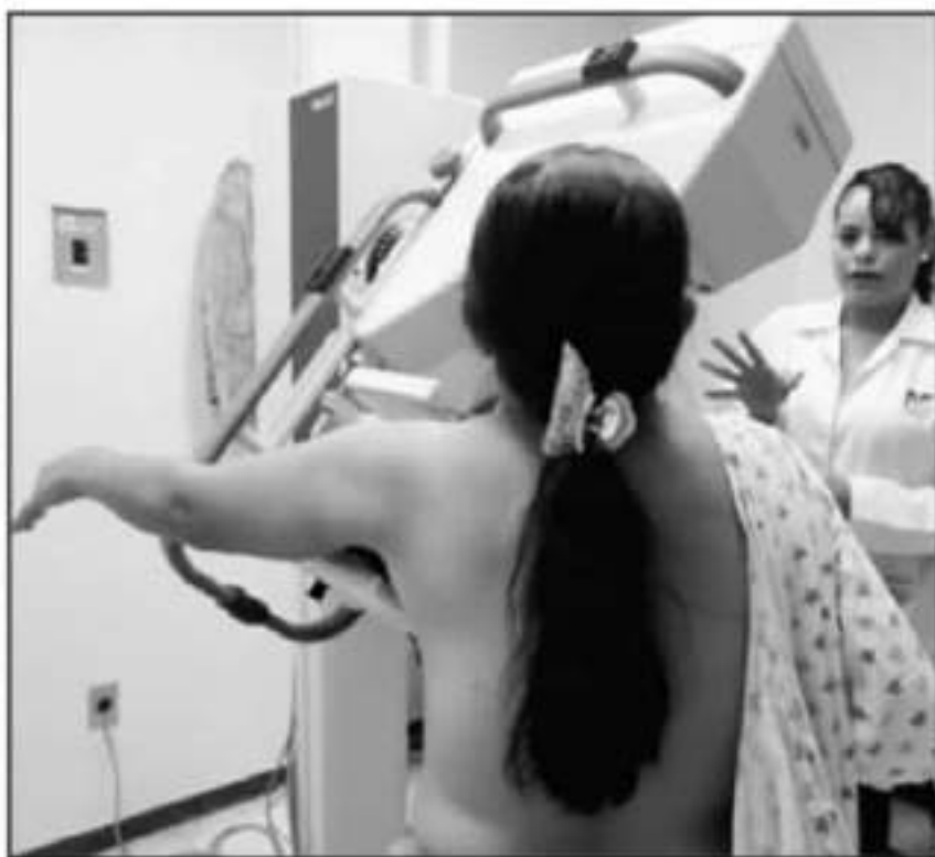
LA SECRETARÍA DE SALUD ENVÍA A MUJERES MAYORES DE 40 AÑOS A INICIAR A PRACTICAR LA MASTOGRAFÍA.

Puntualizó que una vez que sea realizada la mastografía, los resultados permitirán detectar casos sospechosos, lo que a su vez provocará que en lo inmediato se remita a un laboratorio especializado de la ciudad de Morelia a los pacientes para llevar a cabo los estudios posteriores y deslindar la etapa o avance