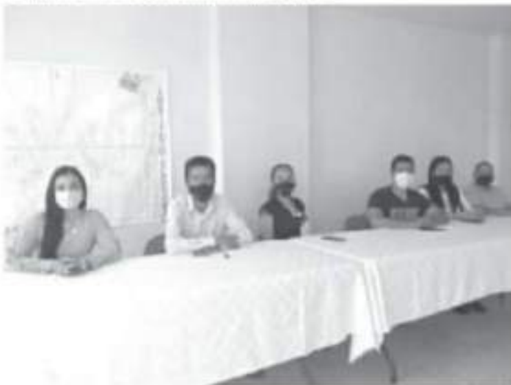
Se tuvo una buena cantidad de registros, más de 200 personas han dejado su documentación, de ellas se elegirán a 7 supervisores y 46 capacitadores electorales.

"La importancia de estas figuras es vital para el desarrollo del proceso electoral, ya que serán quienes darán la cara ante los ciudadanos", expresó.