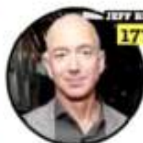
JEFF BEZOS 177 MIL MDD

Considerado el "rey del dólar", es la persona más rica del mundo por su rol en Amazon.com, gracias a un aumento de su rol en acciones en su fortuna, como resultado del alza de las acciones de Amazon.