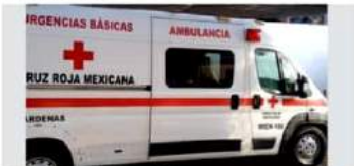
CD. LÁZARO CÁRDENAS, MICH.- Cruz Roja destaca necesidades en equipamiento para atención de emergencias.

Del mismo modo se busca que Cruz Roja tenga instalaciones para recibir pacientes con accidentes de traumas, cuando se presente un desastre, un choque de un camión con varios pasajeros, un avión, entre otros escenarios y que la institución pudiera ampliar su infraestructura hospitalaria para la atención de este tipo de emergencias.