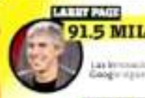
LARRY PAGE 91.5 MIL MDD

El fundador de Oracle aumentó su fortuna gracias a la subvaloración de las ventas.