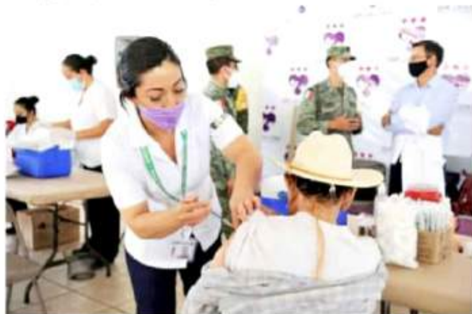
JACONA, MICH.- Ayer inició la aplicación de la segunda dosis de la vacuna contra el Covid-19, que se aplica a adultos mayores de 60 años.

Se estima que se concluya esta primera etapa de vacunación en los próximos días, por lo que tendrán oportunidad de acudir algún familiar del adulto mayor por la fecha a partir de las 8:00 de la mañana.