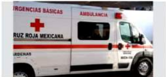
CD. LÁZARO CÁRDENAS, MICH.- Cruz Roja destaca necesidades en equipamiento para atención de emergencias.

Del mismo modo se busca que Cruz Roja tenga instalaciones para recibir pacientes con accidentes de traumas, cuando se presenta un desastre, un choque de un camión con varios pasajeros, un avión, entre otros escenarios y que la institución pudiera ampliar su infraestructura hospitalaria para la atención de este tipo de emergencias.