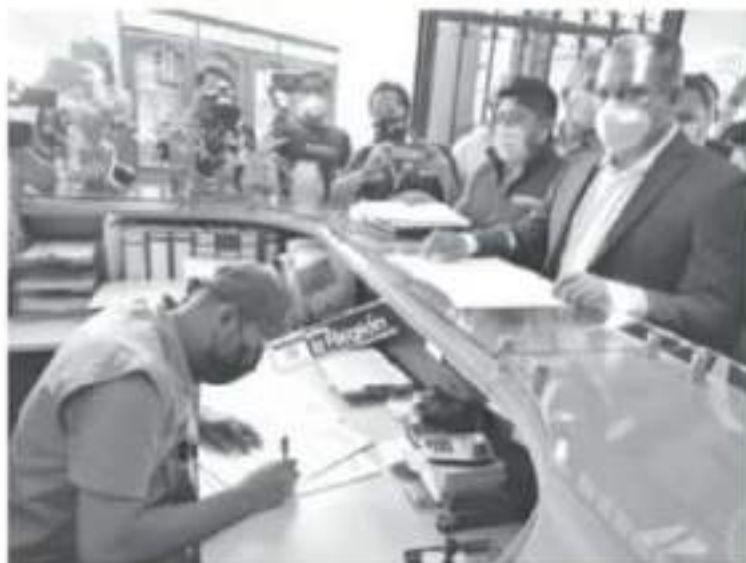
Se tomó una decisión que no permite tiempo a la resolución del Tribunal Federal Electoral, dado que se obligó a su partido a presentar a otro candidato en 5 días.