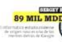
SERGEY BRIN 89 MIL MDD

Las innovaciones del cofundador de Google siguen moviendo al mundo.