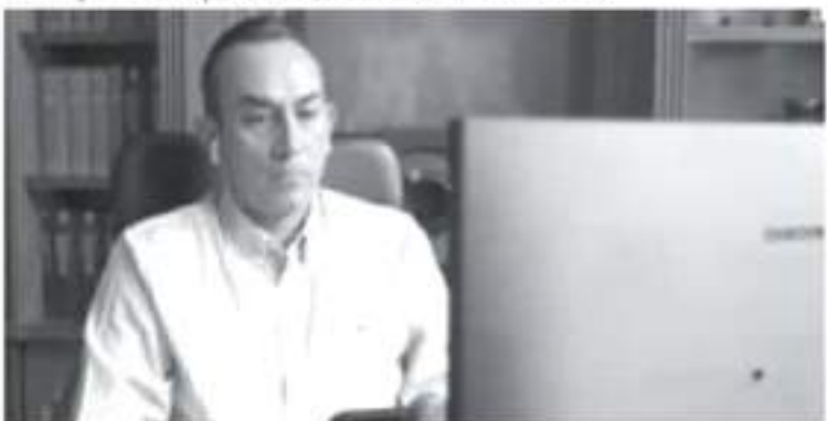
Todo:Esta manera de hacer política ha dejado bajos niveles de eficacia, promoviendo el debilitamiento institucional, el estancamiento económico y ha hundido al país en el subdesarrollo.

Además, en otra decisión un precedente, dijo, el INE previno la creación de mayorías artificiales en la Cámara de Diputados al hacer valer el límite de 8 por ciento a la sobrerrepresentación que establece el artículo 54 de la Constitución.