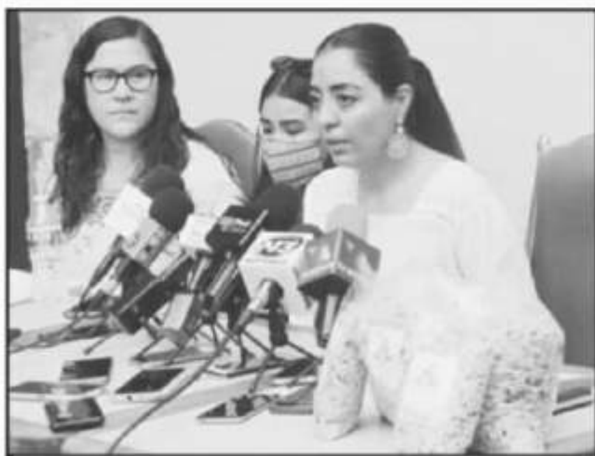
COLECTIVAS ORIGIN SE INVESTIGUE VIOLACIÓN DE UNA MENOR EN SANTA FE DE LA LAGUNA, AGRESORES AHÍ VIVEN.

mente. A pesar de los indicios y las investigaciones, los dos agresores de la menor siguen libres en la misma comunidad.