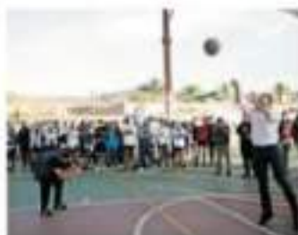
En materia deportiva, se comprometió a tener espacios seguros. / ISAAC CAJRAL

Me da un sentimiento muy positivo que tienen pensado votar en el proceso electoral, yo les invito a que voten, a que se sientan como dice la canción: "¿a qué se dedica el muchacho?". Tienen que ser como ha sido la vida de los candidatos, como ha sido su vida en familia, porque eso les dice mucho, de qué viven, lo que tienen de dónde viene, si han estado siempre metidos en el gobierno o no, si saben trabajar o no, si se saben ganar un peso en la calle o siempre han estado dependiendo de la obra del gobierno.