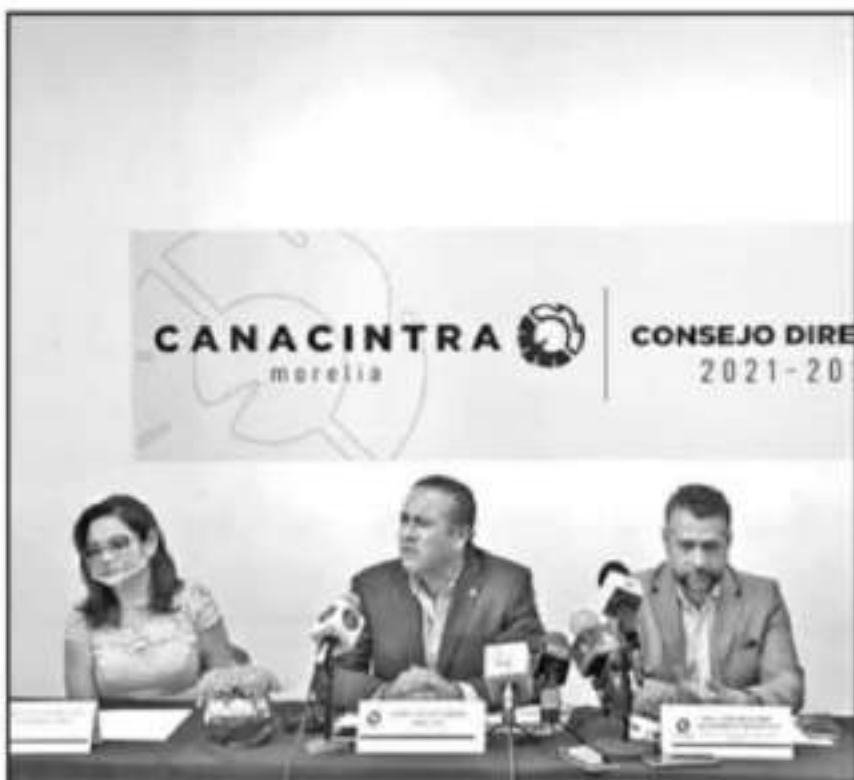
DIRECTIVOS DE LA CANACINTRA, ESPERAN QUE ESTE 2021 SEA MENOS COMPLICADO PARA EL SECTOR INDUSTRIAL.

La crisis por la pandemia nos ha afectado fuerte, aunque ésta no ha sido tan severa como con el sector de los servicios, como el restaurantero, hotelero y demás