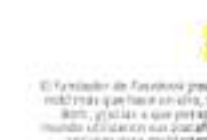
MARK ZUCKERBERG 97 MIL MDD

La fortuna del magnate se incrementó entre las más prósperas gracias a la subida de sus acciones en Microsoft, Capital National Railway y en fabricante de software Oracle & Company.