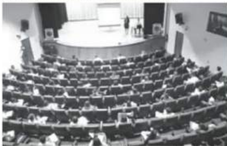
Esta capacitación será impartida de forma virtual a 90 aspirantes, quienes serán divididos en dos grupos, y que previamente cumplieron con los requisitos establecidos.

El programa académico contempla tres apartados: Formación Básica; Materias Complementarias; y Áreas de Desarrollo de Habilidades co-curriculares.