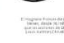
BERNARD ARNAULT 150 MIL MDD

Ocupa el puesto dos de los multimillonarios del mundo, luego del que de por sí, a los millones de dólares el monto del año pasado y que lo situaron en el lugar y del futuro. En el año, las acciones de Tesla, compañía que dirige, lograron un crecimiento exponencial de 70%.