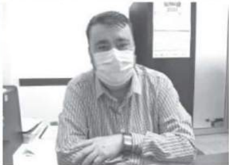
Durante el primer trimestre del año: enero, febrero y marzo, por ley se aplican una serie de descuentos para que el contribuyente se ponga al corriente, en abril se aplican recargos.

El horario en el que labora la dependencia, es de 8:00 de la mañana y a 3:30 de la tarde.