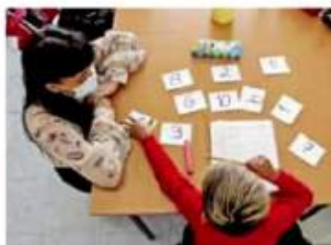
Deserción. En México, 5.2 millones de alumnos dejaron la escuela por la pandemia.

Señaló que antes del regreso debe haber una etapa diagnóstica de conocimiento para saber qué aprendieron los alumnos