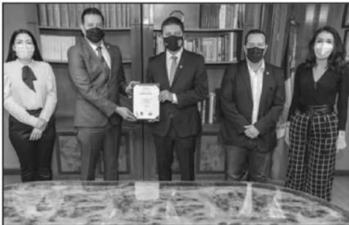
PIEZA LA ACREDITACIÓN LOGRADA POR LA FACULTAD DE VETERINARIA Y ZOOTECNIA, AUTORIDADES DE LA INSTITUCIÓN SEÑALAN QUE AUN HAY PENDIENTES.

Sin embargo, el funcionario afirmó que se identifican desafíos que se tienen que atender y que se requerirá un acompañamiento de las autoridades estatales que van con los