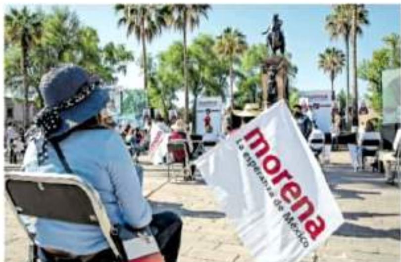
Los acuerdos fueron realizados en la sesión del Consejo Estatal de Michoacán celebrada el 24 de enero.

El TEEM determinó como inoperante el agravio de la aspirante a la alcaldía de Chinicuilta en contra del Comité Directivo Estatal