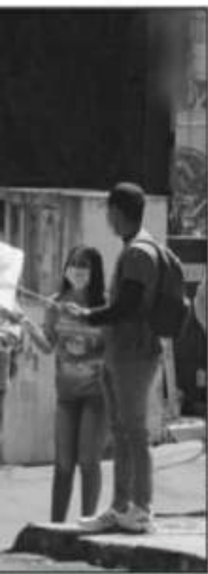
SI HUBO FUERAN ESPACIOS DE LA COVID-19.