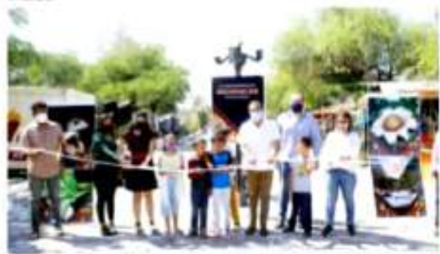
IXTLÁN DE LOS HERVORES, MICH.- La exposición fotográfica "Riqueza Natural de Michoacán", fue instalada en el Parque Ecoturístico Génesis.

"La diversidad de especies, ecosistemas y paisajes atrae al turismo y fomenta el crecimiento económico, si gestionamos de manera sostenible el sector turístico, contribuiremos de manera significativa a proteger la flora y la fauna, incluso a aumentar las poblaciones de determinadas especies claves, además de concientizar acerca del valor de la biodiversidad a través de las actividades turísticas", finalizó.