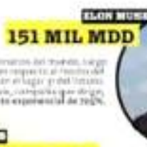
ELON MUSK 151 MIL MDD

Considerado el "rey del dólar", es la persona más rica del mundo por su rol en Amazon.com, gracias a un aumento de su rol en acciones en su fortuna, como resultado del alza de las acciones de Amazon.