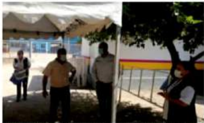
CD. LÁZARO CÁRDENAS, MICH.- Sin contratiempos, en Las Guacamayas inició la segunda jornada de vacunación contra el Covid-19.

■ Se estima que en 10 días concluya la segunda jornada