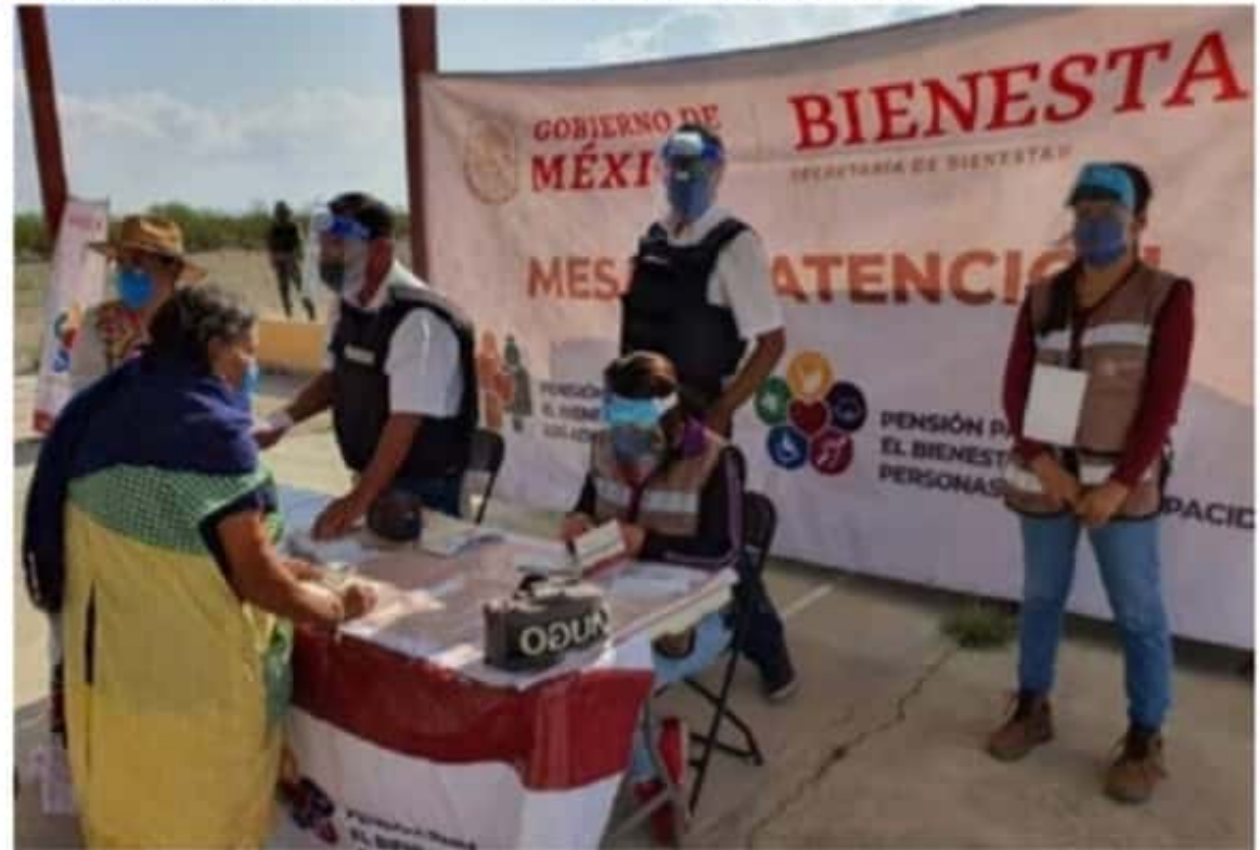
Programas sociales no serán utilizados con fines político-electorales.

tento jurídico al Programa de Blindaje Electoral, así como material didáctico descargable con información sobre los delitos electorales.