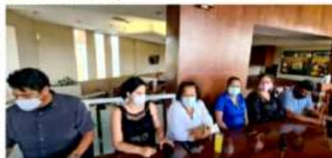
CD. LÁZARO CÁRDENAS, MICH.- Aspirantes a la alcaldía por Morena mostraron molestia ante la falta de claridad de la encuesta a la legislatura local y presidencia municipal, solicitando al dirigente nacional atienda y resuelva en esta ciudad los problemas.

"Queremos claridad desde el nacional para esas encuestas, que sean transparentes y nos den la oportunidad de participar y si perdemos sumarnos a las campañas en busca de fortalecer la Cuarta Transformación", finalizaron.