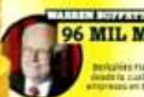
WARREN BUFFETT 96 MIL MDD

El fundador de Facebook pasó a 4 mil millones de dólares, el más alto de todos los que se han registrado en el mundo gracias a sus ganancias de redes sociales para multimedios en contacto.