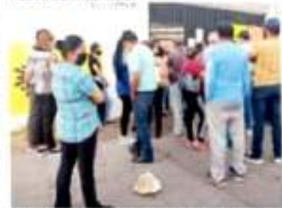
MORELIA, MICH.- Varias personas, vecindados de la colonia ejidal Isaac Arriaga, respondieron con una manifestación en contra y acusaron de intereses fraudulentos a la Convocatoria de Asamblea para la renovación del Comisariado de ese asentamiento.