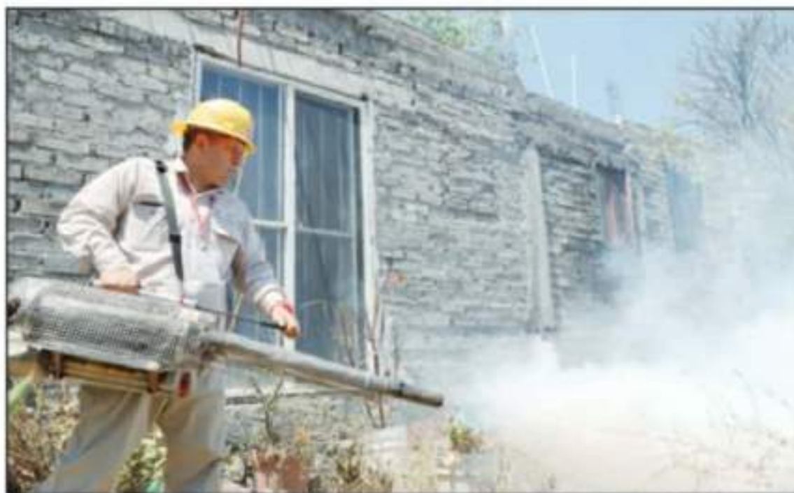
AUTORIDADES DE SALUD TRABAJAN PARA CONTINUAR MANTENIENDO AL DENGUE BAJO CONTROL Y EVITAR REPUNTES CASOS EN ESTA TEMPORADA DE CALOR.

Los datos de la Dirección General de Epidemiología, señalan que 29 casos fueron clasificados como dengue simple, cuatro como dengue con signos de alarma, pero hasta la fecha no se han tenido