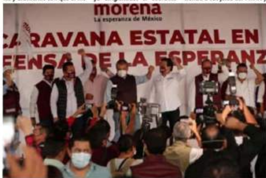
Respaldó Mario Delgado restitución de candidatura de Raúl Morón para consultar la 4T en Michoacán.

Anunciaron que ella aceptó con la misma idea, impulsar un proyecto que saque a Lázaro Cárdenas adelante, sin rebatidas políticas, siendo que la planilla que llamaron de rendimiento y competitiva, la presentarán este miércoles al PAN estatal, para el jueves ante el Instituto Electoral del Michoacán (IEM) solicitar su formal inscripción al proceso electoral.