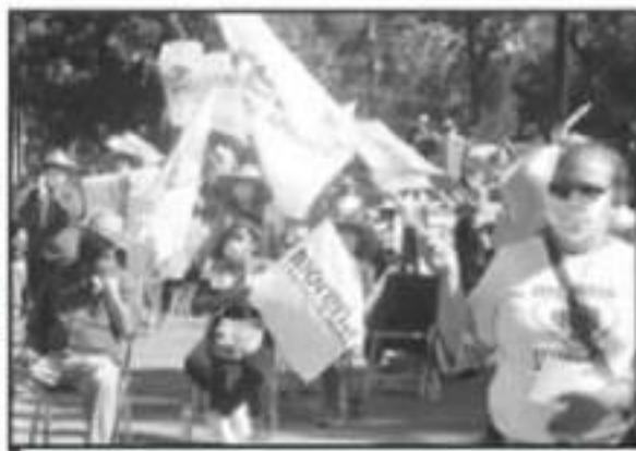
AFOROS NO PERMITIDOS, TEMA QUE DEBEN ATENDER LAS AUTORIDADES.