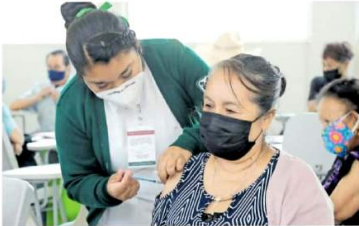
En Ixcama y Huatamo se recibieron el pasado 25 de febrero lotes de vacunas de Pfizer-BioNTech, con lapso de aplicación de entre 21 y 42 días.