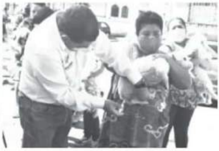
El año pasado la campaña se realizó del mes de agosto a diciembre y en total se aplicaron más de 7 mil dosis, lo que se traduce en una buena aceptación por parte de la población.

Como ya se había dispuesto, durante el desarrollo del programa, se visitarán lugares que no se visitaron el año pasado, las mascotas que ya se vacunaron, no recibirán la dosis, sino hasta el siguiente como reforzamiento. En esta campaña se van a enfocar con las mascotas que no han recibido el biológico.