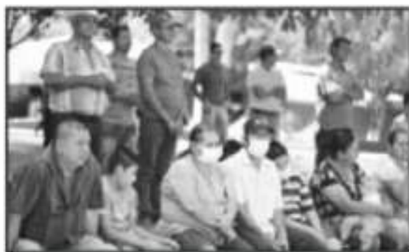
PERSONAS QUE NO PORTAN CLASIFICACION, UN RIESGO EN EVENTOS POLÍTICOS.