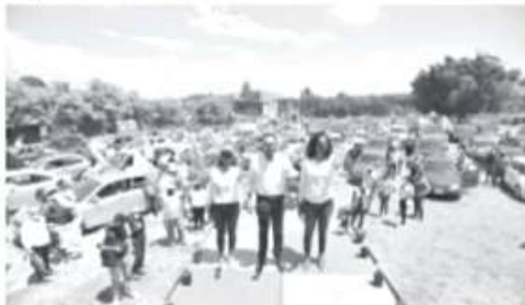
"Podríamos haber llenado estadios, pero somos seres humanos responsables, que estamos de lado de la ley. Hemos cumplido con lo que dicen los requisitos en todo momento".

*El candidato del Equipo por Michoacán destacó su interés de buscar un acercamiento con los ciudadanos, siempre acatando las medidas sanitarias.