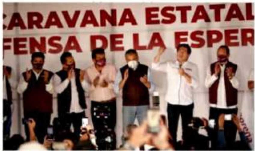
MORELIA, MICH.- Mario Delgado Carrillo, dirigente nacional de Morena, afirmó que "No nos vamos a dejar, vamos a pelear por los derechos políticos de Raúl Morón".

inicio a la Caravana Estatal en Defensa de la Esperanza, un acto de resistencia civil y pacífica que se pensó para blindar la democracia de Michoacán, rumbo a la jornada electoral del 6 de junio.