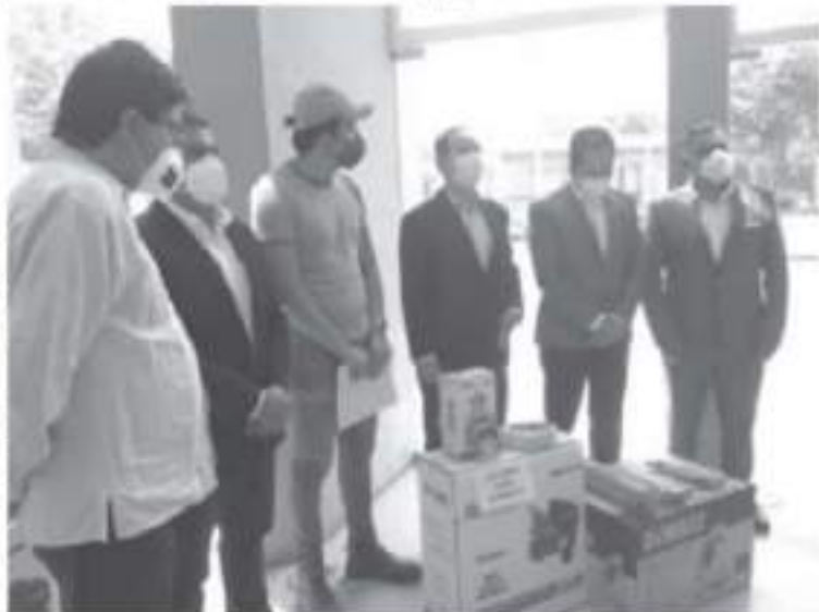
Desde 2016, un total de 150 microempresas de Zitácuaro han recibido beneficios de este programa. La inversión ha sido cercana a los 2 millones 600 mil pesos.

Vargas Ortega, precisó que por el tema, el INE no está facultado para sancionar a quienes no acaten estas recomendaciones sanitarias, de esto estarán como responsables, el comité de salud o alguna autoridad local. En este sentido, convocó a candidatos a actuar de forma responsable y privilegiar el tema de la salud, ya que durante las campañas hay varios motivos de riesgo que su equipo debe tomar en cuenta y tomar las medidas adecuadas para reducir el peligro.