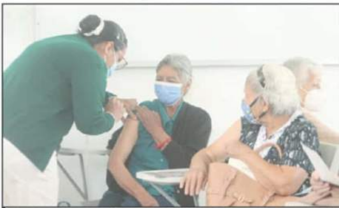
SE ESPERA QUE EN ESTE MES SE DEBE CONCLUIVA LA PRIMERA ETAPA DE VACUNACIÓN CONTRA LA COVID-19 QUE CORRESPONDE A ADULTOS MAYORES DE 60 AÑOS.

"Cabe destacar que el Gobierno de México emitió el pasado nueve de marzo a Lázaro Cárdenas y Ciudad Hidalgo, va-