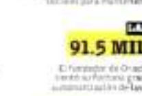
LARRY ELLISON 91.5 MIL MDD

Incluso Berkshire es la corporación más rica del mundo, la cual el magnate controla.