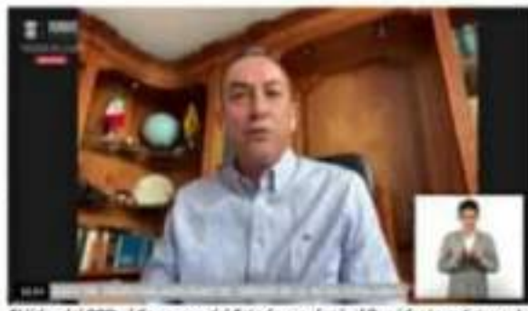
El líder del PRD en el Congreso del Estado emplazó al Presidente a detener la destrucción de las instituciones y dar un giro a la política asistencialista.

En MORENA, lo estaban manejando todo en lo obscuro, pues no quieren que los militantes y simpatizantes de la 4T sepan que la prezisa favoreció a sus más allegados con las candidaturas a regidores y a síndico, ahora sí se aseguró que de que sean gente leal a ella y que no se la vayan a pasar focalizándole la cuenta pública, a ella no le importa que los diferentes equipos de Morena en esta ciudad no la apoyen, ya dijo que no los ocupa, que ni agua les ha de dar. Aquí lo malo, es que muchos de esos equipos se pueden dar