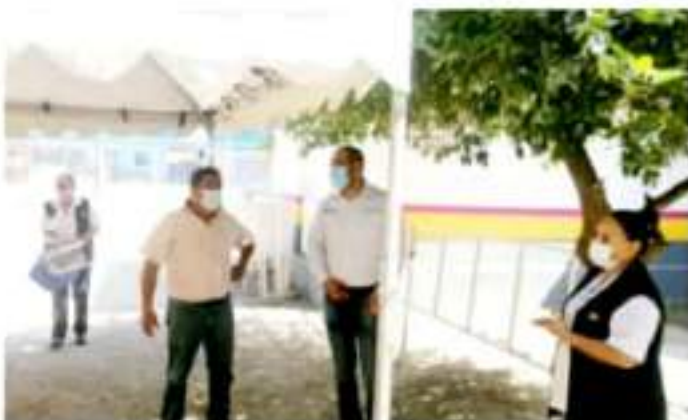
CD. LÁZARO CÁRDENAS, MICH.- Sin contratiempos, en Las Guacamayas inició la segunda jornada de vacunación contra el Covid-19.