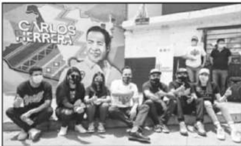
HERRERA TELLO DESTACÓ QUE EL DEPORTE Y LOS JÓVENES DEBEN SER PARTE CLAVE DE LA AGENDA DE TODO GOBIERNO.

Agregó que el deporte da fortaleza física y mental, incluso fortalece el sistema inmunológico de las personas frente al coronavirus y otras enfermedades. Subrayó, asimismo, que el deporte en todas sus ramas será parte fundamental de su gobierno.