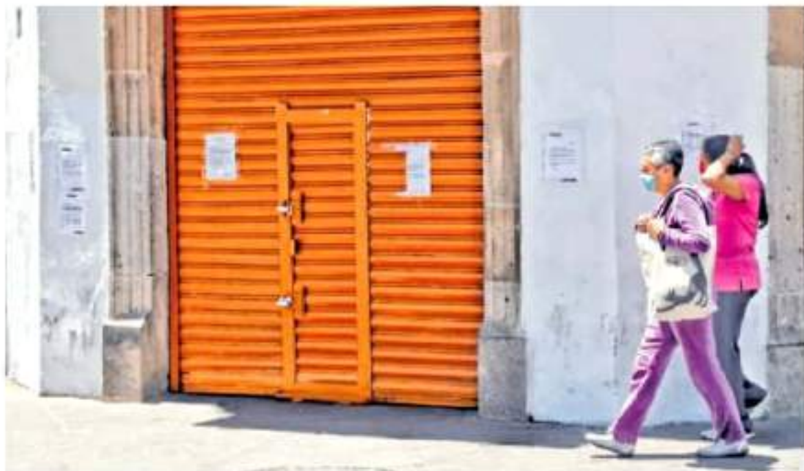
Menos del 1% de los comerciantes del Centro de Morelia se llegaron a ver beneficiados.