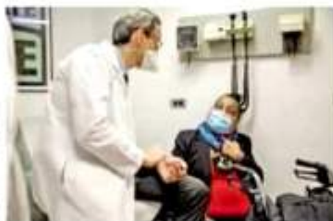
Tratamiento. Previamente la opción era extirpar secciones dañadas o reemplazarlas con prótesis.

"Hemos estado hablando durante 100 años sobre trasplan-