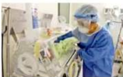
Riesgo. No existen estudios que demuestren que vacunar a esta población es seguro para la madre y el bebé.

En el marco del Día Mundial de la Salud —que se conmemora este 7 de marzo—, las cifras cobran relevancia por las ciudades que se deben intensificar para evitar contagios entre este sector de población. Esto, porque aún no se cuenta con una vacuna que se les pueda aplicar para prevenir la infección al virus SARS-CoV-2.