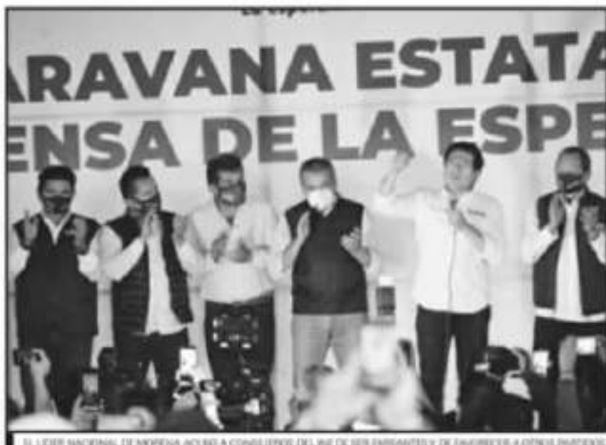
EL LÍDER NACIONAL DE MORENA ACUDIÓ A CONSTITUIRSE DEL INE DE SER ENRIQUETOS Y DE INGRESAR A OTROS INGRESOS.

Con micrófono en mano, el exlíder parlamentario de Morena