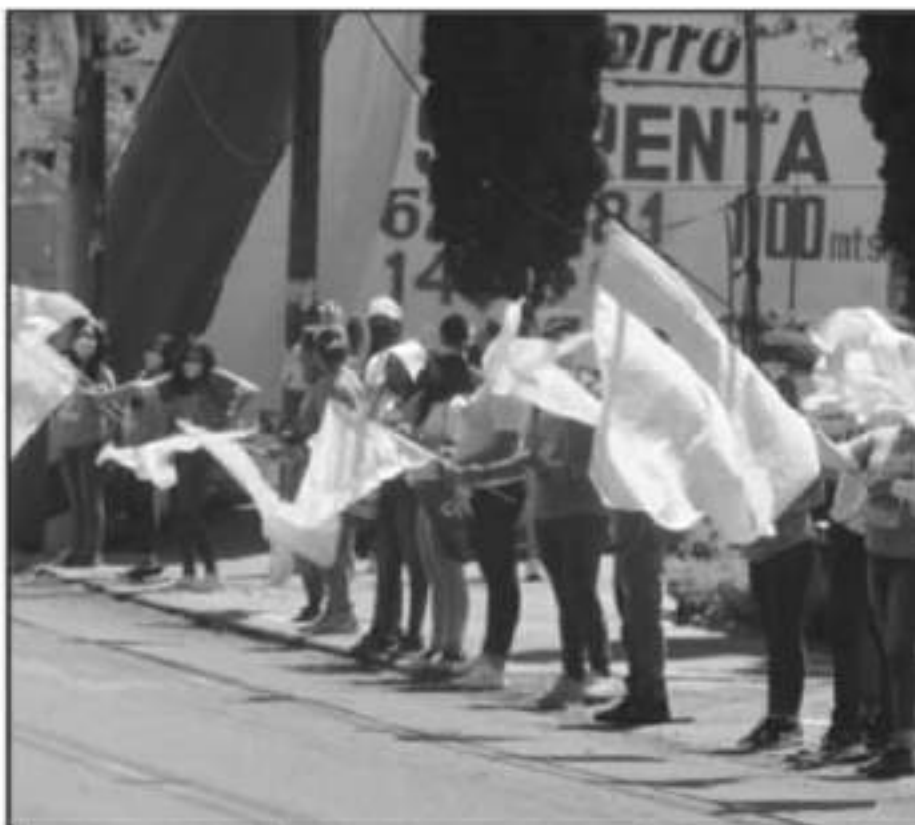
AL DESPUNDO LAS CAMPAÑAS POLÍTICAS SE OBSERVA UN ALTO PRECIO SANITARIO AL NO CUMPLIR CON LAS MEDIDAS ADECUADAS

Es importante recordar que la mayoría de los partidos (salvo Morena y el PT) firmaron un Protocolo Sanitario para el Proceso Electoral, que incluye las acciones preventi-