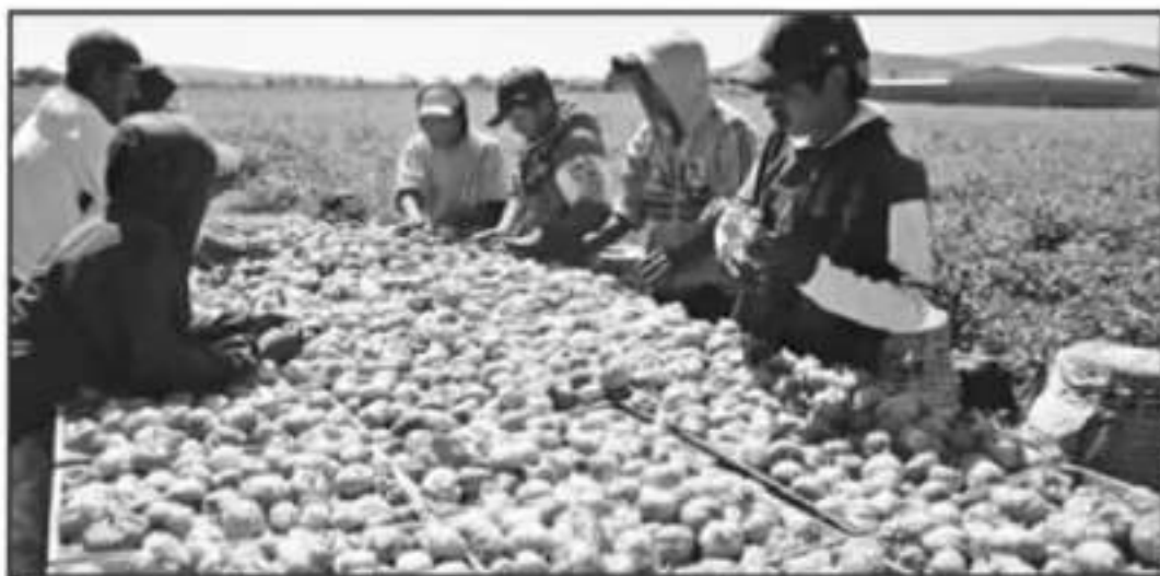
ANTE LA OJEDA DE LA PANDEMIA, DEPENDENCIAS APOSTARON A LA CALIDAD DE LOS PRODUCTOS DEL CAMPO EN EL ESTADO