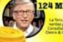
BILL GATES 124 MIL MDD

El magnate francés de artículos de lujo se ha beneficiado de la venta de sus acciones de LVMH - propietario de las marcas Louis Vuitton, Christian Dior y Sephora - logrando un incremento de 60%.