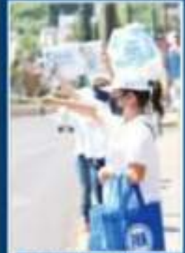
LOS PROTOCOLOS BÁSICOS HAN QUEDADO EN EL OLVIDO

“El protocolo sanitario quedará como un documento de revisión permanente dependiendo de cómo evolucionen los contagios, siempre destacando el seguimiento de las medidas sanitarias que tienen que ver con la responsabilidad plena asumida por los actores políticos y las instituciones, siempre garantizando la participación de las y los michoacanos en el proceso electoral con el pleno uso de sus derechos políticos”, refirió el funcionario.