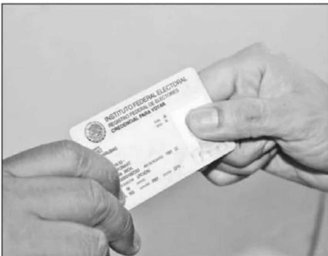
EL 01 DISTRITO ELECTORAL DE MICHOACÁN INFORMÓ SOBRE EL AVANCE DE LA CREDENCIALIZACIÓN EN SEGUIMIENTO A LOS TRÁMITES DE LA CAMPAÑA ANUAL.

Con los movimientos realizados al padrón electoral y la lista nominal, con corte al 25 de febrero, se tiene que en Artega hay un cumplimiento del 99.43