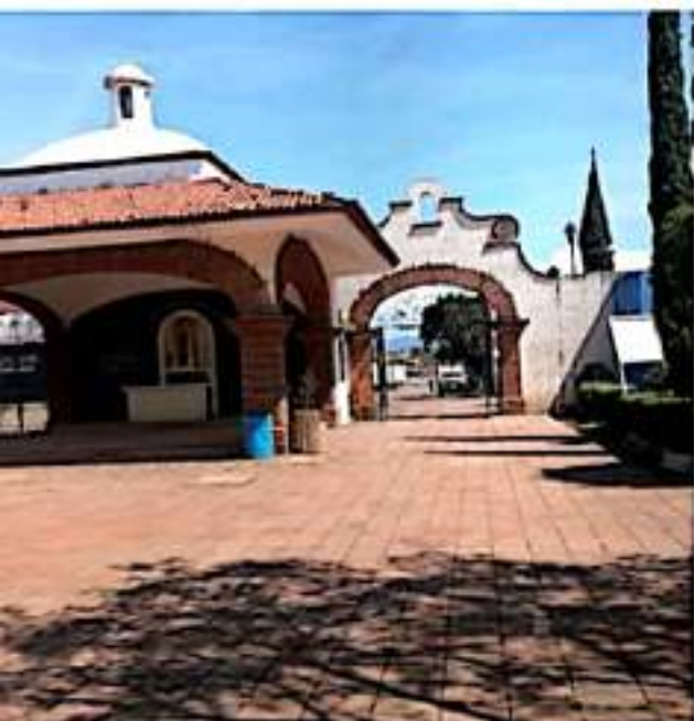
JACONA, MICH.- El próximo viernes 15 de octubre arrancarán formalmente con las acciones que estarán coordinadas con la Dirección de Aseo Público y Parques y Jardines y la administración del Panteón Municipal.

Por instrucción del alcalde Isidoro Mosqueda, estarán reforzando las medidas preventivas contra Covid dentro del cementerio para evitar contagios dentro del lugar por lo que el personal de Protección Civil estará vigilante de que los visitantes tengan el cubrebocas bien colocado y cuidarán que no haya aglomeraciones para evitar situaciones de riesgo.