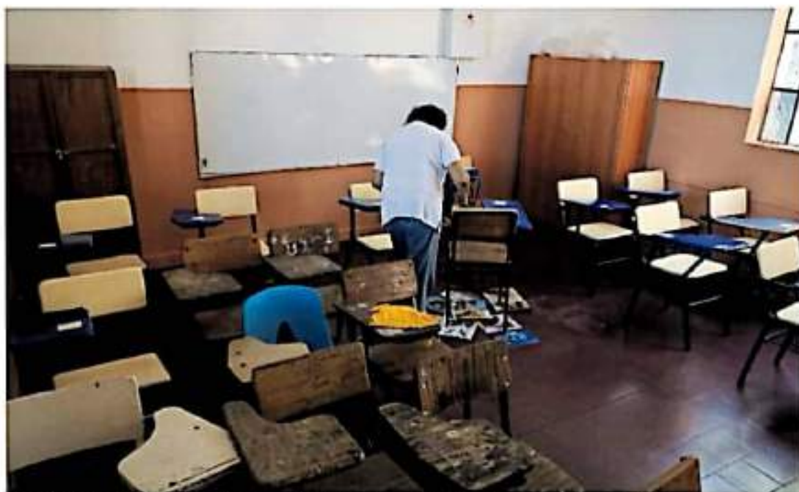
En Michoacán alrededor de 300 mil alumnos de nivel medio superior y superior regresaron a clases presenciales

ESTÁ ENTRE LAS ENTIDADES CON MENOS ALUMNOS EN AULAS