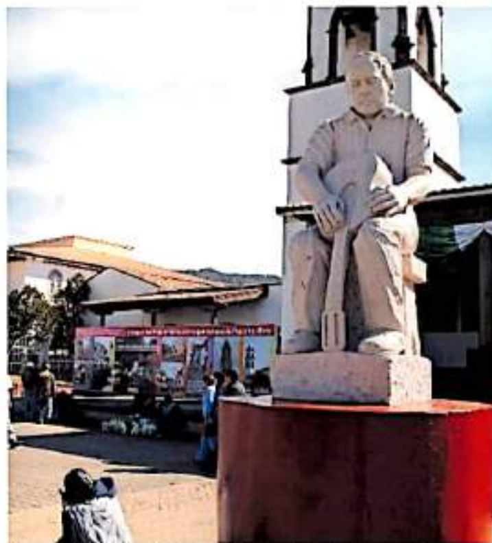
Este proyecto contempla mejorar la imagen de los pueblos.

A decir del director de Educación, Cultura y Fomento Turístico de Paracho, ya comenzaron por su cuenta a indagar sobre el programa.