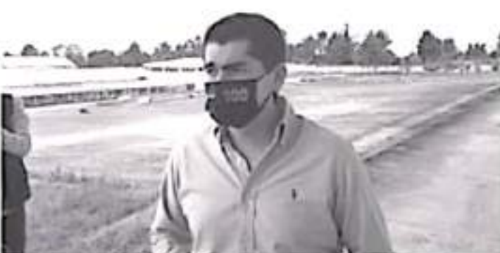
Daremos cumplimento a ser la nueva ruta económica de Michoacán que hemos dicho dentro del Gobierno de las Soluciones.