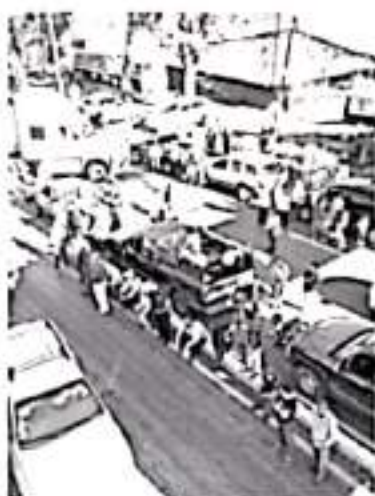
El 12 de octubre para los comunidades indígenas se conmemora el Día de la Dignidad, Resistencia y Lucha Indígena, día en que recuerdan la lucha de sus antepasados.

TERUNJASKUA K' OIA, ECHERIKA JURAMUKUA IAMENTU IRETECHANI JUSTICIA, TERRITORIO Y AUTONOMÍA PARA LOS PUEBLOS ORIGINARIOS. CONSEJO SUPREMO INDÍGENA DE MICHOACÁN (CSIM)