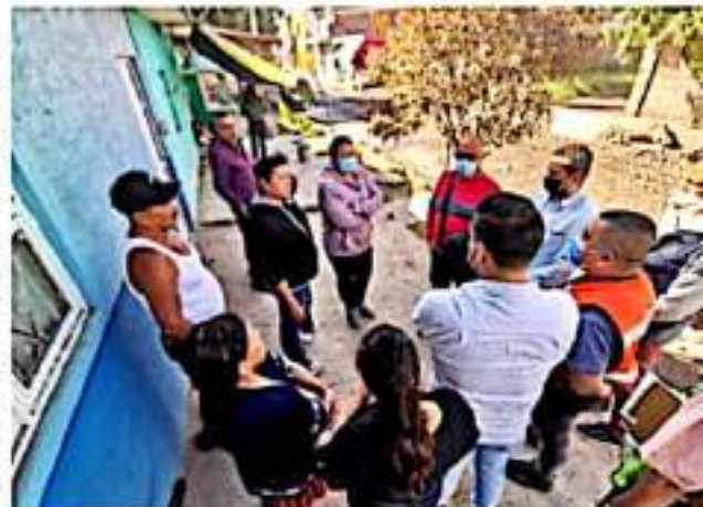
ZAMORA, MICH.- Autoridades escucharon los planteamientos de los residentes de la zona y explicaron que el principal problema del deterioro y hundimientos del cuerpo vial es el colapso de la línea general de drenaje.

Informaron a los vecinos de la colonia, que para subsanar los encharcamientos y prevenir problemas de salud entre los ciudadanos a consecuencia