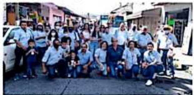
URUAPAN, MICH.- Como una forma de agradecer los favores recibidos durante todo el año, directivos de Tata Lázaro acudieron a la parroquia de Nuestra Señora de Guadalupe.