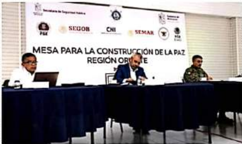
CITÁCUARO, MICH.- Los alcaldes de la región Oriente expresaron al titular del Ejecutivo de Michoacán su interés en trabajar juntos para fortalecer la confianza del visitante en destinos turísticos.

Al respecto, Alfredo Ramírez adelantó que en próximas fechas se reunirá con presidentes municipales para darles a conocer la propuesta de su gobierno en materia de coordinación para la construcción de la paz.