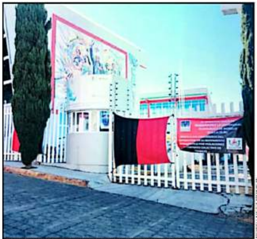
ALGUNAS ALÍNE FALTAN POR CUBRIR OTROS PENDIENTES, TRABAJADORES Y DOCENTES VOLVERÁN A SUS ACTIVIDADES

Así mismo, agregó que existen temas pendientes también