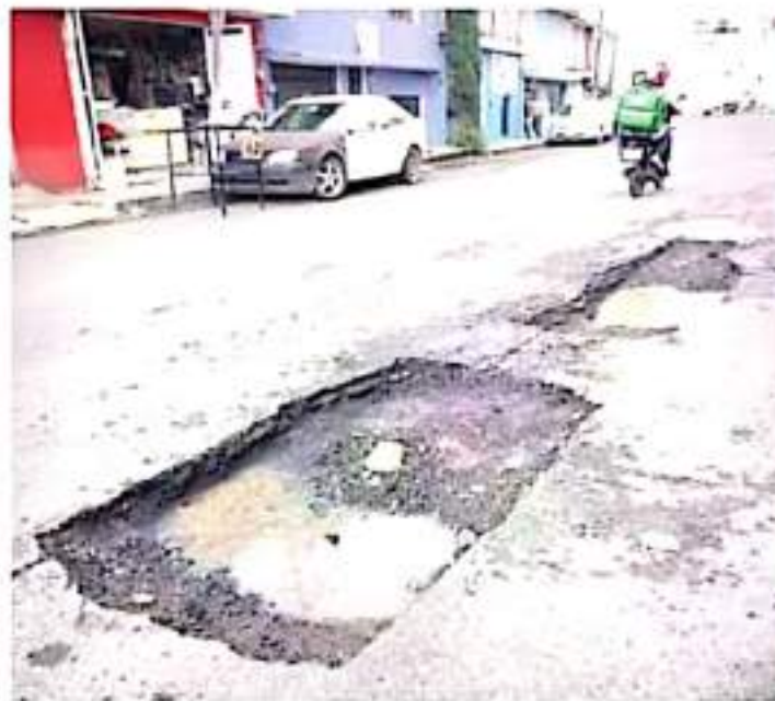
Ciudadanos. "Hay baches por todos lados", señalan automovilistas y ciclistas. https://www.14.mx

las avenidas Michoacán, Amalia Solerzano, Pedregal, Madero Ponce y División del Norte; además de calles en colonias y fraccionamientos como Jesús Romero Flores, Nicolás Ilustre, Felipe Carrillo Puerto e Industrial.