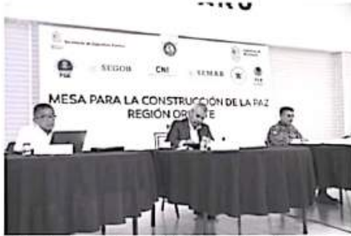
El gobernador dijo que no obstante, también se debe atacar la inseguridad desde sus causas sociales, por lo que subrayó la importancia de impulsar las vocaciones productivas para reactivar la economía.

Zitácuaro, Michoacán, 12 de octubre del 2021* - El gobernador Alfredo Ramírez Bedolla, junto con titulares de fuerzas federales y estatales de seguridad, instaló la Mesa para la Construcción de la Paz en la Región Oriente, donde se acordó con presidentes municipales trabajar en coordinación a favor del bienestar de la