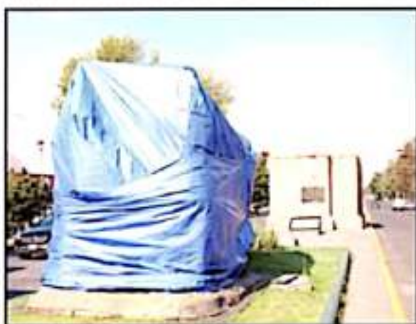
CIERRERON MONUMENTO DE LOS CONSTRUCTORES Y SOBREVIVÓ LA FECHA