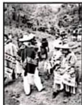
WANDANÍA DEPENDIENDO CRISTERNOS

Ese no es el camino entre quienes se dicen defensores de los pueblos originarios. “Es necesario que esas expresiones artísticas se conserven, pero siempre y cuando se de paso a la crónica objetiva de lo que ocurrió en aquellos siglos en este y otros