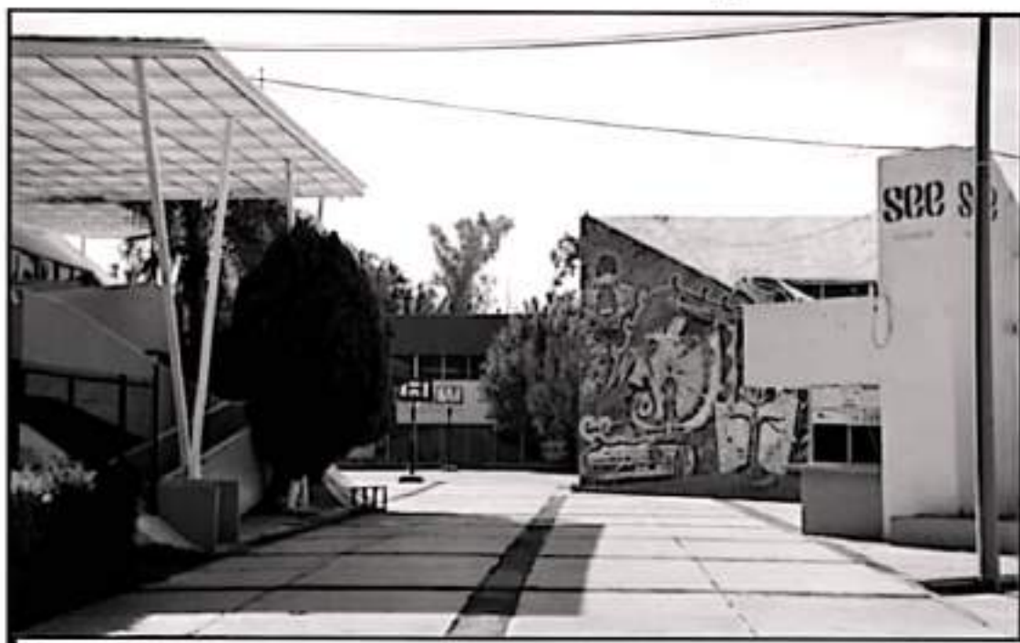
EN CUANTO AL REGRESO PRESENCIAL A LAS OFICINAS CENTRALES, SE SALIÓ QUE SE DAVAN CUANDO SE CUMPLAN PAGOS Y SE ASIGUREN PRECONDICIONES

gobernador Alfredo Ramírez Bedolla permita otorgar los espacios a ciertas personas está bien pero no quieren tener conflictos con ninguno de los funcionarios y su nuevo personal, asimismo no se trata de que se pinte de colores (de Morelia) la SEE.