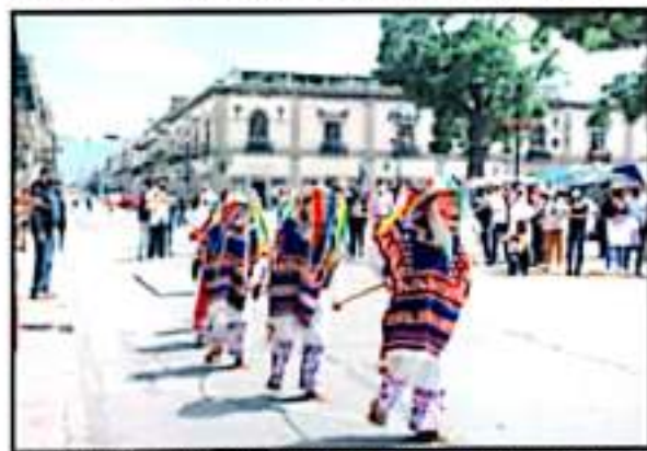
LA MANIFESTACIÓN EN LA AVENIDA MADRO TUVO UN TOQUE DE TRADICIÓN