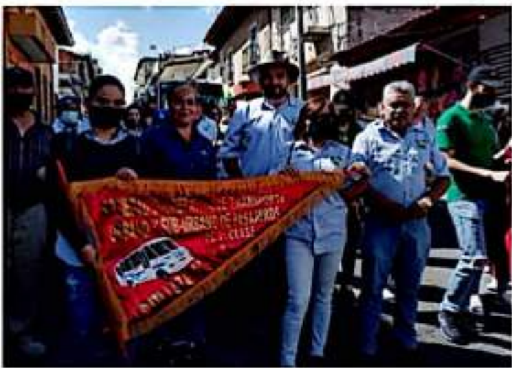
URUAPAN MICH.- Directivos de la Cooperativa Tata Lázaro, conmemoraron la coronación de la Virgen de Guadalupe participando en la va traidicional al peregrinación.