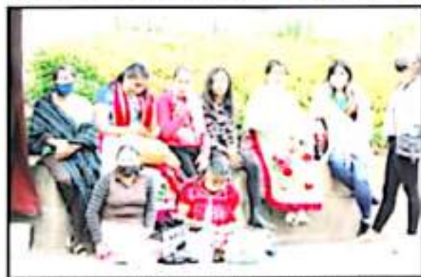
EL PEQUÍ CALLE A MÁS DE 100 MIL HABLANTES INDÍGENAS EN MICHOACÁN