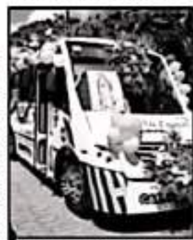
TRANSPORTE ESTAS HACEN CARAVANA

territorios que reclamó la Corona Española. Rechazar todo lo que implica el rescate de aquel largo episodio con altas dosis de barbarie permite abundar en el rescate pleno de la cosmovisión que le pertenece a cada etnia sin que ello implique romper o alterar la relación armónica que exigen los nuevos tiempos, preservar el respeto del uno al otro es el camino para el fortalecimiento de la identidad de los pueblos en la actualidad”.