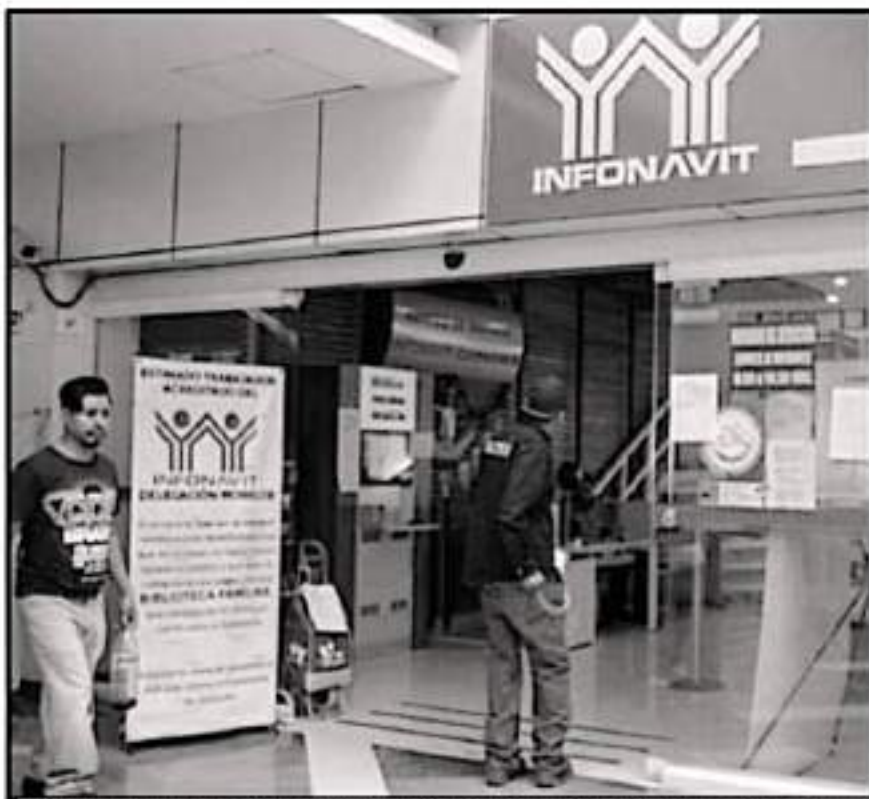
DESTACA DELEGADO ESTATAL QUE REFORMAS Y VARIEDAD DE PRODUCTOS HAN AFECTADO LA VIVIENDA A MICHOACANOS

con las reformas se puede solicitar un crédito con solo seis meses trabajando, además de que se pagan en pesos, por lo que los pagos y los cobramientos son claros desde el principio del crédito y el costo no puede subir. “Son créditos que en el caso de las compras de viviendas usadas o nuevas tienen una duración de aproximadamente 27 años y que se puede reducir su tiempo con la puntualidad y los montos de pagos”, refiere. Sobre la meta anual de asignación de créditos, apunta que andan con un 92 o 95 por ciento de los objetivos mensuales, por lo que continúan en contar con buenos números el año