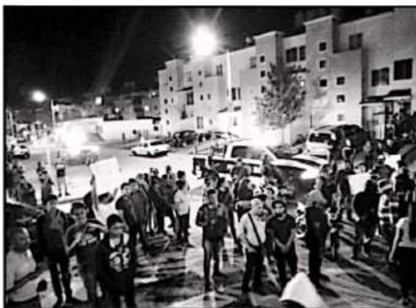
CAJAVEZ ES MÁS RECURRENTE LA VIOLENCIA EN VILLAS DEL PEDREGAL, LOS LADRONES NO PAGAN Y NADIE HACE ALGO