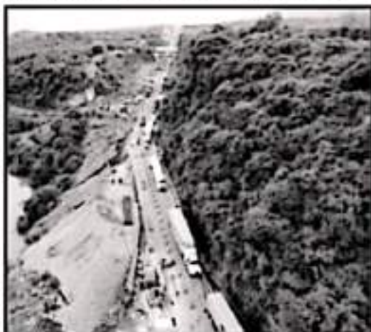
SE RECALCÓ QUE LOS CONSTRUCTORES MICHOACANOS SE ENCUENTRAN EN CONDICIONES DE COMENZAR A TRABAJAR EN BENEFICIO DEL ESTADO.

CONSEJO INTERRELIGIOSO DEL ESTADO DE MICHOACÁN.