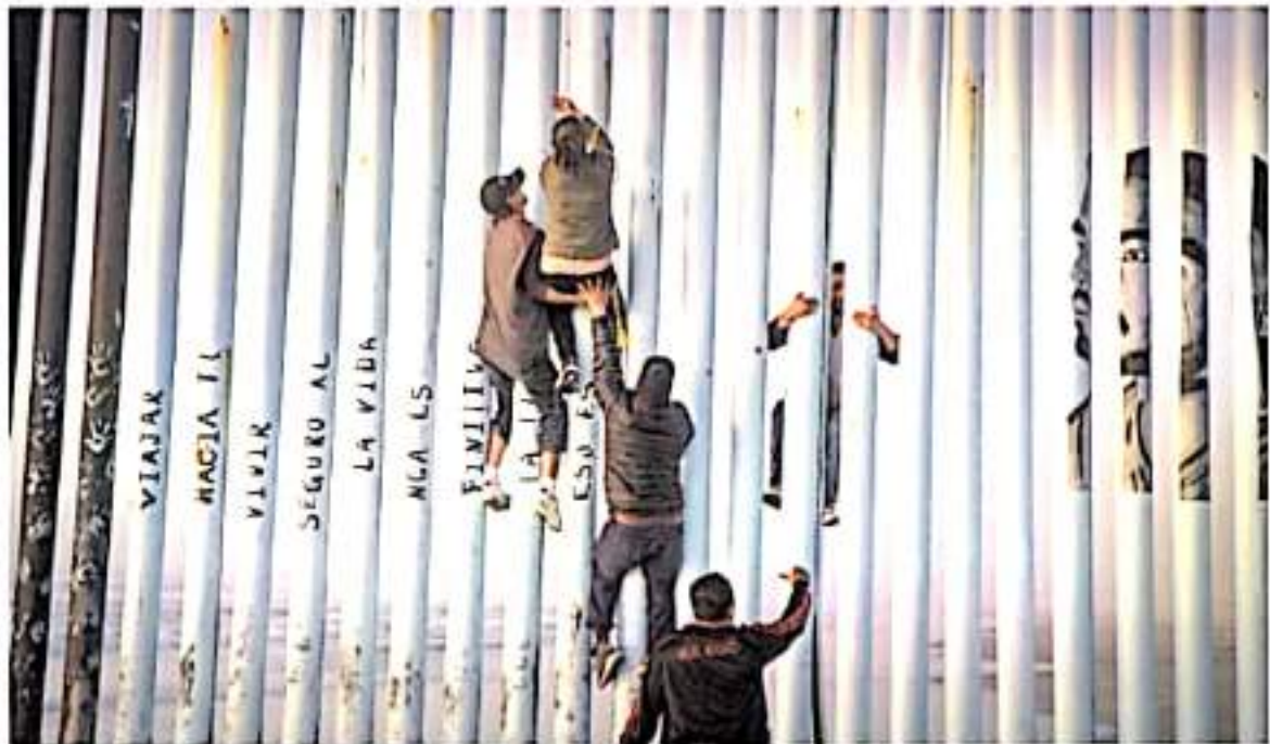
Entre los desplazados hay familias completas, el 30% son niños y adolescentes menores de edad.