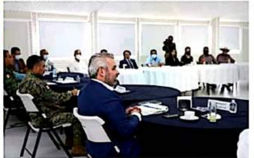
El gobernador Alfredo Ramírez Bedolla, instaló ayer la Mesa de Seguridad de la Región Oriente de la entidad.