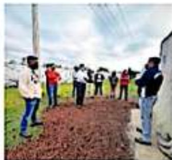
7 de cada 10 estudiantes acuden de 1 a 2 días a las aulas.

Aunque no se tiene un conteo total, pues la apertura de los planteles a la fecha ha sido escalonada, la Dirección de Servicios Regionales de la Educación cuenta con un reporte de 50 centros educativos que regresaron a clases.