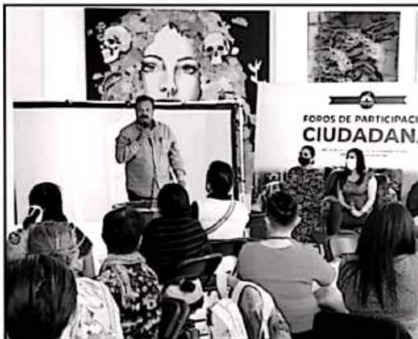
SE ASESORÓ QUE LOS FOROS SON PARA ENSEÑAR LAS DEMANDAS DE LA POBLACIÓN Y A LA VEZ DARLES SOLUCIÓN.

petan, aclaró, que debido a la pandemia por la COVID-19, se tendrá un aforo controlado, por lo que, será un máximo de 40 personas las que participen.