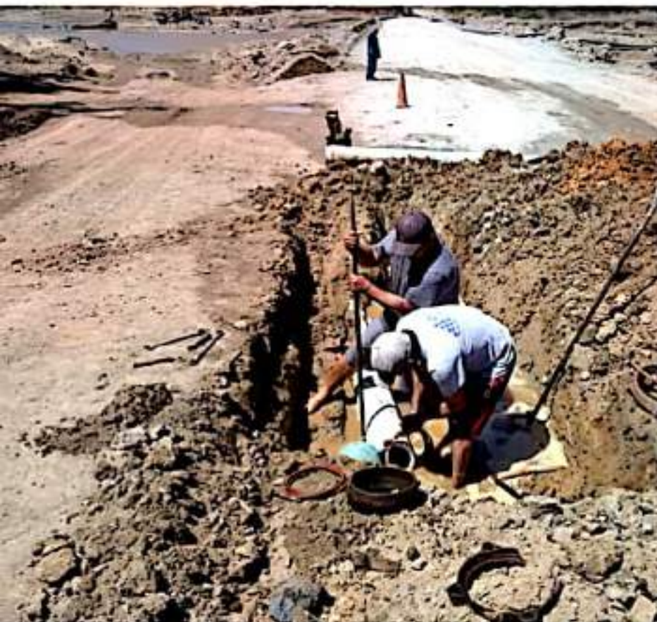
CD. LÁZARO CÁRDENAS, MICH.- Personal de Capalac logró restablecer ayer por la tarde el suministro de agua potable en La Mira.

Personal de Capalac rehabilitó la tubería e hizo mantenimiento general a motor y bomba de agua