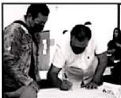
LOS FOROS INICIARÁN EL PASADO 9 DE OCTUBRE Y SE TIENE PREVISTO QUE CONCLUYAN EL PRÓXIMO 6 DE NOVIEMBRE.