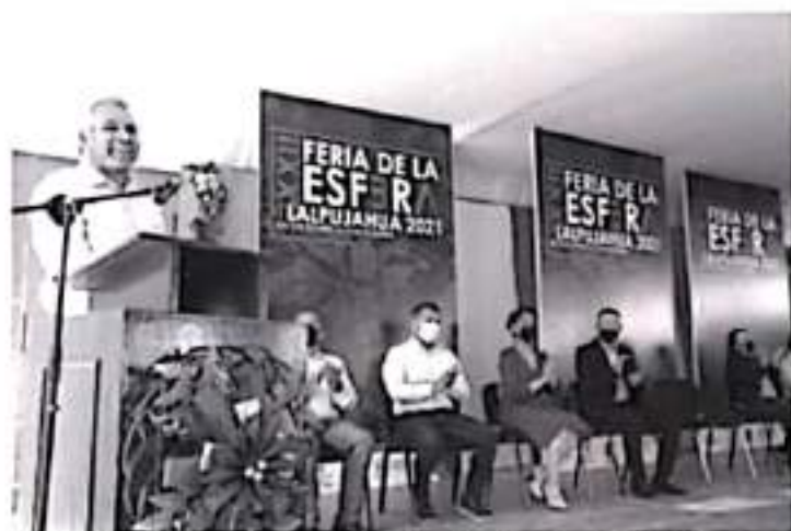
El gobernador señaló que esta es una de las ferias más emblemáticas del estado ubicada en un Pueblo Mágico donde los visitantes podrán disfrutar tanto la belleza de la artesanía michoacana.

-Ramírez Bedolla llamó a consumir las artesanías locales para reactivar la economía.