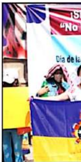
COMUNIDADES TAMBIÉN ABSTRARON