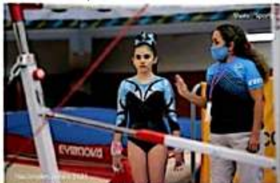
La directora del gimnasio El Olimpo, dando instrucciones a una de sus competidoras.