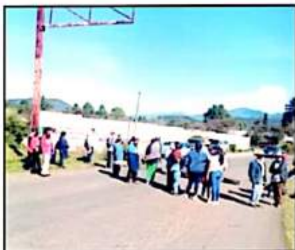
LA DESERCIÓN POR LAS CARRETERAS DEPLANZARON BARREROS AMÉRICOS

A pesar de que se trataba de trabajadores locales, las agresiones del FNLS no pararon durante su paso por la avenida Madero, que en varias ocasiones increparon a ciudadanos que pasaban por el sitio.