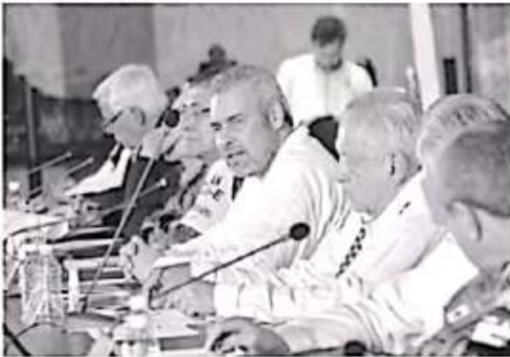
López Obrador puntualizó que el compromiso de la federalización es para que el recurso llegue de forma puntual, directa, inmediata y sin intermediarios a los trabajadores de la educación.

Morelia, Michoacán, 09 de octubre del 2021.- El gobernador Alfredo Ramírez Bedolla celebró el anuncio del Presidente, Andrés Manuel López Obrador, que como parte del Plan de Apoyo a Michoacán anunció se concretará la federalización de la nómina educativa para garantizar el pago a docentes.