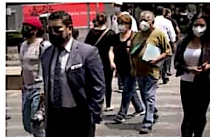
Faltantes. Pese a los resultados positivos, las metas no se han cumplido a cabalidad, según los datos del IMSS.

Sin embargo, apuntó, este último dato se quedó a 18 mil 617 plazas de igualar el nivel de empleo observado antes