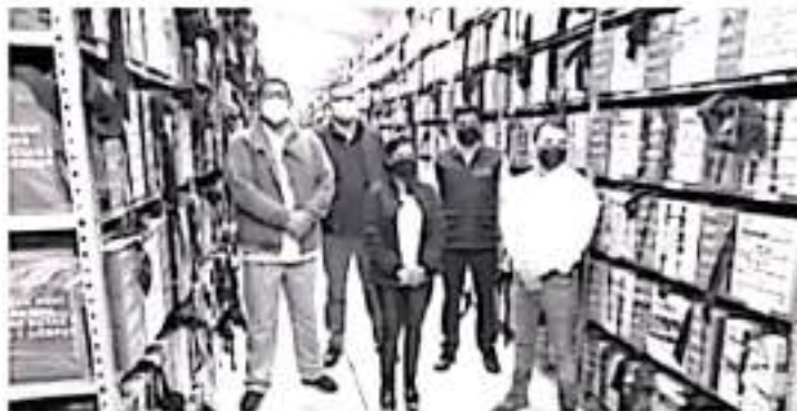
La cantidad de paquetes resguardados, es de 12,311, de los cuales 6,152 corresponden a la elección de ayuntamientos y 6,159 corresponden a la elección de la Gobernatura y Diputaciones.

Finalmente, es importante señalar que dentro de ese material se encuentran boletas electorales, documentación electoral, actas, hojas de incidentes, formatos, manuales de capacitación, entre otros.