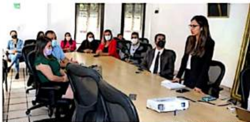
URUAPAN, MICH.- Con una mesa de diálogo en la que se tuvo la participación de psicólogos y autoridades municipales conmemoraron ayer el Día Mundial de la Salud Mental.

La regidora añadió que actividades como ésta se llevarán a diferentes áreas de la administración municipal, con el fin de cubrir y reforzar la salud mental del personal que labora en este gobierno, para que puedan desempeñar de mejor manera sus actividades, con calidad y calidez.