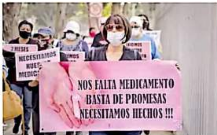
Protestas. Desde el inicio de la administración de López Obrador se han manifestado familiares de niños con cáncer por la falta de medicamentos.

El secretario explicó que la demanda de medicamentos del sector Salud consta de mil 840 claves (equivalentes a 520 millones 300 mil 803 piezas de medicamentos), de las cuales,