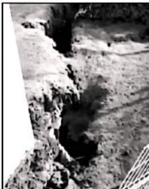
ESPECIALISTAS HAN PRESENTADO EVIDENCIAS DE QUE LA ZONA EN LA QUE SE UBICAN FRACCIONAMIENTOS Y HOSPITALES REPRESENTA UN RIESGO

estatal está en diversas niveles de riesgo