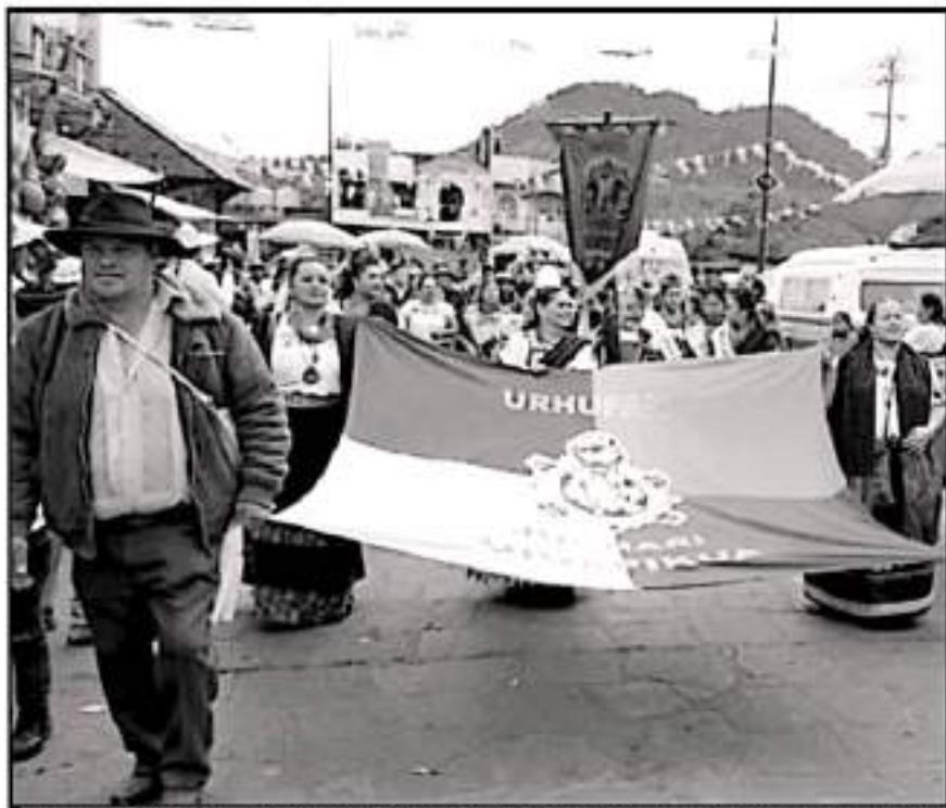
LA LUCHA DE LOS INDÍGENAS NO HA CLAUDICADO CONTRA INTENCIONES DE DESMANTELAR LA COSMOSIÓN DE LAS ETNIAS

El prolongado episodio histórico, posterior al arribo de los españoles a tierras americanas, debe ser un claro ejemplo de la tortura y determinación de los indígenas quienes durante estos siglos no han claudicado a su lucha contra los intentos, de algunos, para desvirtuar la cosmovisión de las etnias, que es la esencia de su existencia a pesar de un nuevo orden de vida pero que ha podido acoplarse con la