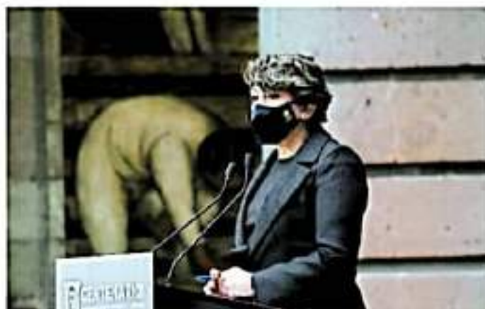
Delfina Gómez espera que en esta semana aumente el número de alumnos en Michoacán

Integrantes de la CNTE Poder de Base bloquearon la calzada La Huerta como forma de presión para exigir el pago de sus quincenas atrasadas