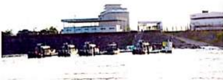
CD. LÁZARO CÁRDENAS, MICH.- La gaceta de Semarnat publicó un Manifiesto de Impacto Ambiental por parte de Apliac para la construcción de un muelle de remolcadores, es el segundo estudio ambiental que se presenta.

■ Para ello presentan 2° Manifiesto de Impacto Ambiental