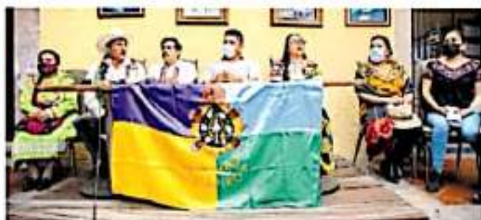
Integrantes de comunidades indígenas solicitaron al gobierno de la República que no los excluya del Presupuesto de Egresos de la Federación. CARMEN VERNACIOZ

"Dentro de las posibilidades que hay es el retirar el monumento, pero es una pieza de 8 toneladas que tiene una profundidad de metro y medio, no es una intervención