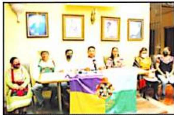
INDÍGENAS LLAMARON A LA REFLEXIÓN DE LA FECHA POR EL 12 DE OCTUBRE