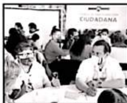
POR LA MAÑANA SE TENDRÁ UN FORO CONTROLADO SERÁ UN MÁXIMO DE 40 PERSONAS LAS QUE PARTICIPEN.