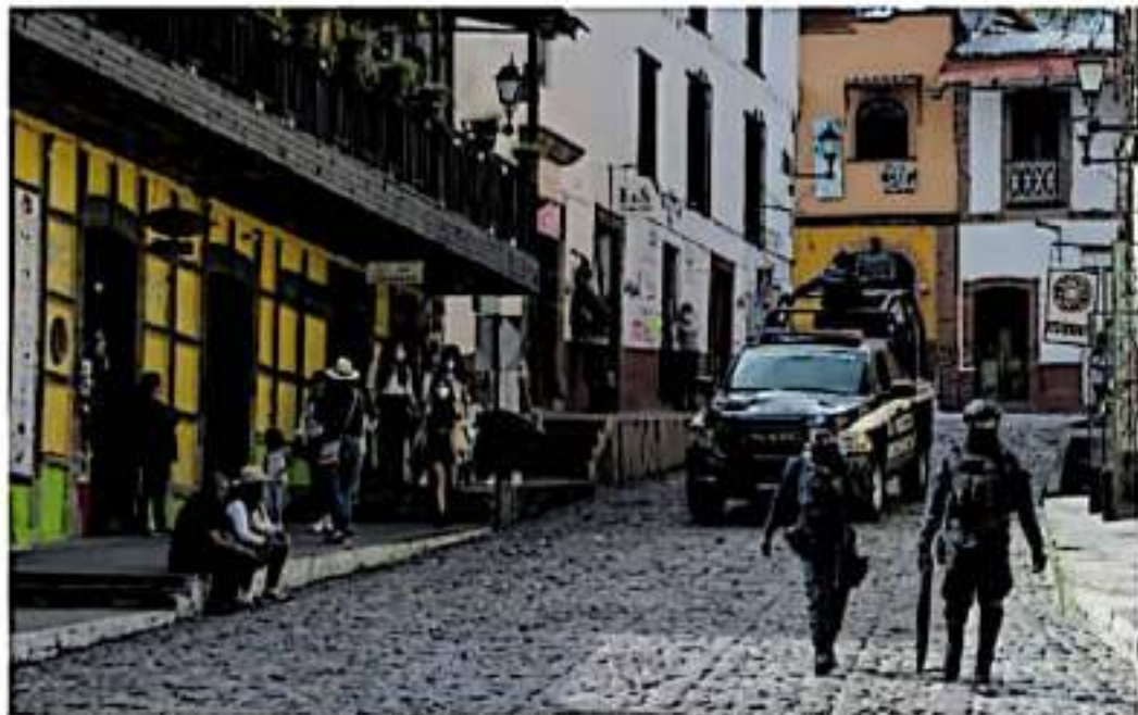
Se habilitaron dos Bases de Operaciones Mixtas para reforzar la seguridad en la región.