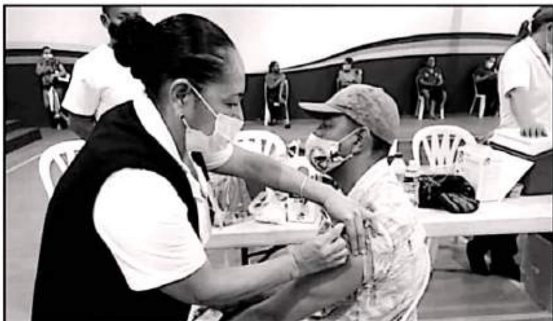
SE DISTINGUE QUE DESDE LA SEMANA 32 A LA FECHA, EN LOS MUNICIPIOS DE LA JURISDICCIÓN SANITARIA EXISTE UN DESCENSO EN CASOS DE EPIDEMIOLÓGICO.

Quedaron algunos jóvenes y adultos sin su vacuna porque no quisieron aplicársela, hubo resistencia de algunos grupos a acudir a los módulos