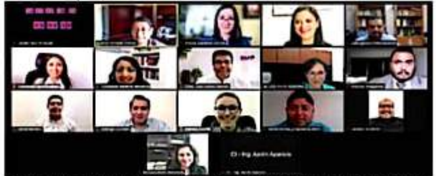
En sesión extraordinaria urgente de Consejo General implementar la Red de Mujeres que resultaron electas a cargos de elección popular del Proceso Electoral Local Ordinario 2020-2021.

plementar una red similar y así proteger sus derechos y buscar erradicar la violencia en contra de las mujeres en el ámbito político y social.