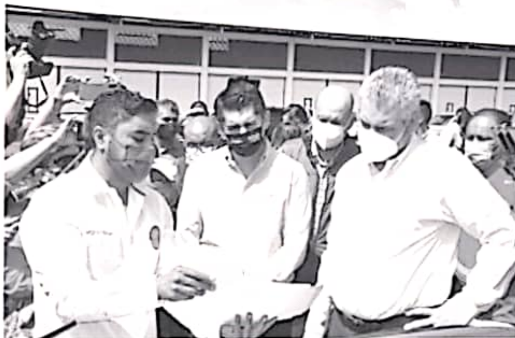
Pretenden reactivar la Central de Abasto, con la instalación de un Centro de Exposiciones, cámara de refrigeración y tiendas ancla, el gobernador recibió toda la información.

Al finalizar el encuentro, el edil destacó que promover la actividad física en sus distintas ramas y categorías, es una herramienta que favorece al desarrollo humano, por lo cual, dentro de las tareas que tiene su administración para la composición del tejido social y prevención del delito, es fomentar el deporte.