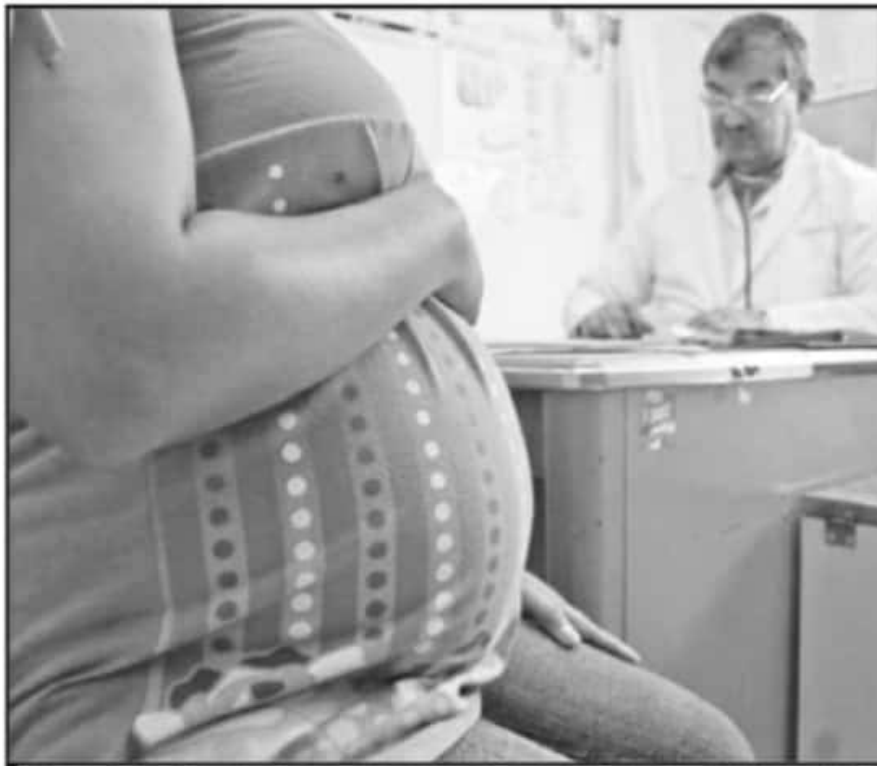
DEBIDO AL RIESGO DE CONTRAER COVID-19, LAS MUJERES QUE PASAN PROCESO DE EMBARAZO DEBEN CUIDARSE MÁS.

cremento del 37.8 por ciento", en tanto que las principales causas identificadas son "COVID-19, (21.6%) con virus SARS-Cov2 confirmado" y "COVID-19, sin virus identificado (4.9%)".