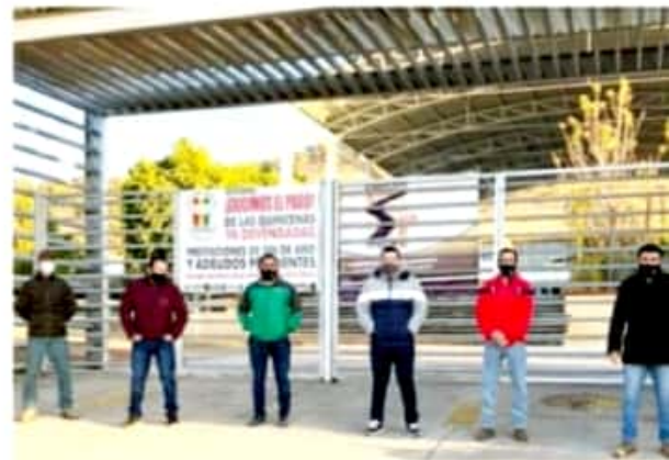
APATZINGÁN, MICH.- Los planteles que pertenecen a la Federación de Sindicatos de Institutos Tecnológicos Descentralizados, han sido seriamente afectados por el incumplimiento en el pago de quincenas y prestaciones.

Por ello, insistió en que se deben reforzar las acciones en México y la Federación acelerar el proceso de vacunación para salvar vidas, así como transparentar su aplicación, ante las denuncias de que con la misma se está favoreciendo a los operadores políticos de Morena.