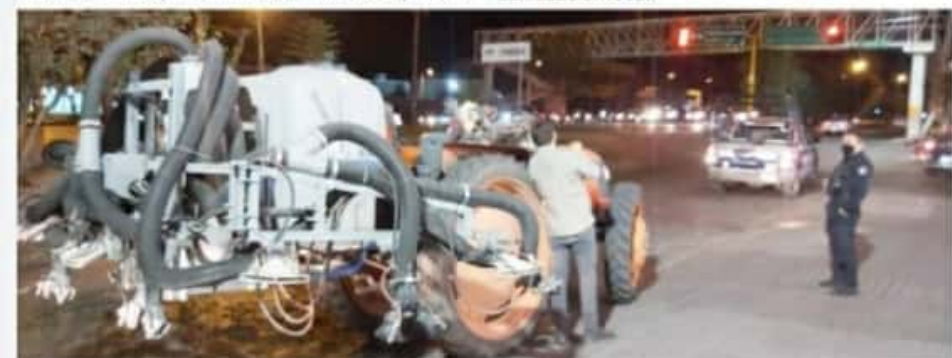
ZAMORA, MICH.- La brigada de trabajadores enfocó las labores en las colonias Valencia y La Pradera.