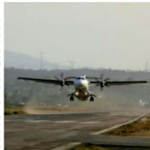
CD. LÁZARO CÁRDENAS, MICH.- La construcción del puente a desnivel en Las Guacamayas es una prioridad para sus habitantes, debido a los problemas que les causa el paso del tren.

El dirigente de la agrupación Colonias Unidas por Las Guacamayas, dijo que a los pobladores