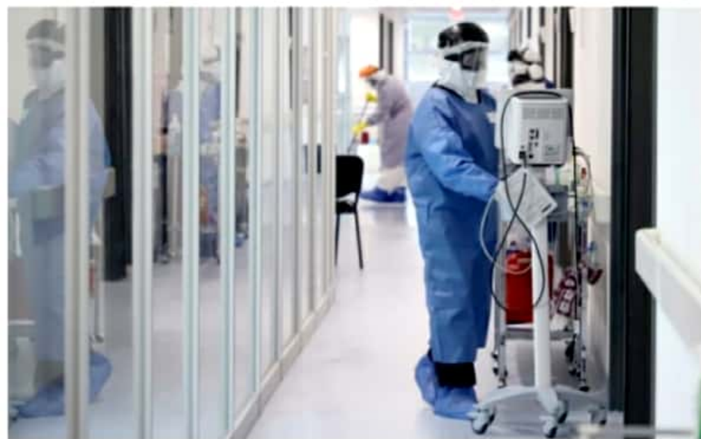
MORELIA, MICH.- Las unidades de la SSM se reportan a un 96 por ciento y el IMSS e Issste a un 100 por ciento.

■ Unidades de SSM al 96%, IMSS e Issste a un 100%; sector privado, al 90%