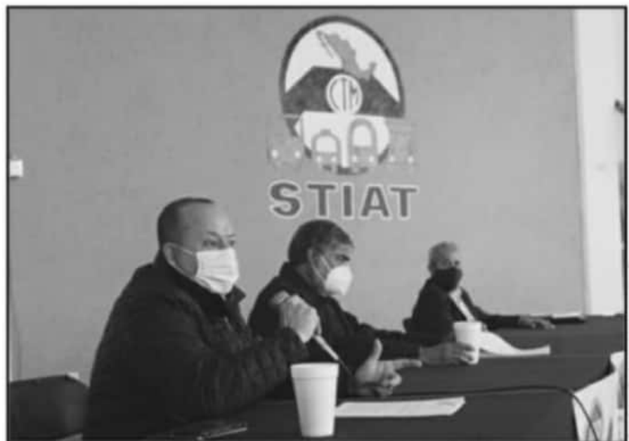
LÍDERES TRANSPORTISTAS Y DEL SECTOR DE MATERIALES PRESENTARON AYER SU PROBLEMÁTICA ANTE MEDIOS.

No es el único punto que plantearon. Ante el escenario, los trabajadores del volante plantearon nuevas tarifas para el trans-