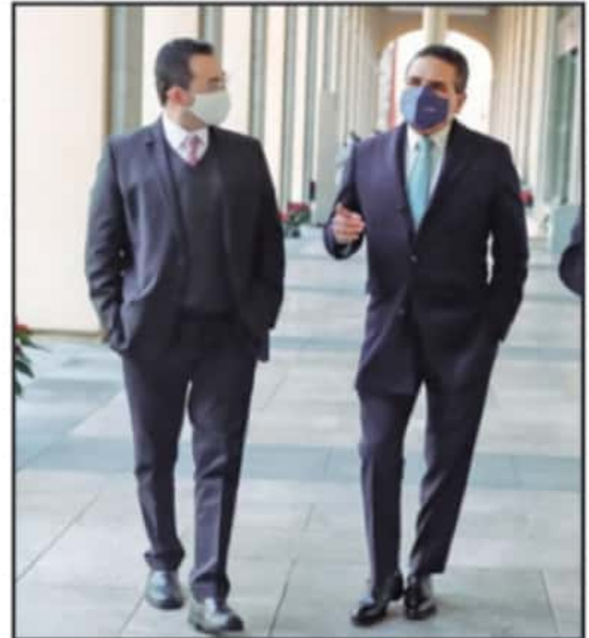
REANUDA EL GOBERNADOR SILVANO AUREOLES CHARLAS CON LA FEDERACIÓN PARA COMPLETAR FEDERALIZACIÓN DE LA NÓMINA EDUCATIVA

Apuntó que quedaron pendientes los anexos de dicho acuerdo que posibiliten mecanismos para poder cumplir con los pagos a los trabajadores de la educación.