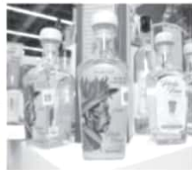
Este estímulo fiscal tiene como propósito apoyar a los productores michoacanos de bebidas como el tequila, la charanda y el mezcal que cuenten con denominación de origen en la entidad.

Para mayores informes respecto a medidas de prevención e información general sobre el COVID-19, la Administración Estatal pone a disposición de la población el número 800-123-2890, con 11 líneas para resolución de dudas, así como un micrositio donde encontrarán toda la información disponible sobre COVID-19, ingresando a la liga bit.ly/MichCOVID-19