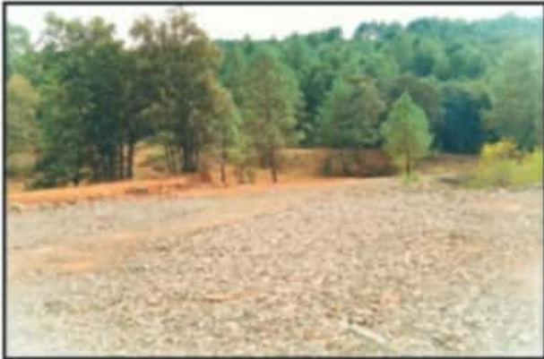
DEVASTACIÓN ES EVIDENTE, AUNQUE SE DIGA QUE NO HAY IMPACTO AMBIENTAL.