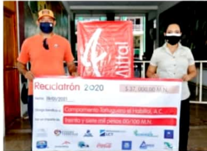
CD. LÁZARO CÁRDENAS, MICH.- El comité organizador del Recicladrón 2020 representantes de ArcelorMittal realizaron la entrega del cheque simbólico por un monto de $37,206 pesos que serán destinados para beneficio de los campamentos tortugueros El Habillal, Las Peñas, Centenarios y Boca Seca.

De acuerdo con el Instituto Nacional de Ecología y Cambio Climático (Inecc), en México cada mes se generan 29,000 toneladas de basura electrónica, y tan solo se recicla el 14%, por ello es fundamental lograr un desecho adecuado de estos residuos mediante procesos para separar los componentes y liberarlos del plomo y otros elementos que pueden contaminar sustancialmente los mantos freáticos con metales pesados, así como generar un impacto ambiental en la tierra, ocasionando daños por millones de años.