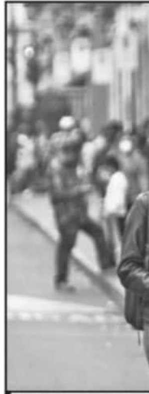
A ONCE MESES DE QUE SE DIO EL PR