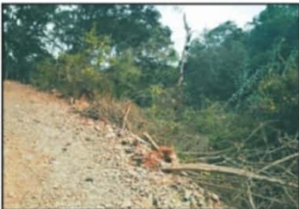
ÁRBOLO SE HA HECHO A UN LADO PARA HACER COMPLEJO INMOBILIARIO.