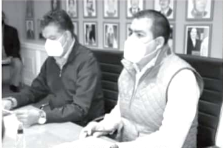
La primera etapa es el estudio, la cual inició este día con la firma del documento y, la segunda, la ejecución que se contempla esté concluida antes de que finalice la actual administración.

-Alcalde y titular de SEMACDET firmaron convenio para comenzar con esta acción. -Involucra a los municipios de la región oriente de Michoacán.