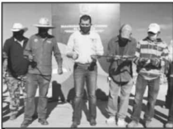
AUTORIDADES MUNICIPALES Y ALGUNOS HABITANTES INAUGURARON LA OBRA.

En lo que hace a las trayectorias existentes en la Universidad de la Ciénega del Estado de Michoacán de Ocampo (UCEMICH) se dio a conocer el calendario de nuevo ingreso a partir del 3 de febrero próximo, en que se comenzará con las solicitudes de fichas y exámenes de nuevo ingreso, mismo que será aplicado del 30 de junio al dos de julio de este año y finalmente, para quienes acrediten el examen, las inscripciones se realizarán el 2 y 3 de agosto vía correo electrónico.