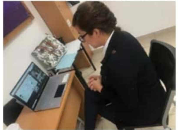
En las conferencias impartidas por la FGE, participación 6 mil 873 personas de las cuales 4 mil 300 lo hicieron de forma virtual.

cialmente a "La Seguridad y los Jóvenes; Prevención de la Violencia Digital; Los Riesgos y las Consecuencias del mal uso de la Tecnología y el Cyberbullying; Diálogos por una Educación para la Paz; Referentes de Seguridad Cibernética; Mujeres Trascendiendo por Michoacán de la Mano con los Jóvenes por la Seguridad Cibernética ante la nueva Convivencia Social; Conductas de Riesgo en Internet y Redes Sociales.