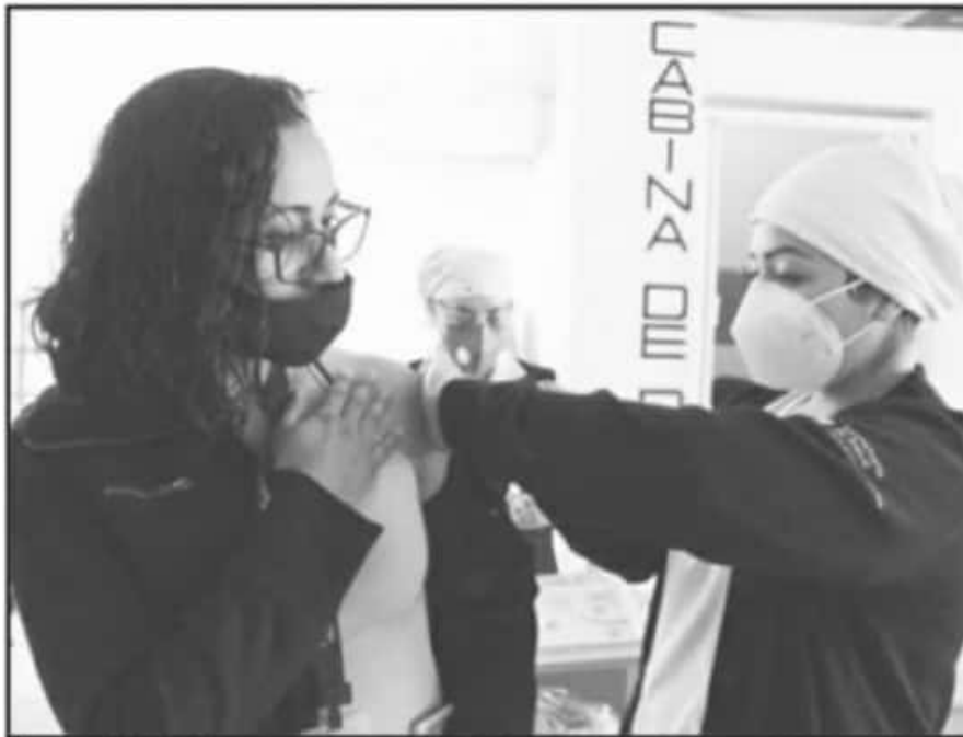
LA VACUNACIÓN, SE INFORMÓ, FUE COORDINADA POR PERSONAL DE LA JURISDICCIÓN SANITARIA DE LA REGIÓN