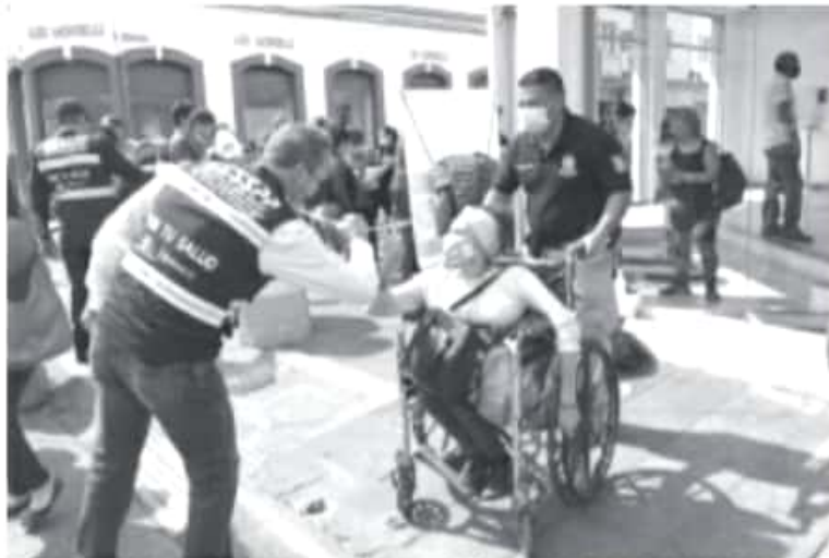
Decenas de cadetes han trabajado para lograr que los habitantes de este municipio se apeguen al protocolo de prevención establecido por las autoridades sanitarias.

Bernal Bustamante destacó que el operativo implementado en Zitácuaro tiene los valores del IEESSPP como eje central, donde el policía tiene una vocación de servicio público, que preserva y prioriza la vida, cuida la salud, defiende los derechos humanos y está siempre comprometido con el bienestar de la sociedad, desarrollo del estado y país en general.