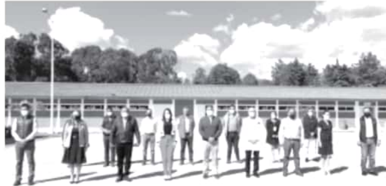
En la sesión de la Red Intermunicipal de la Salud, región oriente, se tomaron importantes acuerdos, como la suspensión de todas las actividades comerciales y prestación de servicios los domingos.

Hernández Suárez, se llevó a cabo la sesión de la Red Intermunicipal de la Salud, región oriente, en donde se tomaron importantes acuerdos, como la suspensión de todas las actividades comerciales y prestación de servicios, atendiendo a la disposición emitida por el Gobierno del Estado.