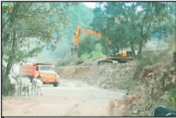
LA MAQUINARIA PESADA "ADAPTA" AL ÁREA PARA CONSTRUIR CABAÑAS.