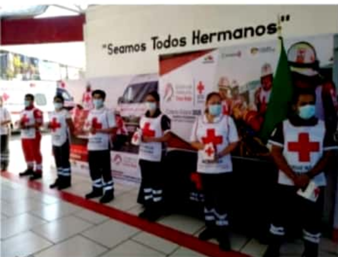
CD. LÁZARO CÁRDENAS, MICH.- Autoridades y sociedad se suman a la "Colecta Anual 2021" que dio arranque este martes en Lázaro Cárdenas.