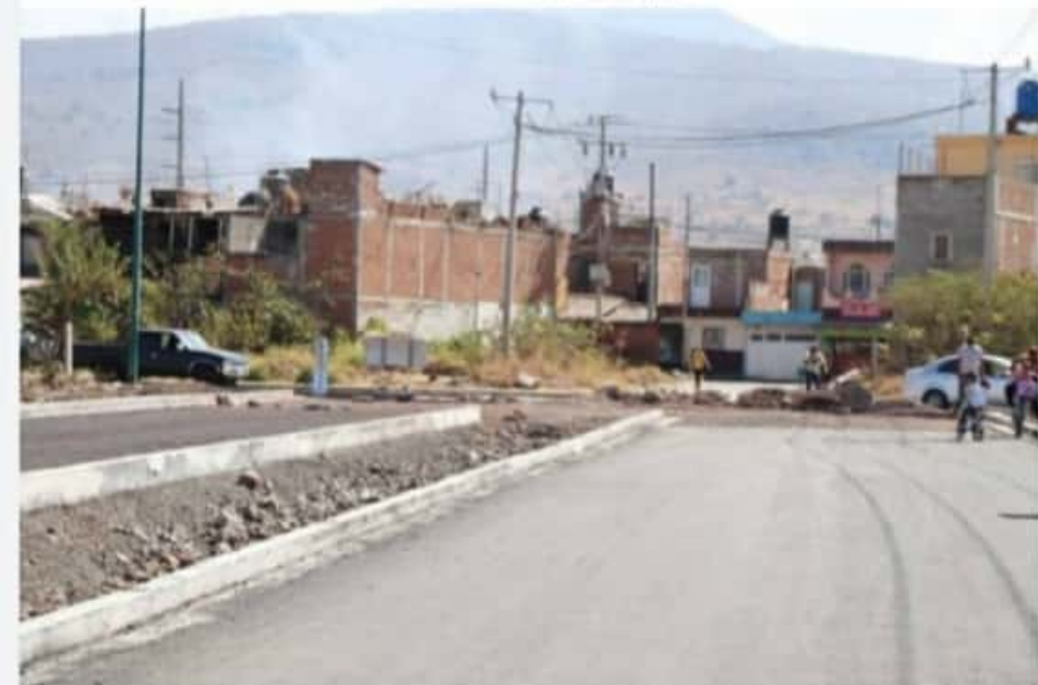
ZAMORA, MICH.- Se estima que a más tardar el 15 de febrero, los trabajos queden concluidos en beneficio de todos los zamoranos.

También, incluye un camellón central de aproximadamente 4 metros de ancho y se procederá a la aplicación de carpeta asfáltica en caliente de 5 centímetros de espesor compactos, para conformar una importante vía de comunicación y fortalecer la infraestructura urbana del municipio.