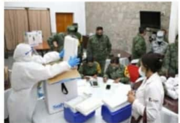
Durante la primera etapa de vacunación, en Michoacán se aplicarán 14 mil 637 dosis de vacuna anti COVID-19.

Es de señalar que previo, la diputada emitió un comunicado para desmentir que en Morena hubiera acuerdos para un candidato, donde anotó que como mujer de convicciones llamaba a la militancia a trabajar con total democracia y apego a los valores del partido, "no incitando a la manipulación de los deseos de pocos, el rumbo de una ciudad con promesa, futuro económico, social y moral".