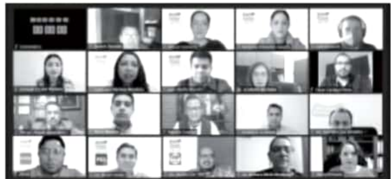
Se aprobaron los límites del financiamiento privado que podrán recibir los Partidos Políticos, de las aportaciones de militantes, simpatizantes y candidatos, para el proceso electoral ordinario local 2020-2021.