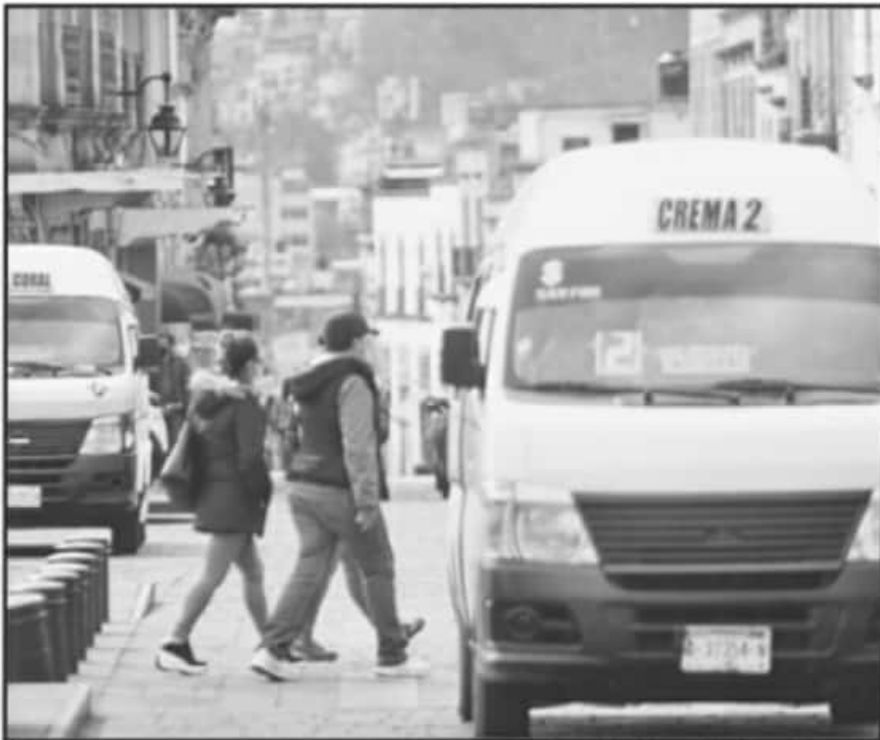
SE DIJO QUE LOS INGRESOS DE LOS TRANSPORTISTAS DE MORELIA CAYERON HASTA UN 70% EN LOS ÚLTIMOS MESES.

No se les ha tomado en cuenta para las medidas de contención a la pandemia. Ante la posibilidad y el riesgo latente de un nuevo confinamiento a nivel estado, los transportistas plantearon la urgencia de que el gobierno de Michoacán o de otros niveles apoye con insumos de operatividad a los miles de trabajadores.