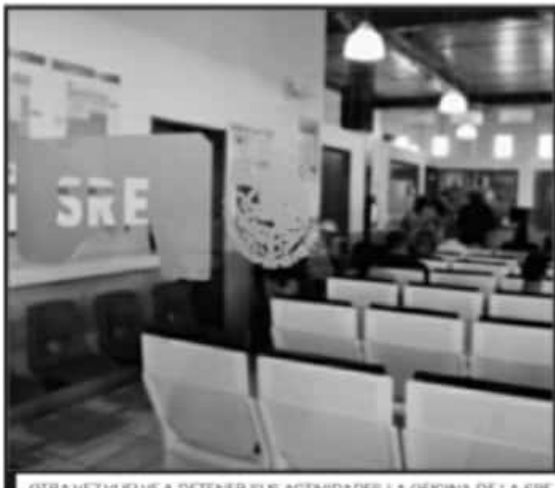
OTRA VEZ VUELVE A DETENER SUS ACTIVIDADES LA OFICINA DE LA SRE