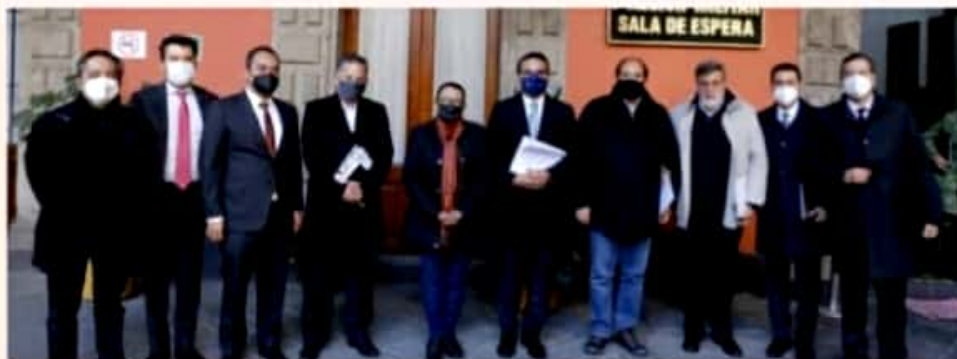
CIUDAD DE MÉXICO.- El Gobierno Estatal tiene disposición absoluta para trabajar coordinadamente y obtener los resultados que la población demanda.

Ante ello, los integrantes del gabinete de Seguridad Federal, encabezados por Rosa Icela Rodríguez, secretaria de Seguridad y Protección Ciudadana, acordaron fortalecer las acciones de coordinación con Michoacán.