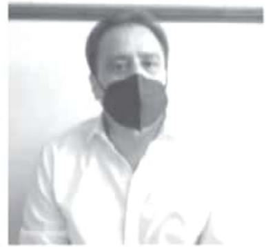
En Zitácuaro es urgente que haya una oficina de la Procuraduría de la Defensa del Trabajo para que atienda los problemas de índole laboral.