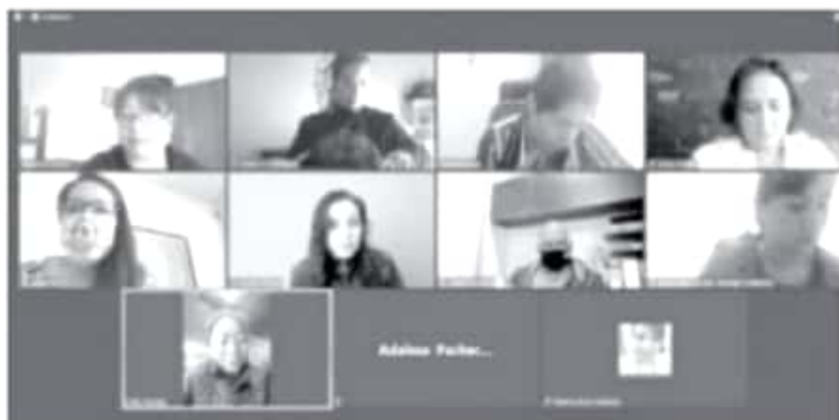
El acuerdo busca brindar herramientas para una protección adecuada contra todas las formas de exclusión social y violencia motivada por la orientación sexual, identidad y/o expresión de género.

En el encuentro virtual se presentaron además a las autoridades del Telebachillerato las estrategias para prevenir y atender la violencia homofóbica y transfobia en el ámbito escolar y se explicó en qué consiste el bullying homofóbico y transfóbico en México.