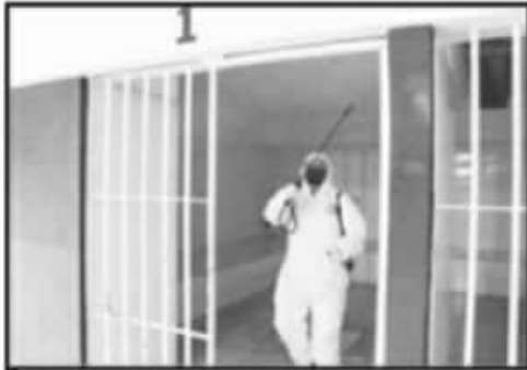
CAMPAÑA SE ACOMPAÑA DE TRABAJOS DE DESINFECCIÓN