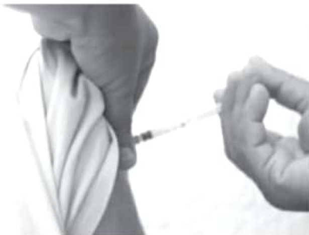
Durante este periodo invernal que comprende desde la semana epidemiológica 40 (octubre 2020) a la semana 20 (marzo 2021), se tiene como meta aplicar 626 mil 918 dosis.

-Exhorta SSM a las y los michoacanos a inmunizarse en su unidad de salud más cercana