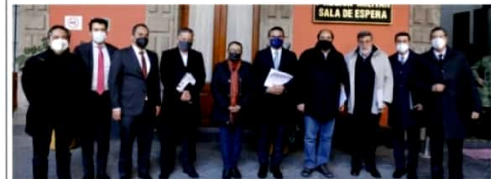
CIUDAD DE MÉXICO.- El Gobierno Estatal tiene disposición absoluta para trabajar coordinadamente y obtener los resultados que la población demanda.

Ante ello, los integrantes del gabinete de Seguridad Federal, encabezados por Rosa Icela Rodríguez, secretaria de Seguridad y Protección Ciudadana, acordaron fortalecer las acciones de coordinación con Michoacán.