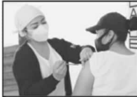
EL PERSONAL DEBE CONTAR CON SU CUADRO DE VACUNACIÓN