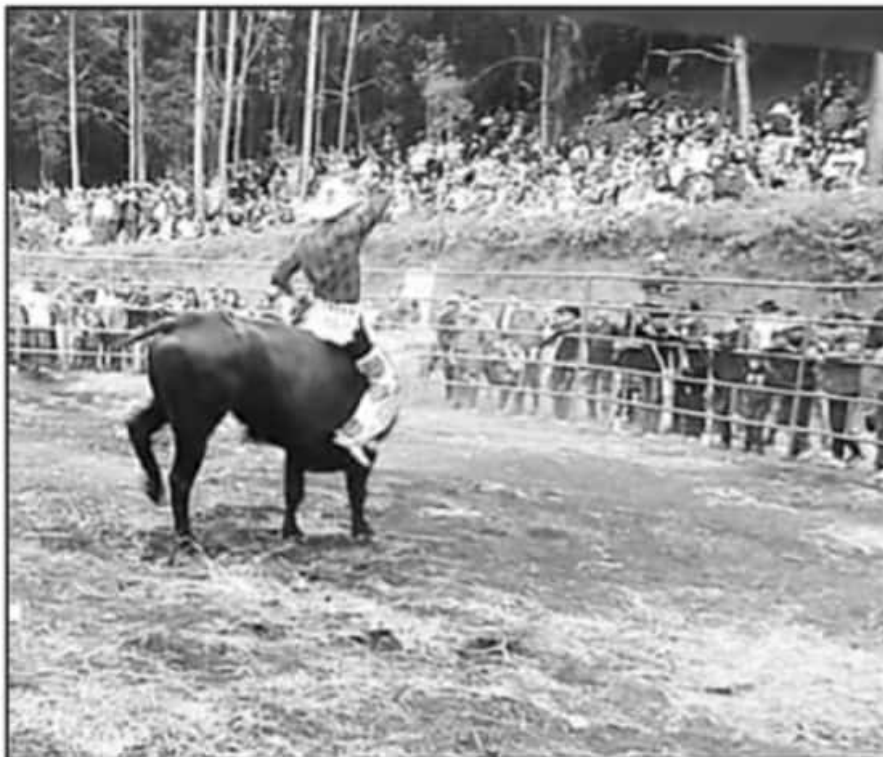
A PESAR DE QUE LA CIFRA DE CONTAGIOS DE COVID-19 CRECE, LAS PERSONAS ACTÚAN COMO SI NO EXISTIERA EL VIRUS.