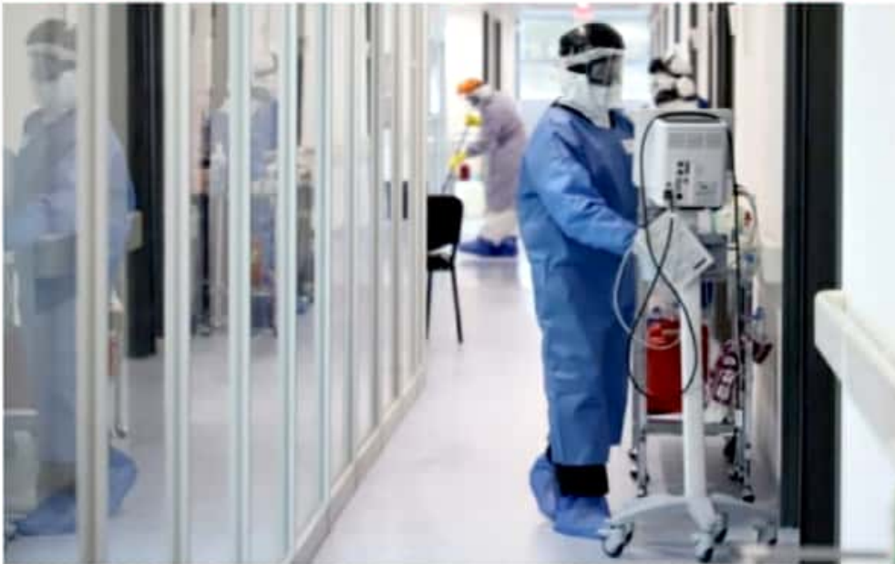
MORELIA, MICH.- Las unidades de la SSM se reportan a un 96 por ciento y el IMSS e Isste a un 100 por ciento.

Unidades de SSM al 96%, IMSS e Isste a un 100%; sector privado, al 90%