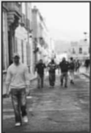
BAJO LA NUEVA MEDIDA PUEDEN IMPONERSE SANCIONES Y MULTAS

cuentan con un respirador artificial ascendió a un 38 por ciento, cuando a inicios de mes era del 20 por ciento. En tanto, en defunciones, cuando en mayo del año pasado el promedio diario era de 4, la cifra ahora es de 18.