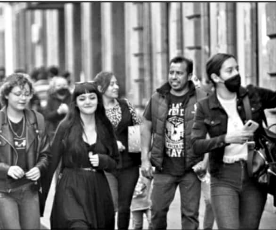
EN CASO EN MICHOACÁN, CIUDADANOS SIGUEN NEGANDOSE A PORTAR EL CUBREBocas PARA EVITAR LOS CONTAGIOS.

dicha pandemia y hasta que la autoridad sanitaria estatal declare oficialmente su conclusión. “Se busca motivar el orden, con respeto a los derechos humanos. Los procedimientos de sanción, estiman una prelación la cual comienza desde una invitación por parte de las autoridades, para posteriormente invitarle hacer una amonestación por escrito y un apercibimiento, sobre las posibles sanciones a las cuales sería acreedor, así como solicitarle se retire de