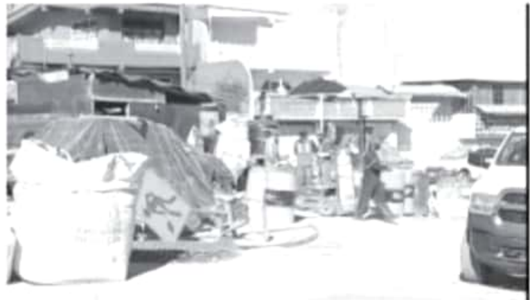
Mediante un recorrido se puede constatar que ambos monumentos se encuentran arrumbados frente al monumento a La Bandera, están tirados sobre el suelo.

Hasta ahora se desconoce si recibirán el mantenimiento prometido, tampoco hay garantía que vuelvan a su lugar, en lo que será la nueva