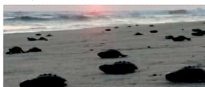
CD. LÁZARO CÁRDENAS, MICH.- El Campamento Tortuguero de El Habillal destacó los buenos resultados de la temporada, pues en lo que refiere a la