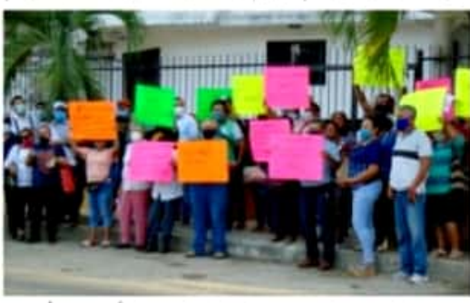
CD. LÁZARO CÁRDENAS, MICH.- Militantes del PRD en Lázaro Cárdenas, realizaron una protesta en las afueras de las oficinas locales, ante lo que llamaron una imposición de candi-