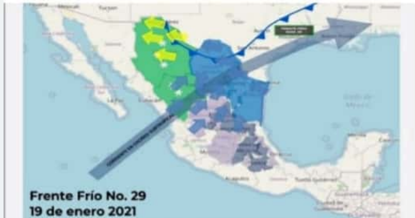
Frente Frío No. 29 19 de enero 2021