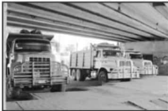
EL SECTOR, PRODUCTO DE LOS RECORTES DE LA FEDERACIÓN Y LA FALTA DE INVERSIÓN EN OBRA PÚBLICA, TAMBIÉN VIENE A LA BAJA ECONÓMICAMENTE.

porte de materiales pétreos, tanto en Morelia como al interior del estado, un ajuste que se plantea al alza ante el contexto actual.