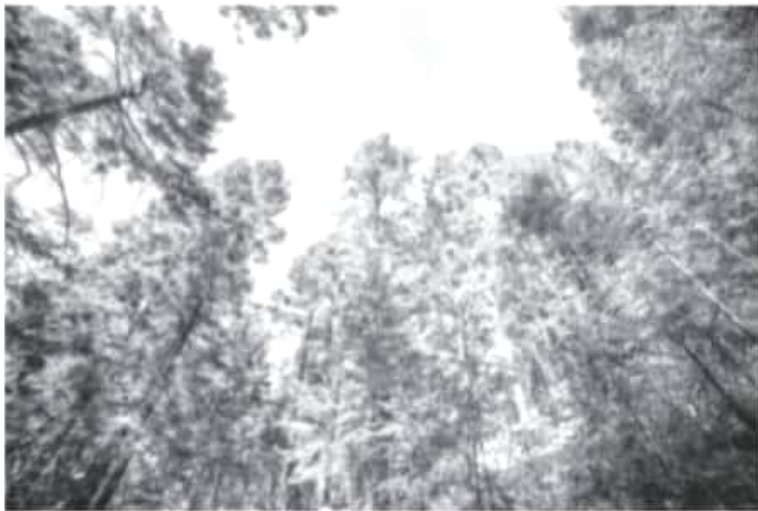
Derivado de algunos contagios entre los lugareños, se decidió el cierre temporal del lugar, con la finalidad de romper la cadena de contagio y en apego a la política de salud emprendida por el Gobierno estatal.

-La medida es temporal con el objetivo de romper la cadena de contagio por el COVID-19