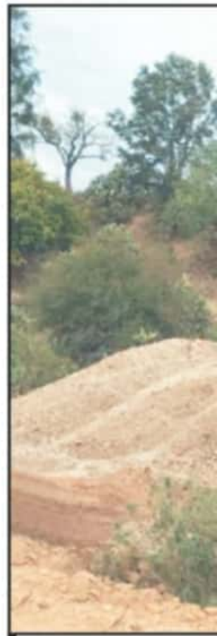
EXISTE UN DECRETO FIRMADO POR...

"Nosotros compartimos esos objetivos de conservar esa zona sur. No es un proyecto inmobiliario para vender terrenos", dijo.