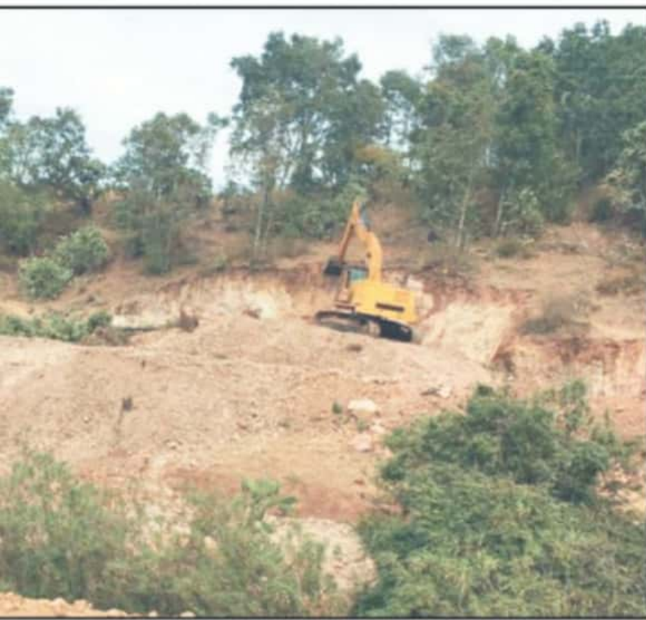
AUTORIDADES EN EL 2011 QUE PROTEGE EL ÁREA NATURAL DE PICO AZUL, POR REPRESENTAR UN PULMÓN PARA MORELIA.