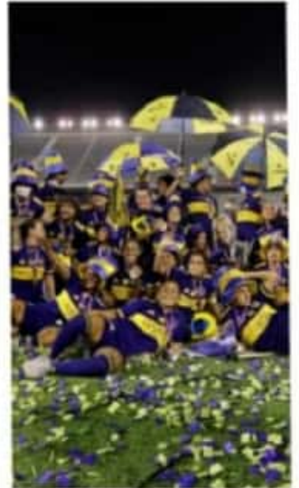
“El equipo Xeneize hizo historia este martes al levantar el título del fútbol profesional de mujeres en Argentina.”

El equipo Boca Juniors conquistó este martes el primer campeonato profesional del fútbol femenino en Argentina, con una brutal goleada de 7-0 a su archi rival River Plate.