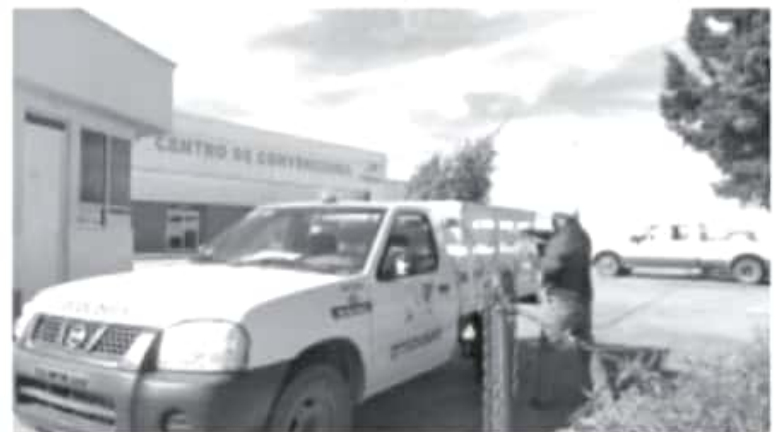
En el Centro de Convenciones SJNA se reciben árboles de navidad hasta el 5 de febrero, el horario de atención es de 9:00 de la mañana a las 2:00 de la tarde.

En este caso, cada árbol utilizado para la navidad contiene nutrientes como potasio, fósforo y nitrógeno; una vez que las ramas y hojas son trituradas estos se mezclarán con arcilla y se convertirá en una composta de calidad que ayudará a los arbolitos que en este momento se encuentran en el vivero.