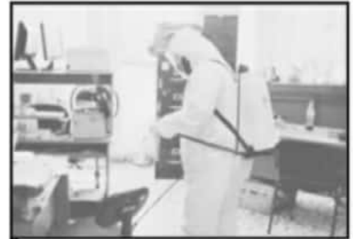
LA SANITIZACIÓN DE ESPACIOS SE SIGUE IMPLEMENTANDO

■ MEDIDAS ■ URUAPAN ANALIZARÁ SI ACOMPAÑA A GOBIERNO ESTATAL