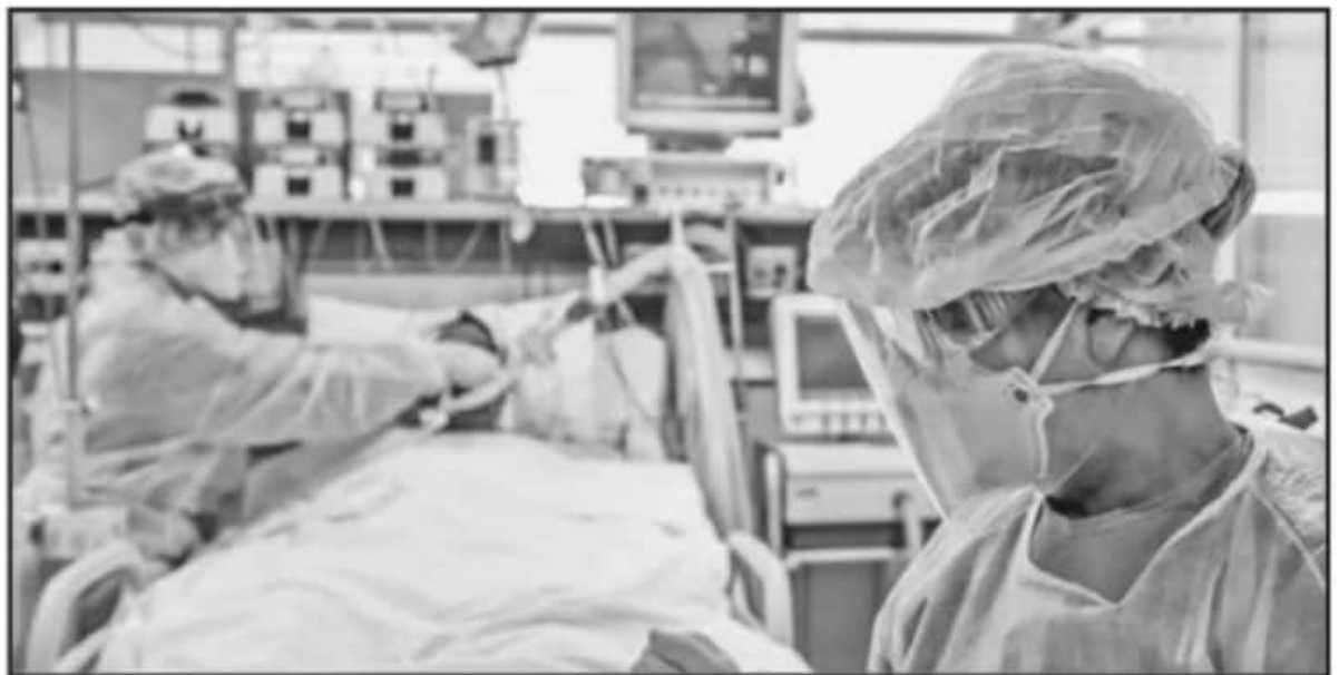
DE SEGUIR INCREMENTÁNDOSE EL NÚMERO DE PACIENTES, PODRÍA LLEGAR UN MOMENTO EN QUE NO HAYA CAMAS PARA QUE RECIBAN ATENCIÓN MÉDICA.

Este panorama se derivó de la movilidad social registrada durante las fiestas decembrinas y de fin de año, por lo que la autoridad