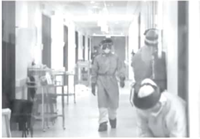
Se trata del 65.29 % del total de defunciones en Michoacán, que al momento registra 37 mil 280 contagiados, de los cuales 2 mil 941 siguen activo, al corte de este sábado que más casos se confirmaron en un solo día, 568.

- Las personas mayores tienen mayor probabilidad de enfermar gravemente si se contagian