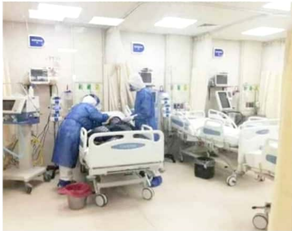
APATZINGÁN, MICH.- Explicó que dicha área cuenta con 18 camas, mismas que se encuentran ocupadas con enfermos en oxigenación.

En lo que se refiere al abasto de oxígeno, Rojas Haro afirmó que no se ha tenido problema alguno con la existencia de ese insumo para ayudar a respirar a los pacientes con Covid-19.