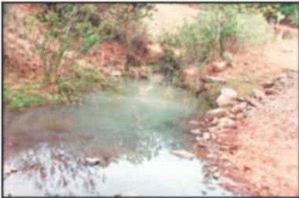
CON MAQUINARIA SE HA TAPONADO EL CAUCE DEL RÍO QUE PASA POR AHÍ.