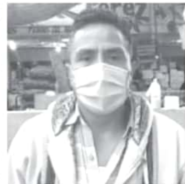
El representante de los comerciantes, explicó que cuando les cierran por varios días, cuando retoman actividades se hacen aglomeraciones durante todo el día, y eso se debe evitar.

Puntualizó que ante la falta de empresas y grandes industrias, la economía del municipio depende exclusivamente del sector comercial. En este sentido, invitó a la autoridad a contribuir para que no se pierdan fuentes de trabajo ni familias se queden sin tener sustento.