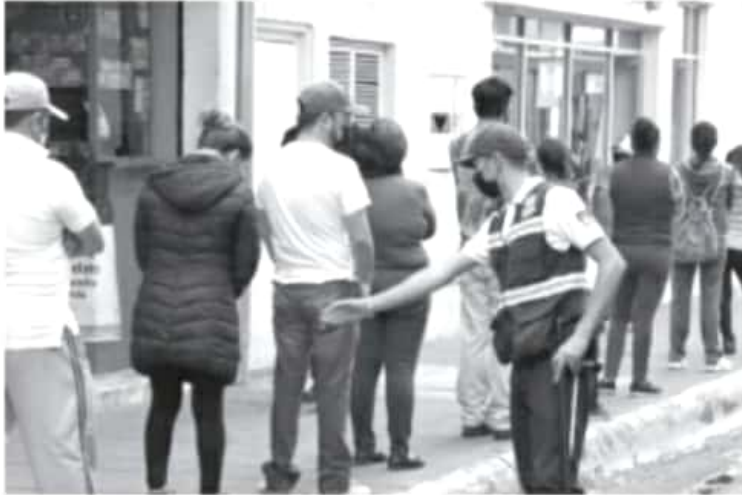
Los resultados de los operativos implementados en el municipio en lo que va del año han sido positivos, por ello no bajaremos la guardia y continuaremos generando acciones.

-Durante el operativo se genera entre la población el hábito de respetar las medidas sanitarias