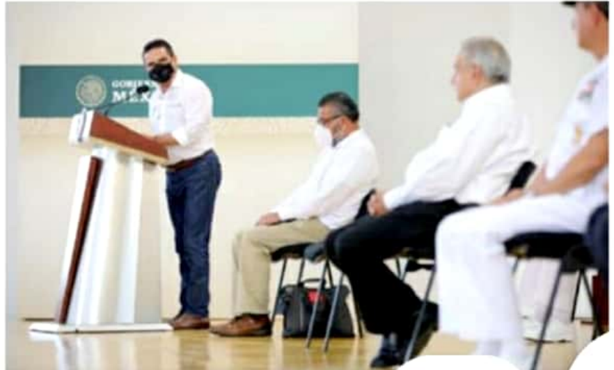
Solicita Gobernador al presidente de México concluir la operatividad de