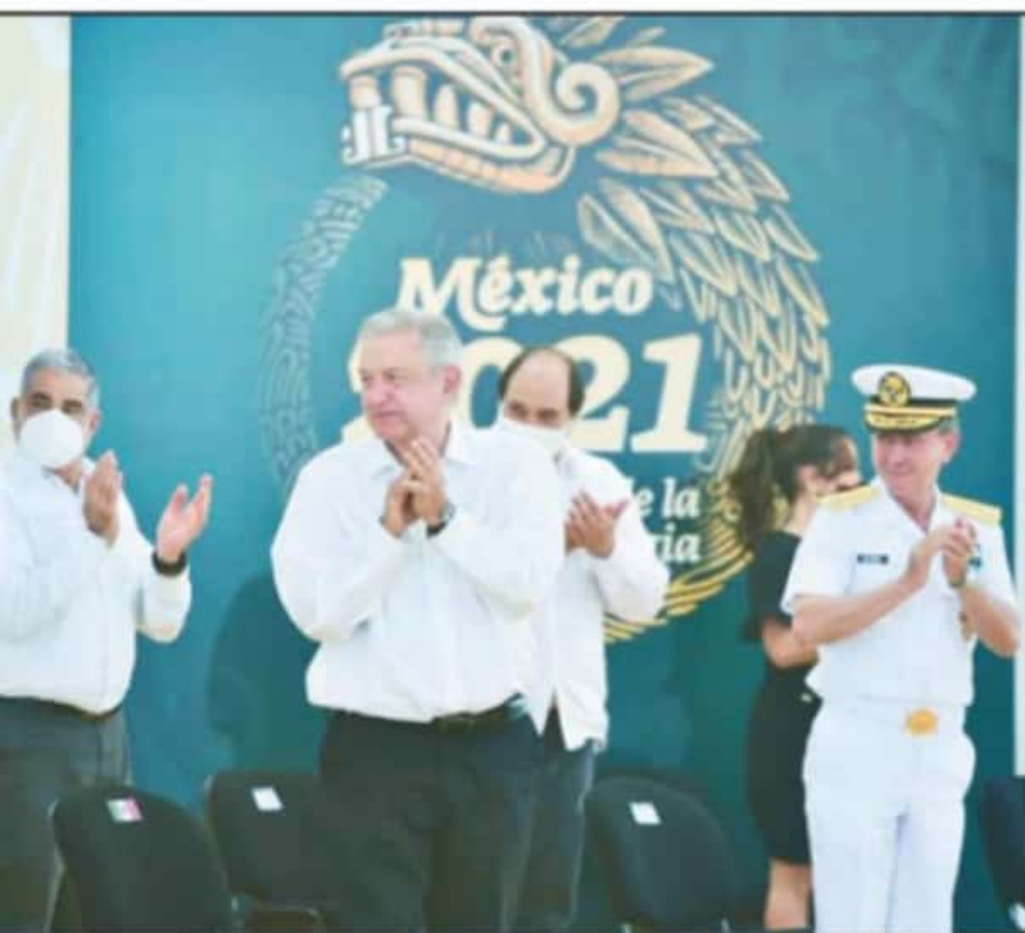
EL PRESIDENTE DEL ESTADO, LÓPEZ OBRADOR ANUNCIÓ QUE ESTARÁ VISITANDO LC PARA SUPERVISAR EL REFORZAMIENTO DE LA ADMINISTRACIÓN.