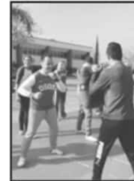
IMPORTE UTM ACTIVACIÓN FÍSICA.