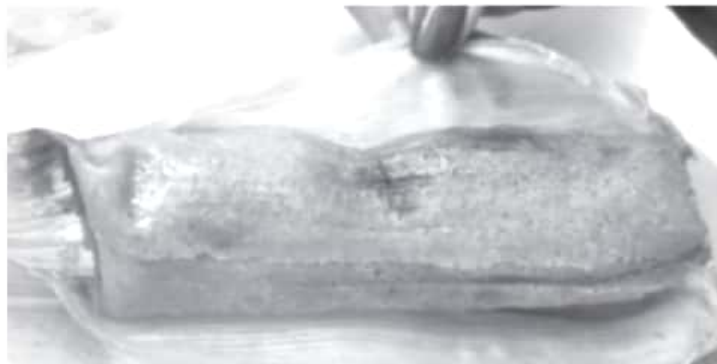
Por la pandemia, la feria será virtual y las ventas serán para llevar desde los locales donde se producen estos alimentos o a través de servicio a domicilio.

Expuso que desde que comenzó la contingencia en marzo del año pasado, la dependencia a su cargo ha tratado de ser creativa para realizar actividades que detonen la economía local y ayude en algo a los prestadores de servicio.