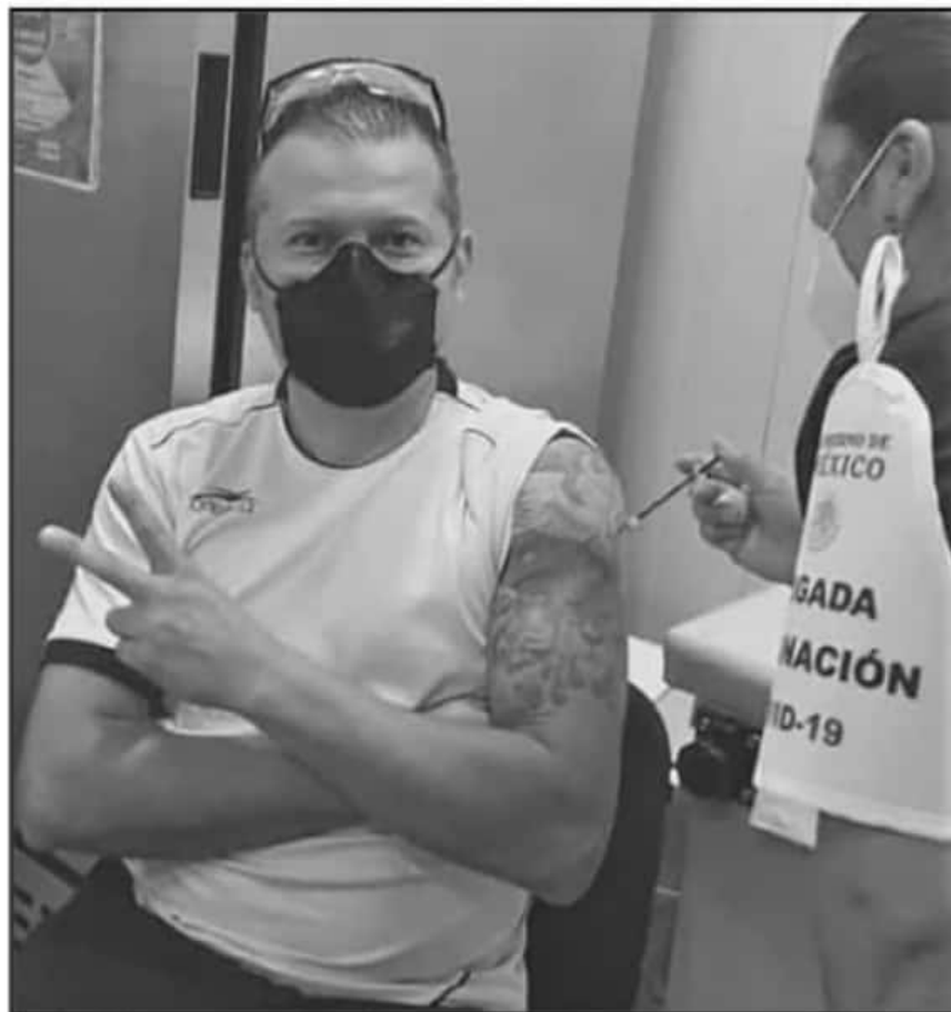
CONCLUYEN EN LOS REYES LA PRIMERA FASE DE INOCULACIÓN A 3 DÍAS DE APLICAR LA VACUNA A PERSONAL MÉDICO.

Además del personal médico y auxiliar del HGLR, recibieron la vacuna los integrantes de la Brigada Correcaminos, exceptuando a los integrantes de