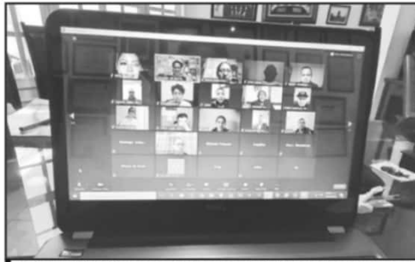
REFUERZA EL COLEGIO DE BACHILLERES EL ACOMPAÑAMIENTO ACADÉMICO VIRTUAL CON DOCENTES Y ALUMNOS.

Así, se han desarrollado una serie de actividades con