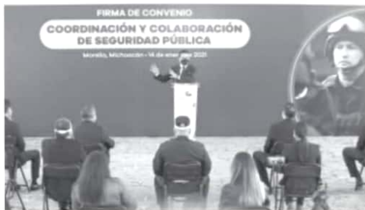
No se permitirá que en los municipios de Morelia, Lagunillas, Charo, Álvaro Obregón, Cuitzeo y Tarimbaro se refugien delincuentes, afirmó el Gobernador Silvano Aureoles Conejo.

•Firma Gobierno del Estado convenio de Coordinación y Colaboración de Seguridad Pública con la Secretaría de Seguridad y Protección Ciudadana federal, Fiscalía General del Estado y 6 municipios, entre ellos Morelia