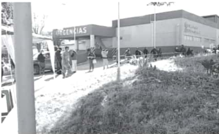
En Zitácuaro, las dosis destinadas para el municipio llegaron alrededor de las 11:00 de la noche de este martes y desde las primeras horas del día se comenzaron a aplicar en el sector salud.

Hasta ahora se desconoce la cantidad de dosis destinadas para Zitácuaro, pero sólo será para el personal médico de las unidades de salud. El personal responsable de las acciones cuenta con listados de quienes recibirán vacunados y una serie de detalles para garantizar que el biológico sea recibido para la persona indicada.