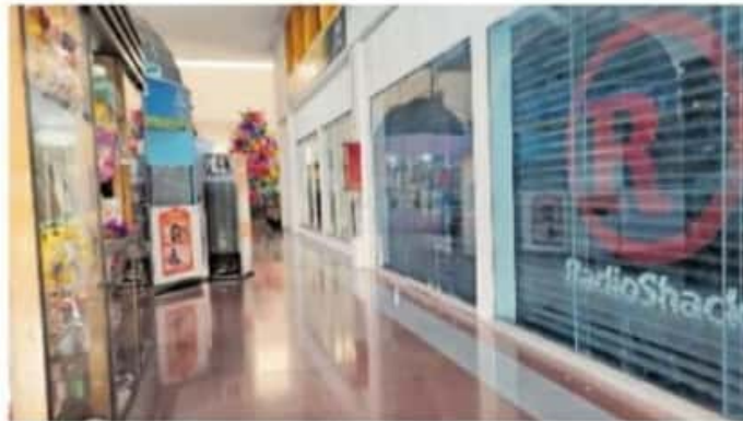
En Morelia se decidió el cierre de todos los negocios a las 19:00 horas, diariamente

Pero, desde la semana pasada se acordó que los domingos es un cierre total en la ciudad, por lo que sólo los negocios de comida preparada puedan trabajar a puerta cerrada en la modalidad para llevar.