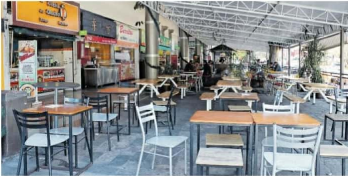
Por el número de contagios en la ciudad las medidas de restricción en los comercios de comida fueron en aumento

La resistencia a respetar la contingencia sanitaria que desató el Covid-19 en Michoacán, ha derivado en 291 denuncias por la realización de fiestas y eventos, a través del 911 y 089. Pág 8