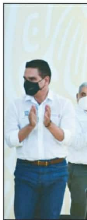
ACOMPAÑADO POR EL GOBERNADOR DEL

una de las etapas de la gira de trabajo que realiza esta tarde de viernes el Presidente de la República Andrés Manuel López Obrador.