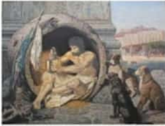
Despertar de Bismarck contra la opresión