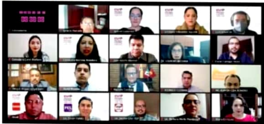
En sesión plenaria, el IEM aprobó los montos de financiamiento privado para los partidos políticos que participan en el actual proceso electoral.