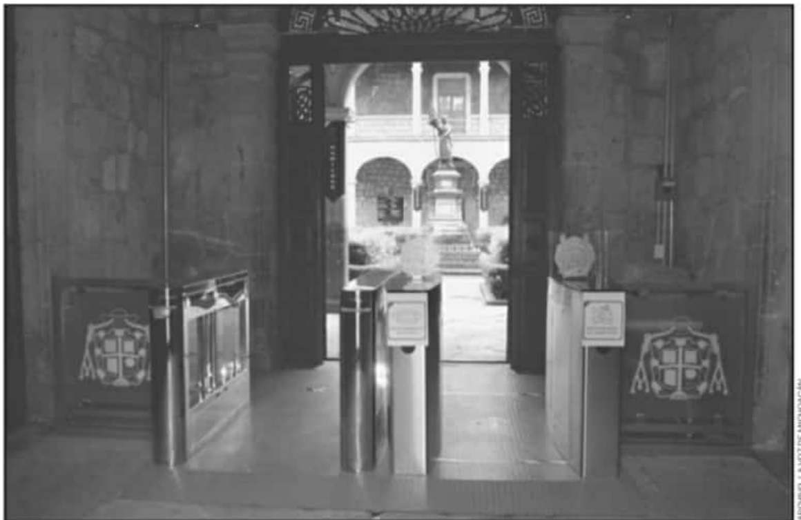
EL SINDICATO DEL STUMICH YA TIENE MÁS AFILIADOS QUE EL GREMIO QUE LIDERA EDUARDO TENA, Y SE SIGUEN SUMANDO MÁS SOLICITUDES DE ADHESIÓN.

“Se suman a otras tres promociones que ya han realizado en los últimos meses que están por ser validadas por la Junta Local de Conciliación y Arbitraje (JLCA) y que bueno en este sentido esto implicará el que suba el nivel de socios”, dijo.