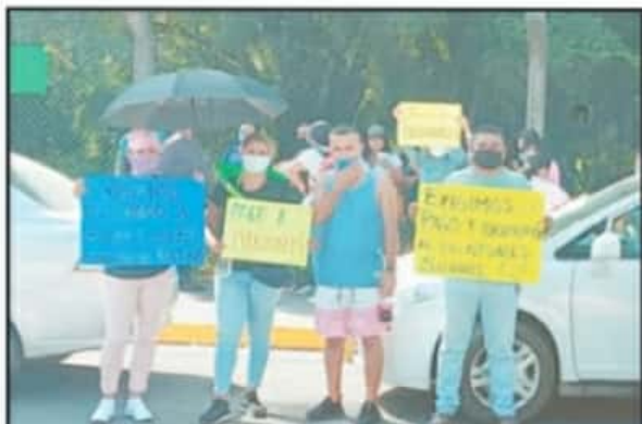
MAESTROS DE LA CNTE SE MANIFESTARON EN LA VISITA DEL MANDATARIO.