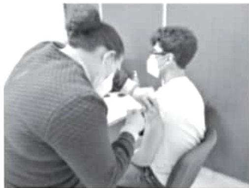
Quienes están siendo inmunizados recibirán una segunda dosis en 21 días; todo el personal del sector salud será vacunado de acuerdo a la programación realizada por la Federación.

-Se distribuyeron 14 mil 625 dosis a 48 unidades médicas