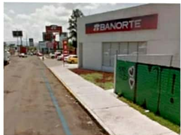
Ayer por la mañana, a punta de pistola, un sujeto despojó de 80 mil pesos a una mujer antes de que ingresara a esta institución bancaria a depositarlos.

A pesar de realizar un operativo por la zona no se logró detener a los delincuentes.