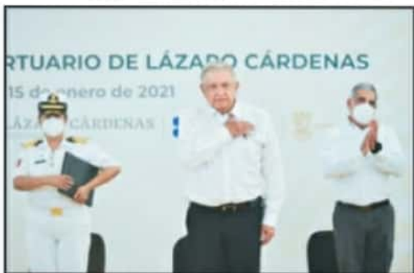
EL PRESIDENTE RECONOCIÓ EL POTENCIAL QUE TIENE EL PUERTO DEL ESTADO.