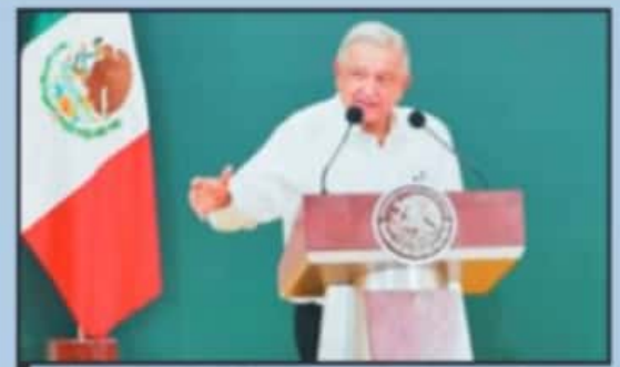
LÓPEZ OBRADOR ATENDIÓ LAS DEMANDAS SOBRE EDUCACIÓN

El consultado añadió que "La exigencia es para recordarle al señor presidente que, en las mesas tripartitas, durante dos años de su gobierno y el gobierno estatal, si se reconoce que el gobierno federal le ha puesto voluntad, pero no resuelve todos los compromisos".