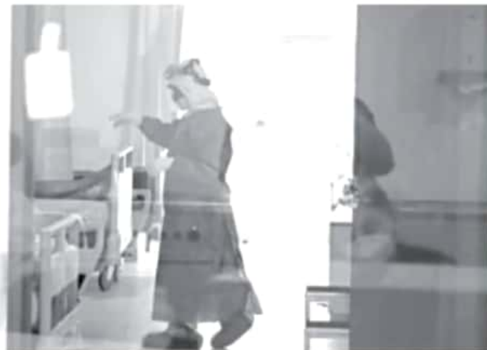
Las camas reconvertidas para pacientes con Infecciones Respiratorias Agudas Graves, de la SSM, el IMSS e ISSSTE se encuentran al 100 %, mientras que, en el sector privado, se registra un 85 %.

En el micrositio bit.ly/MichCOVID-19 , encontrará toda la información del padecimiento.