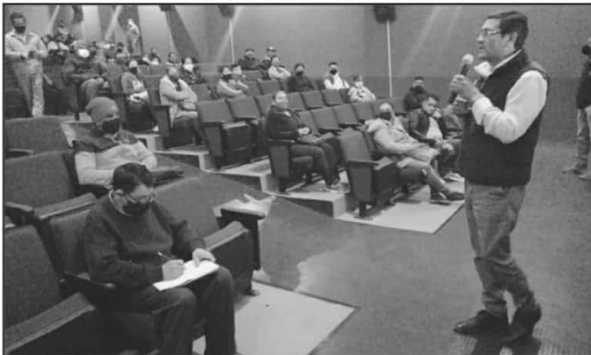
AUTORIDADES DE SALVADOR ESCALANTE Y TZINTZUNTZAN ANUNCIAN UN PLAN DE SANIDAD MÁS RIGUROSO PARA EVITAR QUE SE PROPAGUEN LOS CONTAGIOS.

Sabemos que no podemos dañar más la economía de las personas, por eso en conjunto con comerciantes acordamos los horarios y la aplicación de las medidas sanitarias