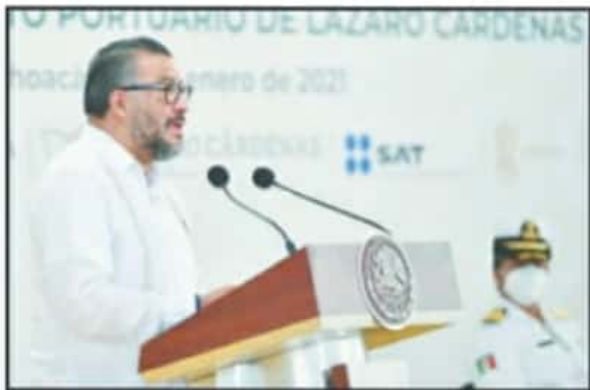
EL DIRECTOR GENERAL DE ADUANAS, HORACIO DUARTE ACOMPAÑÓ A AMLO.