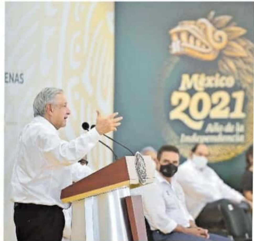
AMLO se comprometió a cerrarle el paso al narcotráfico

Por su parte el gobernador del estado Silvano Aureoles Conejo, coadyuvará en