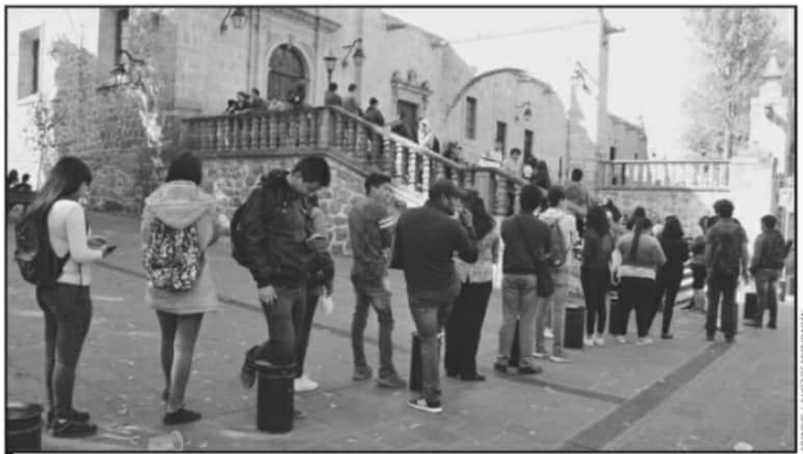
TODAVÍA EN EL 2020 LOS JÓVENES UNIVERSITARIOS TENÍAN QUE HACER LARGAS FILAS PARA REALIZAR SUS TRÁMITES Y SUS PAGOS EN LA OFICINA DE TESORERÍA.

nera coordinada para atender estos temas por lo cual señaló hasta el momento se ha podido garantizar el servicio.