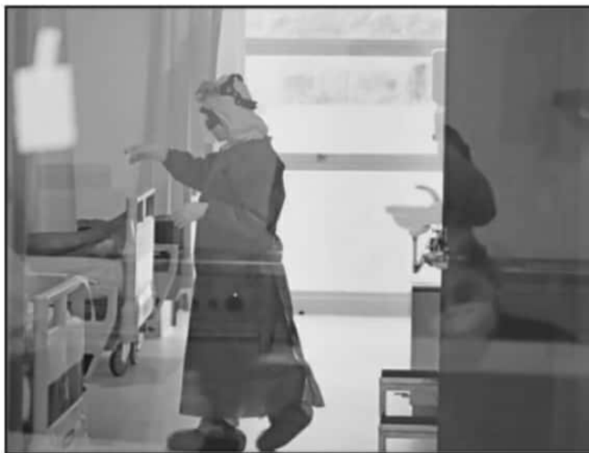
SE HA ADVERTIDO QUE PSICOLÓGICA Y FÍSICAMENTE EL PERSONAL DE LA SALUD SE ENCUENTRA AL BORDE DEL COLAPSO.

han sufrido mil 324 casos de contagio; estomatólogos con 174 detecciones; laboratorista con 119 casos y el personal administrativo y técnico de los hospitales han registrado mil 149 casos en total.