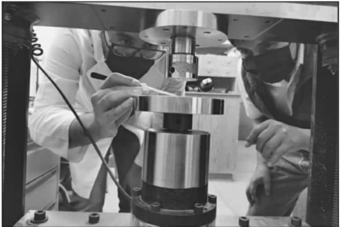
ESTUDIANTES DEL ITM ENCABEZAN UN GRAN PROYECTO PARA CREAR PRÓTESIS, IMPLANTES Y PIEZAS QUIRÚRGICAS MÁS AMABLES CON EL CUERPO HUMANO.

El desarrollo del proyecto actualmente es a nivel laboratorio, en el cual el estudiante utiliza titanio y aleación de titanio 64 en polvo, que actualmente es el más utilizado y estudiado para la elaboración de piezas de