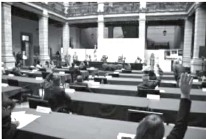
Las sanciones podrían llegar a una amonestación por escrito y un apercibimiento sobre las posibles sanciones, así como solicitarle que se retire de la vía pública, hasta la imposición de una multa.

En consecuencia, los procedimientos de sanción van desde una invitación respetuosa por parte de las autoridades sanitarias y municipales para usar correctamente el cubrebocas, una amonestación por escrito y un apercibimiento sobre las posibles sanciones, así como solicitarle que se retire