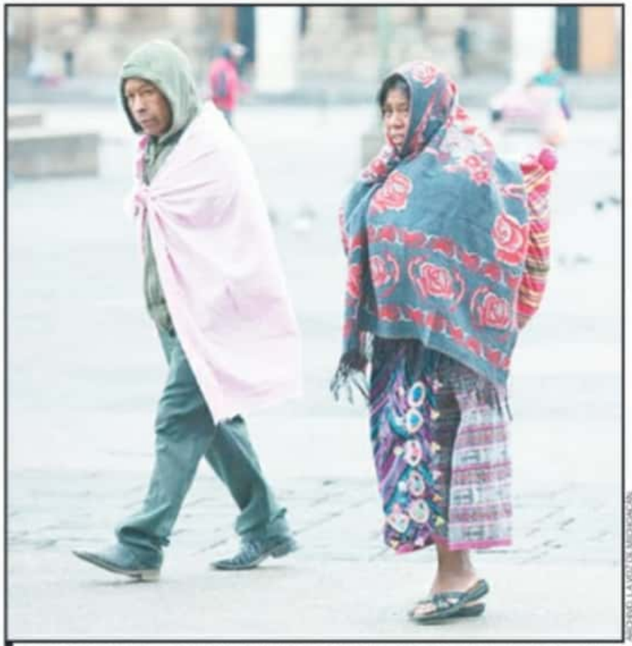
SON MÁS DE 40 PUNTOS EN LOS QUE SE ADVIERTEN UN ALTO GRADO DE RIESGO POR EL FRÍO DESDE LOS ÚLTIMOS MESES.

para este 2021 únicamente se han contabilizado cerca de 26 personas en condiciones de indigencia.