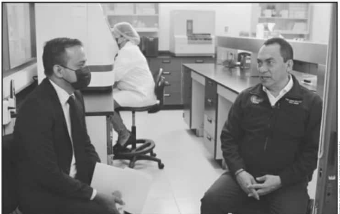
EL FISCAL AFIRMÓ QUE DESDE HACE AL MENOS UN MES, AL MENOS DOS INSTITUTOS POLÍTICOS HAN MANIFESTADO PÚBLICAMENTE INTIMIDACIÓN Y AMENAZAS

El exhorto de Adrián López Solís a los institutos políticos es a no permitir que las agresiones e intimidaciones queden impunes, por lo que manifestó que la denuncia es el mecanismo a través del cual la fiscalía podrá intervenir para brindar protección conjunta con las cor-