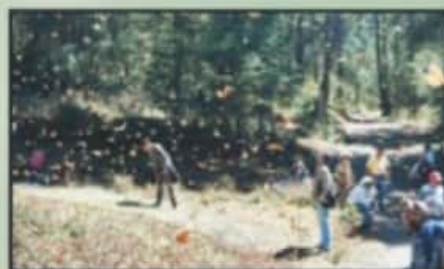
CON LA CAIDA DE LOS INGRESOS POR LOS VISITANTES, EL PANORAMA PARA CIENTOS DE FAMILIAS ES DELICADO.