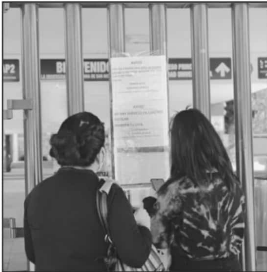
RECTORÍA DE LA UNIVERSIDAD MICHOACANA DE SAN NICOLÁS DE HIDALGO EXHORTA A NO FRENAR LABOR ACADÉMICA.

"Sin embargo, es de dominio público que ese retraso no obedece a una decisión de la autoridad universitaria, la Casa de Hidalgo siempre ha sido solidaria y defensora del bienestar de sus trabajadores; no olvidemos que, para solventar el adeudo, se han realizado los trámites necesarios y, como consecuencia, el saldo requerido se encuentra garantizado para realizar los pagos faltantes en cuanto sea posible", señaló en el