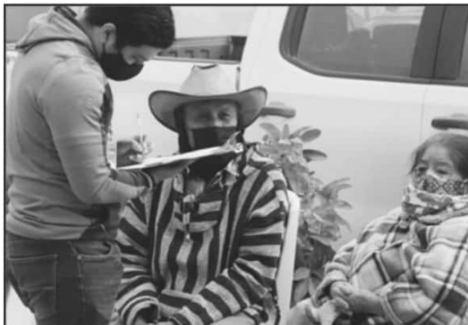
POR FALTA DE EQUIPO O CONOCIMIENTO, VARIOS ADULTOS MAYORES DE 60 AÑO NO PUEDEN REALIZAR SU REGISTRO.

Cabe mencionar que la atención será tanto para los mayores de 60 años que residen en esta ciudad o cabecera municipal como para el resto de los habitantes en las comunidades rurales del municipio, donde se estima que el