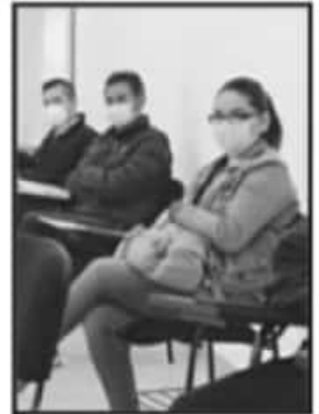
ELEMENTOS DE ATENCIÓN PREHOSPITALARIA RECIBEN VACUNA.

"Muy pronto también arrancaremos la construcción del cuartel de la Policía Michoacán que tendrá capacidad para 240 elementos y contará con todo lo que se requiere", agregó el mandatario.