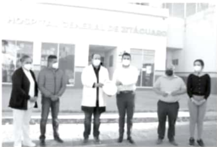
Los médicos y personal del sector salud tiene un año dando la batalla, muchos de ellos no han descansado, están agotados y no han podido estar con sus seres queridos.

-Resalta la labor invaluable de médicos y personal del sector salud