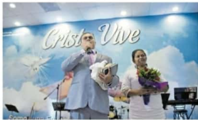
Encuentro en el Centro Cristiano Ministerio Vida Nueva / CUARTOS CUERPO

Michoacán se encuentra debajo de Guanajuato con 93.8 por ciento; Zacatecas, 93.5; Aguascalientes, 92.9 por ciento y Jalisco que tiene 91.9 por ciento, de acuerdo con los resultados del Inegi en el