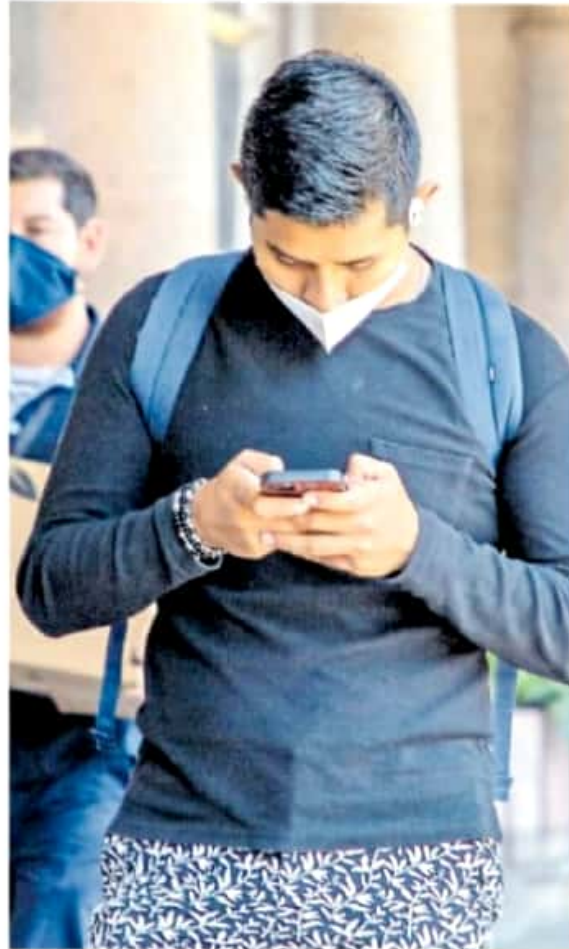
En Michoacán el uso de teléfono celular se incrementó del 59.3 % en 2010 a 87.6 % en 2020.