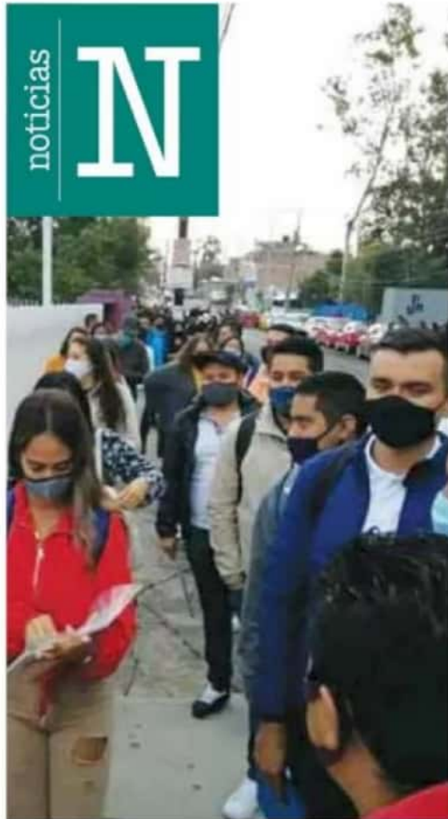
Empleos. Serían contratados mil 200 egresados normalistas de las generaciones 2019 y 2020 y mil 200 trabajadores eventuales.