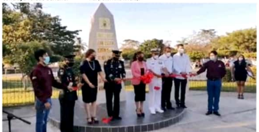
Momentos de la inauguración del Obelisco a los Niños Héroes de Chapultepec y a los Cadetes de la Heroica Escuela Naval de Veracruz. (Foto: Kike Rivera).