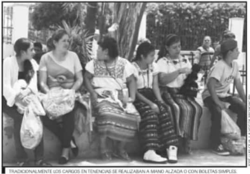
TRADICIONALMENTE LOS CARGOS EN TENENCIAS SE REALIZABAN A MAND ALZADA O CON BOLETAS SIMPLES.