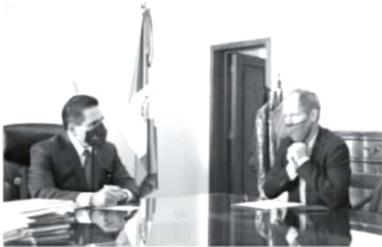
Para la atención de la infancia y la adolescencia en el presente año se etiquetaron 791 millones de pesos, un incremento del 0.2 por ciento en términos reales respecto del año 2020.

-Se reúne gobernador con representante de UNICEF en México, Christian Skoog -Eliminar las barreras de acceso a mejores condiciones de vida para niñas, niños y adolescentes, es nuestra tarea como gobiernos, señala