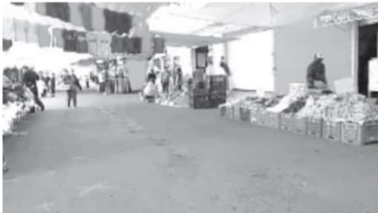
Las ventas están a un 20% de lo normal, y los más afectados somos quienes vendemos productos frescos de la canasta básica, ya que al no haber ventas se nos echan a perder, dijo el líder.