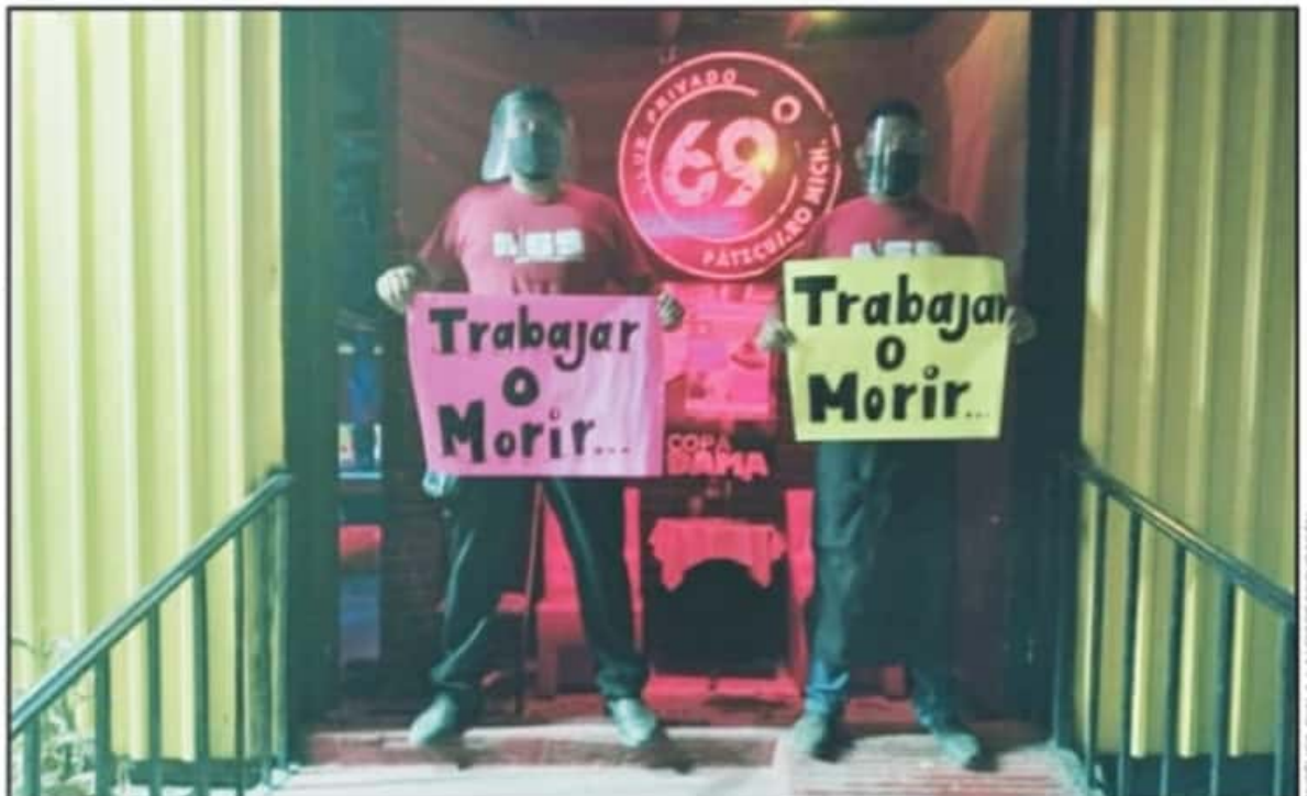
EN LAS ENTRADAS DE LOS CENTROS NOCTURNOS Y DENTRO DE ESTOS, LOS EMPLEADOS MOSTRARON SU INCONFORMIDAD ANTE LAS RESTRICCIONES ACTUALES.

Los manifestantes, quienes también pertenecen a la Alianza por la Salud y la Economía (ASE) en Pátzcuaro y la integran hoteles, restaurantes, transportistas, del sector comercial tanto de la explanada del mercado como del libramiento Ignacio Zaragoza, gimnasios, los bares y cantinas, dieron a conocer que la necesidad de trabajar y generar economía los orilló a realizar la protesta, "para hacerle saber a nuestro gobierno que somos un brazo económico de la sociedad,