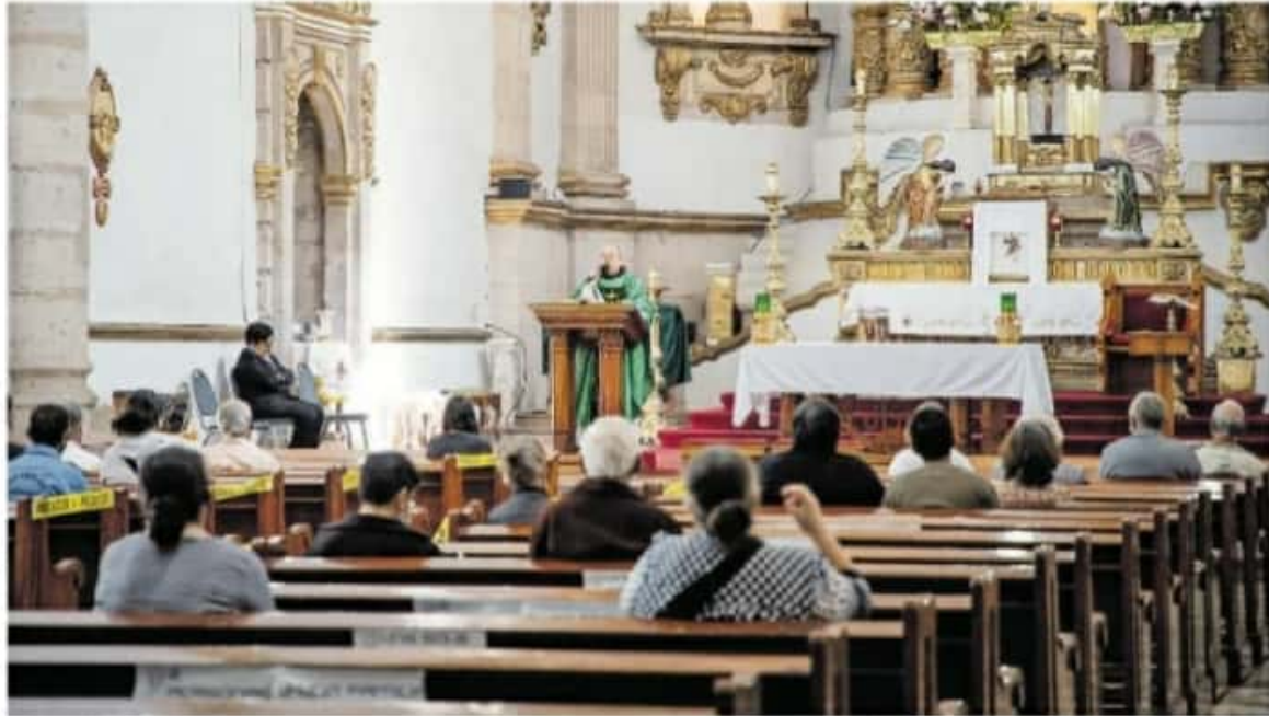
Del total de la población de la entidad, el 91.5 % profesa el catolicismo

MILLONES 7 mil 421 nuevos católicos se han sumado en los últimos diez años