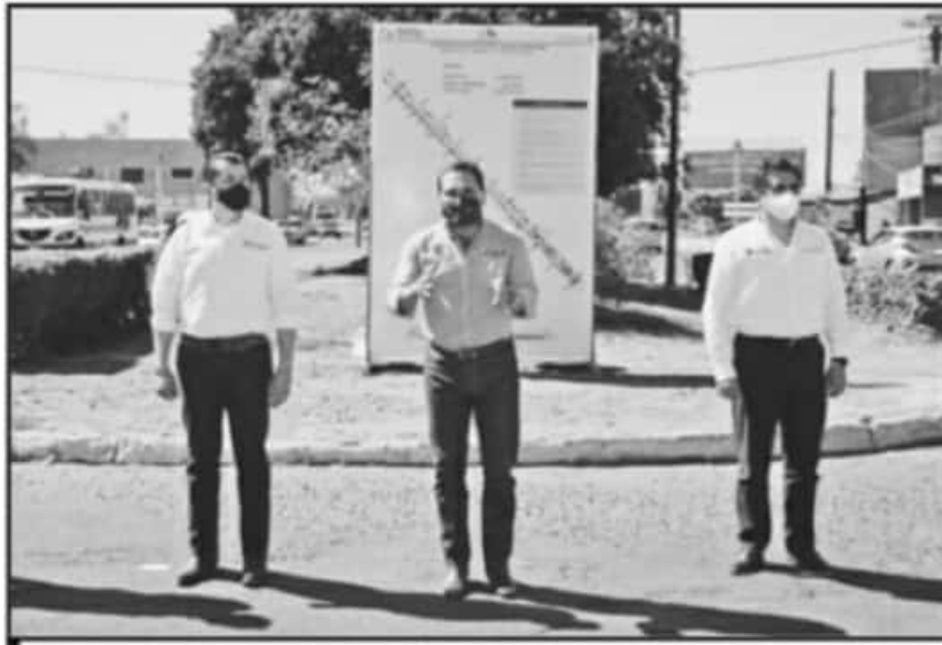
LAS OBRAS PLANTEADAS BENEFICIARÁN A MILES DE HABITANTES EN EL MUNICIPIO, ASEGURA EL MANDATARIO.

"Vamos a invertirle a esta vialidad que atraviesa todo el municipio, para hacerla mejor y