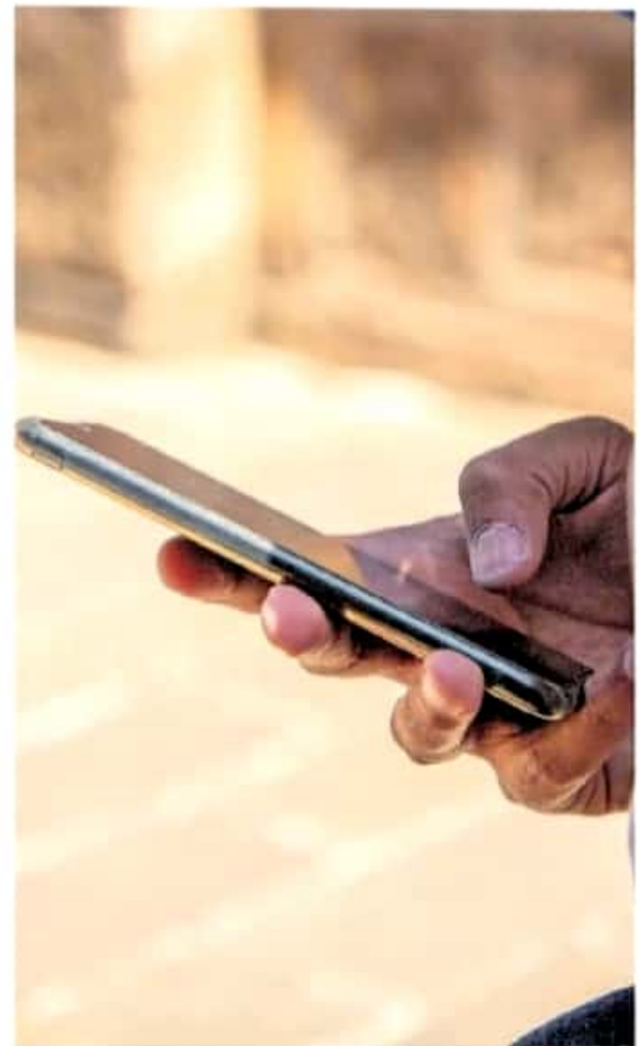
La sociedad se está quedando sin estímulos para interactuar de forma física.