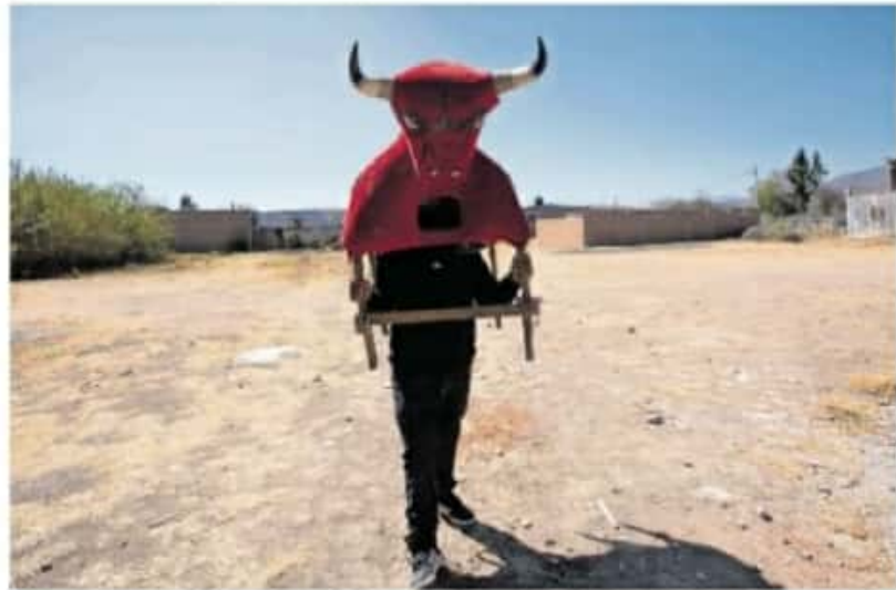
Este año la elaboración de los toros se quedó a medias

Aunque había voces de habitantes que pe-