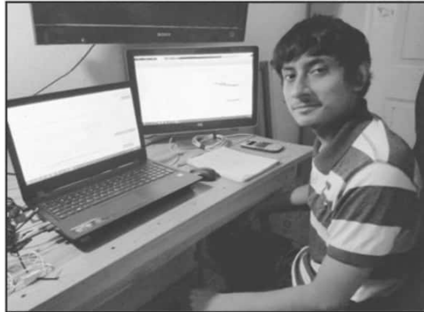
LOS CURSOS DE INDUCCIÓN SE LLEVARON A CABO DE MANERA VIRTUAL A TRAVÉS DE LA APLICACIÓN DE ZOOM

Agregó que los cerca de 800 estudiantes presentaron su examen de admisión en mayo de 2020 y fueron seleccionados para el proceso de admisión otoño-invierno.