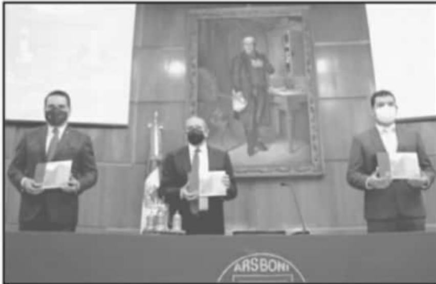
DURANTE EL EVENTO SE RESALTO QUE LOS FUNCIONARIOS ESTÁN OBLIGADOS A INFORMAR SU LABOR A LA SOCIEDAD.