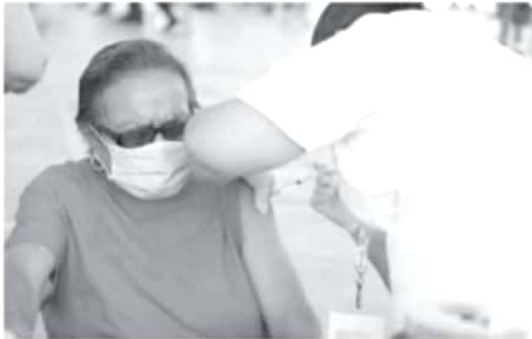
Los beneficiados con la vacuna son personas que residen en comunidades de los municipios de Villamar (960), Aporo (413), Tingambato (670), Buenavista (1264), Apatzingán (1090), Parícutaro (1108) y Múgica (1100).

• El biológico es aplicado por personal de enfermería capacitado y con experiencia