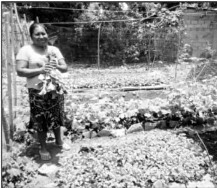
HASTA 38 PROGRAMAS DEL CAMPO HAN DESAPARECIDO EN LOS ÚLTIMOS 2 AÑOS EN EL ESTADO DE MICHOACÁN

Estoy revisando lo que faltan de recursos, vienen tiempos muy limitados", explicó.