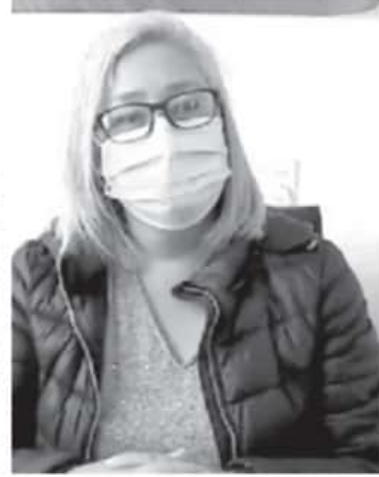
Hay mucho interés de la población de los municipios del oriente en saber la fecha de la llegada de las vacunas para adultos mayores.

En cuanto a los comentarios de los adultos mayores que ya se han vacunado, señaló que prevalece un agradecimiento sincero por tomarlos en cuenta y darles