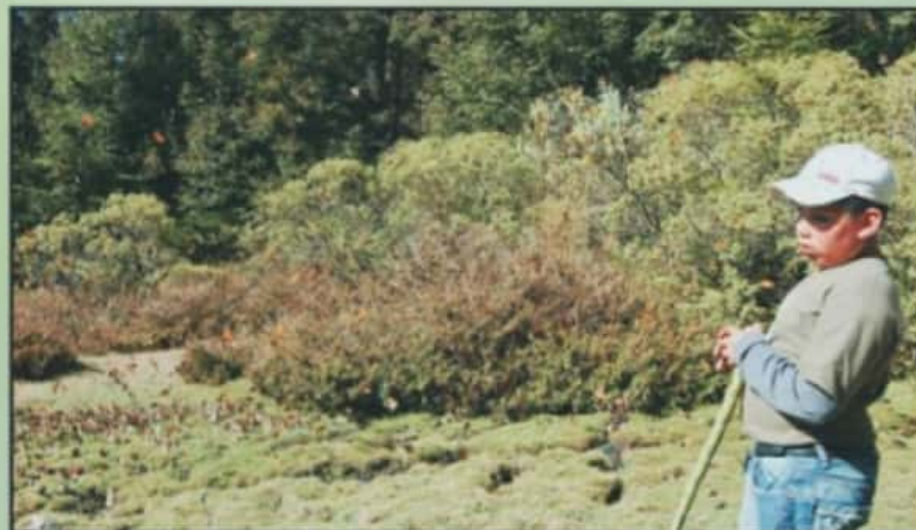
ESTE AÑO LA HISTORIA EN LOS SANTUARIOS DE LA MARIPOSA MONARCA FUE MUY DIFERENTES, DEBIDO A LA PANDEMIA.

actividades no esenciales en el mes de noviembre y la capacitación de los trabajadores de los santuarios, la actividad turística a nivel mundial se ha desplomado.