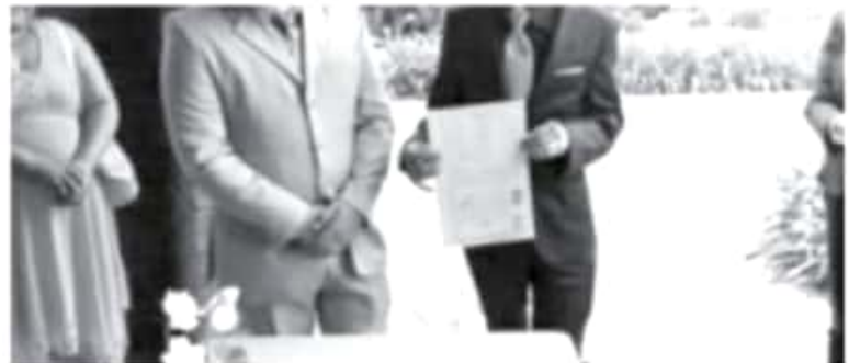
El primer matrimonio igualitario en Zitácuaro ocurrió el 26 de julio de 2016, fue una pareja de hombres, y la ceremonia se hizo en las oficinas del registro civil.

"Estas bodas han sido de las más emotivas que yo he celebrado en mi vida, en todo momento de la ceremonia se siente el sentimiento a flor de piel, en cada una de ellas me he sentido emocionada de ser testigo de la unión de dos personas", expresó.