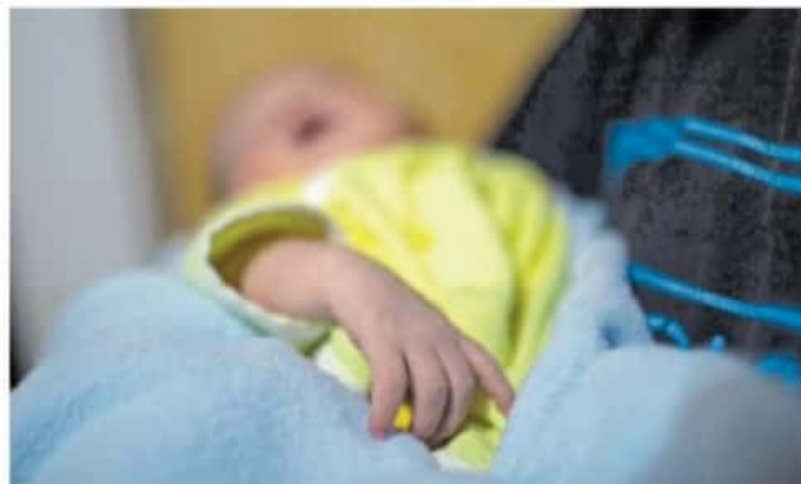
Michoacán tuvo su "época de oro" poblacional entre 1950 y 1980 / IVÁN ARIAS

En este sentido, de los 27 municipios que vieron disminuida su población en los últimos 10 años, 24 tienen un índice de intensidad migratoria alto y muy alto", remarcó.