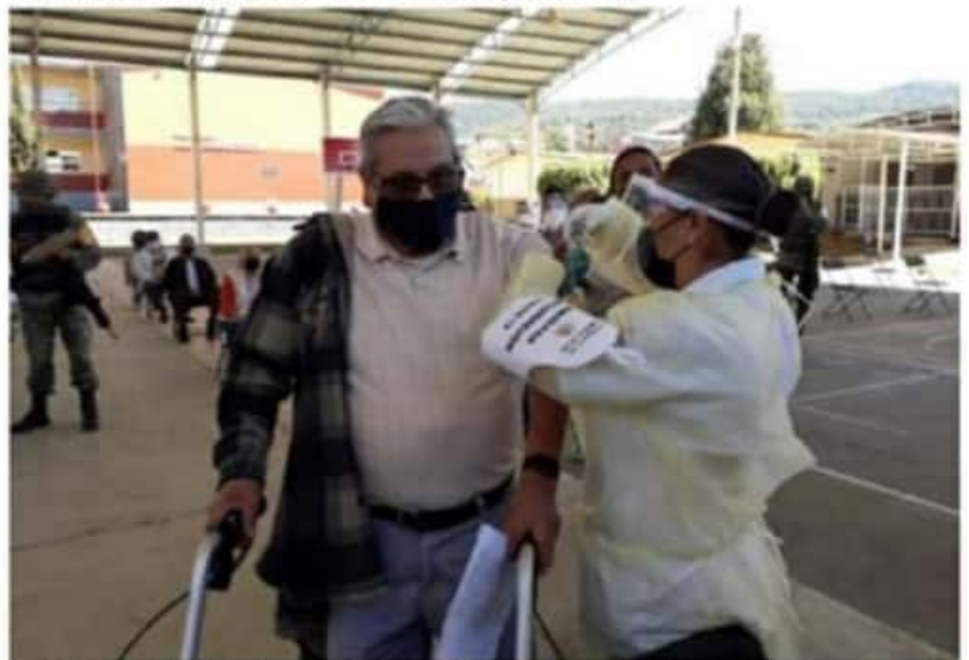
En Michoacán se han aplicado ya más de 13 mil dosis de vacuna contra el COVID-19 a los adultos mayores de 60 años de edad.

Se mantiene a disposición de la ciudadanía el 800-123-2890 con 11 líneas para resolver todas sus dudas médicas, así como el micrositio bit.ly/MichCOVID-19 , donde encontrará toda la información del padecimiento.