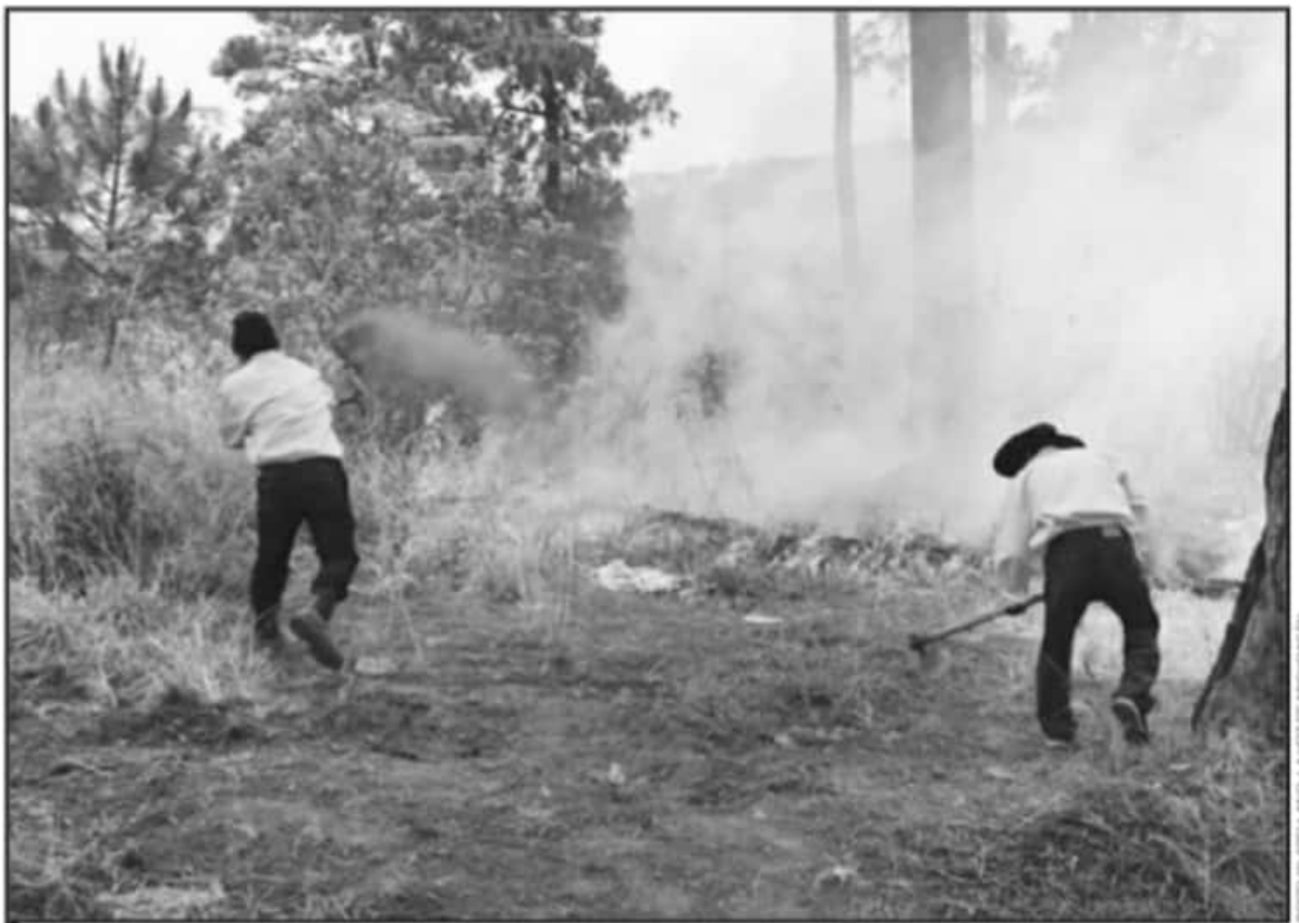
POR LA PRONTA MOVILIZACIÓN DE ELEMENTOS DE LA CONAFORY LA COFOM, SE LOGRARON MITIGAR LAS LLAMAS ANTES DE QUE AUMENTARAN SU MAGNITUD.

El historial climático de este y el pasado año, permite establecer que la temporada de estiaje 2021 será bastante crítica, sobre todo porque en el pasado periodo de lluvias fue poca la humedad que lograron los bosques de la región y en la actualidad las bajas tempe-