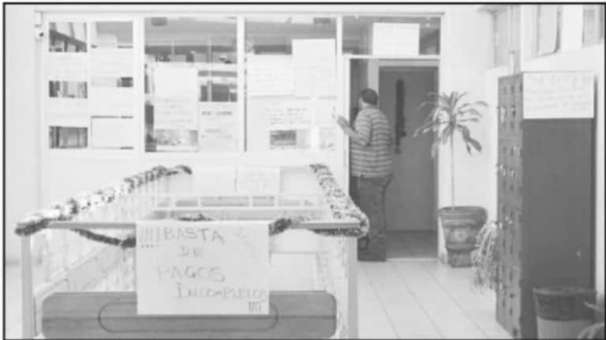
SE ESPERAN QUE EL PRÓXIMO LUNES LAS AUTORIDADES PUDIERAN TENER UN ACERCAMIENTO PARA QUE LOS TRABAJADORES TENGAN SEGURIDAD DE SUS PAGOS.

La Secretaría de Finanzas ya no convocó a los gremios a reuniones para poder atender los adeudos pendientes