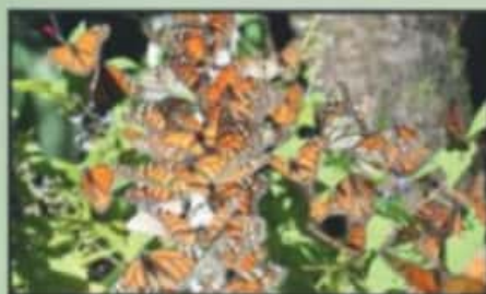
EL SEGUNDO MES DEL AÑO ES EL DE MAYOR INFLUENCIA DE VISITANTES TANTO NACIONAL COMO INTERNACIONAL.

En promedio cada año superó al otro gracias a la promoción, protección y trabajo de las comunidades enclavadas en el oriente Michoacano. Esta temporada fue distinta, aunado a que abrieron semanas más tarde por el cierre de