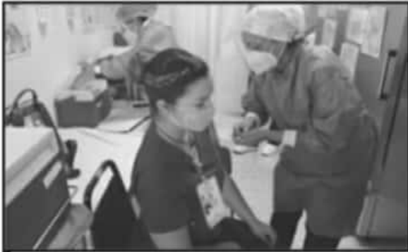
A TRAVÉS DE DONATIVOS BLANDARON AL PERSONAL DE SALUD QUE LABORAN EN ESPACIOS DESTINADOS A PACIENTES COVID-19 EN URUAPAN, AFRIMAN.