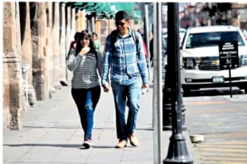
Por practicidad, las parejas optan cada vez más por la unión libre.

De acuerdo con cifras del Inegi, cada vez es mayor el número de personas que rechazan la unión ante alguna institución