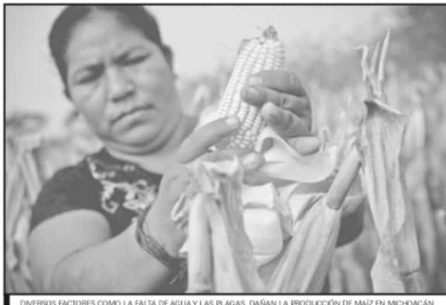
DIVERSOS FACTORES COMO LA FALTA DE AGUA Y LAS PLAGAS, DAÑAN LA PRODUCCIÓN DE MAÍZ EN MICHOACÁN.

2019), se anticipa que el valor de la producción de la cosecha del último ciclo rondaría los 5 mil 788 millones de pesos.