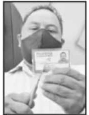
RENUNCIARON A SU MILITANCIA.

unidad debe de prevalecer, nosotros como Poder Legislativo tenemos la responsabilidad de generar las leyes y las sentencias que en su momento el Poder Judicial aplicará, por ello es importante mantener la coordinación entre instituciones, dependencias y poderes", finalizó.