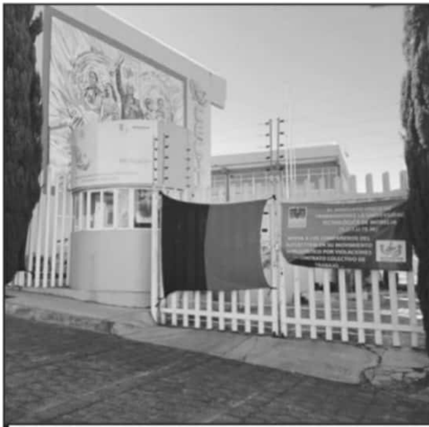
LOS AGREMIADOS MANTIENEN EL PARO DE ACTIVIDADES ANTE LA FALTA DE PROPUESTAS POR PARTE DE LA AUTORIDAD.

de vales de despensa para los trabajadores