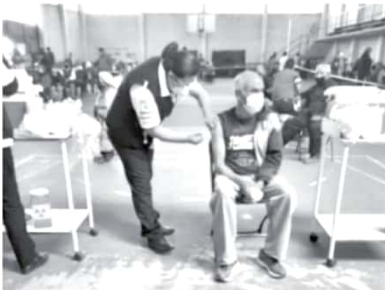
Fueron 413 las personas mayores que recibieron la inmunización de acuerdo con la estrategia federal que ejecuta el personal de la SSM, nadie presentó reacción alguna al biológico.

Se mantiene a disposición de la ciudadanía el 800-123-2890 con 11 líneas para resolver todas sus dudas médicas, así como el micrositio bit.ly/MichCOVID-19 , donde encontrará toda la información del padecimiento.