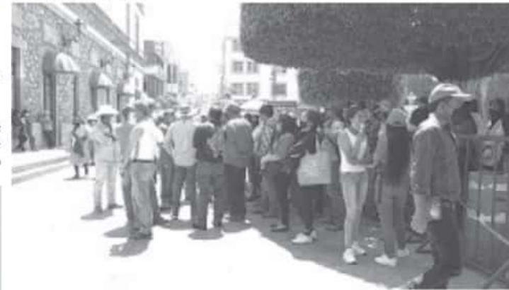
Por muchos años las comunidades hemos sido abandonadas, no hay obras, y se requiere un recurso que se aplique de forma directa, que se vea el trabajo.