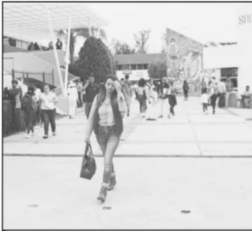
EL OBJETIVO ES QUE LOS DOCENTES DEL ESTADO CUMPLAN EN TIEMPO Y FORMA CON LOS REQUISITOS DOCUMENTALES.

se requisa en el Anexo 3 de la Convocatoria del citado Proceso.