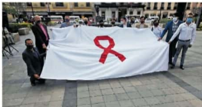
En tres décadas, 100 mil mexicanos murieron de SIDA

En México, el primer caso de cólera se registró en 1991 y el último, tuvo lugar en el 2001, es decir, diez años después, lo que