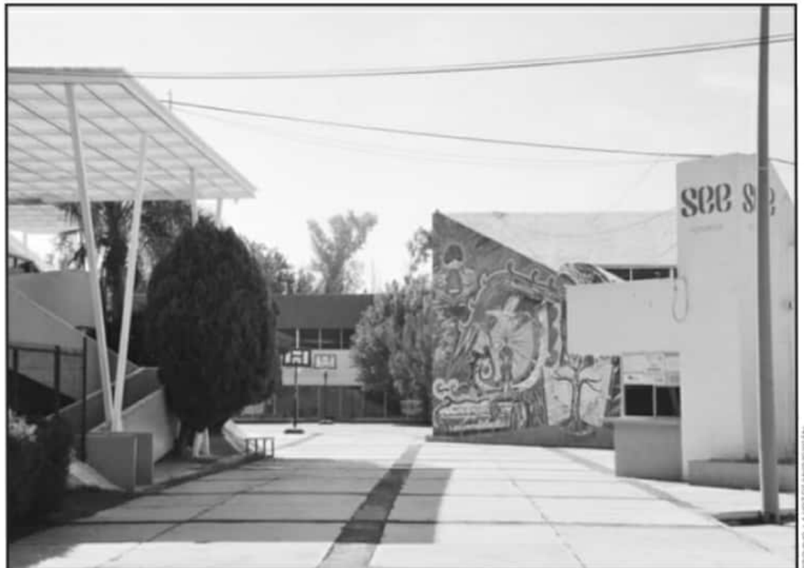
LA SECRETARÍA DE EDUCACIÓN EN EL ESTADO REFORZARÁ PROGRAMAS DE CAPACITACIÓN EN LAS ESCUELAS PARA UN REGRESO A CLASES SEGURO.

"El deporte, en específico el fútbol me ha dado todo, me ha enseñado respeto, solidaridad, perseverancia, entre otros valores que son muy importantes y que a través del deporte pueden aprender, ahora que soy docente, tengo la necesidad de