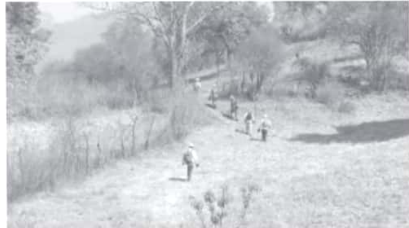
Esta corporación municipal, conformada para el combate de incendios forestales, también asiste este tipo de siniestros que, en su mayoría, son provocados.

Se le recuerda a la población en general, llamar al 911 para que los cuerpos de emergencia atiendan desde un conato hasta cualquier tipo de fuego, además se exhorta a tener todos los cuidados