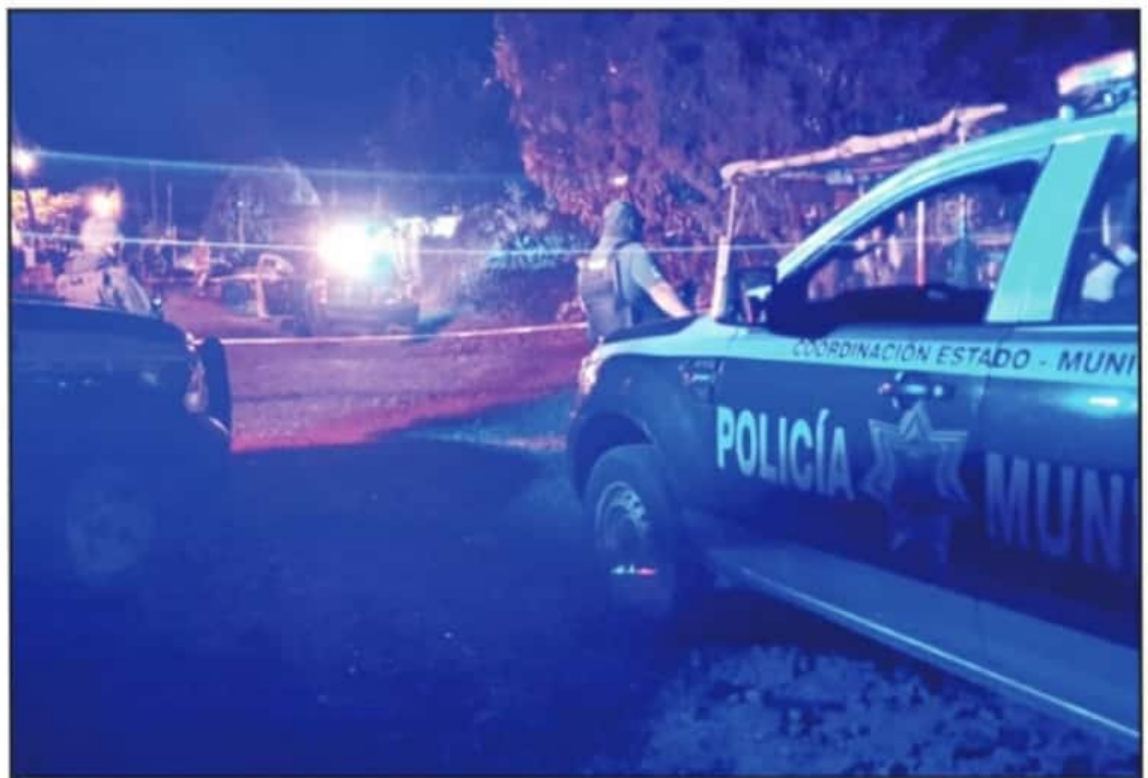
LOS GRUPOS DELICTIVOS HAN AFECTADO LOS MUNICIPIOS CON MAYOR POBLACION DENTRO DEL ESTADO, EN LOS CUALES SE REGISTRAN ALTOS INDICES DE CRIMEN.

Hay coincidencias entre los municipios con mayor tasa de homicidios y narcomenudeo; en el listado cotejado con informa-