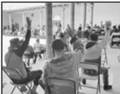
ASEGURAN QUE AYUNTAMIENTO NO CUMPLIÓ ACUERDOS