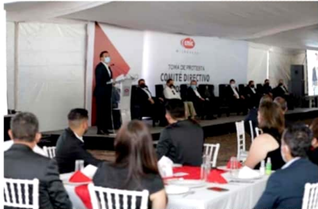
Agradecen constructores la asignación de obras a empresas locales y el pago de los adeudos pendientes.

"Hicimos un muy buen trabajo, al día de hoy somos 233 empresas agremiadas a la Cámara y sin ustedes no habríamos logrado la presencia que hoy tenemos; tuvimos la participación en obras estatales que significó la derrama económica de varios millones de pesos para el sector", concluyó.