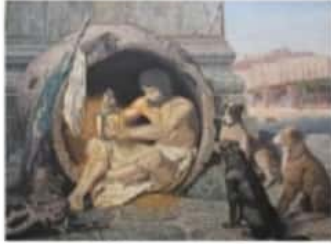
Obra de Donato