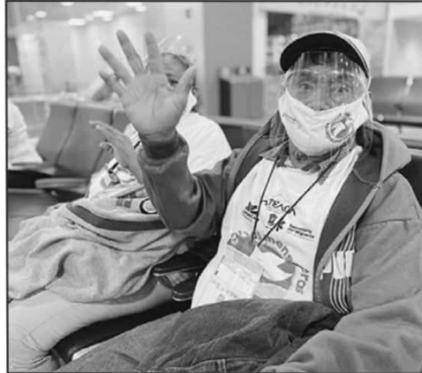
DURANTE LOS CUATRO AÑOS SE CONFORMARON 475 GRUPOS DE PERSONAS ADULTAS ORIGINARIAS DE MICHOACÁN.

Además de la reunificación familiar, otra de las principales virtudes del programa Palomas Mensajeras es la promoción de la cultura de cada región del estado de Michoacán, entre las nuevas generaciones que nacen