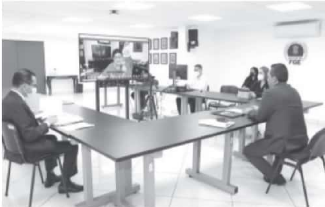
El Fiscal General destacó la importancia de que, durante estos comicios, se pondere el respeto

-En el marco del Convenio de Colaboración para la Atención de Delitos Electorales, acordado en la Conferencia Nacional de Procuración de Justicia (CNPJ), titulares de las fiscalías y procuradurías de todo el país, se reunieron para analizar aspectos y establecer líneas de acción en la materia