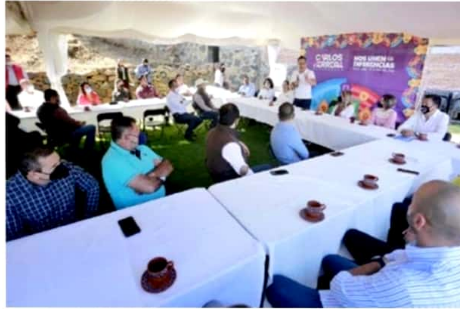
De acuerdo con el candidato a la gubernatura del Equipo por Michoacán, el Pueblo Mágico tiene todo para convertirse en uno de los principales puntos que incentiven la economía de Michoacán.

un año, aportaron ganancias de hasta mil 200 millones de pesos, según cifras de la Asociación de Productores y Empacadores de Aguacate de Michoacán (PEAM).