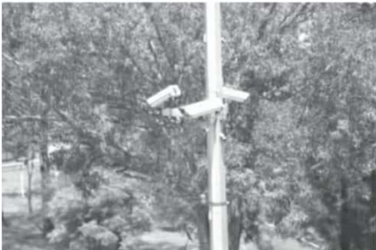
Desde el Centro de Mando de Morelia, que se conecta a los diez Subcentros ubicados en las diferentes regiones de Michoacán, se continúa con las labores de vigilancia durante las 24 horas del día.

En caso de requerir apoyo ante alguna eventualidad o emergencia, se mantiene abierta la línea 911 las 24 horas del día los 7 días de la semana, donde por medio de las denuncias, se combaten actos que vulneren la seguridad de la ciudadanía.