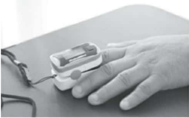
Para los pacientes crónico degenerativos el virus puede ser mortal, si no tienen sus niveles controlados, por lo que se complica el padecimiento, existiendo un riesgo alto de perder la vida.

* Personas con enfermedades crónico degenerativas deben extremar precauciones