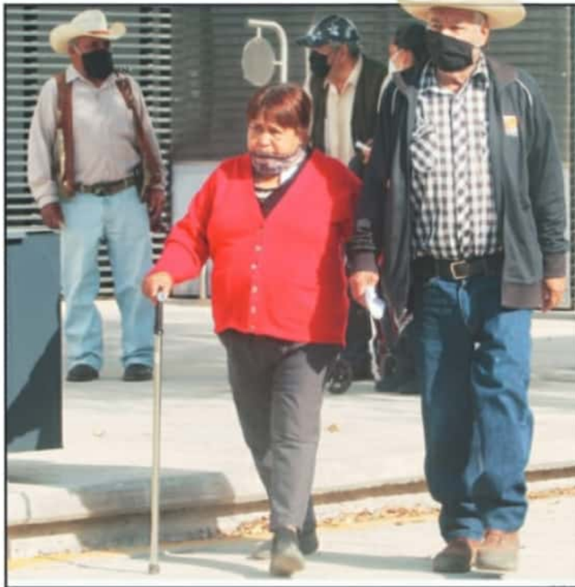
ESPECIALISTA EXHORTA A LA GENTE PARA QUE MANTENGA ESTABLE LOS NIVELES DE GLUCOSA Y PRESIÓN ARTERIAL

El 60 por ciento de los pacientes con enfermedades crónicas descontroladas tiene complicaciones asociadas después de haber padecido coronavirus