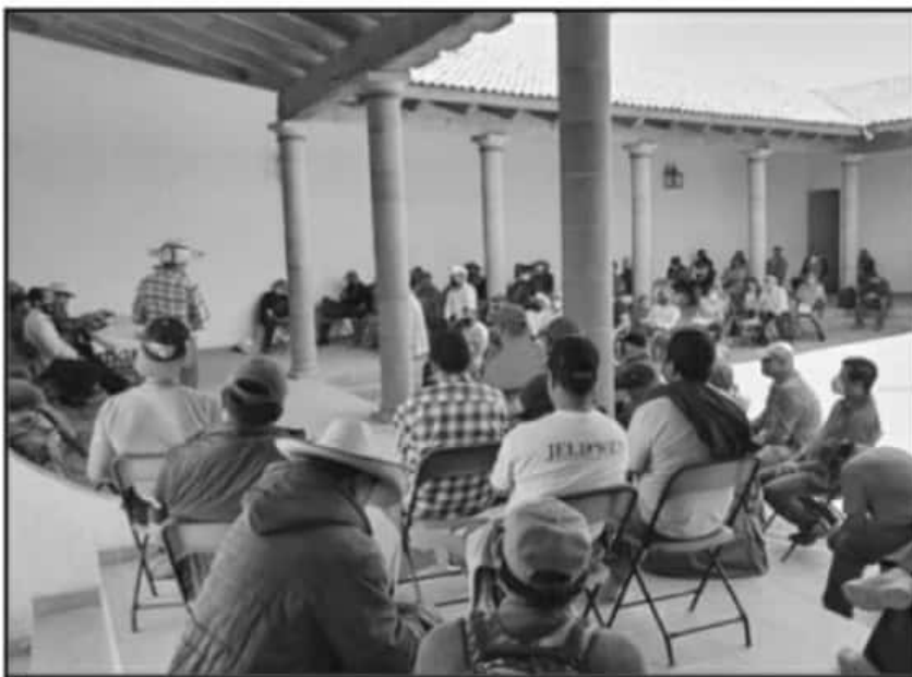
39 COMUNIDADES INTEGRANTES DEL CONSEJO INDÍGENA ACORDARON DAR SU APOYO A SANTA FE DE LA LAGUNA.

comunidad quien rompió la mesa de diálogo y eso no es verdad, eso lo hizo la presidenta al desconocer su propio acuerdo, engañan a la comunidad y tratan de manipular al desconocer los acuerdos plasmados en un acta de cabildo", detalló.