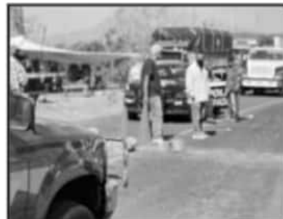
CONTINUARÁN BLOQUEOS CARRETEROS, ASEGURAN.