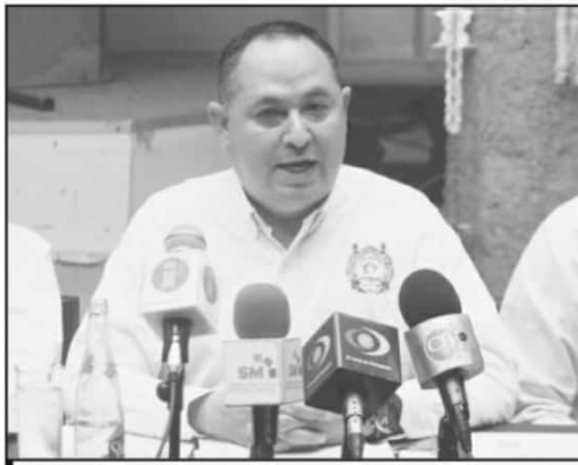
DIRIGENTE SINDICAL ADMITE QUE SON MÁS AFILIADOS O SOCIOS INTEGRADOS AL STUMICH QUE EN EL SUEUM.

dos que pudieran avanzar en este tema y agilizar los trámites, ante la junta local de conciliación y arbitraje y también a la misma pedirle que pueda darle celeridad a este proceso, para ser el sindicato que administre el CCT".