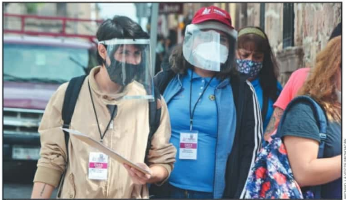
EL PASADO 17 DE MARZO DE 2020, EL AYUNTAMIENTO DE MORELIA APROBÓ QUE LOS TRABAJADORES DE LA TERCERA EDAD SE RESGUARDARAN EN SUS CASAS.

Respecto de la versión de que los sindicatos se negarían a que sus trabajadores regresen a las labores sin contar con el esquema completo de vacunación que consta de dos dosis, el funcionario respondió que de parte del