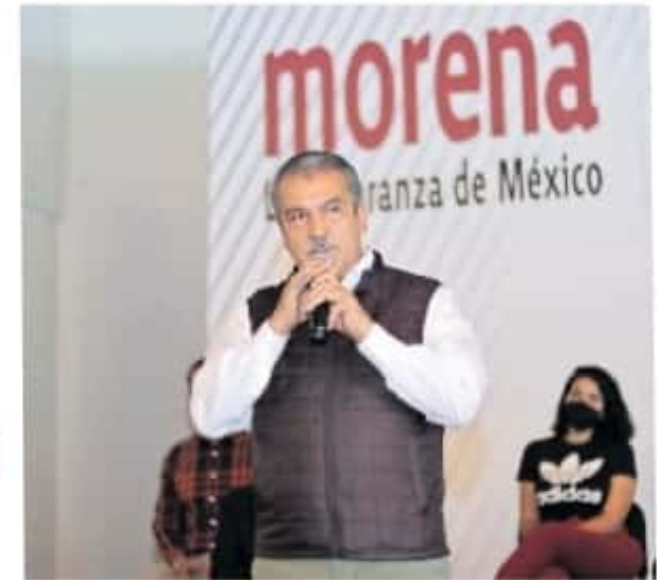
El equipo jurídico del candidato interpuso recursos de apelación

Una semana después, el 4 de abril, el Instituto Electoral de Michoacán (IEM) rati-