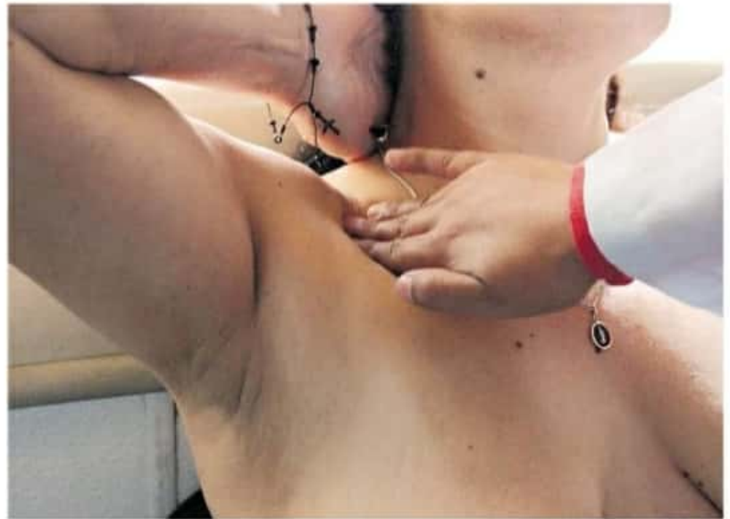
Las operaciones para la reconstrucción del pecho están entre los 200 mil y los 750 mil pesos

"Me hicieron tres operaciones, primero me quitaron un segmento de la mama izquierda y dos ganglios linfáticos con riesgo, pero se tuvo que hacer una segunda y me quitaron otro segmento, pero aún había una masa de riesgo que resultó en la mastectomía".