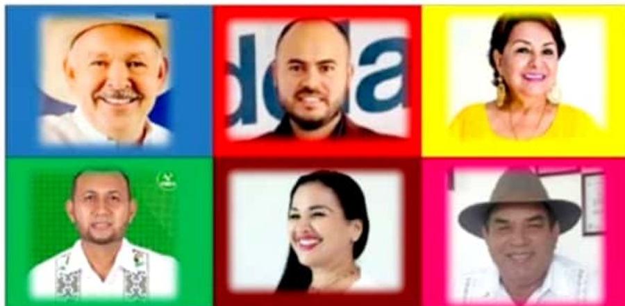
Los candidatos registrados para la presidencia municipal de Coahuayana, postulados por el PAN, PRI, PRD, PVEM Morena-Pt y Fuerza por México.