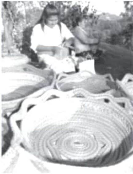
Las artesanías de ocochal ya se adoptaron como propias por las mujeres de Donaciano Ojeda, así como el bordado de los trajes tradicionales, especialmente de sus enaguas.

Zitácuaro, Mich. - Son hombres, mujeres y niños que con sus manos mágicas y hábiles convierten la hoja del ocochal en artesanías. Producto muy apreciado por los turistas pero saturado en el mercado, ya que tres cuartos de la comunidad mazahua de Donaciano Ojeda lo trabajan.