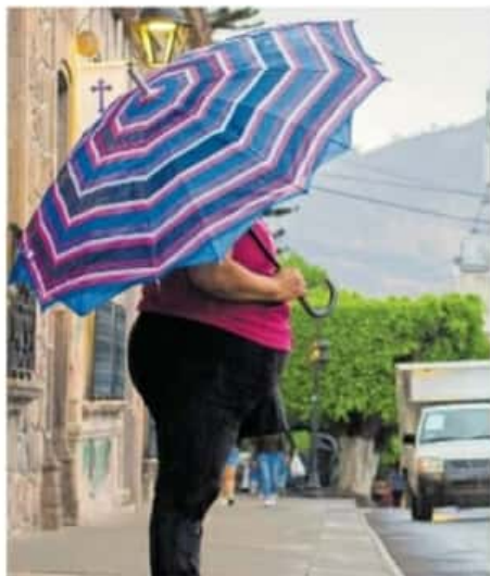
Mejorar la alimentación y hacer ejercicio es urgente ante la pandemia

Actualmente, una quimioterapia puede llegar a costar, por sesión, entre los 60 mil y 80 mil pesos. Una radioterapia oscila entre los 12 mil y los 25 mil pesos, los medicamentos pueden llegar a costar hasta 50 mil pesos, y las operaciones para la reconstrucción del pecho están entre los 200 mil y los 750 mil pesos.