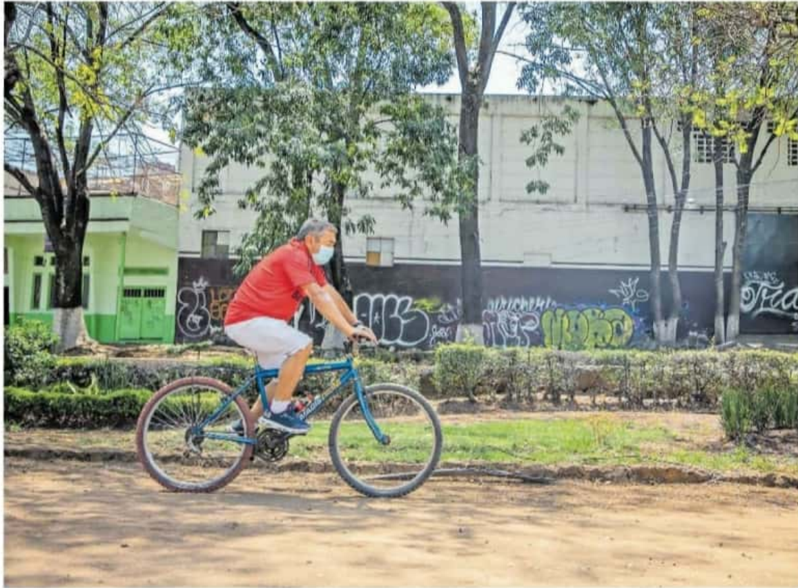
Sin una alimentación correcta, las horas invertidas en el deporte serán en vano