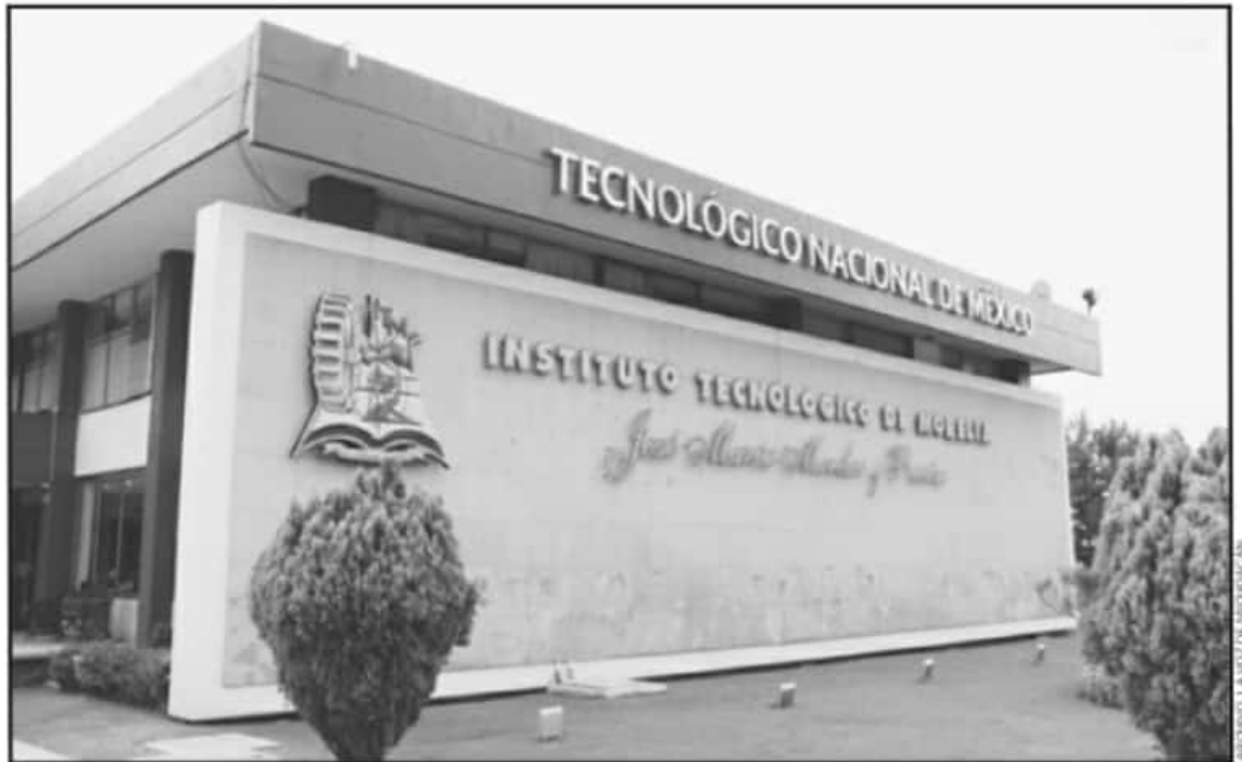
UNA NUEVA APORTACIÓN DE INVESTIGADORES Y ALUMNOS DEL TECNMY DE LA UNIVERSIDAD AUTÓNOMA DE SAN LUIS POTOSÍ PARA LA INDUSTRIA.

De acuerdo con el doctor e investigador del Posgrado en Metalurgia del TecNM campus Morelia, Garnica González, este proyecto busca determinar qué características internas de un acero de alta resistencia para la