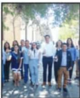
REALIZÓ REUNIÓN EN LAS ROSAS.

A través de los juzgadores federales, el Tribunal Electoral evidenció los descuidos del INE en la ruta fiscalizadora: la Unidad Técnica de Fiscalización no le proporcionó la “e.firma” a Morón, ni le abrió el sistema en línea para registrar aclaraciones ni le advirtió de la pérdida del derecho a registrar la candidatura en caso de incumplimiento.