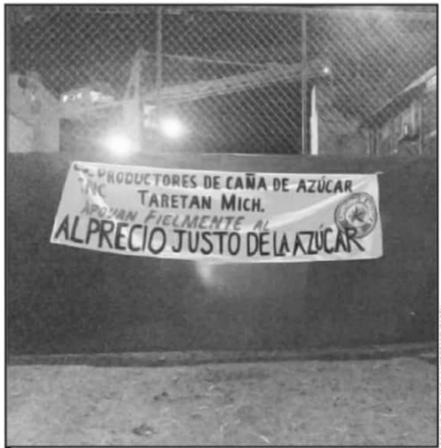
PRODUCTORES DE CAÑA DE AZÚCAR TOMARON EL INGENIO PARA EXIGIR MEJORES PRECIOS EN LA COMERCIALIZACIÓN

La protesta inició a las 6 de la mañana de este jueves y por acuerdo de los propios productores se escalonaron las guardias para motivar la participación de todos. De esta forma el primer cambio de turno para mantener la protesta se rea-