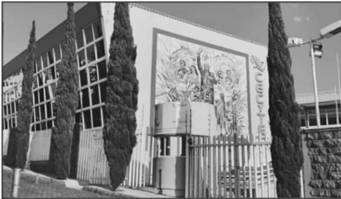
EL CECYTEM MANTIENE UN ADEUDO CON LOS TRABAJADORES DE PRESTACIONES DEL AÑO PASADO. UNA DE ELLAS DE POCO MÁS DE 9 MILLONES DE PESOS.

Expuso que el gremio sí ha sido sensible al otorgar tiempo a