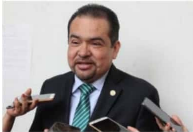
Es urgente exigir el compromiso de aquellos que aspiran a una diputación federal, para impulsar este tema que es prioritario frente a los embates al federalismo por parte del Gobierno de la República Tony Martínez.

que rompa con dos siglos de centralización de las decisiones políticas en la Presidencia de la República, y reconozca la soberanía de las entidades y al municipio libre.