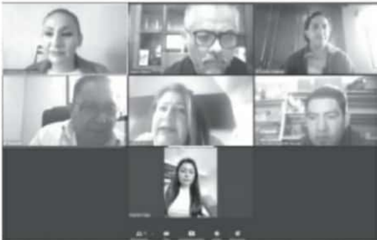
El presidente provisional rendirá protesta en la próxima sesión que se celebre, ante el Pleno del Congreso del Estado, para que a la brevedad entre en funciones de su nuevo encargo.