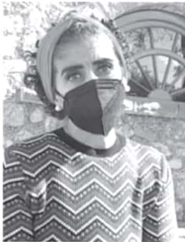
Con motivo de la pandemia del Covid-19, la subdirección de Cultura Municipal ha limitado todas sus actividades, actualmente se encuentran trabajando a puerta cerrada y a distancia.

Reiteró el llamado a la población a cuidarse, tomar en serio la emergencia sanitaria y acatar todas las disposiciones vigentes que la autoridad municipal ha dispuesto para bajar la ola de contagios.