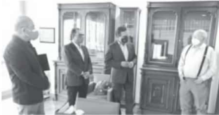
Aureoles Conejo mostró el interés general del Gobierno del Estado de dar seguimiento a la labor auditora y procesos de rendición de cuentas en el ejercicio de los recursos públicos.

-El Gobierno de Michoacán refrenda su disposición y voluntad para llevar a cabo procesos de rendición de cuentas, destaca Silvano Aureoles