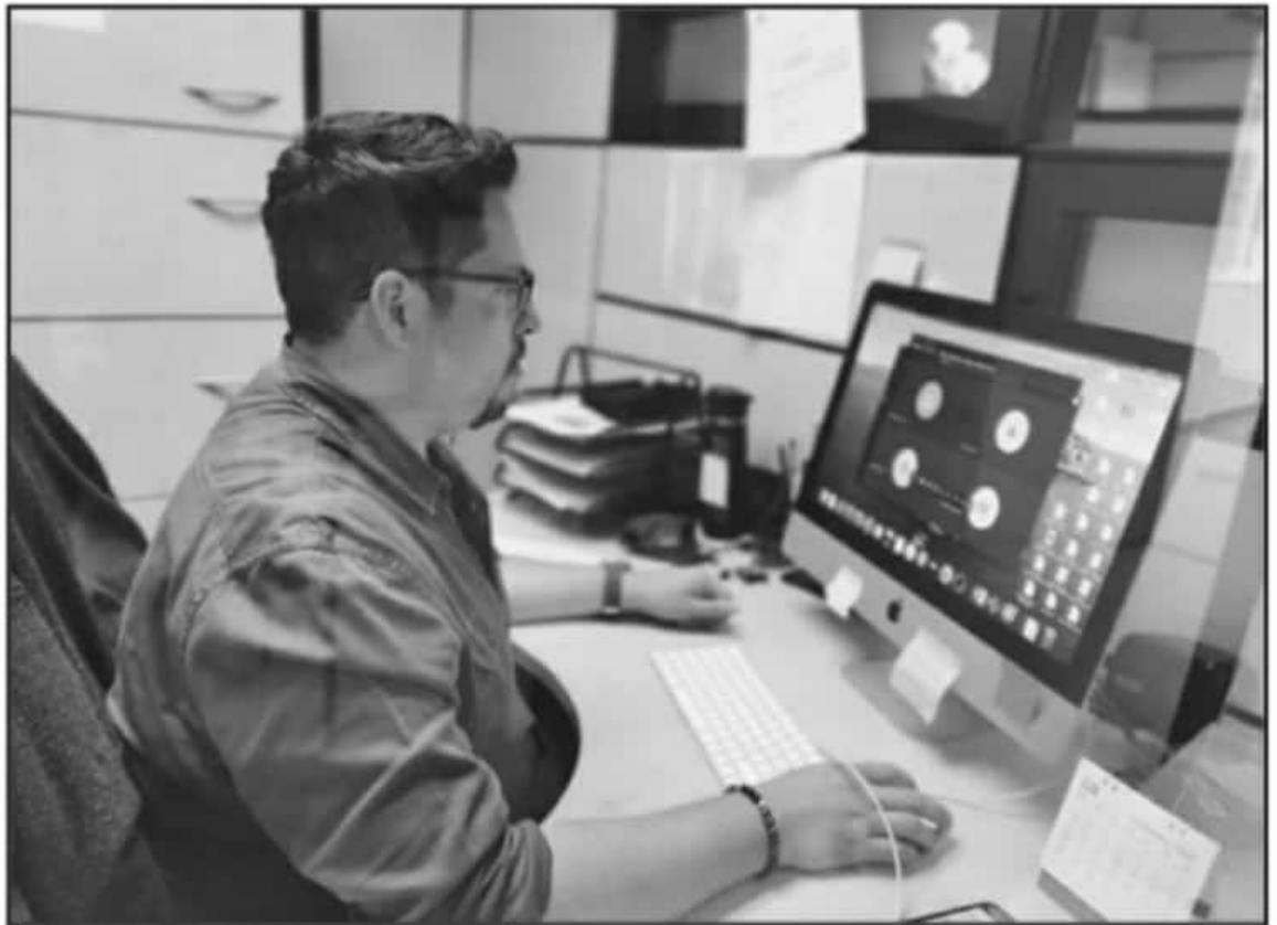
LOS CURSOS INTERSEMESTRALES SE REALIZAN CON LA FINALIDAD DE MANTENER UNA ALTA CALIDAD EDUCATIVA EN EL PERSONAL DOCENTE DE LA INSTITUCIÓN

Recordó que este proceso de capacitación es el primero que se realiza en los periodos intersemestrales durante el periodo