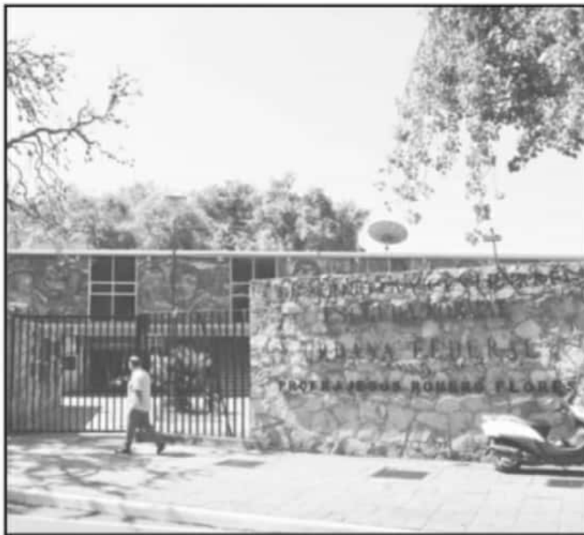
LOS PROFESORES DE INGLÉS HAN TRABAJADO EN CONDICIONES DE CONSTANTE ACOSO LABORAL Y RECHAZO, DICEN

Explicó que los pocos docentes que han podido colocados es porque los docentes fueron aceptados en las escuelas Normales Urbana y Superior, en donde desarrollan su función sin problemas.