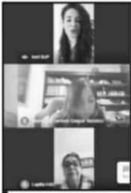
LOS FUNCIONARIOS RECIBIERON EL CURSO DE FORMA VIRTUAL.