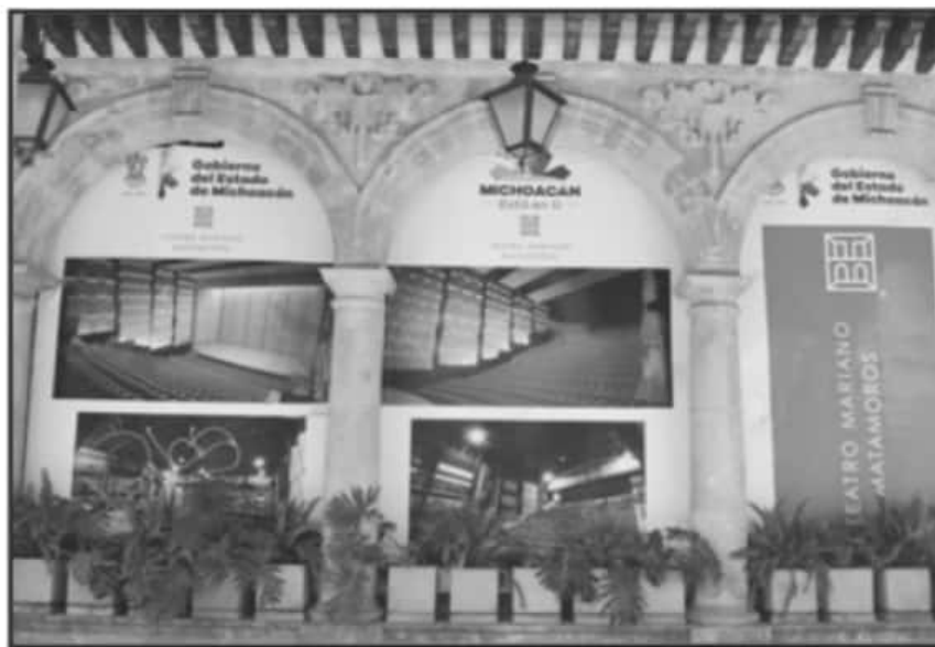
ENTRE LAS OBRAS QUE MENCIONÓ EL GOBERNADOR DEL ESTADO, DESTACA EL TEATRO MARIANO MATAMOROS.

rior ante la urgencia de rehabilitar los tramos estatales que durante años fueron acumulando desgaste y daños en su infraestructura.