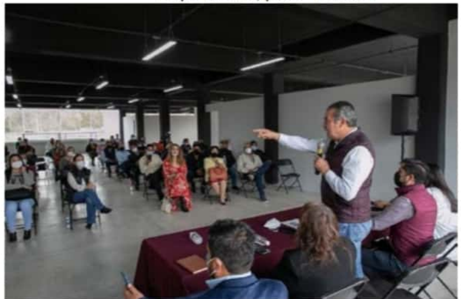
El coordinador estatal en Defensa de la Cuarta Transformación, se reunió con 80 representantes de la sociedad del interior de la entidad.