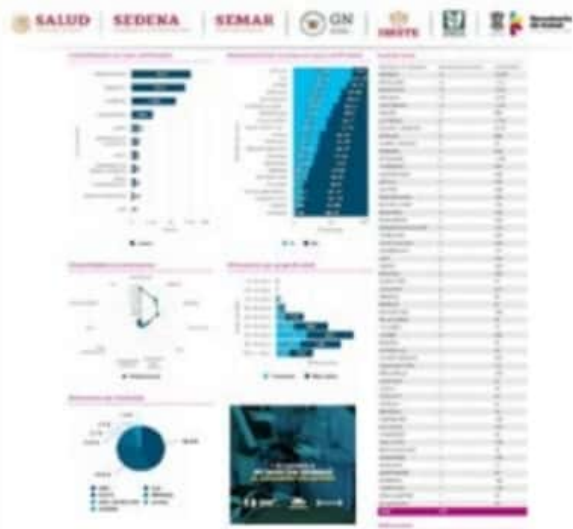
Ayer viernes el CESS reportó que en este municipio se documentaron otros seis nuevos casos positivos de COVID-19 y un fallecimiento más.

Por su parte, la Jurisdicción Sanitaria 08 dio a conocer que los 6 nuevos casos positivos de COVID-19 que se registraron en este municipio, todos fueron en la ciudad, que llegó a un acumulado de 3,519. Asimismo se informó que hasta anoche había 20 enfermos de este virus, hospitalizados y que el número de enfermos recuperados había llegado ya a los 5,373.