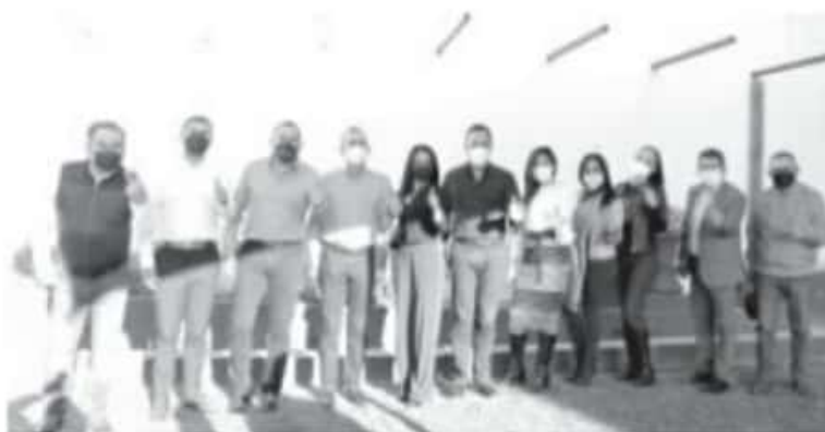
El encuentro realizado con los diputados locales busca construir una agenda común por el progreso de la entidad, la justicia y desarrollo de las y los michoacanos.

El proyecto de Gobierno que enarbola la alianza "Equipo por Michoacán", es de todas y todos los ciudadanos, afirman legisladores perredistas