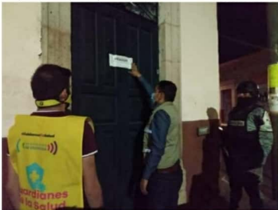
La capital michoacana se mantiene en Bandera Roja, con 462 casos activos y 950 defunciones.

La SSM mantiene a disposición de la población el 800-123-2890 con 11 líneas para resolver todas sus dudas médicas, así como el micrositio bit.ly/MichCOVID-19, donde encontrará toda la información del padecimiento.