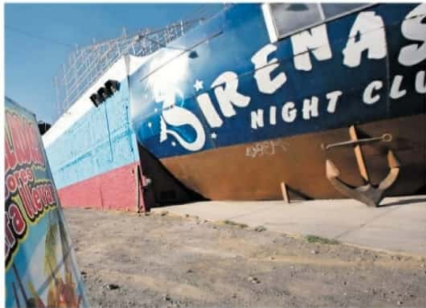
Los establecimientos no se arriesgan a extender el horario

cuarta parte de lo que ganamos normalmente", dijo el portero y checador, luego de asegurar que en su congal solamente trabajan las seis horas previas al cierre establecido.