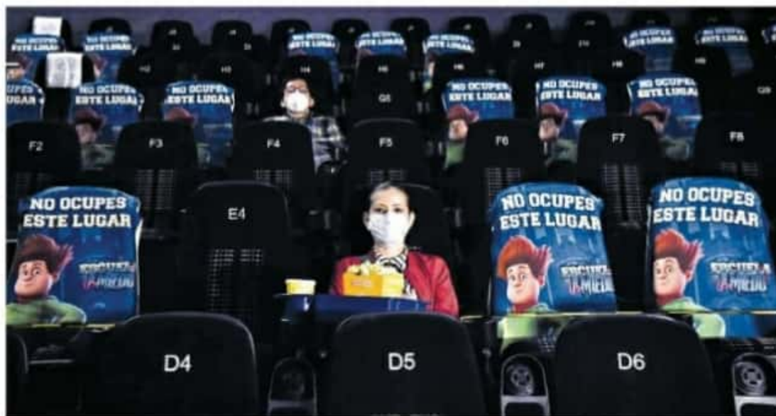
La espectadora seguirá asistiendo por el exclusivo hecho de amar al cine / CLAR TOS CURD.