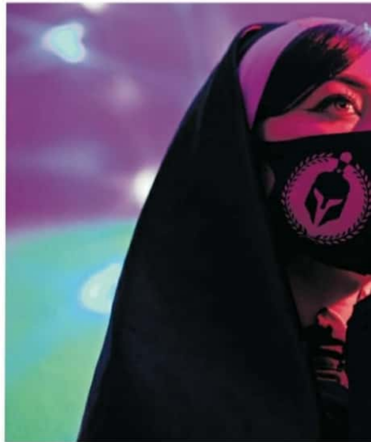
Las medidas restrictivas se han endurecido incluso para los centros nocturnos

Yoatzin sabe que en este 2021 no se puede hablar de firmeza en ningún ámbito de la vida. Aunque en el table dance no