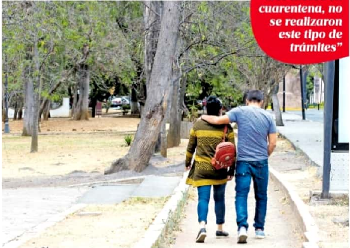
En Michoacán hay 4.4 matrimonios por cada mil habitantes.

EN CIFRAS: Morelia tiene el 7.13 por ciento, Zamora el 5.34 por ciento y Uruapan el 5.16 por ciento.