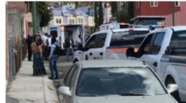
Por la mañana de ayer en el fraccionamiento La Maestranza de Morelia, sujetos desconocidos dieron muerte a balazos a una mujer y dejaron heridos a dos hombres más.