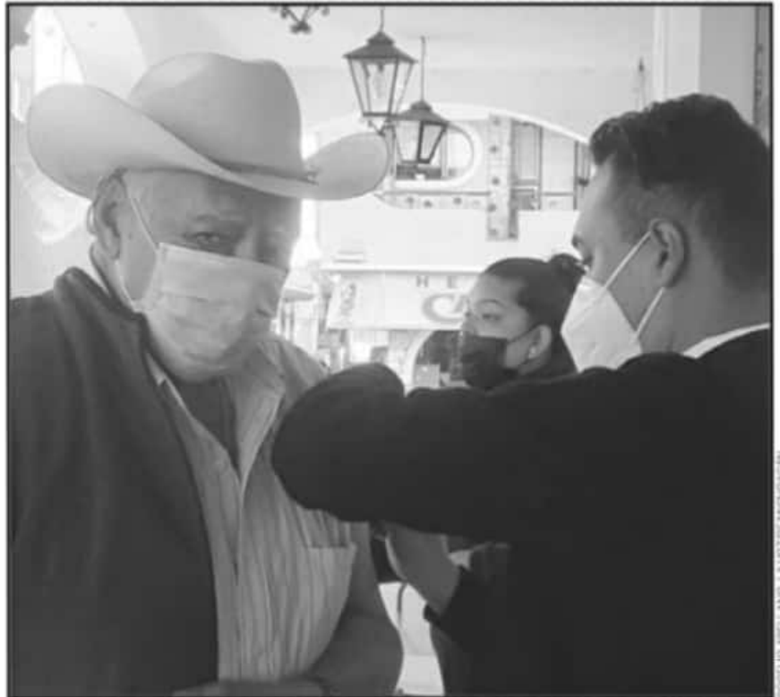
EN LA REGIÓN 4, LA CAMPAÑA DE VACUNACIÓN SE HA ESTIMADO QUE INICE EN EL HOSPITAL IMSS-BIENESTAR DE VILLAMAR.

"De momento se acordó que tenemos siete espacios ya habilitados de primer momento que serían tres en Jiquilpan, tres en el Sahuayo y que en el IMSS (Hospital IMSS-Bienestar) podamos ir creciendo a por lo menos un espacio por municipio para poder ir cubriendo el total de los más de 65 mil adultos mayores que estaremos vacunando durante el mes de marzo y principios de abril".