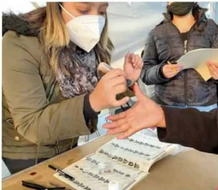
Abril. El día 10 de ese mes inicia la elaboración de las listas definitivas de votantes.