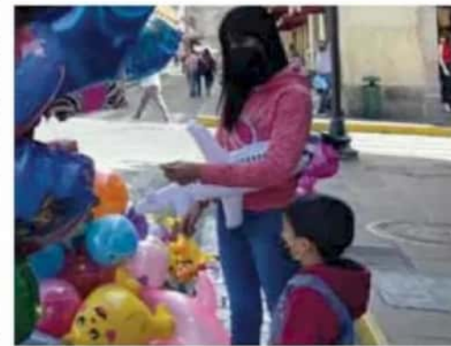
Cuidado. Autoridades piden a la gente abrigarse bien. / CYNTHIA A.

será la temperatura mínima en la capital del estado durante varios días.