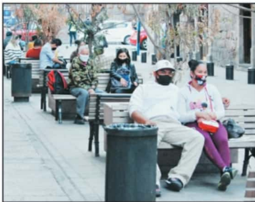
A PESAR DE LA INSISTENCIA DE LA AUTORIDAD ESTADAL POR QUEDARSE EN CASA, LA MOVILIDAD EN LA CIUDAD PERSISTE.

"Empezamos a tener señales pequeñas pero alentadoras. Ha bajado el número de hospitalizados, ha bajado el número de defunciones y no es menor. En la última semana fallecieron 160 personas y estábamos alarmados porque en la última de enero fueron 230 y en esta fueron 160, es muy doloroso porque una vida que pierda nos duele", manifestó este viernes el mandatario michoacano ante la opinión pública.