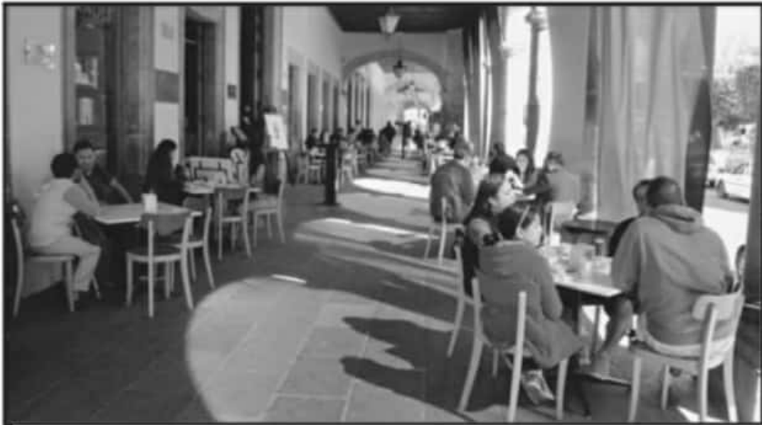
DEBIDO A QUE LOS DOMINGOS EL SERVICIO ES SÓLO PARA LLEVAR, RESTAURANTEROS ESPERAN MALAS VENTAS EN EL DÍA DEL AMOR.