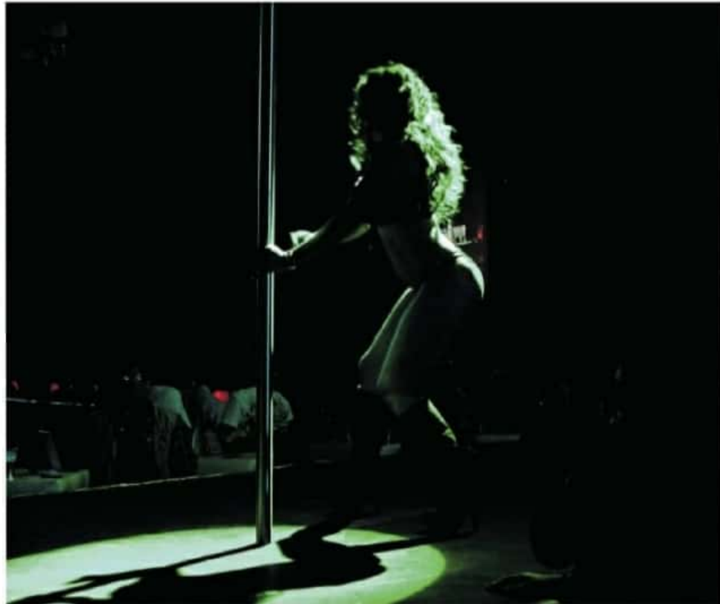
Debido a la poca afluencia, hay "2 o 3 mesas en todo el mediodía y a veces un poco más durante la tarde" CUARTOS CURO