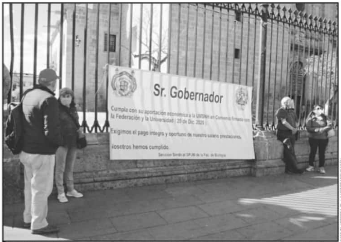
LOS TRABAJADORES BUSCAN VISIBILIZAR LA PROBLEMÁTICA CON EL OBJETIVO DE TENER INTERLOCUCIÓN CON LAS AUTORIDADES Y SABER LAS CAUSAS DE IMPAGO.

huelga, por la falta de pago de la primera quincena de diciembre y la canasta navideña; también por la falta de pago de la segunda quincena de diciembre, de la prima vacacional, del aguinaldo y de las promociones 2015, teniendo ambos emplazamientos como fecha de estallamiento de la huelga, el día 8 de enero de 2021 a las 18:00 horas.