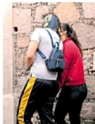
20 mil 966 matrimonios se consumaron entre mujer y hombre.

Al 2020, en Michoacán, del un millón 546 mil 652 de personas casadas, 353 mil 515 están casadas al civil, 87 mil 900 están casadas por la iglesia y un millón 105 mil