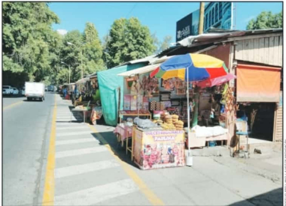
PANORAMA DE MAYOR CRISIS OBSERVAN LOS ARTESANOS ANTE LA CANCELACIÓN DEL TRADICIONAL TIANGUIS ARTESANAL DE DOMINGO DE RAMOS.

Crítico el que los tres niveles de gobierno no han desempeñado un papel a la altura de la emergencia, no solo por un plan de vacunación que destaca por la inexistencia de vacunas a gran escala, sino porque se ca-