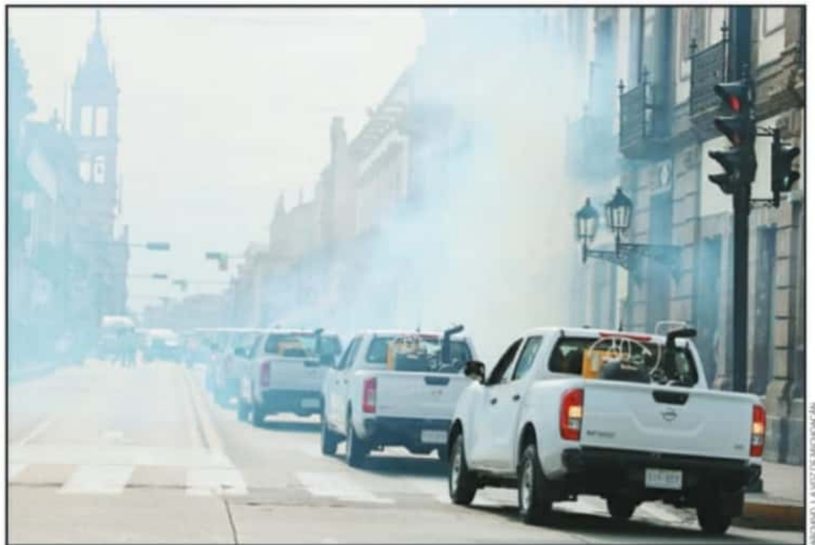
AUTORIDADES DE SALUD ARGUMENTARON QUE LOS HABITANTES DE LA CAPITAL MICHOACANA DEBERÁN MANTENER MEDIDAS PREVENTIVAS PARA EVITAR EL DENGUE.

de año en el estado porque representan casi una duplicación de los casos del mismo plazo del año anterior, además de que lo posicionan en el primer puesto nacional por esta enfermedad, mientras que al cierre del 2020 se ubicaba en el segundo puesto al ser superado por Jalisco.