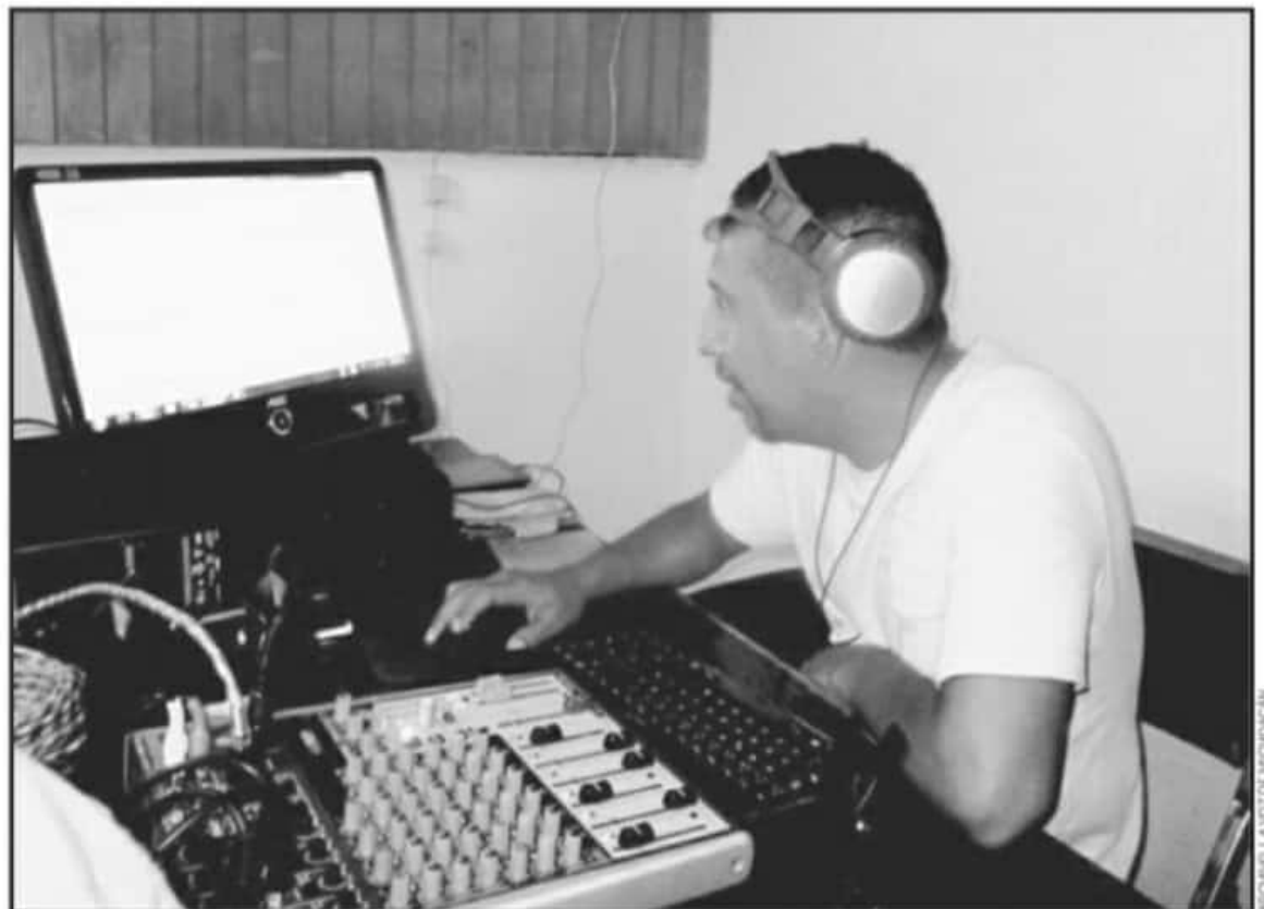
EN TIEMPOS DE PANDEMIA POR LA COVID-19, LAS RADIOS COMUNITARIAS SE CONVIERTEN EN UN MEDIO DE COMUNICACIÓN CRUCIAL, PERO NO SON VALORADAS.