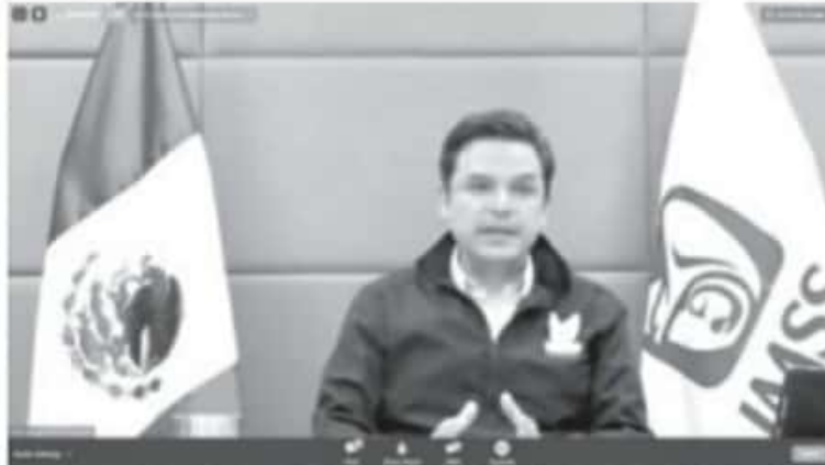
2019 el Instituto contaba con 463 camas para atender enfermedades respiratorias, y con la pandemia llegó a cerca de 19 mil destinadas exclusivamente al tema de COVID, de 32 mil camas que tiene el país

El director general del Seguro Social apuntó que dimensionar el desafío de la pandemia