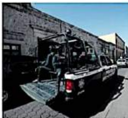
En los alrededores del recinto se pudo observar la presencia de varios cuerpos policiacos.