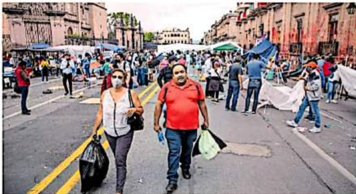
Luego del diálogo, los profesores decidieron retirar el plantón. CAROLINA HERNÁNDEZ