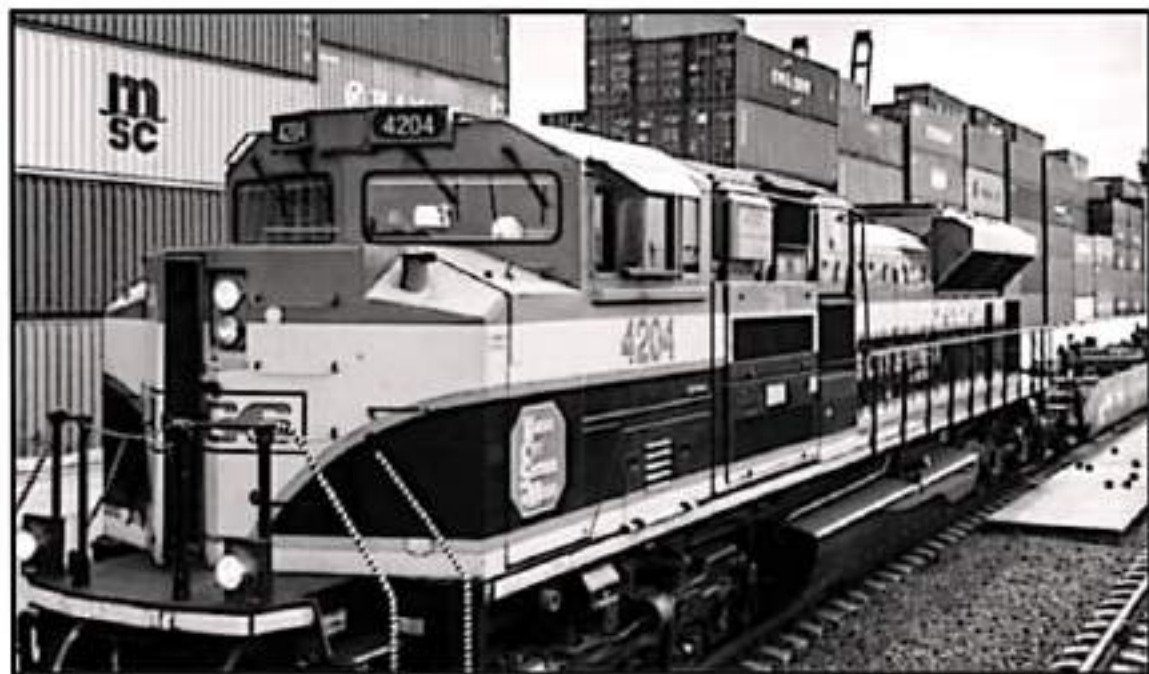
LA DISTRIBUCIÓN DE MERCANCÍAS EN EL PAÍS MUESTRA RETRASOS DEBIDO A BLOQUEOS A VÍAS DE COMUNICACIÓN, DERIVADOS DE LAS PROTESTAS SOCIALES

En este contexto Tejeda Szaar refirió que los bloqueos férreos y el retraso en la llegada de mercancías