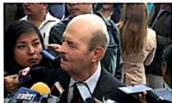
Fausto Vallejo Figueroa, ex gobernador de Michoacán.

ción y la desunión que existe entre los michoacanos, opinó del ex gobernador de Michoacán, Fausto Vallejo Figueroa.