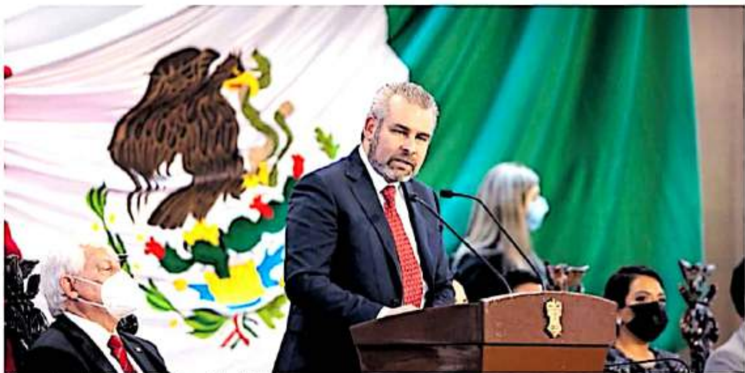
El nuevo gobernador rindió protesta en el Centro Cultural Clavijero. FRANCISCO VALENZUELA

"SE ACABÓ LA CONFRONTACIÓN CON GOBIERNO FEDERAL"