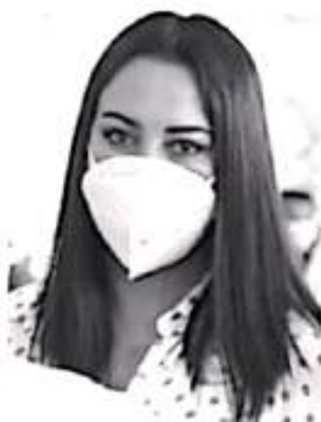
Resulta alarmante la obsesión por el control de las y los mexicanos que tiene el Gobierno Federal, y que ahora pretende realizar a través del RFC, haciéndolo obligatorio desde los 18 años.

"¿Qué va a suceder también con los jóvenes que son mayores de 18 años y aún no laboran?, que siguen con mucho esfuerzo estudiando, pues ahora tendrán que preocuparse por registrarse ante el RFC y que alguien los asesore para sus declaraciones anuales, porque de lo contrario ya sabemos cómo opera Hacienda".