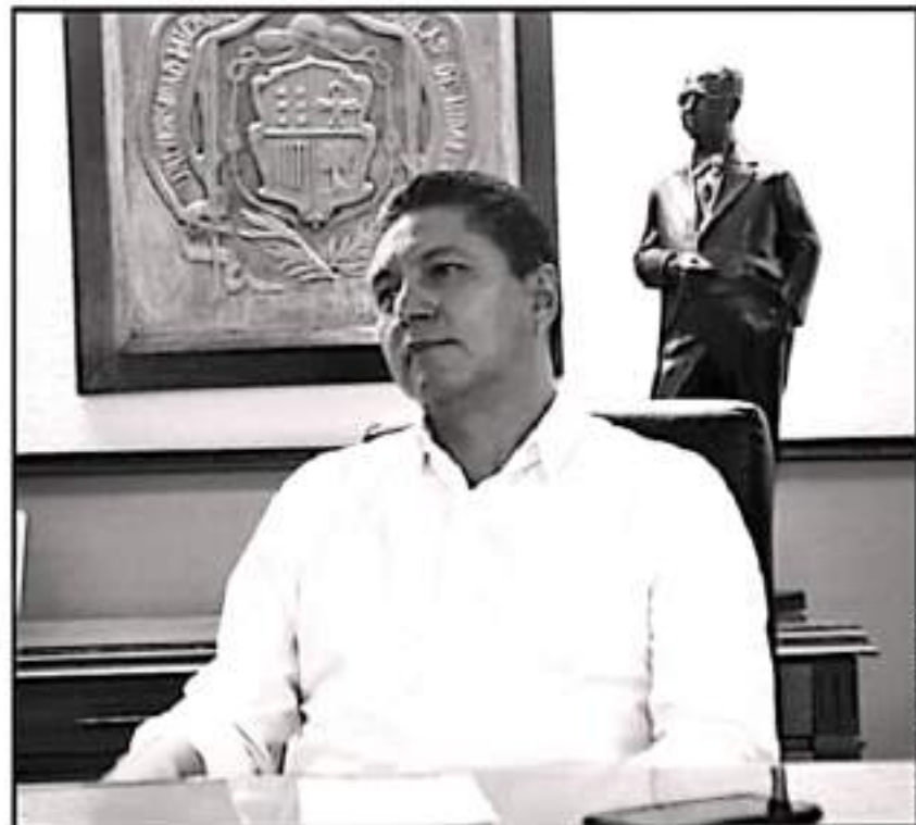
EL RECTOR MANIFESTÓ QUE HAN PLATICADO CON EL GOBERNADOR SOBRE DIVERSOS RUBROS Y CONTENCIÓN DEL GASTO

El 6 de junio pasado en el marco del día de la elección para la gubernatura, el rector expuso que el déficit presupuestal de la Universidad Michoacana de San Nicolás de Hidalgo (UMSNH), es el principal desafío que enfrentará