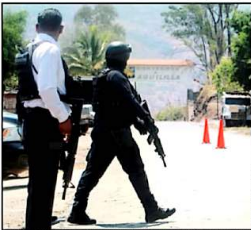
HABITANTES DE LA ZONA DE TIERRA CALIENTE ESPERAN MEJOR LA SEGURIDAD CON LLEGADA DE NUEVAS AUTORIDADES.

nera regional con la opinión de corporaciones militares y civiles.