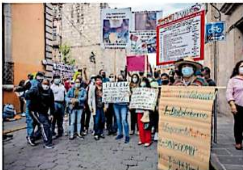
En las inmediaciones hubo protestas y manifestaciones de grupos magisteriales.