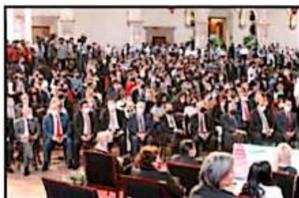
LOS INVITADOS ATENDEN AL DISCURSO DEL NUEVO GOBERNADOR DEL ESTADO