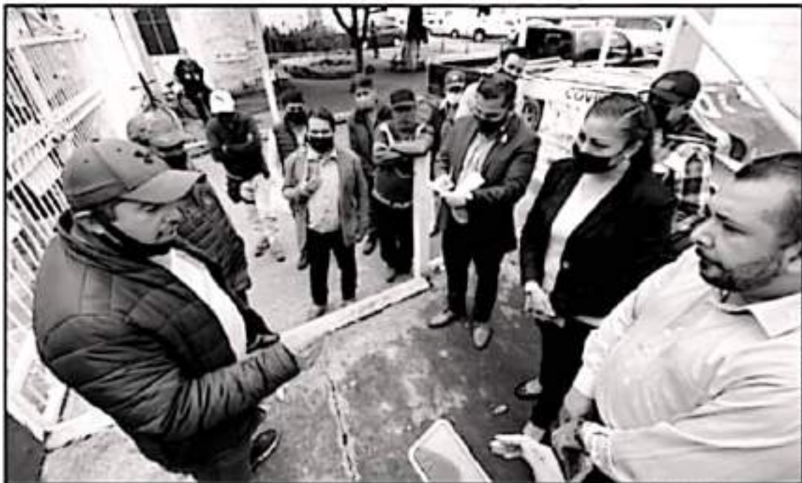
AUTORIDADES MUNICIPALES MANIFIESTAN QUE LAS PROTESTAS DE GRUPOS INDETERMINADOS DEBEN SER PACÍFICAS PARA PODER SER ATENDIDAS.

Previo que el haber cerrado los accesos principales de la alcaldía e incluso los del edificio contiguo que alberga las instalaciones del DIF Municipal e impedir la salida o entrada de cualquier trabajador, funcionario y ciudadano con actitudes de utilizar la fuerza, debe ser suficiente para establecer que esas no deben ser las condiciones para atender o cumplir las demandas diversas