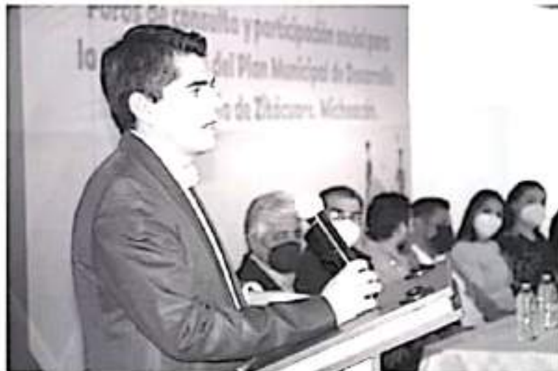
Este tipo de ejercicios que toman en cuenta las decisiones sociales, seguirán siendo la directriz que abanderará su administración pública durante los próximos tres años.

-Presenta alcalde Foros de Consulta que involucra a la ciudadanía en proyectos para el desarrollo del municipio.