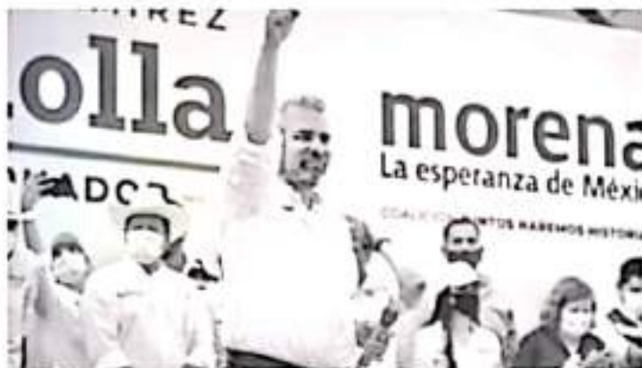
El gobernador electo afirmó que la resolución de la Sala Superior, que es concluyente e irreversible, trae certeza a Michoacán porque respeta la voluntad de la mayoría del pueblo de Michoacán.

Morelia, Michoacán, 29 de septiembre del 2021.- La decisión de las y los michoacanos de iniciar un cambio en Michoacán el 01 de octubre ha sido respetada, y estamos listos para iniciar juntos la transformación de Michoacán, afirmó Alfredo Ramírez Bedolla después de que el Tribunal Electoral del Poder Judicial de la Federación declaró legítima y legal su elección como gobernador.