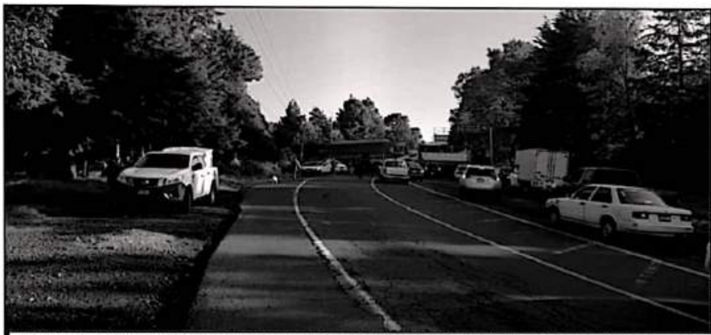
UN GRUPO DE PERSONAS ENFURECIDAS PORQUE NO SE INSTALÓ UN PUESTO DE VACUNACIÓN CONTRA EL CORONAVIRUS EN SAN LORENZO, BLOQUEÓ EL TRAMO CARRETERO URUAPAN-LOS REYES.

■ CAMPAÑA ■ BLOQUEAN CARRETERA URUAPAN-LOS REYES