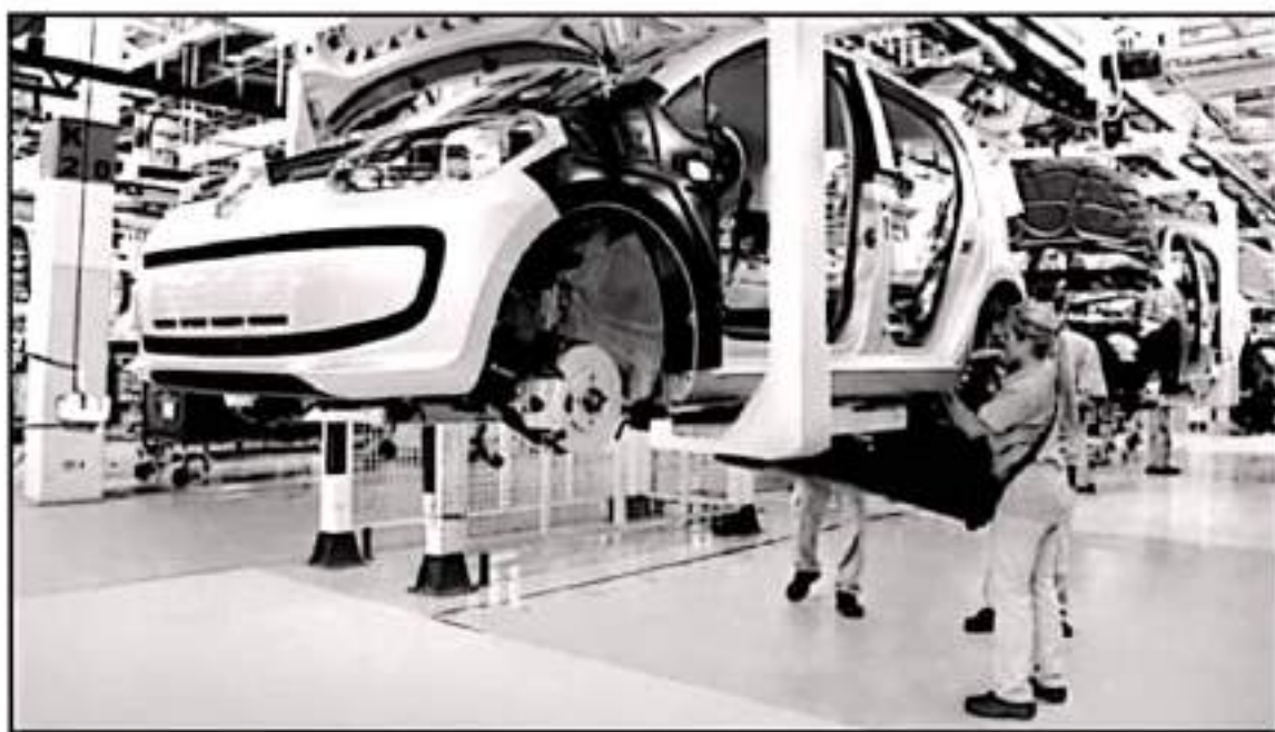
LA INSUFICIENCIA DE AUTOPARTES ES UN PROBLEMA A NIVEL MUNDIAL Y DEBIDO A LA PANDEMIA SE ACORTÓ LA PRODUCCIÓN Y SE LLEVAREM LOS PRECIOS

gunda ola de contagios y un nuevo refortalecimiento en las medidas las ventas siguen sin levantar, y no sino hasta el mes de junio que empezó a ver una recuperación con respecto a las ventas.