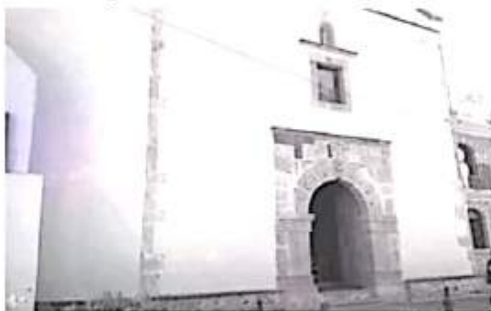
No habrá Feria del Mole, que este año estaría cumpliendo 25 años de su existencia, confían en que el próximo año la pandemia ya no sea un problema.

Respecto a los juegos mecánicos y puestos en la calle principal de esta tenencia, aseguró que no se sabe si cuentan con autorización, por parte de la iglesia no tienen prevista la feria a fin de evitar contagios.