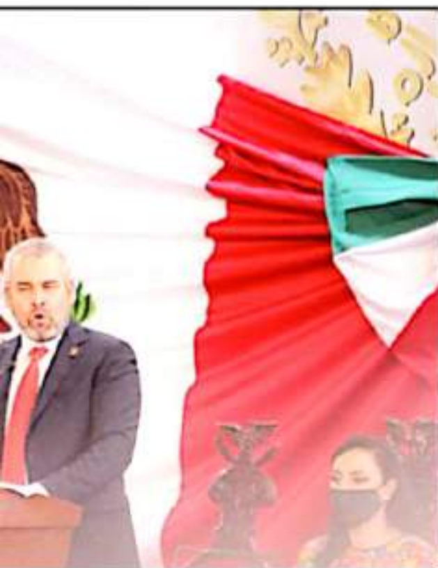
PRENSA QUE EL ESTADO CONTARÁ CON UNA POLÍTICA DE ARMONÍA Y PACIFICACIÓN