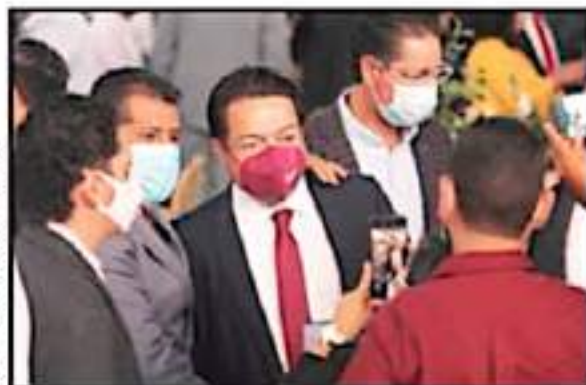
EL DIRIGENTE NACIONAL DE MORENA, MARIO DELGADO, PRESENTE EN EL EVENTO

que defina a través de sus asambleas y autoridades Constitucionales su voluntad en torno a regirse bajo el esquema de usos y costumbres o conservar los gobiernos locales a los cuales se han servido en décadas.