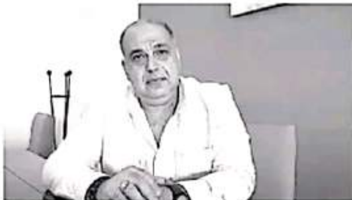
Podemos decir que hay mucho por hacer, pero nos estamos reorganizando, y vamos a terminar con ese distanciamiento que había con empresarios y comerciantes.

"Muchos me conocen y saben que soy una persona que trabaja, me gusta innovar, construir y estamos en el mejor de los ámbitos", indicó.