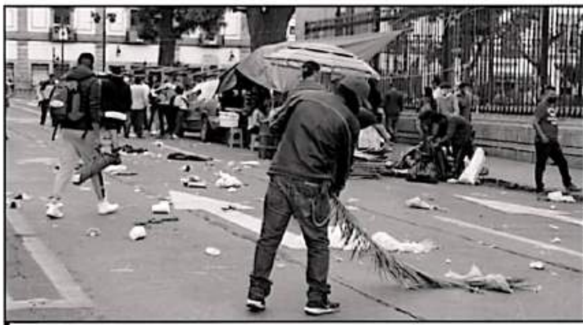
INTEGRANTES DE LA CNTE LEVANTAN PLANTÓN EN EL CENTRO HISTÓRICO, COMO UNA MUESTRA DE CONFIANZA EN EL NUEVO GOBIERNO DE RAMÍREZ BEDOLLA.

más de que era una administración que apenas empezaba.