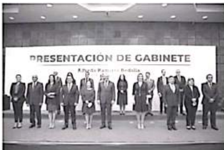
Mi equipo tiene la responsabilidad de servir al pueblo de Michoacán con honestidad y trabajo para sacar adelante a Michoacán.

Serviremos a Michoacán con honestidad y experiencia