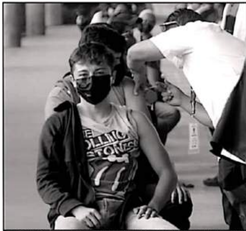
ESTA SEMANA SE APLICÓ EN LA CAPITAL MICHOACANA LA SEGUNDA DOSES DE INICIAR A LOS JÓVENES DE 14 A 29 AÑOS.

En voz del titular de la Secretaría del Bienestar en la entidad, para este fin de semana llegarán otras 200 mil dosis de al menos 2 laboratorios que permitirán