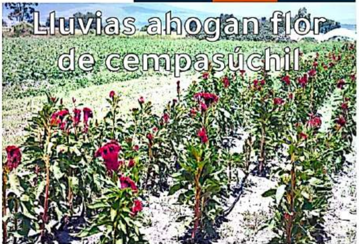
En la imagen la flor Pata de León comienza a florar y a sus espaldas otros cultivos que van ganando terreno.

El Cabildeo de Copándaro analiza ya la viabilidad de un programa que ayude a los productores para activar la floración, mediante fitohormonas o en su caso hormonas de crecimiento y