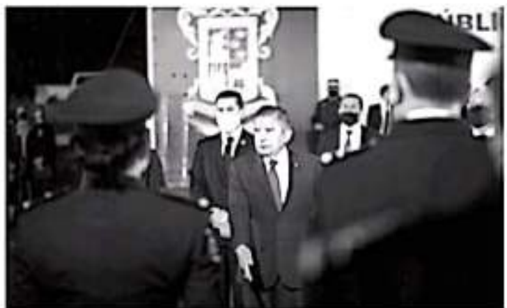
El General destacó que la seguridad pública del estado estará orientada en salvaguardar la vida, las libertades, la integridad y el patrimonio de las personas.

Añadió que se dará marcha a estrategias y mecanismos apegados al Plan Nacional de Seguridad 2018-2024, al programa sectorial de protección ciudadana, y a la estrategia nacional de Seguridad Pública, alineando el actuar del estado con la federación.