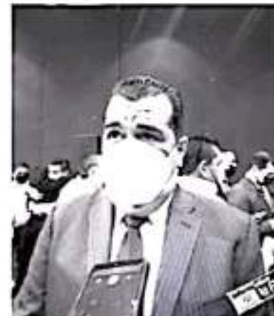
El manejo de la pandemia en el estado ha sido adecuado, la enfermedad se ha contenido mucho, sin embargo se deben reforzar las estrategias para evitar más contagios.

"Se puede presentar la cuarta ola, si bien la más mortal fue la segunda, la más explosiva en número de casos ha sido la tercera y las medidas hay que extremarlas para evitar