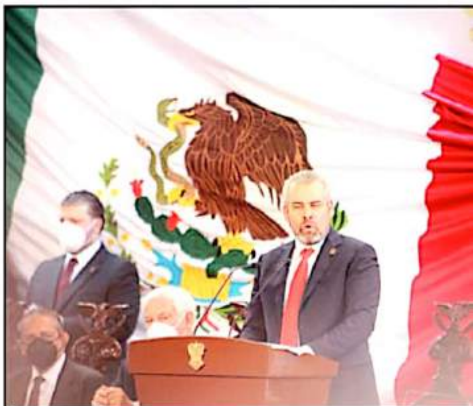
EL GOBERNADOR ALFREDO RAMÍREZ BEDOLLA, DURANTE SU DISCURSO DE JURAMENTO PREVIÓ QUE EL ESTADO CONTARÁ CON UNA POLÍTICA DE

La Secretaría del Finanzas del gobierno entrante ha señalado que parte de las promesas del gobierno de la República para con el nuevo gobierno de Michoacán se ostenta el rescate financiero para el pago de