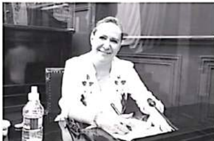
El interés debe ser Michoacán, por lo que es primordial que la gobernabilidad que se consolidó a lo largo de seis años mantenga su curso.