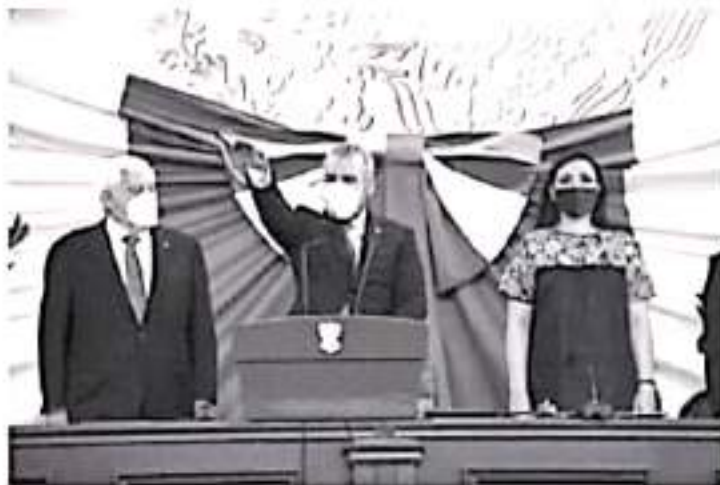
Como gobernador Constitucional del Estado, Alfredo Ramírez Bedolla, rindió protesta ante el pleno de la LXXV Legislatura, en el Palacio Clavijero.