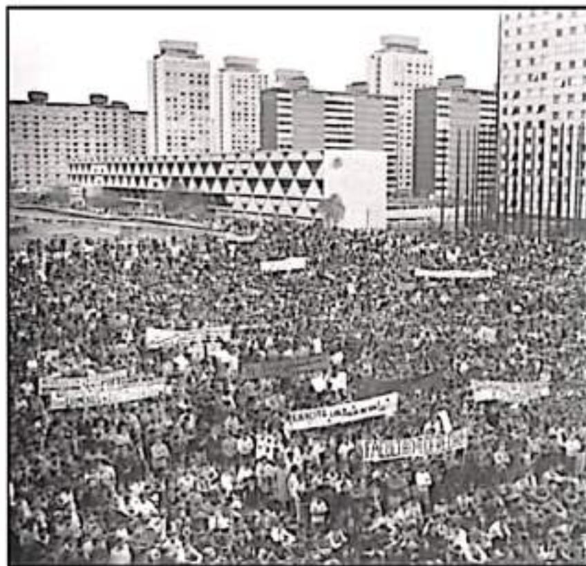
DURANTE LOS AÑOS 60 Y 70, EL SECTOR ESTUDIANTIL FUE OBJETO DEL ESPIONAJE POR PARTE DEL GOBIERNO.