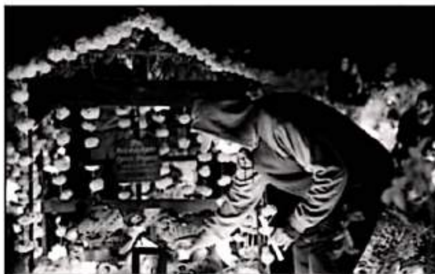
IGUAL QUE EL AÑO PASADO, HABITANTES DE JANITZIO TENDRÁN QUE REALIZAR CELEBRACIÓN A SUS DEFUNTO EN CASA.

Los años durante todo el año han realizado varias acciones para evitar que el coronavirus se incre-