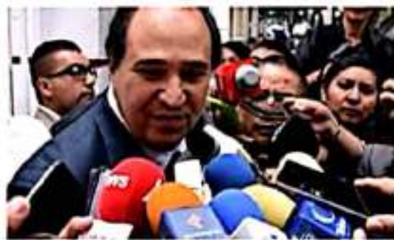
Lázaro Cárdenas Batel, ex gobernador de Michoacán y actual jefe de asesores del presidente AMLO.

El estado michoacano será de condiciones logísticas para la inversión, desarrollo de parques industriales y atracción de inversiones, con la trazabilidad de rutas logísticas, argu-