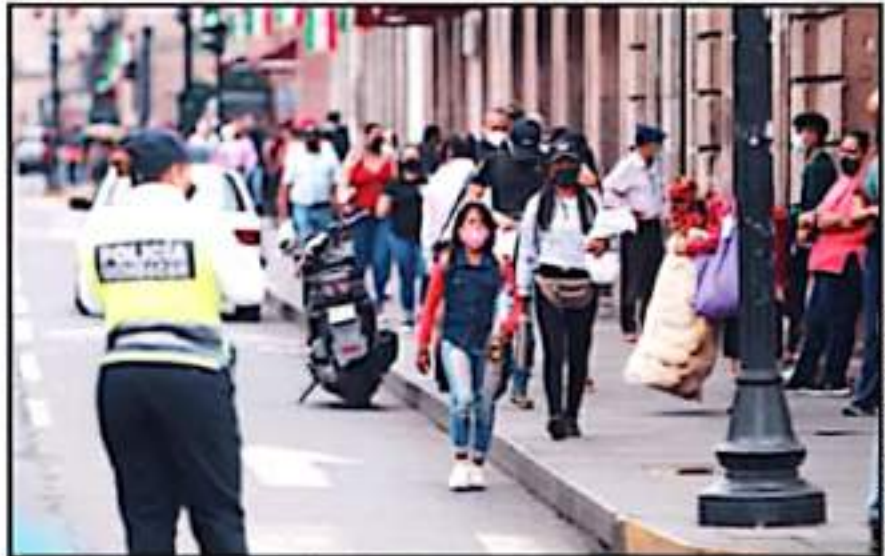
ALTERNIDADES EXHIBIRÁN A LA POBLACIÓN A CONTINUAR CON LAS MEDIDAS SANITARIAS A PESAR DE CONTAR CON VACUNA.

Sobre la ocupación hospitalaria en la región costa de Michoacán, las autoridades de salud dieron a conocer que va a la baja y que hasta el momento se reporta un 33.96 por ciento de ocupación en las áreas para pacientes de coronavirus y que la vacunación y el reforzamiento de las medidas sanitarias llevadas a cabo en la región han permitido que esto sea posible.