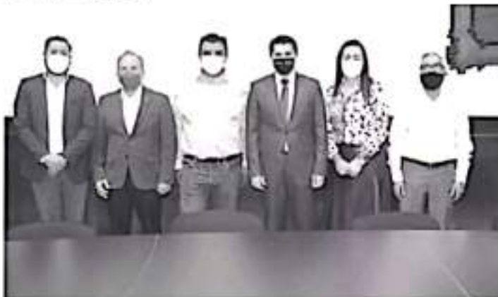
El presidente municipal hizo nuevos nombramientos en su equipo de gobierno, con nuevos cargos que anteriormente no existían.

El edil convocó a los funcionarios a que la prioridad de su #GobiernoDeSoluciones, es brindar un servicio a la altura a los zitacuarenses, porque durante los siguientes tres años, el municipio debe mejorar su imagen y que sus habitantes tengan una vida más agradable y segura.