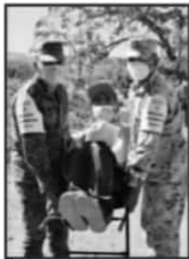
ADULTOS MAYORES, LA PRIORIDAD.