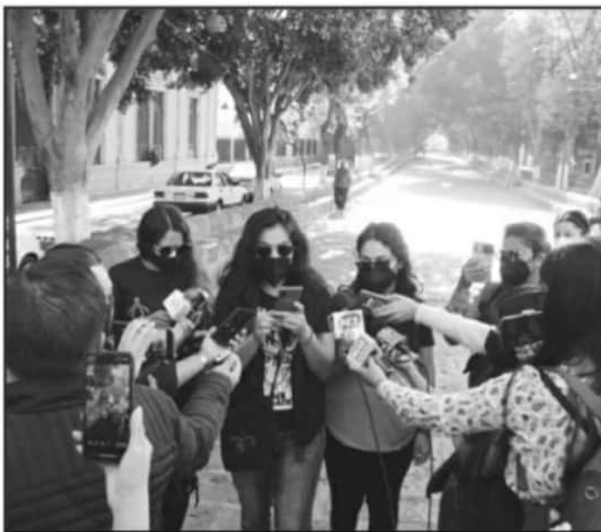
INVITARON A LAS MICHOACANAS A UNIRSE A LAS COMISIONES PARA LA ORGANIZACIÓN Y EJECUCIÓN DE ACTIVIDADES.

Fue el año pasado cuando la AMM fue la organización encargada de la organización y de la logística de la marcha del 8 de marzo del año pasado, donde participaron alrededor de 10 mil mujeres; pero este 2021, desde la misma asociación se acordó no convocar a marcha.