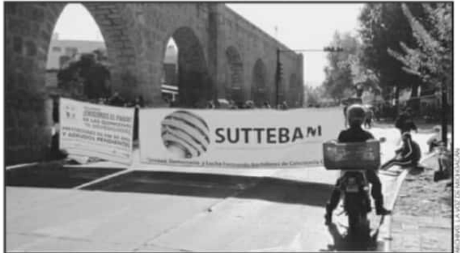
UNA DE LAS PREOCUPACIONES ES EL ADEUDO GENERALIZADO DE LAS CUOTAS OBRERO PATRONALES, ASEGURA DIRIGENTE.

El dirigente agregó que como año también está el tema del aumento salarial está incluido en el tema, "cada año lo vemos, la expectativa es que se dé un aumento considerable nosotros en los años pasados exigimos un aumento del 50 por ciento, pero sobre la práctica nunca se ha dado".