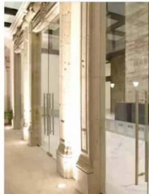
Cantera. La cantera y el cristal templado predominan en la fachada del recinto.