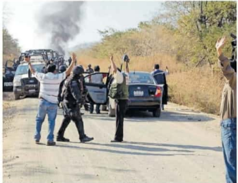
El combate de Felipe Calderón contra el narco recayó en funcionarios presuntamente coludidos

Esta serie de detenciones, bautizadas como El Michoacanazo, se desataron contra de Genaro Guízar Valencia, ex presidente de Apatzingán; Armando Medina