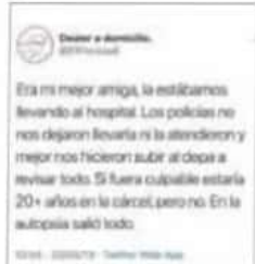
Dato. El creador de la cuenta se deslinó de la muerte.