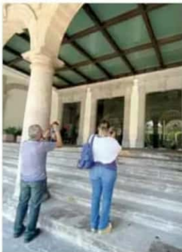
Curiosidad. Ciudadanos aprovecharon para observar desde afuera.

Cabe recordar que fue en 2009, durante la administración del exgobernador Leonel Godoy Rangel, cuando se inició la construcción del Teatro Matamoros y, a través de un fideicomiso a cargo de Cuauhtémoc Cárdenas Batel, se contempló una inversión total de 33 millones de pesos. En ese entonces se aseguró que la obra quedaría lista en 2010, pero para 2017-2018 las autoridades informaron que el proyecto de inversión era de 500 millones de pesos, aproximadamente.