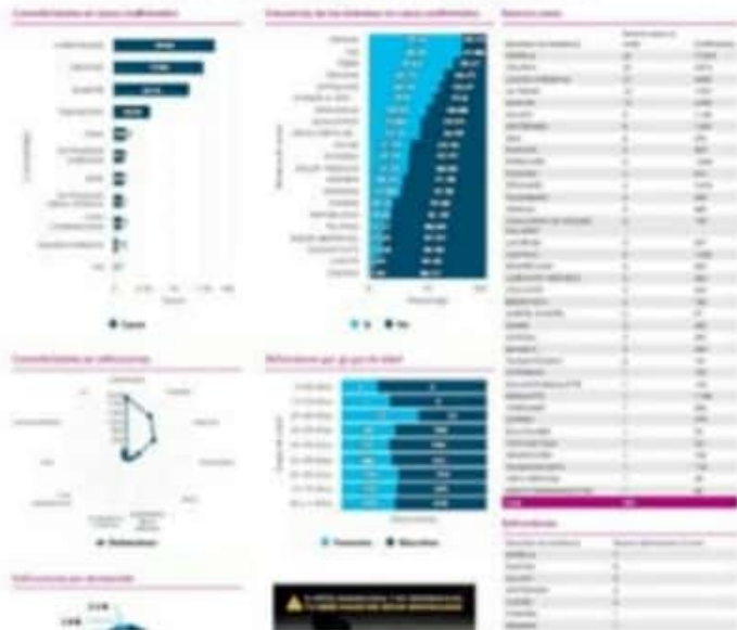
El CESS reportó el día de ayer 21 nuevos casos positivos en este municipio, que llegó a un acumulado de 5,852.