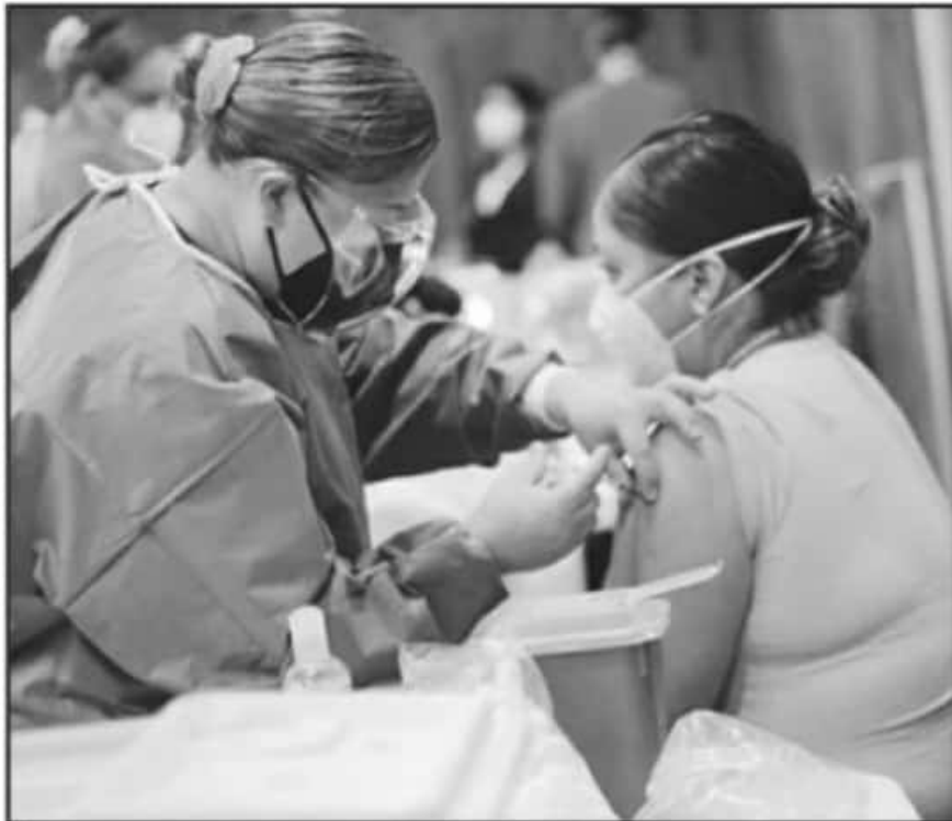
GOBERNADORES AFIRMAN QUE LA VACUNACIÓN SE HA POLITIZADO Y RALENTIZADO EN TODAS LAS ENTIDADES DEL PAÍS.

México son mundialmente reconocidas por su expertise y por el conocimiento médico y su cobertura. Jamás precisaron de personal ajeno al de salud y no se requiere ahora, mucho menos de un ejército de activistas electorales vinculados a un partido político”, explicó el mandatario.