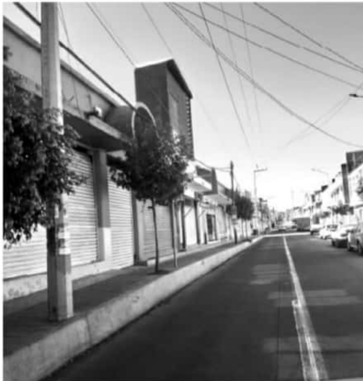
La siguiente semana podrían cambiar las medidas, de acuerdo a la información que instruya la autoridad estatal de salud, pronostica el ayuntamiento.

-Jueves, viernes y sábado continúa horario permitido hasta las 7:00 Pm -El martes que sesione el Comité Municipal de Seguridad en Salud, se emitirán nuevas disposiciones.