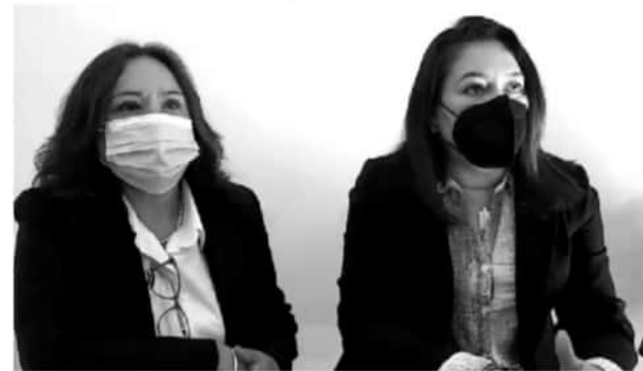
Este módulo será de gran ayuda para los trabajadores, ya que no tendrán que acudir hasta la ciudad de Morelia y hacer gastos innecesarios.