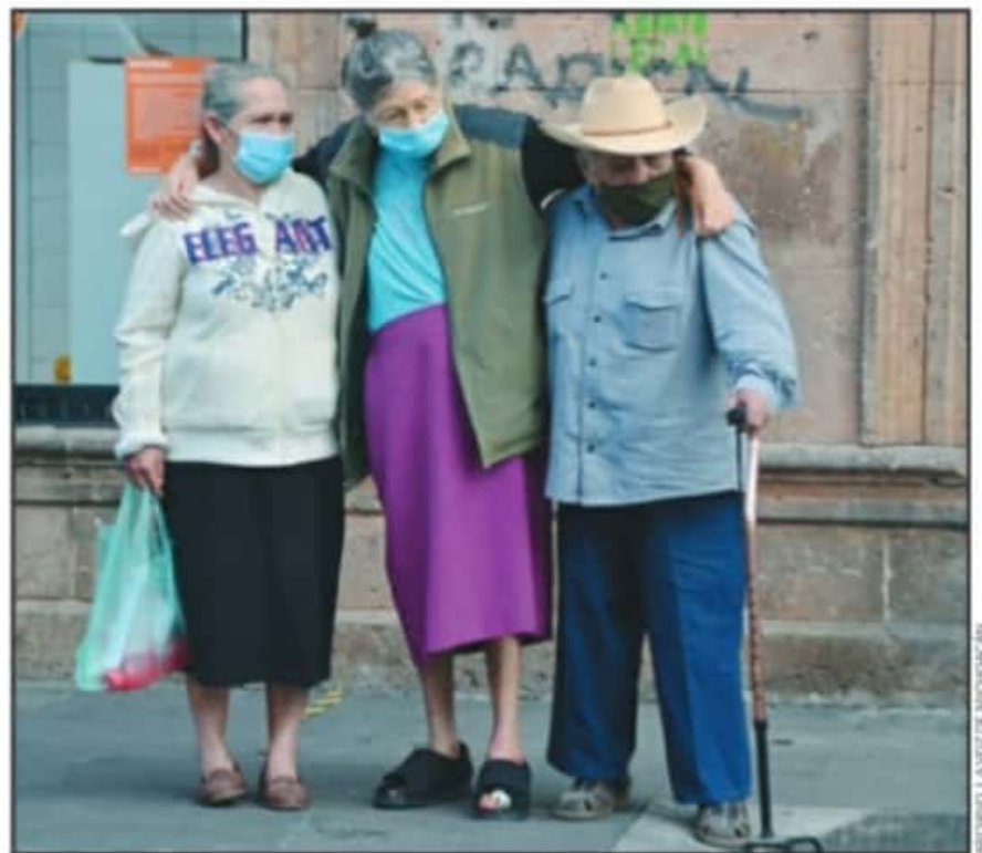
LAS AUTORIDADES TENDRÁN 10 AÑOS IVA REFORZAR LOS ESQUEMAS DE ATENCIÓN Y SERVICIOS POBLACIÓN MAYOR.

Alta densidad, zonas urbanas Otro de los fenómenos observados para Michoacán tiene que ver con el proceso de urbanización de la