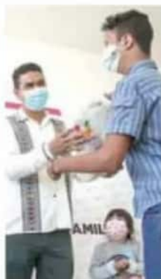
Apoyos. La entrega se llevó a cabo en la Casa PAMAR.

La entrega se llevó a cabo en la Casa PAMAR, en donde el alcalde destacó que la mejor inversión está en la educación y señaló que estos apoyos tienen mucho significado para las familias de escasos recursos, quienes han visto su economía muy golpeada por la crisis derivada de la contingencia sanitaria. MIMORELIA