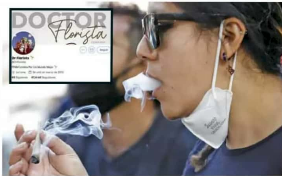
Redes sociales. La cuenta tiene casi nueve años operando con total impunidad.

recabados por Publimetro , las compras se realizan en efectivo y se distribuyen en puntos cercanos al transporte público. Según usuarios, se les envía un catálogo con diversos tipos y calidad de marihuana, así como otras drogas, para posteriormente concretar la compra.