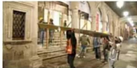
10 años. Ahora se pueden apreciar la escalinata de acceso y el vestíbulo.

años de atraso en la obra, pues se comenzó en 2009 y se pretendía que quedara lista en 2010.