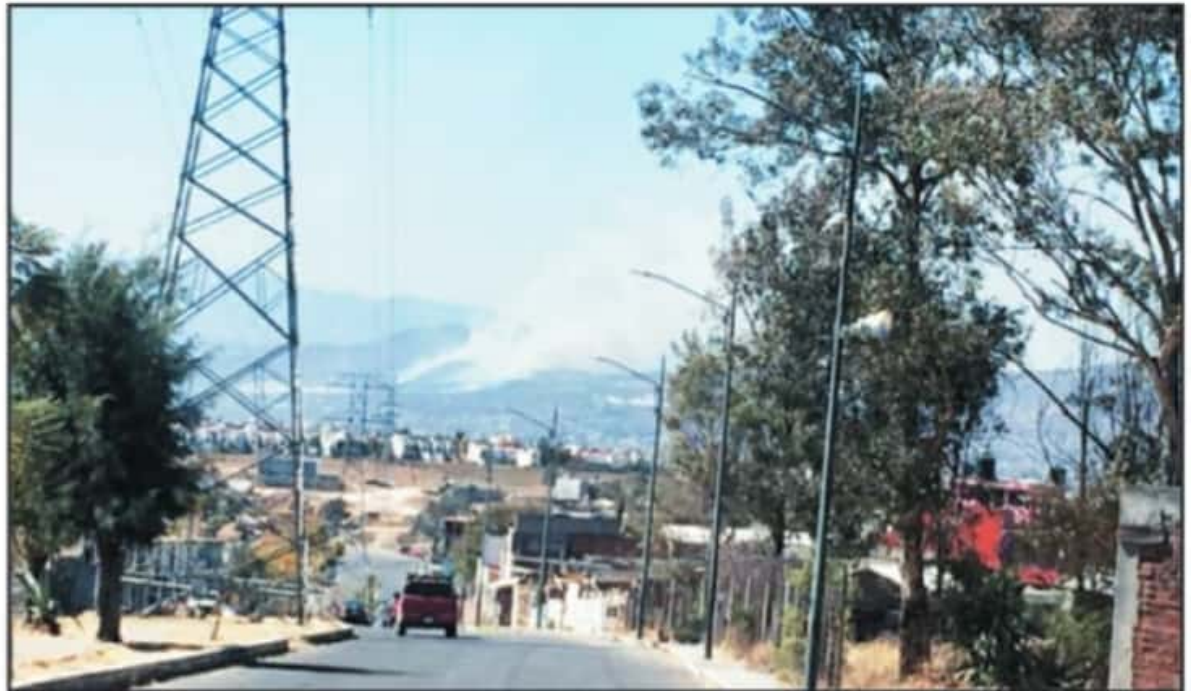
SEGÚN EL MISMO INFORME, A PESAR DE LO ABRUPTO DEL INCREMENTO DE INCENDIOS, MICHOACÁN SE ENCUENTRA EN CUARTO LUGAR NACIONAL EN AFECTACIONES.

hectáreas de superficies afectadas. Solo la ciudad capital concentra más del 40 por ciento de todo el volumen de afectación de la entidad.