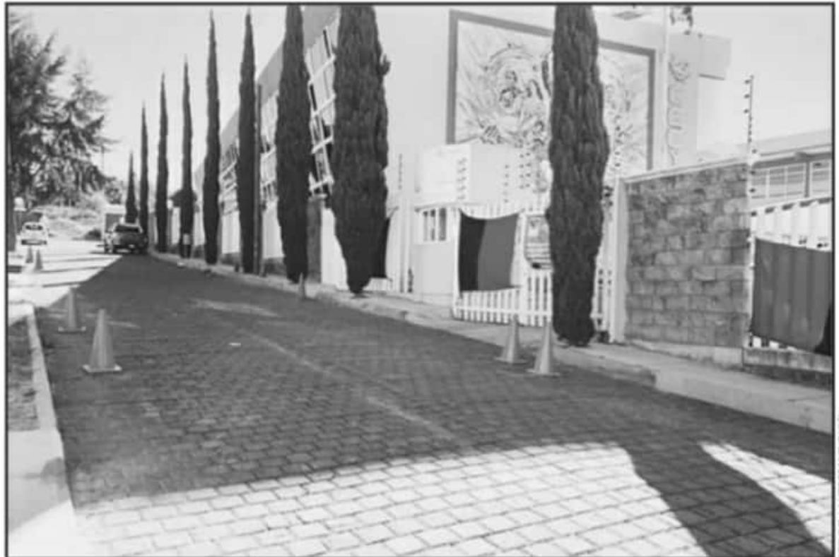
DURANTE EL PARO LABORAL A NIVEL ESTATAL FUERON AFECTADOS ALREDEDOR DE 25 MIL ESTUDIANTES. RETOMARÁN ACTIVIDADES LA SIGUIENTE SEMANA.

El líder celebró que hubiera un acuerdo con las autoridades que permitieran lograr este acuerdo y lamentó que se tuviera que llegar a este punto para lograr avanzar, "los trabajadores