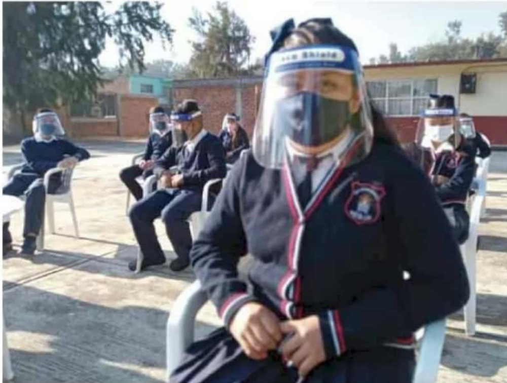
Estudiantes. El regreso a las escuelas será bajo un estricto protocolo para evitar contagios.