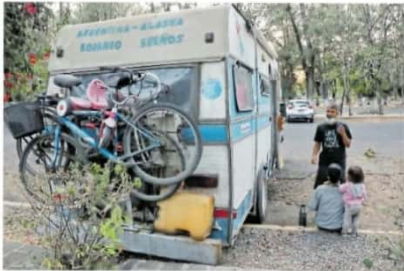
En febrero de 2017 empezaron el viaje y quieren llegar a Alaska

Carlos también estaba saturado de la vida, así que no dudó en aceptar la propuesta. Vendieron su automóvil y los muebles, luego se compraron a la "Gran Jefa" y ficharon el 2 de