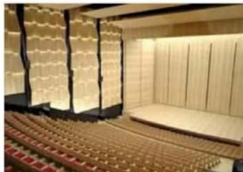
Sala. Se tiene un espacio para 450 personas.