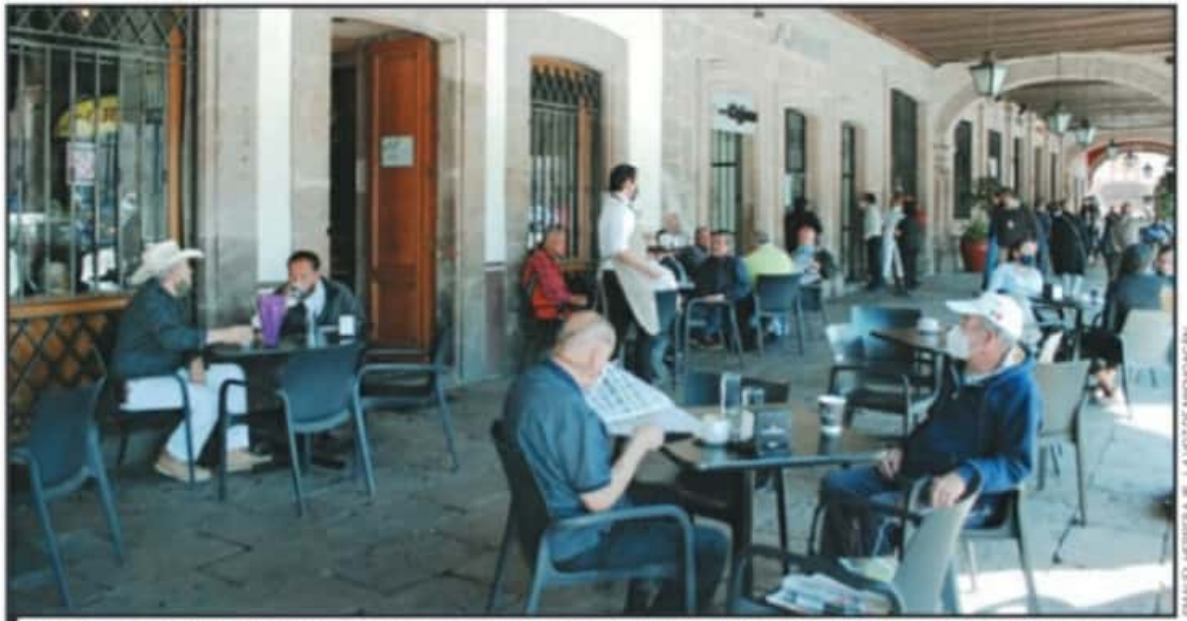
EL COMITÉ DE SALUD MUNICIPAL APROBÓ QUE PARA LOS LUGARES DE CONSUMO CONTINUARÁN LOS AFOROS CONTROLADOS PARA DISMINUIR LOS RIESGOS.

Cada uno de los municipios en donde se generaron medidas de cierre de comercios y espacios públicos, tendrán que sesionar con