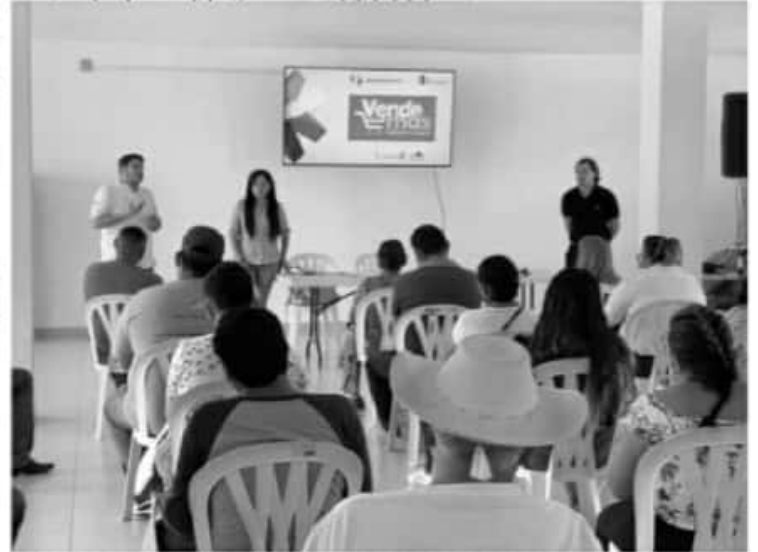
Con Vende Más, la Sedeco busca promover el desarrollo económico a través de apoyos integrales que constan de: capacitación, consultoría, remozamiento y equipamiento productivo