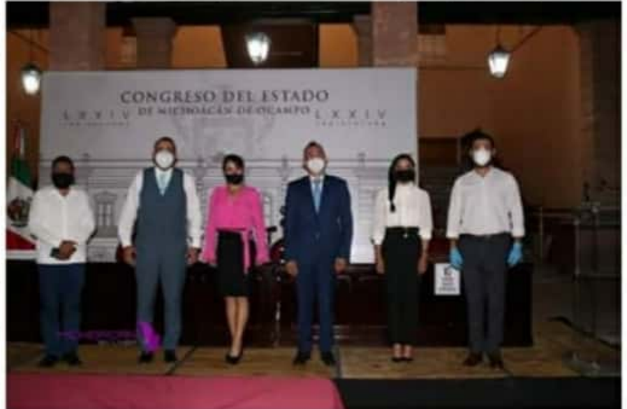
Diputados que integran el GPPRD en el Congreso del Estado, respaldaron el llamado de Alianza Federalista para que no se usen políticamente las instituciones.

llamaron a redoblar esfuerzos para una democracia política que dé cauce a la pluralidad política que existe en México, lo que evitará que culminen las pretensiones hegemónicas del partido en el poder.