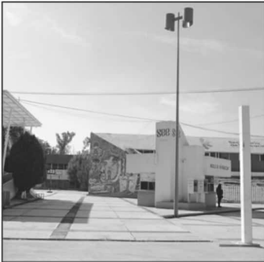
AUTORIDADES DE LA SEETRAJAJAN PARA QUE EL AGUA SEA EL RECURSO INDISPENSABLE PARA LA SALUD DE LOS ALUMNOS.