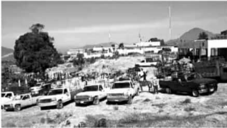
Desde que se instala el tianguis ganadero, se ha convertido en la mejor oportunidad que tienen ganaderos de vender al contado cabezas de ganado o aves.

- Este jueves retomó actividades pero descansará las siguientes dos semanas