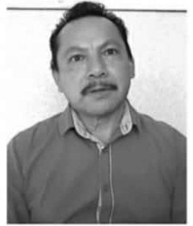
También han enfrentado en los últimos meses problemas por la escasez de agua como en la Presa de Zirahuato y la Presa del Bosque, ya que ambas no se llenaron durante la época de lluvias.

"El panorama es crítico, y la única esperanza que tenemos es esperar a que llegue la temporada de lluvias para recuperarnos en la floración de septiembre", dijo.