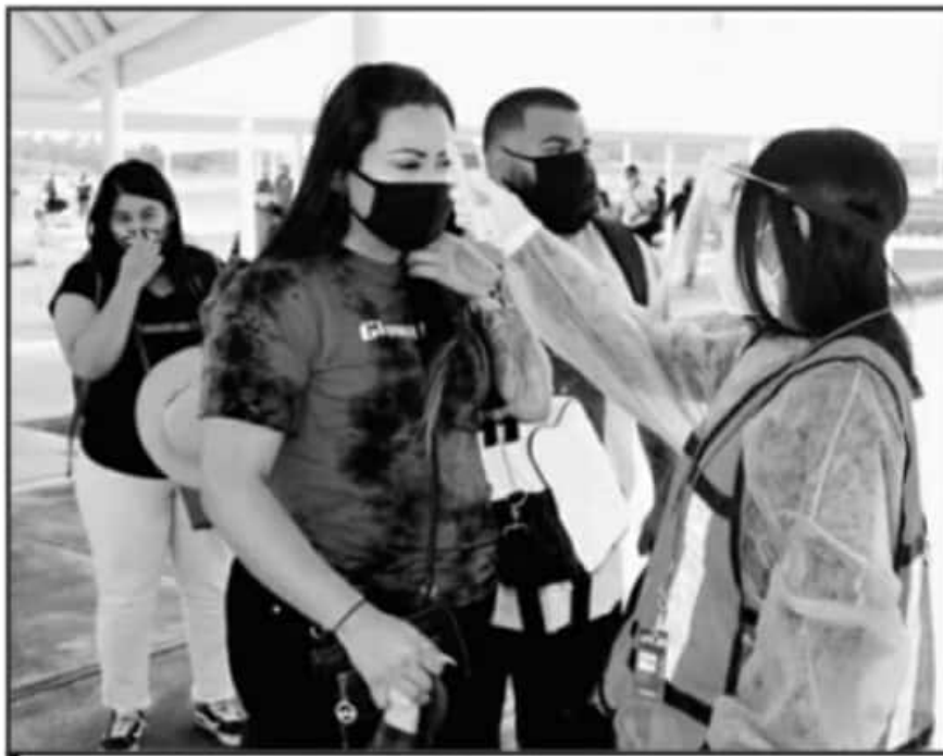
LAS NUEVAS MEDIDAS SANITARIAS LAS ESTABLECERÁ EL COMITÉ MUNICIPAL DE SALUD, PARA EVITAR MÁS CONTAGIOS.

En este sentido, precisó que en atención al análisis detallado de la logística que requieren este tipo de trabajos o acciones gubernamentales emergentes, ya están identificados los posibles espacios que cumplen con los requerimientos necesarios y uno de ellos es el extenso espacio que alberga la Unidad Deportiva “Hermanos Flores Magón” ubicada al norponiente del centro de la ciudad con vías de comunicación y rutas de transporte que permiten una ágil movilidad.