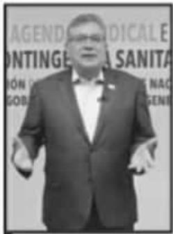
EL SECRETARIO GENERAL DEL SNTE ENCABEZA ACCIONES.