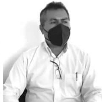
La dependencia no ha cerrado sus puertas, trabaja mediante guardias y en la entrada se ha dispuesto de un escritorio para evitar el contacto persona a persona.

Una dinámica que ha optado la dependencia es la realización de ferias virtuales, la más próxima está proyectada para este viernes 27 de febrero con sede en Uruapan, pero va a tener vacantes de todo el Estado. Zitácuaro participará con 8 empresas que estarán ofertando empleos que tengan disponibles, y ciudadanos de aquí pueden acceder a alguna, lo único que debe hacer es registrarse en la página www.sitrabajamichoacan.com.mx