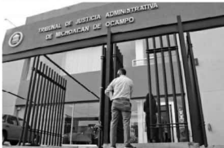
A partir del próximo lunes, el Tribunal de Justicia Administrativa de Michoacán (TJAM) reanudará la recepción de demandas por vía tradicional, de lunes a viernes de 10 a 13 horas.