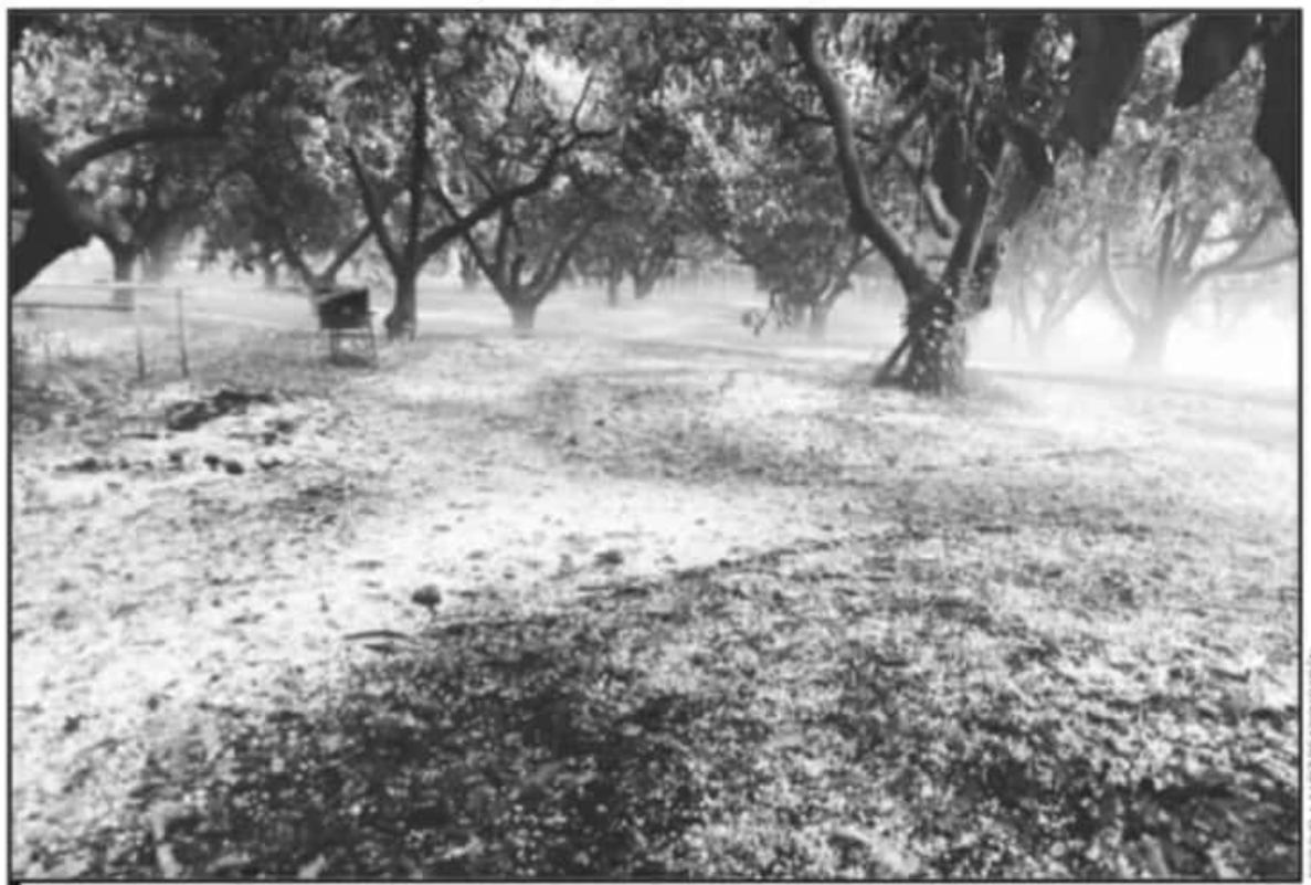
LAS HELADAS QUE SE PRESENTAN DURANTE LAS NOCHES Y MADRUGADAS YA HAN DEJADO ESCENARIOS TRÁGICOS EN CULTIVOS DE AGUACATE, COMENTAN.

Lo anterior, trajo consigo expresiones de manifestaciones durante esta semana en distintas regiones en donde incluso, los bloqueos de carreteras y los emplazamientos a los empaques, quedaron evidenciados como mecanismo de exigencia para que se nivelen los precios de empaque con las ganancias que se genera con el mercado del aguacate a nivel internacional con mercados como el estadounidense, europeo y asiático.