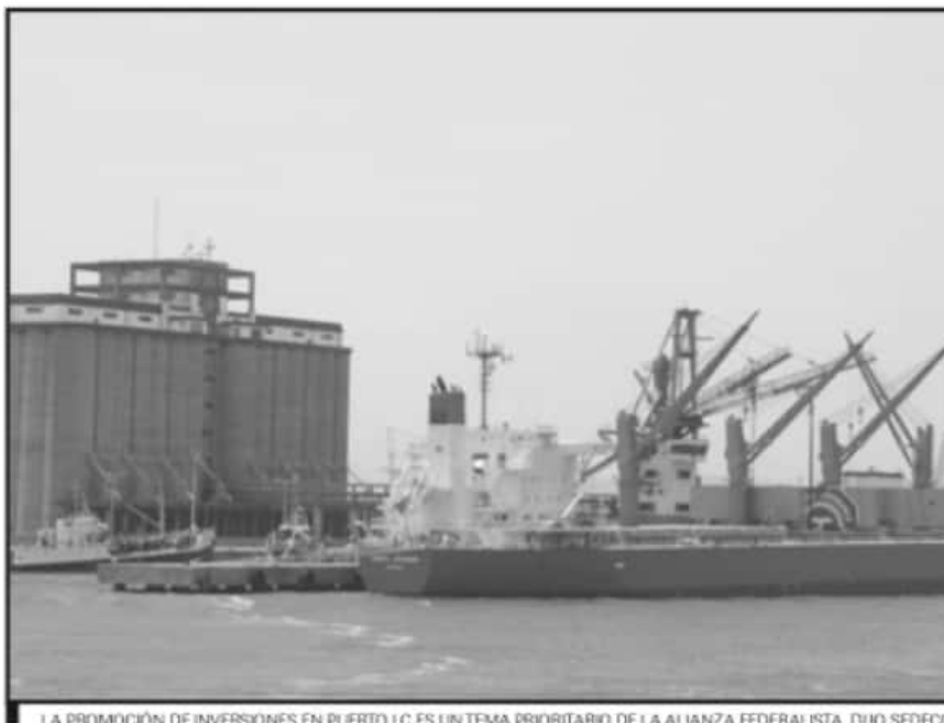
LA PROMOCIÓN DE INVERSIONES EN PUERTO LC ES UN TEMA PRIORITARIO DE LA ALIANZA FEDERALISTA, DUO SEDECO.

En el caso específico de Michoacán, son la ventaja geográfica de Lázaro Cárdenas y su potencial para convertirse en un exitoso corredor industrial lo que se posiciona como la apuesta más importante de la administración estatal, sin dejar de lado el poder del sector agroindustrial, que año con año lidera la derrama económica