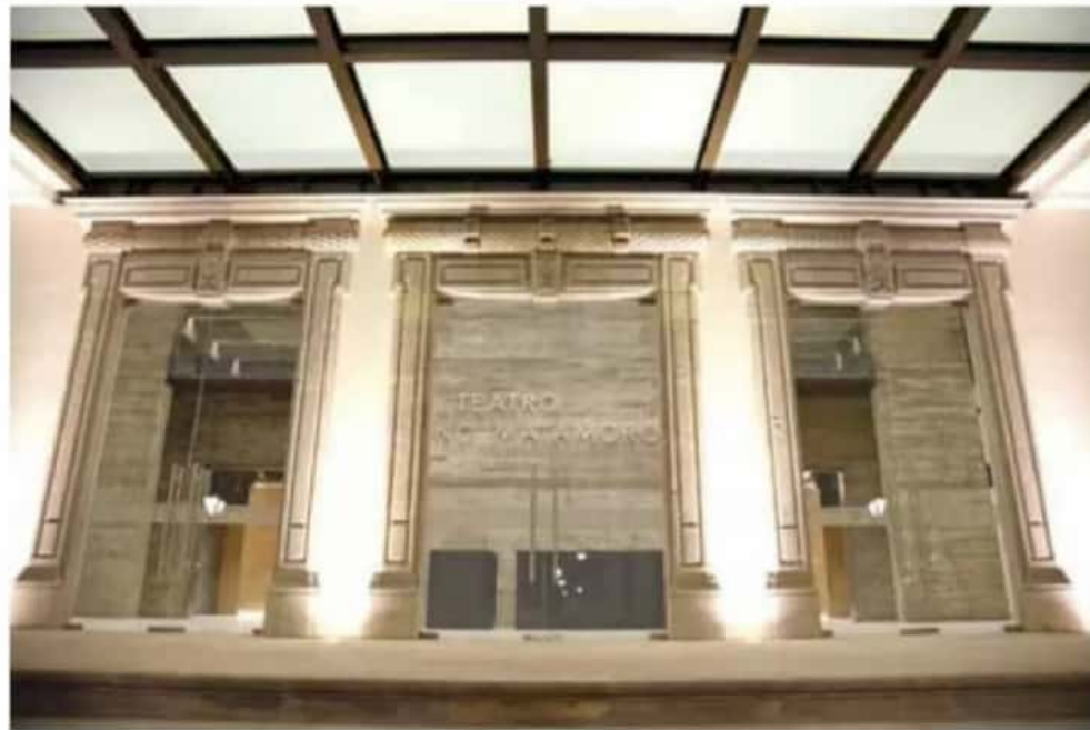
Inmueble. Albergará puestas en escena, espectáculos, conciertos, festivales, entre otras actividades.