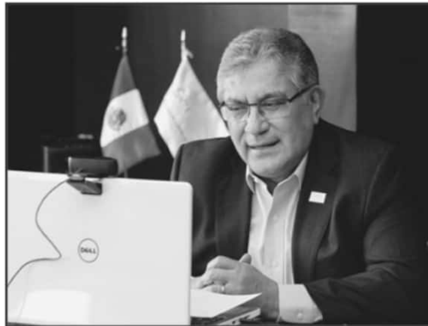
ALFONSO CEPEDA, SECRETARIO GENERAL DEL SNTE, DURANTE LA REUNIÓN VIRTUAL CON EL SECRETARIO DE HACIENDA.

2021. Al respecto, se acordó que bajará la tasa de interés en 1.5% y aumentará el monto de los ordinarios en 40%; además, se incluirán préstamos para