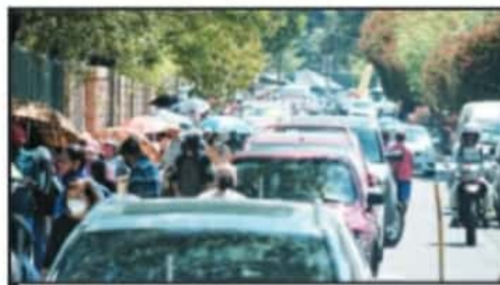
CON EL REINICIO DE LA VACUNACIÓN, REGRESARON LAS LARGAS FILAS.