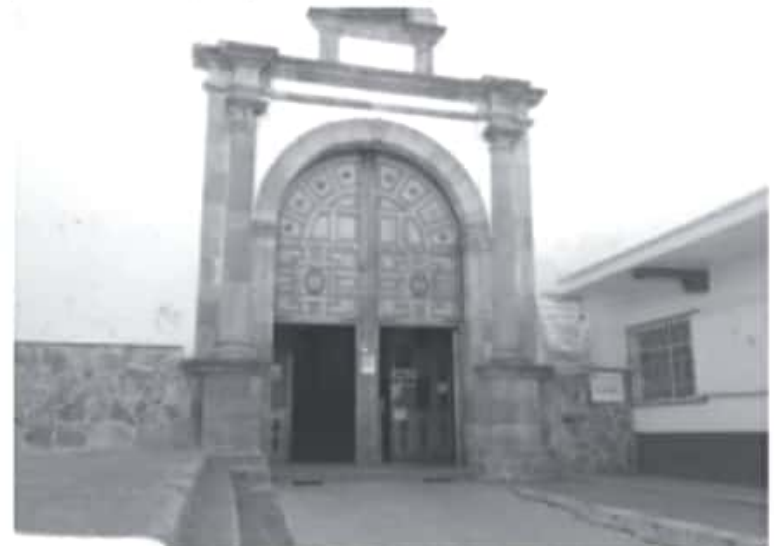
La celebración de Domingo de Ramos en las iglesias no será masiva como años anteriores, y la bendición de palmas solo se hará durante cada misa con aforo del 50 por ciento.