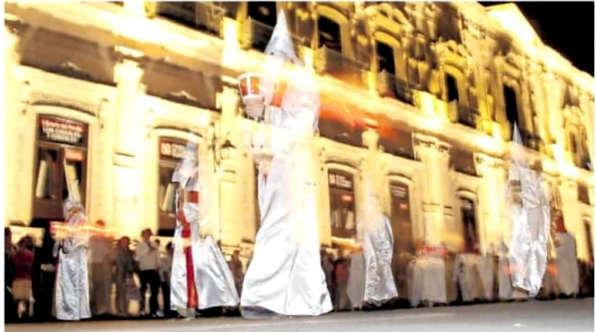
El trayecto incluye una parada para dar pie a la ceremonia de Pésame en la Plaza Valladolid