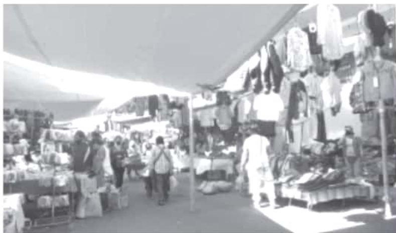
Desde que comenzó la pandemia, a los tianguistas que vienen de otros municipios o del Estado

Debido a que algunos ciudadanos no respetan las recomendaciones de salud, los comerciantes tienen la indicación de no venderles si no traen el cubrebocas, o de proporcionarles uno en caso de tener posibilidades de hacerlo.