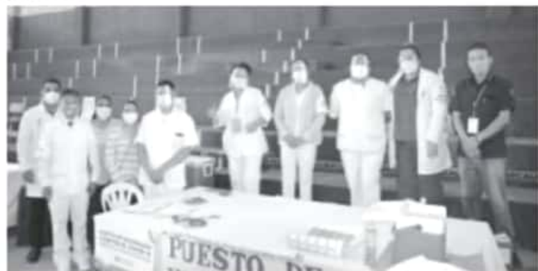
El Comité Municipal de Seguridad en Salud, informó que culminó la campaña de vacunación contra COVID-19 para adultos mayores de 60 años, alcanzando el objetivo de aplicar cerca de 12 mil 500 vacunas.

También se instaló un módulo especial en la primaria José María Morelos, para aquellas personas del mismo sector que no alcanzaron a vacunarse durante estos días o perdieron su cita; además se cubrió, a través de las brigadas móviles, a aquellas abuelitas y abuelitos que por su condición física no pudieron trasladarse, así como a quienes se encuentran en asilos y en la cárcel.