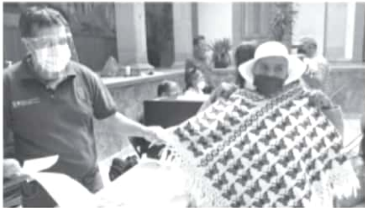
Artesanos locales nuevamente dieron muestra de su talento, luego de que 12 de ellos, originarios de la zona indígena, ganaron el concurso estatal de artesanías, con primeros, segundos y terceros lugares.

Zitácuaro, Mich., 26 de marzo del 2021 - Zitácuaro nuevamente dio muestra de su talento, luego de que doce artesanas y artesanos de la región indígena ganaron el concurso estatal de