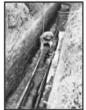
ESTRUCTURA SANITARIA Y PLUVIAL SE HA REFORZADO, ASEGURAN.

Antes, el 20 de enero del presente año, se informó sobre otra suspensión por los trabajos de pavimentación en un amplio tramo del Paseo Lázaro, lo que implicó cambio de tubería general de cuatro pulgadas. En esa ocasión, se afectó el suministro de agua para los usuarios del lado oriente del citado pase en su tramo del cruce con la Avenida Latinoamericana hasta el cruce con la calle Niza al sur de la ciudad.