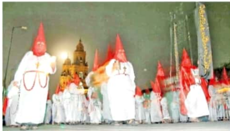
Cada cofradía adopta imágenes icónicas y una forma particular de vestirse

La tradición fue traída a la entonces Nueva España por los padres Carmelitas en 1585 para entonces arraigarse con fuerza