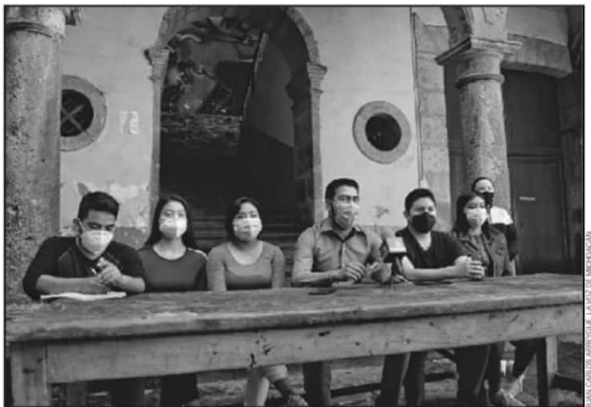
INTEGRANTES DE LA CUL DURANTE UNA RUEDA DE PREENSA, PARA INFORMAR DE LA EXPULSIÓN DE SU CONSEJERO Y DEL NUEVO NOMBRAMIENTO

Apuntó que, en la actual coyuntura electoral, la organización no participará y se mantiene al margen de apoyar a cualquier candidato aún si perteneció a la organización, ya que ha sido la tradición de la misma no inmiscuirse. El nuevo consejero indicó que la intención es la gestión para que continúen llegando los recursos a los albergues a pesar de este contexto de pandemia, asimismo velar por los intereses