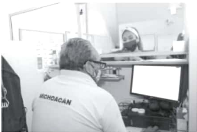
La SFA, informa sobre el periodo de cierre de oficinas, con motivo de las celebraciones de Semana Santa, comprendidas del 29 de marzo al 4 de abril, para las oficinas de Rentas en todo el estado.

Sin embargo, el proceso de pago en línea para el refrendo vehicular podrá realizarse en la página michoacan.gob.mx/tramites/bienvenido-consulte-sus-adeudos-de-tenencia-y-o-refrendo/ ; este servicio permite el pago sin restricción de horas o sin importar la suspensión de labores en oficinas, teniendo la oportunidad de recoger su engomado una vez que el servicio presencial se haya reestablecido.