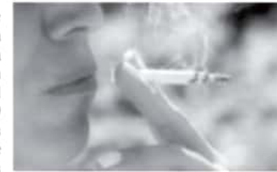
De acuerdo con datos de la Organización Panamericana de la Salud, se estima que del 30 al 40 por ciento de los cánceres se pueden prevenir al modificar los siguientes factores de riesgo.

Actualmente existen varios tipos de tratamientos para diferentes tipos de cáncer, algunos de ellos son: cirugía, quimioterapia, radioterapia, terapia dirigida, inmunoterapia, trasplante de células madre o médula ósea y terapia hormonal. 8 En MSD nuestro compromiso con los pacientes es inquebrantable, por ello, nuestro equipo de investigadores y científicos reúne conocimiento de la genómica, la biología y el sistema inmunológico para avanzar en la forma en la que se trabaja contra el cáncer. 9