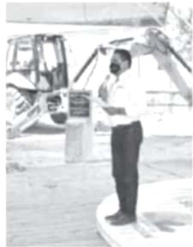
En Michoacán se está cerrando un ciclo importante para la salud de las y los ciudadanos, porque dejaremos los mejores servicios del país, afirmó el gobernador Silvano Aureoles.

"El Gobernador ha sido un aliado que ha cumplido a la población de nuestro municipio, porque con este nuevo Centro tendremos servicios de calidad y una atención digna para los habitantes", concluyó.