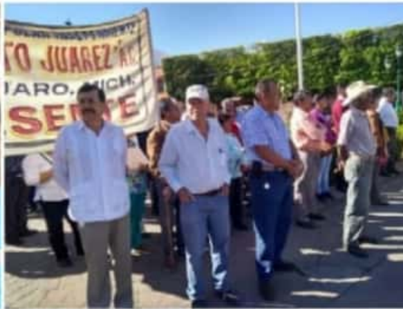
Figura Zitácuaro como el primer municipio en Michoacán en integrar su presupuesto participativo