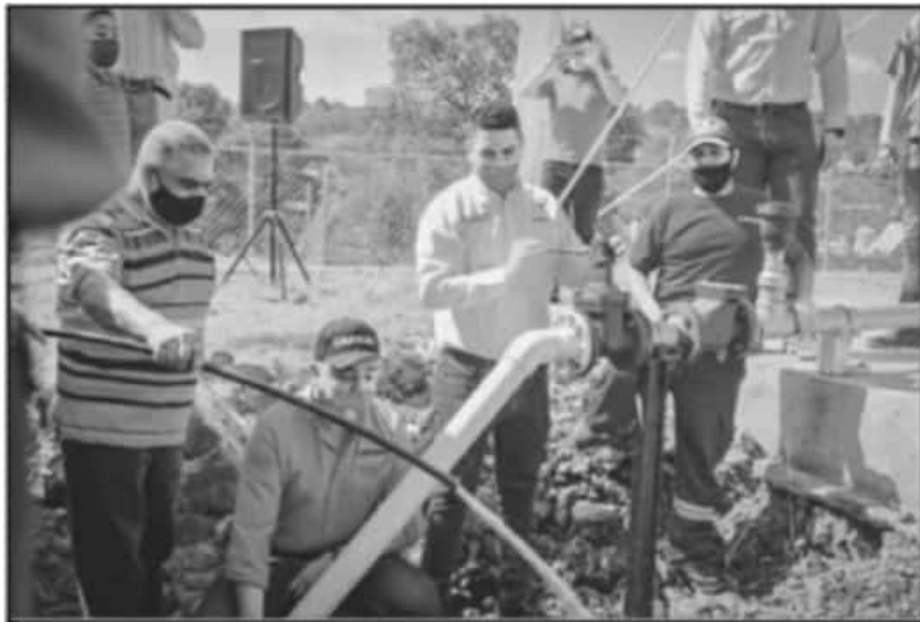
LA CAPASU SE ENCUENTRA EN UN PROCESO DE DIAGNÓSTICO Y SOLUCIÓN DEL ACTUAL PROBLEMA, ASEGURAN.

Existen trabajadores que destacan por su convicción de servicio, muchos con experiencia de muchos años, por ello ya son parte de la historia del organismo