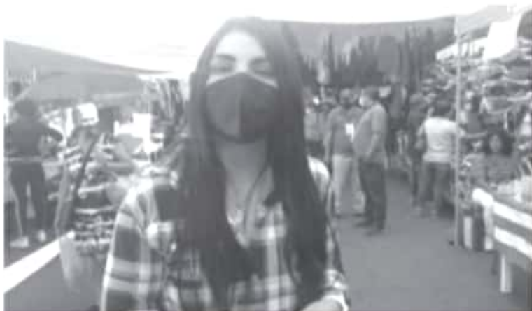
Somos conscientes que la economía del municipio depende de la actividad comercial, por eso invito a los comerciantes a trabajar en conjunto con la autoridad.

- Dicha medida aplicará en mercados y tianguis