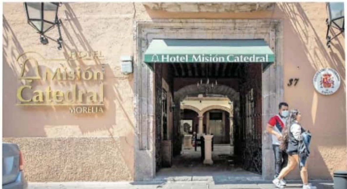
Según estimaciones de las autoridades, habrá al menos 4.4 millones de personas durante el periodo vacacional

NO HAY RESERVACIONES PARA ESTA SEMANA SANTA