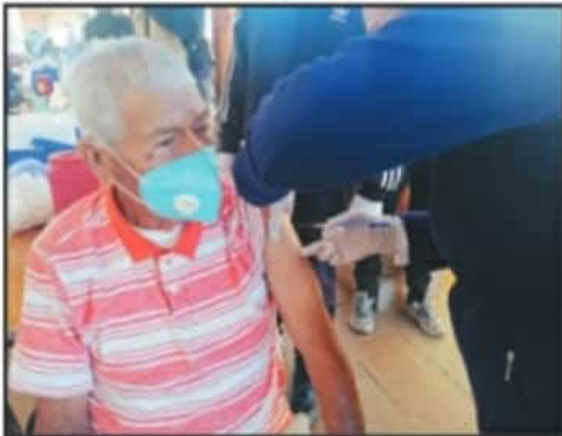
DESDE LAS 08:00 HORAS, EN LAS TRES SEDES DE PURUÁNDRIRO, SE INICIÓ EL PROCESO DE VACUNACIÓN A LOS ADULTOS MAYORES DEL MUNICIPIO.

La vacunación continuará este sábado para la región de la tenencia de Opopeo, que comprende las localidades de Palmitos, La Estacada, Tzitzipicho, Felipe Trintzun, El Tepetate, San Gregorio, la Puerta, Casas Blancas y Opopeo. Para el domingo se tiene prevista aplicar la vacunación a la región Paramén - Ixtaro, que comprenden al menos unas 20 localidades. La Casa de la Cultura de Santa Clara del Cobre, como sede única de la inoculación, a los beneficiados se les otorga agua y fruta después de ser vacunados.