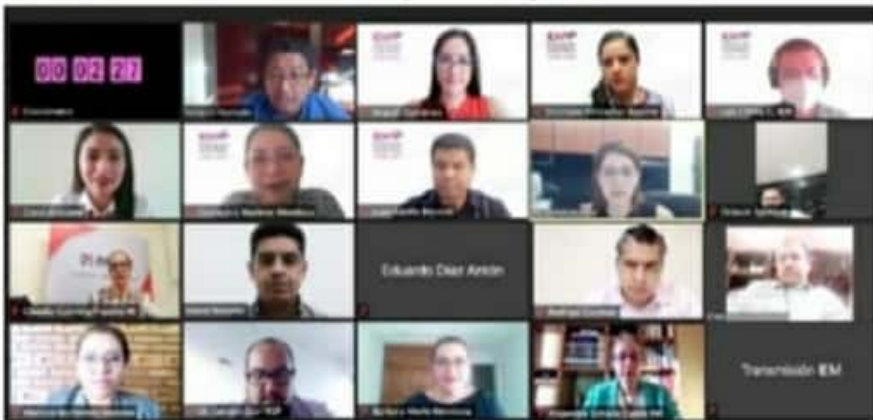
Consejeros electorales del IEM, aprobaron que la sede para ambos ejercicios democráticos (debates) será el Salón Michoacán del Ceconexpo.

en Michoacán, con inclusión, equidad, participación ciudadana y respeto a los derechos humanos.