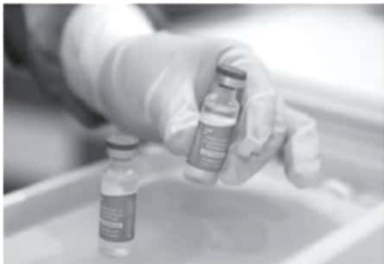
Estas vacunas apócrifas contra el virus SARS-CoV-2 ponen en peligro la salud de las y los ciudadanos, la Cofepris, ha publicado en su página web alerta permanente con información específica.

Cualquiera de los tres biológicos al inicio mencionados, no se deberá adquirir, ya que, en México, por el momento no está autorizado su comercio al sector privado; además de que la empresa no ha reconocido a ningún intermediario para este fin, por lo que, si alguien adquiere alguna sustancia que se ostente como vacuna, es falsa.