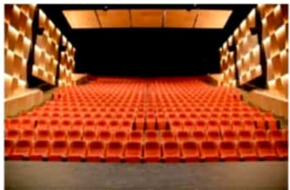
Artistas michoacanos consideran que la apertura de este espacio es una luz en medio de la oscuridad que ha dejado el COVID-19.

e-mail: notariopublica@michoacan@gmail.com