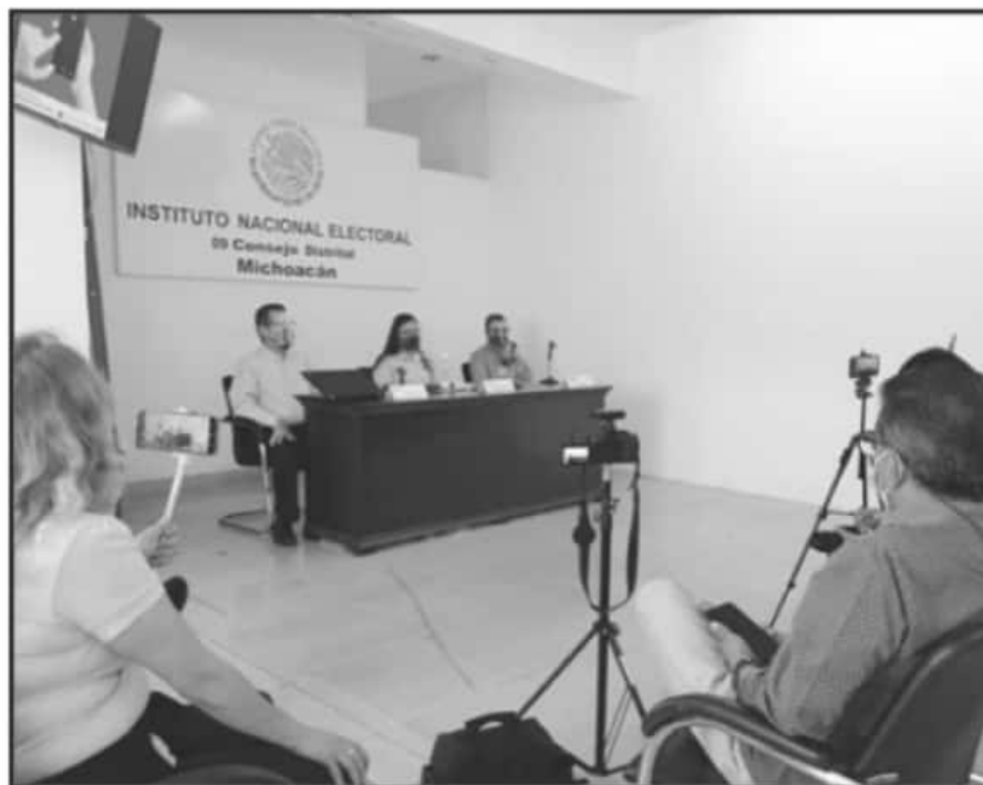
EN EL DISTRITO 09 DE URUAPAN SERÁN INSTALADAS 416 CASILLAS PARA LAS PRÓXIMAS ELECCIONES. DUO RICARDO CARO.

de mexicanos, quienes durante unas horas se alzarán como las máximas autoridades para el desarrollo de la jornada electoral, estará compuesto por 3 mil 744 ciudadanas y ciudadanos quienes además de hacer cumplir la ley electoral deberán hacer que se respeten los protocolos ordenados por la Secretaría de Salud ante la pandemia de coronavirus.