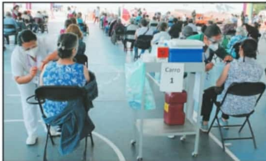
DE NUEVA CUENTA, LOS ADULTOS MAYORES DE MORELIA ACUDIERON A LOS CENTROS DE VACUNACIÓN INSTALADOS

aplicación de la vacuna contra COVID-19 en la ciudad de Morelia. Hasta un 5 por ciento de los adultos mayores que asistieron a los 11 centros de vacunación durante los últimos días, optaron por retirarse ante el riesgo de contagio