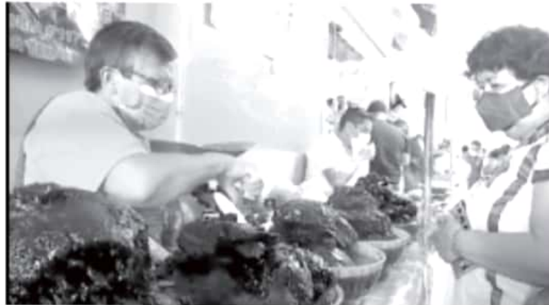
Cada fruta lleva diferente elaboración, no es la misma, pero lo particular de este dulce es que debe estar en el fuego un total de 36 horas, de lo contrario no tiene el sabor tradicional.