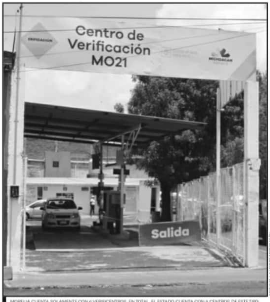
MORELIA CUENTA SOLAMENTE CON 6 VERIFICADORES, EN TOTAL, EL ESTADO CUENTA CON 8 CENTROS DE ESTE TIPO.

dado a conocer la intención de invertir en los centros ya existentes en la ciudad de Morelia mientras que los concesionarios han manifestado que no es rentable seguir invirtiendo ante la baja demanda de estos dos últimos años.