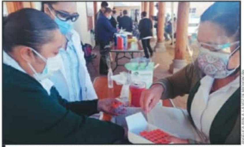
LA VACUNACIÓN CONTRA LA COVID-19 CONTINUARÁ ESTE SÁBADO PARA LA REGIÓN DE LA TENENCIA DE OPOPEO.

El H. Ayuntamiento de Puruándiro continúa apoyando a la ciudadanía con el registro para la vacunación así como con el traslado a las sedes correspondientes y con el trámite de los requisitos, reafirmando la importancia e interés hacia salud de los ciudadanos, en esta ocasión pertenecientes al sector de mayor riesgo ante esta pandemia.