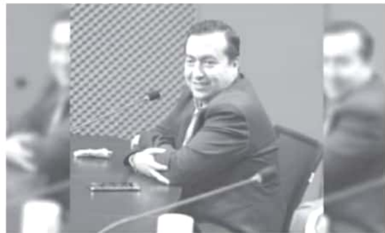
La decisión del órgano electoral de actuar por actos anticipados de campaña, es también por la omisión de un informe de gastos de precampaña por parte de los aspirantes de Morena.

"Todo el apoyo a los representantes de la Cuarta Transformación en Michoacán, que recibieron un golpe por parte de las instituciones neoliberales al servicio del PRIANPRD", finalizó.