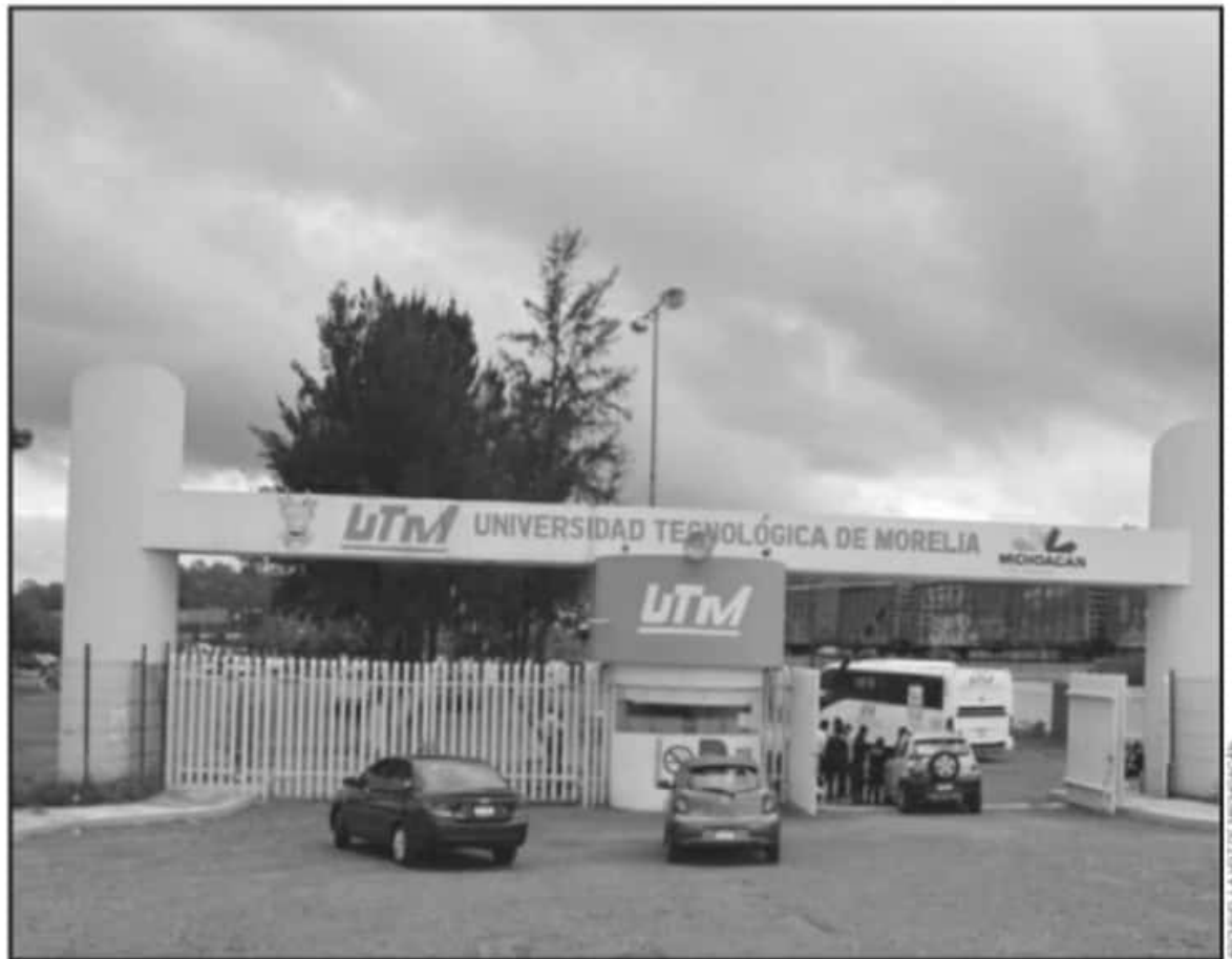
LA UNIVERSIDAD TECNOLÓGICA DE MORELIA (UTM) PONDRÁ EN MARCHA UN PROYECTO QUE NACIÓ DE SUS PROPIOS ALUMNOS Y QUE SERÁ DE GRAN BENEFICIO.

Expuso que el proyecto presentado logra acceder, a recursos para primero obtener la antena para dotar de Internet a la comunidad, a un bajo costo y se entregarán los dispositivos a las familias. “Sí, la demanda está rebasada por el sondeo que hicimos, pero veremos que se entreguen a los hogares donde más lo necesiten; el sistema que vamos a implementar es que se tendría una cuota mínima de recuperación y en los casos de si-