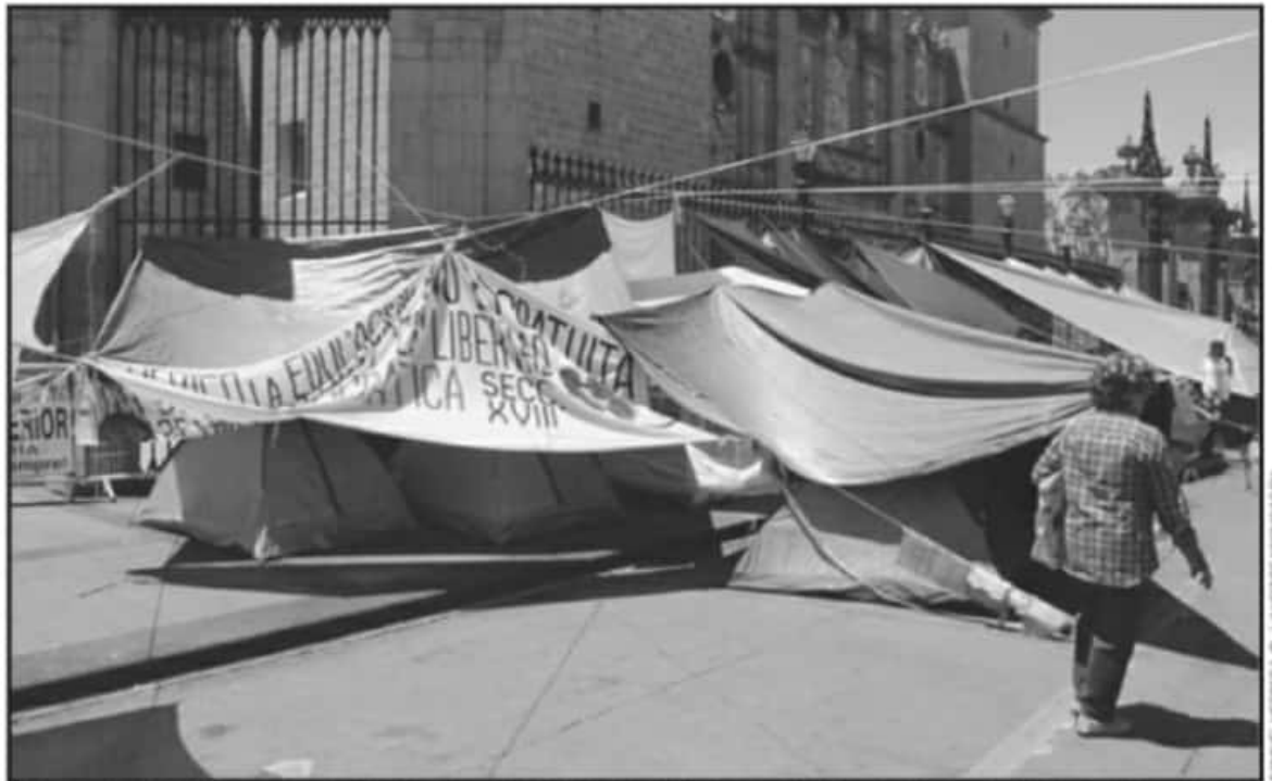
EL REDUCIDO GRUPO DE DOCENTES QUE MANTENÍAN EL PLANTÓN SOBRE LA AVENIDA MADERO DECIDIÓ EL DÍA DE AYER SUSPENDER LA PROTESTA POR VACACIONES.