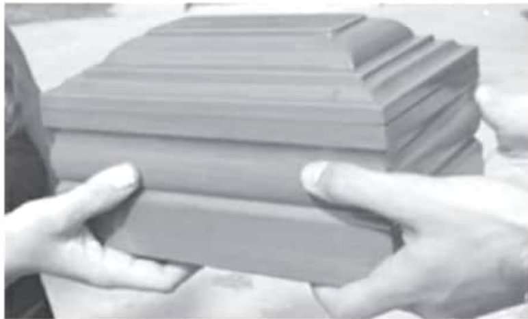
Sin cada vez más las familias que deciden cremar los restos de su ser querido que ha fallecido a causa de este virus, de 10 personas, 4 son incineradas.

H. Zitácuaro Michoacán, 25 de marzo de 2021.- Por: Guadalupe Solache Rebollo A nivel local aumenta la incineración de las personas que han perdido la vida a causa del Covid 19, debido a la falta de espacios en los panteones y porque es más sencillo disponer