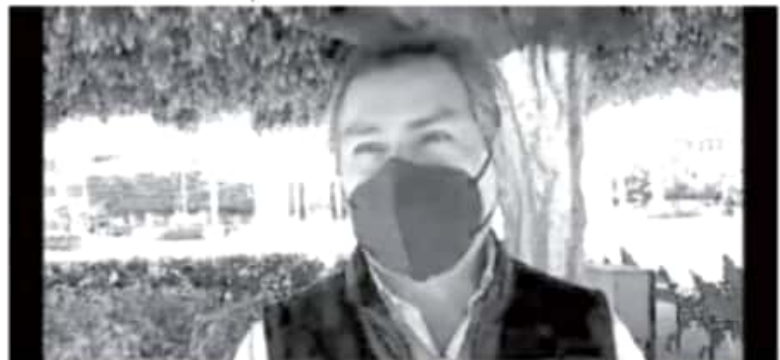
SNE realiza feria: La actividad se realiza de forma estatal donde se están ofertando 900 vacantes de distintos niveles operarios, y Zitácuaro participa con 150 de unas 15 empresas que se registraron para participar.

De acuerdo al Servicio Nacional del Empleo en el Estado, durante los meses de marzo, abril, mayo y junio, en Michoacán se tuvo una pérdida importante de empleos, se estima que esta cifra es de 15 mil 700 empleos.