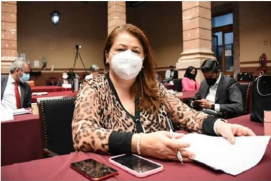
Cristina Portillo Ayala, Presidenta de la Comisión de Gobernación en el Congreso local.

"Vamos juntas y juntos en este objetivo. Nuestro país, nuestro estado y nuestro municipio así nos lo demandan", concluyó.