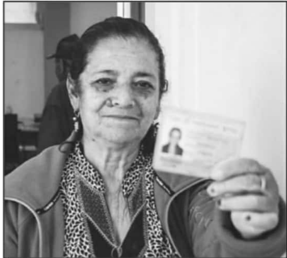
ANTE LA FALTA DE MICAS, EL TRÁMITE DE LA CREDENCIAL NO SE HA DETENIDO DESDE QUE SE REACTIVÓ EL PROGRAMA.

Ante el incremento de demanda y la falta de la mica, que debe ser proporcionada por el instituto nacional al beneficiario, se