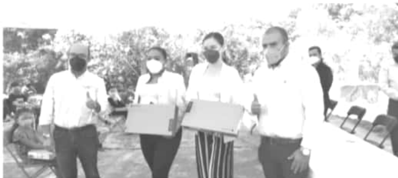
Los equipos cuentan con todos los contenidos educativos para este nivel de educación básica, además no necesita conexión a internet para establecer comunicación con el maestro mediante una plataforma digital

Este programa permitirá que niños como Víctor, que es alumno de esta escuela no abandone sus clases y cumpla con los contenidos educativos que marca su grado, ya que antes de esta entrega solo recibían material e indicaciones para enviar tareas.