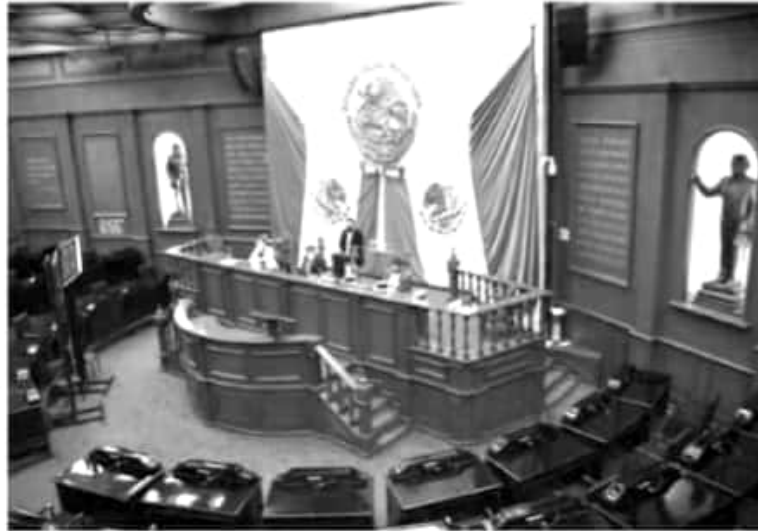
Para recibir esta prestación, deberá dársele prioridad a las y a los menores de 18 años, a las y los niños con cáncer, las y los indígenas y afroamericanos, hasta la edad de 64 años.

Así, la propuesta legal busca incorporar en la redacción del artículo 4