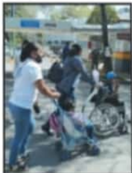
INFANTES CON CÁNCER TENDRÍAN APOYO ECONÓMICO.

Así, la propuesta legal busca incorporar en la redacción del artículo 4 de la Constitución Política de los Estados Unidos Mexicanos, la obligatoriedad del Estado de garantizar un apoyo económico a las personas que tengan alguna enfermedad crónica o discapacidad permanente. Para recibir esta prestación, deberá dársele prioridad a los menores de dieciocho años, a los niños con cáncer, los indígenas y afroamericanos, hasta la edad de sesenta y cuatro años, así como a las personas que se encuentren en condición de pobreza.