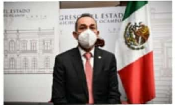
La estrategia aplicada obedece a criterios político-electorales y no epidemiológicos.

Refirió que razón de dos millones de mexicanos vacunados por mes, en agosto apenas se estaría cubriendo una cantidad de diez millones de mexicanos, lo que evidentemente va muy por debajo de las cuentas alegres que está presentando el Gobierno de la República, el cual recordó que está más interesado por el proceso electoral que por actuar para proteger la vida de las y los mexicanos.