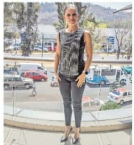
De los Santos vivió sus primeras experiencias políticas en la sindicatura

sideró que las reformas promovidas para garantizar paridad de género en la vida pública del país, se seguirían viendo mermaid por el esquema sociocultural con que se rigen las y los mexicanos. “Hoy tenemos reformas constitucionales que iniciaron en el periodo de Peña Nieto, que nos permiten una mayor participación a las mujeres, pero nos seguimos enfrentando a una cultura machista”, concluyó.