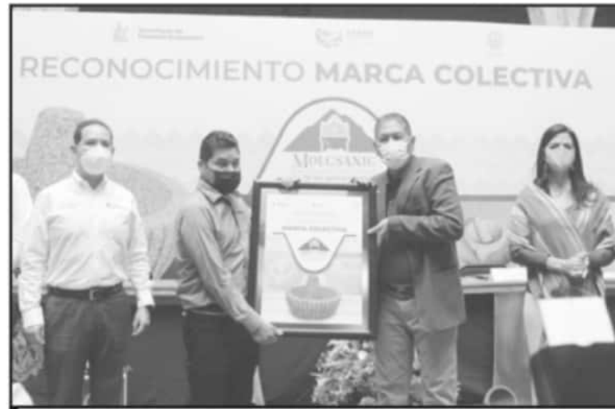
EL IMPI DIÓ EL AVAL A LA MARCA COLECTIVA MOLCSANIC, PARA LOS MOLCAJETES DE SAN NICOLÁS OBISPO.

Durante el evento para dar a conocer este logro de la tenencia