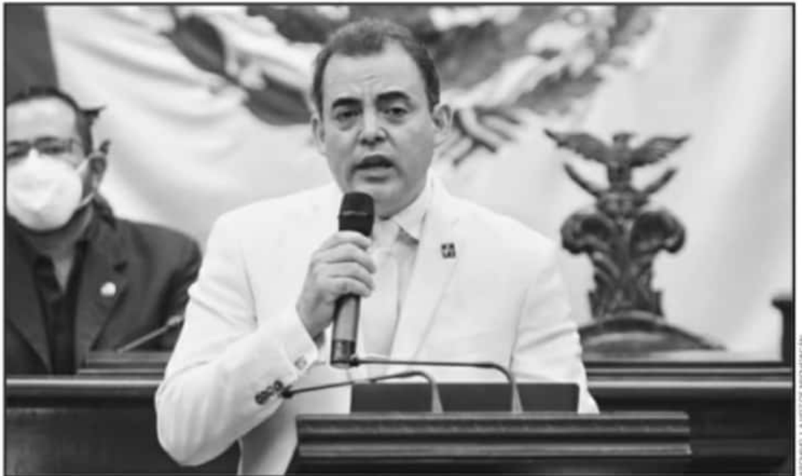
EL QUE FUERA CINCO VECES EDIL DE TARÍMBARO PERDIÓ LA BATALLA CONTRA LA COVID-19 POR UNA COMPLICACIÓN EN LOS RIÑONES, INFORMARON FAMILIARES.

"Tenemos un homenaje póstumo, será en la Presidencia Municipal. A las 11 de la mañana será una ceremonia solemne, al término de la ceremonia se le permitirá a la gente que quiera, con las medidas de seguridad sanitaria y protocolos que estén en orden. Lo hacemos porque sé que hay mucha gente que lo quiere, que lo aprecia de corazón. Estamos sorprendidos de la gente que quiere estar cerca de él y no podemos dejarles de dar esa posibilidad de estar cerca de quien les tendió la mano", mani-