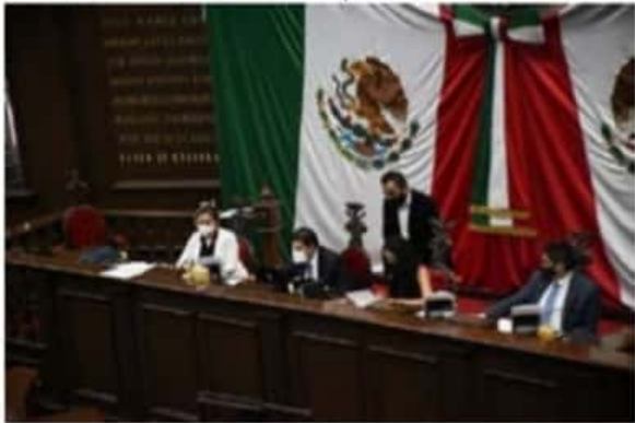
Los diputados locales, realizaron diversos exhortos al Titular del Poder Ejecutivo, a fin de mejorar y fortalecer las políticas públicas en torno a Turismo, Derechos Humanos, Gobernación, Asuntos Electorales y Participación Ciudadana, entre otras

Al respecto la comisión dictaminadora concluyó que la iniciativa se encuentra dentro de los límites fijados por la Constitución local y los tratados internacionales de los que México forma parte, toda vez que no contraviene con las facultades que tiene el Congreso de la Unión; refiriendo que no reviste ningún tipo de inconstitucionalidad en el ámbito local.