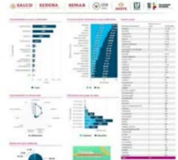
Según el CESS, el día de ayer el municipio de LC registró otros 6 casos positivos más de COVID-19 para un acumulado de 5,905.