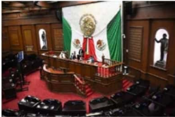
La 74 Legislatura, remitió al Congreso de la Unión una propuesta de reforma al artículo 4 de la Constitución Política de los Estados Unidos Mexicanos.

Por lo anterior, los diputados locales consideraron pertinente que dichas prestaciones sociales y económicas establecidas por la Federación, se amplíen para las personas con alguna enfermedad crónica, brindando así especial protección de los derechos de los menores y de quienes por su condición de salud, sean vulnerables.