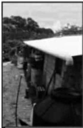
SE BENEFICIAN LOS HABITANTES.

potable que se llevó a cabo para beneficiar a las colonias La Arboleda y Villa del Sol. Ahí, sus residentes cumplieron 15 años viviendo y en ese tiempo ningún gobierno había volteado a verlos para llevarles obras de agua y drenaje, por lo que no dudaron en externar su agradecimiento hacia la administración del Gobernador Silvano Aureoles Conejo. En Buenavista, El Llano (San Miguel Canario) y la cabecera municipal, también se implementaron trabajos de alcantarillado y colectores sanitarios.