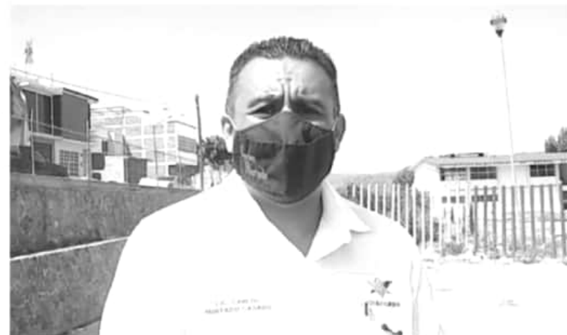
En el proceso electoral buscó encabezar la candidatura a la Diputación Local, por la conformación de la alianza del PRD, PRI y PAN, la designación le tocó al PRI y es para una mujer.