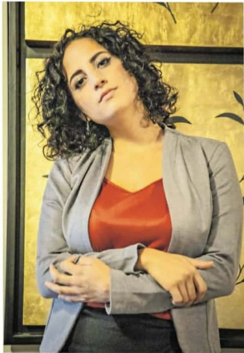
La artista fue crítica con lo que las instituciones le ofrecen a su gremio

En ese sentido, la pandemia le ha servido para “atreverse a experimentar” y ahondar más en sus obsesiones. Se hace tarde, pero la charla continúa en el patio del café-librería. Llegamos a la política en el arte y le pregunto cómo se percibe en