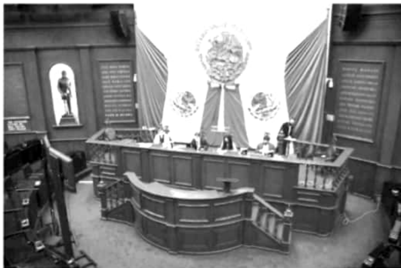
En el Congreso del Estado se recibieron las solicitudes de licencia para separarse por tiempo indefinido de su cargo de nueve diputados locales.

Posteriormente en la próxima sesión, el Pleno del Congreso del Estado analizará, discutirá y votará los dictámenes de las licencias de los legisladores locales antes mencionados y en caso de ser aprobados, las y los suplentes de quienes hoy solicitaron su licencia para separarse por tiempo indefinido de su encargo como legisladores, tomarán protesta como diputados y diputadas locales.