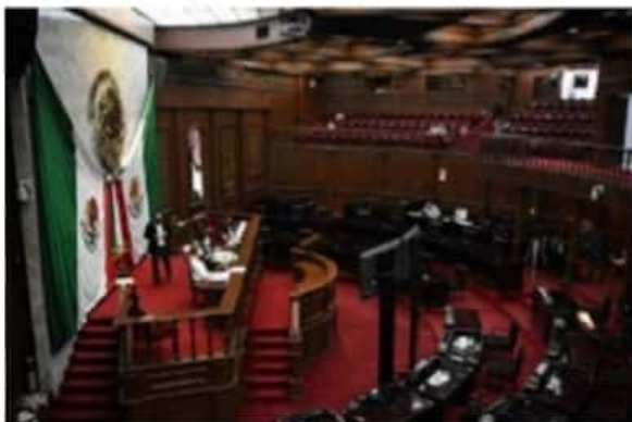
El Pleno de la 74 Legislatura otorgó el "ha lugar", para su análisis y discusión, a dos iniciativas de reforma constitucional en materia electoral y de