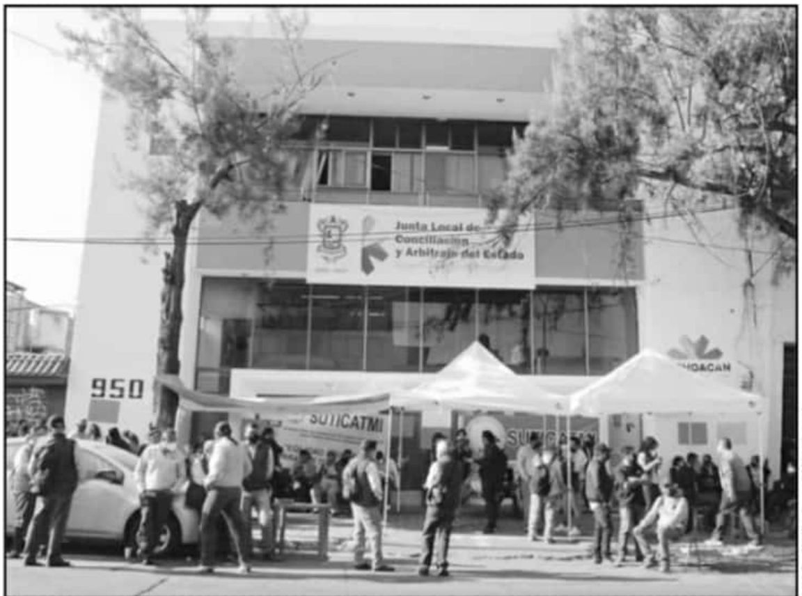
EL CONFLICTO ENTRE LOS GRUPOS POR LA OBTENCIÓN DEL CONTRATO COLECTIVO DE TRABAJO SE HA MANTENIDO DURANTE AÑOS, COMENTA DIRIGENTE.

"La prueba final es el mencionado recuento de trabajadores sindicalizados para determinar la mayoría, establecido en los artículos 897-F y 389 de la Ley Federal de Trabajo (LFT), después de un proceso largo ante la Junta Local finalmente se resolvió de manera favorable para nuestro gremio".