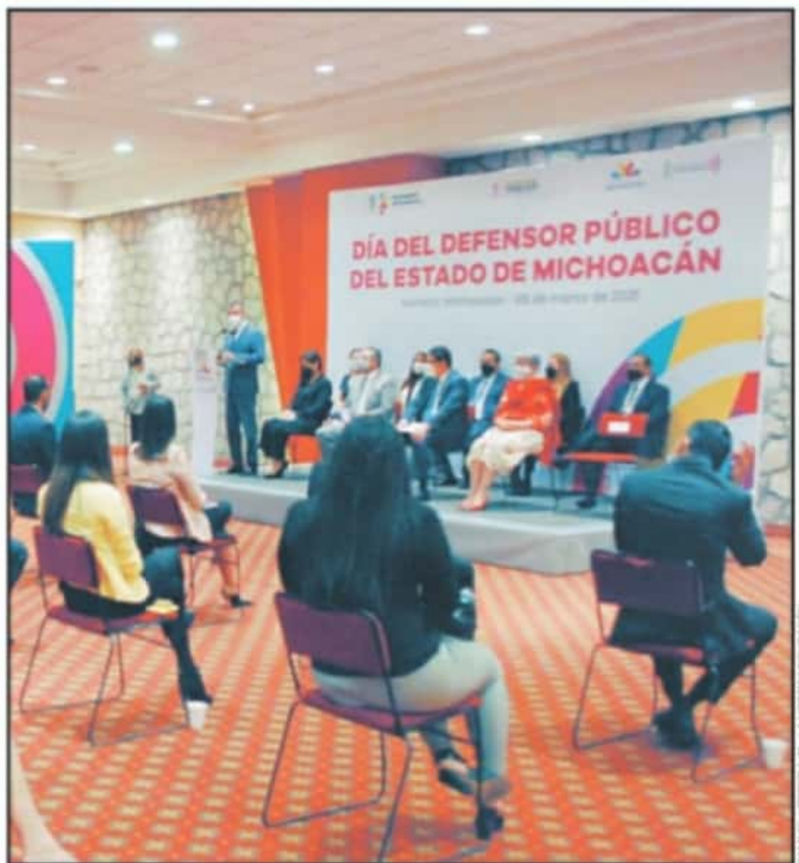
EN EL MARCO DEL DÍA DEL DEFENSOR PÚBLICO SE RECONOCIÓ LA PROBLEMÁTICA A LA CUAL SE ENFRENTAN LAS MUJERES.

tos atendidos. Se espera que, con la reapertura de actividades del Poder Judicial de Michoacán desde inicios de año, incrementen la cifra de atenciones antes las necesidades de la población por los asuntos rezagados.