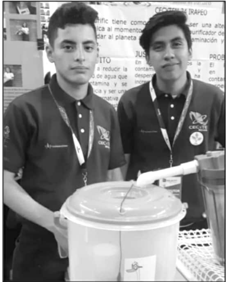
FUE EN CONCURSOS DE CIENCIAS Y ROBÓTICA DONDE LOS ESTUDIANTES OBTUVIERON LOS GALARDONES

"Nos sentimos orgullosos y contentos de recibir este galardón, que en nuestro municipio reconocen nuestro talento, trabajo y esfuerzo es una alegría", dijo la alumna de Tangancicuaro. La estudiante expresó que este año ha sido complicado, un año atípico en nuestra historia; 2020 no ha sido sencillo, pero consideramos que la ciencia, la tecnología, el deporte, la salud, la cultura y nuestras tradiciones