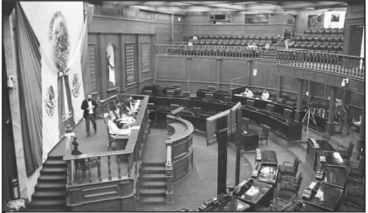
LAS DOS INICIATIVAS FUERON CONSIDERADAS PROCEDENTES, AL NO CONTRADECIR DERECHOS FUNDAMENTALES CONSAGRADOS EN LA CONSTITUCIÓN

taminadora determinó que la propuesta de reforma no modifica las condiciones para que la persona adquiera la calidad de ciudadano, lo que pretende es homologar en los dos supuestos anteriores, es que a la edad de dieciocho años se adquiere el derecho para votar y ser votado.