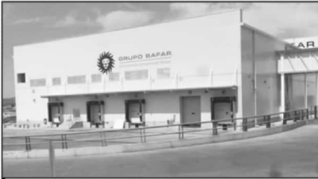
EMPRESARIOS PONEN LOS OJOS EN MICHOACÁN PARA ABRIR DOS EMPRESAS MÁS Y GENERAR MILES DE FUENTES DE EMPLEO.