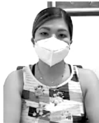
Se pretende entregar un reconocimiento a alrededor de 200 mujeres enfermeras y doctoras, así como trabajadoras, que están en la primera línea de atención de Covid 19 en instituciones del sector salud.

"Si bien es cierto que no podemos realizar un evento masivo como años pasados, no queremos que esta fecha pase desapercibida para las mujeres, ya que representa una fecha fundamental para este sector que representa más de la mitad de la población total", expresó