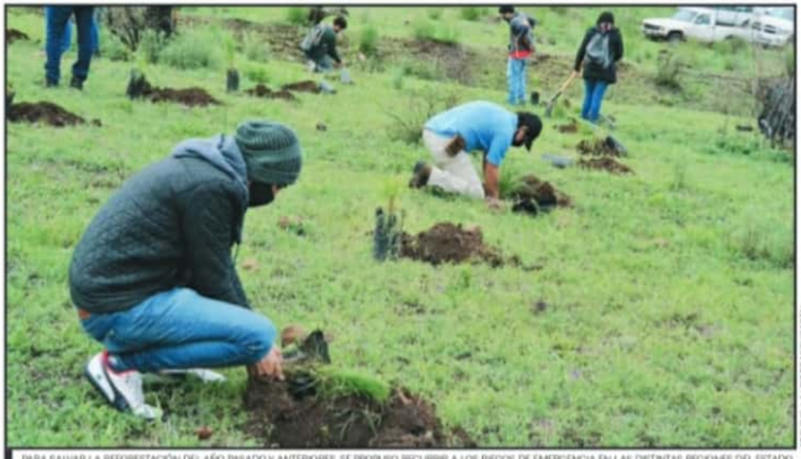
PARA SALVAR LA REFORESTACIÓN DEL AÑO PASADO Y ANTERIORES, SE PROPUSO RECURRIR A LOS RIEGOS DE EMERGENCIA EN LAS DISTINTAS REGIONES DEL ESTADO.

"Se suma el efecto del estrés por sequía con las heladas para acabar por matar a las plantas y tenemos una mortalidad muy im-