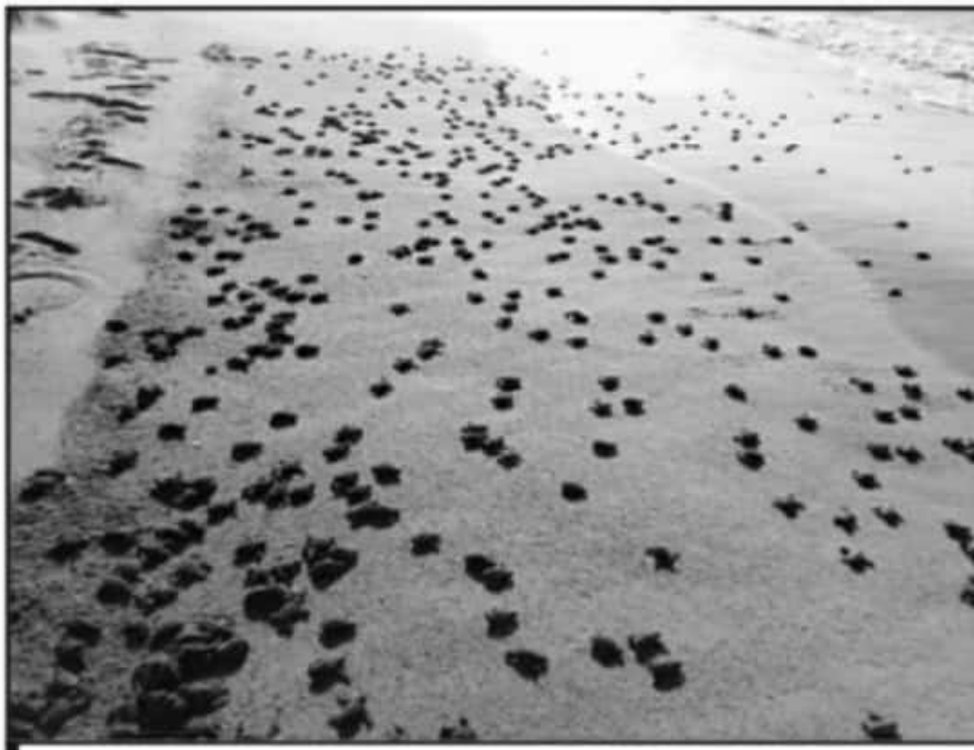
COMPARADO A LA TEMPORADA PASADA, EN ESTA OCASIÓN SE REGISTRÓ UN ÉXITO ABSOLUTO, ASEGURAN

Lamentó el presidente del campamento tortuguero "Solera