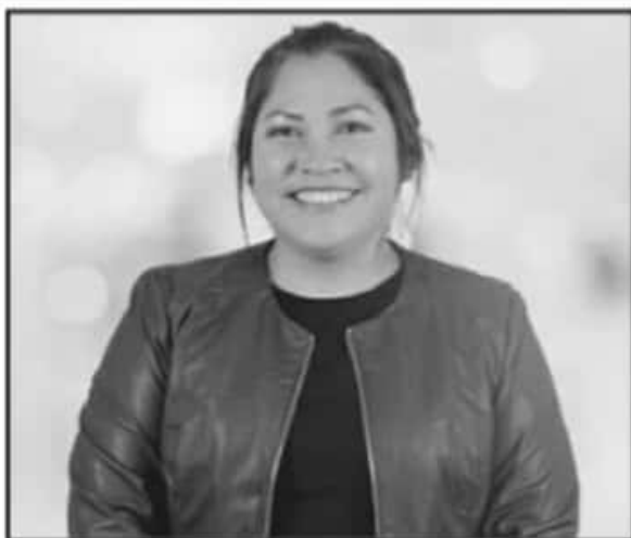
EN EL MARCO DEL DÍA INTERNACIONAL DE LA MUJER, LA LEGISLADORA DESTACÓ QUE EN EL 2020 MORELIA FUE UNO DE LOS MUNICIPIOS CON MÁS FEMINICIDIOS.

Al respecto la comisión dictaminadora concluyó que la Iniciativa se encuentra dentro de los límites fijados por la Constitución local y los tratados internacionales de los que México forma parte, toda vez que no contraviene con las facultades que tiene el Congreso de la Unión; refiriendo que no reviste ningún tipo de inconstitucionalidad en el ámbito local.