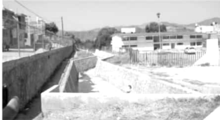
El alcalde recordó que en noviembre de 2019 lluvias atípicas azotaron la ciudad, esta zona fue la más afectada por inundaciones, incluso el agua entró a varios domicilios.

Como parte final del acto de inauguración autoridades y representantes llevaron a cabo el tradicional corte del listón inaugural.