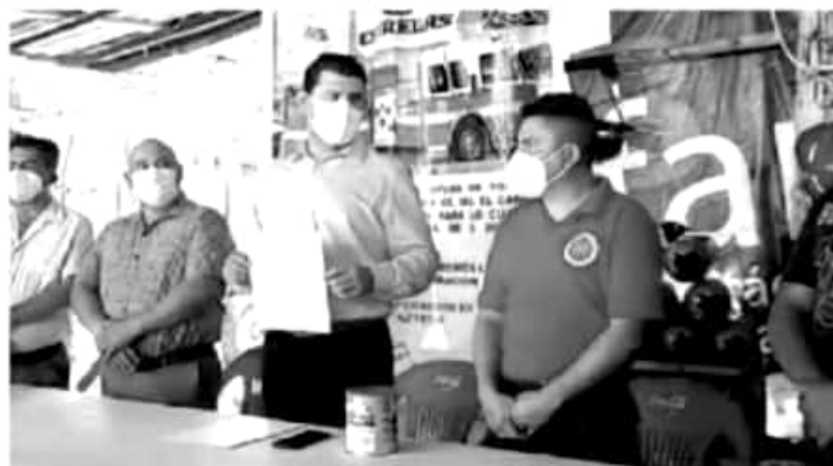
En la Base del Cuerpo de Bomberos, hizo entrega de literas y además un donativo de 20 mil pesos que servirán para traer el camión de Estados Unidos.

-A Bomberos entrega literas y 20 mil pesos para completar traslado del camión de EU.