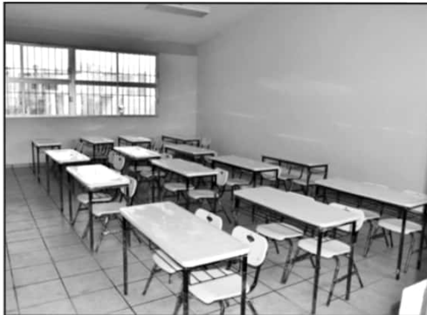
LA ENTREGA DE MESAS Y MESABANCOS PARA EL AULA DE TAREAS SE SUMA A LAS ACCIONES DE LA SOCIEDAD CIVIL.

permiten que la niñez que se encuentra matriculada en este centro cuente con las condiciones necesarias para su desarrollo pleno y continúen sus estudios.