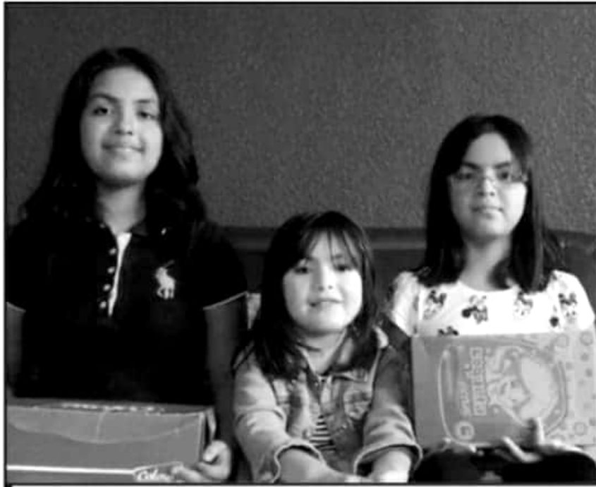
CON EL PROGRAMA DE CALZADO ESCOLAR, LOS MENORES SE VEN BENEFICIADOS AL RECIBIR EL IMPORTANTE APOYO.

A su vez, la diputada local hizo llegar a diversos domicilios el calzado escolar que le solicitaron a través de su casa de gestión y por medios electrónicos, a los menores en las colonias y comunidades del