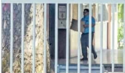
El examen será realizado por el Ceneval. /CARMEN HERNÁNDEZ