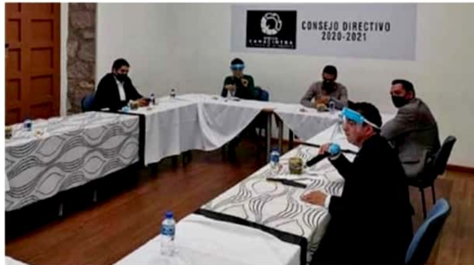
Legisladores de Acción Nacional sostuvieron un encuentro con la Mesa Directiva de CANACINTRA, Delegación Morelia.