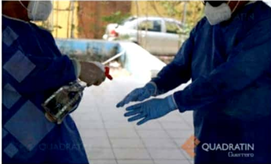
Hasta el día de ayer en Guerrero sumaban 1,539 personas fallecidas a consecuencia del COVID-19.

Los municipios de Juan R. Escudero y La Unión sumaron cinco decesos, respectivamente, el primero tuvo una nueva defunción y el segundo acumuló dos más. En Omepetec, Tixtla, Teloloapan y Xochistlahuaca notificaron la muerte de una persona más en cada municipio, por lo cual cerraron con 23, nueve, cinco y dos muertes acumuladas, respectivamente.