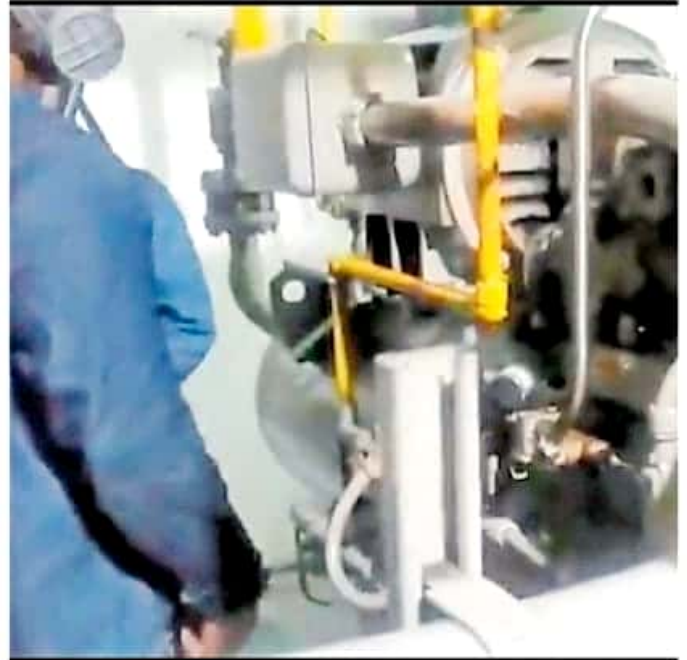
La empresa detuvo sus labores hasta que se garantizara la seguridad de los empleados.

Los sistemas de refrigeración con amoníaco son muy comunes en las industrias agrícolas, ya que se encuentran como la opción más barata, menos contaminante y efectiva del mercado. Sin embargo, al ser el amoníaco un gas dañino para los