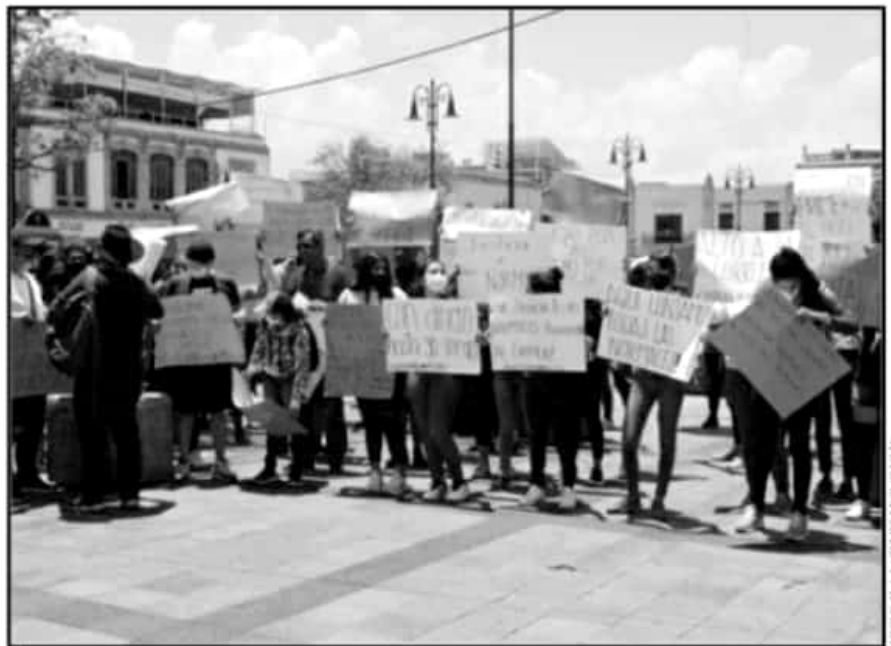
EL COMITÉ ESTUDIANTIL DICE QUE SE DESLINDA DE CUALQUIER ACCIÓN VIOLENTA QUE PUEDAN TOMAR LOS RECHAZADOS.

razón por la cual la ONOEM se ha mantenido al margen.