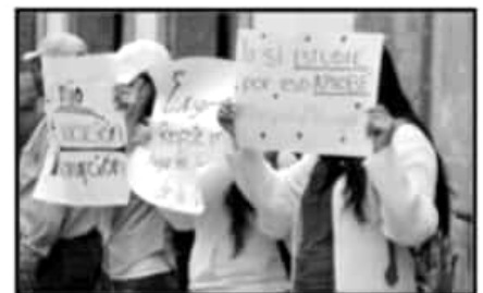
LOS ASPIRANTES APROBADOS POR SU PARTE, INSISTEN QUE LOS RESULTADOS SON FRUTO DE SU ESFUERZO.