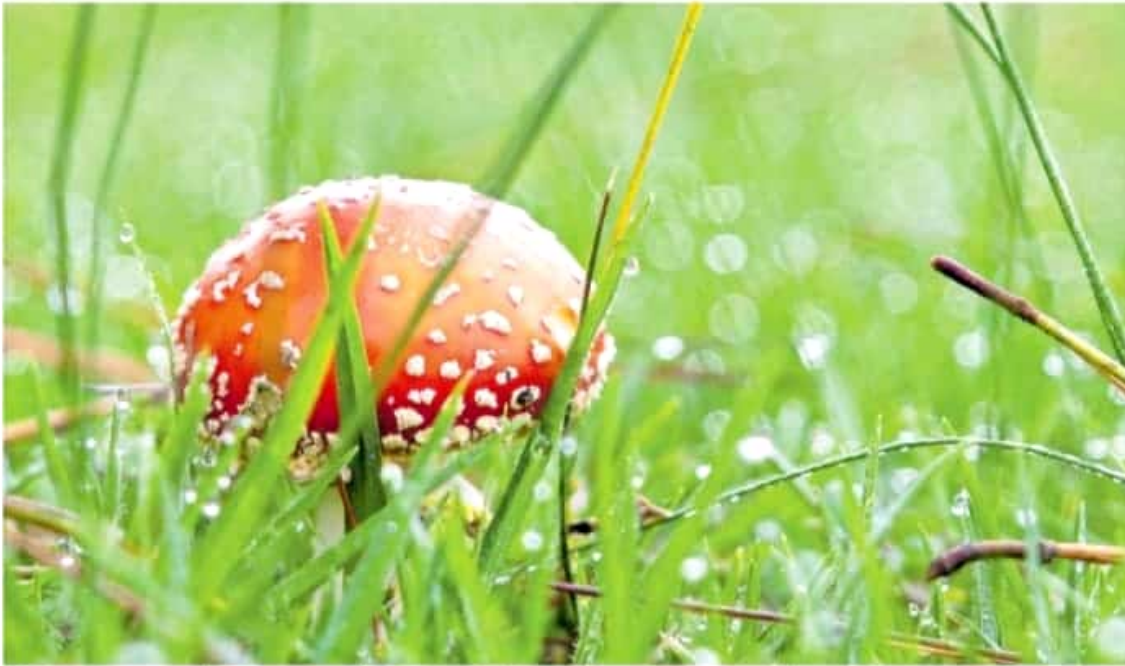
El hongo mata moscas ( Amanita muscaria ) es quizás el alucinógeno más antiguo usado por la humanidad /ADD JIMENEZ