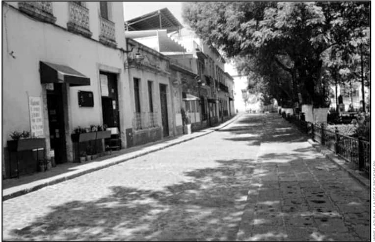
EL CIERRE DE COMERCIOS, BARES Y RESTAURANTES A CAUSA DE LA PANDEMIA DE COVID-19. DEJÓ SIN EMPLEO A MUCHOS JÓVENES EN EL ESTADO.

"Hablar del tema económico es ver que les ha afectado a los jóvenes. Se ha dicho que Michoacán por mes hemos tenido una serie de pérdida de empleos de 1 mil 300 formales y también en el sector informal, que es donde más