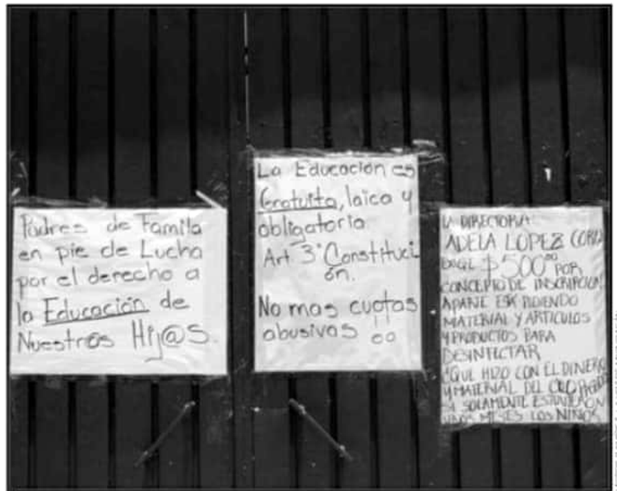
LOS PADRES DE FAMILIAS EXIGEN SE TERMINE CON LOS COBROS ABUSIVOS POR PARTE DE LAS INSTITUCIONES

Las madres de familia indicaron que esperan que a partir de la acción pudiera existir una mediación de la SEE, "nosotros sabemos que no se debe pagar, que es una escuela pública, pero entendemos que debe cooperarse para gastos de la escuela, pero no estamos de acuerdo con