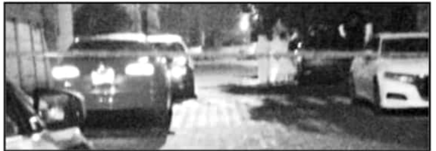
EN EL CASO DE JULIO, LA CEDH REMARCA QUE ENCUENTRA 'GRAVES VIOLACIONES' POR PARTE DE LOS ELEMENTOS.

vinculados al delito de desaparición forzada y homicidio de civiles. En octubre de 2019, la Policía Municipal de Ziracuaretiro fue desarmada y llevada a comparecer a la Fiscalía Regional de Uruapan. Días después trascendió que al menos 7 elementos de dicha demarcación fueron vinculados a proceso por su participación en la desaparición