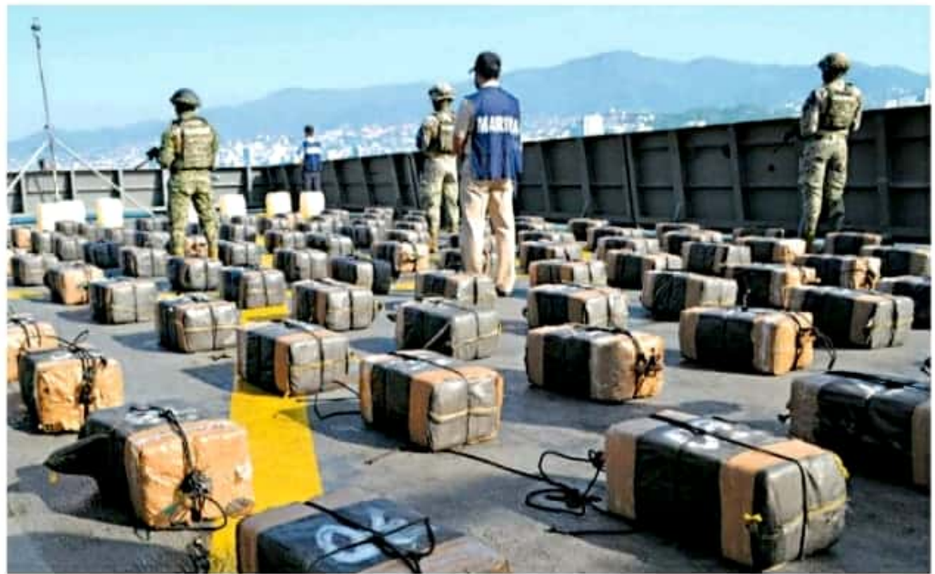
Con la llegada de López Obrador, la orden fue limpiar de corrupción los puertos marítimos. SEMAR MX

Los decomisos de cocaína y precursores químicos en puertos y aduanas en la administración de Andrés Manuel López Obrador duplican a los realizados en todo el sexenio de Peña Nieto