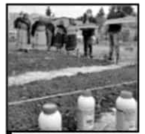
MUJERES DE LA REGIÓN DE SANTA FE BUSCAN ERRADICAR QUÍMICOS