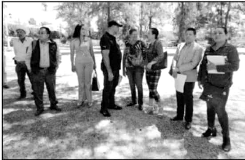
INTEGRANTES DE LA UNIÓN DEMOCRÁTICA CAMPESINA PIDEN ATENDER PROBLEMÁTICA CON ACCIONES DE LA POLICIA.

"Ellos no están autorizados para decomisar las unidades o