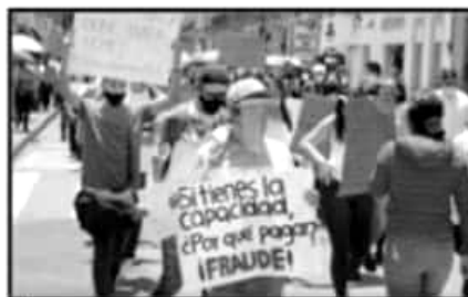
LOS ASPIRANTES RECHAZADOS CONTINÚAN EXIGIENDO QUE SE REPITA EL EXAMEN EN LAS NORMALES.