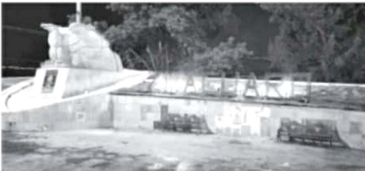
Con apoyo de empresarios de la ciudad, en el monumento a La Bandera fueron colocadas letras con la leyenda: «Heroica Zitácuaro», se podrán iluminar con antorchas.

Cuando sean encendidas tales antorchas, estará personal de la dependencia vigilando que todo transcurra con calma, esto con el fin de prever algún posible incidente.