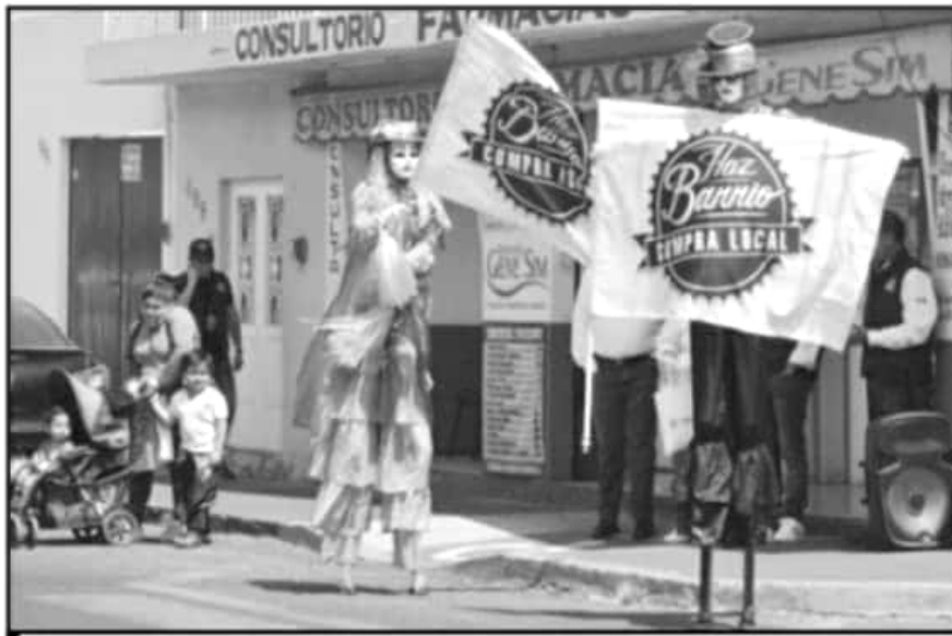
LA IPVIO POSTIVÓ EL IMPULSO AL PROGRAMA “HAZ BARRIO” QUE SIRVIÓ PARA REACTIVAR LA ECONOMÍA LOCAL.

Destacó que esta situación se ha solicitado no sólo a nivel municipal, sino que también estatal e incluso nacional, esto con la intención de que mejore la economía de las constructoras locales al poder competir por la participa-