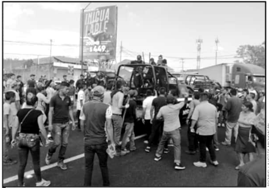
A CAUSA DE LOS DISPAROS EMITIDOS POR ELEMENTOS DE LA POLICÍA, VARIOS CIVILES RESULTARON CON LESIONES.

forma ha acudido a los llamados de la Fiscalía Regional para dar celeridad en la integración de la presunta carpeta de investigación, sin embargo, a casi 100 días de los sucesos no existen indicios sobre avances sustanciales de las investigaciones para deslindar responsabilidades, en aras de que se atienda su derecho de una justicia pronta y expedita.