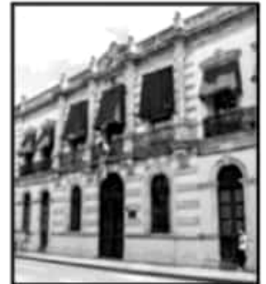
DEBIDO A LOS RIESGOS SANITARIOS POR COVID-19 EN EL ESTADO.

"Como nuestra tuvo la oportunidad de conocer muy de cerca las necesidades de nuestros niños, padres de familia y profesores, por eso, de manera constante he tratado de apoyar a este sector, el cual es clave para el crecimiento de nuestra sociedad", finalizó la legisladora.