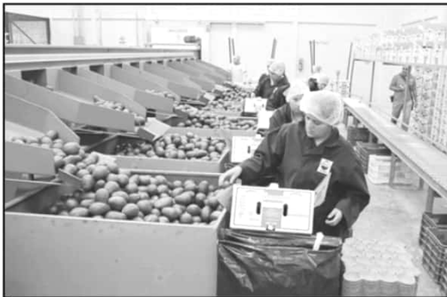
EN LO QUE VA DEL AÑO, TANCITARO HA PRODUCIDO 128 MIL TONELADAS DE AGUACATE Y ES LIDER A NIVEL MUNDIAL.

80% AGUACATE michoacano tiene como destino Estados