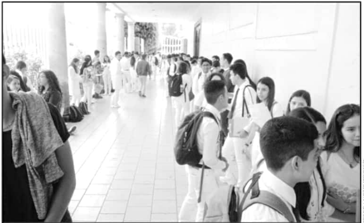
MEDICINA, ENTRE LAS CARRERAS QUE TIENEN MÁS DEMANDA POR ASPIRANTES A ESTUDIAR EN LA UNIVERSIDAD MICHOACANA DE SAN NICOLAS DE HIDALGO.

La universidad tendrá todos los protocolos de sanidad establecidos por autoridades; les pedimos a los aspirantes que los cumplan