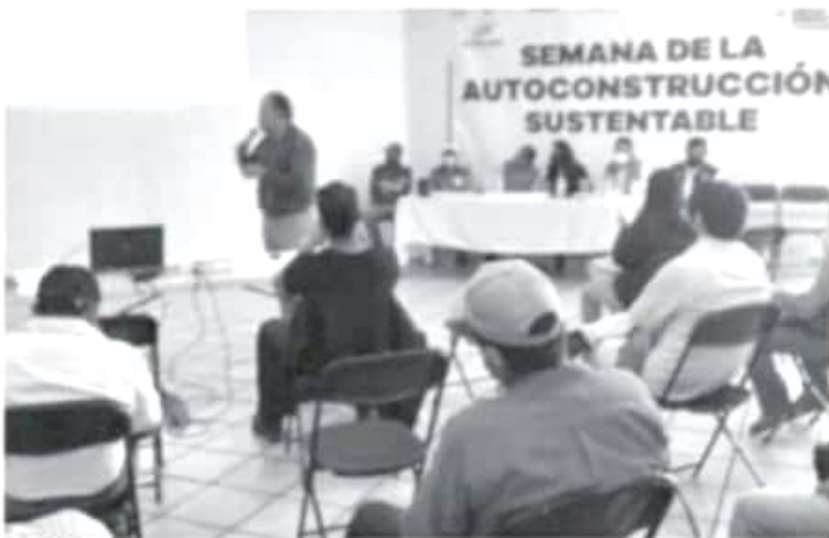
Los talleres van dirigidos para los habitantes de las comunidades, ya que en estos lugares cuentan con el material para las prácticas y no tendrían que comprar nada.

- Se requerirá tierra, agua, paja, carrizo, desperdicios de madera entre otros elementos de fácil acceso.