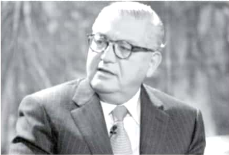
HR Ratings modificó de Estable a Positiva la perspectiva crediticia de Michoacán y ratificó la calificación local de largo plazo en HR BBB, gracias al trabajo de la Secretaría de Finanzas y Administración.

-El resultado es producto de un adecuado comportamiento fiscal, expuso HR Ratings