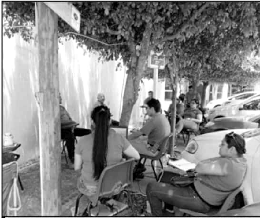
AUTORIDADES DE SALUD RECOMIENDAN A EMPLEADOS TOMAR LAS PRECAUCIONES PARA EVITAR CONTAGIOS

“Tenemos el reporte de 15 compañeros con 10 activos y los otros sospechosos. Desde que empezó la pandemia tenemos 6 decesos. Se mantuvo por acuerdo con el gobierno del estado la participación de 25 por ciento en todas las oficinas por el aforo que tenemos. Donde el espacio permite que haya más del 25 por ciento se comenta con la parte sindical y se revela qué porcentaje puede estar. O bien que haya un trabajo urgente que tenga que requerir de la presencia de más perso-