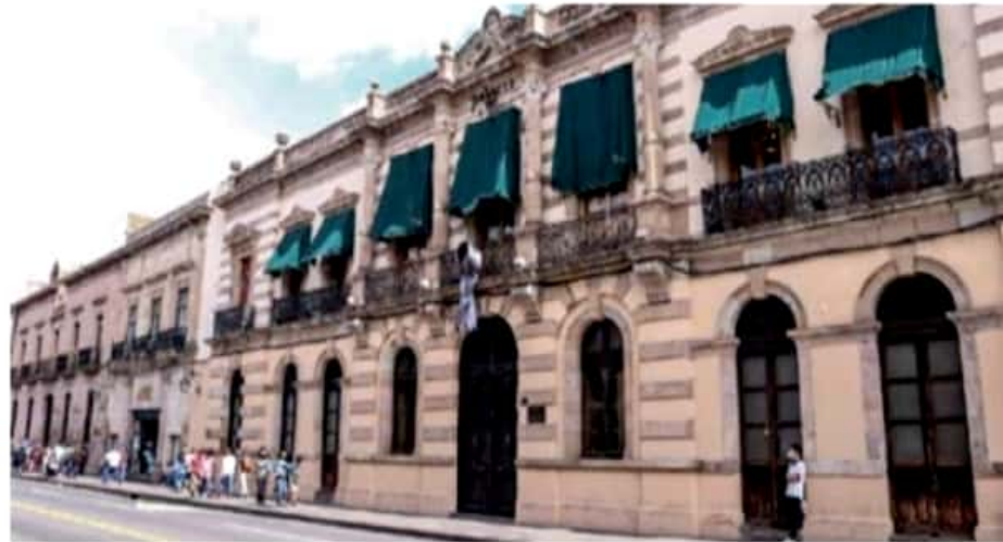
"Hasta nuevo aviso" actividades no esenciales en el Congreso del estado.

estará limitando el ingreso al edificio a aquellas personas que no justifiquen su presencia para asistencia o trámite en dichas áreas esenciales.