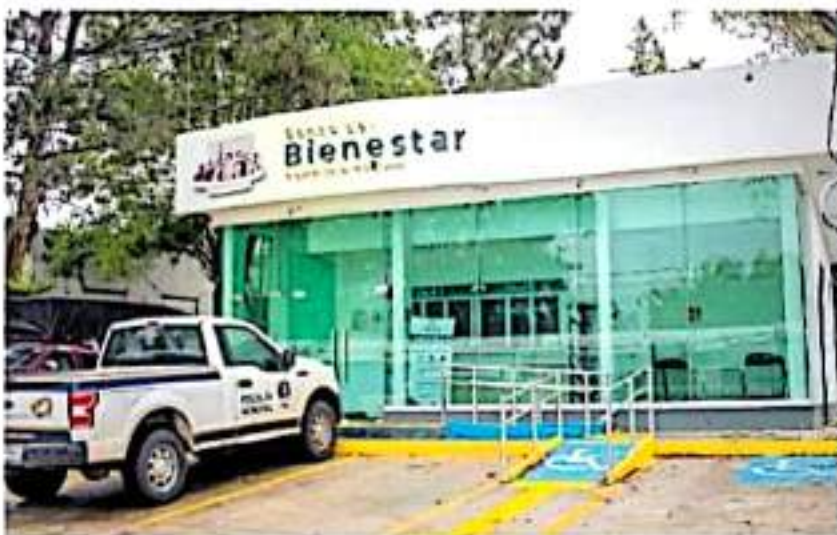
Sucursal del Banco de Bienestar fuera de operaciones en la colonia Los Vergeles, zona sur de la ciudad