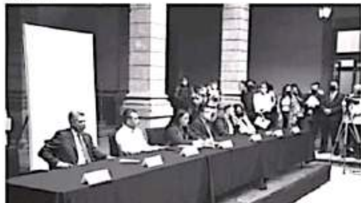
Adriana Hernández Iñiguez, presidenta de la Mesa Directiva del Congreso del Estado, declaró formal y legalmente instaladas las comisiones de dictamen y comités legislativos.

Con su instalación, el Congreso local da apertura a los trabajos de 28 comisiones de dictamen, 2 comisiones especiales y 5 comités de vigilancia que operarán durante la LXXV Legislatura.