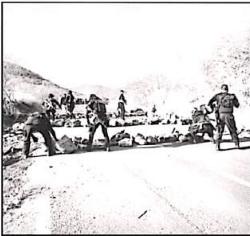
DAÑAR LAS CARRETERAS ES EL MODO QUE UTILIZA LA DELINCUENCIA PARA EVITAR QUE LLEGUE AYUDA A CIUDADANOS

llevar hasta el pleno y al gobierno del estado. De poco sirve el marco jurídico y la ley si no van acompañados del tema presupuestal y financiero con el que se debe de aplicar", señaló la legisladora.