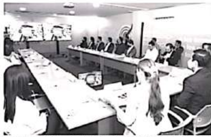
En breve comenzará a operar la planta laminadora de Arcelor Mittal, empresa que proyecta nuevas inversiones en la zona costera; también anunció que se tiene comprometido otro proyecto para una granja solar.

Los inversionistas recorrieron Espacio Emprendedor, donde conocieron las diferentes áreas de apoyo a emprendedores y empresarios.