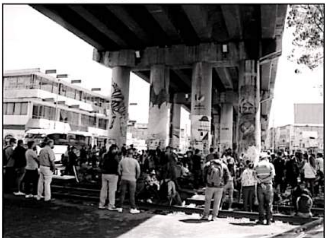
LOS DOCENTES MICHOACANOS SE HAN RETIRADO DE LAS VÍAS DEL TREN, PERO ESPERAN QUE EL GOBIERNO FEDERAL LES PAGUE PARA REGRESAR A LAS AULAS

López Obrador convino con un llamado respetuoso a los maestros de Michoacán de que se acepte que se les entregue una tarjeta o monedero electrónico.