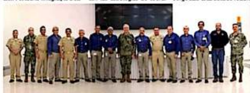
Autoridades de la SEMAR realizaron ayer una visita a las instalaciones portuarias de LC.

El Inspector y Contralor General de la Secretaría de Marina, destacó que se trabajará con eficacia, honestidad y compromiso reanudando la eficiencia de los puertos. Tras dar a conocer la visión estratégica y las acciones específicas de la Secretaría de Marina, se resolvieron dudas e inquietudes del personal, dejando un claro mensaje de apertura y confianza respetando las condiciones y derechos laborales de cada trabajador.