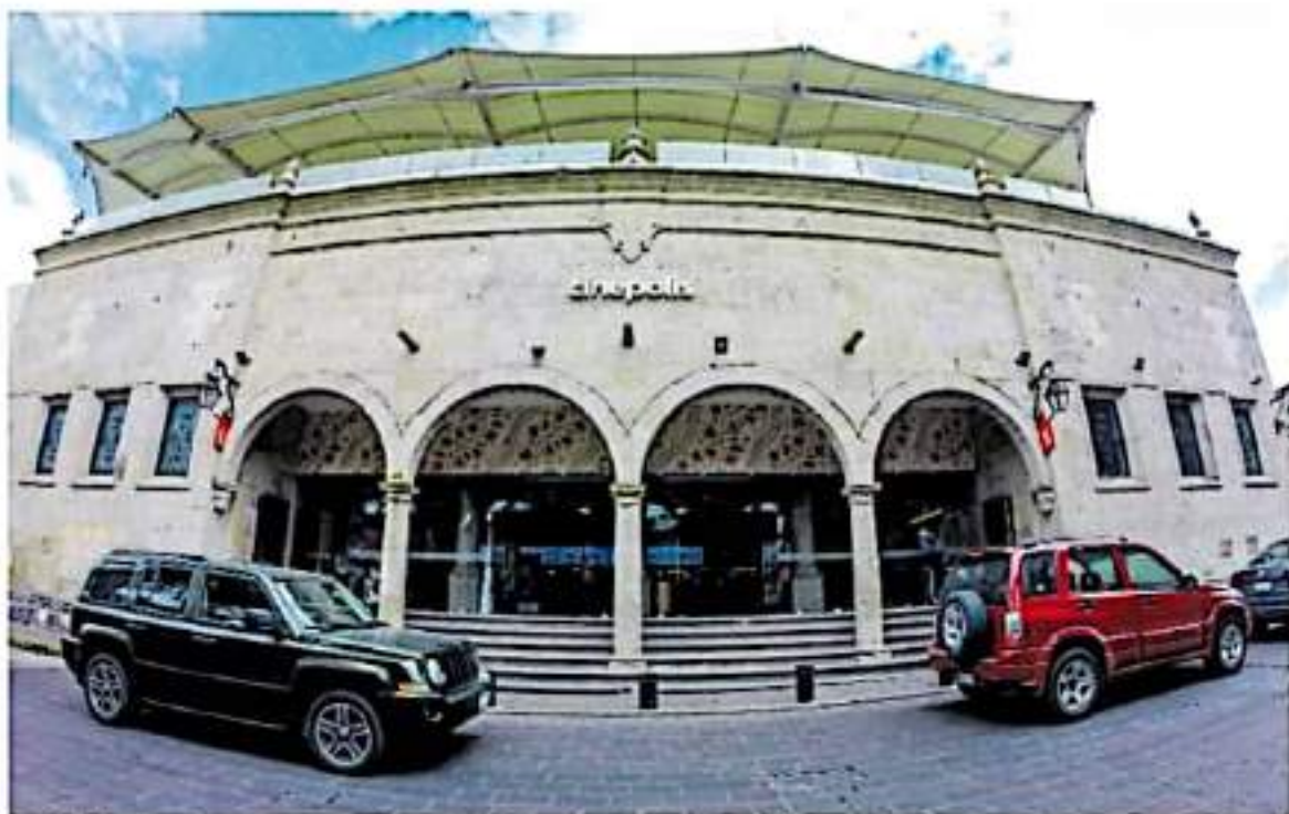
Fachada de Cinépolis Morelia Centro, sede del Festival Internacional de Cine de Morelia. AGO/IMEL/2

LEOS CARAX Y NATALIA LAFOURCADE, ENTRE LOS INVITADOS