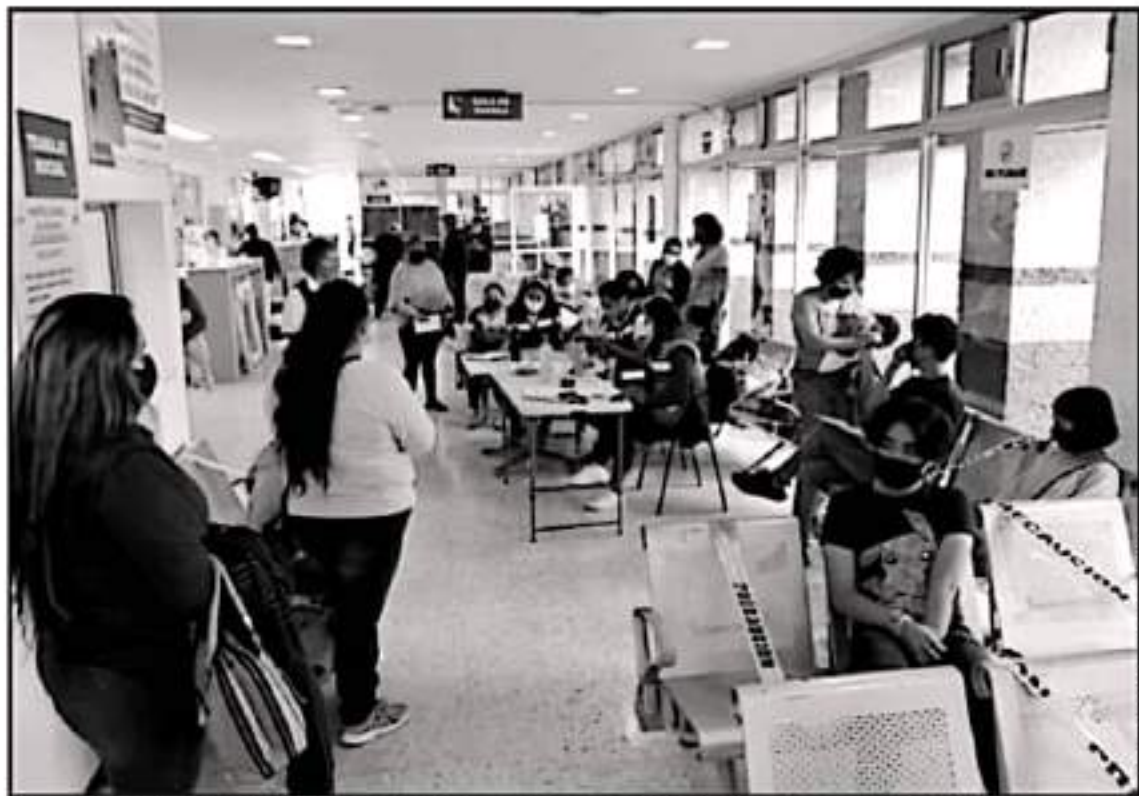
LOS MENORES QUE CUENTAN CON ENFERMEDAD CRÓNICA Y QUE NO FUERON VACUNADOS, DEBERÁN ACUDIR EL LUNES. SE APLICARÁN 728 DOSIS PENDIENTES.

Esta extensión de vacunación emergente hasta el próximo lunes, también se debió a que al cerrarse ayer por la tarde dichos módulos de vacunación, se quedaron sin ser atendidos