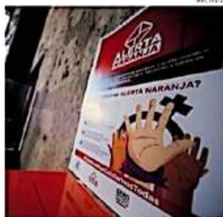
El programa Botón Naranja se creó en 2020 con la intención de brindar auxilio a las mujeres en riesgo.

"No solo es la obra pública también es un tema de organización interna y la