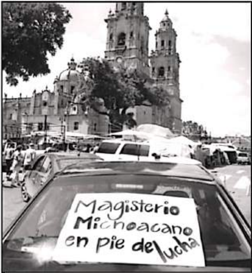
CON MARCHAS Y PLANTONES, PROFESORES ESTATALES INDICAN LES URGEN QUINCENAS PENDIENTES DE PAGO

sin cobrar en organismos descentralizados