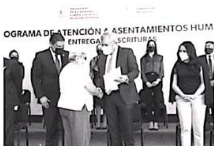
El gobernador Ramírez Bedolla apoyará en los procesos de tramitación de escrituras para dar certeza patrimonial a personas de bajos recursos económicos.