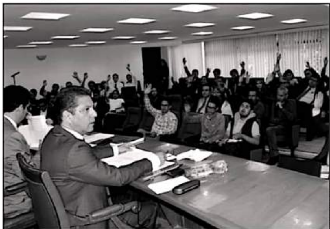
DURANTE LA SESIÓN PRESENCIAL DE ESTE VIERNES, TAMBIÉN EL CONSEJO UNIVERSITARIO NOMBRÓ A DOS DIRECTORES PARA LOS PRÓXIMOS CUATRO AÑOS.

Los integrantes del Máximo Órgano Colegiado de Gobierno de la Universidad Michoacana de San Nicolás de Hidalgo, aprobaron continuar con los Procesos de Escalificación para el Cumplimiento de la Normativa Universitaria, lo anterior, con el objetivo de seguir manteniendo a esta Casa de Estudios con los estándares más altos en materia de Transparencia y Rendición de Cuentas.