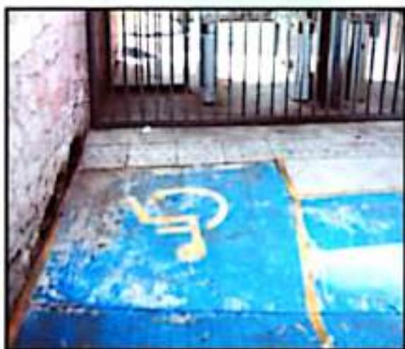
LA FALTA DE RAMPIAS DE ACCESO A LOS PLANTELES EDUCATIVOS, UNO DE LOS PRINCIPALES OBSTÁCULOS QUE ENFRENTA EL SECTOR ESTUDIANTE.

La estudiante señaló que no tiene interés en otra carrera y que espera que con la visibilización de su caso tomen en cuenta a los jóvenes que estructuralmente enfrentan la discriminación e infravaloración de las personas que creen que no deben estar en las instituciones educativas.