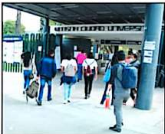
EL DERECHO A CONTAR CON UNA EDUCACIÓN DE CALIDAD AUN CUENTA CON VARIOS OBSTÁCULOS PARA LOS ALUMNOS CON ALGUNA DISCAPACIDAD.