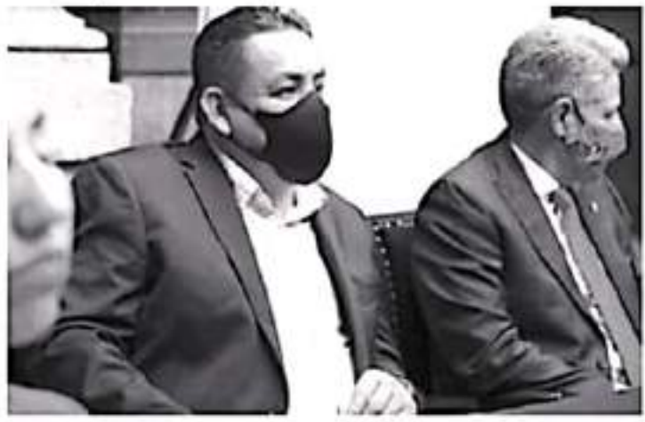
El legislador recordó que el costo del barril de petróleo alcanza actualmente un valor internacional de casi 80 dólares, sin embargo, en se determinó para la Ley de Ingresos estimarlo en 55.1 dólares.

Aparto que serán los estados de la República y los municipios quienes una vez más paguen las consecuencias de este tipo de estrategias, pues al no estimarse debidamente el total de ingresos federales, los montos etiquetados para entidades federativas y municipios es menor al que realmente les corresponde.