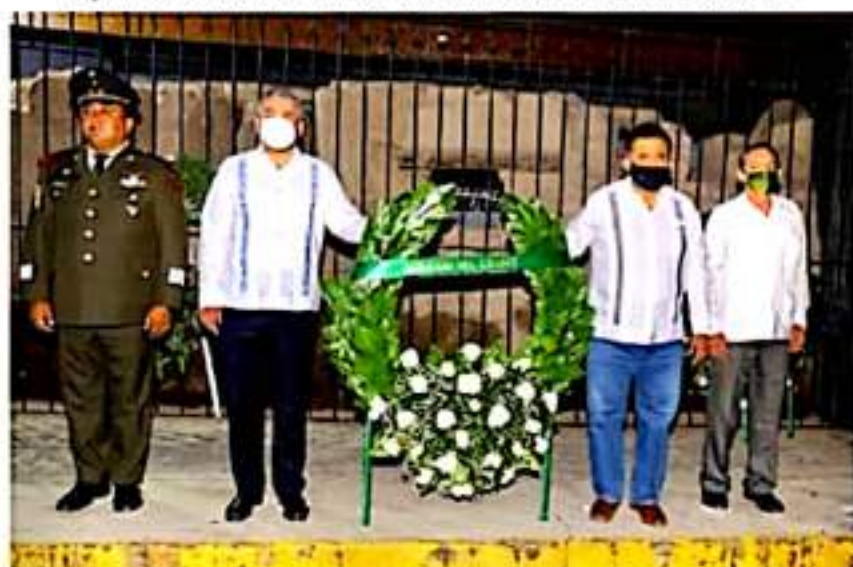
El día de ayer, el gobernador ARB estuvo en Apatzingán para la conmemoración de un aniversario más de la promulgación de la Constitución de 1814.