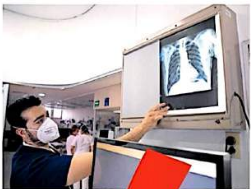
El estado ocupa la posición número 13 en defunciones en este rubro.

pese a que un número importante de la población está vacunada.