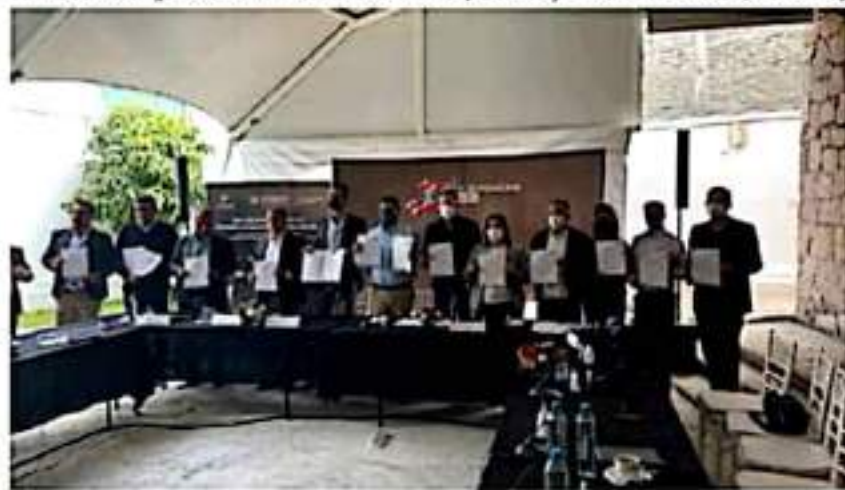
Integrantes del sector productivo de Michoacán, se reunieron ayer con legisladores federales, con quienes signaron una agenda legislativa de colaboración.

"El día de hoy (ayer) me incorporo como integrante de la Coordinadora Estatal de Movimiento Ciudadano, desde ese espacio buscaré contribuir a consolidar una verdadera alternativa política desde la izquierda para el 2024. Vamos por la Dignificación del oficio político y la vida pública de nuestro bello Michoacán", concluye.