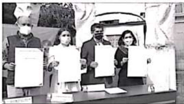
Para el registro y presentación de propuestas se debe ingresar a la página www.zitacuaro.gob.mx con fecha límite hasta el 29 de octubre.

-Con el presupuesto participativo, anunciado por el ayuntamiento