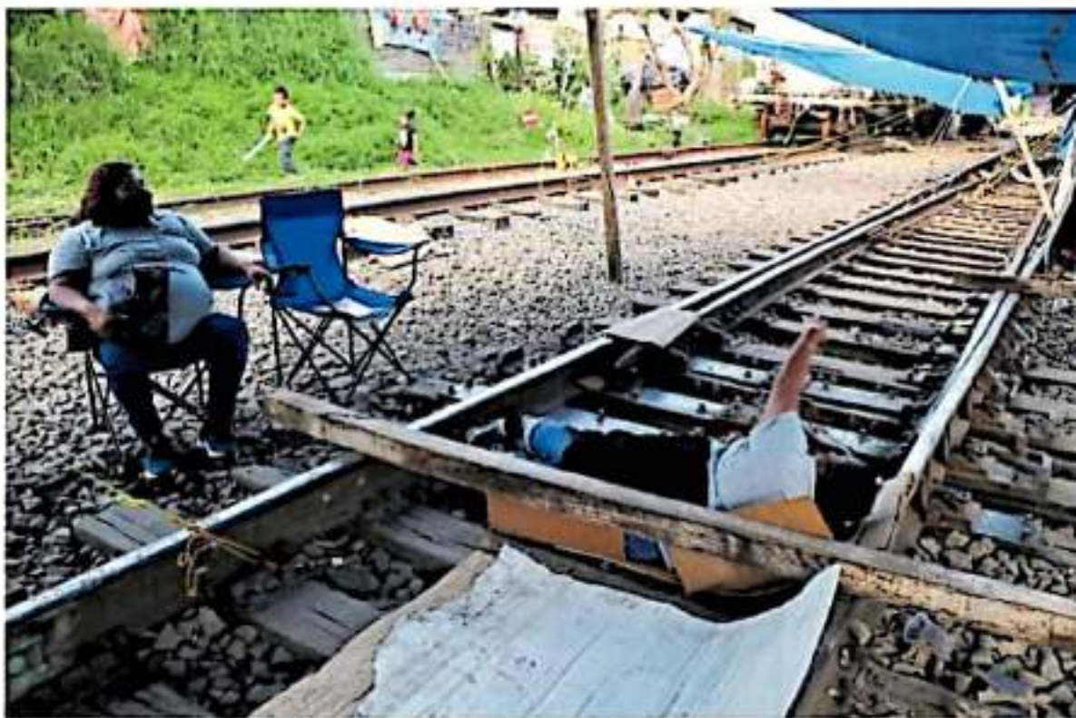
Mantienen el bloqueo desde hace tres meses