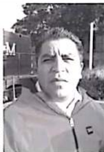
En la primera parte el grupo parlamentario de Morena y PT votaron en contra por el 6%, pero en la ley de ingresos vota a favor de ese mismo 6%, mismo que se aplicará a los ciudadanos.

"Yo creo que con el 6 por ciento es más o menos diez pesos de aumento, esto permitirá que el SAPA deje de colapsar económicamente".