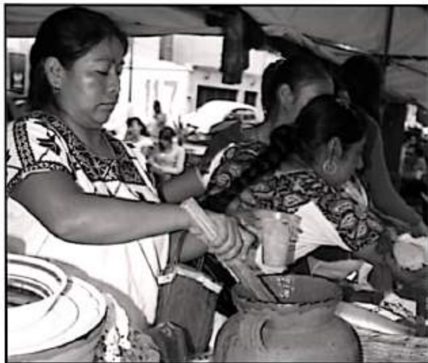
EN AÑOS PASADOS SE HA PRESENTADO ATOLE DE ZAZZAMORA, PINOLE, TRIGO, MAÍZ COLORADO Y BLANCO.