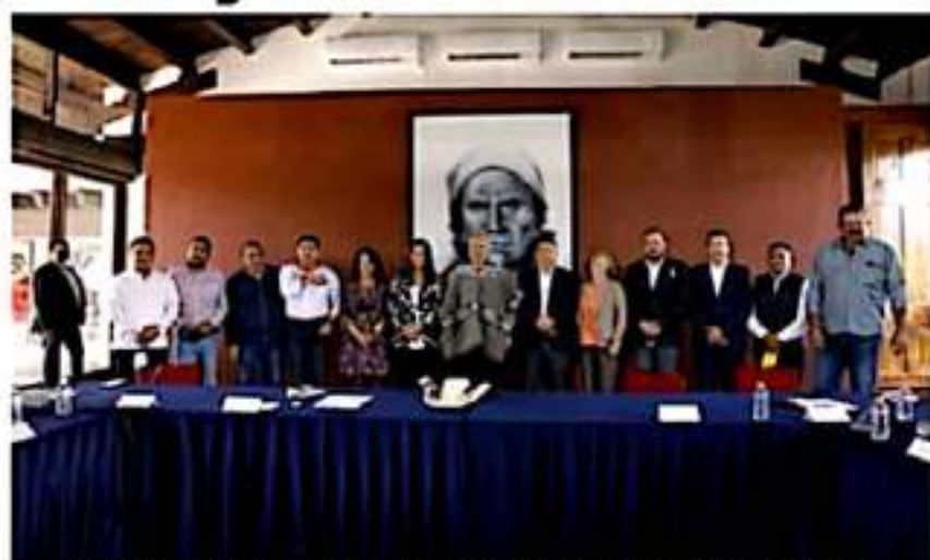
El gobernador Alfredo Ramírez Bedolla, se reunió con alcaldes michoacanos amados del PRD.