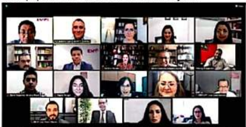
El IEM llevó a cabo la conferencia virtual "Las Amenazas de la Democracia desde la Democracia".

(IEM), personal del Instituto Nacional Electoral (INE) en Michoacán, de la Fiscalía Especializada para la Atención de Delitos Electorales, así como otras instituciones y público en general.