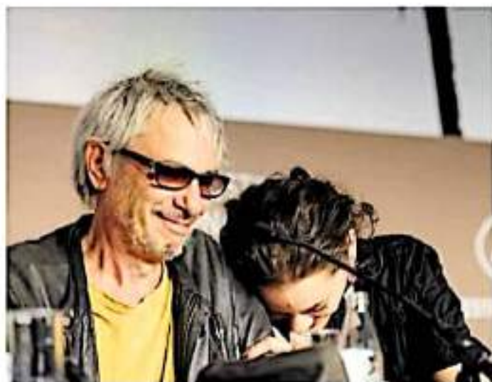
Carax es uno de los cineastas más famosos del mundo.

La venta de boletos comenzó desde el pasado 21 de octubre, no sin algunas fallas técnicas que provocaron reclamos de los