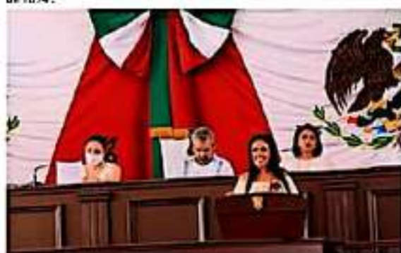
La importancia de contar con una Constitución es la certeza de los derechos.