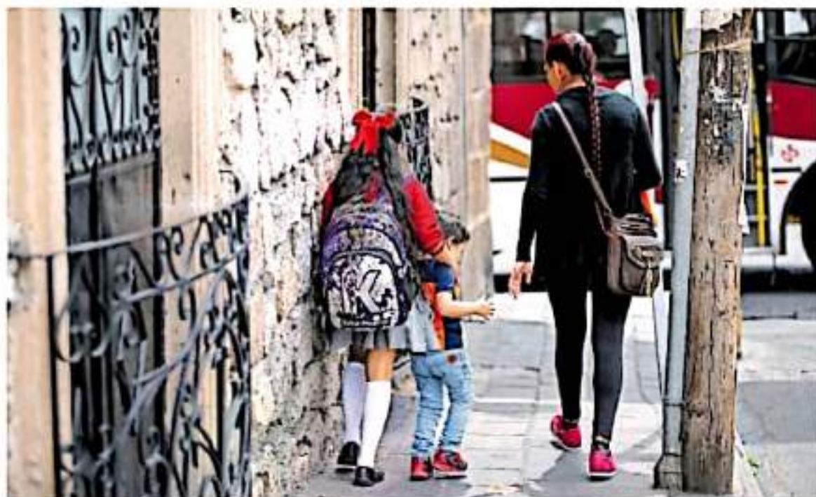
El acompañamiento a las víctimas y las medidas cautelares no existen a pesar del aumento en casos. (FOTOGRAFÍA)