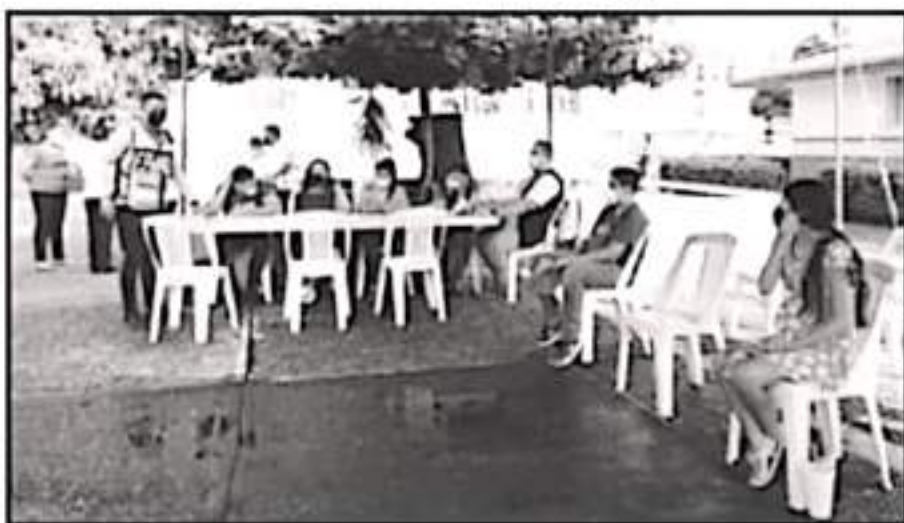
DOS CENTROS DE VACUNACIÓN DIERON LUGAR EL LUNES PARA APLICACIÓN DE DOSIS A MENORES VULNERABLES