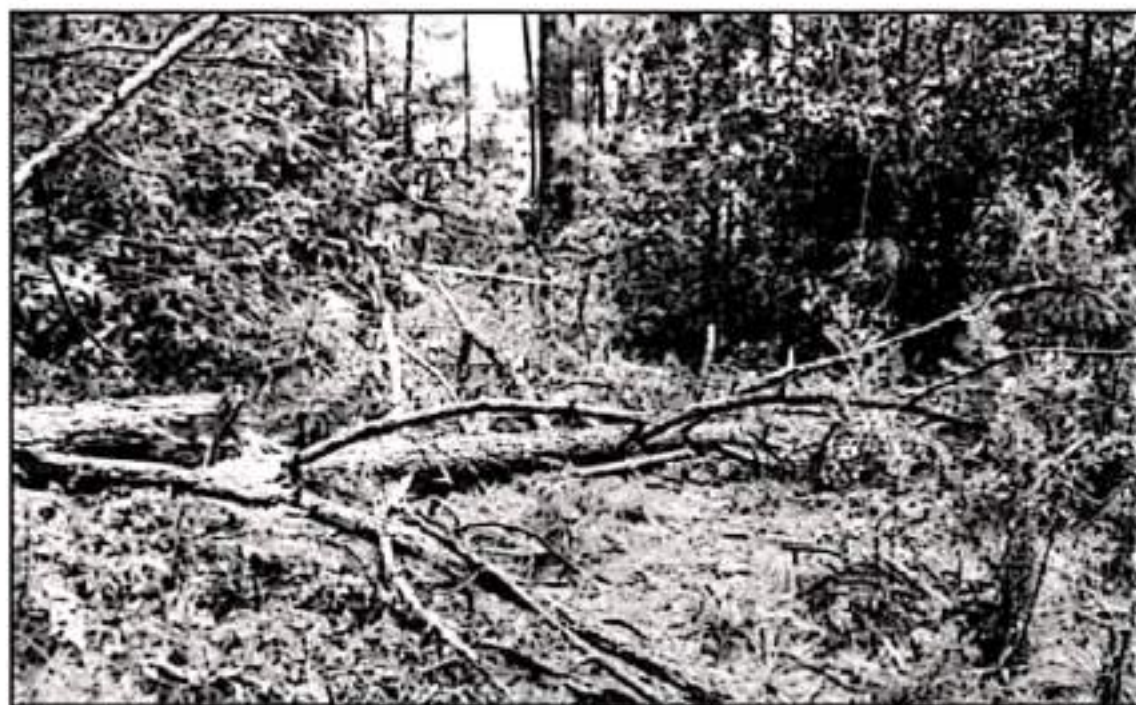
EL CAMBIO DE USO DE SUELO ENTRE LOS PRINCIPALES PROBLEMAS QUE ENFRENTAN COMUNEROS DE LA ZONA SAN PEDRO PIEDRAS GORDAS, EN VILLA MADERO

Señalan que también aplicarán a la comunidad de San Pedro Piedras Gordas los acuerdos y las leyes ambientales como medio para garantizar la preservación de los bosques y las aguas que hacen posible la vida de la comunidad y las poblaciones es-