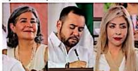
Las y los legisladoras petistas asistieron a la sesión solemne que se llevó a cabo en Apatzingán en donde se hizo entrega de la presea "Constitución de 1814".

"La legalidad es un valor superior, más allá de ideologías o posturas políticas. Sin un profundo respeto a la ley en todas sus formas y acepciones, ninguna sociedad puede avanzar, porque ninguno de sus miembros tiene certidumbre respecto a lo que los otros, incluyendo el gobierno, van a hacer", recaló.