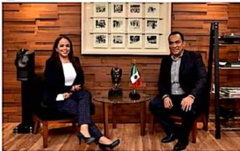
En reunión de trabajo, ambos funcionarios compartieron su interés de contribuir al fortalecimiento de esta institución y así, garantizar la justicia para de los michoacanos.