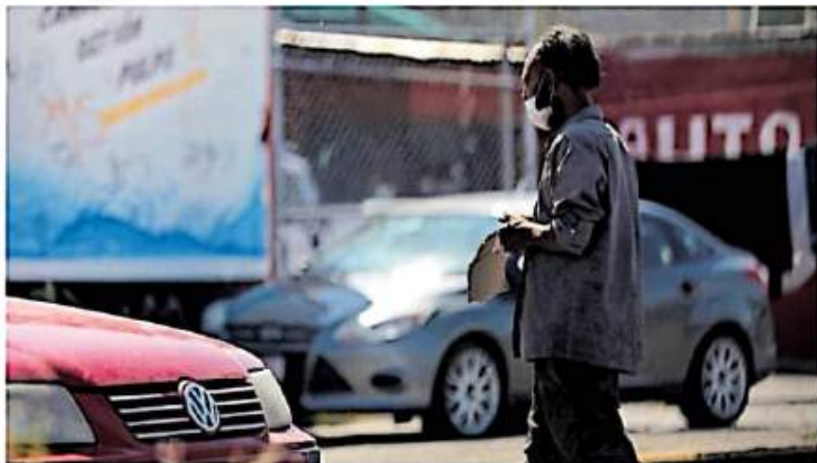
En Morelia no existe un refugio para los migrantes / IVÁN ARRAS