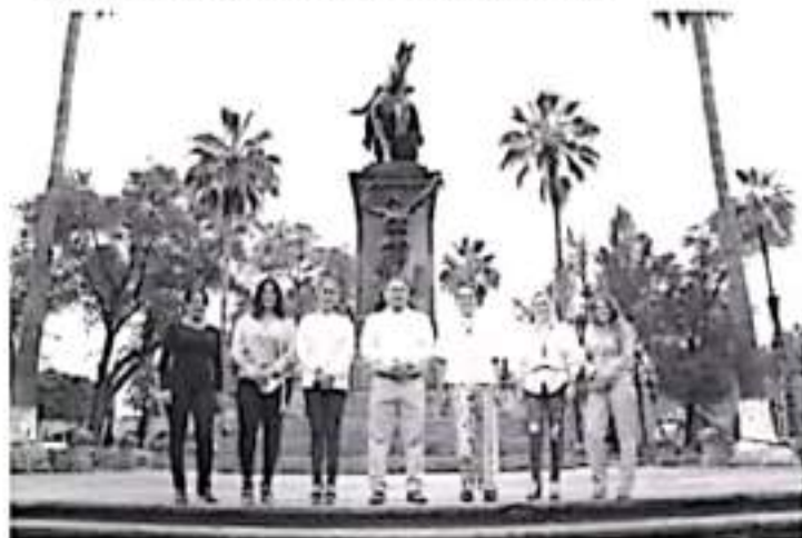
Como diputados estarán atentos a los trabajos de investigación que realicen las autoridades, y reiteraron su llamado a los gobiernos Estatal y Federal para que generen condiciones de seguridad.

-Condenan ataque al domicilio del alcalde de Tuxpan