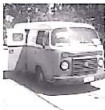
COCOTRA pide a usuarios de colectivos a denunciar a conductores que no cumplan con el uso de cubrebocas y todas las medidas sanitarias.