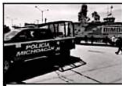
LA POLICIA NO INTERVIENE PARA EVITAR VIOLENCIA