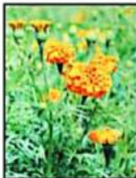
LA FLOR DE CEMPASÚCHIL.