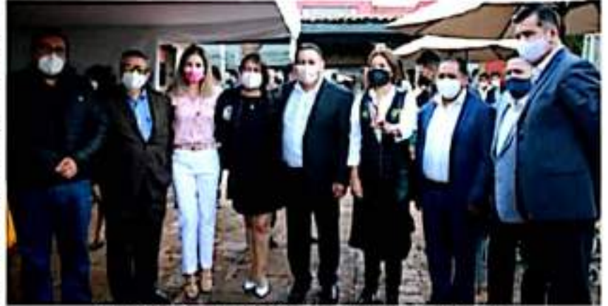
Congresistas Michoacanos del PRD preparados para hacer sus aportaciones.