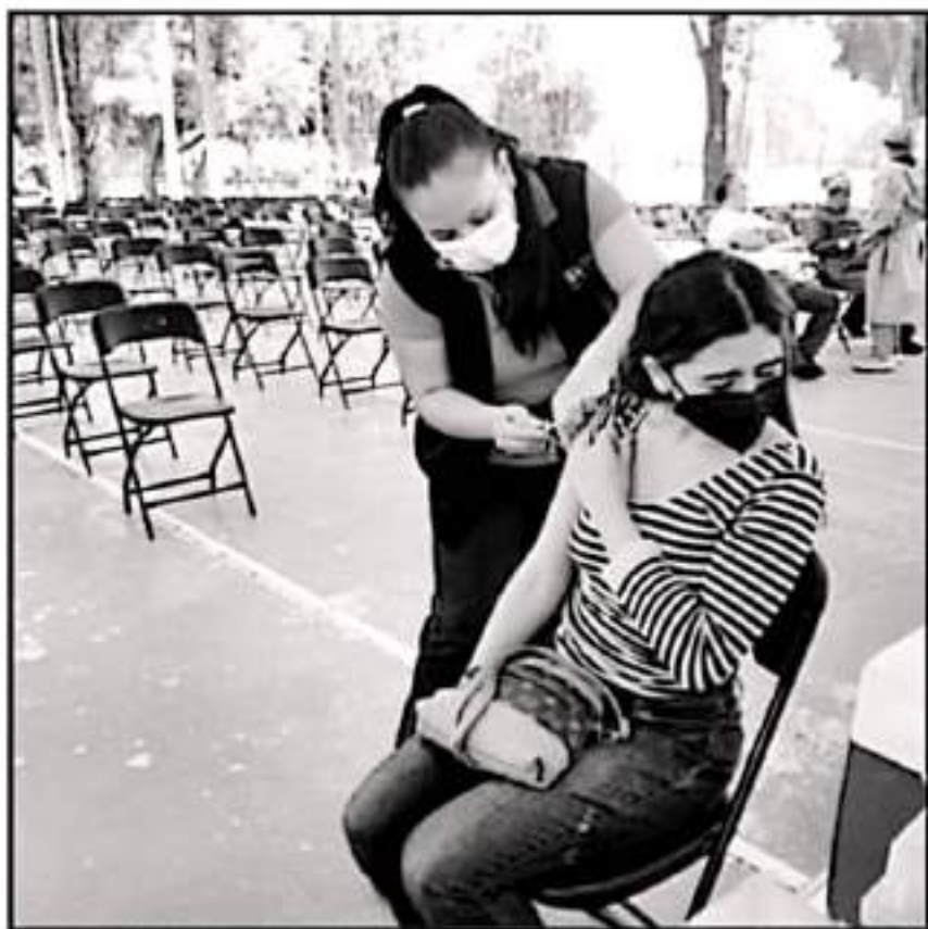
CIENTOS DE JÓVENES DE URUAPAN SE QUEDARON SIN LA APLICACIÓN DE LA SEGUNDA DOSIS QUE FUE CANCELADA.

Cabe mencionar que a principios del mes pasado se inició con la aplicación de primeras dosis al grupo etario de 18-29 años en seis barzadas y al nuevo 3 mil rezagados, principalmente de 30 a 39 años de edad, para ello se pusieron en operación tres módulos, sin