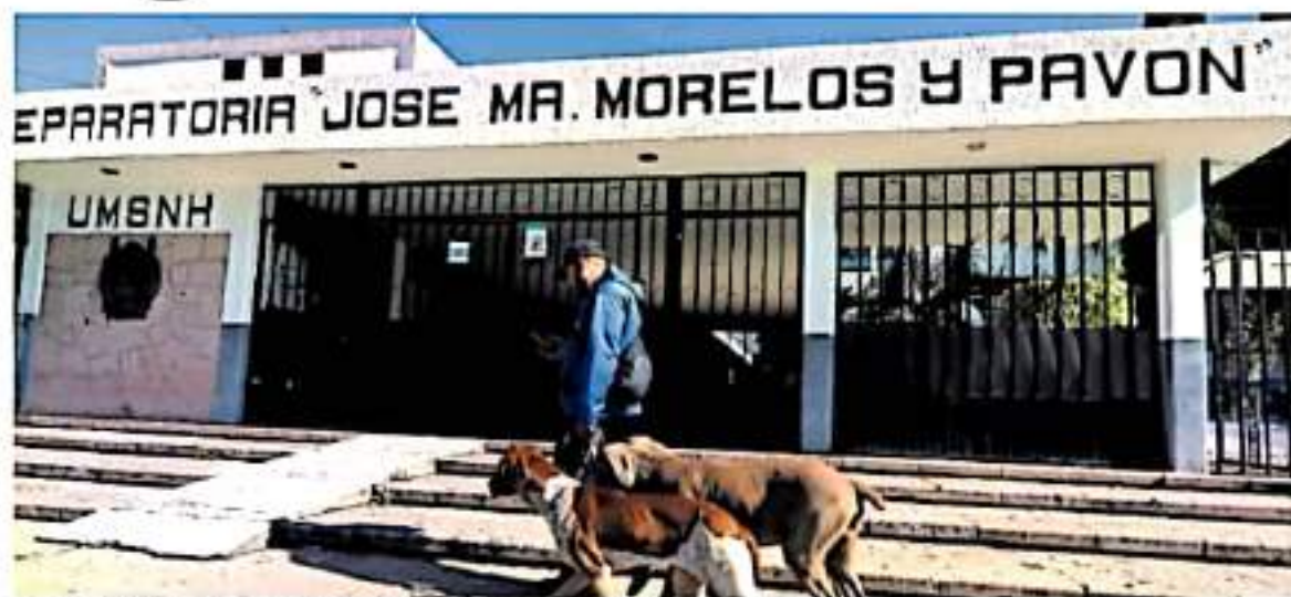
se contempla la instalación de filtros con apoyo de maestros y padres.