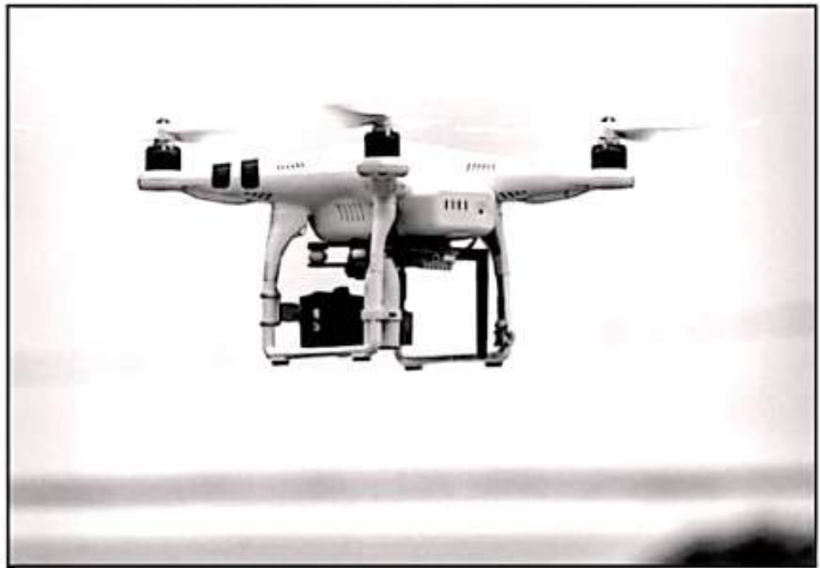
ALERTA Y TEMOR CAUSAN LOS EPISODIOS DE UNOS DE LOS TALLERES POPULARES DE VARIAS COLONIAS SOBREVOLANDO INCLUSO POR ARRIBA DE VIVIENDAS

"La primera vez que vi a uno fue como a un kilómetro de mi azotea, eran 11:00 de la noche y lo primero que pensé es que era un avión, pero no se movía y estaba muy alto, tenía luces prendidas con alcance de varios metros. Después de un largo rato voló muy rápido hacia otro lado y de un momento a otro apagó las luces, luego se volteó a prender y regresó al lugar