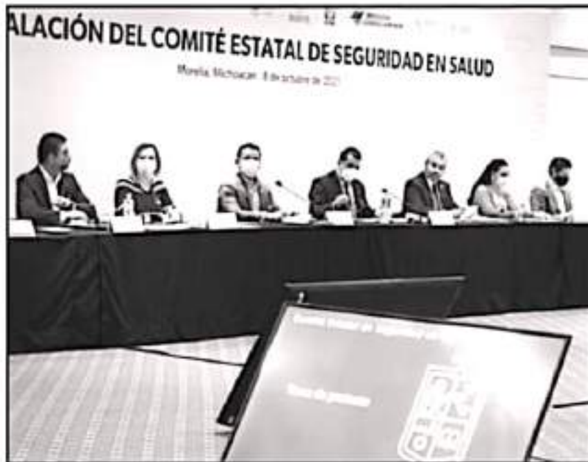
EL COMITÉ ESTATAL DE SEGURIDAD EN SALUD ACORDÓ REGRESAR A CLASES PRESENCIALES, ENTREN LOS AULES.

de Educación y las instituciones educativas públicas, privadas, clubes de familia y la Secretaría de Salud y las demás autoridades sanitarias serán responsables en la aplicación del citado acuerdo y de la guía para el regreso ordenado a las escuelas", señaló el mandatario.