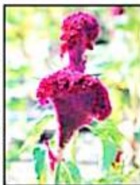
LA FLOR 'MAMI DE LEÓN'.