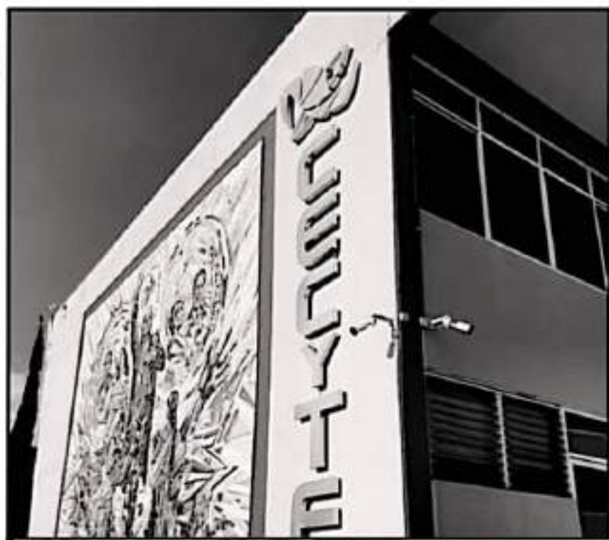
AUTORIDADES MANIFESTARON QUE CON LA RECONVERSIÓN DEL PLANTEL SE MEJORARÁ LA EDUCACIÓN DE CALIDAD

Este año el subsistema cumplió su 30 aniversario del subsistema educativo, se fundó el 3 de julio de 1991, poniéndose en marcha el primer plantel escolarizado en el es-