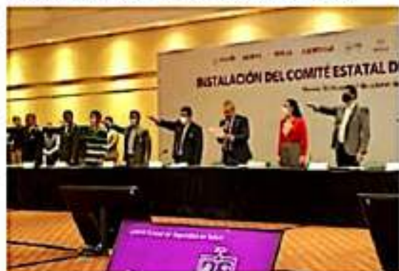
En Michoacán, el 11 de octubre vuelven a las aulas en el nivel medio superior y superior; y el 18 de octubre para nivel básico, según el decreto firmado ayer por el gobernador Alfredo Ramírez Bedolla.

Finalmente, indicó que en la próxima discusión del presupuesto estatal para el ejercicio 2022, impulsará la asignación de recursos suficientes para la Fiscalía General del Estado, a fin de promover un presupuesto progresivo y superior que le permita estar a la altura de las necesidades de seguridad y justicia que demandan los michoacanos.