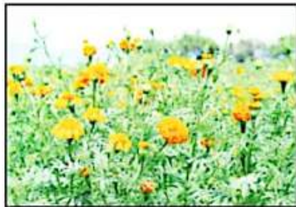
BAJA PRODUCCIÓN DE FLOR PARA LOS EVENTOS DE NOCHE DE MUERTOS.

saría a que la flor as distintas variedades de flores, requieren de al menos cinco meses de trabajo para poder estar listas para la noche de gala, en la cual serán utilizadas como elemento central, colorido y espiritual de miles de tumbas de todo el estado.