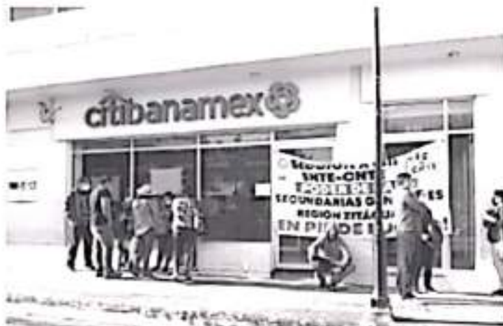
A cada uno de los 30 mil maestros estatales, se les adeudan en promedio 25 mil pesos, que incluye tanto las 4 quincenas, así como varios bonos.

- Maestros estatales no han recibido su pago de 4 quincenas