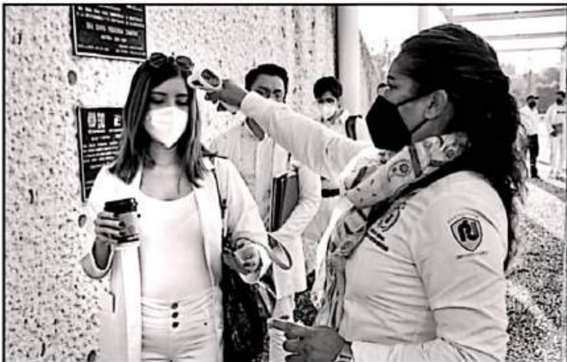
EN CONCORDANCIA CON LAS POLÍTICAS SANITARIAS Y EDUCATIVAS, EL COMITÉ SE VA DANDO EL REGRESO A LAS CLASES PRESENCIALES EN LA UMSNH

"Se reiteró la necesidad de la UMSNH de acceder a recursos económicos extraordinarios que permitan cumplir sus acciones"