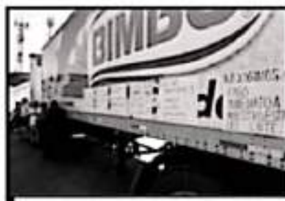
LOS MANIFESTANTES USAN TRÁILER PARA BLOQUEAR

"Nos está lloviendo sobre mojada sobre todo en aquellas familias donde el único ingreso es por parte del padre de familia que es profesor o la maestra que es jefe de familia y es peor aun cuando no se tiene la capacidad de desempeñar otro trabajo, por el momento, en la mayoría de quienes no han recibido su salario, somos apoyados por otros familiares, pero esto no puede prolongarse por más tiempo",