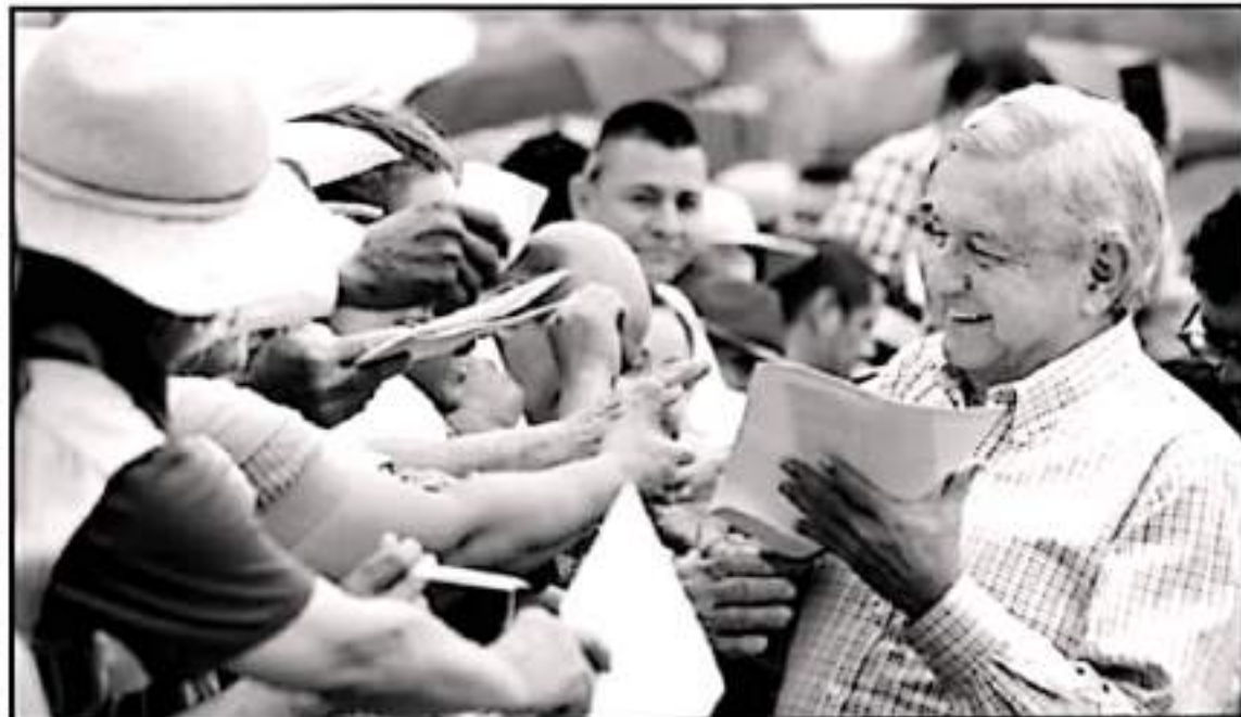
A SABIDAS DE QUI PARTE DE LA POBLACION SE ACHICARA PARA INTENTAR SALIDAR AL MANANTIAL FEDERAL, YA SE INSTALARON MALLAS DE CONTENCIÓN.

Hasta el cierre de esta edición no se ha planteado el encuentro del presidente con profesores, grupos magisteriales, sindicatos o incluso con la ciudadanía, tal como se ha dado en otras visitas presidenciales al estado de Michoacán.