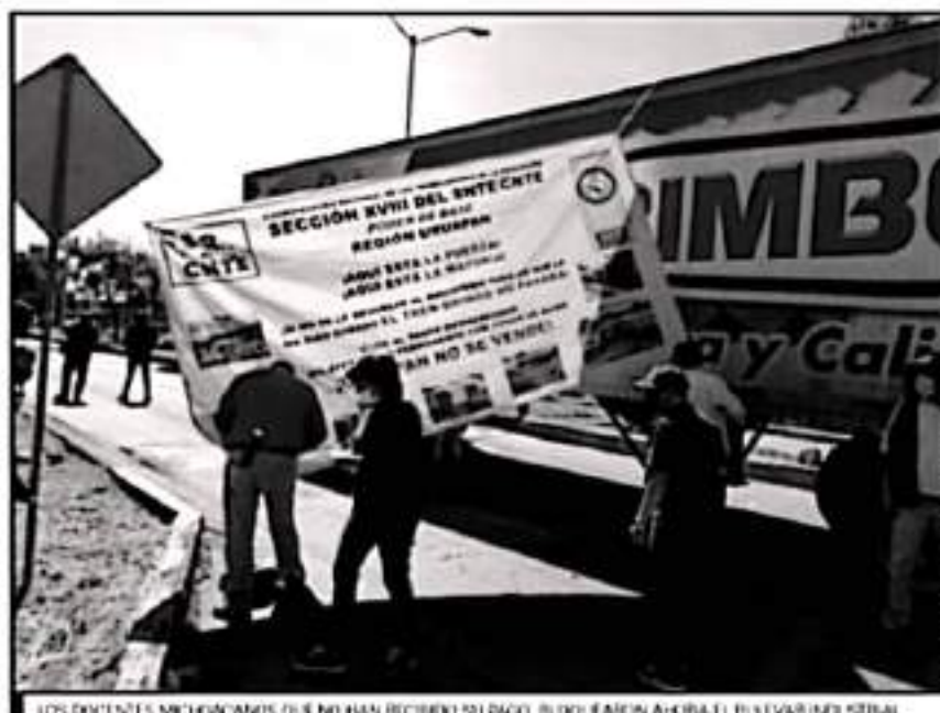
LOS DOCENTES MICHOACANES QUE NO HAN RECIBIDO SU PAGO, BLOQUEARON AHORA EL BULEVAR INDUSTRIAL.

señaló una maestra que también participaba en el bloqueo a la altura de la entrada a la comunidad indígena de Calzoncillo.