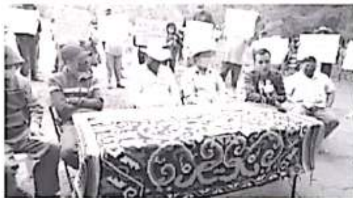
Prueba de que buscan el bienestar de sus comunidades y de dejar un buen futuro para las nuevas generaciones, es que han trabajado con Guardia Nacional para parar la tala y recuperar tierras con vocación forestal.

Dejaron claro que no necesitan del ayuntamiento para tener un programa ambiental, las comunidades son dueñas de una superficie importante de bosque y además tienen especialistas para estos temas. Sin embargo están dispuestos a trabajar con las autoridades que si quieren hacerlo, no con que utilice la bandera de las comunidades para continuar su carrera política.