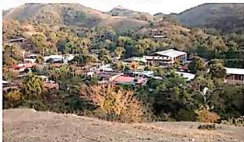
En Coire, municipio de Aquila, buscan generar empleo con la explotación de una mina de hierro.

en que vive nuestra gente, tenemos programada una reunión con Ternium, esperamos que salgan cosas buenas", concluyó.