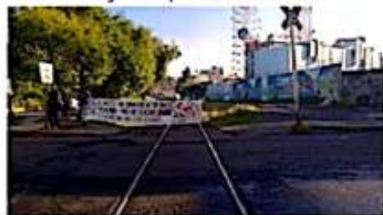
Este sábado maestros imponen nuevo récord en bloqueos a las vías del tren, se cumplen ya 80 días, con incalculables pérdidas económicas.

Expone también que los bloqueos ferroviarios provocan un ajuste de las rutas logísticas, generando un sobrecosto en el transporte que, finalmente es trasladado al consumidor final.