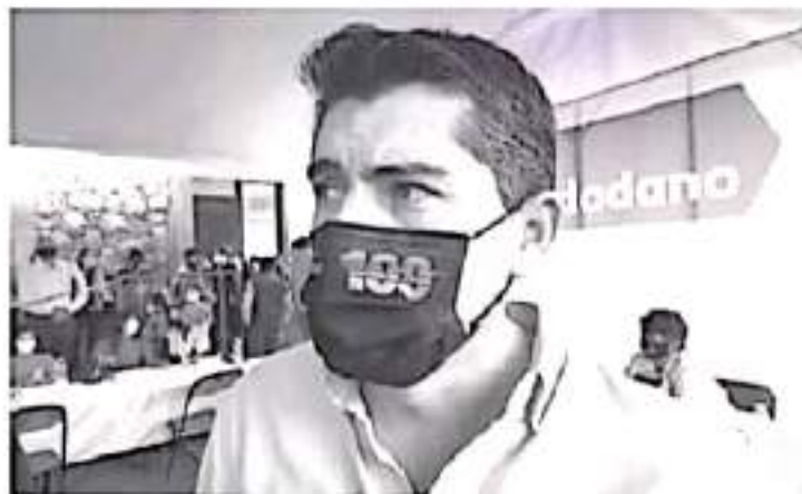
Durante los hechos violentos que tuvieron una duración de casi 45 minutos, hubo una buena reacción de la Fiscalía, Guardia Nacional, Policía Michoacana y de la propia policía municipal.

- Condena hechos violentos ocurridos en Zitácuaro