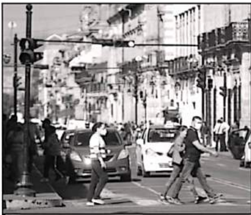
TRAS LA LLEGADA DEL CORONAVIRUS AL ESTADO, MÁS DE 95 MIL PERSONAS SE HAN RECUPERADO DE LA ENFERMEDAD.

Además, 2 mil 739 personas que murieron por coronavirus también padecían diabetes, es decir, más de una tercera parte de todas las defunciones, mientras que mil 796, es decir 23.5 por ciento, tenían obesidad.