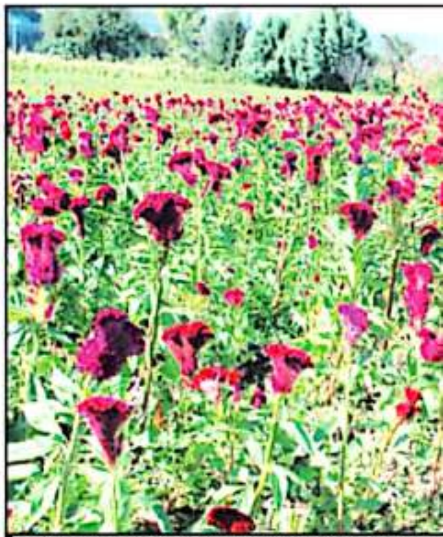
LA PRODUCCIÓN DE MÁS SE HA REDUCIDO DURANTE ESTA TEMPORADA, HAY SERVICIOS DE

"Este año sobre la lluvia, y lo poquito que se está dando es esto,