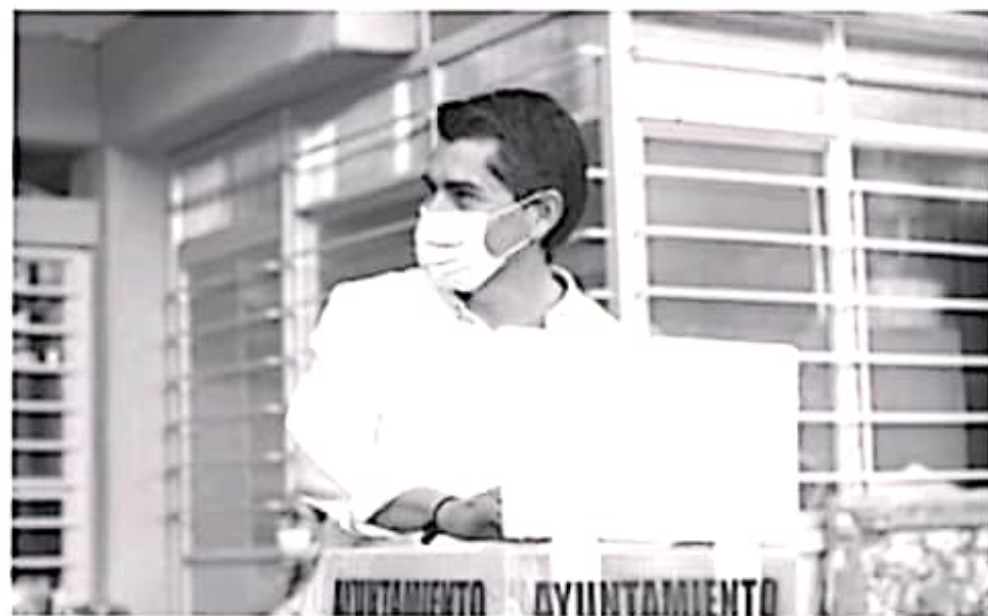
El presidente municipal informó que trabajará coordinado con los gobiernos Federal y Estatal, para garantizar la tranquilidad y seguridad de los zitacuarenses.

Este año, los temas que se abordarán, serán: la pandemia, el cuidado del medio ambiente y nuestros derechos