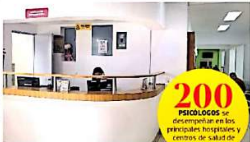
En México el 28% de la población, a lo largo de la vida, presentará algún trastorno mental.

mental de los michoacanos, comparte que 800 psicólogos se capacitan dentro de la tercera generación de la Estrategia Nacional para la Prevención del Suicidio, curso avalado por la Universidad Nacional Autónoma de México (UNAM) y la Organización Panamericana de la Salud (OPS).