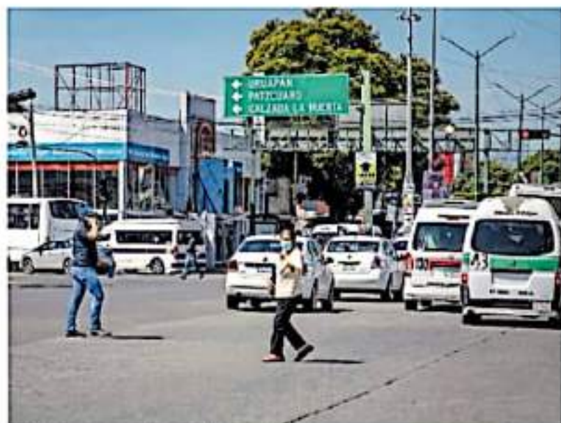
En 2020 se registraron 192 atropellamientos de peatones / CARMEN HERNÁNDEZ