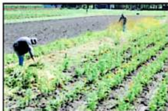
PRODUCTORES ESPERAN RECUPERAR ALGO DE LA INVERSIÓN EN SUS CAMPOS.