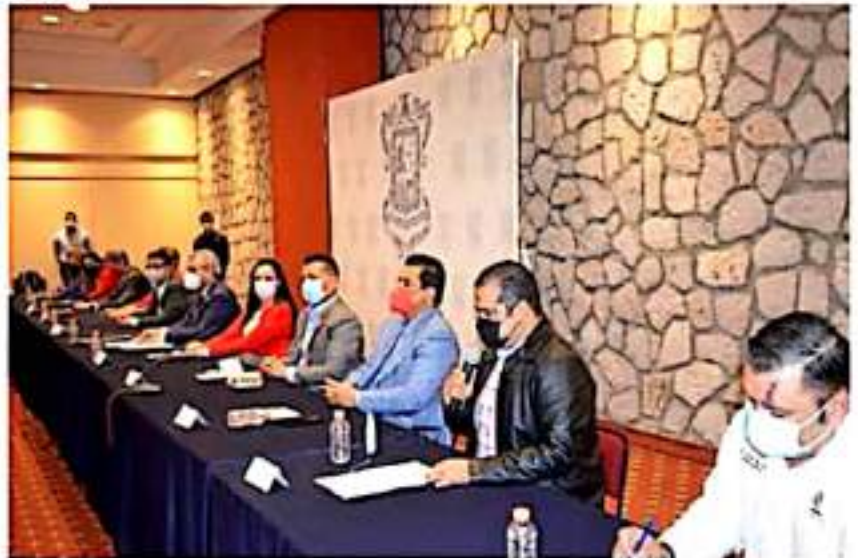
Alcaldes de extracción priista se reunieron para definir la agenda municipalista.

Se intenta al mismo tiempo, dijo Equihua Serrato recuperar el acuerdo de que empresas y organismos locales se hagan cargo de un kilómetro del boulevard, para que una vez "bonito y activo" se le programen actividades deportivas y recreativas.