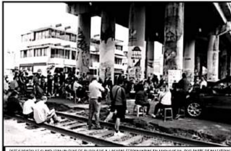
ESTE SÁBADO SE CUMPLIRÁN 70 DÍAS DE BLOQUEOS A LAS VÍAS FERROVIARIAS EN MICHOACÁN, POR PARTE DE MAESTROS.

Al corte del viernes 8 de octubre, se tienen diez trenes varados con graves afectaciones a la comu-