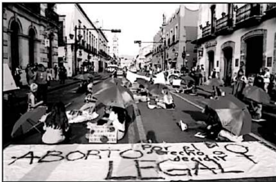
COLECTIVOS FEMINISTAS Y ACADÉMICOS REALIZARON UNA SOLICITUD AL GOBERNADOR DEL ESTADO EN CONTRA DE LA TITULAR DE LA SECRETARÍA DE EDUCACIÓN.

Dijo que el pronunciamiento no es tema que no importe, pero hay muchos otros en la SEE en los que tiene que establecer su