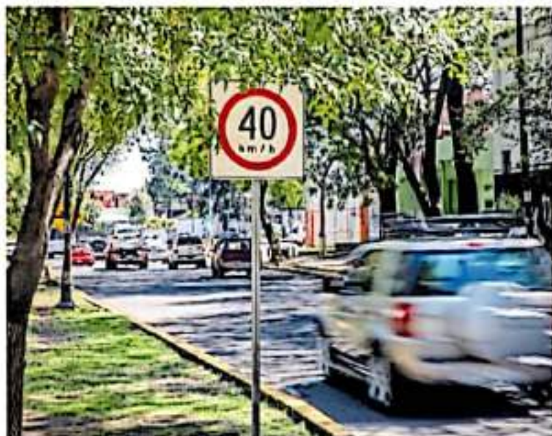
Las principales causas de accidentes y muertes de peatones en la ciudad son por conducir a exceso de velocidad