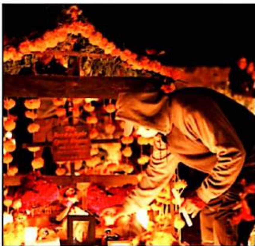
AUTORIDADES Y LAS COMUNIDADES INDÍGENAS DE LA ZONA ANALIZAN LA REALIZACIÓN DE LA NOCHE DE MUERTOS

Pero se va a analizar, la postura es que primero está el dar prioridad a la salud y luego lo demás; esperamos mejore la incidencia de contagios en la región