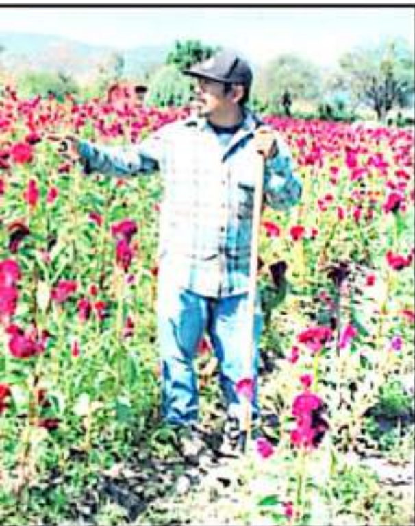
LA FLOR 'MAMI DE LEÓN', QUE HA LOGRADO SOBREVIVIR A LA TEMPORAL DE LLUVIAS.