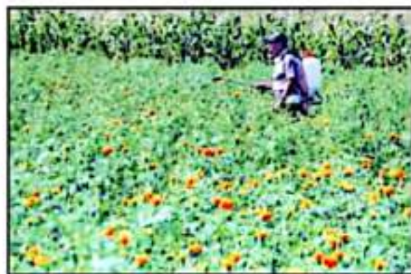
UNA POCAS FLOR SE APRESA EN LOS CAMPOS QUE LEGARÁN A PRODUCCIÓN.