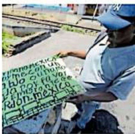
Carlos salió de El Salvador por la violencia provocada por pandillas

"Truimos con estas familias a abrirlos en primera instancia, para que supie-