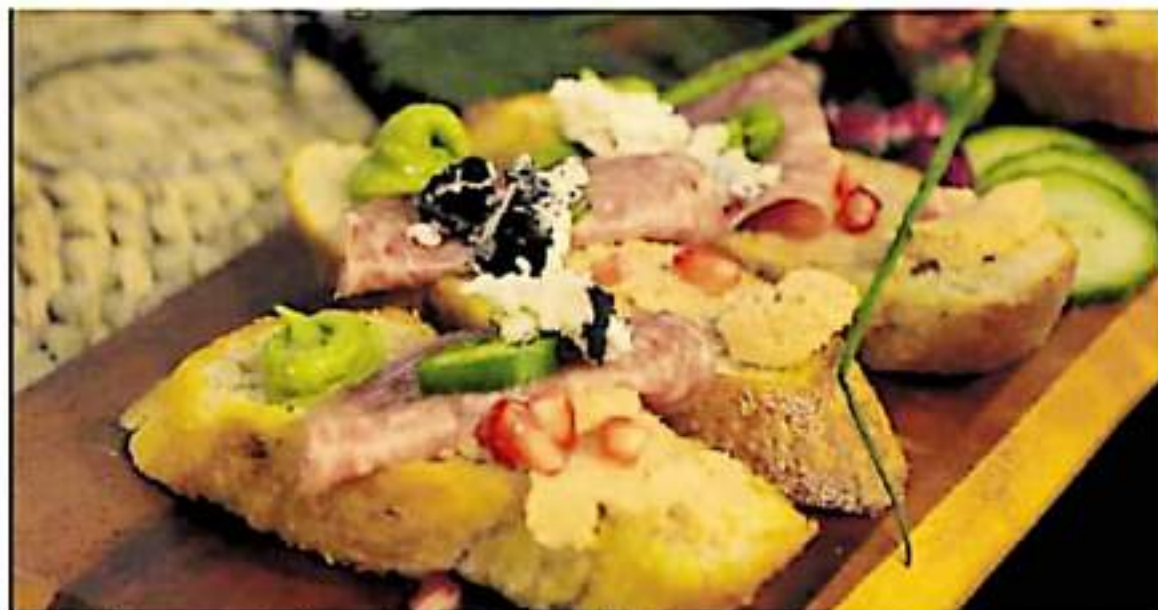
Brusheta de pan tostada con jamón pastrami y pequeños corazones de cáñamo / LOS TRUQUE