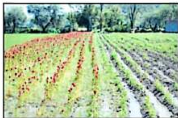
LA TEMPORADA DE LLUVIAS DEJÓ MUCHAS PÉRDIDAS A LOS PRODUCTORES.