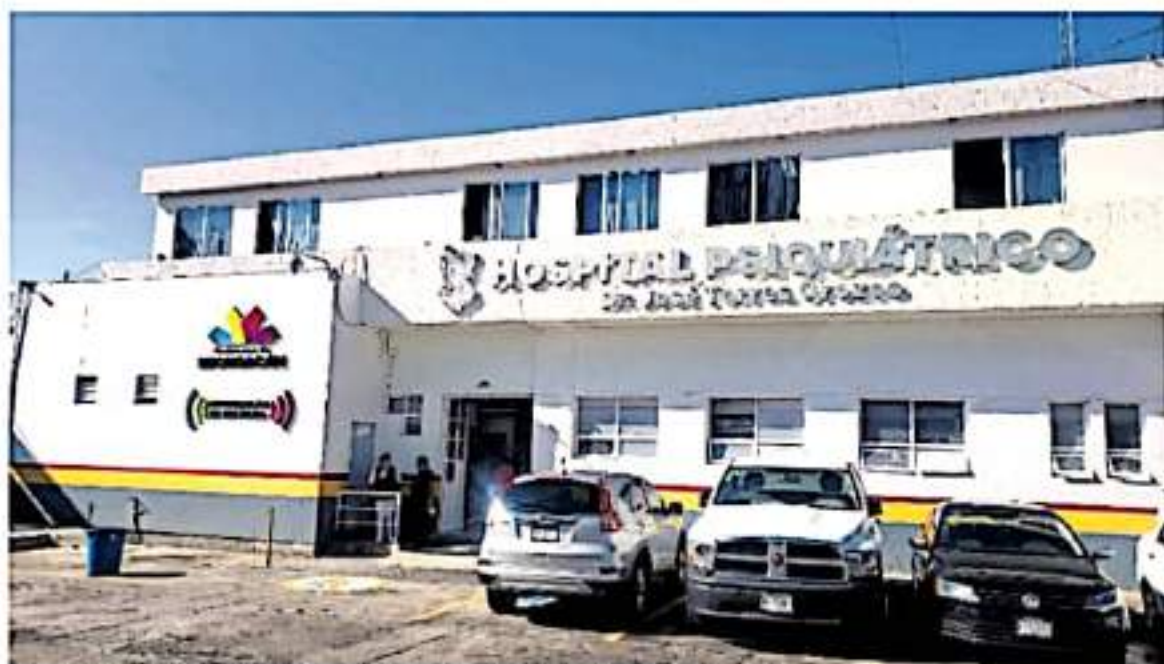
El Hospital Psiquiátrico de Morelia es uno de los más antiguos del país.