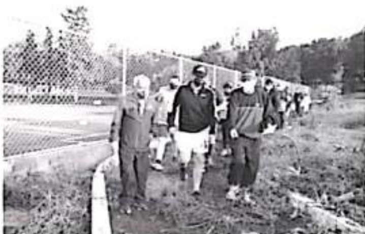
Invitó a las ligas, clubes, atletas destacados y ciudadanía en general a presentar proyectos para la conformación de un Plan del Deporte Municipal.

El edil acompañó a un equipo de atletismo en su entrenamiento matutino; asimismo, dio a conocer que las unidades deportivas, con base en lo emitido por la COEPRIS, se apertura de 6:00 Am a 8:00 Pm., bajo las medidas sanitarias establecidas.