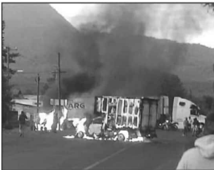
EN LOS ÚLTIMOS DÍAS SE HA VISTO UN INCREMENTO DE CASOS EN LOS MUNICIPIOS FRONTERIZOS CON JALISCO.

nen los organismos delincuenciales para que las instituciones no lleguen al lugar donde están desplegados. Sin embargo, la tarea es importante y hemos logrado de manera inmediata generar desbloques y las limpiezas de las carreteras", explicó el titular de la SSP.