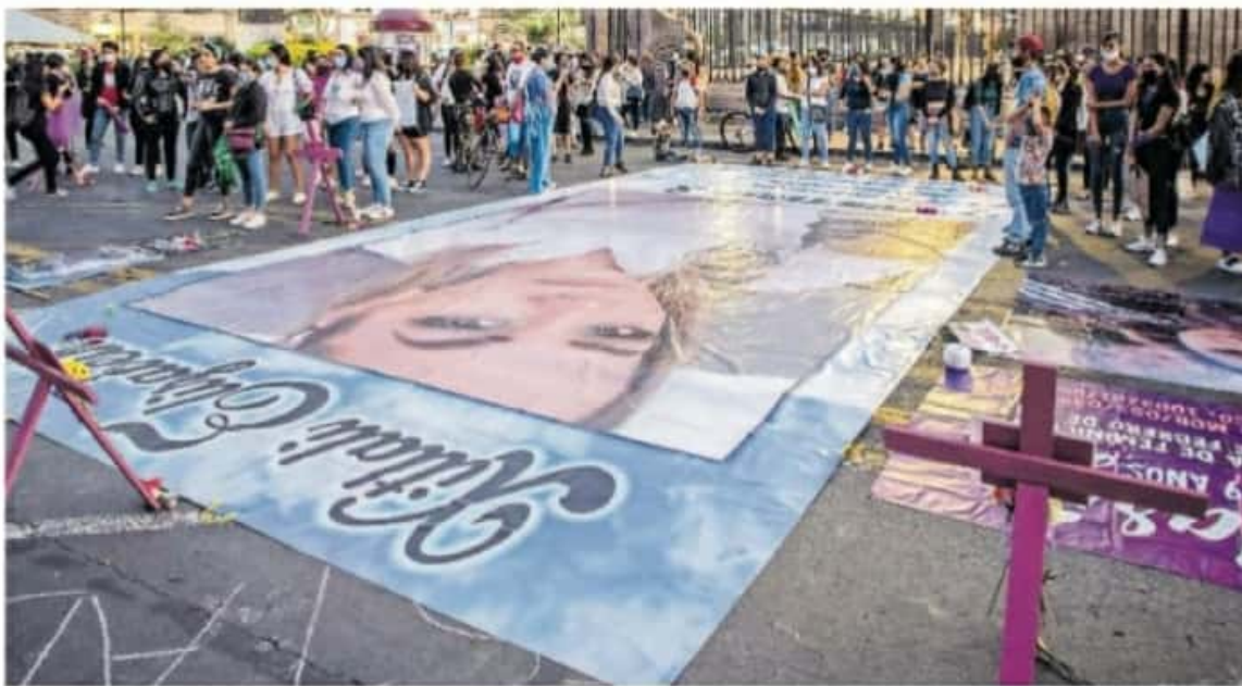
De 18 delitos del fuero común los únicos que incrementaron este año fueron los feminicidios, los de violencia intrafamiliar y los homicidios dolosos

MUNICIPIOS hay en el país, 15 concentran el 27.5 por ciento de los delitos de homicidio doloso