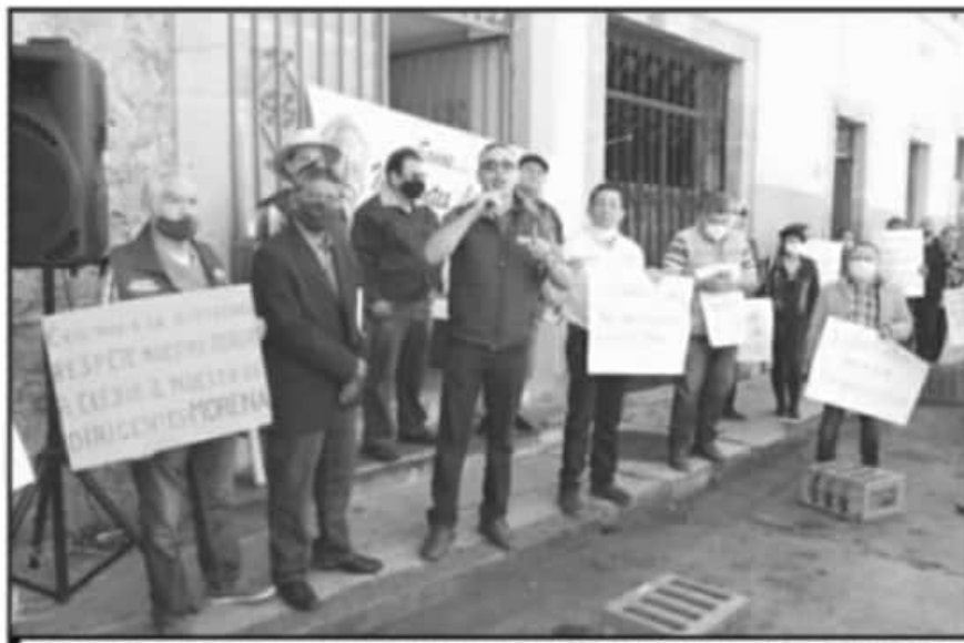
LOS MILITANTES INCONFORMES ADVIRTIERON QUE NO PERMITIRÁN LA INTROMISIÓN DE LA DIRIGENCIA NACIONAL.

"No al dedazo", "no a la imposición", "no al chapulines" fueron algunos de los mensajes que se leyeron en las cartulinas y pancartas que se desplegaron