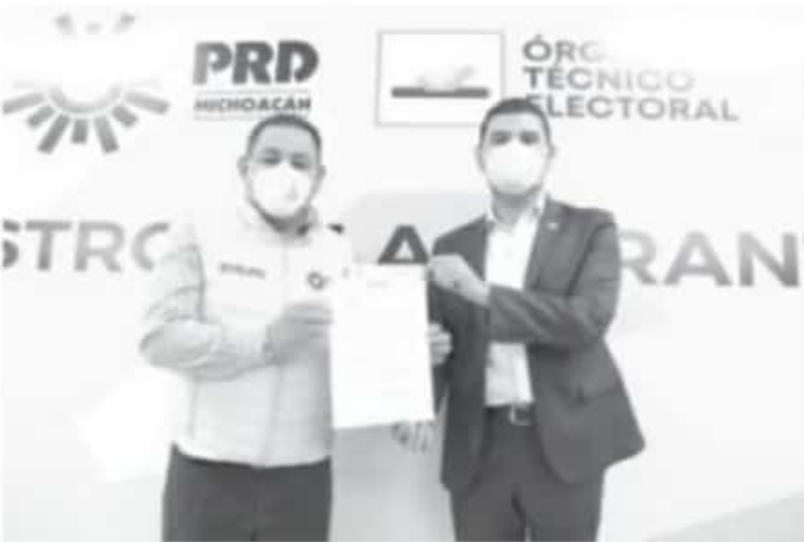
El ex presidente municipal de Tuzantla y actual diputado de la LXXIV Legislatura Local, acudió a las oficinas del PRD a manifestar su interés de participar en el proceso electoral 2021.

Distrito de Huetamo, en donde ha destacado por su trabajo y apertura para la construcción de acuerdos.