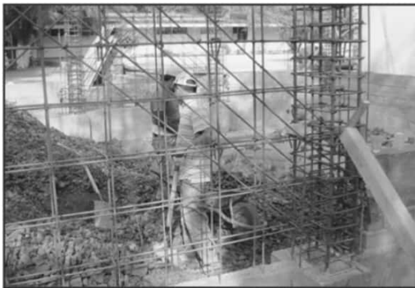
EL SECTOR PRIVADO DE LA CONSTRUCCIÓN ESTÁ DETENIDO PORQUE LOS INVERSIONISTAS ESTÁN CON INCERTIDUMBRE.

De acuerdo a una estimación de la cámara, con el cierre de estas 20 unidades económicas, son alrededor de 2 mil 500 personas las que se quedaron sin trabajo durante el año.