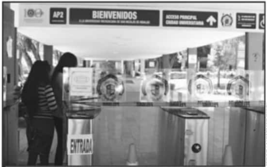
LOS TRABAJADORES NO PODRÁN RECIBIR NI PAGO DE QUINCENAS NI OTRAS PRESTACIONES PORQUE NO HAY DINERO.

Se continúan haciendo gestiones ante las instancias federales y estatales, para obtener recursos económicos