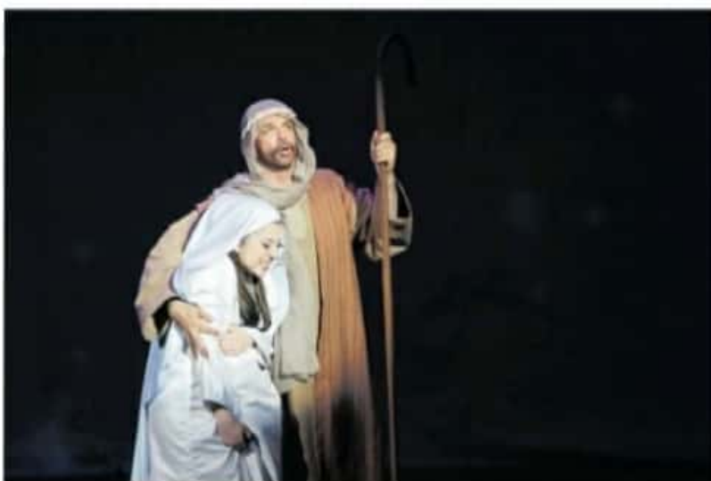
Las pastorelas contarán con un aforo del 50 por ciento.

nea, ya empiezo a dominar ese mundo, entonces ajusté los ensayos a convocatorias con personas específicas que hayan respondido a partir de video-ensayos y luego comenzamos a trabajar en ensayos presenciales", explicó.