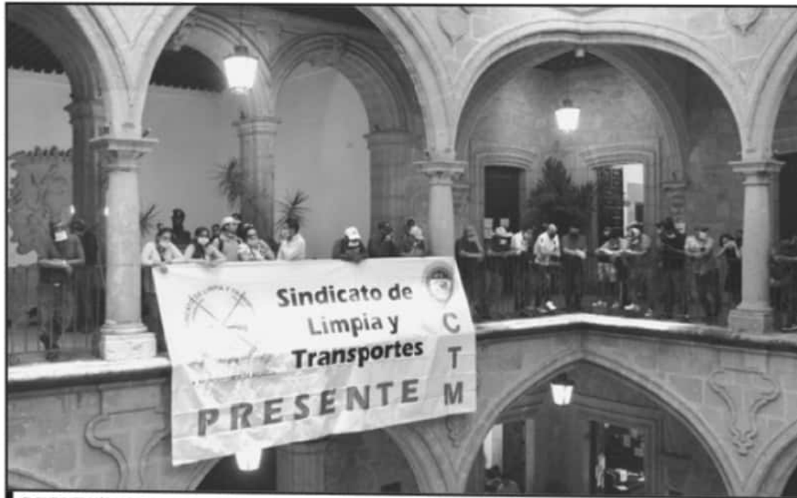
EL SINDICATO MÁS ANTIGUO DEL AYUNTAMIENTO DE MORELIA, PIDIÓ AL EDIL LA NIVELACIÓN DE LAS PROPORCIONES Y EXIGIÓ EL PAGO DE LO QUE FUE DESCONTADO.

El secretario general del SLyT sostuvo que, por ley, el pago de estas prestaciones no se realiza con promedios o diferendos, sino