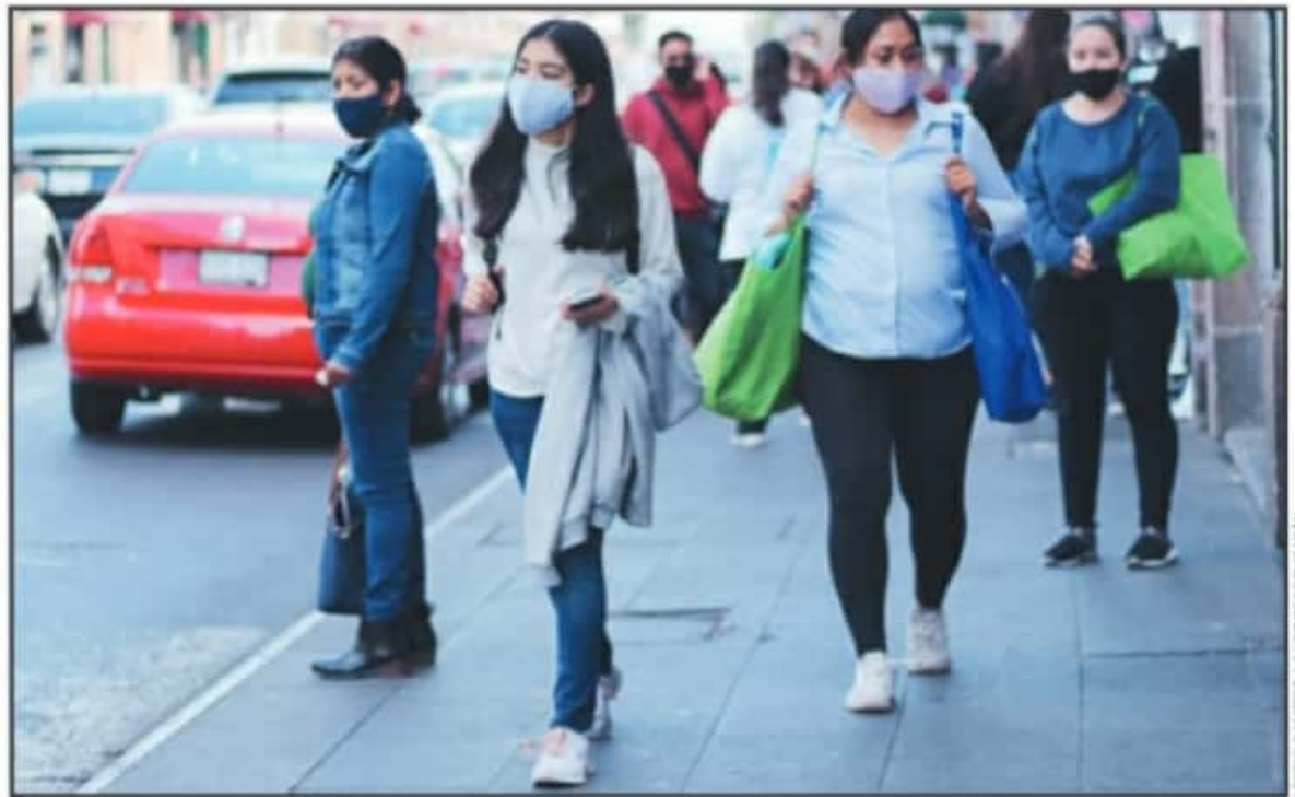
AUTORIDADES SANITARIAS HACEN UN LLAMADO A LA CIUDADANÍA PARA EVITAR ESTAR EN LUGARES CONCURRIDOS Y MANTENER LAS CONDICIONES SANITARIAS.

que encabezan la estadística de defunciones", explicó la autoridad sanitaria en Michoacán.