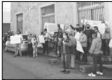
UNOS 50 MILITANTES PIDEN NO A LAS IMPOSICIONES.