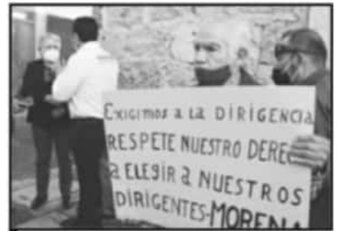
PIDEN RESPETO AL DIRIGENTE NACIONAL, MARIO DELGADO.

PROCESO EN LA DEFINICIÓN DE CANDIDATURAS, LA PETICIÓN