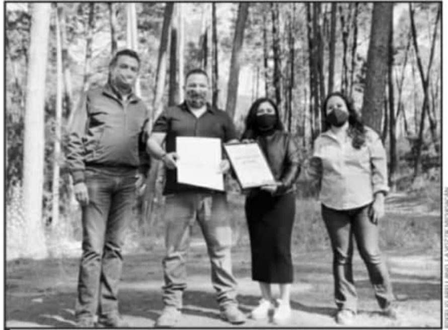
ES LA PRIMERA CERTIFICACIÓN EN ESTE RUBRO QUE LOGRA URUAPAN, LA CUAL AYUDARÁ A COMBATIR CAMBIO CLIMÁTICO

En este sentido, el funcionario estatal precisó que esta labor se realizará de manera coordinada entre Semaccdet, los go-