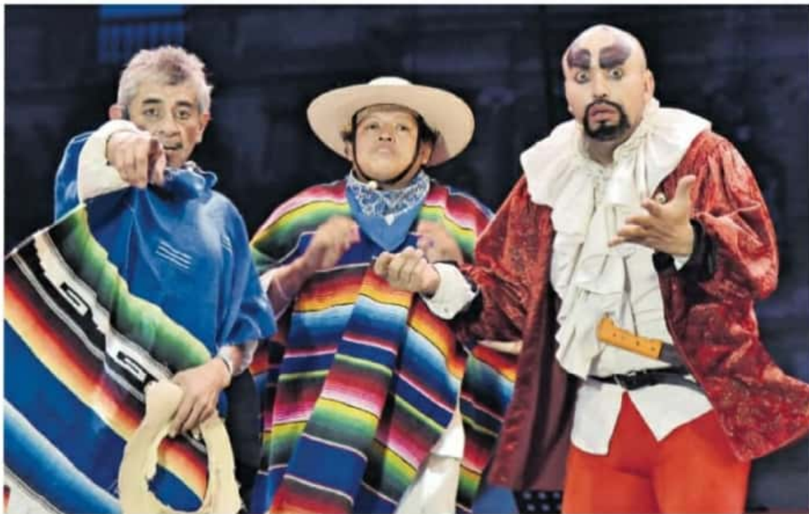
Obras de carácter cómico han sido adaptadas al momento sociopolítico.