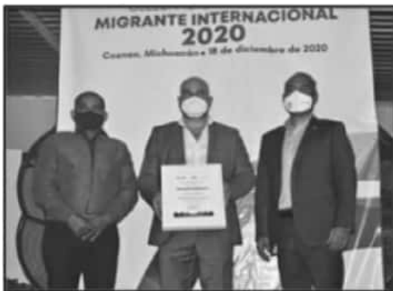
CELEBRARON EL DÍA DEL MIGRANTE INTERNACIONAL EN EL MUNICIPIO DE COENO, MICHOACÁN, RESPETANDO LAS NORMAS SANITARIAS POR COVID-19.

El titular de la Semaccdet, finalmente destacó que los predios certificados ya hacen desde trabajos de inspección y vigilancia, con la conformación de comités comunitarios, hasta temas de prevención de incendios.