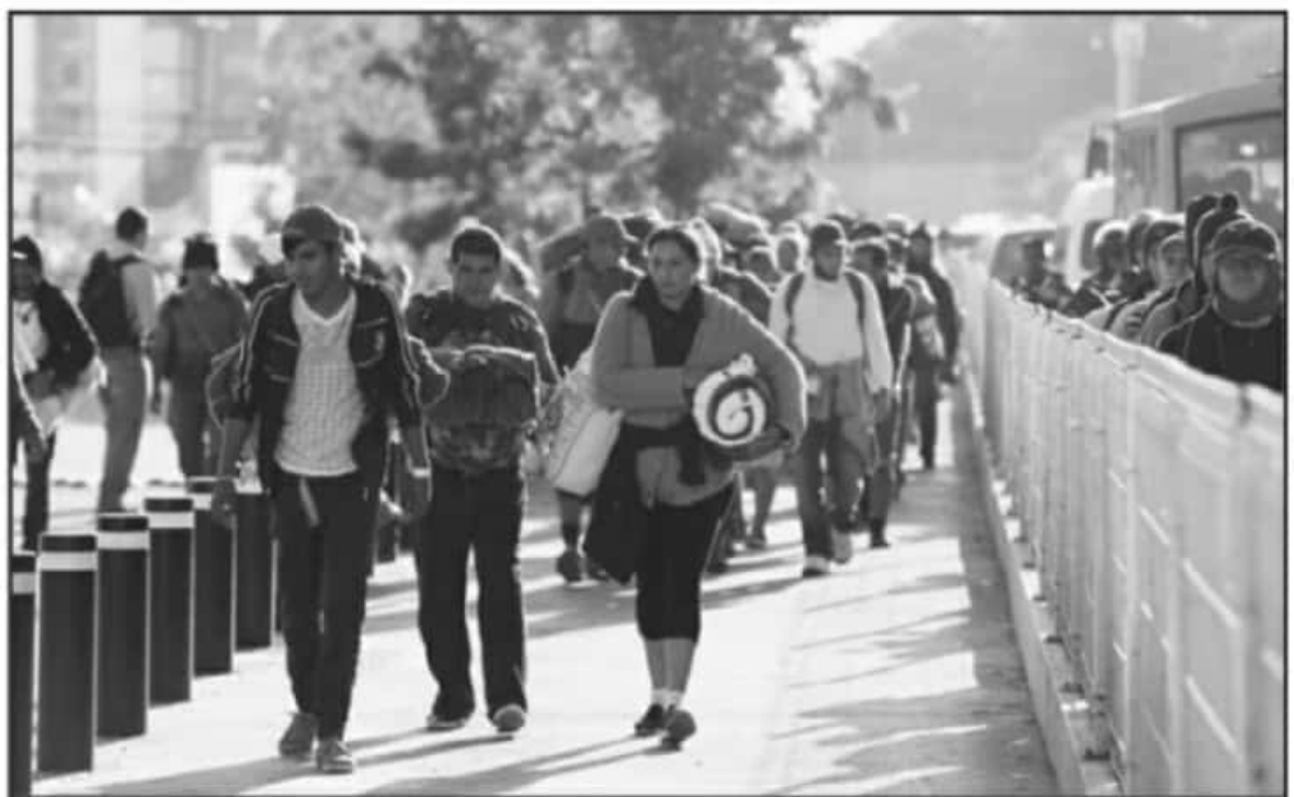
LA MAYORÍA DE PAISANOS SE MANTENDRÁN EN EL PAÍS VECINO DURANTE ESTAS FECHAS DECEMBRINAS, YA QUE EL PANORAMA GLOBAL LOS IMPOSIBILITA A VENIR.

Según datos de la Secretaría del Migrante del Estado, durante los periodos de semana santa y el verano, se disminuyó hasta en un 50 por ciento la afluencia de migrantes al estado de Michoacán para las fiestas. En este sentido, se advierte que cada año en promedio regresan hasta 90 mil michoacanos para pasar tiempo