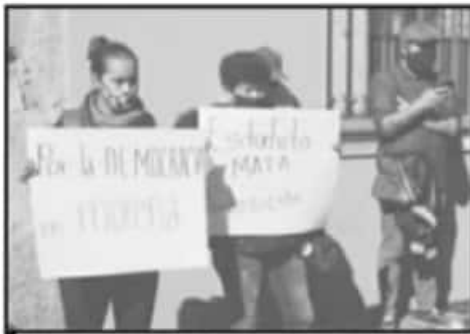
CON CARTULINAS EN MANO, MOSTRARON SU RECHAZO.