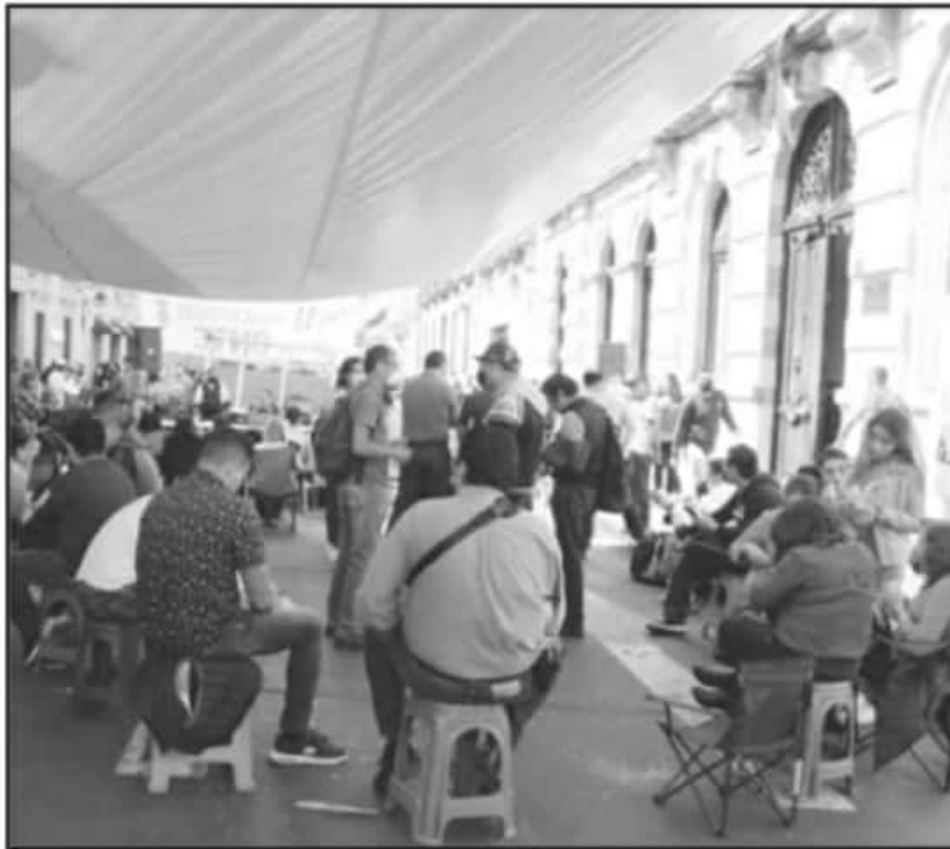
LOS AGREMIADOS AMENAZAN CON MANTENER PLANTÓN EN CONGRESO SI NO SE ASIGNA EL RECURSO DEMANDADO.

Detalló que en caso de que, a más tardar para este lunes, pueda distribuirse los pagos que