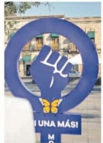
Morelia es antepenúltimo lugar en homicidio doloso