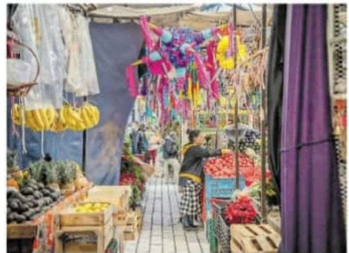
Los comerciantes hicieron un llamado a los morelianos para que compren en los mercados

Corundas, tamales, huchepos, atoles, enchiladas, churipo y champurrado, entre una diversidad de platillos que tiene como base al maíz, hacen las delicias de fami-