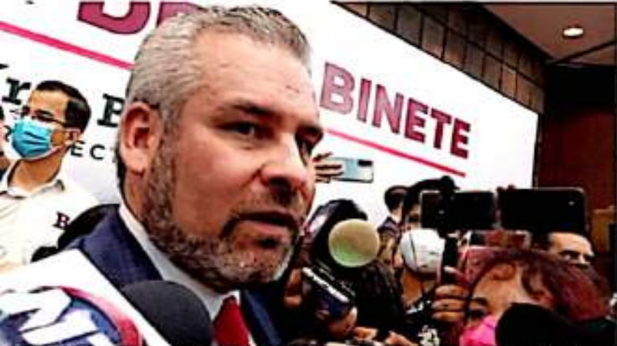
MORELIA, MICH.- En Palacio Clavijero, a las 11 de la mañana, se llevará a cabo la sesión solemne, donde se le tomará protesta a Alfredo Ramírez Bedolla.

Asimismo, el artículo 59, sostiene que el gobernador, al tomar posesión de su cargo, rendirá protesta ante el Congreso del Estado, lo siguiente: "protesto guardar y hacer guardar la Constitución Política de los Estados Unidos Mexicanos, la particular del estado y las leyes que de ambas emanen, y desempeñar leal y patrióticamente el cargo de gobernador que el pueblo me ha conferido, mirando en todo por el bien y prosperidad de Michoacán; y si así no lo hiciera, que la nación y el estado me lo demanden".