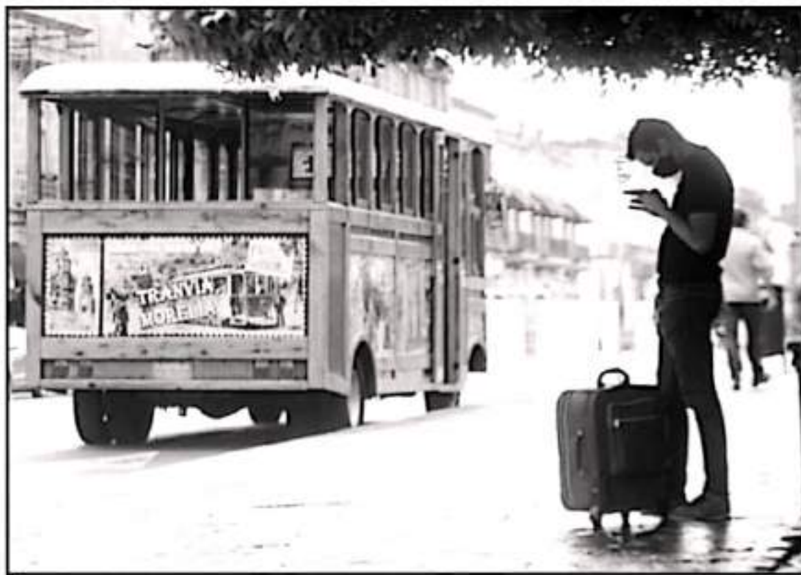
ADemás de la pandemia por coronavirus, el sector turístico ahora enfrenta otra crisis, la inseguridad y los enfrentamientos en municipios.

Los enfrentamientos de grupos armados en Aguahilla, Cuahuacán, Tepalcatesco y Apatzcingán, así como la serie de homicidios violentos en Uruapan, Zamora, Tacámbaro e incluso Morelia se han mediatizado en los noticieros y sitios informativos nacionales. Las imágenes de los choques armados y las víctimas de asesinatos acriados en Michoacán son cada vez más comunes en las televisiones y páginas web, situación que incluso ha llevado a Estados Unidos de América a elevar alertas de viaje para que sus residentes desistan