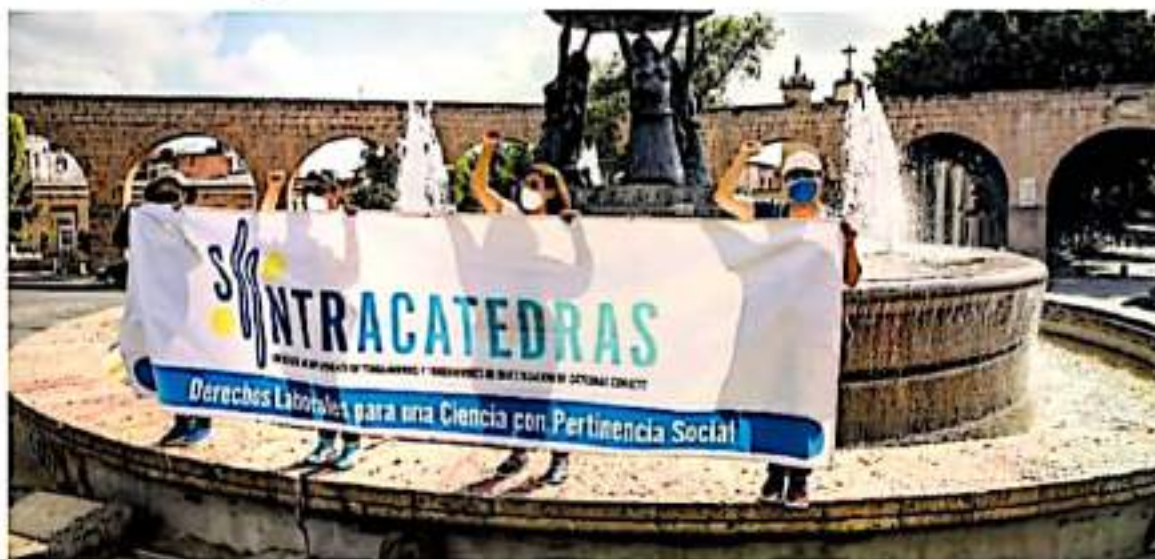
Se manifestaron en la fuente de Las Tarascas.