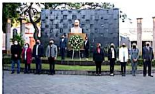
ZAMORA, MICH.- El 256 aniversario del natalicio de José María Morelos y Pavón.