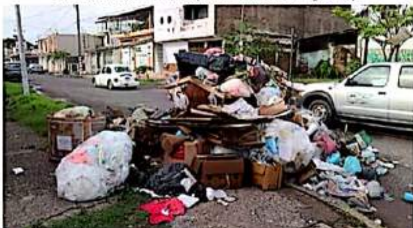
Uno de los principales focos de contaminación en la ciudad y en todo el municipio, es el deficiente servicio que se tiene de recolección de basura.