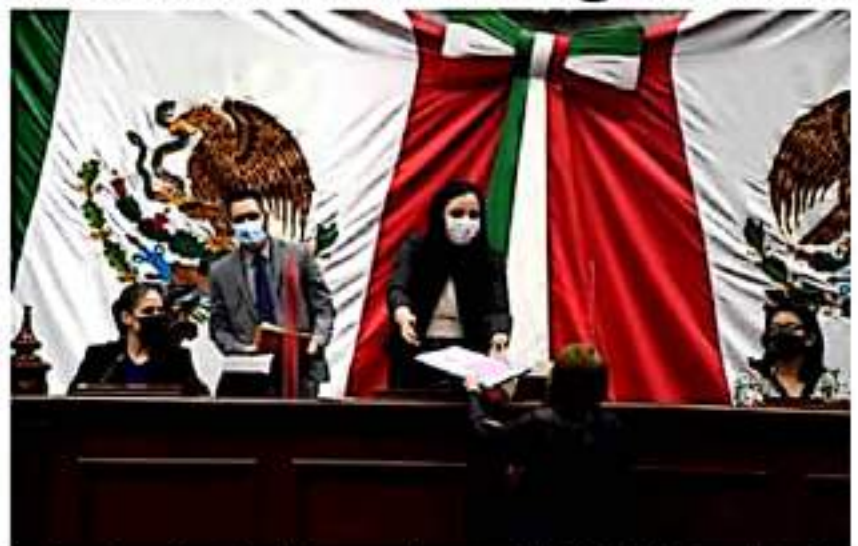
Ayer quedaron conformados todos los grupos parlamentarios y la JUCOPO de la 75 Legislatura del estado.