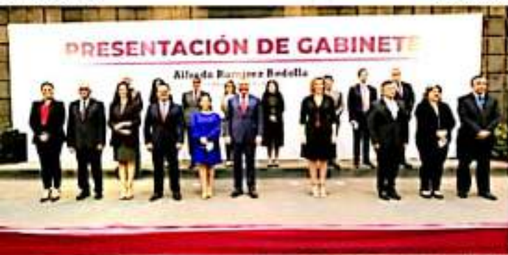
MORELIA, MICH.- Bedolla presentó a los perfiles que le acompañarán en su gestión como parte del Gabinete Legal, equipo en el que reconoció pluralidad y equidad.

Ramírez Bedolla comprometió constante comunicación y trabajo en todos los territorios y municipios de Michoacán, pero también con la federación, a fin de garantizar armonía para la resolución de las necesidades.