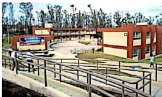
El Tecnológico de Morelia tiene registrados tres maestrías y dos doctorados ante el Conacyt.

No obstante, tras meses de litigio, la Junta Federal de Conciliación y Arbitraje