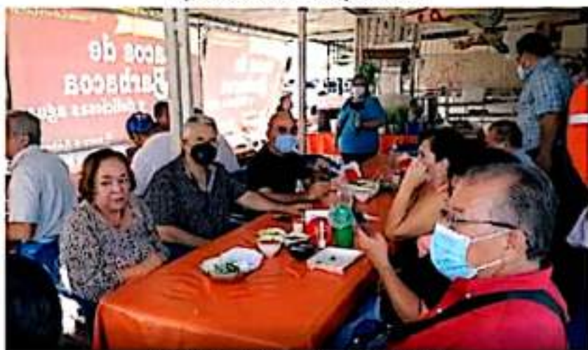
Clientes e invitados al 50 aniversario de Taquería Cabrera.