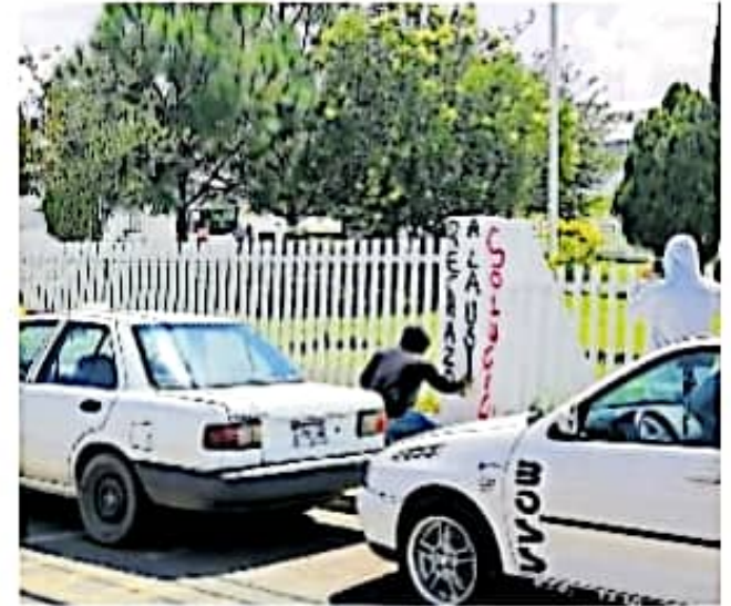
La SEE requirió el apoyo de la fuerza pública para evitar mayores afectaciones