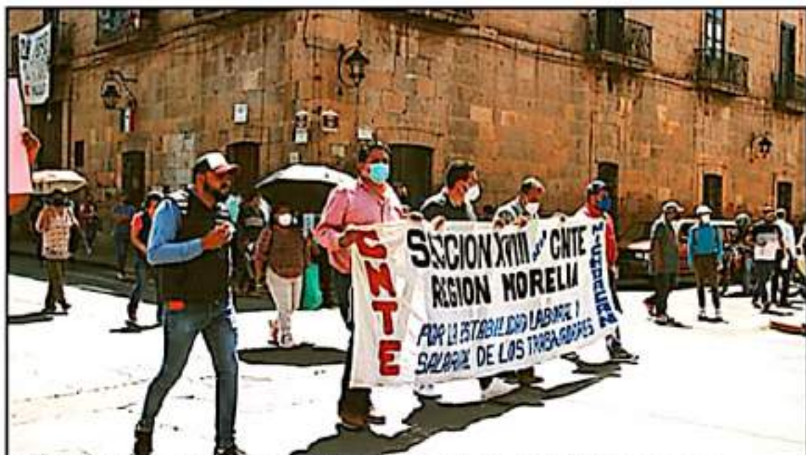
LOS MAESTROS DE DISTINTAS FRACCIONES SINDICALES SE HAN MANTENIDO EN PROTESTA ANTE LA FALTA DE PAGO DESDE HACE DOS MESES

Manifestó que su perfil puede ayudar si se rodea de un buen equipo la negociación con los trabajadores particularmente con los docentes de la CNTE. "También creo que debemos empezar la reconciliación en el sector educativo". Agregó que es necesario una interlocución y que no sean diferentes