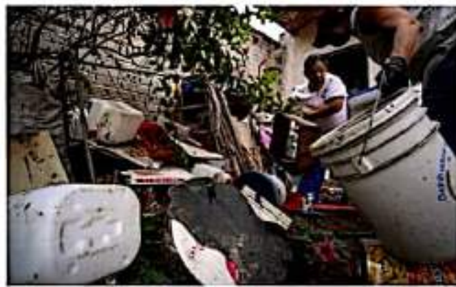
ZAMORA, MICH.- El dengue es una enfermedad que atiene su erradicación principalmente en los domicilios de los ciudadanos.