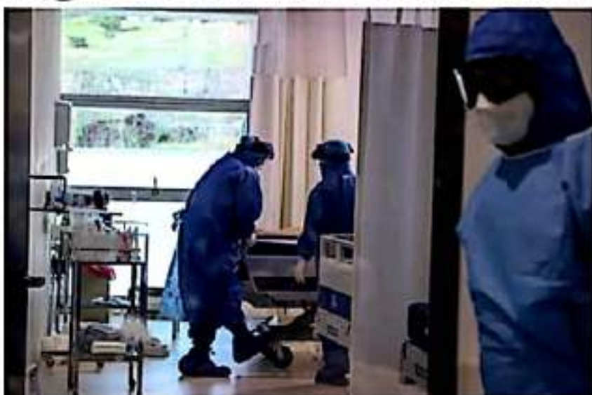
De acuerdo con datos de la SSM, la ocupación de camas COVID en LC sigue a la baja.

El equipo que realiza estas acciones, reconoció que la barrera mayor para el cumplimiento de los criterios, ha encontrado como barrera el deficiente servicio de recolección de basura y mala calidad de agua en la ciudad.