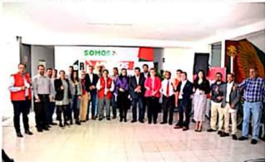
La dirigencia y militancia del tricolor partido, fijó su postura en torno al gobierno de Alfredo Ramírez Basallo, que inicia hoy en Michoacán.