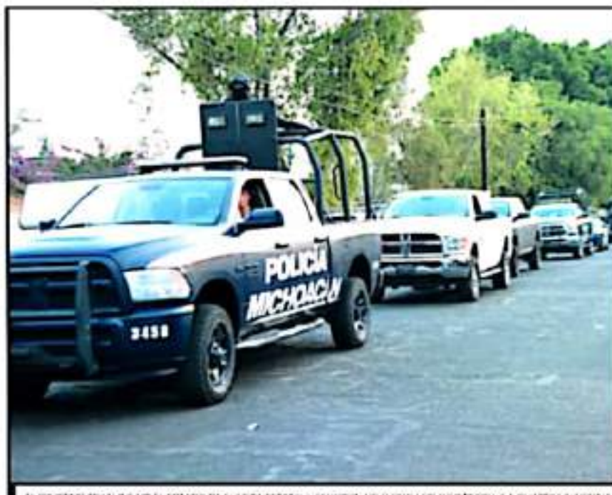
EL OBJETIVO ES ALINEAR EL ESTADO DE FUERZA ESTATAL Y COORDINARLO CON LOS OBJETIVOS Y LA GUARDIA NACIONAL.

Actualmente, la Policía Michoacán cuenta con un estado de fuerza de poco más de 7 mil elementos entre personal administrativo y oficiales en activo en las 110 regiones en las que se dividió el