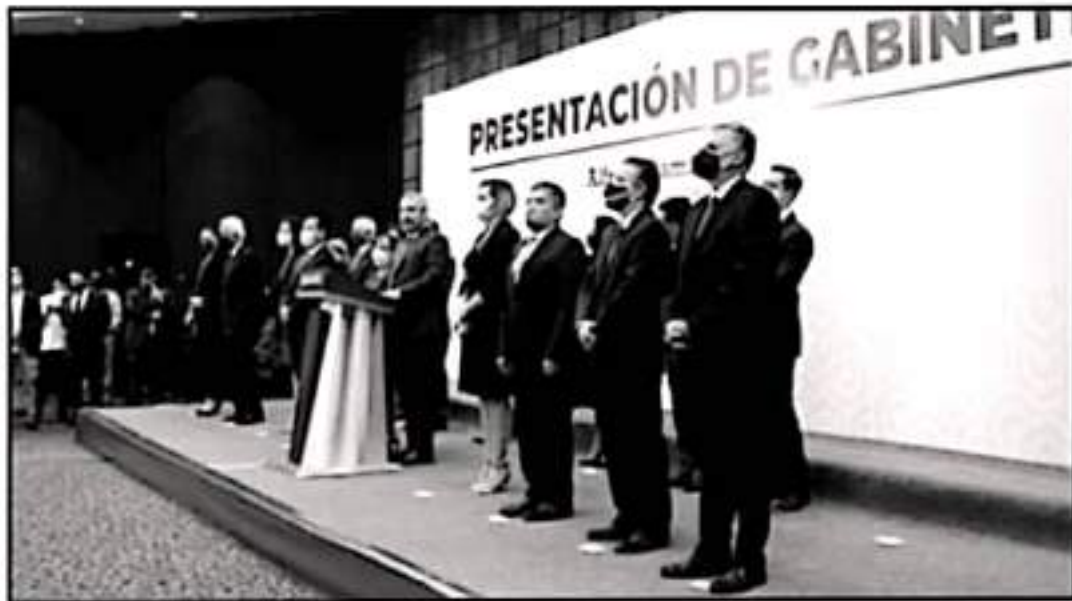
EL GOBERNADOR ELECTO DESIGNÓ A LOS NUEVOS TITULARES DE LAS SECRETARÍAS QUE SON CLAVE PARA REACTIVAR LA ECONOMÍA