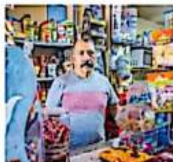
30 negocios han tenido que implementar medidas.

El préstamo es de 25 mil pesos y los interesados deben acudir a la Dirección de Desarrollo Social Municipal ubicada en la presidencia de Jacona, en horarios de 09:00 a 5:00 horas, quienes deberán respetar las recomendaciones de sana distancia y uso correcto del cubrebocas. Deben registrar el nombre y giro del negocio, dirección y nombre del propietario y número telefónico.