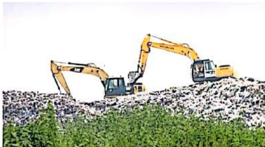
Sólo se lograron recursos en 2020 para un relleno sanitario.