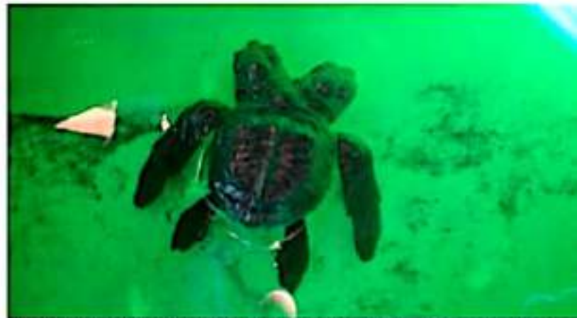
CD. LÁZARO CÁRDENAS, MICH.- Resguardan nuevo ejemplar de tortuga de dos cabezas en campamento El Habital.

Este campamento ha sido testigo del nacimiento de tres ejemplares de dos cabezas, dos de ellas perdieron pocos días, mismas que no fueron liberadas al mar ya que sus capacidades y expectativas de vida se reducen debido a la descompensación de sus dos cabezas, sin embargo esperan se puedan realizar los estudios pertinentes para determinar las causas de esta rara y llamativa malformación.