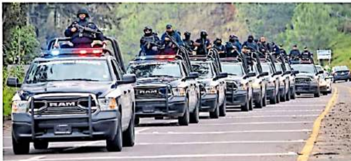
En próximos días tendrán comunicación con los encargados de la Guardia Nacional en la zona de Tierra Caliente