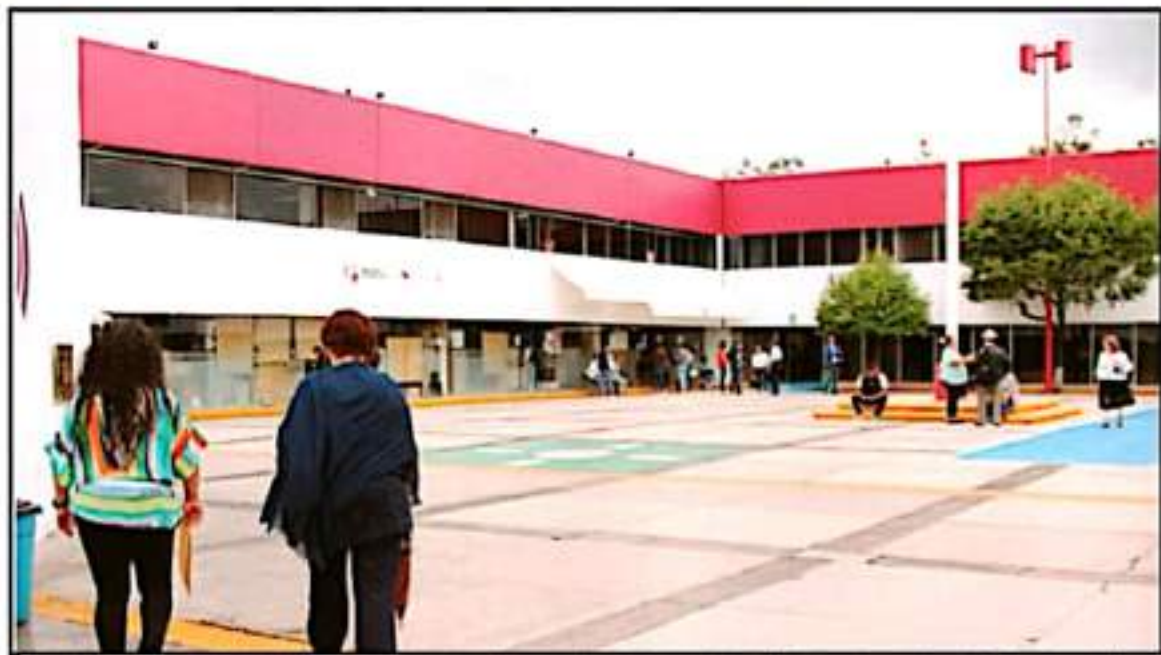
UN GRAN RETO ES EL QUE TENDRÁ QUE ENFRENTAR LA SIGUIENTE ADMINISTRACIÓN EN LA SEE EN EL TEMA ECONÓMICO: SENAJA EL TITULAR SALIENTE

Subrayó que la coyuntura política electoral dejó en medio a los maestros y que es un tema que se politiza, donde habita dos posturas encontradas; en este sentido dijo que, de igual forma, el impedir que se adelantara presupuesto para cumplir con los pagos tampoco se permitió por disciplina financiera.