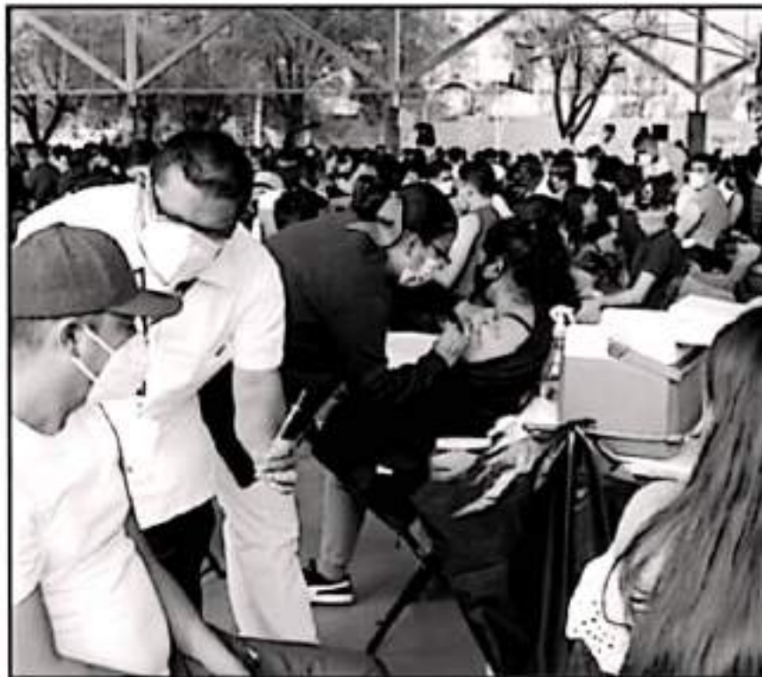
MUY LIMITADA HA SIDO LA ESTRATEGIA EN CUANTO A MÓDULO, HORARIOS, DÍAS HÁBILES Y SEGUIMIENTO.

El próximo sábado sesionará por primera vez como Comité Estatal de Crisis Sanitaria, en donde se pondrán los primeros planteamientos y necesidades para contener a la enfermedad que hasta el momento ha dejado más de 113 mil infectados y casi 7 mil 500 muertos en Michoacán.