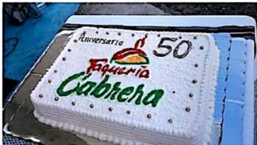
El pastel del 50 aniversario de Taquería Cabrera.