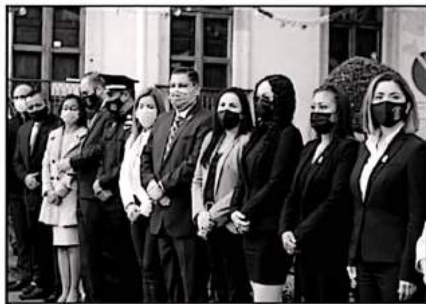
EL EDIL PARTICIPÓ EN EL ACTO CÍVICO DEL 25º ANIVERSARIO DEL NATALICIO DE JOSÉ MARÍA MORELOS Y PAVÓN.

Lo anterior fue señalado por el presidente municipal luego de su participación en el acto cívico para conmemorar el 25º aniversario del natalicio de José María Morelos y Pavón, acompañado de miembros de su gabinete y regidores. "La esperanza está puesta en la Cuarta Transforma-