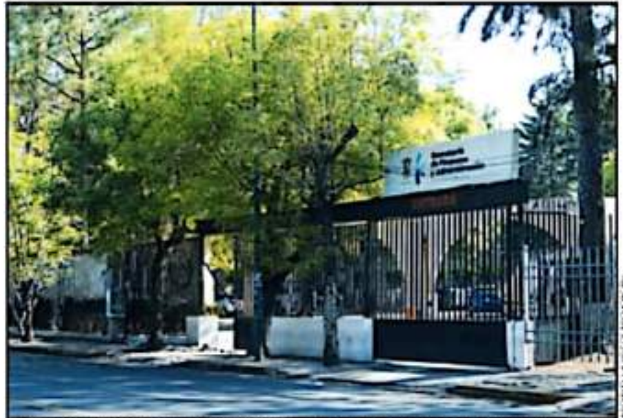
SE PREVÉ QUE EL APORTE DE LA FEDERACIÓN GARANTICE EL PAGO A TRABAJADORES DE LAS DISTINTAS ÁREAS ANTES DEL 2022

Desde hace al menos 3 semanas el labora gobernador Alfredo Ramírez Bodilla manifestó y denunció que el total de las deudas a largo, mediano y corto plazo del estado superan los 50 mil millones de pesos. Si bien un porcentaje importante es deuda bancarizada, preocupan los pendientes con terceros institucionales, proveedores y otros números rojos que se tendrían que pagar de manera inmediata y para lo cual no hay recursos.