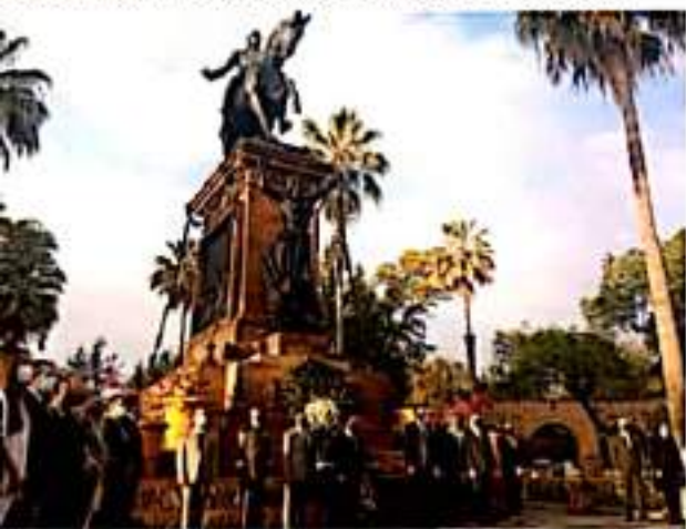
MORELIA, MICH.- Conmemoran a José María Morelos y Pavón a 256 años de su natalicio.

Cabe señalar que, como parte de la conmemoración que hoy se enmarca en el 200 aniversario de la consumación de la Independencia de México, el Instituto Nacional de Antropología e Historia (INAH) se presentó una réplica de la bandera Trigarante, que portó el Ejército Trigarante a su ingreso a la Ciudad de México, y al Acta de Independencia firmada por los que intervinieron en este proceso.