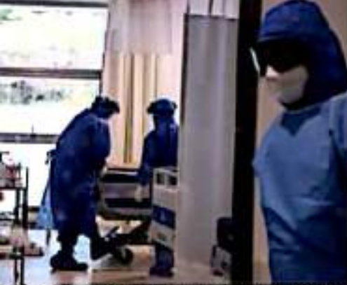
CD. LÁZARO CÁRDENAS, MICH.- La vacunación anti Covid-19, ha permitido una baja en la ocupación hospitalaria de las unidades médicas de la región de Lázaro Cárdenas, con 33.96 por ciento.

Se mantiene a disposición de la población el 800-123-2890 con 11 líneas para resolver todas sus dudas, así como el micrositio bit.ly/MichCOVID-19 donde encontrarán toda la información disponible sobre Covid-19.