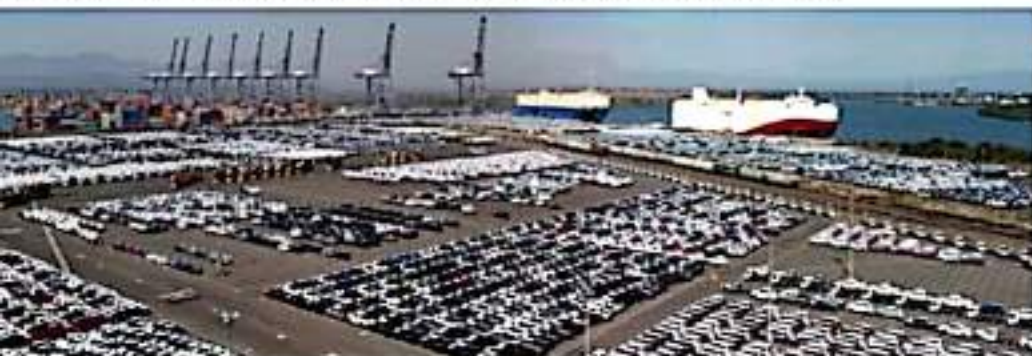
CD. LÁZARO CÁRDENAS, MICH.- Lázaro Cárdenas Port Community externó su molestia por el bloqueo a las vías del tren por la CNTE y confía en que pronto sean alcanzados los acuerdos para que sean liberadas las vías y se deje de perjudicar a uno de los principales medios de desalojo de la mercancía, como lo es el ferrocarril.

Aunque actualmente Lázaro Cárdenas ya establece sus cifras Covid-19, ha sido de los municipios más atacados por el coronavirus, y de los que más elevaron sus cifras durante la tercera ola de contagios, junto con Morelia y Uruapan.