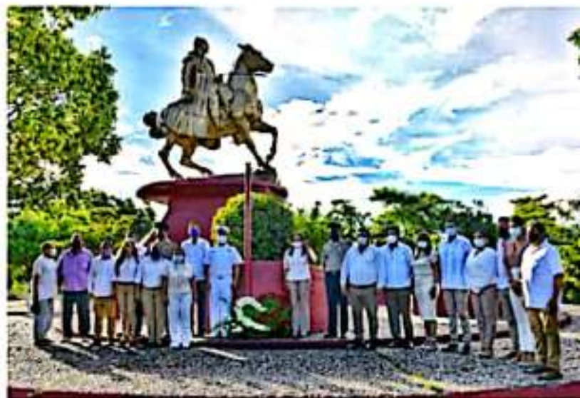
CD. LÁZARO CÁRDENAS, MICH.- Autoridades navales, militares y municipales rindieron homenaje al héroe de la patria, José María Morelos y Pavón al cumplirse el 256 aniversario de su natalicio.