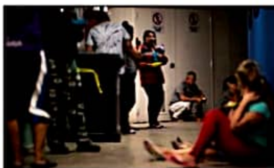
JAIMÉ DARÍO OSEGUERA MÉNDEZ

No sabía que existe el Índice Global de Delincuencia Organizada. Sin duda los indicadores permiten comparar fenómenos sociales y al hacerlo, el análisis se vuelve más creíble o por lo menos tiende a ser más acertado. Es imposible evaluar cuantitativamente lo que no se mide.