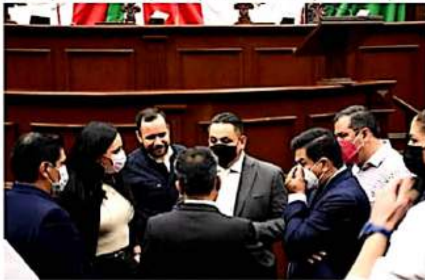
Diputados integrantes de la 75 legislatura.