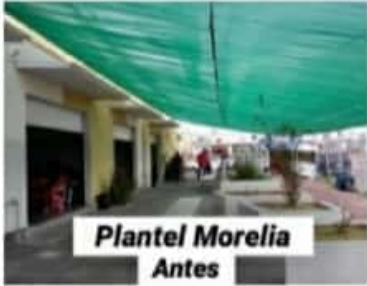
Plantel Morelia Antes