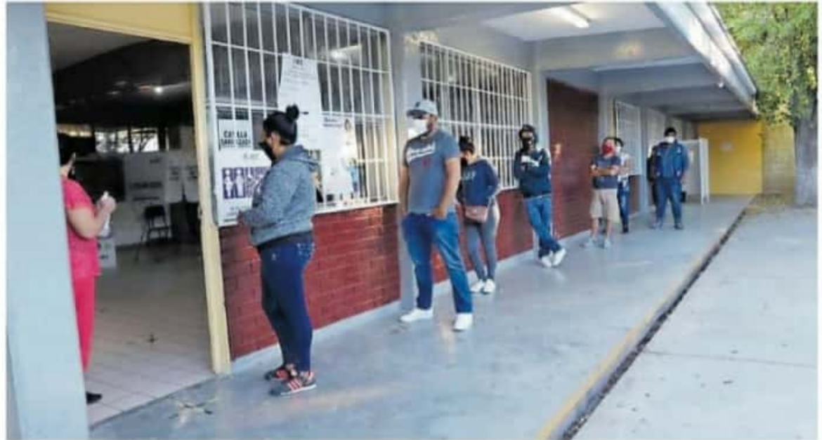
El gobierno de Michoacán no podrá sancionar a quienes hagan concentraciones masivas