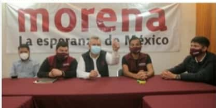
MORELIA, MICH.- El fundador de Morena subrayó la importancia de que se mantengan organizados y activos en la defensa de la 4T.

Vislumbró que mínimo ganarán en 32 municipios y reiteró "la importancia de tener mayoría legislativa federal en la Cámara de Diputados para lograr los contrapesos frente a las decisiones del Ejecutivo Federal".