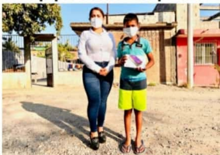
CD. LÁZARO CÁRDENAS, MICH.- La Dirección de la Unidad Regional de Servicios Educativos de Lázaro Cárdenas, continúa llevando hasta los hogares de los alumnos los dispositivos electrónicos con los que podrán realizar sus actividades escolares a la distancia.