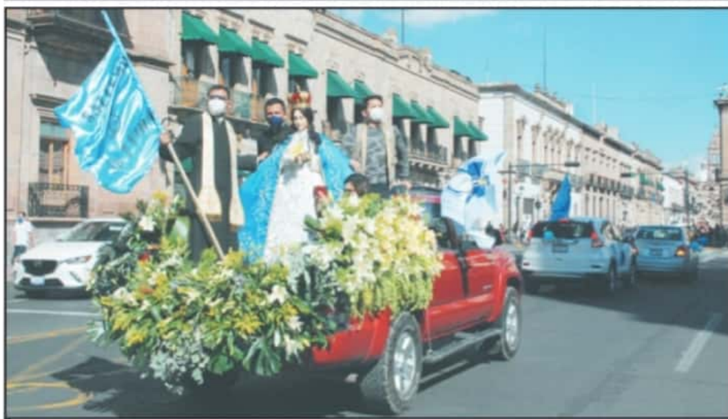
LA IMAGEN DE LA VIRGEN DE LA SALUD SALIÓ DESDE LA CATEDRAL DE MORELIA, ABORIDO DE UNA CAMIONETA, CON LA INTENCIÓN DE MOTIVAR LA RECUPERACIÓN EN ENFERMOS

tuto Mexicano del Seguro Social (IMSS), donde unas 20 personas ya presentes en esta unidad médica se reunieron y realizaron oración en torno a la figura religiosa.