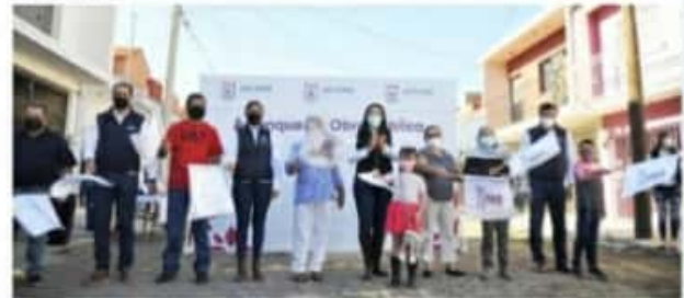
JACONA, MICH.- La rehabilitación integral de esta calle será de vital importancia para esa colonia, ya que se contribuye a mejorar la vialidad.

Cabe destacar que la inversión total de la obra es de 2 millones 790 mil 833.24 pesos, trabajos de pavimentación, construcción de banquetas, líneas de drenaje, descargas domiciliarias de drenaje, tomas de agua, pozos de visita y alumbrado público harán que luzca una calle en óptimas condiciones.