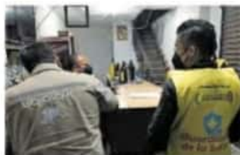
En el último fin de semana se verificaron 92 establecimientos.

El representante del sindicato afirmó que los trabajadores que se encuentran en primera línea de atención ya están agotados y que la pandemia los ha rebasado, prueba de la cantidad de defunciones a diario en la entidad, aunado a esto dijo que "esto no es un juego, es una realidad" y pidió a las autoridades que dejen de hacer publicidad con este tema y busquen una solución para el beneficio de todos.