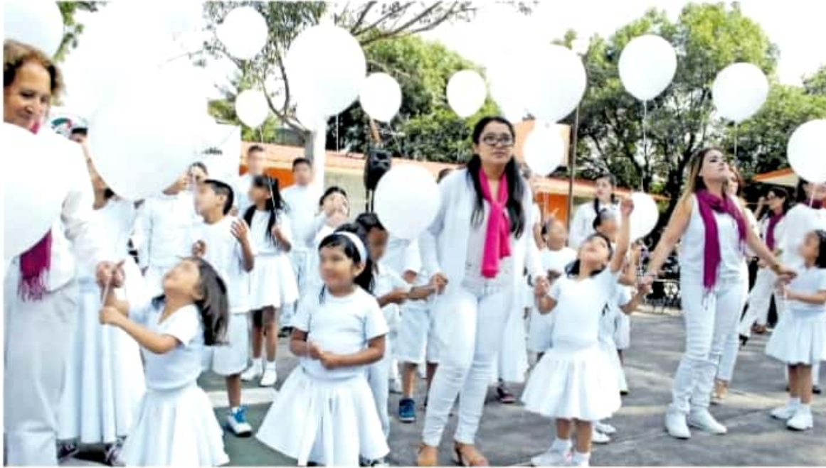
Ante la emergencia pandémica este sector educativo también tuvo que acoplarse a la modalidad a distancia