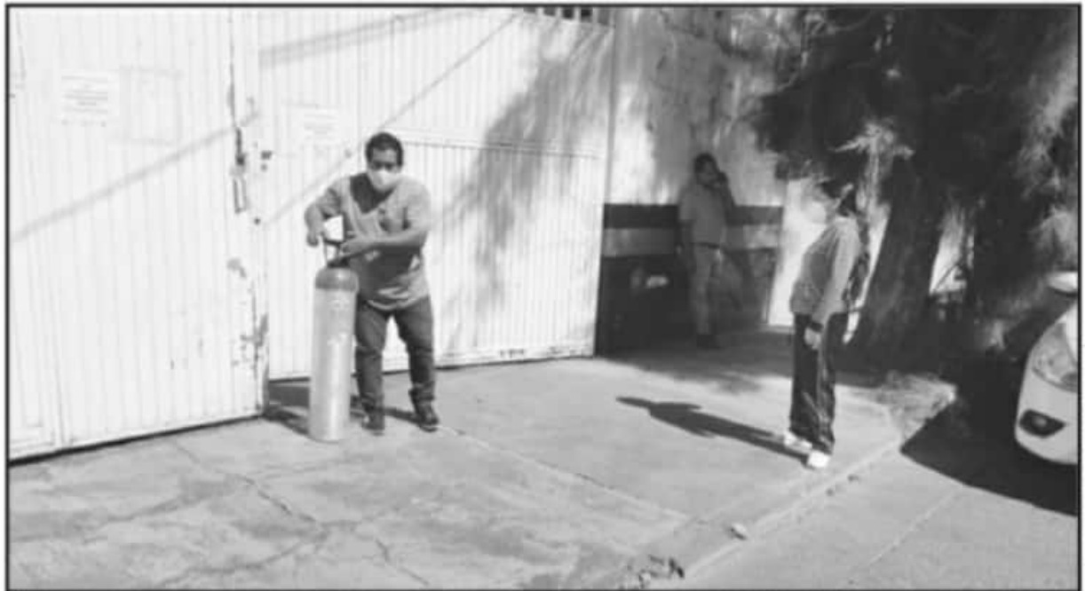
DEBIDO A LA EMERGENCIA QUE REPRESENTA LA PANDEMIA DEL CORONAVIRUS, LA EMPRESA INFRA TRABAJA LAS 24 HORAS DEL DÍA, LOS SIETE DÍAS DE LA SEMANA.

No puede haber desabasto o bien reducir la atención a particulares, pues se adaptaron a esta