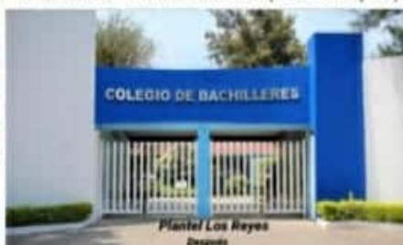
Plantel Los Reyes Después