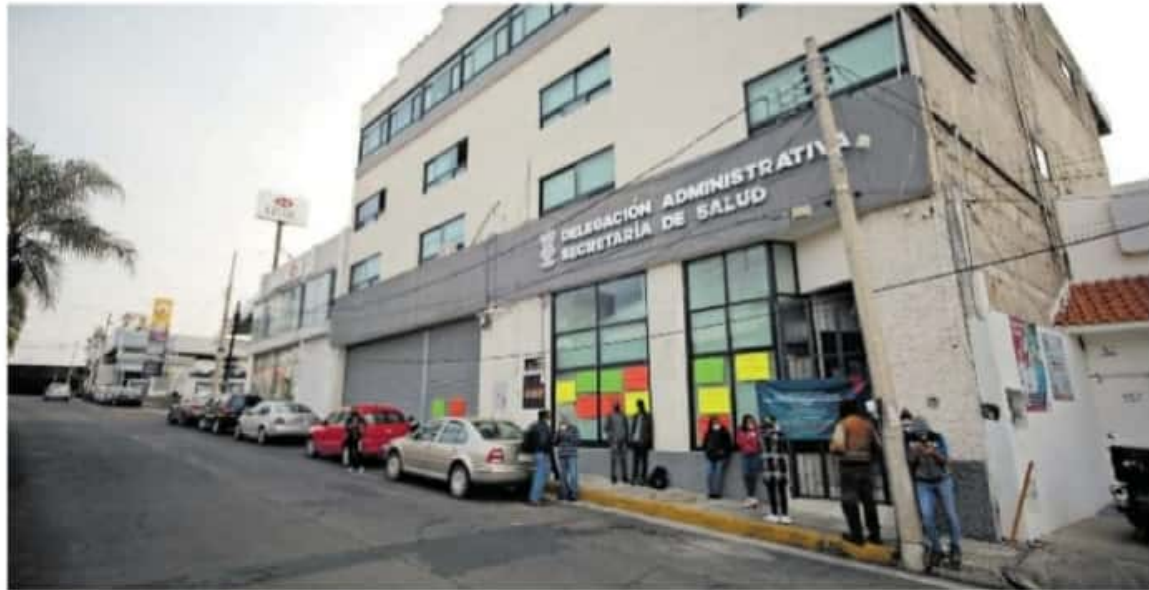
Las principales demandas son en pro de la integridad laboral.

El personal que ha sido capacitado por la Comisión Estatal para la Protección contra Riesgos Sanitarios (Coepris) ha estado presente en Argamacuero, Apatzingán, Ario de Rosales, Carácuaro, Charo, Churintzío, Ciudad Hidalgo, Copándaro, Cuicatlan, Huatamo, Iungapeo, La Huacana, La Piedad, Lázaro Cárdenas, Los Reyes, Maravatio, Morelia, Múgica, Numanán, Panindícuaro, Parácuaro, Pastor Ortiz, Patzcuaro, Puruándiro, Quiroga, Sahuayo, Salvador Escalante, Tacámbaro, Tarímbaro, Talpujahuá, Tzucán, Tzintzuntzan, Uruapan, Villa Jiménez, Yurécuaro, Zacapu, Zamora, Zináparo y Zitácuaro.