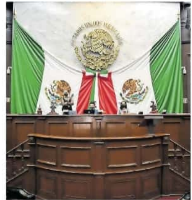
La glosa del Informe de Gobierno incluye observaciones sobre recaudación de impuestos / CONGRESO

y que pasará al pleno, también destaca que en el tema de acciones hacendarias y presupuestales para atender la pandemia provocada por el covid-19, el gobierno del estado invirtió mil 719 millones de pesos.