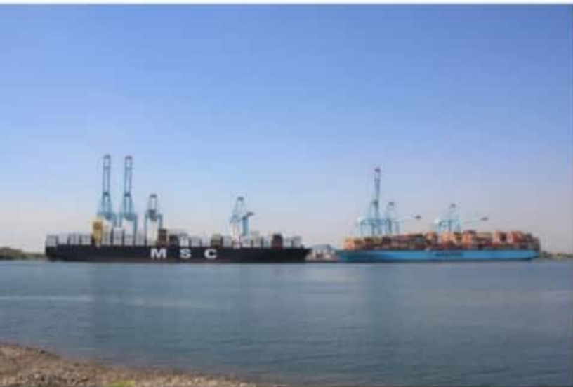
CD. LÁZARO CÁRDENAS, MICH.- El Puerto michoacano recibió dos buques de carga contenerizada de grandes dimensiones: el MaerskEssen, de bandera danesa y el MSC Aliya, con bandera de Liberia.