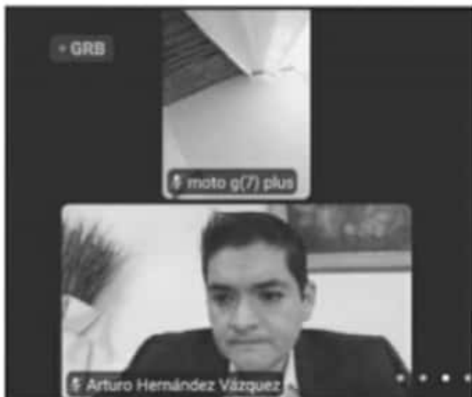
SE HIZO ÉNFASIS EN LA NECESIDAD DE QUE MICHOACANOS CONOZCAN CON CLARIDAD Y TRANSPARENCIA EL USO Y DESTINO DE RECURSOS PÚBLICOS.