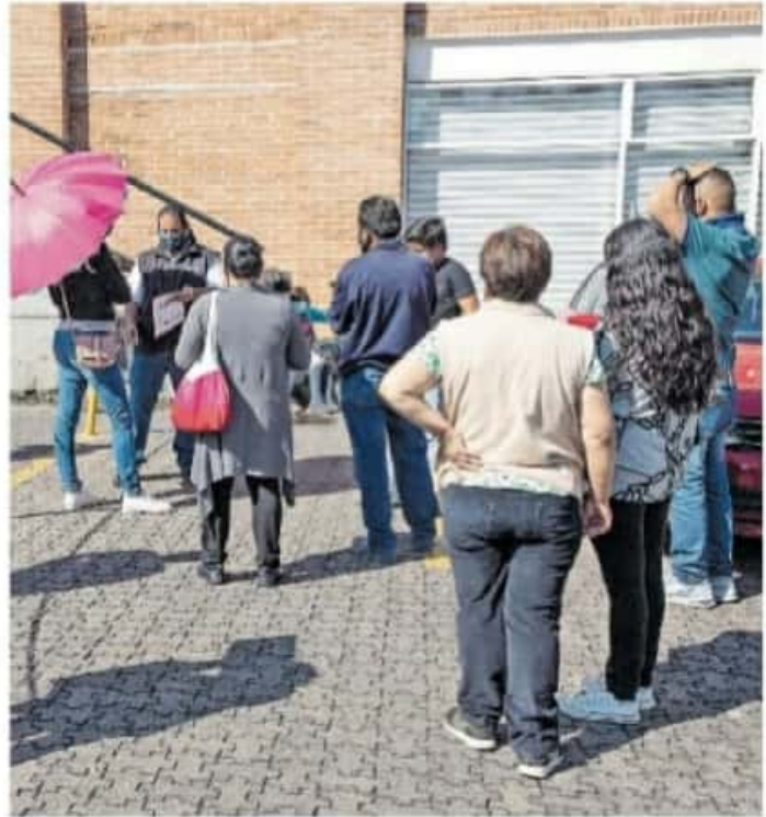
Las credenciales con vigencia de los años 2019 y 2020 serán válidas hasta el día después de la jornada electoral.

"Tendremos un dato definitivo a mediados del mes de abril, cuando ya cierre la Lista Nominal, hacia mediados de abril, tendremos la cifra definitiva para la Lista Nominal".