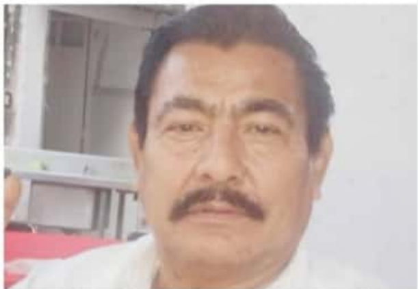
APATZINGÁN, MICH.- El ex alcalde dio a conocer su confianza en la evaluación de la que fueron objeto los precandidatos a la alcaldía.

Pero también consideró la posibilidad de otro perfil en la misma candidatura, ante lo que dijo: "yo me sumaré con todo al proyecto de mi partido, sin regatear esfuerzo alguno, para así contribuir al triunfo de la alianza "Equipo por Michoacán".