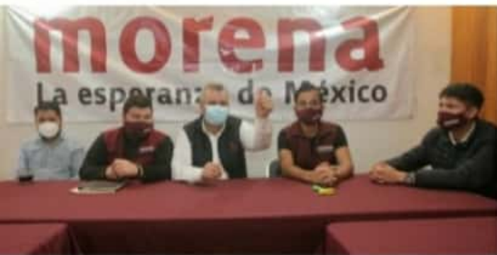
MORELIA, MICH.- El fundador de Morena subrayó la importancia de que se mantengan organizados y activos en la defensa de la 4T.

Vislumbró que mínimo ganarán en 32 municipios y reiteró "la importancia de tener mayoría legislativa federal en la Cámara de Diputados para lograr los contrapesos frente a las decisiones del Ejecutivo Federal".