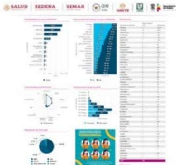
El municipio de LC registró ayer, según el CESS, cuatro nuevos casos posi-

Asimismo dio a conocer que hasta anoche había 20 enfermos de COVID-19 hospitalizados y que el número de enfermos recuperados era ya de 5,368.