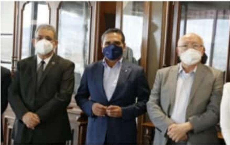
CIUDAD DE MÉXICO.- Silvano Aureoles mencionó que es importante llevar a cabo una correcta fiscalización que permita garantizar que cada peso sea aplicado con honestidad.

Por tal motivo, reiteró la estrecha colaboración de su Gobierno con la Auditoría Superior de la Federación, para contribuir a una administración pública con mejores resultados, en el que todas las dependencias y entidades, así como sus titulares, asuman su responsabilidad para dar seguimiento a los requerimientos de la Entidad Fiscalizadora Superior de México.