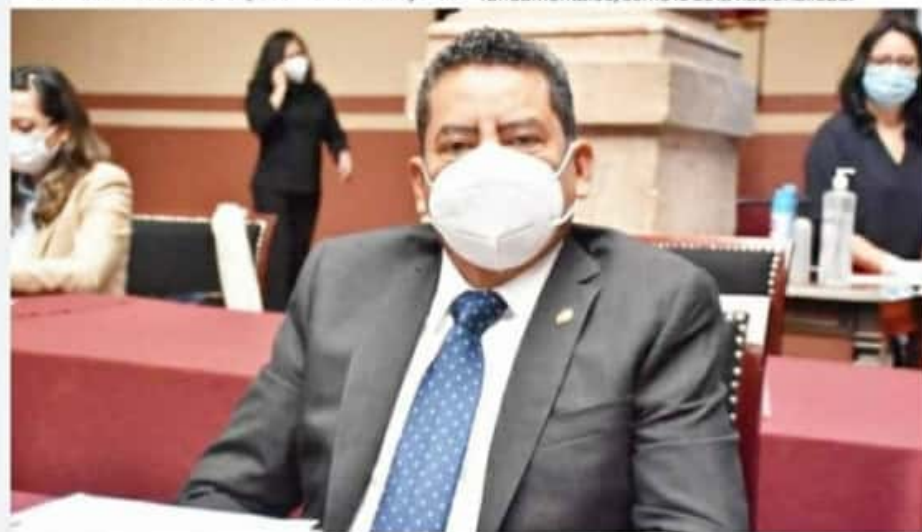
APATZINGÁN, MICH.- Se garantiza el derecho a la nacionalidad mexicana de las hijas e hijos de padres mexicanos o de madre o padre mexicanos: Custodio.