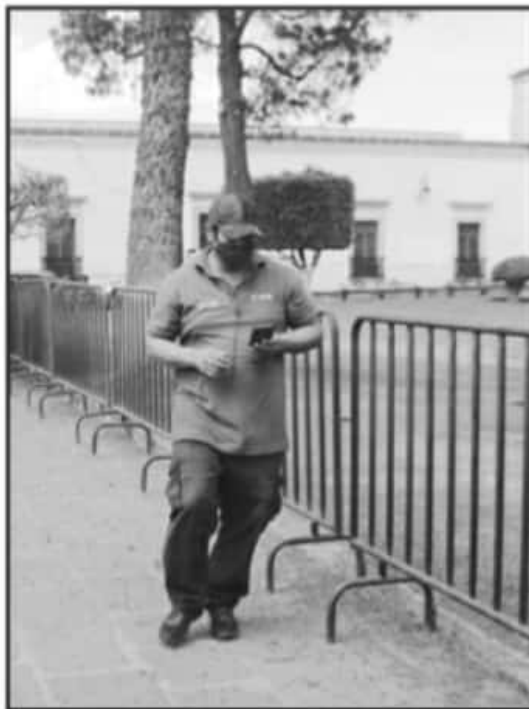
EL CIERRE DE PLAZAS Y JARDINES DE LA CIUDAD BUSCA INHIBIR LA PRESENCIA DE CIUDADANOS PARA EVITAR MÁS CONTAGIOS Y MUERTES.

dan un total de 46 mil 622 casos confirmados a la nueva cepa de coronavirus, el SARS-CoV-2.