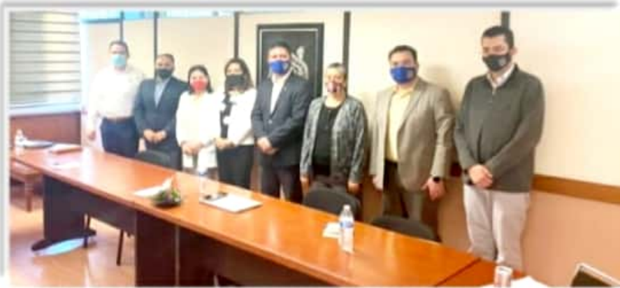
La UMSNH realiza investigaciones para una vacuna anticovid.

Por fin se escucha una de cal por las que van de arena y es más que excelente saber que hay alumnos e investigadores que le meten cerebro, ganas y corazón en bien de los michoacanos y del mundo. Ojalá que estos avances sean tomados en cuenta ¡pero de verdad y a la de ya!, por el IMSS y que los tomen en cuenta y sobre todo, ¡que les den apoyos para continuar! Son tiempos en que la vida se va en un tris y por lo tanto se debe actuar a la de ya. Estaremos pendientes de esas respuestas ante esa esperanzadora noticia, tomando en cuenta que se habla de más de 5 vacunas en el mundo, pero en la realidad, los mexicanos nomás las estamos viendo pasar. Ya ven, millones de estadounidenses se están vacunando a diario y acá, de este lado del río, todavía no nos llegan, ¿o no?... Y por supuesto que no estaría nada mala que los hombres y mujeres del billete en la entidad, apoquinaran para apoyar en esa tarea a los que están creando la vacuna y por supuesto que tampoco estaría mal, que todos los michoacanos y las