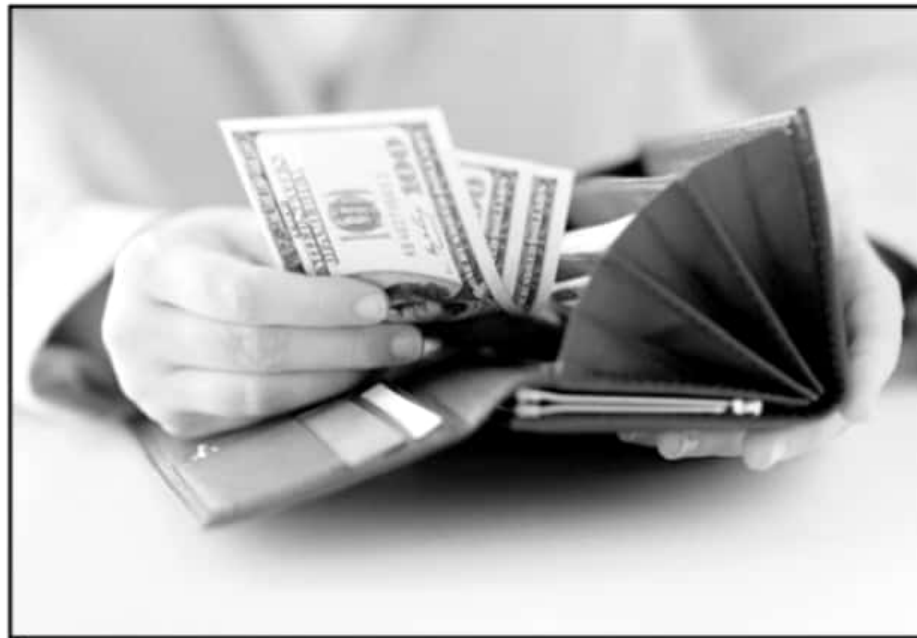
EXPERTOS PREVÉN QUE EN 2021 EL ENVÍO DE BILLETES VERDES A MÉXICO TENDRÁ UN AUMENTO DE 9.8% RESPECTO A 2020.