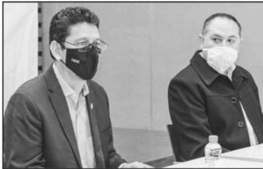
DURANTE LA REUNIÓN SE RESALTÓ LA VITAL IMPORTANCIA DE LOS TRABAJOS DE LOS ÓRGANOS COLEGIADOS.

prevalecer en los centros universitarios de trabajo, entre otros.