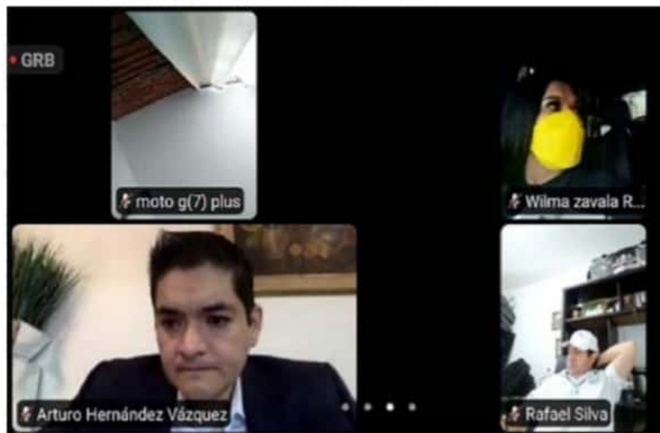
En el marco del estudio y análisis del Quinto Informe de Gobierno, comprendido de septiembre 2019 al mes de agosto del 2020, legisladores pidieron al gobierno de Silvano Aureoles informe sobre los recursos del endeudamiento contratado en 2020.

Finalmente, pidieron al Gobierno estatal, dar cuenta a esta soberanía, sobre el destino de los recursos recaudados por el impuesto al Hospedaje, en un plazo no mayor a treinta días y de conformidad a lo dispuesto en la legislación aplicable.