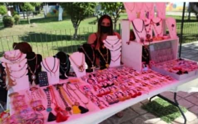
CD. LÁZARO CÁRDENAS, MICH.- El próximo sábado 13 de febrero de 16:00 a 22:00 horas en la explanada municipal se llevará a cabo el Emprendefest , manteniendo las medidas de salud.