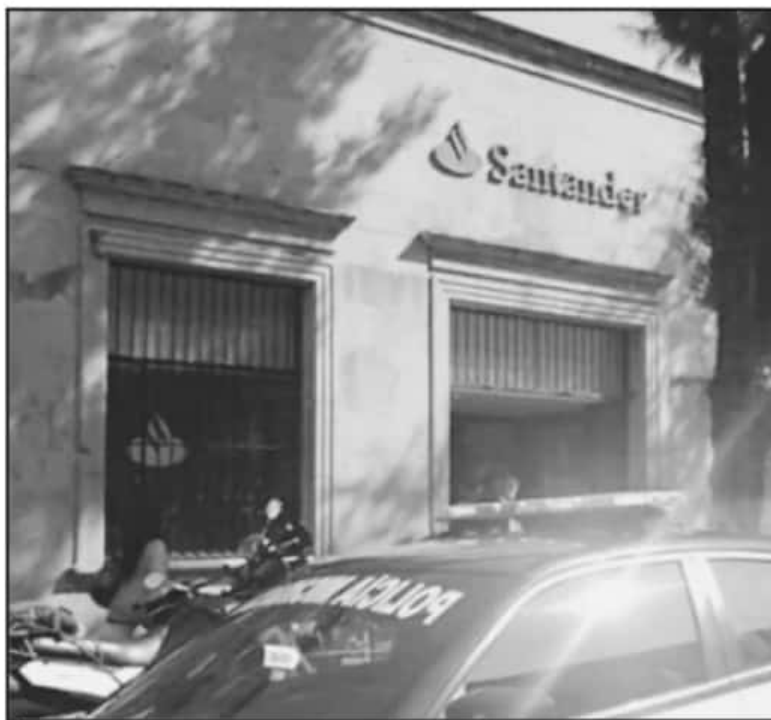
ESTE JUEVES UNA INSTITUCIÓN BANCARIA DE MORELIA FUE BLANCO DE UN ATRACO PERPETRADO POR TRES SUJETOS ARMADOS.

"El año pasado creo que tuvimos aproximadamente 15 reportes en todo el año de presencia de