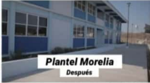
Plantel Morelia Después

siempre hay una recompensa, el trabajo extra siempre es ganar, ganar".