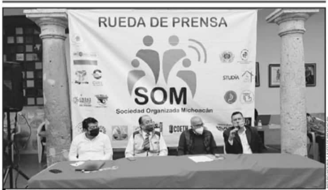
ORGANIZACIONES CIVILES DENUNCIAN OPACIDAD POR PARTE DEL PODER LEGISLATIVO; EXIGEN RETOMAR TEMA DE LA DIRECCIÓN ESTATAL DE DERECHOS HUMANOS.

putados locales. A un año de la pandemia por la enfermedad de coronavirus (COVID-19), las violaciones a los derechos humanos han sido constantes, por lo que exigen que antes de que concluya su periodo al frente del legislativo, en alrededor de medio año, dejen nombrado al nuevo ombudsperson de Michoacán.