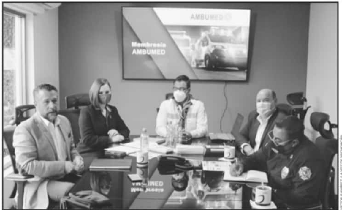
PERSONAL DE LAS CORPORACIONES DE EMERGENCIA ALZARON LA VOZ PARA QUE SE LES TOMÉ EN CUENTA EN EL PROGRAMA NACIONAL DE VACUNACIÓN

"Háiriamos un llamado a los grupos voluntarios y que tiene formación en la atención prehospitalaria a ser parte de la red y poder ser parte de ayudar a va-