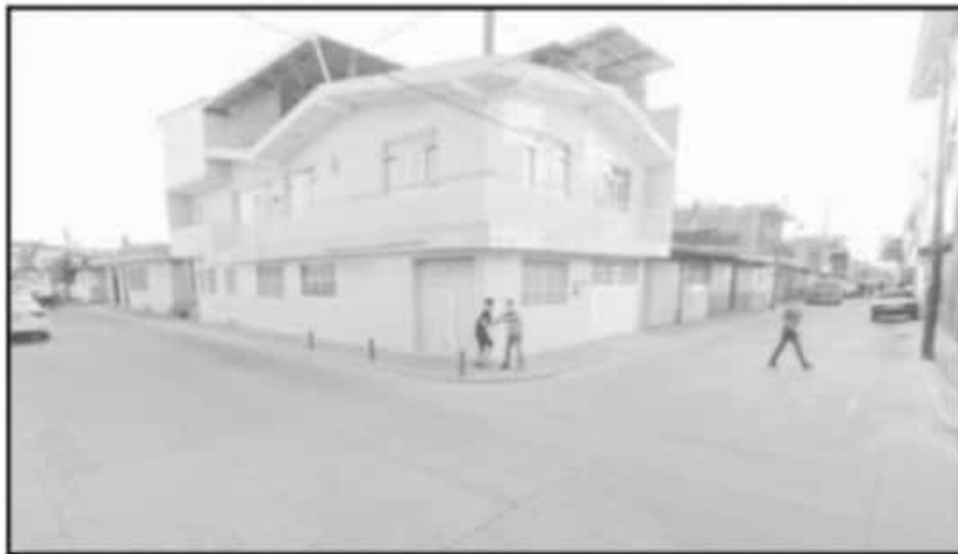
SE RAN 100 MDP DE INVERSIÓN POR PARTE DE LA AUTORIDAD MUNICIPAL EN DIVERSAS OBRAS EN EL MUNICIPIO.