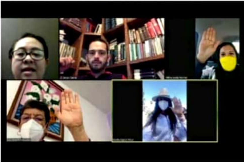
Comisión de Trabajo y Previsión Social del Congreso local, terminó la glosa del V Informe del gobierno estatal.

Agregaron que el dictamen con los resultados de la glosa será presentado ante el Pleno de la LXXIV Legislatura en los próximos días, para discusión y en su caso aprobación.