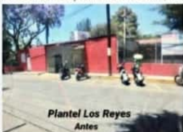
Plantel Los Reyes Antes

Por otra parte, el Cobaem fue calificado con el 100 por ciento de cumplimiento en materia de armonización contable por instancias federales y estatales.