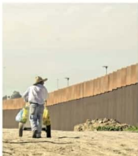
Más de 2 mil michoacanos que residen en EU ya se registraron en la plataforma.

De acuerdo al último corte, el padrón electoral del estado es de 3 millones 580 mil 241 personas, y la Lista Nominal la conforman 3 millones 528 mil 94 ciudadanos.