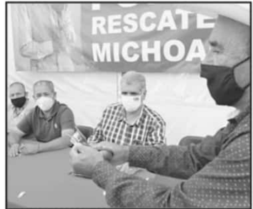
SEGUIDORES DE CRISTÓBAL ARIAS SOLIS RENUNCIARON A MORENA PARA INTEGRARSE AL MOVIMIENTO DE UNIDAD Y CONCILIACIÓN DEL DE CHURUMUCO.

ciero, por lo que instaron al rescate de Michoacán, para llevarlo a una transformación profunda a favor de todas y todos.