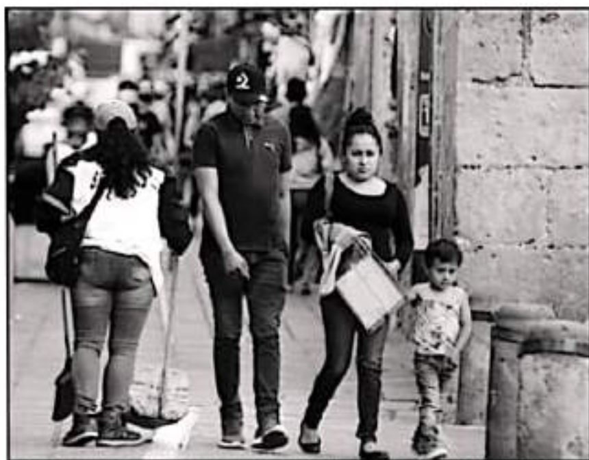
DE CONTINUAR A LA BAJA LA NECESIDAD DE CONTENER, TAMBIÉN PODRÁN REABRIR ESPACIOS DE ESPARCIMIENTO SOCIAL.

Desde inicios de septiembre, el Comité Municipal puso sobre la mesa la meta de alcanzar un descenso sin repentes como factor para reabrir espacios económicos cerrados desde hace meses.