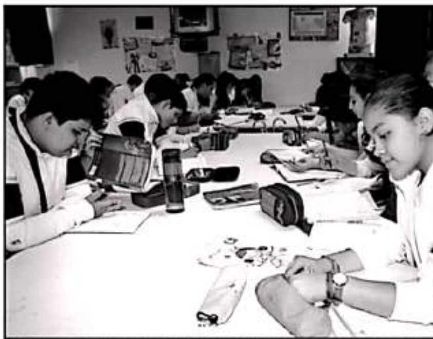
SIGLE PROMOVENDO EL GOBIERNO ESTARAL LA PARTICIPACION DE JÓVENES EN TEMAS DE INNOVACION TECNOLÓGICA.

Destacaron la participación que busca reconocer la investigación y el desarrollo científico, tecnológico y de innovación en la entidad; así como, la labor de divulgación de la ciencia y la tecnología, además de los logros en la vinculación que permiten contribuir al desarrollo de nuestra sociedad.