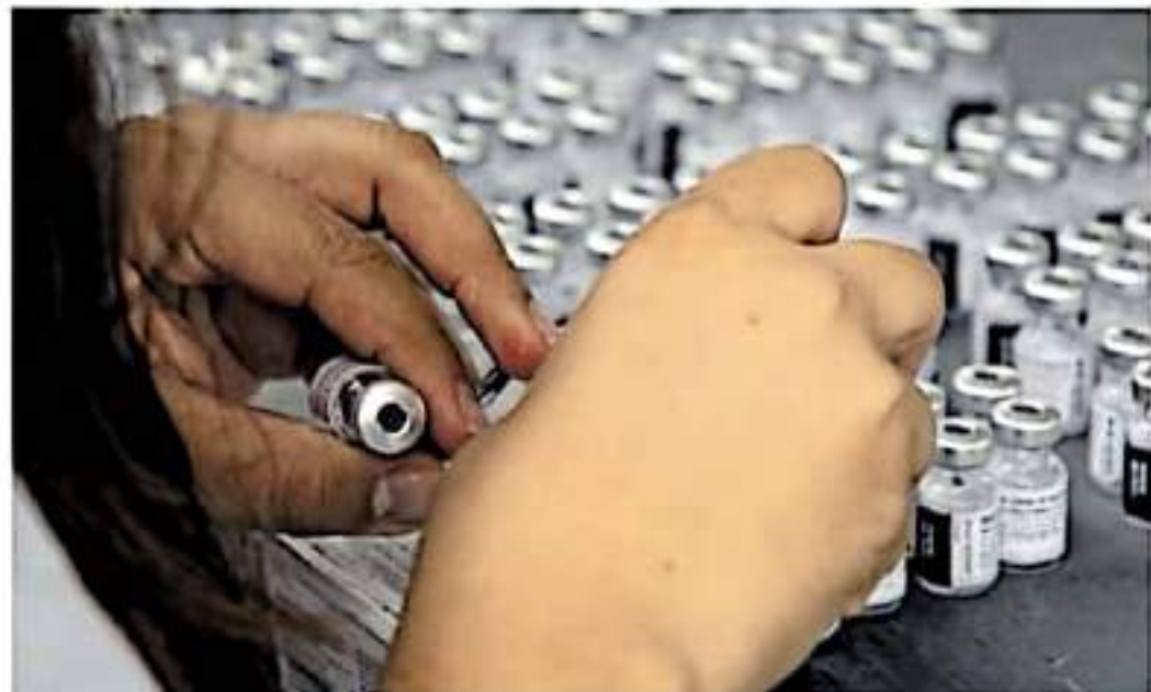
En Jarácuaro, desde septiembre pasado se insistió en la aplicación del biológico