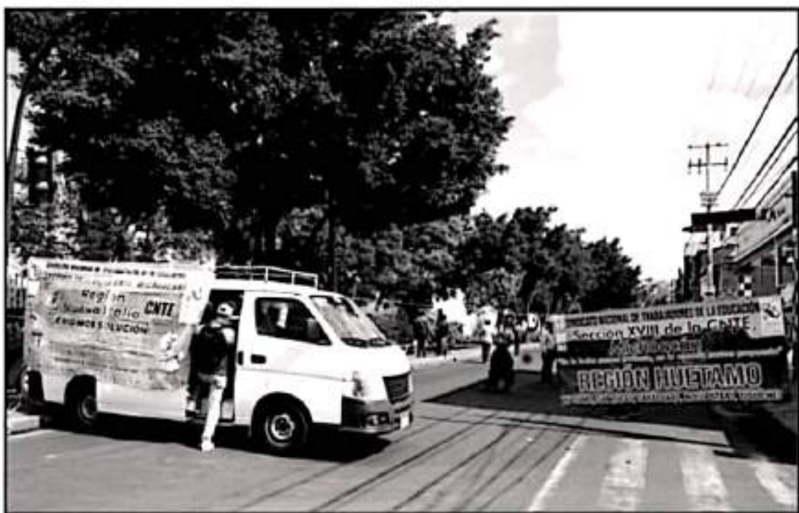
LOS ADEUDOS SALARIALES ES UNO DE LOS MOTIVOS POR LOS QUE LAS FRACCIONES DE LA CNTE SE MANTIENEN EN PARO DE LABORES EN MICHOACÁN.

Incluso existe una plataforma digital para estos fines y cumplir los reclamos de los profesores para que atiendan el ha-