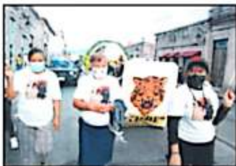
CON MANEAS CLAMORON JUSTICIA PARA LOS CAÍDOS