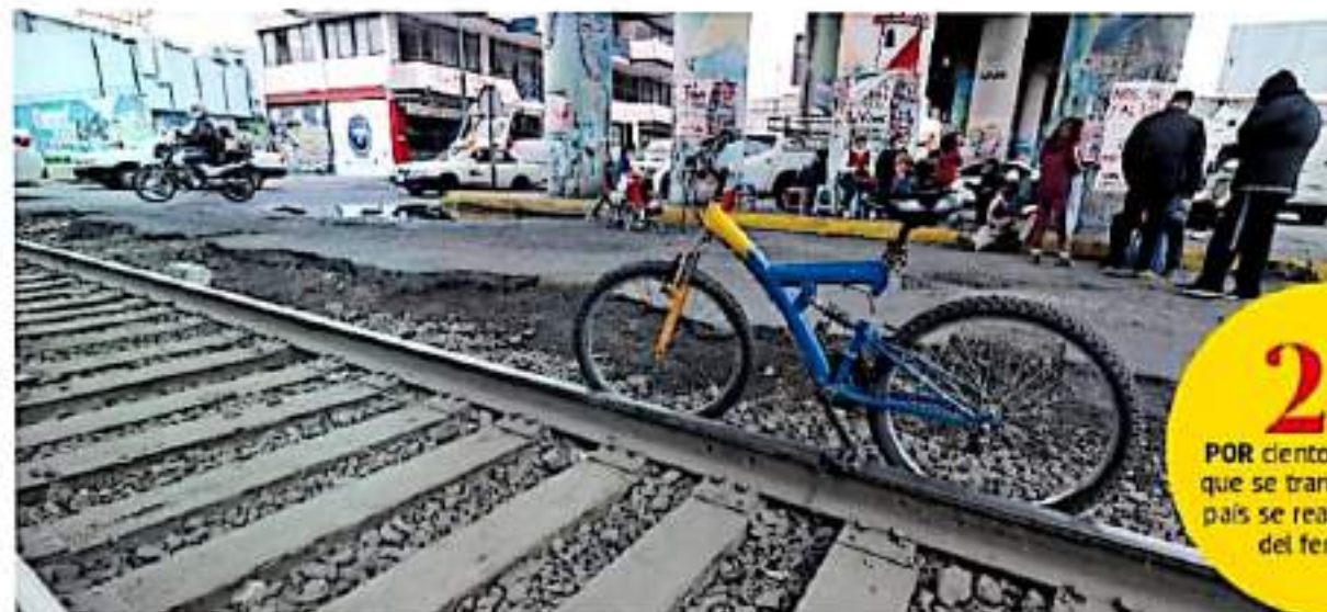
Este miércoles, personal del sector educativo realizó bloqueos viales.