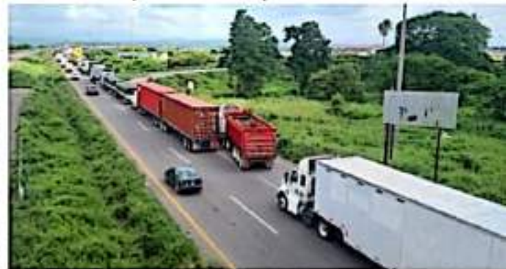
CD. LÁZARO CÁRDENAS, MICH.- Transportistas lograron acuerdos con profesores de Poder Base para permitir el tránsito de mercancías por la autopista.

■ Para poder mover mercancía del puerto, de lo contrario hubieran sido pérdidas millonarias para el sector