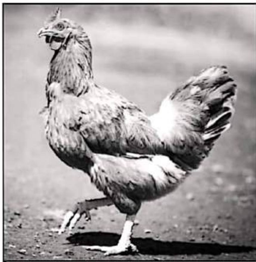
EL COMERCIO EN COMUNIDADES SE LIMITA A TENER GALLINAS ÚNICAMENTE PARA SU CONSUMO DOMÉSTICO

Uno tiene gallinas para los huevos o un caldo, pero ya nos explicaron que esto es mucho más, como imbuir de la cadena de producción y comercialización completa