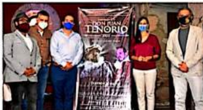
MORELIA, MICH.- La XLIV temporada de "Don Juan Tenorio" estará dedicada para honrar la memoria de uno de los máximos exponentes del teatro en Michoacán, al maestro Manuel Guízar.

Cabe señalar que a fin de garantizar la seguridad sanitaria de los asistentes, se establecieron medidas de control, como toma de temperatura y suministro de gel antibacterial durante el evento; el aforo será del 50 por ciento, es decir cupo máximo de 200 espectadores.