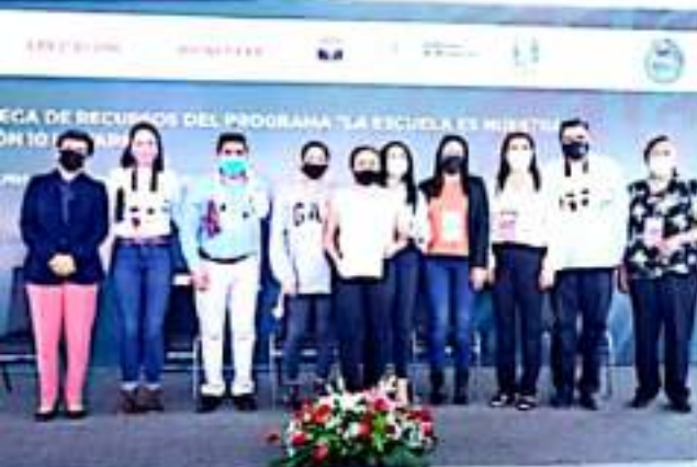
URUAPAN, MICH.- La Secretaria del Bienestar entregó ayer recursos del programa "La Escuela es Nuestra", a planteles de Uruapan y Ziracuaretiro.

En el evento, que se llevó a cabo en la ETI 30, el alcalde de Uruapan destacó que la coordinación de los tres órdenes de gobierno permite crear el bien en este municipio, y recordó que en su anterior cargo, desde la Cámara de Diputados aprobó los recursos para este programa, dirigido a escuelas de escasos recursos económicos, incluidos planteles de zonas indígenas.