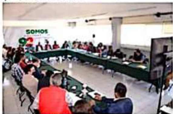
La XXIII Asamblea Nacional del PRI se llevará a cabo el próximo 11 de diciembre, de manera presencial y a distancia, en atención a los protocolos de salud, por ello en Michoacán se le da seguimiento a su desarrollo: CDE.

La convocatoria se encuentra disponible en la página electrónica del PRI Nacional en https://pri.org.mx/ElPartidoDeMexico/Convocatorias/ConvocatoriasNacionales.aspx y en la del PRI Michoacán https://www.primichoacan.org/nacionales .