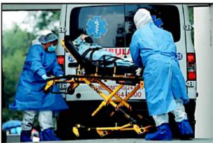
AUMENTAN IMPLAZADO A CEDER CONTAGIOS DEL CORONAVIRUS. AUMENTA LA INCIDENCIA DE MUERTES EN EL ESTADO

A pesar de que se tienen solicitudes para la aplicación de una jornada para rezagados en las distintas regiones, lo anterior dependiera de los tiempos y de la disponibilidad nacional de las vacunas, aunque ya las autoridades estatales y la propia Delegación del Bienestar trabajan para lograr atraer más dosis a la entidad.