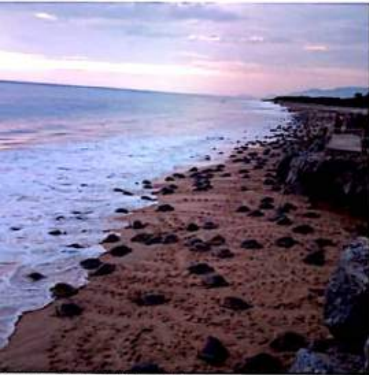
CD. LÁZARO CÁRDENAS, MICH.- Punta Ixtal, campamento tortuguero en playa Ixtapilla en Aguila, registró la pérdida de entre 5 a 10 millones de huevos de tortuga marina durante la temporada de lluvias.

Explicó que entre 5 a 10 millones de huevos de tortugas marinas se vieron afectadas por el fuerte oleaje de las tormentas que pasaron por la Costa Michoacana y que dejaron al descubierto miles de nidos, lo cual se traduce en grandes pérdidas de futuras crías, no obstante se mantienen con la esperanza de que aun así lograr buenos resultados al final de la temporada de anidación 2021-2022 de la tortuga marina en esta playa.