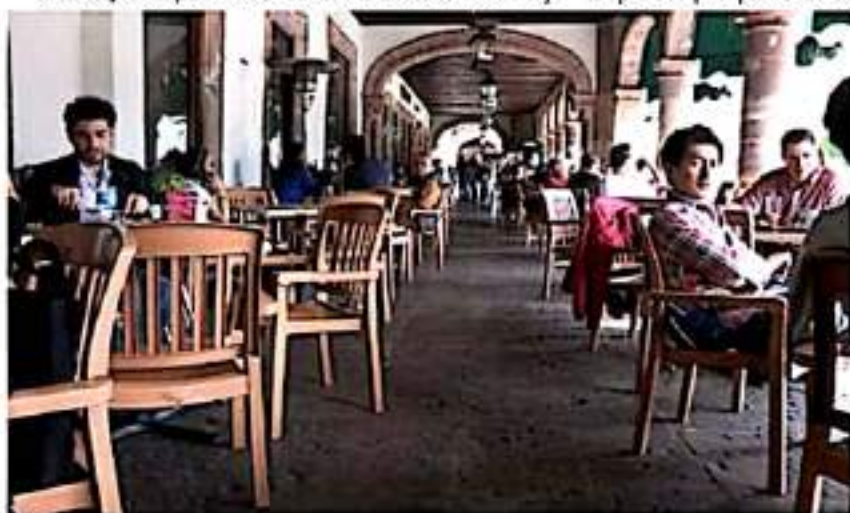
Restaurantes de Morelia, con la presentación del certificado de vacunación Covid-19, ofrecen descuentos en el consumo.

Morelia, Mich., 14 de octubre de 2021.- Una baja respuesta por parte de la