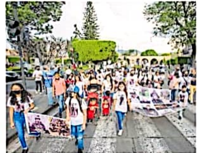
En la conmemoración participaron hijos y viudas de los policías asesinados

"Hablé con él, el domingo en la noche, horas antes de su muerte. A las 8 de la mañana del día siguiente recibí una llamada