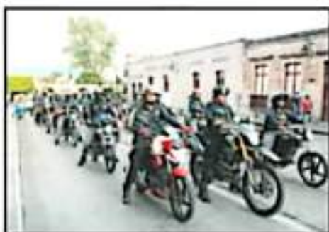
AGENTES CAÍDOS FUERON RECORDADOS POR SUS COMPAÑEROS