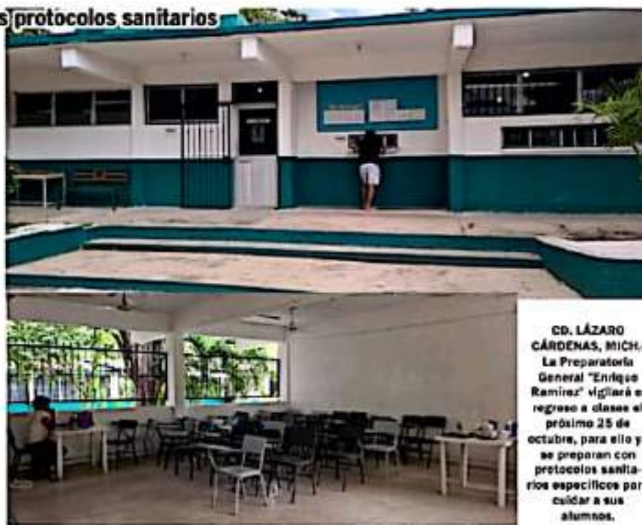
CD. LÁZARO CÁRDENAS, MICH.- La Preparatoria General "Enrique Ramírez" vigilará el regreso a clases el próximo 25 de octubre, para ello y se preparan con protocolos sanitarios específicos para cuidar a sus alumnos.

"El primer filtro será desde casa con los padres de familia, el segundo filtro se aplicará en la entrada de la escuela con la aplicación de gel antibacterial y revisión de temperatura, el tercer filtro será en el salón de clases, donde el profesor estará encargado de vigilar el uso continuo de gel y de respetar medidas sanitarias".