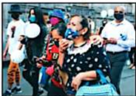
A DOS AÑOS DE HECHO, EL DOLOR DE LUTO SIGUE PRESENTE