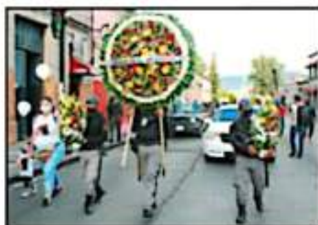
EN SU RECORDADO CARGARON VELAS Y OFERTAS FLORALES

DEUDOS SE MANIFIESTAN EN MORELIA SUS FAMILIARES