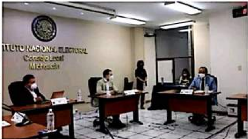
El Magistrado Presidente Salvador Pérez Contreras, presentó el micro sitio TEEM INFANTIL JUVENIL que se abrió hace unos días a través del cual se promueve la Consulta impulsada por el INE.

próximo mes, se despliegue en todo el estado y así escuchar la opinión de las niñas, niños y adolescentes.