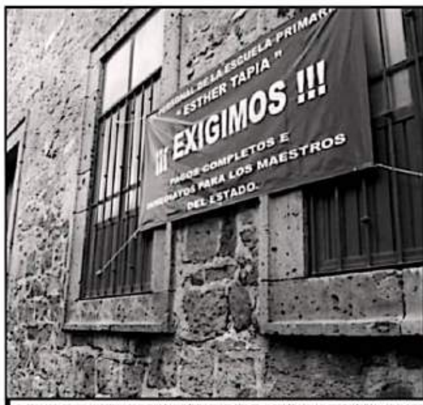
EL PELIGRO DE LOS MAESTROS ES QUE SI PAGAN TODO COMPLETO, DE LO CONTRARIO NO COMENZARÁN LAS CLASES

La fracción docente descarta que haya un nuevo escenario de impago y por lo menos hasta el cierre de esta edición no se ha tenido información sobre la distribución prevista a los trabajadores a través