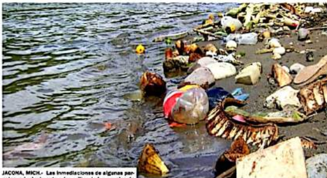
JACONA, MICH.- Las inmediaciones de algunas parcelas, principalmente a las orillas de los canales de riego se han convertido en recipientes de todo tipo de basura.

que se genera en las colonias y fraccionamientos que se asientan en las riveras de estos conductos hidráulicos.