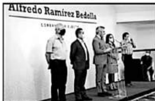
EL GOBERNADOR DESTACÓ QUE SE REVISARÁ EL PROYECTO CON EL QUE SE BUSCARÁ MEJORAR LA CONDICIÓN DE VIDA DE FAMILIAS MICHOACANAS.