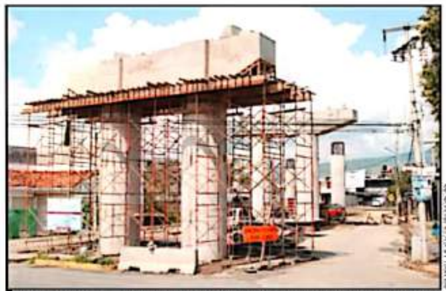
HAY RIESGO DE SUBSERVICIO QUE OBLIGARÁ A DEVOLVER EL RECURSO SI ESTE NO FUE EJECUTADO EN TIEMPO Y FORMA.

En poco más de 45 días de gobierno, las irregularidades en ma-