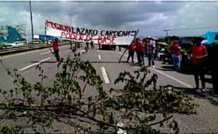
CD. LÁZARO CÁRDENAS, MICH.- Maestros de Poder de Base, grupo radical de la CNTE, realizan un bloqueo carretero en varios puntos de Michoacán, en protesta a los adeudos salariales que mantiene el Gobierno del Estado.