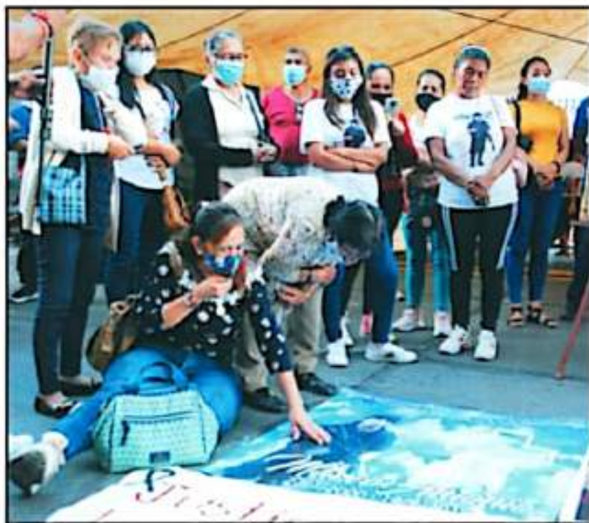
SE LEYÓ POSICIONAMIENTO POR PARTE DE LOS DEUDOS DE LOS OFICIALES CAÍDOS EN EL CUMPLIMIENTO DE SU DEBER.