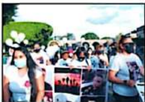
SE REUNIERON CERCA DE LA FUENTE DE LAS TARASCAS