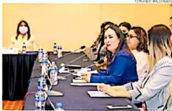
La dirección del DIF expuso que espera solventar los pendientes financieros urgentes con los recursos que actualmente tienen.

Además de acuerdo a un reporte emitido por dicha dependencia, están pendientes de pago 2.7 millones de pesos por