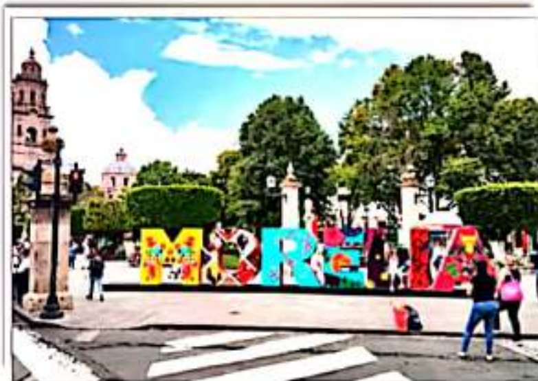
Morelia se pinta de colores.