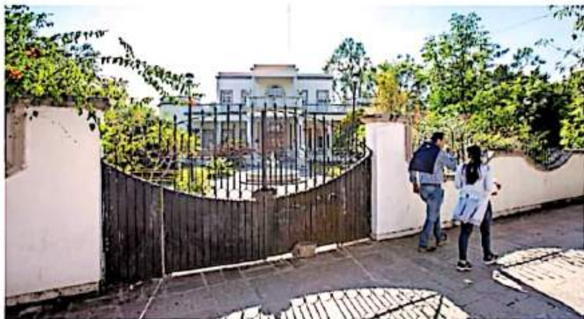
Uno de los contratos es por el monto de 695 millones de pesos para la renta de 88 camionetas

SEÑALAN ONEROSO GASTO EN RENTA DE VEHÍCULOS