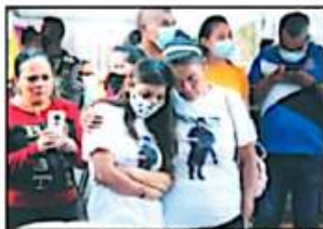
ACUSAN A LA FISCALÍA DEL ESTADO DE NO TENER DETENIDOS