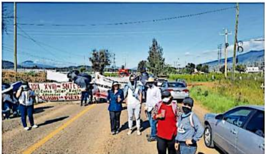
El magisterio desplegó lonas y pancartas para realizar el cierre carretero.

LES ADEUDAN CINCO QUINCENAS Y PRESTACIONES