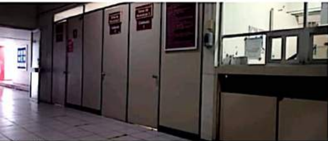
CD. LÁZARO CÁRDENAS, MICH.- La falta de insumos en las clínicas del IMSS está repercutiendo en la salud de muchos

Cabe señalar que se pudo conocer que tampoco se puede donar sangre en las clínicas del IMSS de Morelia ni de Uruapan para que sea traída a esta ciudad, ya que afirman tampoco tienen material indispensable para ello.