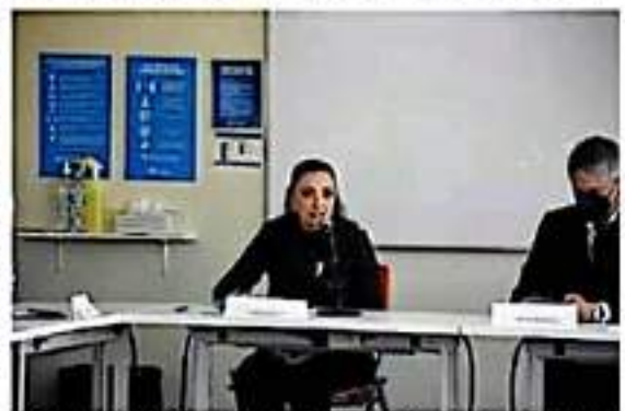
El Congreso del Estado participó en Mesa Ciudadana de Seguridad y Justicia Región Morelia.

Por ello, dijo, para la LXXV Legislatura será una prioridad la revisión de la eficacia de todas aquellas políticas que se generen en este rubro.