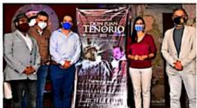
MORELIA, MICH.- La XLIV temporada de "Don Juan Tenorio" estará dedicada para honrar la memoria de uno de los máximos exponentes del teatro en Michoacán, al maestro Manuel Guízar.

Cabe señalar que a fin de garantizar la seguridad sanitaria de los asistentes, se establecieron medidas de control, como toma de temperatura y suministro de gel antibacterial durante el evento; el aforo será del 50 por ciento, es decir cupo máximo de 200 espectadores.