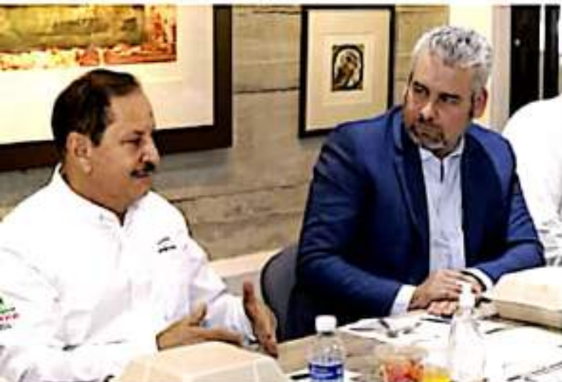
URUAPAN, MICH.- Ramírez Bedolla anticipó que se proyecta para Michoacán una subsecretaría enfocada al T-MEC que funcionará como parte de la Sedeco.