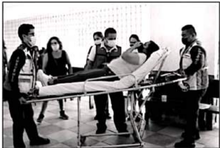
EN MAYO, MAESTROS DE PODER DE BASE ASALTARON CON VIOLENCIA EL INCEPY Y GOLPEARON A UNA MAESTRA.