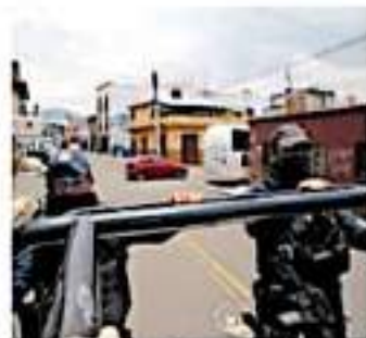
Los agentes realizaban patrullajes por la colonia Libertad