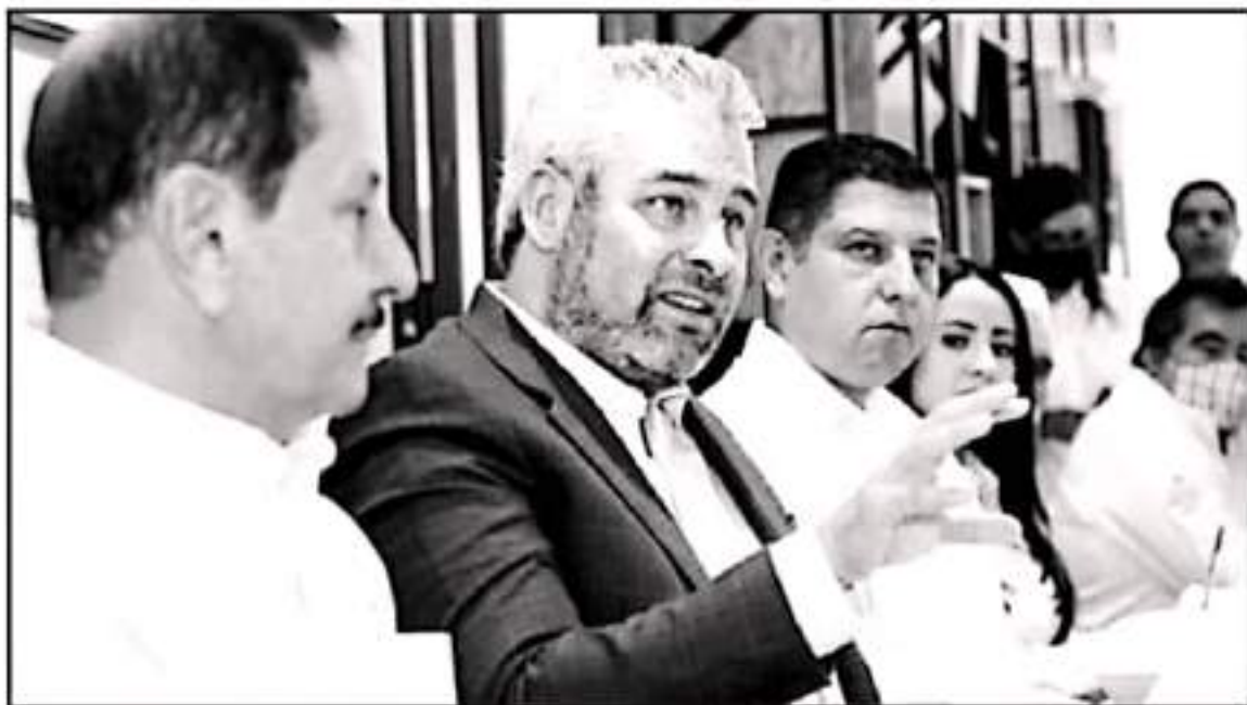
LOS PRODUCTOS DEL AGRO MICHOACANO, ENTRE LOS QUE SE DESTACA EL AGUACATE, SON UN TEMA IMPORTANTE EN NEGOCIACIONES CON EUA, DIO RAMÍREZ

ciación de Productores, Empacadores y Exportadores de México (APEAM), recordó el importante papel de Michoacán en la producción agrícola, siendo la entidad líder a nivel nacional y el único estado certificado por el USDA (Departamento de Agricultura de EUA) para exportar aguacate.