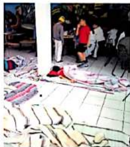
Por cada uno de esos anexos el gobierno paga entre 7 mil 500 y 8 mil pesos mensuales. (MEXICO)