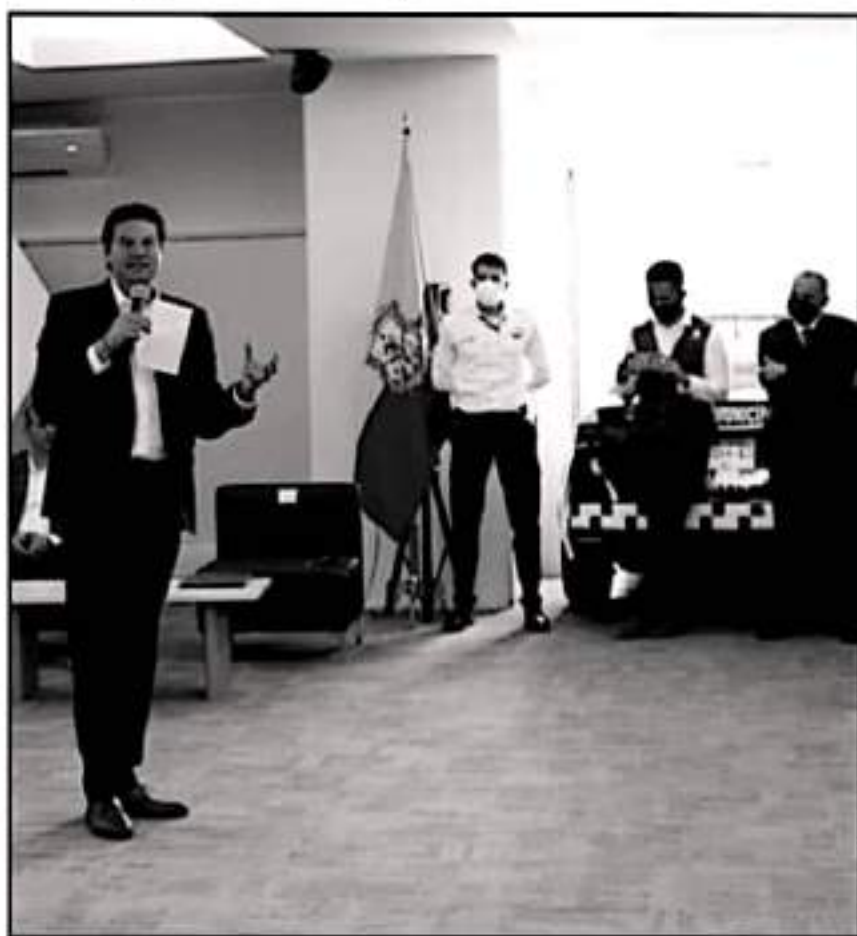
EL OBJETIVO EN CUANTO A CRECIMIENTO POLICIAL TRABAJA LA ADMINISTRACIÓN 2021-2024 SERÁ LLEGAR LOS MIL ELEMENTOS

"Lo que tenemos que hacer es retomar lo que se dejó de hacer para que se pongan a funcionar los