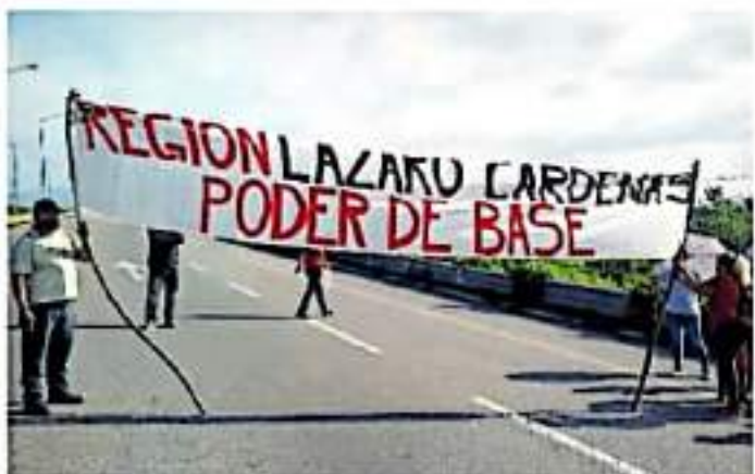
Amagaron con crear presidencias municipales.

Con dos horas de atraso, el magisterio desplegó lonas y pancartas para realizar el cierre carretero, que afectó a automovilistas que circulaban en los puntos ya mencionados. En el caso de Huacana, integrantes de Poder de Base tomaron el Centro Integral de Servicios