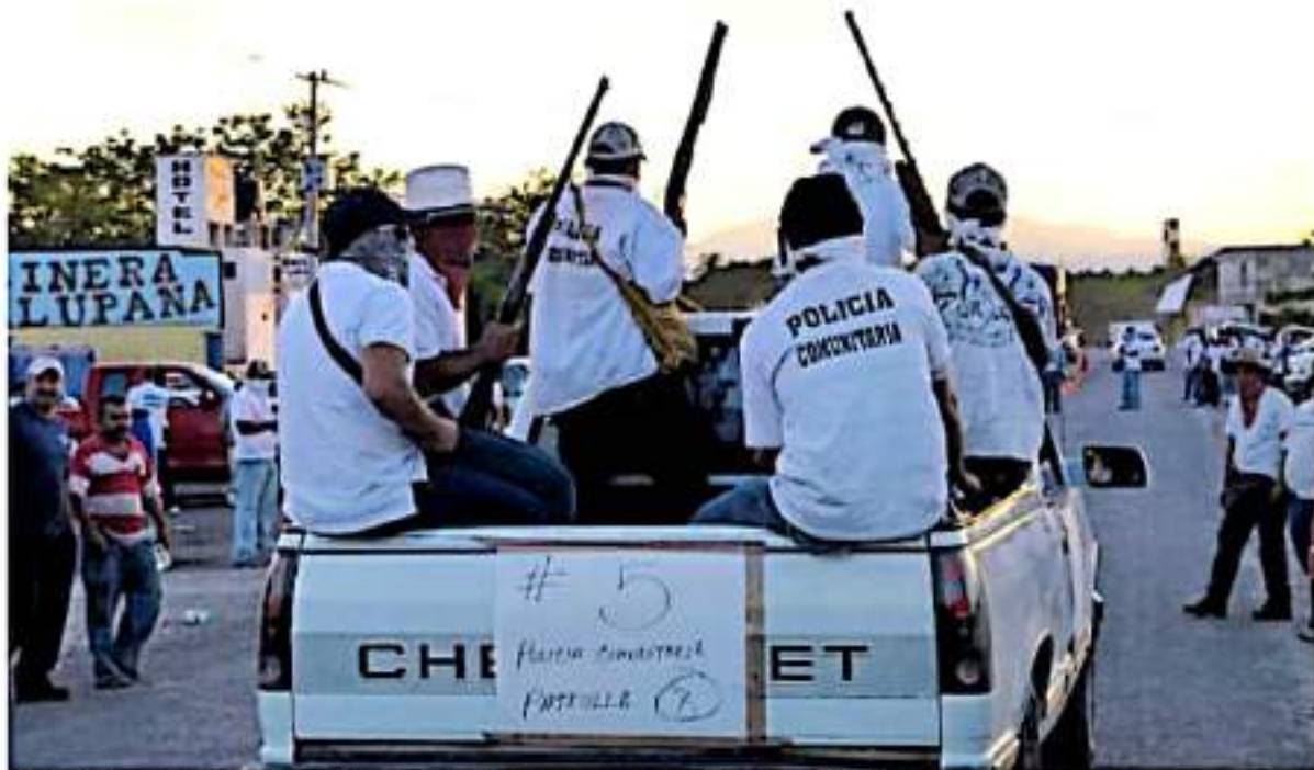
A través de cuentas de twitter se comenta que los cinco personas eran miembros del CING

MATAN A CINCO PERSONAS Y HIEREN A DOS ELEMENTOS DE LA GN