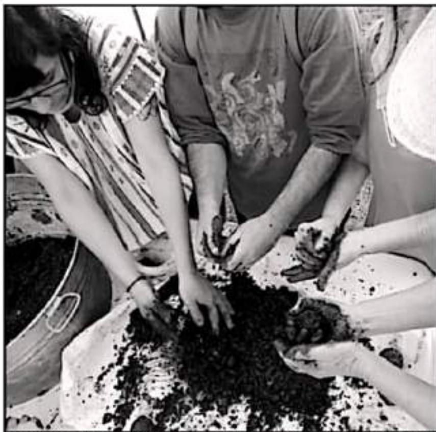
LA IDEA ES COMENZAR SOBRE LA PROBLEMÁTICA AMBIENTAL EN UN MUNICIPIO TAN DE TERREMOTO COMO PÁTZCUARO.

Otra de las motivaciones para participar en la Huelga fue el reciente corte de varios árboles en la antigua entrada a Pátzcuaro para construir una glorieta que con esta medida se concluye por el cambio de autoridades municipales. "En la ciudad, en la entrada, tumbaron unos árboles y para nosotros fue algo muy triste. Entonces en este grupo hacemos varias cosas y una de las cosas que nos interesan es participar en este evento que es mundial,