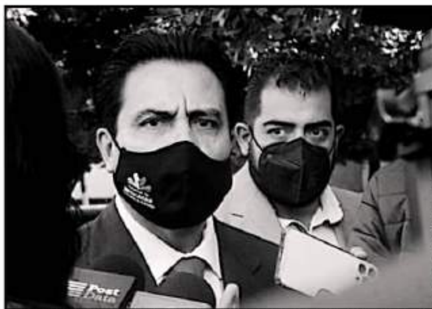
EL SECRETARIO DE GOBIERNO AFIRMA QUE SE ASUMIRÁ LA RESPONSABILIDAD CONSTITUCIONAL PARA SEGUIR EL PROCESO

Tras las diferencias entre gobierno entrante y saliente que dieron como resultado la interrupción interinstitucional de las mesas, el encargado de la política interna de la entidad reconoció que se debe de poner