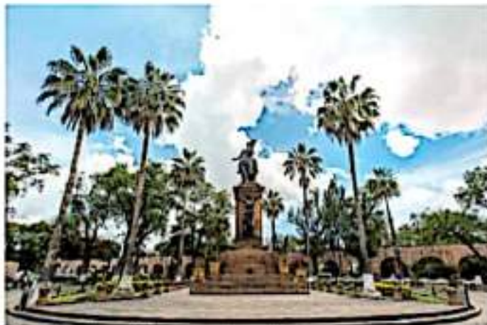
Aún está pendiente el formato en el que se hará el evento conmemorativo del nacimiento del 'Siervo de la Nación'.