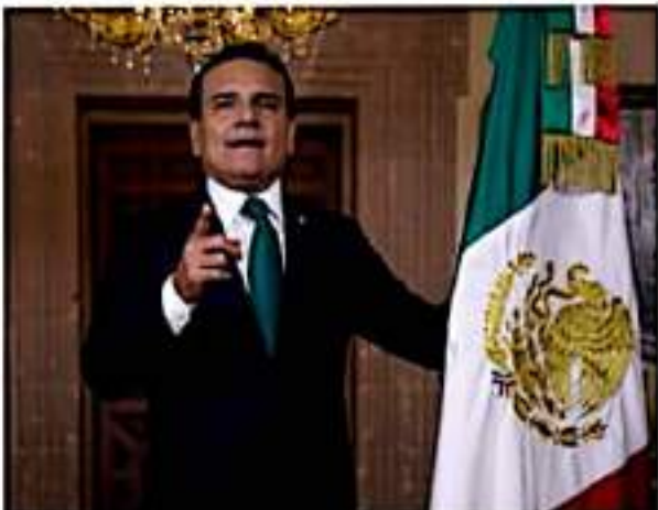
MORELIA, MICH.- Con un cambio al formato del tradicional Grito de Independencia, Silvano Aureoles Conejo, gobernador de Michoacán, hizo un reconocimiento a los héroes y heroínas quienes han estado en la primera línea de batalla en contra del Covid-19.

¡Qué viva México! ¡Qué viva Michoacán! ¡Qué viva Morelia! ¡Qué viva Hidalgo! ¡Qué viva Josefina Ortiz! ¡Qué viva Ignacio López Rayón! ¡Viva México! ¡Viva México! ¡Viva México!, concluyó.