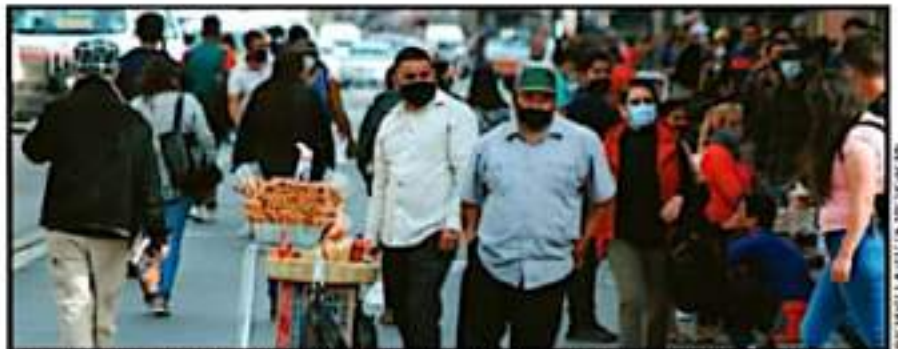
AGLOMERACIONES SE ESTÁN NORMALIZANDO DE NUEVO EN EL CENTRO, ESPECIALMENTE ANTE LOS PLANTONES

Sin embargo, las autoridades mantienen el llamado a toda la población, vacunada o no, para que no relajen las medidas de prevención contra el virus, pues la circulación de nuevas variantes y la próxima temporada de frío son las principales amenazas de sufrir una cuarta ola de contagios.