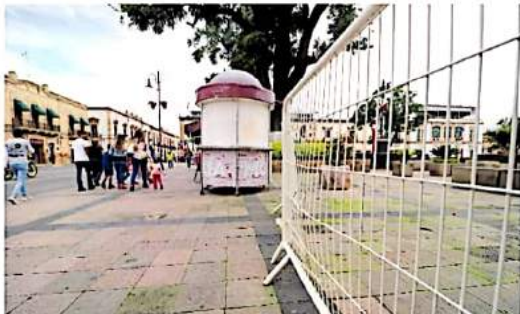
De acuerdo al reporte de las autoridades, en toda la entidad no hubo incidentes mayores.

EN INDAPARAPEO 300 PERSONAS ATESTIGUARON EL GRITO