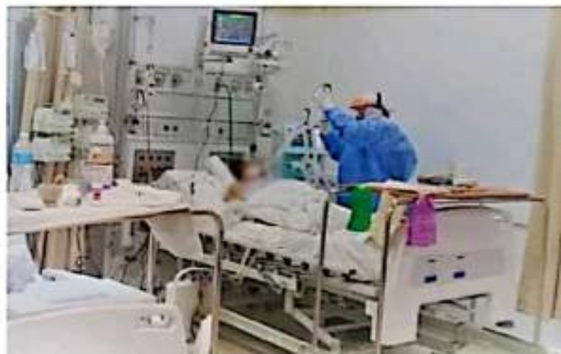
CD. LÁZARO CÁRDENAS, MICH.- Con el 75 por ciento, las unidades médicas del sector privado en Lázaro Cárdenas son las que registran mayor ocupación de camas reconvertidas para la atención de pacientes Covid-19.

Asimismo, mantiene a disposición de la ciudadanía el 800-123-2890 con 11 líneas para resolver todas sus dudas médicas, así como el micrositio bit.ly/MichCOVID-19 , donde encontrar toda la información del padecimiento.