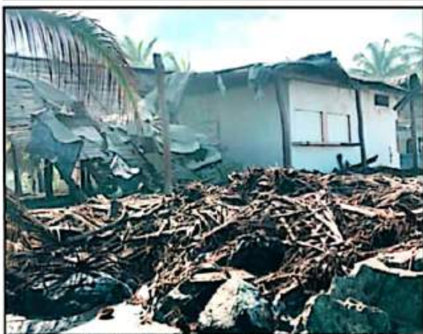
LOS DAÑOS MÁS SEVEROS REGISTRADOS EN LA ZONA PLAYERA OCURRIERON CON EL ARRIBO DE LA BORRASCIA ENRIQUE

gistrados en la zona playera de esta región ocurrieron con el arribo de la tormenta Enrique, que pasó por esta zona del Pacífico en junio pasado, ocasionando mar de tormenta que erosionó de manera sustancial las playas llegando a dañar de manera severa a varias entramadas y viviendas de los prestadores de servicios.