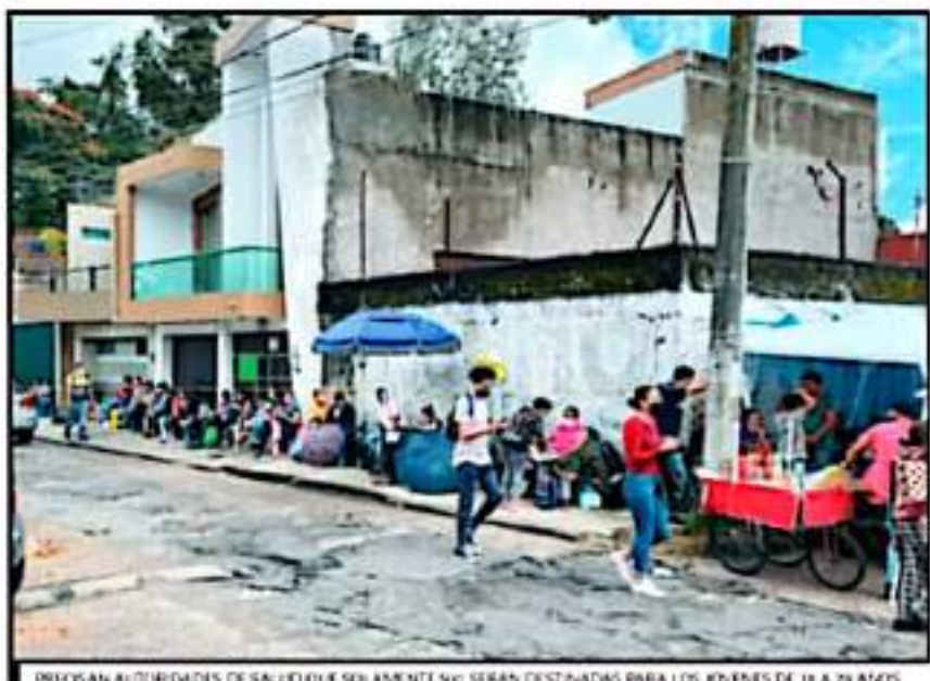
PRECISAN AUTORIDADES DE SALUD QUE SOLAMENTE SERÁN DESTINADAS PARA LOS JÓVENES DE 18 A 29 AÑOS.

deportiva, esta cantidad de 3 mil vacunas que se han destinado para aplicarse este viernes definitivamente será insuficiente, pues estimaron que son más de 30 mil los uruapenses que faltan por ser vacunados, sobre todo por la falta de vacunas para los rezagados.