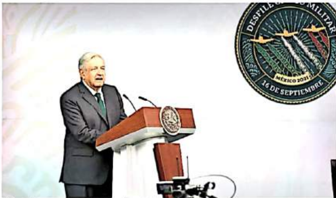
El formato del evento por la visita del Presidente dependerá del número de contagios.