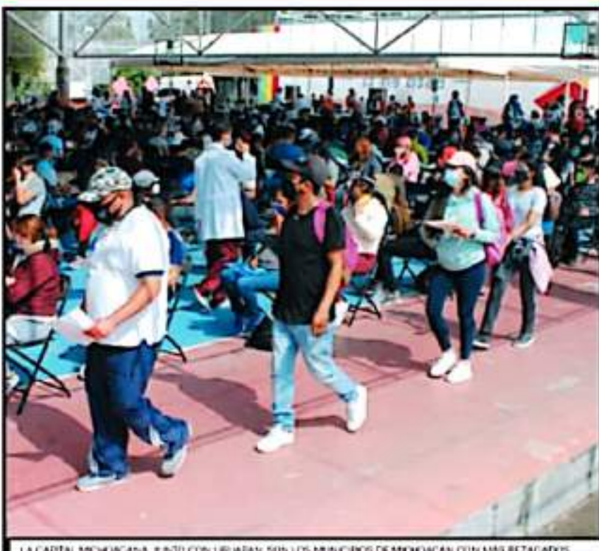
LA CAPITAL MICHOACANA, JUNTO CON URUAPAN SON LOS MUNICIPIOS DE MICHOACÁN CON MÁS REZAGADOS.