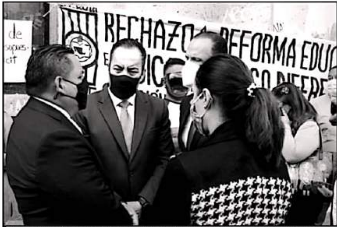
EL EQUIPO POR MICHOACÁN MANTIENE LA ALIANZA PARA MAYORITAR A MORENA Y EL PARTIDO DEL TRABAJO. IBE SUMAN CINCE DIPUTACIONES