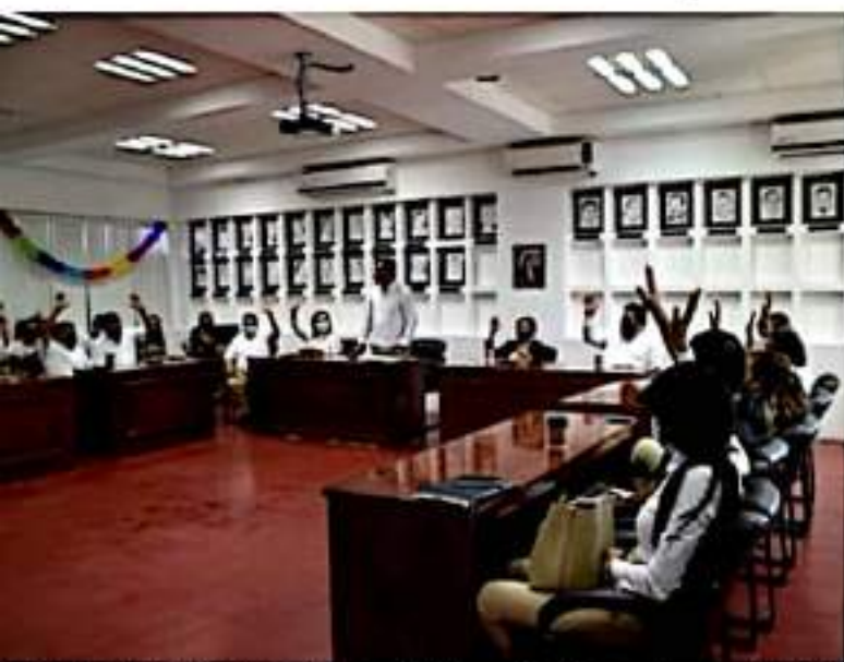
CD. LÁZARO CÁRDENAS, MICH.- El Órgano de Gobierno Municipal aprobó por unanimidad la convocatoria para la designación del contralor o controlora municipal.