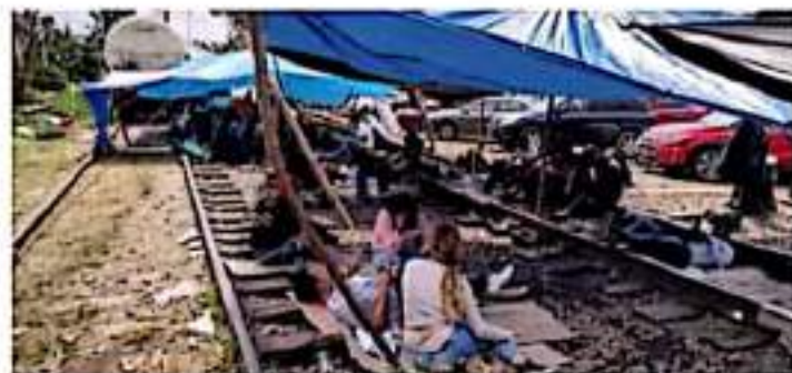
Boqueos. En 2021 romperia Michoacán cifra histórica por estos delitos.

Récord. En 2020 la entidad registró 384 de estos delitos, cifra récord si se contrasta con los datos de enero-diciembre de 2012 al mismo periodo de 2019