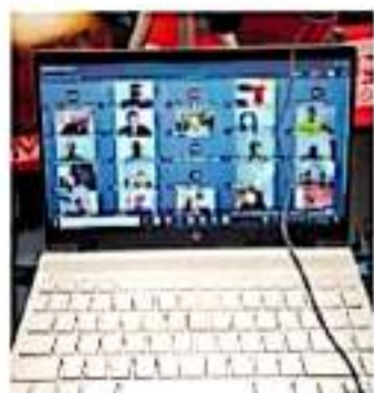
El pacto se realizó de forma virtual.

Serrato Juárez puntualizó que el compromiso educativo de nivel profesional es alto en la institución, lo que se refrenda con el proceso de formación de nivel pro-