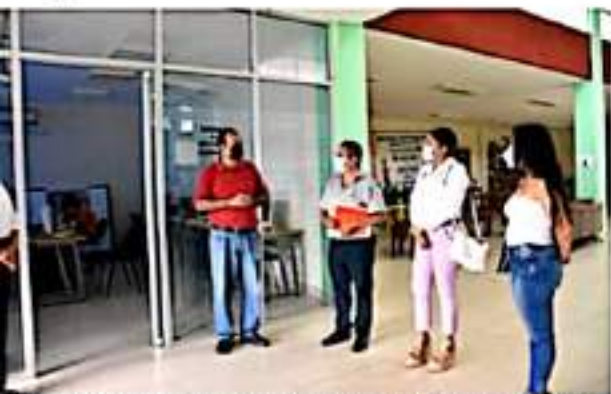
CD. LÁZARO CÁRDENAS, MICH.- El departamento de Bibliotecas Públicas Municipales puso en marcha las salas de cómputo e internet en los recintos.