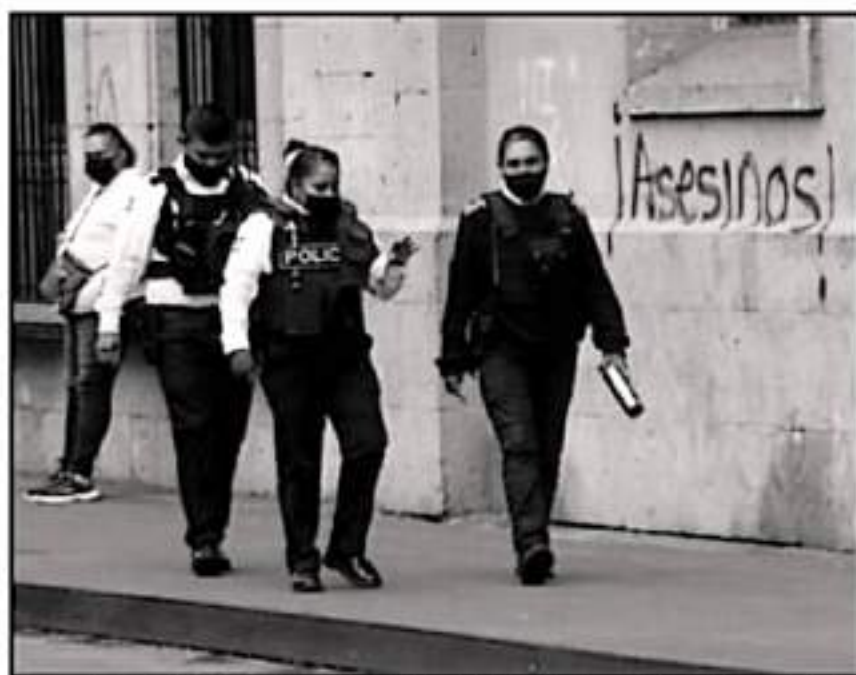
FALTA CAPACITACIÓN DE LOS ELEMENTOS MUNICIPALES PARA ATENDER LAS ÁREAS DE PROXIMIDAD EN LA CAPITAL