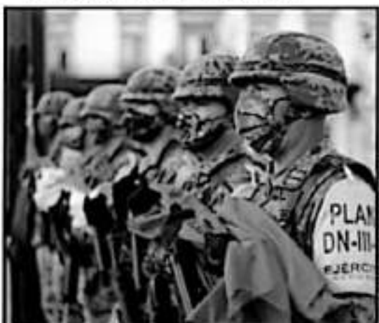
NUEVAMENTE FUE UNA CONMEMORACIÓN EN LA QUE SE EXTRAÑÓ EL TRADICIONAL DESFILE, SUSPENDIDO POR SEGUNDO AÑO CONSECUTIVO.