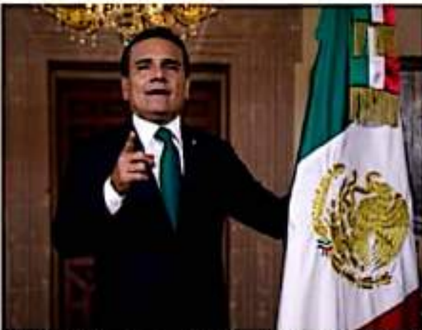
MORELIA, MICH.- Con un cambio al formato del tradicional Grito de Independencia, Silvano Aureoles Conejo, gobernador de Michoacán, hizo un reconocimiento a los héroes y heroínas quienes han estado en la primera línea de batalla en contra del Covid 19.

(Qué viva México! ¡Qué viva Michoacán! ¡Qué viva Morelia! ¡Qué viva Hidalgo! ¡Qué viva Josefa Ortiz! ¡Qué viva Ignacio López Rayón! ¡Viva México! ¡Viva México! ¡Viva México!, concluyó.