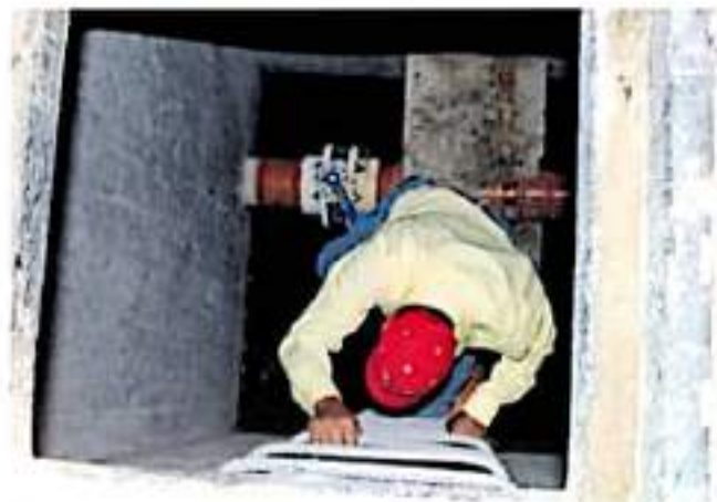
Actualmente se dialoga con las autoridades de la CFE para reactivar el suministro eléctrico.