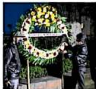
Aborda el primer evento clasificado como terrorista en México.

El atentado fue atribuido al crimen organizado y ese mismo día el gobierno federal presentó a tres presuntos culpables.