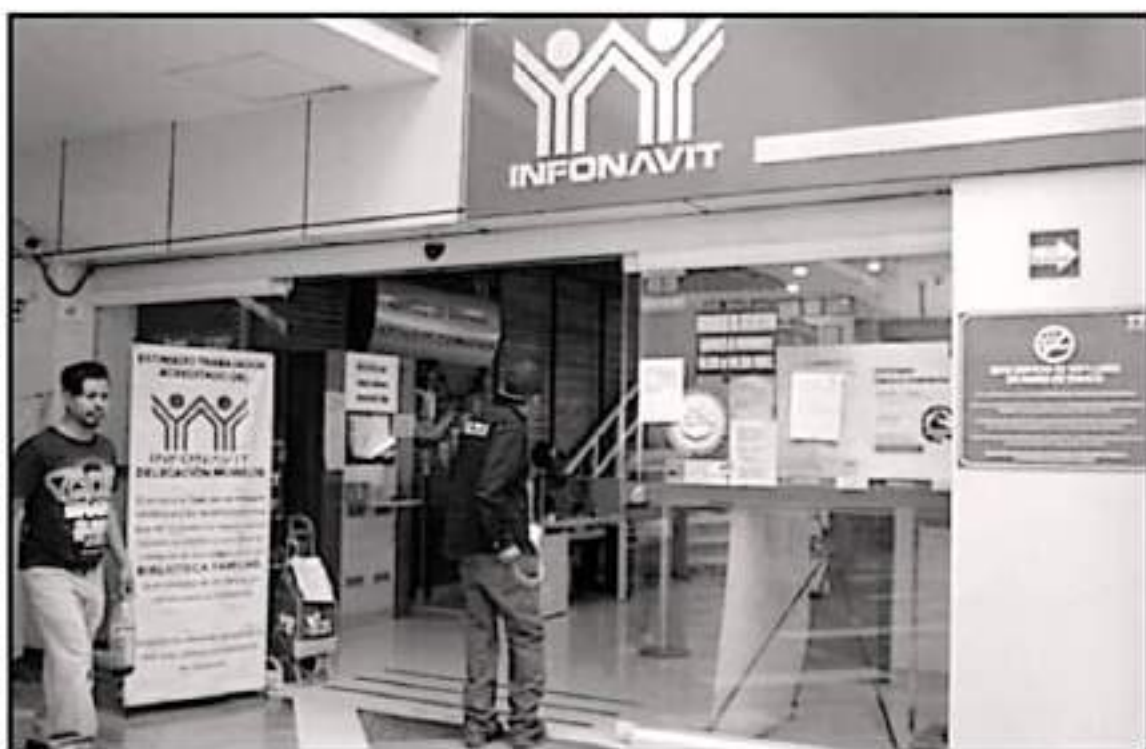
EL TITULAR DEL INFONAVIT EN EL ESTADO, SERGIO ADEM, DESTACÓ LAS METAS DE INCLUSIÓN PARA TRABAJADORES NO ACTIVOS O QUE NO COTIZAN

"Muchos trabajadores han tenido en algún momento de su vida laboral relación con algún empleador formal y esto les posibilita que tengan un ahorro en