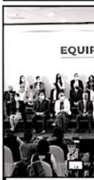
A PARTIR DEL 17 DE SEPTIEMBRE TITULAR