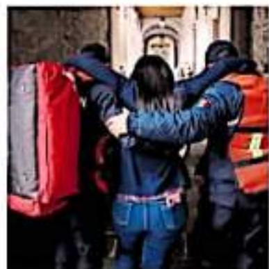
En el marco del aniversario del sismo de 1985.

Indicó que se trabajará con escuelas y to-