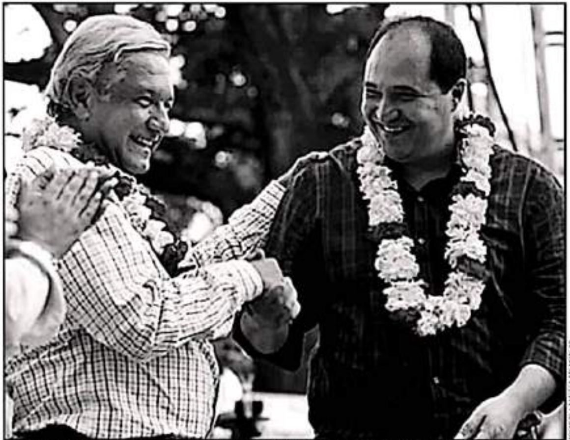
EL MICHOACANO LAZARO CÁRDENAS BATEL SE POSICIONA COMO UN PRESIDENCIAL Pese a que médicamente se encuentra desaparecido

De acuerdo con la mediación hecha por Massive Caller, Marcelo Ebrard cuenta con el 30.5 por ciento de las preferencias