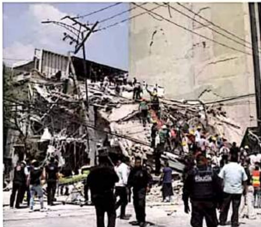
Estados. El terremoto del 19S afectó a ocho estados: Morelos, Puebla, Ciudad de México, Tlaxcala, Estado de México, Guerrero, Chiapas y Oaxaca. JAVIER LACORTE

Señaló que los primeros meses posteriores al sismo referido — que causó daños millonarios en la CDMX,