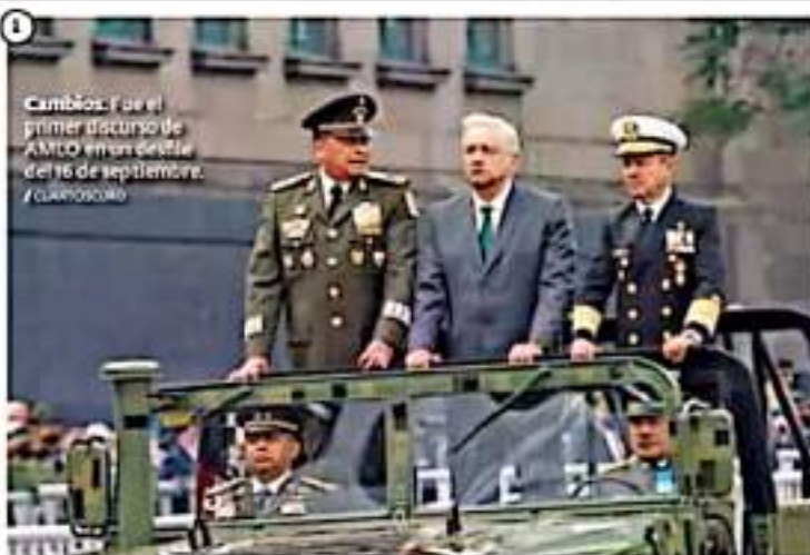
Cambios. Fue el primer discurso de AMLO en el desfile del 16 de septiembre. JOSÉ MANUEL

En el desfile militar de 2021 participaron 34 bandas de guerra nacionales, 13 banderas y 437 militares de fuerzas armadas amigas. Además, marcharon 15 mil 180 integrantes de las tres Fuerzas Armadas y de la Guardia Nacional.