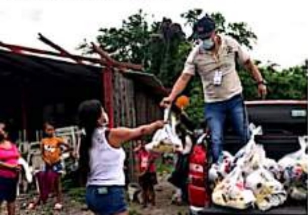
CD. LÁZARO CÁRDENAS, MICH.- Enramaderos de la colonia Edén del Sur de la tenencia de Las Guacamayas, que resultaron afectados por las lluvias que dejó el huracán "Nora" hace unas semanas, recibieron 50 despensas por parte del departamento de Desarrollo Social.

Fue hasta el día miércoles 15 de septiembre que las compuertas cerraron y el nivel del río bajó, dejando al descubierto la afectación, por lo que los afectados pudieron hacer el recuento de las pérdidas, en las que dicen "quedamos en ceros".