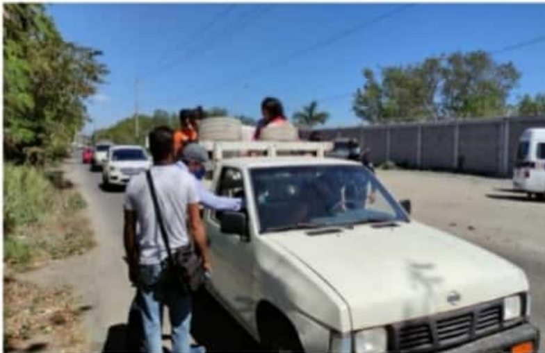
CD. LÁZARO CÁRDENAS, MICH.- Durante este próximo fin de semana se tiene programados algunos filtros sanitarios para cortar la cadena de contagios por el Covid-19.

El día domingo, los filtros se ubicarán en el acceso a Playa Jardín y en la comunidad de Acalpican de Morelos, en donde personal de Reglamentos Municipales, en coordinación con el 82 Batallón de Infantería, X Zona Naval, Policía Municipal y Michoacán,