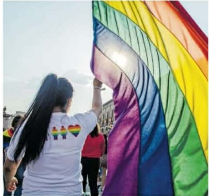
En Michoacán existen muchos retos para erradicar la discriminación hacia los grupos vulnerables.

También acusó que estos grupos existen en Michoacán, al igual que en todo México, y están financiados por personas