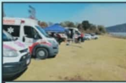
PARTICIPA EN RESCATE PERSONAL DE PROTECCIÓN CIVIL MUNICIPAL DE QUIROGA, TZINTZUNTZAN Y PÁTZCUARO.