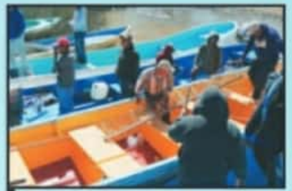
LA COORDINACIÓN INICIA DESDE LA ORILLA DEL LAGO, EN EL LUGAR CONOCIDO COMO LA PLAYITA.

años, empezó a arrojar piedras al lago y le gritaba le decía que saliera de ahí, que la extrañaba y quería a jugar con ella, sal de ahí hace frío, le decía", narró uno de los pescadores de la búsqueda. "es muy triste esta situación, hemos hecho todo lo posible por rescatar los cuerpos, pero las condiciones climáticas nos limitan mucho".