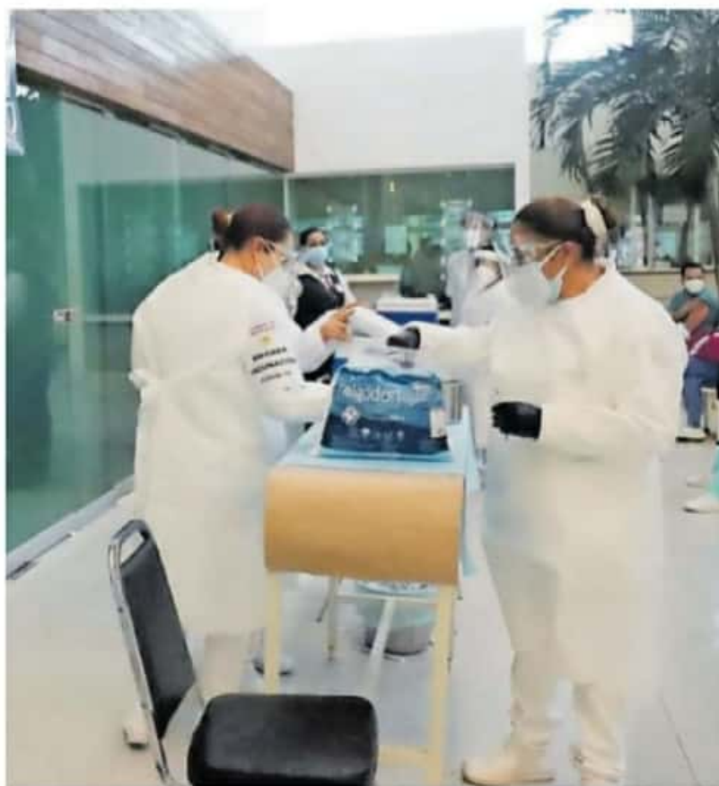
Las vacunas que se aplicaron son los refuerzos que estaban pendientes.