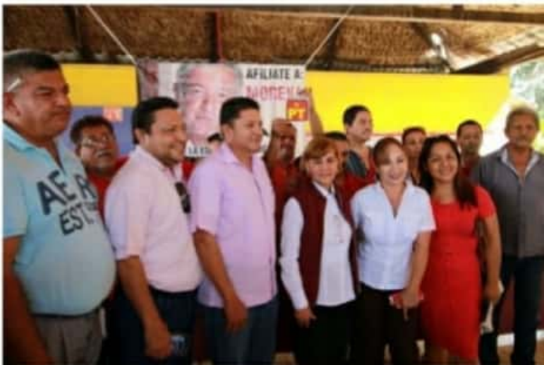
CD. LÁZARO CÁRDENAS, MICH.- Hasta el momento se tienen contabilizados a 16 aspirantes a contender por la alcaldía emanados de Morena.

Es de señalar que de acuerdo a Morena, el 8 de marzo, Día Internacional de la Mujer, dará el anuncio de género con el que competirá en esta municipalidad, y todo se definirá en una encuesta a la que están siendo sometidos los aspirantes.