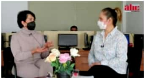
MORELIA, MICH.- Entre 2018 y 2019 existía un padrón en Michoacán de 600 niños con el padecimiento. A la fecha, hay 236 niños.

Finalmente, desglosó que Voces Federación Mexicana aglutina 9 organizaciones con causas sociales, tales como Autismo Kuani, Hola Hospis, para adultos mayores, Sonrisas Peludas, Colegio de Enfermeras -que trabajan con mamis embarazadas-, Uno en Voluntad -que acompaña a personas en duelo-, Familias Unidas contra el Cáncer, Salud Aplicada Uruapan, Yo Amo Uruapan, jóvenes, y el Comité de Desarrollo Comunitario que apoya con creación de viviendas para los más necesitados.