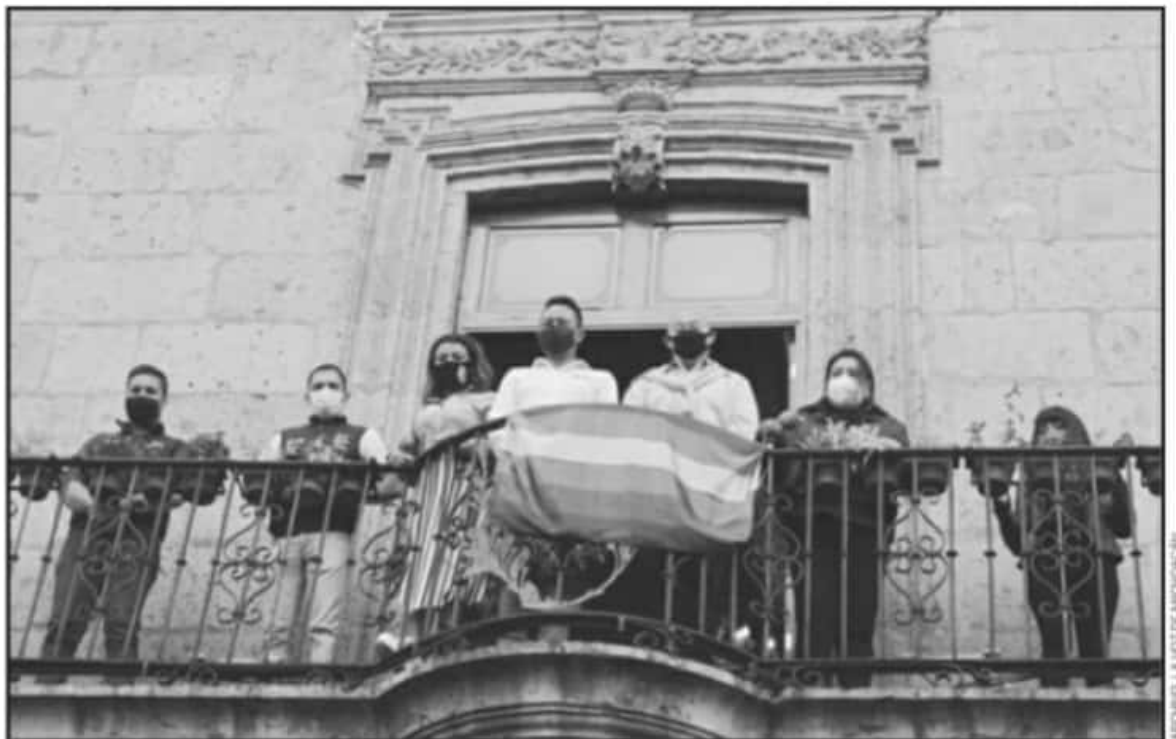
SE RESALTÓ QUE EXISTEN PERSONAS DE TODAS LAS DISIDENCIAS SEXUALES CON CAPACIDADES ACADÉMICAS Y PROFESIONALES PARA OCUPAR PUESTOS DE PODER.

"Hay posiciones que ya las conocemos, las posiciones se-