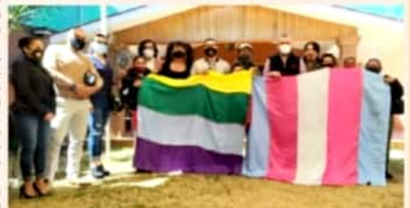
MORELIA, MICH.- El diputado de Morena sostuvo un diálogo con integrantes de colectivos de la diversidad sexual como el Frente Michoacano LGBTI.

El diputado local acordó con los representantes de la comunidad LGBTI mantener la coordinación para elaborar una agenda de trabajo orientada al reconocimiento pleno de sus derechos, y a la eliminación de diversas formas de discriminación; "Morelia es un municipio plural y diverso, por lo que debe reconocerse como tal con la implementación de políticas inclusivas", concluyó.