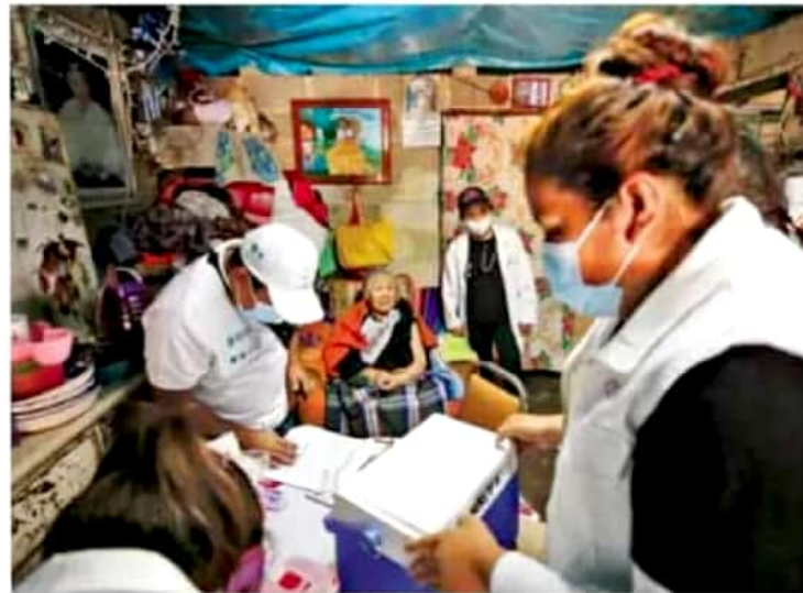
Mezcla. La OPS alertó que no se recomienda aplicar dosis de vacunas diferentes; se deben tomar únicamente las dos dosis de la misma marca para maximizar la eficacia.