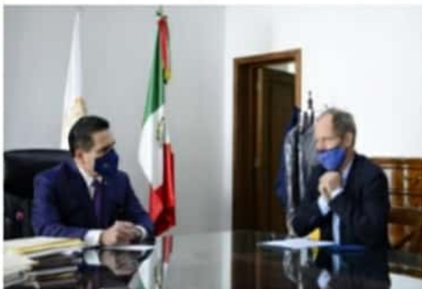
MORELIA, MICH.- El gobernador expresó su preocupación, pero también ocupación, para que los derechos de la niñez y adolescencia se cumplan sin excepción.

El mandatario estatal y las autoridades de la Unicef coincidieron en la necesidad de que la vacunación contra Covid-19 llegue a poblaciones que no cuentan con servicios básicos, como salud, nutrición e inmunización básica.