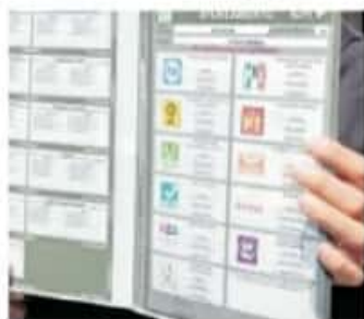
Se renovarán gubernatura y diputaciones locales y federales.