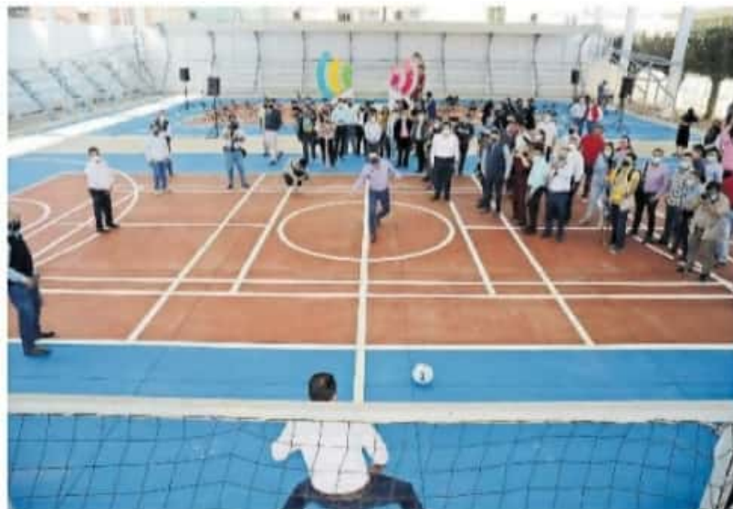
La finalidad es que todos los estudiantes puedan regresar a las escuelas

De acuerdo a la medición de la SSM en su portal, actualmente son 96 municipios los que estarían en esa posibilidad del regreso a clases presencial, sin embargo aún