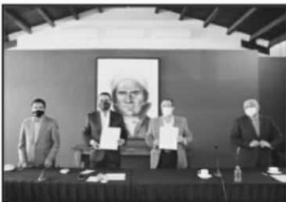
SE RECONOCIÓ EL CUMPLIMIENTO DE LA PROMESA REALIZADA DE MANTENER LAS PLANTILLAS DE TRABAJADORES EN LAS INSTITUCIONES PÚBLICAS.

Con estas acciones, junto con la estrategia implementada en los rubros financieros y económicos en el estado, como la puesta en marcha de programas de apoyo a las empresas michoacanas, en lo referente al subsidio al Impuesto a la Nómina, dan cimiento a la reactivación económica de la entidad.