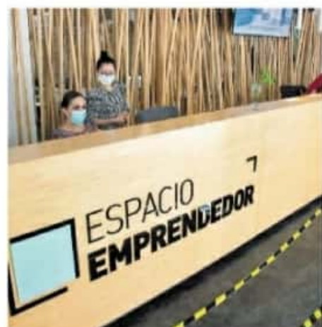
Espacio Emprendedor pueda estar listo para la primera quincena de marzo

De acuerdo al portal de la SSM hay 11 municipios en tono Amarillo y 20 más en color Verde.