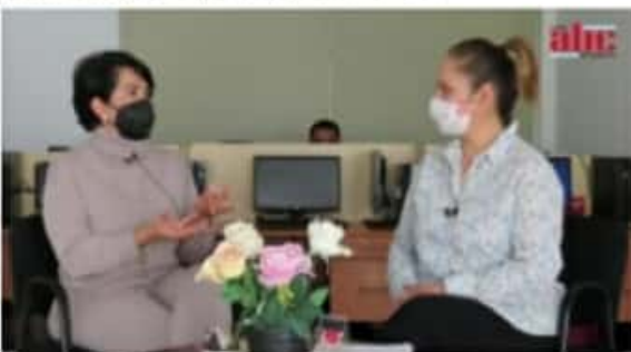
MORELIA, MICH.- Entre 2018 y 2019 existía un padrón en Michoacán de 600 niños con el padecimiento. A la fecha, hay 236 niños.

Finalmente, desglosó que Voces Federación Mexicana aglutina 9 organizaciones con causas sociales, tales como Autismo Kuani, Hola Hospis, para adultos mayores, Sonrisas Peludas, Colegio de Enfermeras -que trabajan con mamis embarazadas-, Uno en Voluntad -que acompaña a personas en duelo-, Familias Unidas contra el Cáncer, Salud Aplicada Uruapan, Yo Amo Uruapan, jóvenes, y el Comité de Desarrollo Comunitario que apoya con creación de viviendas para los más necesitados.