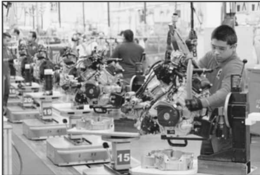
VARIAS INDUSTRIAS EN EL PAÍS Y EN EL ESTADO SE HAN TENIDO QUE IR A PARO TÉCNICO POR LA FALTA DE GAS NATURAL.

deró que las reducciones en la distribución y consumo obliga a que las autoridades mexicanas se encuentren preparada para tener un plan de contingencia, sobre todo ante el impacto que ya se ha resentido en las cadenas productivas y que seguirá