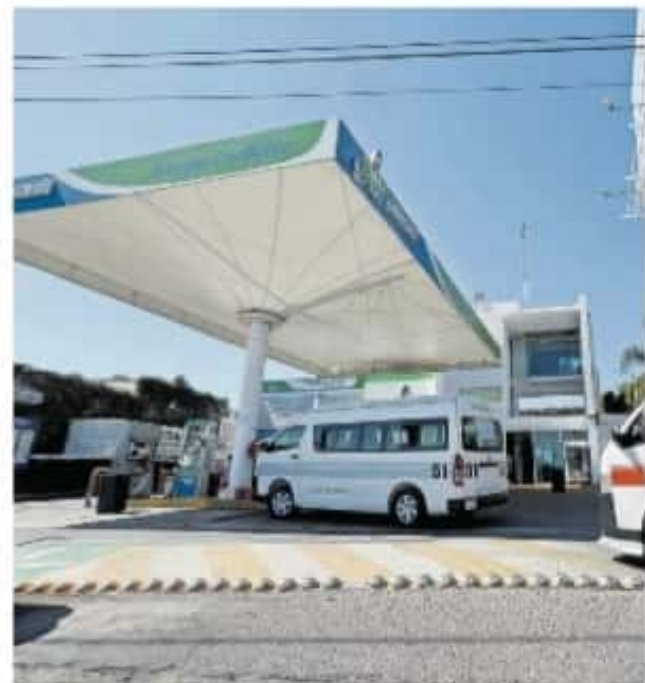
Los líderes del transporte público aún no reportan una escasez real de gas natural

En la capital michoacana el 80 por ciento del transporte público logró hacer la reconversión de sus tanques de gasolina a gas natural hace más de 4 años a tra-