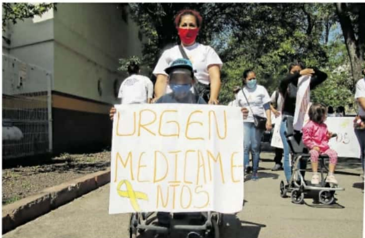
La Comisión de Salud reveló que el gobierno estatal no ha actuado con equidad / FERNANDO MALDONADO