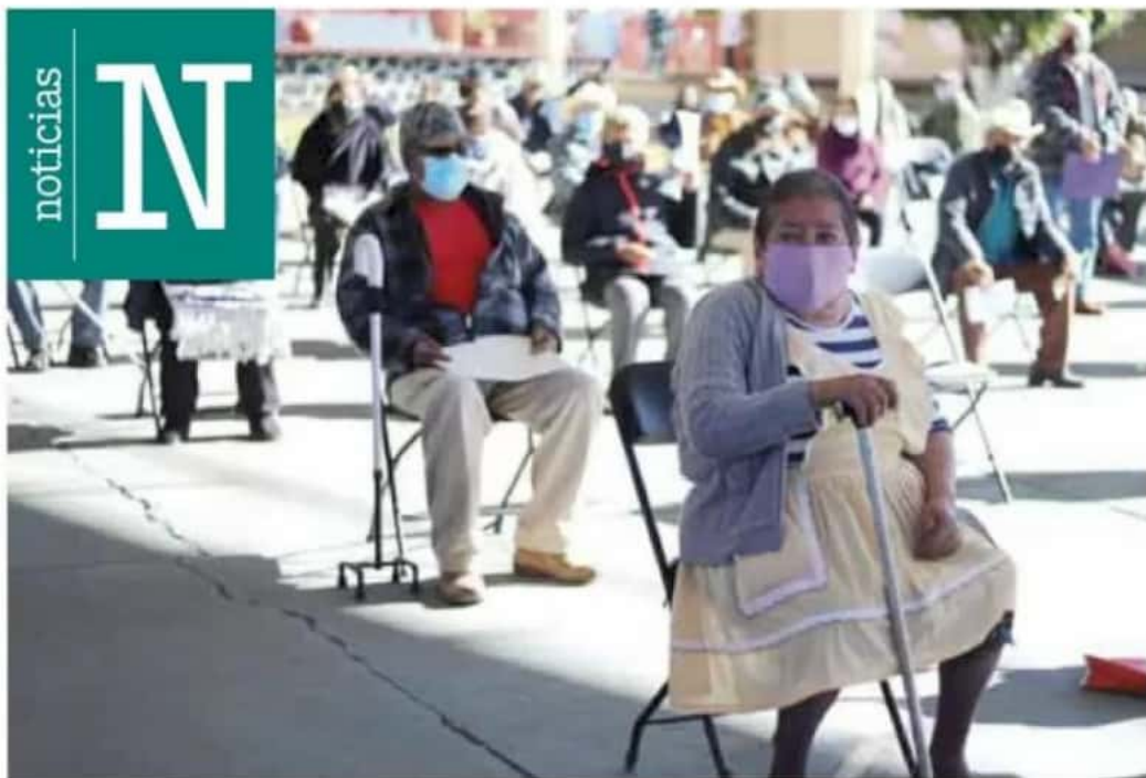
Grupo prioritario. La vacuna contra el coronavirus se aplica, por ahora, en siete de los 113 municipios.