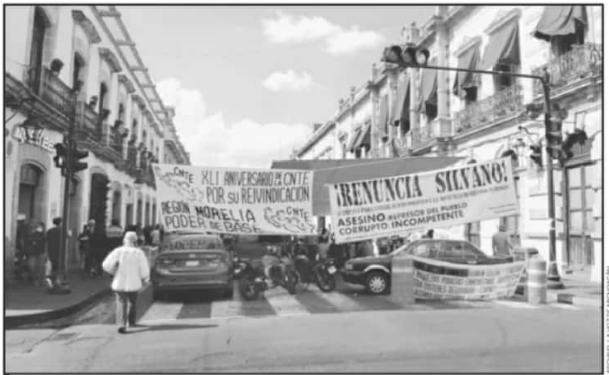
TRABAJADORES ESTATALES Y FEDERALES SE MANTENDRÁN EN ALERTA MÁXIMA, EN ESPERA DE OBTENER LOS BENEFICIOS QUE POR DERECHOS LES CORRESPONDEN.

desde el 2019 se tenía el compromiso del establecimiento de esta convocatoria, tema que fue retrasado por las autoridades y que, a raíz de la llegada de la pandemia, las autoridades estatales señalaron que imposibilitó el acceso a los recursos federales para financiar dicho proceso.