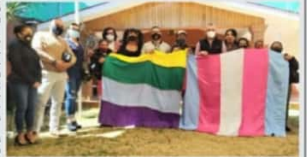
MORELIA, MICH.- El diputado de Morena sostuvo un diálogo con integrantes de colectivos de la diversidad sexual como el Frente Michoacano Lgbti.

El diputado local acordó con los representantes de la comunidad Lgbti mantener la coordinación para elaborar una agenda de trabajo orientada al reconocimiento pleno de sus derechos, y a la eliminación de diversas formas de discriminación; "Morelia es un municipio plural y diverso, por lo que debe reconocerse como tal con la implementación de políticas inclusivas", concluyó.