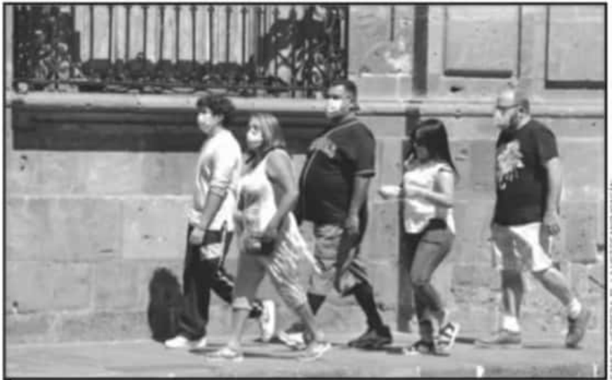
A PESAR DE QUE MORELIA SIGUE SIENDO EL EPICENTRO DEL CORONAVIRUS EN EL ESTADO, LA MOVILIDAD SE MANTIENE ALTA.

DECESOS se registraron en la capital michoacana