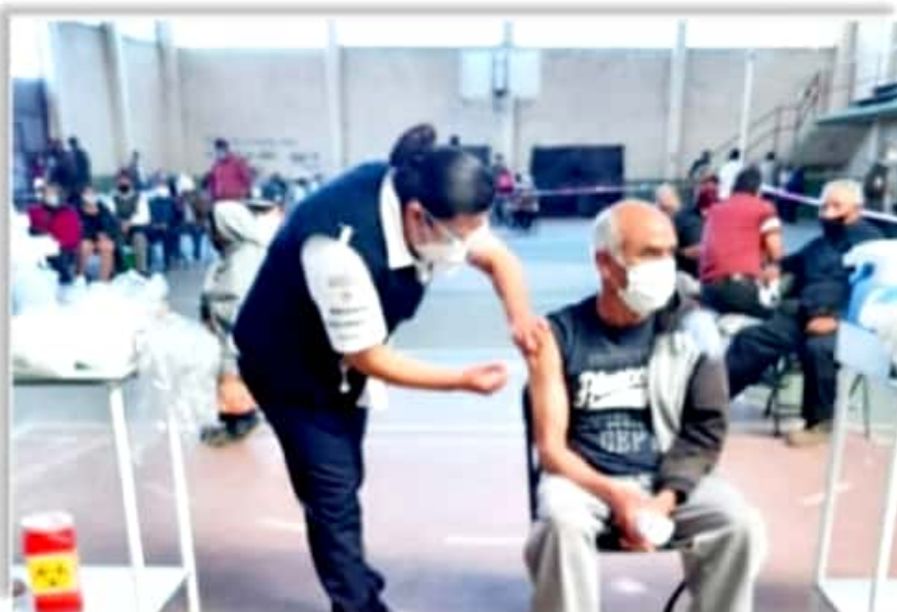
Más de 10 mil Adultos Mayores ya fueron vacunados en Michoacán.

y sus familias, es mi compromiso”, subrayó... EN EL ENCUENTRO se abordó la alerta que la UNICEF emitió en diciembre del 2020 en cuanto “al mínimo incremento en el presupuesto destinado a la atención de la infancia y adolescencia en México para este 2021, por parte del gobierno federal”, tras señalarse que para la atención de la infancia y la adolescencia “en el presente año se etiquetaron 791 millones de pesos, un incremento del 0.2 por ciento en términos reales respecto del año 2020”... ASIMISMO, EL representante de UNICEF en México, comentó en torno a la iniciativa de transporte aéreo para la distribución de vacunas COVID-19 “que cubrirán las rutas de 100 países y así apoyar a la distribución de las vacunas ligadas al mecanismo COVAX. El acceso equitativo a las vacunas es fundamental, para todas las personas, incluidas las que