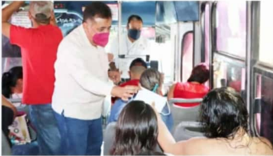
APATZINGÁN, MICH.- El alcalde verificó que tanto los choferes de combis y microbuses como los usuarios usen correctamente el cubrebocas.

"Cuidamos es responsabilidad de todos, por eso no debemos relajar las medidas para contener al virus, si todos colaboramos en este sentido, pronto podremos superar a la pandemia", concluyó el alcalde.