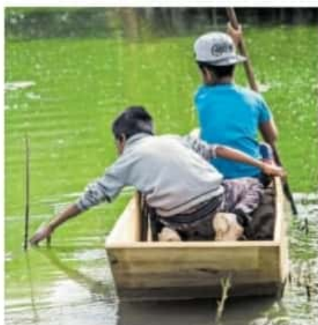
Planean tener un trabajo coordinado en la protección de la adolescencia.

La recepción de documentos en las instalaciones de la citada secretaria es en avenida Acueducto número 106, colonia Chapultepec Norte, en un horario de 8:00 a 17:00 horas.