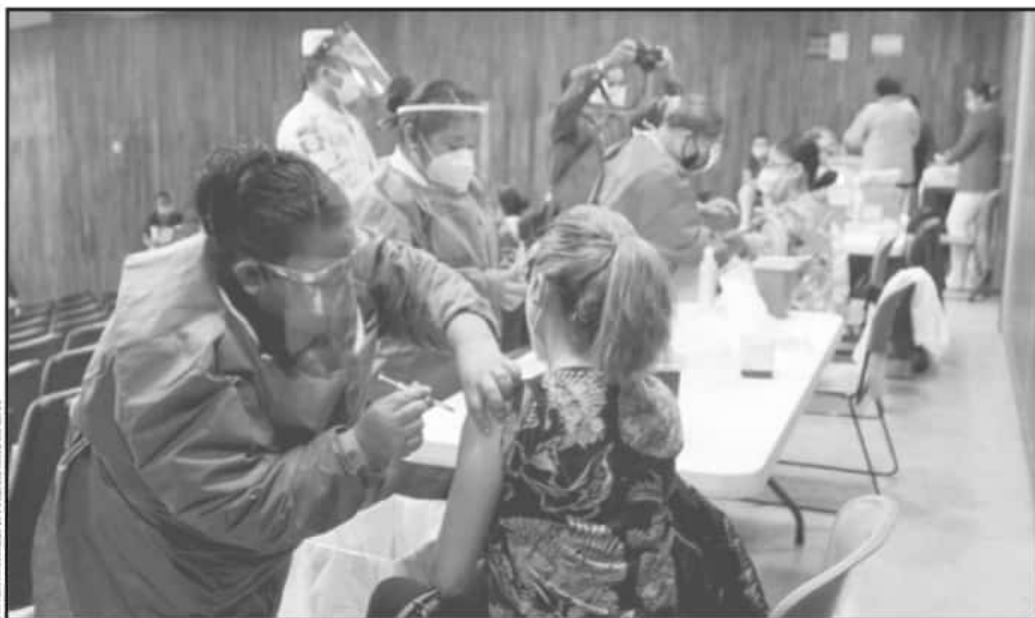
PERSONAL MÉDICO RECIBIÓ LA SEGUNDA DOSIS DE VACUNACIÓN CONTRA LA COVID-19. SE ESPERA SEGUIR LA INOCULACIÓN PARA ADULTOS MAYORES CON ÉXITO.

Silvano Aureoles, GOBERNADOR DE MICHOACÁN