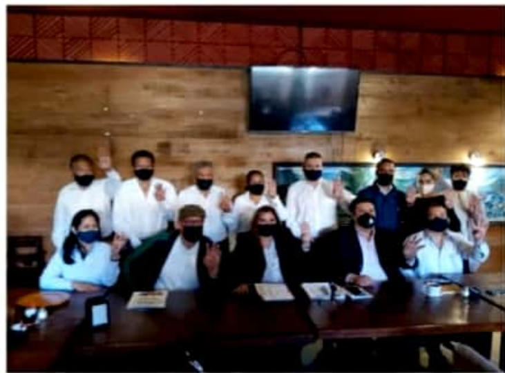
URUAPAN, MICH.- Integrantes de la Fundación Mireles pidieron a la dirigencia nacional de Morena que tome en cuenta sus solicitudes para participar como candidatos de ese partido político en el proceso electoral de este año.

Explicó que aun hay registros para sindicaturas y regidurías hasta el 28 de febrero; en cuanto a la situación de definición de candidatos es el 25 de marzo de acuerdo con la convocatoria. Para esa fecha ya tiene que estar toda la planilla conformada para diputaciones y ayuntamientos.