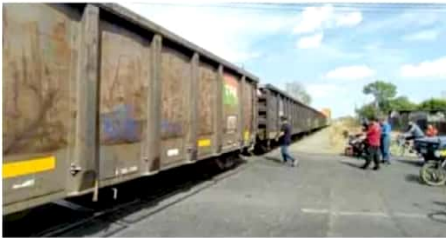
Peligro. A menudo peatones se cruzan entre los vagones cuando el tren está detenido. /CYNTHIA