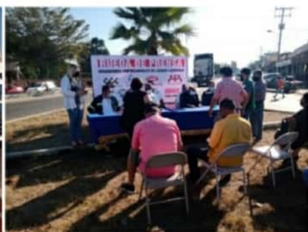
CD. LÁZARO CÁRDENAS, MICH.- El Distribuidor Vial ya debería estar en funcionamiento de acuerdo con lo pactado por el Gobierno y la Federación.