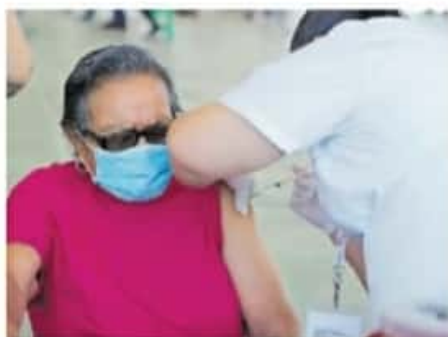
Las brigadas iniciaron este jueves.