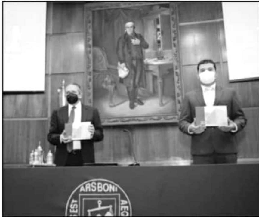
EL INFORME SOBRE LOS TRIBUNALES LOCALES FUE DETALLADO A PUERTA CERRADA POR EL TITULAR DEL PODER JUDICIAL

Con la presencia del gobernador Silvano Aureoles, el magistrado sostuvo que la judicatura michoacana retomó actividades, prácticamente en su totalidad, a partir del pasado mes de agosto.