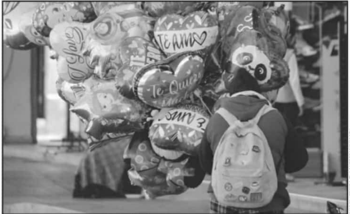
LA MOVILIDAD POR LA COMPRA DE REGALOS POR EL DÍA DE SAN VALENTÍN FUE MENOR A LA COMPRA DE REGALOS DURANTE LAS CELEBRACIONES DECEMBRINAS.

"Creo que ha pasado la etapa crítica donde sí fueron muy marcados los contagios de fin de año.