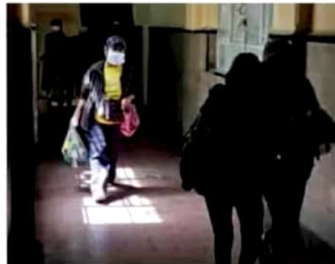
Alerta. Castigarán con cárcel los delitos electorales. / CUARTOSURCO

“Es un populismo penal que se está dando, hoy no solamente van ya con delincuencia organizada, ni con robo, ahora hasta delitos electorales. Quiero ver los abusos que van a existir en este país, y los va a haber y los van a vivir, de parte de personas que abusen de la autoridad que van a mandar a la cárcel por motivos políticos a la gente”, refirió. JENNIFER ALCOCER