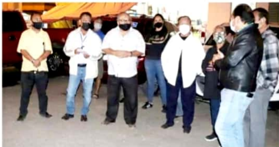
ZAMORA, MICH.- Se busca la recuperación de 2 áreas verdes para que sean funcionales y que los niños y niñas tengan un espacio digno.

El presidente municipal giró instrucciones para que se dé mantenimiento a las luminarias de la colonia y abrió la posibilidad de que juntos, vecinos y el ayuntamiento, puedan estar remplazando el alumbrado público.