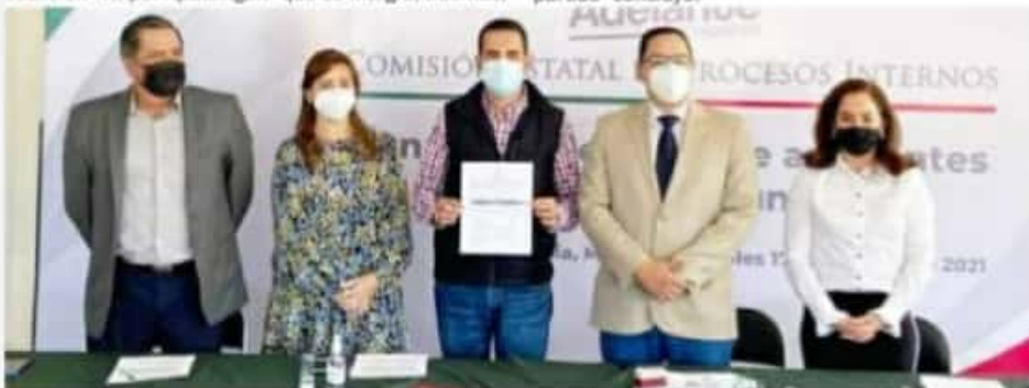
MORELIA, MICH.- Con esta decisión el partido tricolor cumplió un punto más del calendario político dentro del proceso electoral 2021 en pleno desarrollo.

"Trabajaremos para obtener buenos resultados y para ello se necesita de la suma de esfuerzos de todos y cada uno de los militantes y simpatizantes de los tres partidos, además de la unión con los demás compañeros que tenían la aspiración a la candidatura, unido a esto el apoyo y respaldo por los sectores y organizaciones tanto en el Comité Estatal, como en el Municipal; será más que importante para cumplir las metas, demostrando siempre la grandeza de nuestro partido" concluyó.