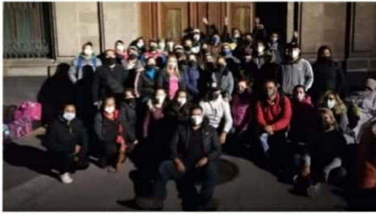
CD. LÁZARO CÁRDENAS, MICH.- Como "logros históricos", la CNTE celebra que alcanzaron acuerdos favorables para la base magisterial.