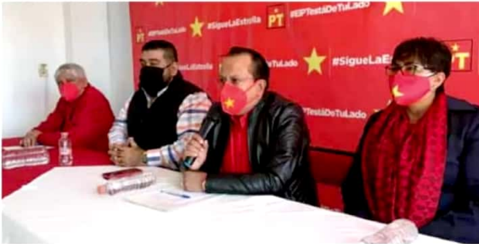
Acuerdos. Se mantiene la alianza con Morena en la entidad.