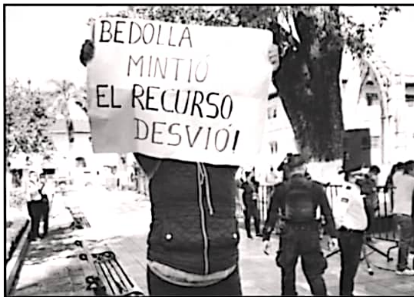
INTEGRANTES DE PODER DE BASE PORTABAN CARTULINAS Y MANTAS CON LAS QUE RECLAMABAN INCUMPLIMIENTO