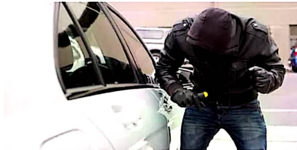
Costo. Los automovilistas no asegurados no recuperan las pérdidas tras el robo.

Alerta. En promedio, 60% de los casos correspondieron a robos con violencia; aunque en estados como Sinaloa, Guerrero y Zacatecas, la cifra se disparó hasta 82%