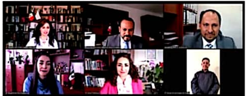
En sesión pública, el Pleno también atendió dos Procedimientos Especiales Sancionadores más, y un Juicio Ciudadano.

Aquí el TEEM declaró la inexistencia de la infracción atribuida a los denunciados, toda vez que, no se aportaron elementos probatorios suficientes para sustentar la conducta denunciada.