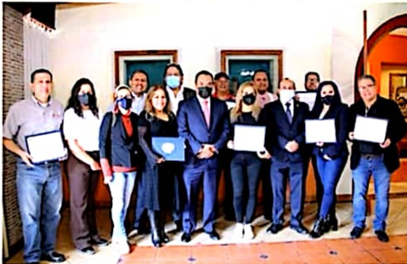
Adrián López Solís entregó constancias a profesionales de la comunicación que participaron en el seminario "Los Medios de Comunicación en Torno al Sistema Penal Acusatorio" en la Región Uruapan.

En su momento, las y los periodistas que participaron en la jornada académica, agradecieron al Fiscal General por promover este tipo de capacitaciones para que trabajen de manera correcta, cuidando las limitantes procesales y los derechos humanos, y que evite afectar el debido proceso o el principio de presunción de inocencia, que, en ocasiones, pueda favorecerse con ello, a quien es victorioso de un hecho, en perjuicio de la víctima.