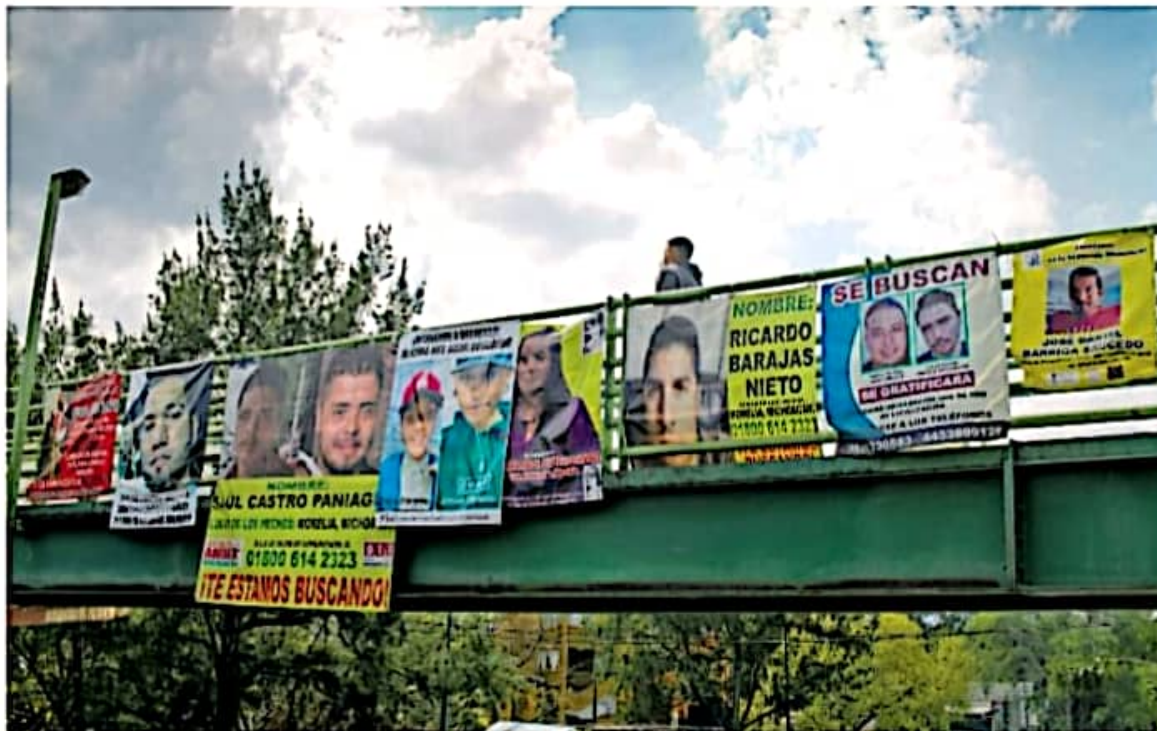
Fichas de búsqueda en el puente peatonal de Xangari