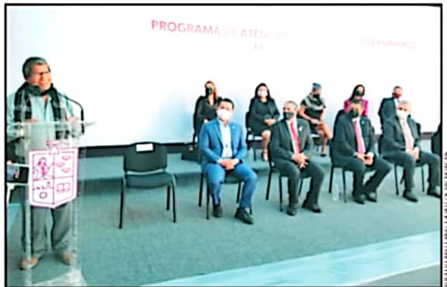
UNO DE LOS IMPULSORES DE ESCRITURACIÓN SEÑALÓ QUE DURANTE MÁS DE 3 AÑOS BUSCARON CONCRETAR ESTE PROCESO

El primer contacto fue con dependencias federales que impulsan regularización de colonias, ejidos y comunidades como el Registro Agrario Nacional y la Procuraduría Agraria pero ahora con la Semacdet.