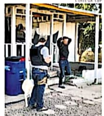
Migrantes rescatados por la CBP

Como parte de los aseguramientos, el pasado domingo un traficante detenido reveló que había una casa de seguridad en Vinton, Texas, lugar en donde rescataron a 20 migrantes provenientes de Bolivia, El Salvador, Guatemala, Honduras y México.