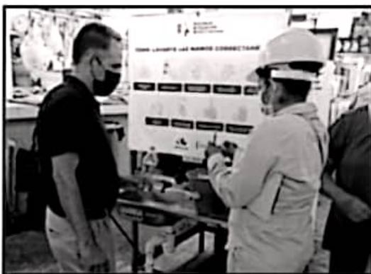
SEÑALAN LAS ACCIONES PARA EVITAR LA PROPAGACIÓN DEL MOSCO.