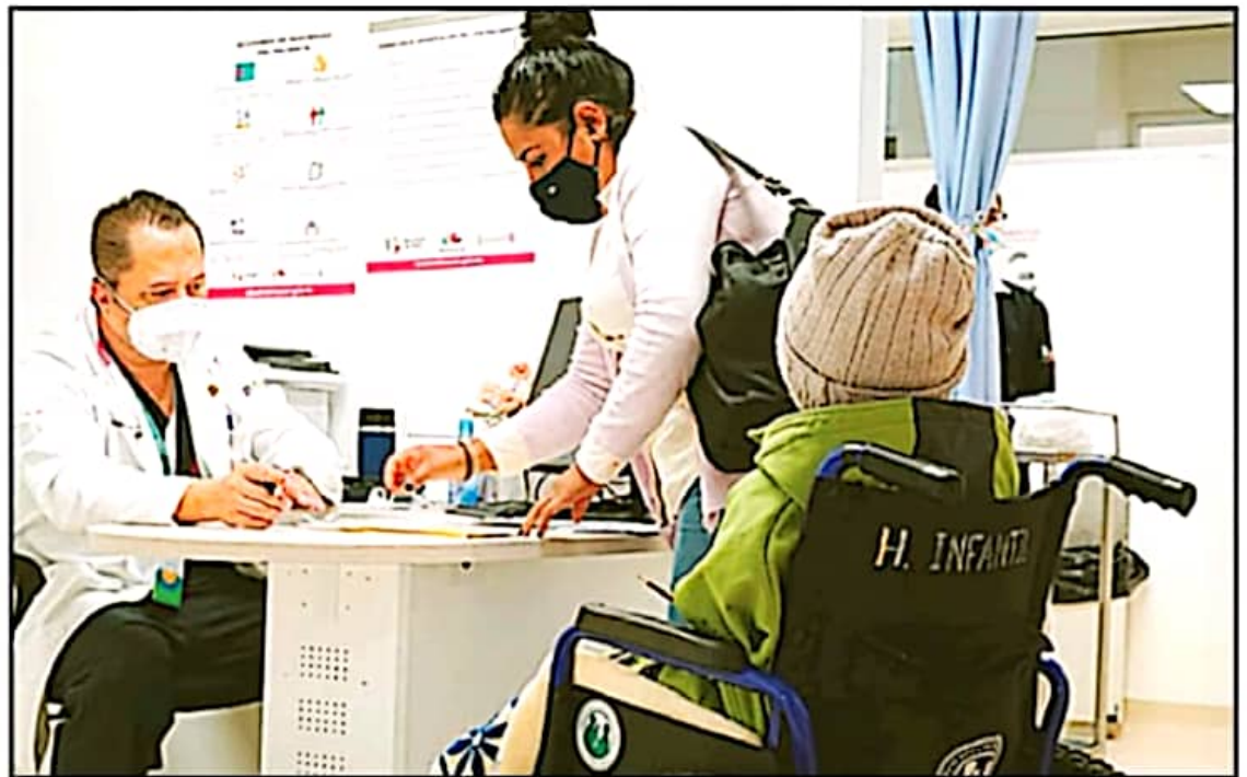
EL ESQUEMA DEL AMPARO PARA QUE LOS MENORES DE EDAD SEAN VACUNADOS, CONTINUA CRECIENDO TANTO A NIVEL ESTATAL COMO A NIVEL NACIONAL.

Incluso, destacó que en caso de que los menores no se encuentren en la mejor condición para recibir la vacuna, se seguirá optando por no aplicar la dosis para no poner en riesgo la salud del paciente con la inmunización, en este aspecto, destacó que al menos en el Hospi-