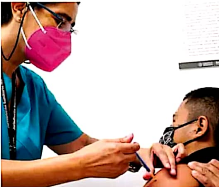
Vacunas. La aplicación de la primera dosis se llevó a cabo sin contratiempos.