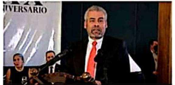
El gobernador Alfredo Ramírez Bedolla, anunció gestión de recursos para un centro cultural de Uruapan.

Durante el XX Aniversario del Diario ABC de Michoacán, el mandatario reiteró su compromiso de fortalecer la infraestructura como parte de su agenda pública.