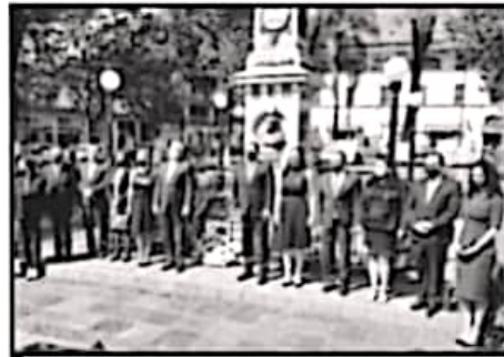
VARIAS PERSONALIDADES DESTACARON DURANTE EL ACTO