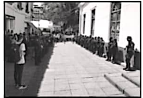
ELEMENTOS DE DIVERSAS CORPORACIONES HICIERON VALLA

■ ADEUDOS ■ PROTESTA PODER DE BASE EN EVENTO CÍVICO