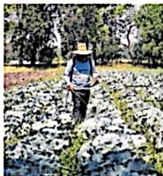
El apoyo se destina para la compra de biofertilizantes

Añadió que este programa estará disponible para todos los pobladores que se dediquen a la producción agrícola y no alcanzaron a recibir el apoyo en esta ocasión.