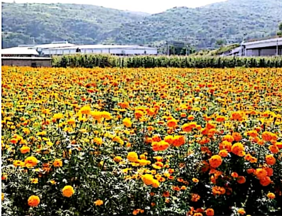
Cempasúchil. Tarimbaro y Copándaro son dos de los principales proveedores de Morelia.

Uno de los oferentes explicó que muchos de los agricultores de esta región determinaron no cultivar, ante la expectativa de que los panteones estuvieran cerrados por la contingen-