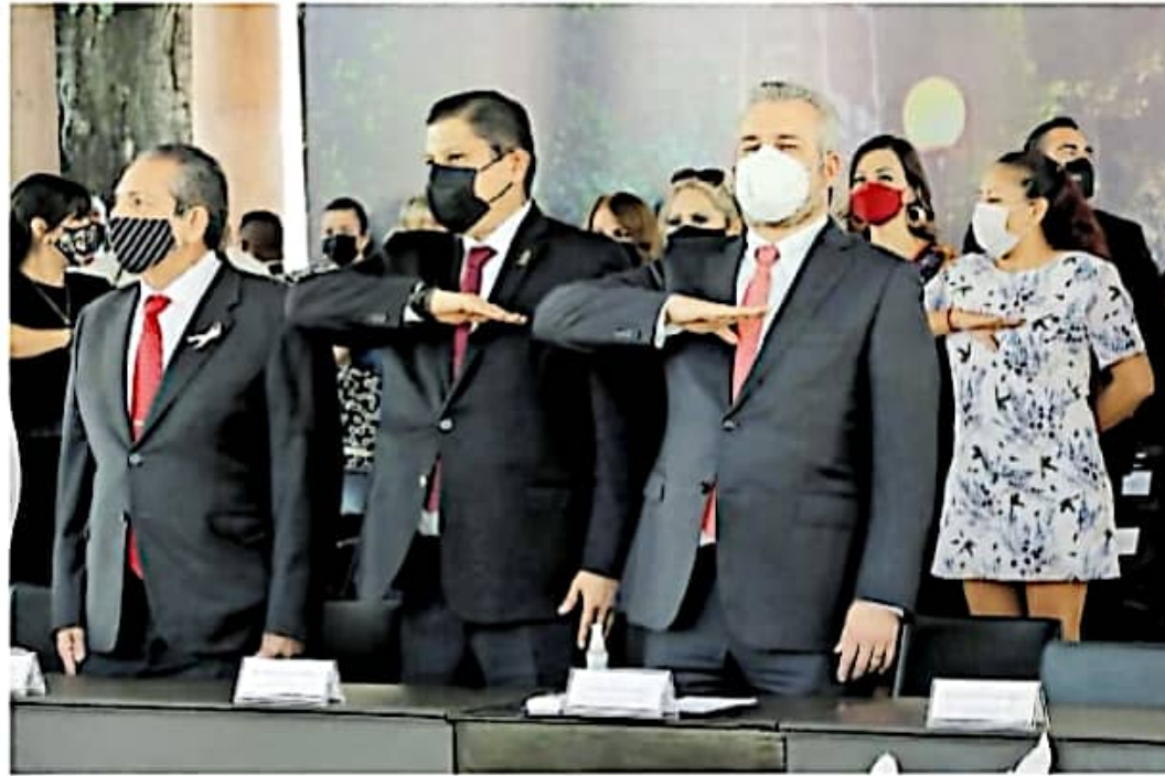
El funcionario arribó a la plaza Mártires de Uruapan / GOBIERNO DEL ESTADO MICHOACÁN