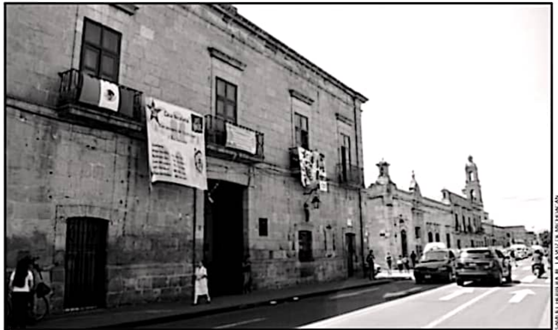
YA SE ESTÁN LIBERANDO LOS RECURSOS PARA LAS CASAS DEL ESTUDIANTE EN TORNO A LA DESPENSA Y MATERIALES DE LIMPIEZA, ENTRE OTROS RUBROS

"Esto que esto también será un signo positivo para albergues como la Isaac Arriaga, que se ha visto envuelto una problemática, por la injerencia de una organiza-