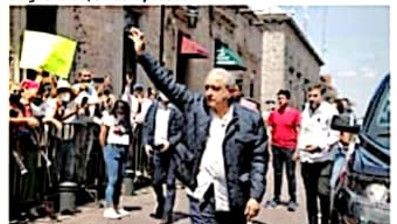
A pocos días de haber anunciado el plan de Apoyo a Michoacán, el gobierno de AMLO, a través de la SCT canceló licitaciones de obras carreteras ya ganadas por varias constructoras michoacanas.