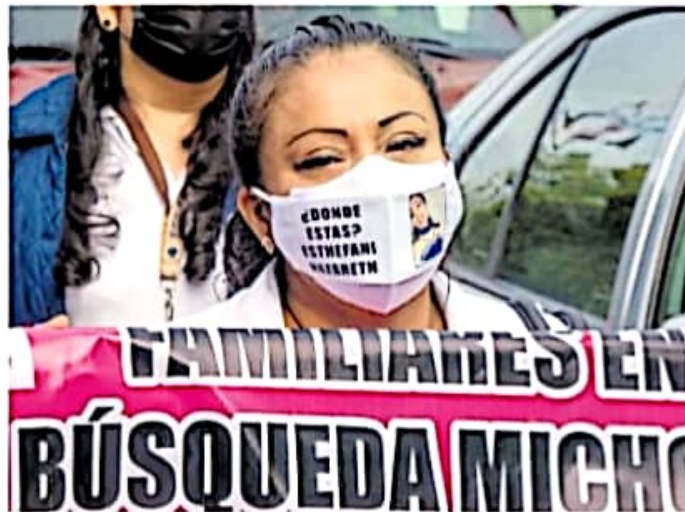
En agosto, familiares de desaparecidos protestaron en el Centro

UNA DE las hipótesis sobre el paradero de los desaparecidos es que fueron reclutados para trabajos forzados o de narcotráfico