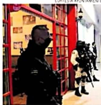
La verificación se realizó en las avenidas Enrique Ramírez Miguel

Las autoridades pidieron a dueños y encargados dar cumplimiento a los reglamentos que marca la ley, con base a las