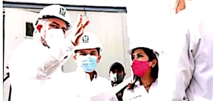
IMSS. El gobernador dijo que se avanza en el traslado de oficinas centrales a Morelia.

Alfredo Ramírez Bedolla Gobernador de Michoacán.