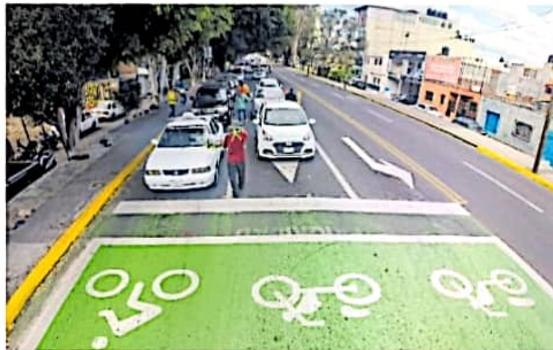
Se plantea condonar multas y recargos a deudores de impuestos vehiculares