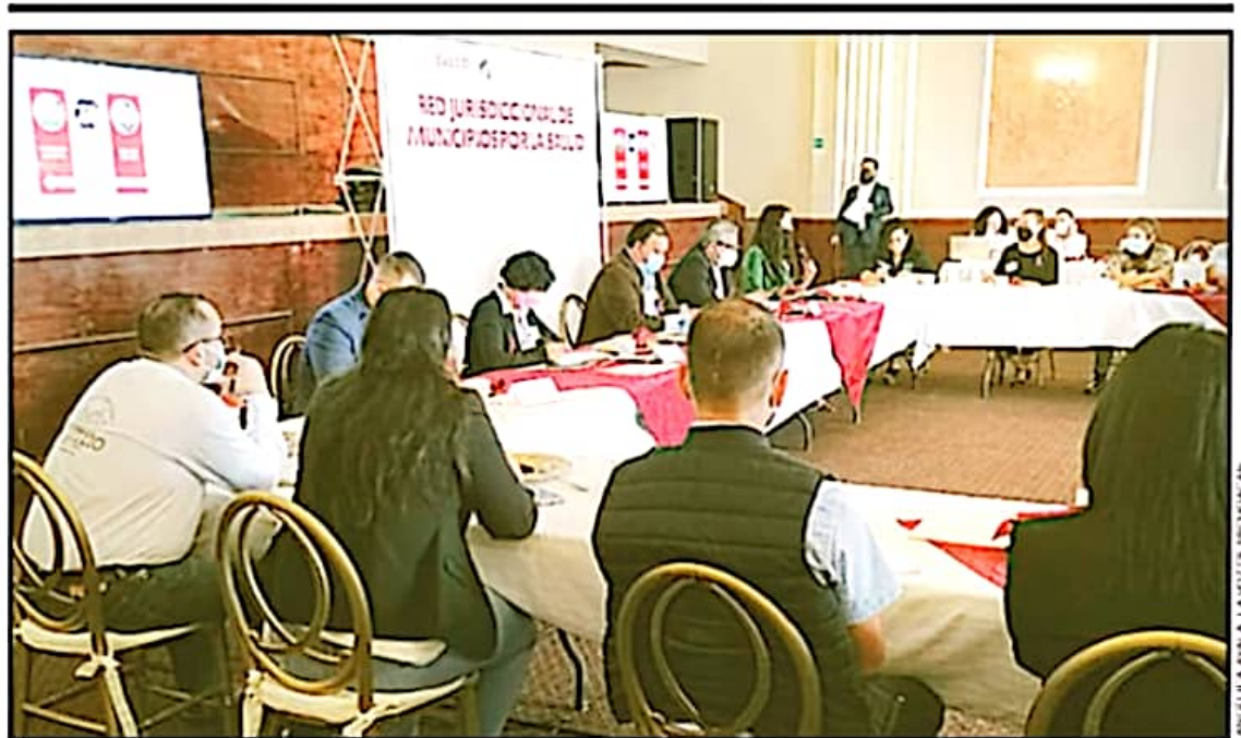
AUTORIDADES MUNICIPALES Y DE SALUD DE PÁTZCUARO FORMARÁN PARTE DEL COMITÉ DE LA RED JURISDICCIONAL DE MUNICIPIOS POR LA SALUD

nos. Para ello, requieren un diagnóstico situacional del municipio, para después realizar talleres intersectoriales para la planeación y después desarrollar actividades y proyectos en beneficio de la salud, para que logren la certificación en el último año de gobierno, los beneficios, explicaron, es lograr una protección ecológica, orden y seguridad pública, mejoramiento de los servicios públicos, además de aplicar actividades particulares, todo conlleva a tener un impacto favorable en la salud.