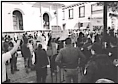
GRITARON CONSIGNAS CONTRA LA ADMINISTRACIÓN ESTATAL