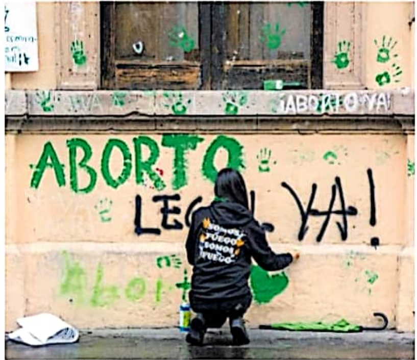
Las comisiones de Salud de los congresos tienen la responsabilidad de planear una serie de reformas a la Ley de Salud

De manera reciente, la Suprema Corte del País, máxima autoridad jurisdiccional, se pronunció a favor de despenalizar el aborto en toda la República, dejando a los congresos estatales armoni-