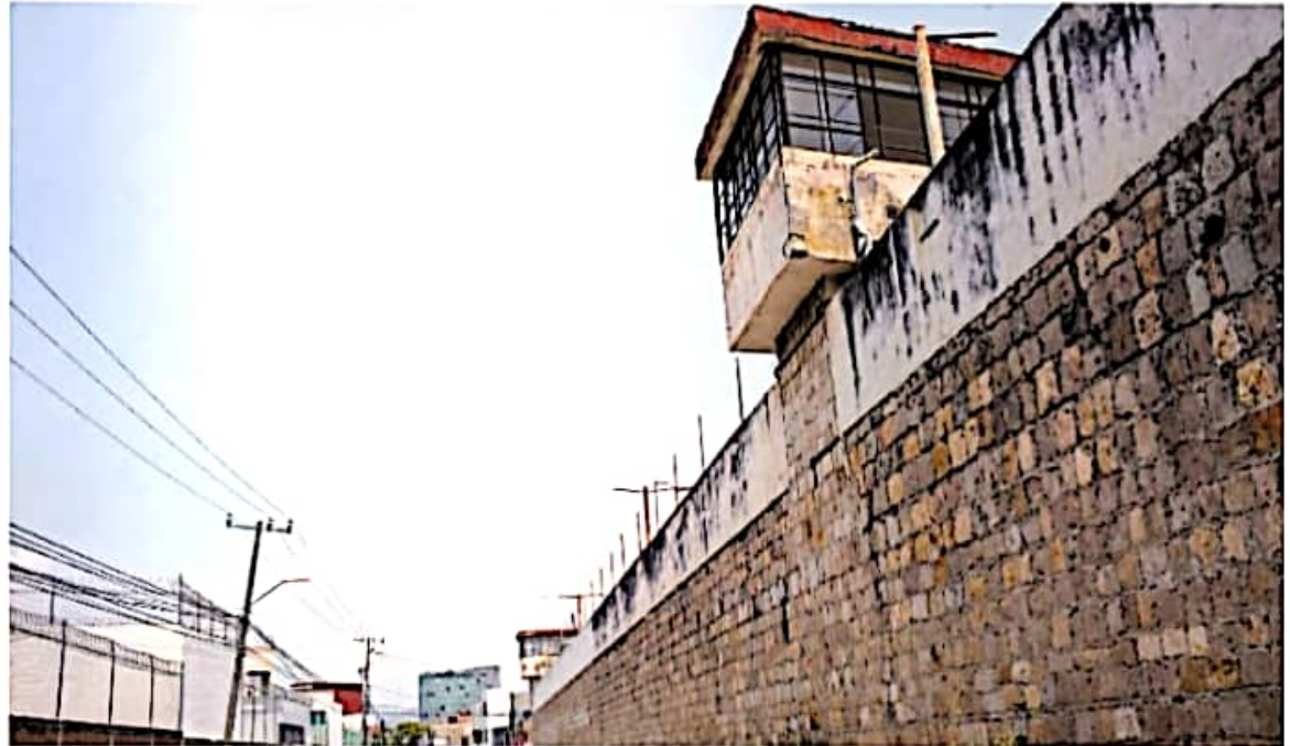
El antiguo Cereso podrían ser la nueva sede federal del Instituto / VAN VILLANUEVA