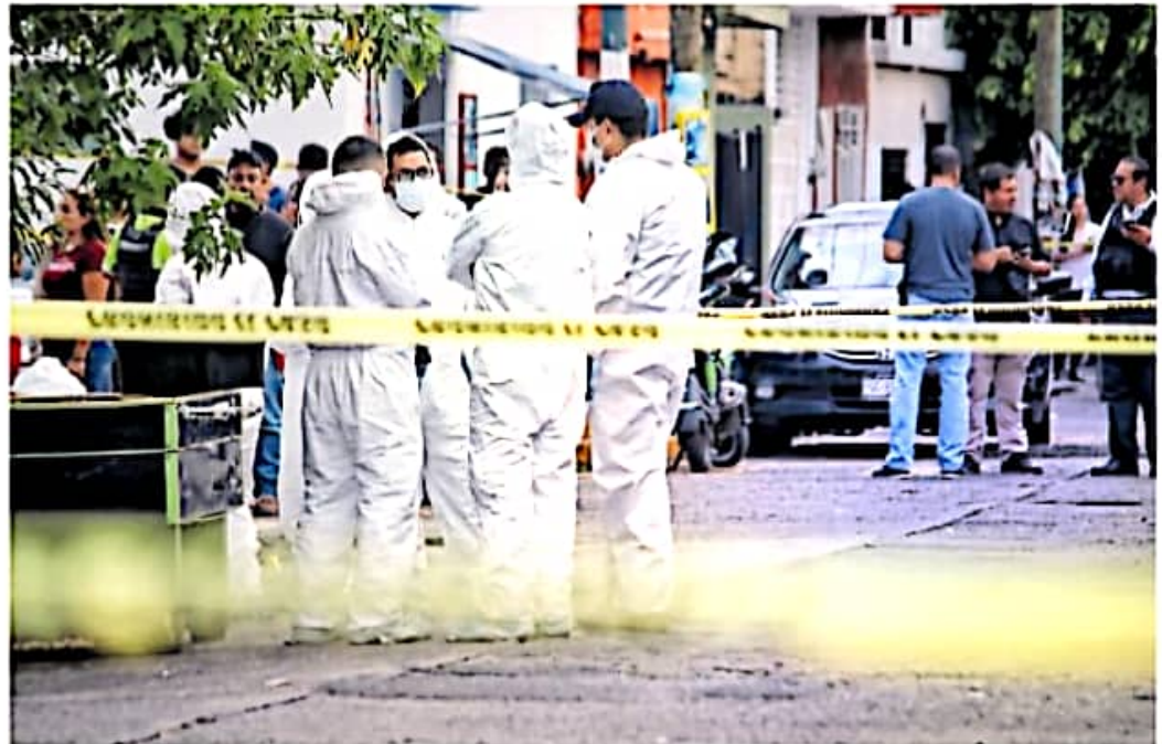
En la colonia San Pancho se encontró a un hombre sin vida con heridas de bala / FERNANDO MALDONADO