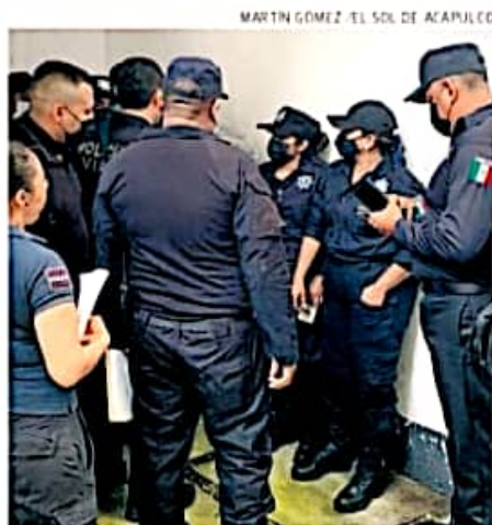
Los uniformados tomaron las instalaciones