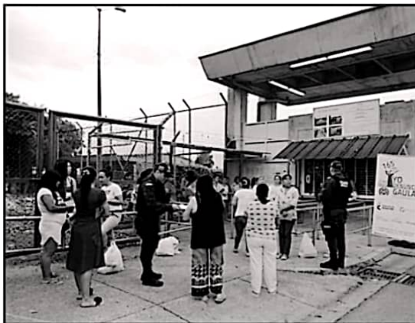
DE NUEVA CUENTA LAS PENITENCIARIAS DEL ESTADO ABREN SUS PUERTAS PARA QUE FAMILIARES VISITEN A LOS REOS

El registro de contagios de la Coordinación de Centros Penitenciarios refiere únicamente 5 contagios detectados y aislados, así como sin casos de reos falle-