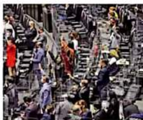
Añós. El retiro de las divisiones en el pleno de San Lázaro inició esta semana.

Precisaron que las acciones obedecen a que se mantienen medidas adecuadas y la apli-