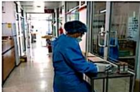
De acuerdo a datos al cierre del 22 de septiembre en LC la ocupación de camas COVID era del 45.85 por ciento, según la SSM.