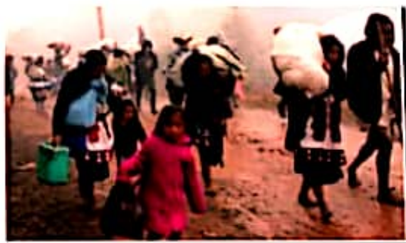
Jaime Darío Osseguera Méndez

Las imágenes distribuidas hace unos días de la Patrulla Fronteriza persiguiendo, violentando y deportando migrantes en Texas, exhibe una de nuestras grandes tragedias: la gran movilización de personas desplazadas por la violencia, la pobreza y la marginación que buscan en Estados Unidos el sueño de escapar de sus desgracias.