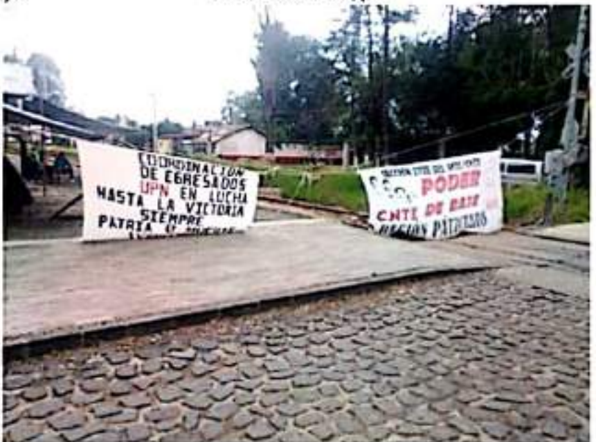
La ATEM respalda los movimientos sindicales, pero no participa con los bloqueos de oficinas o toma de vías del tren.

Cabe indicar que se anotó durante la presentación de López Gaona, que la ATEM acercará a sindicatos y organizaciones charlas y capacitación, según se registren necesidades, incluso con especialistas en los temas que se propongan, y a la sociedad se involucrará en asuntos y foros que tengan que ver con salud en las pandemias, cambio climático y aprovechamiento del agua, entre otros.