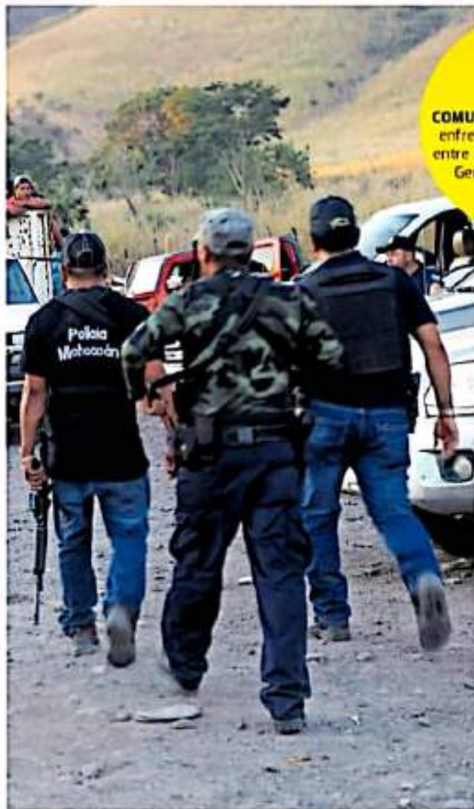
Habitantes denunciaron la situación de vulnerabilidad en la que se encuentran en Coahuila.

El documento consigna además que ante la violencia generalizada y el constante aseso de grupos del crimen organizado en la región de Tierra Caliente, habitantes de los municipios de Coahuila y Tepalcatépec denunciaron la situación de desprotección y vulnerabilidad en la que se encuentran las personas desplazadas y comunidades de acogida pidiendo la intervención de las Naciones Unidas.