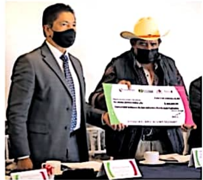
En el programa sólo están integradas 14 localidades

Mondragón Flores sostuvo que si el programa desaparece con el cambio de gobierno, no les afectará. "Trae más problemas y dificultades recibir el dinero que