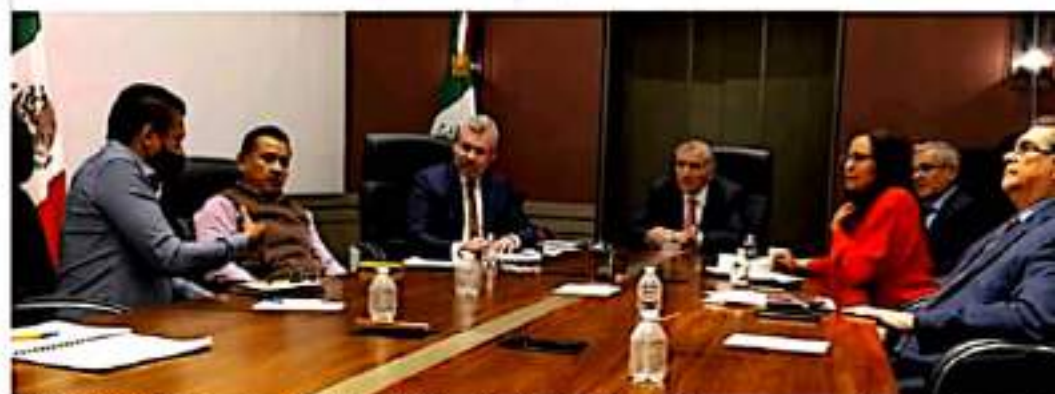
CIUDAD DE MÉXICO.- El gobernador electo de Michoacán, Alfredo Ramírez Bedoña, sostuvo una reunión con el secretario de Gobernación, Adán Augusto López.

Los funcionarios del Gobierno de México reafirmaron su voluntad de apoyar con recursos extraordinarios a Michoacán; sin embargo, coincidieron en que se debe buscar esquemas que garanticen que el dinero enviado se destine realmente a pago de nómina, ya que como señaló Poder de Base, la administración estatal no ha cumplido con ese objetivo y los docentes siguen esperando su salario.