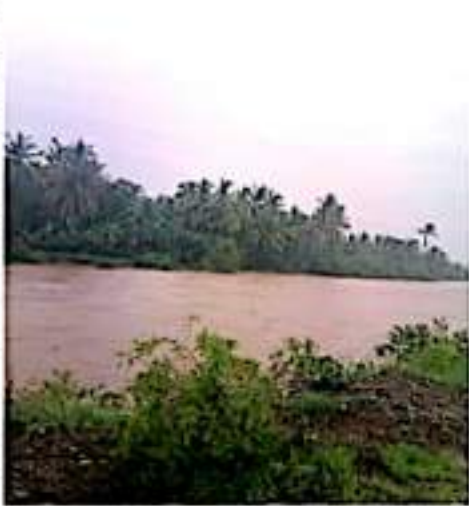
CD. LÁZARO CÁRDENAS, MICH.- La Jefatura Regional entregó un censo por daños en Acapulcan, Playa Azul y El Habbital a la Secretaría de Agricultura y Desarrollo Rural.

afectadas, para determinar el monto de los daños y para ver de dónde van a surgir los recursos que deberán entregarse a los damnificados".