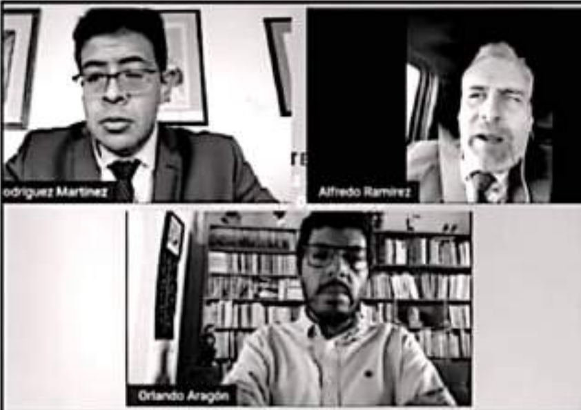
ALFREDO RAMÍREZ BEDOLLA UNA CHAPLA VIRTUAL PARA LA CARRERA DE ESTUDIOS SOCIALES DE LA UNAM

Ramírez contextualizó que, de cada 100 pesos erogados por el Gobierno Estatal y los Ayuntamientos, 46 provienen de la Federación, de ahí la necesidad de llevar una relación armónica.