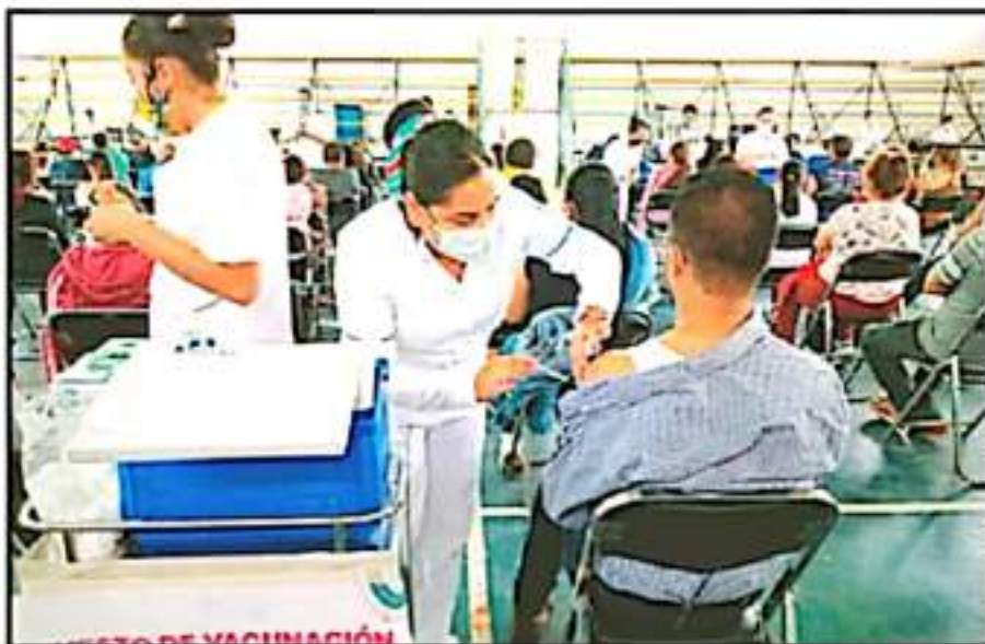
EN LA REGIÓN SE ESPERA EL RESULTADO DE LAS GESTIONES ANTE LA FEDERACIÓN PARA QUE DESTINEN MÁS VACUNAS