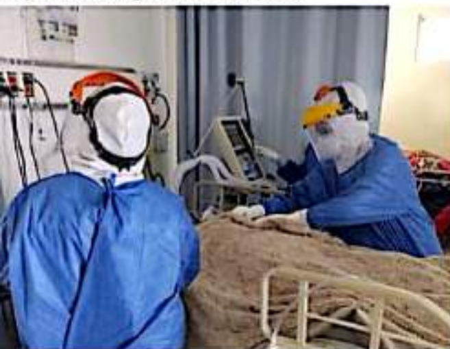
CD. LÁZARO CÁRDENAS, MICH.- El municipio de Lázaro Cárdenas ha reportado una disminución continua en cuanto a los contagios diarios de Covid-19.

Los municipios que durante los últimos días han liderado la lista de contagios diarios de covid-19, han sido Morelia y Uruapan de manera continua con un promedio de 40 a 60 nuevos contagios diarios, mientras que Lázaro Cárdenas ya abandonó los primeros puestos diarios de contagios.