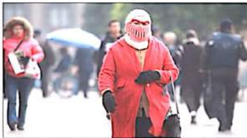
Entre todos podemos evitar la Cuarta Ola en este invierno.

la ejecución de más de seis mil obras y la implementación de programas sellos que son el ejemplo a nivel nacional, tales como Palomas Mensajeras, Palabra de Mujer y Espacio Emprendedor"... MENCIONA QUE en el programa Palabra de Mujer se superaron los más de 170 mil créditos entregados, para "impulsar los sueños de miles de emprendedoras michoacanas, promover su independencia y abatir desde todos los frentes la violencia de género". En el programa Palomas Mensajeras -puntualiza-, se logró que cerca de 10 mil michoacanos y michoacanas se reencontraran con sus seres queridos en EE. UU., "por lo que hoy es una estrategia que se replica en otros puntos del país"... EN CUANTO al sector salud, Aureoles Conejo precisó que "6 años después de reanudar las obras abandonadas por distintos gobiernos, se inauguró la primera Ciudad Salud en la historia de Michoacán, donde se ha puesto el corazón del personal de salud y la tecnología médica de punta al servicio de más de