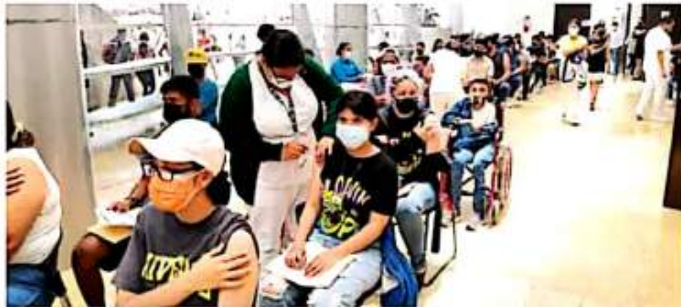
Vacuna. Durante la aplicación de la primera dosis a los jóvenes se registraron largas filas.

dosis cuando es inevitable un retraso", señalan los Centros para el Control y la Prevención de Enfermedades (CDC) de Estados Unidos.