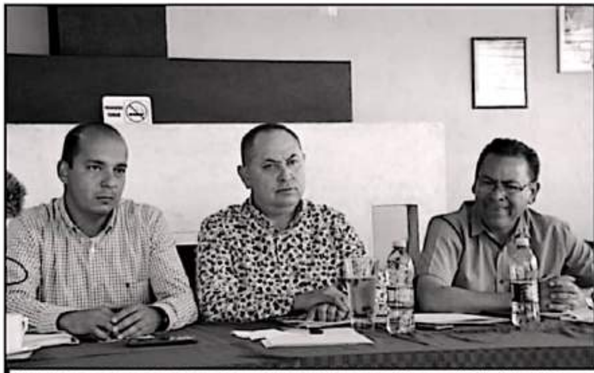
TRAS MESES DE LUCHA, EL STUMICH PODRÁ DESGANCAR AL SUEUM COMO TITULAR DEL CONTRATO COLECTIVO, AUNQUE TENDRÁ QUE DEMOSTRARLO