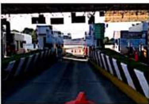
MORELIA, MICH.- Fueron liberadas las casetas de cobro en la autopista Siglo XXI, Morelia-Lázaro Cárdenas, a la altura de Santa Casilda, Taretan; la México-Guadalupe, a la altura de Contapec y Panidicuaro.

Y el "Poder de Base" dirigido por Benjamín Hernández se movilizará de manera masiva el próximo 1 de octubre, día en que inicia gestión el nuevo gobierno de Michoacán, a cargo de Alfredo Ramírez Bedoña.