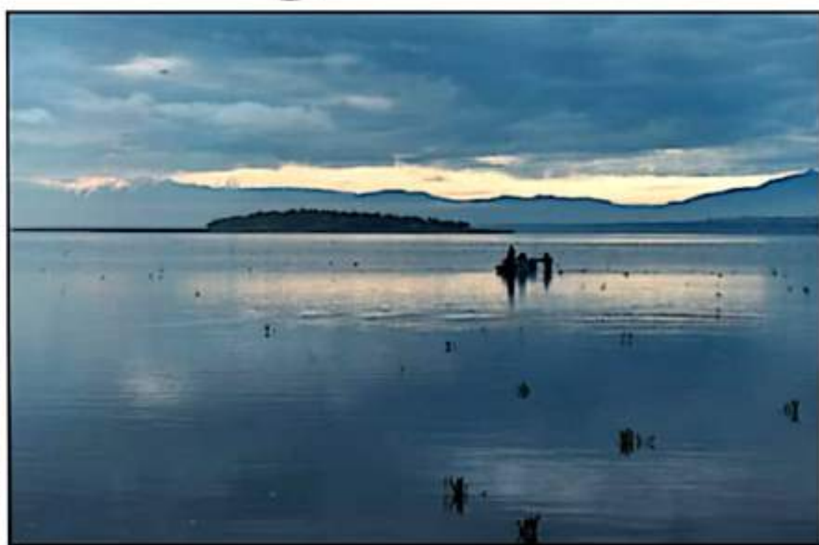
LOS PUNTOS CON MAYOR PROFUNDIDAD ESTÁN UBICADOS CERCA DE LA LONJA PESQUERA, DONDE SE REUNEN MÁS DE 700 PESCADORES DE LA REGIÓN.

No obstante, a pesar de los altos registros hasta este mes y el respo para los pescadores, especialistas advierten que se requiere