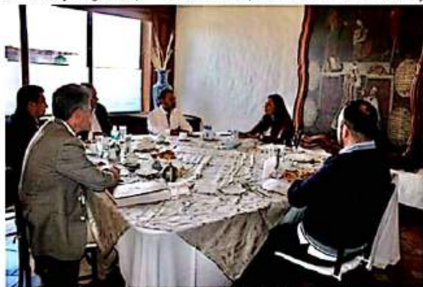
Diputados integrantes de la 75 Legislatura local.

Con diálogo y construcción de acuerdos, apuntó que se pondrán a realizar grandes acciones en el Congreso del Estado, al impulsar propuestas que aporten al desarrollo de Michoacán, atendiendo las demandas de los distintos sectores sociales.