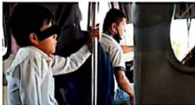
ZAMORA, MICH.- La mayoría de los choferes de taxis y minibuses, han relajado estas medidas.