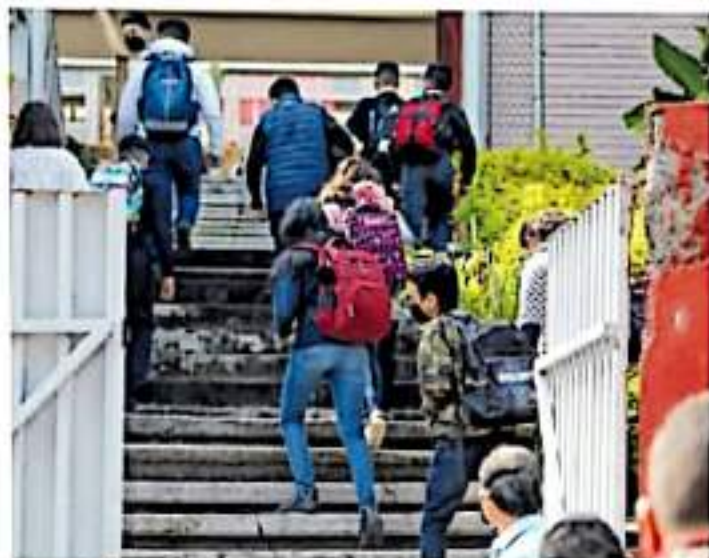
Los estudiantes deben mantener distancia y usar cubrebocas en todo momento

De enero a septiembre de este año, el SNTE-CNTE Poder de Base acumula un total de 74 días de bloqueos en las vías del Iteu, de acuerdo a los datos de la Asociación de Industriales del estado de Michoacán (AIEMNG).