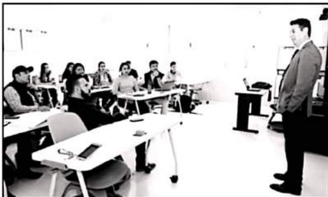
LOS JÓVENES UNIVERSITARIOS SON UN PILAR ELEMENTAL EN EL DESARROLLO DE LAS INDUSTRIAS EN EL ESTADO COMO EN AIEMAC.