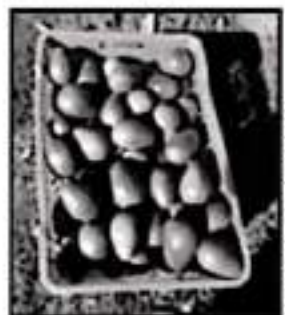
PROVECHO SIN REGULACIÓN

El extirpatorio de Sésileo decretó que las marcas colectivas son primas herramientas de las denominaciones de origen e indicaciones geográficas. Habló de las catirras de Capula, las guitarras de Paracho, las piezas de Santa Clara del Cobre, el queso Cotija y las ollas de Cocahuac. "No llegamos a las comunidades a decirles que hacer, sino que los acompañamos y facilitamos el ordenamiento de estos temas". Finalmente subrayó que la Ley Orgánica Municipal ya contempla el derecho al autogobierno, al presupuesto directo y a la justicia comunitaria en favor de las comunidades indígenas.