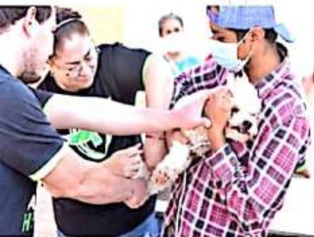
ZAMORA, MICH.- Debido a la buena respuesta de la población, serán instalados puntos fijos a partir del día 26 de septiembre.

Indicó que uno de los requisitos para que el biológico pueda ser aplicado, la mascota debe tener más de un mes de nacido, además de que debe contar con una buena condición de salud y señaló que en el caso de las hembras que estén amamantando o se encuentren embarazadas también son candidatas para la vacunación.