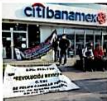
Amagan con más movilizaciones en los próximos días

Gobernamental que integrantes del Sindicato de Profesores de la Universidad Michoacana y de la Coalición Estatal de Sindi-