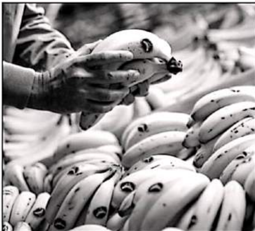
EL CULTIVO DE PLÁTANO MICHOACANEÑO HA SIDO DE LOS FRUTOS MÁS AFECTADOS DEBIDO A LAS FUERTES LLUVIAS.

Si bien a principios de agosto se había comenzado que las presentes lluvias habían sido más benéficas que dañinas, si había habido afectaciones en las plantaciones de plátano y las tormentas ocasionadas en las últimas semanas terminaron por menguar la producción en algunos municipios, como fue la de