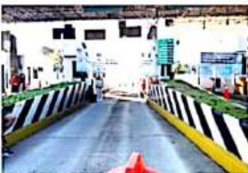
MORELIA, MICH.- Fueron liberadas las casetas de cobro en la autopista Siglo XXI, Morelia-Lázaro Cárdenas, a la altura de Santa Casilda, Taretán; la México-Guadalajara, a la altura de Contepec y Panindicuaró.

Y el "Poder de Base" dirigido por Benjamín Hernández se movilizará de manera masiva el próximo 1 de octubre, día en que inicia gestión el nuevo gobierno de Michoacán, a cargo de Alfredo Ramírez Bedolla.