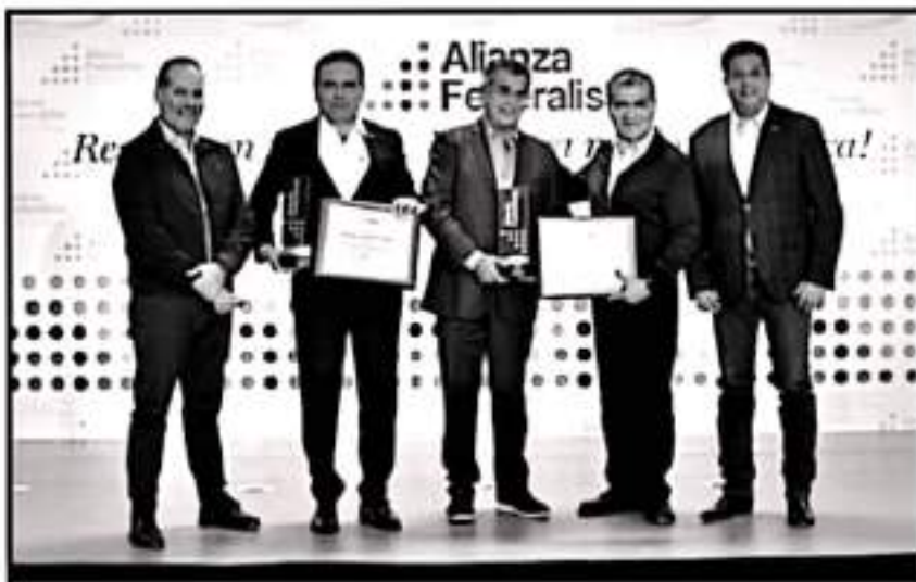
EL GOBERNADOR RESALTÓ QUE TERMINÓ EL PERIODO DE 6 AÑOS PARA EL CUAL FUE ELECTO Y AGRADECIÓ LA CONFIANZA

En esta reunión participaron los gobernadores Miguel Ángel Riquelme Solís, de Coahuila; Francisco I. García Cabeza de Vaca, de Tamaulipas; Silvano Aureoles Conejo, de Michoacán; Jaime Rodríguez Calderón, de Nuevo León; y Martín Orozco Sandoval, de Aguascalientes. Los asistentes reconocieron la destacada labor de los mandatarios de Michoacán y de Nuevo León, quienes culminan su encargo al frente de sus respectivos Estados. En el acto se destacó en especial