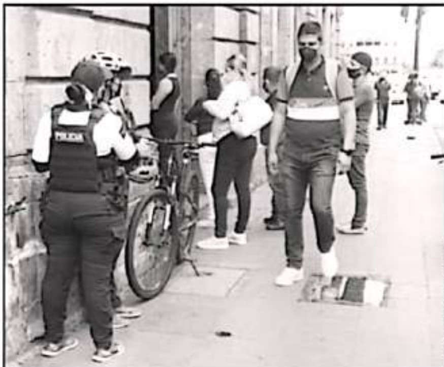
A PESAR DEL MAYOR NIVEL DEL ESTADO DE FUERZA PÚBLICA EN EL ESTADO, LA INCIDENCIA DELICTIVA SIGUE CRECIENDO

Desde 2015 se inició en la zona urbana un programa de atención y acompañamiento policial a los ciudadanos interesados en retirar recursos de los