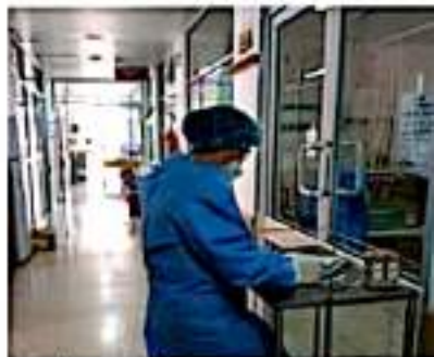
CD. LÁZARO CÁRDENAS, MICH.- En un 45.85 por ciento se encuentra la ocupación de camas

Asimismo, mantiene a disposición de la población el 800-123-2890 con 11 líneas para resolver todas sus dudas, y en caso de requerir atención médica la canalización a la unidad más cercana con disponibilidad.