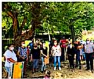
CD. LÁZARO CÁRDENAS, MICH.- El Sistema DIF municipal recibió la donación de 500 catres, colchonetas y cobijas, las cuales serán entregadas a familias damnificadas por el huracán "Nora".