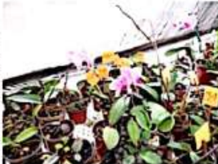
URUAPAN, MICH.- Las orquídeas silvestres están en peligro de extinción, a causa de todos los problemas que se tienen en los bosques.

Explicaron que las orquídeas juegan un papel muy importante en la cadena natural del planeta, pero lamentablemente, los aspectos que afectan al bosque, como es la tala ilegal, la quema del recurso forestal y la extracción