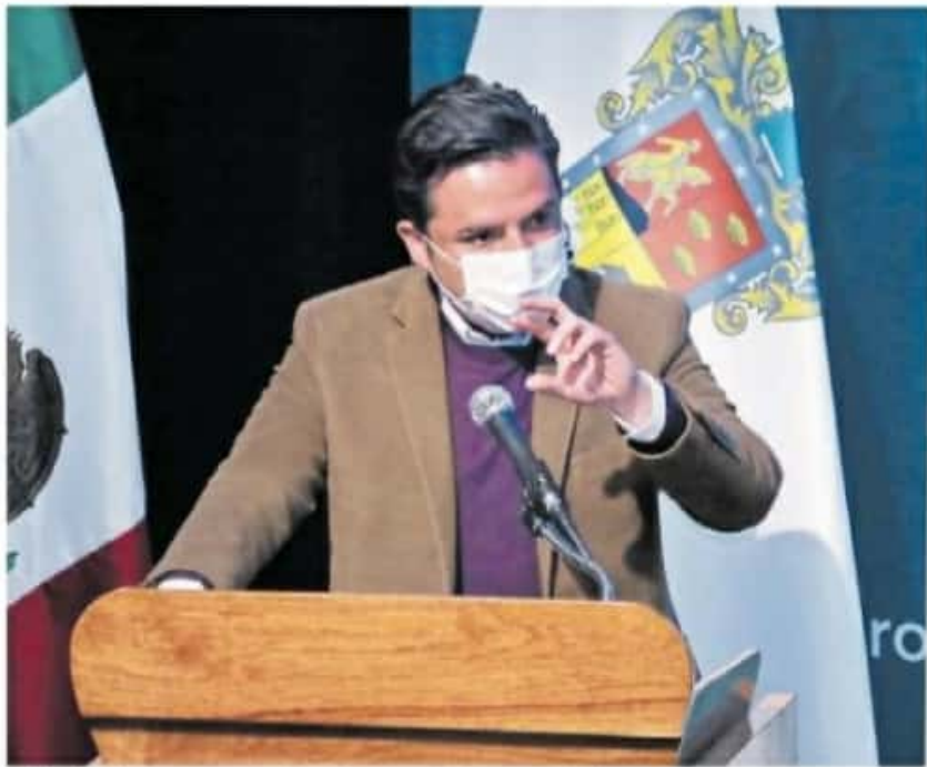
Zoé Robledo Aburto aseguró que hay especialistas trabajando en el desarrollo de una vacuna