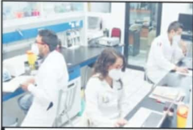
LA UNIVERSIDAD TAMBIÉN REALIZA UN BIOSENSOR PARA DETECTAR EL VIRUS