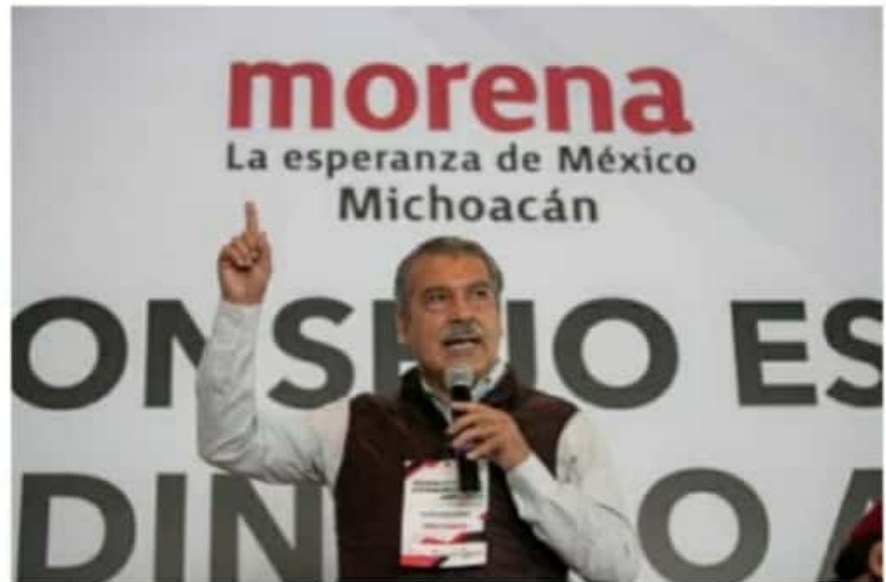
Raúl Morón Orozco, es hoy en día, el candidato a gobernador mejor posicionado a nivel nacional, con una mayor intención de voto en su estado.