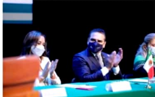
MORELIA, MICH.- El gobernador Silvano Aureoles Conejo, destacó el liderazgo de las mujeres en instituciones de salud y cuya coordinación ha permitido encausar la contención de la pandemia.

Cabe señalar, aunado a las acciones hospitalarias y de atención, en temas de economía, el IMSS atendió al Estado vía Créditos Solidarios a la Palabra otorgados por el Gobierno federal a empresarios, personas trabajadoras del hogar e independientes, y en 18 días se registraron, validaron y dispersaron cerca de 183 millones de pesos para siete mil 335 empresas, lo que permitió que el 70 por ciento de ellas no diera de baja a sus trabajadores, e incluso el nueve por ciento contrató a más.