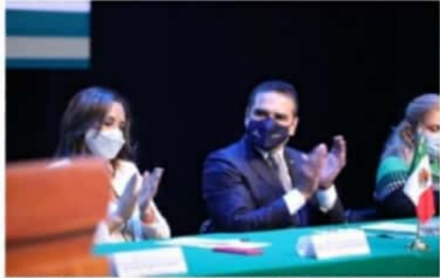
MORELIA, MICH.- El gobernador Silvano Aureoles Conejo, destacó el liderazgo de las mujeres en instituciones de salud y cuya coordinación ha permitido encausar la contención de la pandemia.

Cabe señalar, aunado a las acciones hospitalarias y de atención, en temas de economía, el IMSS atendió al Estado vía Créditos Solidarios a la Palabra otorgados por el Gobierno federal a empresarios, personas trabajadoras del hogar e independientes, y en 18 días se registraron, validaron y dispersaron cerca de 183 millones de pesos para siete mil 335 empresas, lo que permitió que el 70 por ciento de ellas no diera de baja a sus trabajadores, e incluso el nueve por ciento contrató a más.