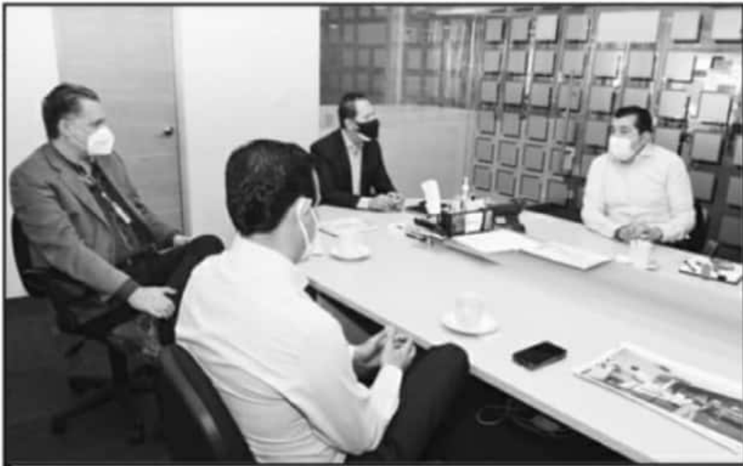
EL EDIL DE LA PIEDAD, EMPRESARIOS Y EL TITULAR DE LA SEDECO, COINCIDEN EN APOYAR EMPRENDEDOR EN ESTOS MOMENTOS.