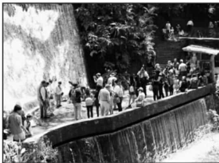
EN EL PROGRAMA DEL 2006 PARTICIPARON LOS SECTORES ACADÉMICO, INDUSTRIAL Y TURÍSTICO, ENTRE OTROS.

La necesidad impostergable de modificar dicho "documento madre" radica en atender los cambios que registran los ecosistemas por diferentes situaciones, desde amenazas como los incendios forestales, hasta el movimiento de especies. "Tenemos que saber cómo está el área para