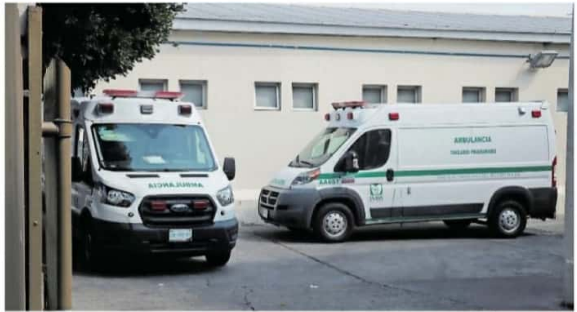
El IMSS ofrece atención médica al 53 por ciento de la población

didias sanitarias que vigilará el Gobierno de Michoacán.