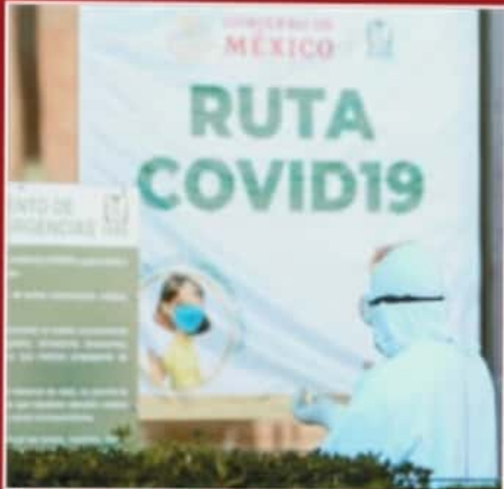
LA PANDEMIA TRAJÓ CONSIGO CAMBIOS IMPORTANTES EN EL IMSS

El titular del Seguro Social remarcó que la COVID-19 seguirá presente por largo tiempo a pesar de contar con la vacuna, por ello "es de vital importancia empezar a tener esos puntos de contacto, esas dimensiones de colaboración y empezar a trabajar".