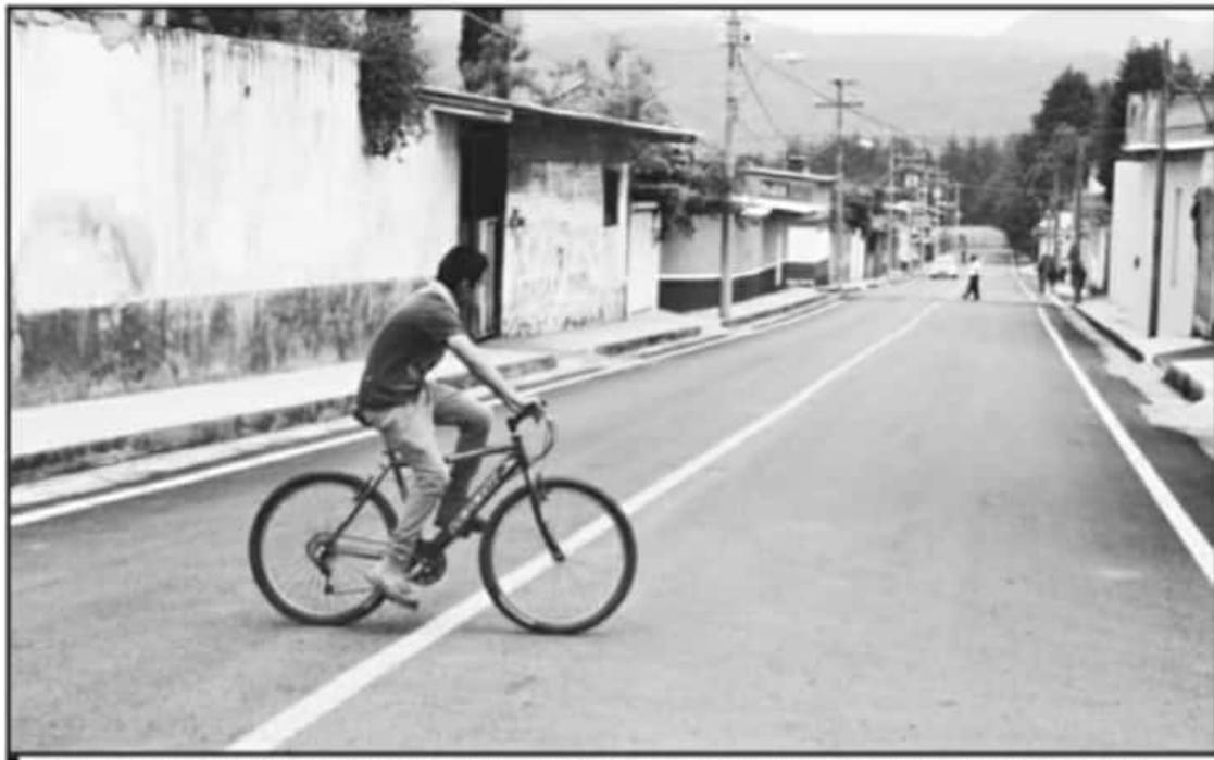
SE INFORMÓ QUE TANTO ZIRAHUÉN COMO HUÁNCITO ESTÁN EN SU DERECHO DE UNA LIBRE AUTODETERMINACIÓN, AUTOGOBIERNO Y DEL PRESUPUESTO.

Históricamente, informó que el presupuesto directo para los pueblos indígenas es una aspiración que mantiene sus raíces en los acuerdos de San Andrés, comunidad indígena de Chiapas, en 1996, y que fueron impulsados por el Ejército Zapatista de Liberación Nacional (EZLN) y el Congreso Nacional Indígena (CNI) donde manifiesta que, "las autoridades competentes realizarán la transferencia ordenada y paulatina de recursos, para que ellos mis-