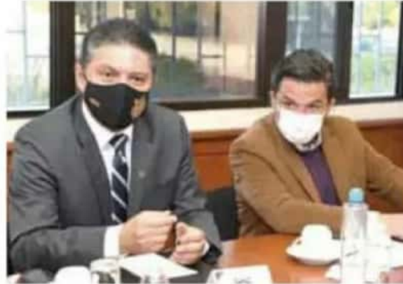
Colaboración. El director general del IMSS se reunió con autoridades e investigadores nicolaítas.

"Son tres proyectos que se tienen en la Universidad Michoacana y lo que se ha hecho es trabajar de cerca con ellos para coordinar los avances y