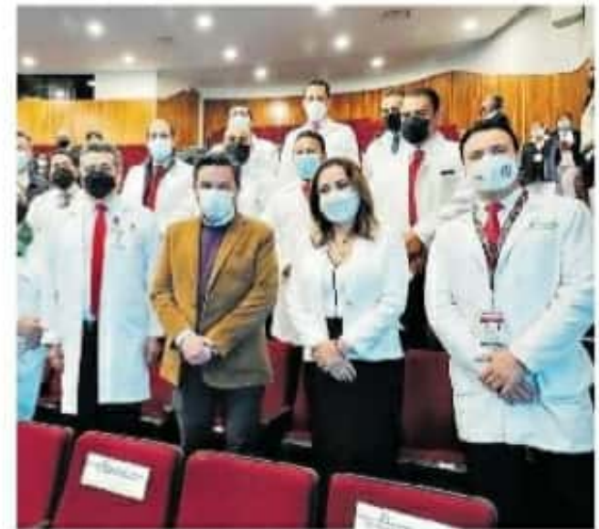
Se unificaron esfuerzos para brindar atención médica a todo paciente con COVID-19.

Detalló que la atención de la pandemia se basó en cuatro ejes fundamentales: plan