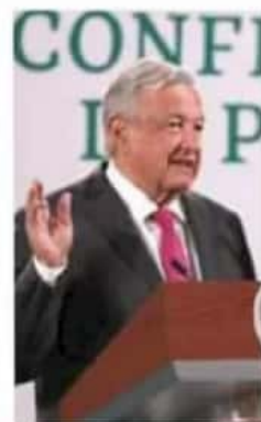
Presidente. Dijo que protegerán a los candidatos. / CLARIFICADO

El presidente de México detalló que este fenómeno también ha sido motivo por el que se han registrado fraudes electorales. "Se hacían acuerdos con estos grupos para rellenar las urnas, para falsificar las actas; entonces, a cambio tenía que haber impunidad. Por eso en algunos estados todavía no se puede resolver el problema de la violencia, de los homicidios, porque se metieron hasta abajo, en los municipios echaron raíces". MIGUEL VELÁZQUEZ