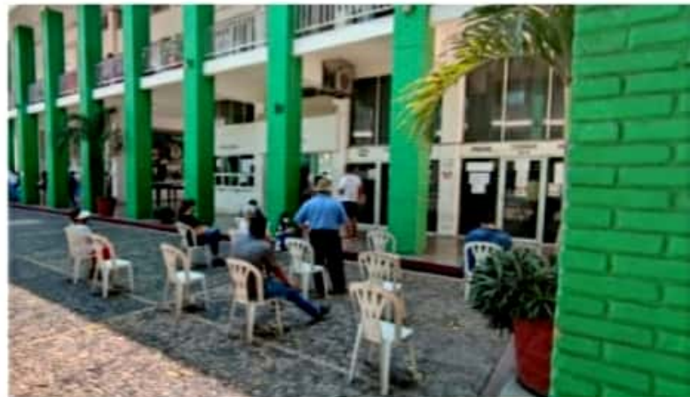
CD. LÁZARO CÁRDENAS, MICH.- El Departamento de Catastro invita a la ciudadanía a aprovechar el descuento del 5 por ciento en pronto pago de predial, cuya promoción concluye este sábado.