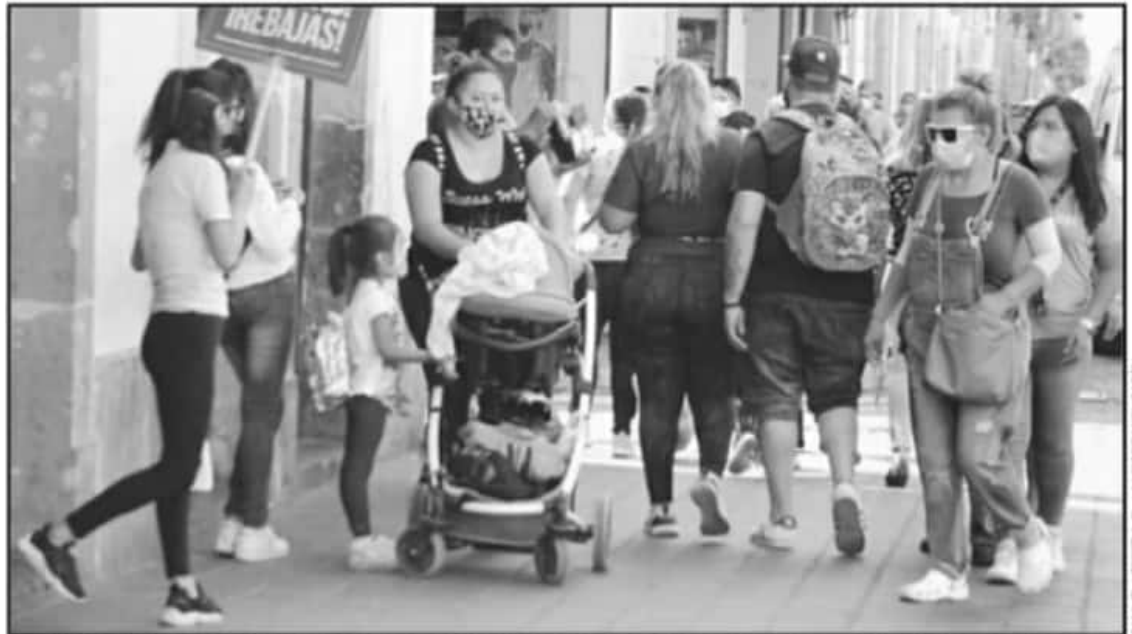
A PESAR DE QUE MORELIA ES LA CIUDAD QUE REGISTRA EL MAYOR NÚMERO DE MUERTES, LA MOVILIDAD SIGUE SIENDO ALTA EN EL CENTRO HISTÓRICO.

han recuperado. Su letalidad es del 9.6 por ciento.