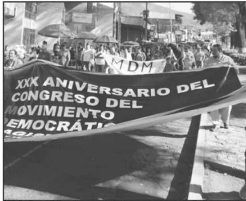
LOS ACUERDOS QUE BUSCARÁN EN LA PRÓXIMA ASAMBLEA SERÁN PARA MANIFESTARSE EN CONTRA DE LOS GOBIERNOS.

INTEGRANTE DE LA DIRIGENCIA REGIONAL DE LA CNTE