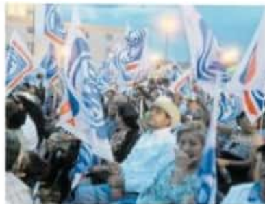
Las medidas partirán de la valoración establecida por la SSM

Posterior a la instalación de la quinta Mesa de Seguimiento al Proceso Electoral 2020-2021, el secretario de Gobierno subrayó que las medidas a considerar en las próximas elecciones, partirán de una valoración establecida desde la SSM, así como de los órganos electorales que vigilarán el correcto desarrollo de la