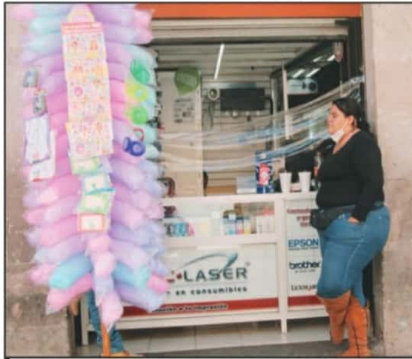
EL RETORNO NORMAL DE LAS ACTIVIDADES COMERCIALES DARÁ INICIO A PARTIR DE MAÑANA EN TODO EL ESTADO.

Frente a representantes del IMSS, ISSSTE, Guardia Nacional, así como representantes de la sociedad civil que participan en el Comité de Seguridad en Salud, la epidemióloga reconoció que la entidad va saliendo de la segunda