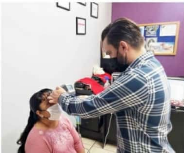
JACONA, MICH.- El presidente del DIF municipal, informó que la campaña ha tenido gran aceptación.

La atención que se brinda es para toda la familia y todos los sectores de la población, por lo que se invita a las y los jaconenses a que acudan para su revisión y adquirir sus lentes a bajo costo para mejorar su calidad de vida.