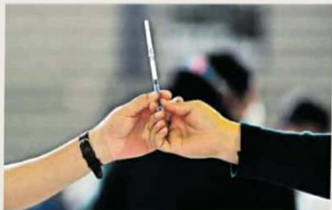
Las vacunas están garantizadas y continuará la planeación

Según la funcionaria, en el IMSS de Camelinas hay brigadas de vacunación y lo único que existe es mal información, ya que la vacunación es lenta porque hay lineamientos que seguir y una lista que cumplir.