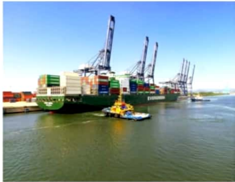
CD. LÁZARO CÁRDENAS, MICH.- Un barco que accede al Puerto de Lázaro Cárdenas, dependiendo su giro, paga una cierta tarifa a la Apilac.

Esto, señalan los especialistas obedece a que se ha incrementado la demanda de carga, pero con escasez de contenedores y espacios en los barcos.