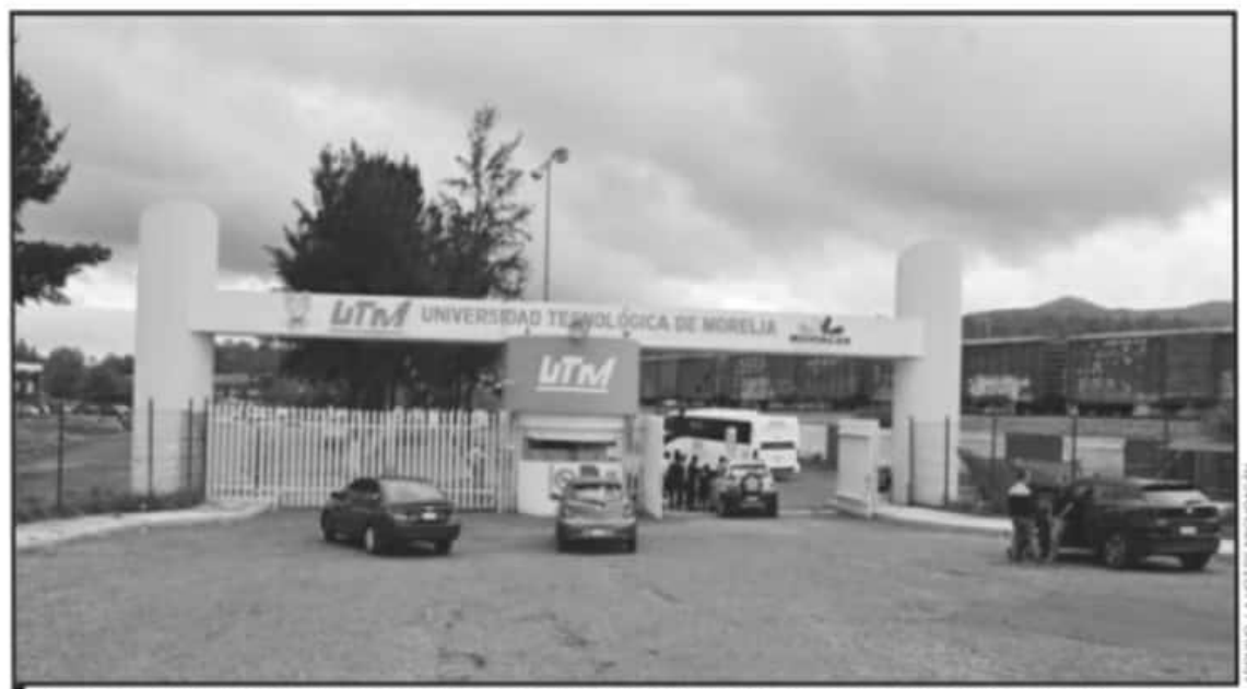
SINDICALIZADOS HAN PASADO 16 MESES EN ESPERA DEL PAGO DE LAS PRESTACIONES SINDICALES MARCADAS EN EL CONTRATO COLECTIVO DE TRABAJO.

los trabajadores no quieren más paros, quieren ser tomados en cuenta y que se les resuelva".