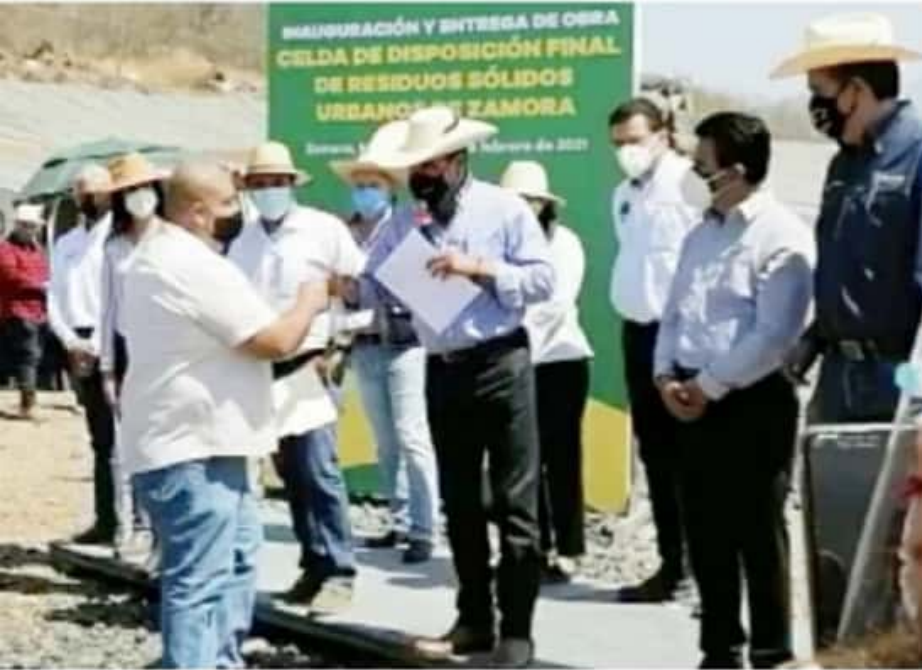
ZAMORA, MICH.- El jefe de Tenencia aprovechó para entrevistarse con el gobernador, a quien puso al tanto de la situación.