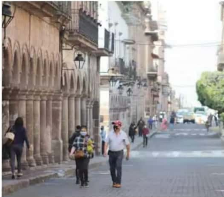
Morelia. Autoridades reiteran la importancia de contener los contagios en la capital.

Añadió que los centros comerciales, que son de riesgo