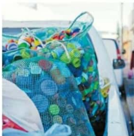
Las taps serán entregadas a empresas que apoyan a fundaciones benéficas