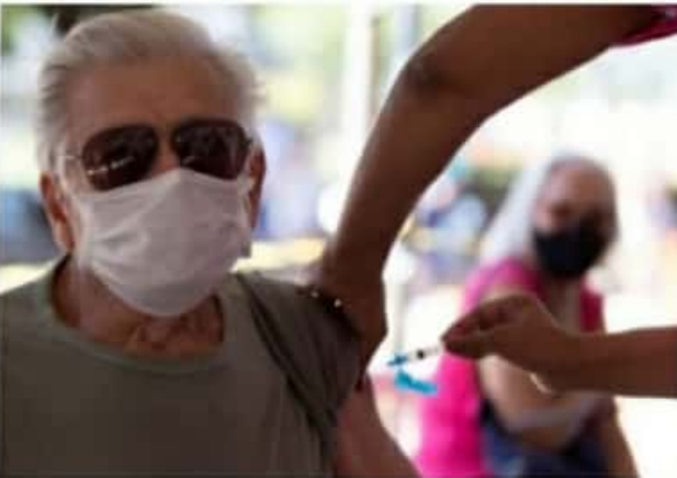
CD. LÁZARO CÁRDENAS, MICH.- El domingo o lunes de la próxima semana, iniciará la primera etapa de vacunación a adultos mayores de 60 años en Lázaro Cárdenas.

Las personas que no estén registradas dentro de la plataforma, podrán también vacunarse, tras ser anotados en una zona de registro que se instalará en los puntos de vacu-