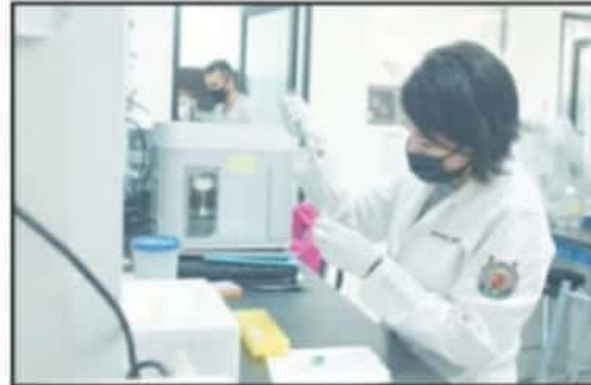
LOS LABORATORIOS DE LA UMSNH TRABAJAN EN BIOLÓGICO DESDE 2020.

Fuera del tema de la COVID-19, la autoridad máxima del IMSS añadió que también existe el planteamiento de apoyar a la universidad michoacana para la puesta en marcha de su Clínica Universitaria que, si bien no es un proyecto re-