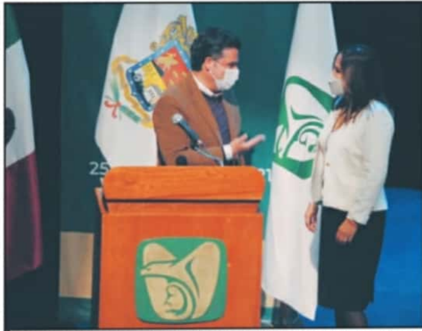
EN EL INFORME SE DESTACÓ LA LABOR DEL IMSS COMO DIFÍCIL, LA QUE PLANTEÓ MÁS ATENCIÓN Y DECLINES ECONÓMICOS.

Por su parte, la delegada recordó que el primer caso confirmado de COVID-19 en el IMSS Michoacán se dio en abril, en el Hospital General Regional Número Uno de Charo; el primer contagio de personal del instituto fue en mayo en Apatzingán, mientras que el mayor