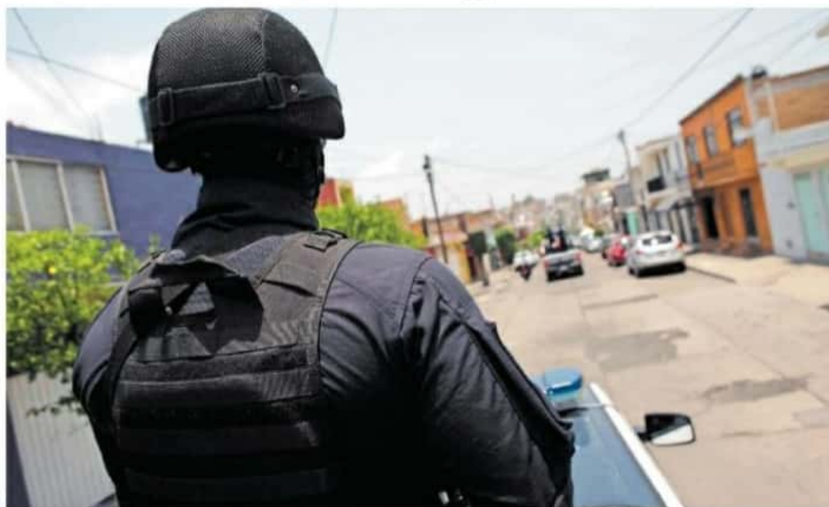
La ASF detectó inconsistencias en el presupuesto ejercido para seguridad en el municipio de Lázaro Cárdenas