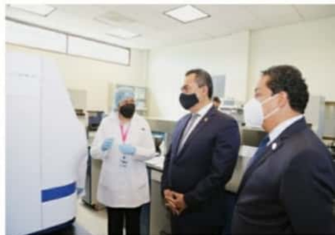
MORELIA, MICH.- Los laboratorios de genética y química de la FGE cumplen con estándares internacionales, aseguró el fiscal general, Adrián López Solís.

En ese sentido, recalcó que la Fiscalía ha invertido en la adquisición de equipos de alta especialidad para equiparlos con tecnología de punta a fin de procesar muestras y evidencias de manera más ágil, en menor tiempo y sin márgenes de errores. López Solís, manifestó que los laboratorios cumplen con estándares internacionales como el del FBI garantizando con ello que el trabajo que se realiza en los mismos es confiable.