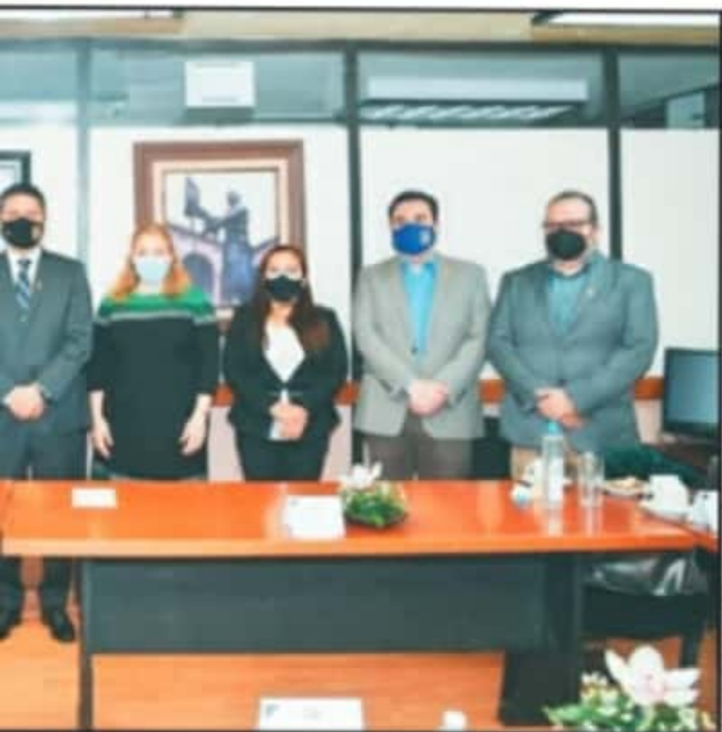
EL DIRECTOR DEL IMSS DESTACÓ QUE ES IMPORTANTE DETONAR EL POTENCIAL DE LOS ALUMNOS