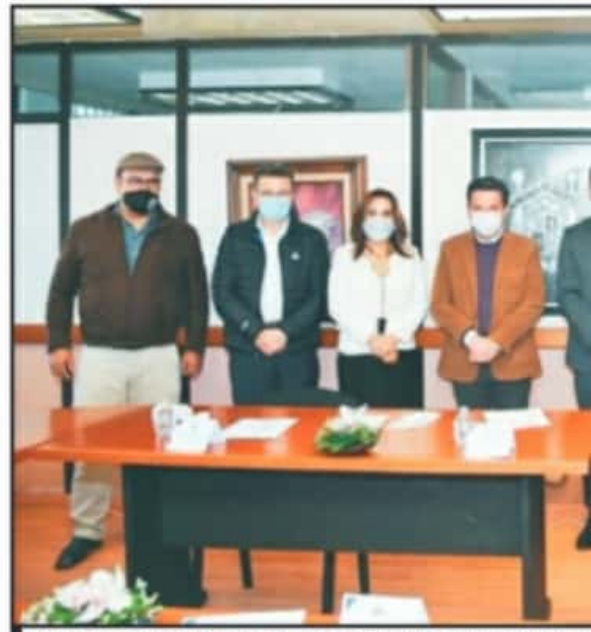
EN UN ENCUENTRO CON LAS AUTORIDADES ACADÉMICAS DE LA UMSNH, EL TIT

lacionado a dicho instituto, si existiera una corresponsabilidad de apoyo debido al cumplimiento que tiene la casa de estudios en sus cuotas obrero-patronales.