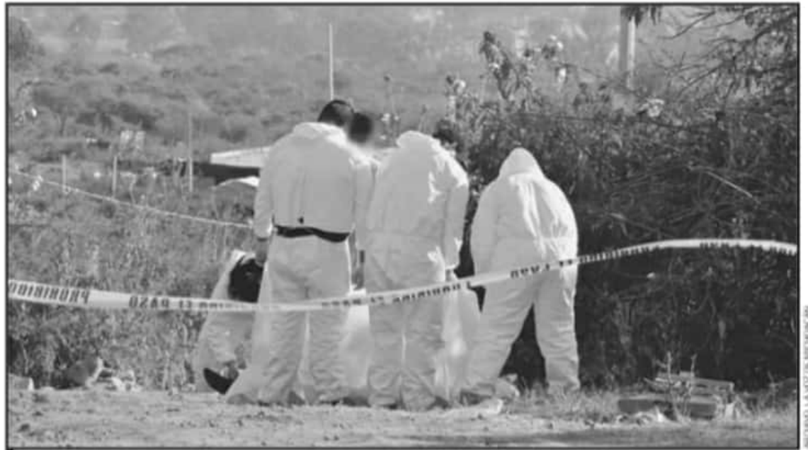
LA CAPITAL MICHOACANA SE HA UBICADO COMO EL MAYOR FOCODE FEMINICIDIOS EN EL ESTADO DE MICHOACÁN.

Es importante recordar que Morelia se ha ubicado como el mayor foco rojo de feminicidios en Michoacán, ya que cerró el año 2020 en la posición número