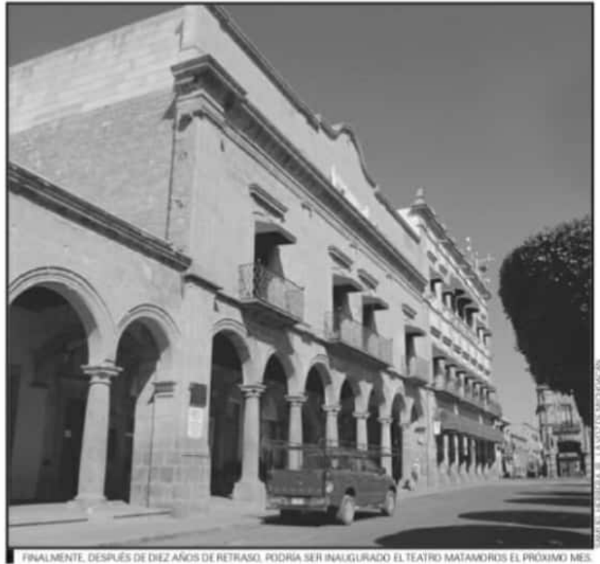
FINALMENTE, DESPUÉS DE DIEZ AÑOS DE RETRASOS, PODRÍA SER INAUGURADO EL TEATRO MATAMOROS EL PRÓXIMO MES.

Desde un inicio, el objetivo era que el inmueble y la obra se estrenaran para el Centenario y Bicentenario de la Independencia de México, situación que, a diez años no se ha logrado materializar. Prácticamente cada año desde 2016 se ha buscado que el teatro quede concluido antes de los festivales cinematográfico de finales de año; la promesa para 2021 es que estará listo y entregado antes de que concluya la administración silvanista.