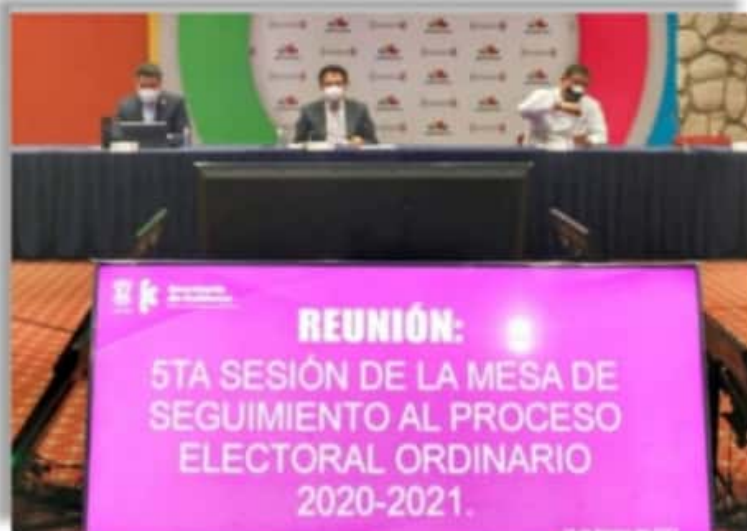
Acuerdan pacto de paz y certidumbre en proceso electoral.