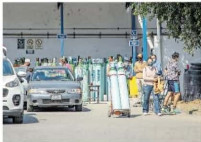
En ventas ilícitas un tanque puede costar hasta 40 mil pesos

La Procuraduría Federal del Consumidor (Profeco) ha detectado más de 700 perfiles en redes sociales que especulaban con la venta y renta de tanques y concentradores. Profeco en coordinación con la Policía Cibemática y con el apoyo de las plataformas de redes sociales y de comercio electrónico, ha logrado que se "bajen" un