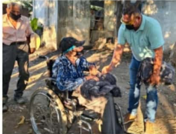
CD. LÁZARO CÁRDENAS, MICH.- El Sistema DIF estatal en la región de la Costa continúa brindando apoyos a adultos mayores y familias de escasos recursos.