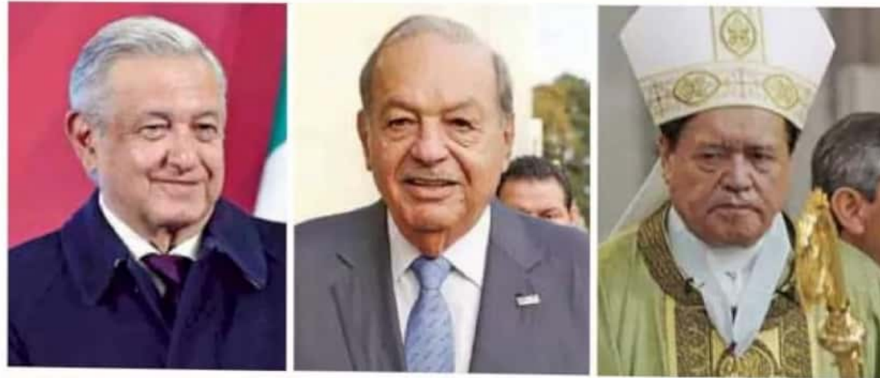
Estado. Obrador se mantiene resguardado, Slim está hospitalizado por precaución y Norberto Rivera fue desintubado.

“Es un asunto de salud y, por supuesto, no le deseamos mal a nadie; tenemos que ser solidarios con todos los que están atravesando esta enfermedad, pero es un hecho que la pandemia no se ha manejado de la forma más adecuada y ahí tenemos los resultados”, externó la confederación.