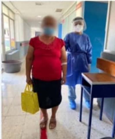
CD. LÁZARO CÁRDENAS, MICH.- Dos mujeres fueron dadas de alta del Hospital General "Dra. Elena Avilés" de Lázaro Cárdenas.

■ Ambas deberán permanecer en sus hogares, siguiendo las indicaciones de los médicos