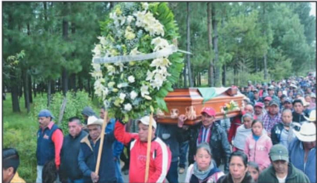
LA VERSIÓN DE LAS AUTORIDADES DE LA FISCALÍA DE MICHOACÁN VERTIDA NO HA CAMBIADO: EL HOMBRE DE 50 AÑOS MURIÓ A CAUSA DE UNA "CAÍDA ACCIDENTAL".

Uno de los puntos que más llama la atención, es que Homero Gómez fue localizado sin vida a 100 metros del último lugar de