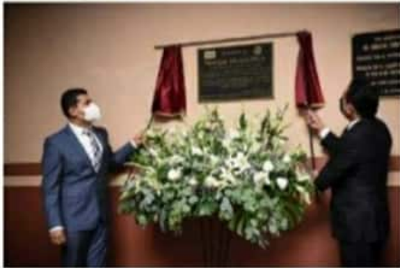
El presidente de la Mesa Directiva, reconoció su legado y trayectoria, marcada por su activismo a favor de los ejidos, comunidades indígenas y organizaciones campesinas.

"La mejor manera de recordarlo hoy y todos los días, es seguir adelante como él le hubiera querido. La mejor manera de honrarlo, hoy más que nunca, es estar unidos, más allá de colores, de distinción social. Les doy las gracias de todo corazón a mi nombre y a de su familia por todo el cariño que le dieron y le siguen dando", finalizó la legisladora local.