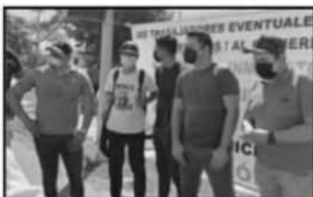
CULPAN AL GOBIERNO POR LA FALTA DE SERIEDAD.

El vocero de la coordinación apuntó que hay que reconocer que hay mucha disponibilidad por el Gobierno Federal y últimamente por el Gobierno Federal, pero añadió que "hay disponibili-