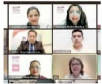
Busca empoderar a las mujeres en el proceso electoral.

'Es una actividad que se va trabajando en coordinación con el Instituto Nacional Electoral', la Asociación Nacional de Consejeras Electorales, y ahora el IEM se va a sumar a esta Red, es una Red Nacional de Candidatas, donde nosotras a través de un aviso de privacidad logramos la autorización de todas las candidatas que se registren en el proceso electoral y no me refiero solo a candidatas encabezando planillas o fórmulas, sino también, candidatas suplentes y a todos los cargos. Todas las can-