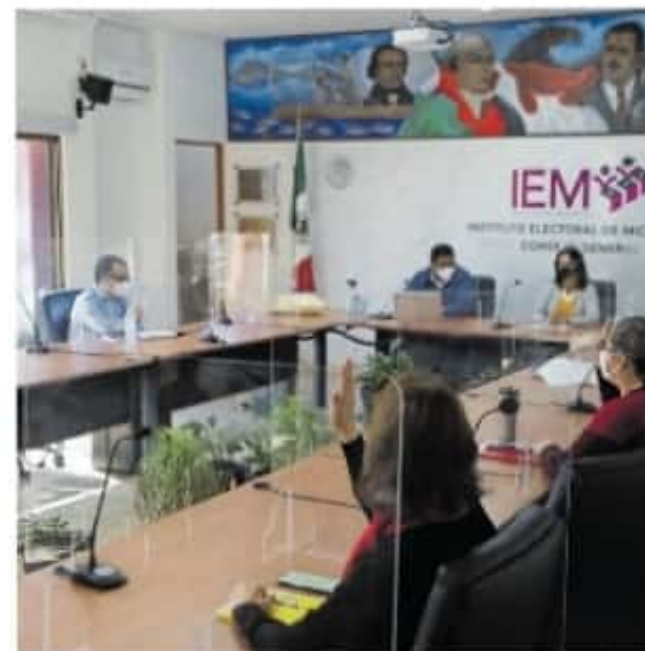
Entre sus facultades está el atestiguamiento del proceso de conteo y del cierre de bodegas

De acuerdo al artículo 27 de la Ley general de Instituciones y Procedimientos Electorales, los observadores pueden estar presentes en los actos de preparación y