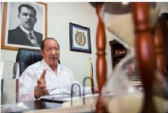
CD. LÁZARO CÁRDENAS, MICH.- De acuerdo a una encuesta elaborada por Contact Line y Servicios de Personal del Estado de México (SPEM), Leonel Godoy Rangel es claro favorito para ganar la elección a diputado federal por este distrito.