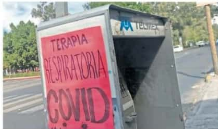
Las terapias respiratorias "patito" son parte de la oferta

centenar de páginas y se cierran 700 perfiles "que especulaban y defraudaban a consumidores, a través de Internet, con la venta de tanques y concentradores de oxígeno" señaló esta dependencia a través de un comunicado.