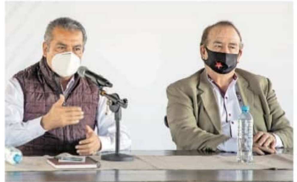
El munícipe renunció porque no quiere que su cargo influya en el proceso electoral

EL ALCALDE Raúl Morón, dio a conocer que al abandonar el cargo enfocará su trabajo político en la consolidación de la Cuarta Transformación en Michoacán a partir del próximo primero de febrero