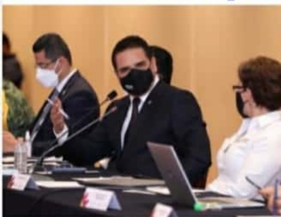
MORELIA, MICH.- El gobernador indicó que los 4 mil 192 casos activos y la alta movilidad colocan al estado en un nivel que riesgo y se deben tomar medidas.