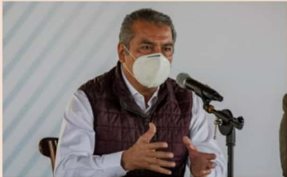
MORELIA, MICH.- Informó que los avances que ha tenido este Gobierno los van a hacer público en el marco de petición de licencia.

Agregó que se continúa con obra pública, los proyectos y programas sociales que se tenían proyectados en pleno proceso electoral, se tiene claridad con el tema económico, hay varios anuncios importantes para este término de la pandemia que es una preocupación de todos y todas. Explicó que el 31 de enero, aún estará en el Comité de Salud porque su licencia entrar en vigor el 1 de febrero, se tomen algunas decisiones adicionales que vengán a fortalecer el cuidado de la salud de todas las morelianas y morelianos.