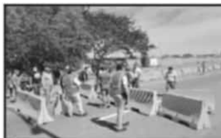
SE TRATABA DE BLOQUEO Y SE CONVIRTIÓ EN PLANTÓN.