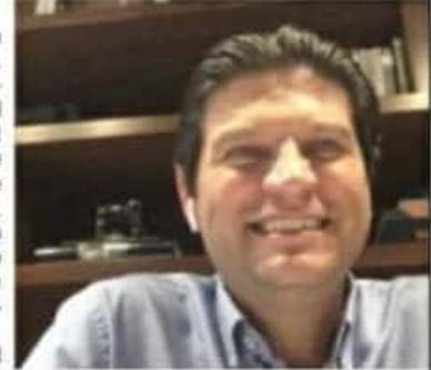
MORELIA, MICH.- Refrendó su compromiso por construir un municipio en el que las niñas y mujeres se sientan libres y seguras.

Lo anterior lo señaló al encabezar una charla digital con mujeres panistas y morelianas, titulada "Mujeres en Acción por Morelia", en donde refrendó su compromiso por construir un municipio en el que las niñas y mujeres se sientan libres y seguras.