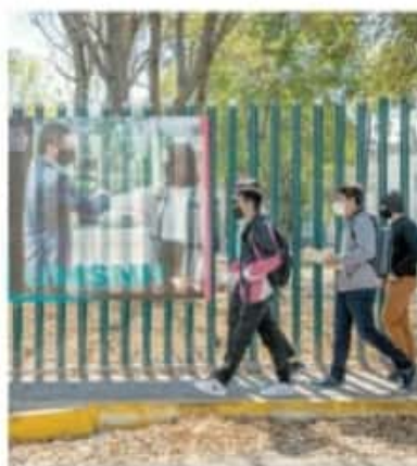
La UMSNH se unió al llamado a la ciudadanía. CARMEN HERRÁNDIZ

Mediante un pronunciamiento público, la Universidad Michoacana de San Nicolás de Hidalgo (UMSNH), junto con otros sectores empresariales y eclesásticos de Michoacán, hizo un llamado a la ciudadanía a concientizar y actuar de manera solidaria y responsable frente al incremento por casos de Covid-19 en el país y en el estado, de acuerdo a los últimos reportes oficiales. "Se exhorta a cumplir de forma íntegra las medidas establecidas por las autoridades federales y locales para evitar la propagación y el crecimiento de la pandemia que cada día se vuelve más alarmante", señala el documento que es firmado por la Arquidiócesis de Morelia, el Consejo