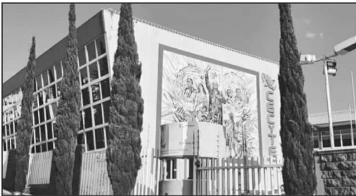
DESDE OCTUBRE ESTÁN MANIFESTÁNDOSE LOS SUBSISTEMAS DE EDUCACIÓN MEDIA SUPERIOR, ANTE EL ABANDONO INSTITUCIONAL QUE PADECEN.

compromiso de cubrir los adeudos con los trabajadores.