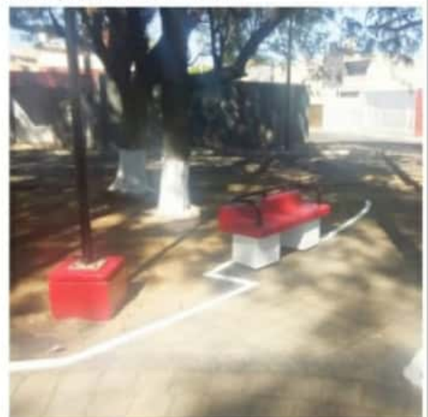
ZAMORA, MICH.- Las acciones permiten que los vecinos tengan un mejor ambiente, esté limpio y sea más seguro.

Las acciones continuarán en la zona señalada pues este asentamiento cuenta con varias plazoletas, mismas que tiene espacios para el ejercicio; y si bien en estos momentos no se permiten las reuniones en los espacios públicos, es necesario mantenerlos, ya que los zamoranos están cumpliendo con las medidas y pronto habremos de regresar a la cotidianidad, y queremos encuentren estos espacios en buenas condiciones.