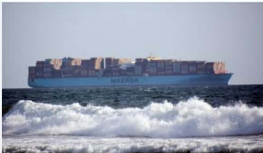
CD. LÁZARO CÁRDENAS, MICH.- El buque Maersk Essen se encuentra anclado en zona de fondeadero; el buque en ruta de China a Estados Unidos, fue desviado a Lázaro Cárdenas tras enfrentar marejadas que propiciaron la caída al mar de 750 contenedores.