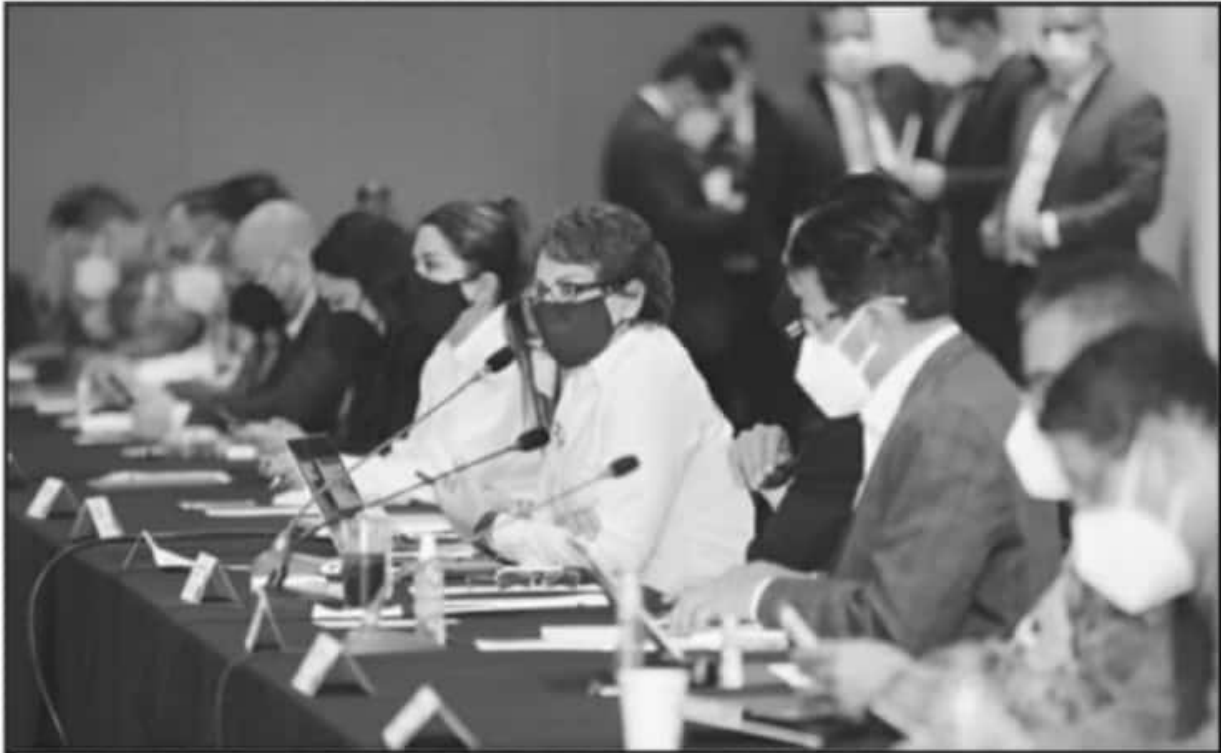
EN PRESENCIA DEL GABINETE ESTATAL Y DE REPRESENTANTES DE LOS SERVICIOS DE SALUD SE HABLÓ DE LA ALTA MOVILIDAD Y EL ALTO NIVEL DE RIESGO.

Indicó que como parte de los protocolos el uso del cubrebocas sigue siendo obligatorio, así