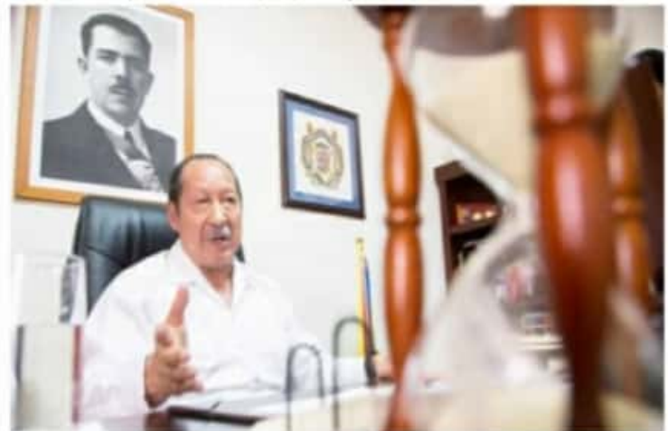
CD. LÁZARO CÁRDENAS, MICH.- Según encuesta elaborada por Contact Line y Servicios de Personal del Estado de México, el exgobernador Leonel Godoy Rangel, encabeza la preferencia electoral para la diputación federal por Lázaro Cárdenas, por Morena.

Cabe resaltar que en cuanto a intención de voto por Partidos, Morena encabeza la preferencia con 30.1% en Lázaro Cárdenas según los datos que arroja la encuesta realizada. Por su parte el PAN ostenta un 20.3% de intención de votos, el PRI 10.0% y el PES un 5.8%. Asimismo, el 10.1% aún no se decide por algún partido, mientras que el 23.8% dicen que no votarían por ningún partido.