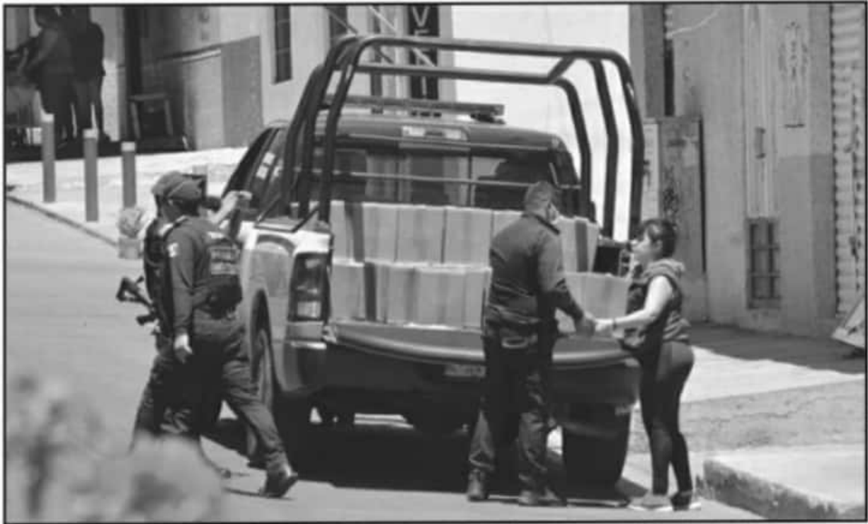
EL AÑO PASADO EL GOBIERNO DEL ESTADO DE MICHOACÁN ENTREGÓ CIENTOS DE MILES DE DESPENSAS Y CANASTA ALIMENTARIAS EN PLENO CONFINAMIENTO.

Es importante recordar que, en abril de 2020, ante la crisis económica que se comenzaba vivir a causa del resguardo obligatorio, el Gobierno del Estado lanzó el programa ‘Michoacán Alimenta’ para la entrega de despensas a