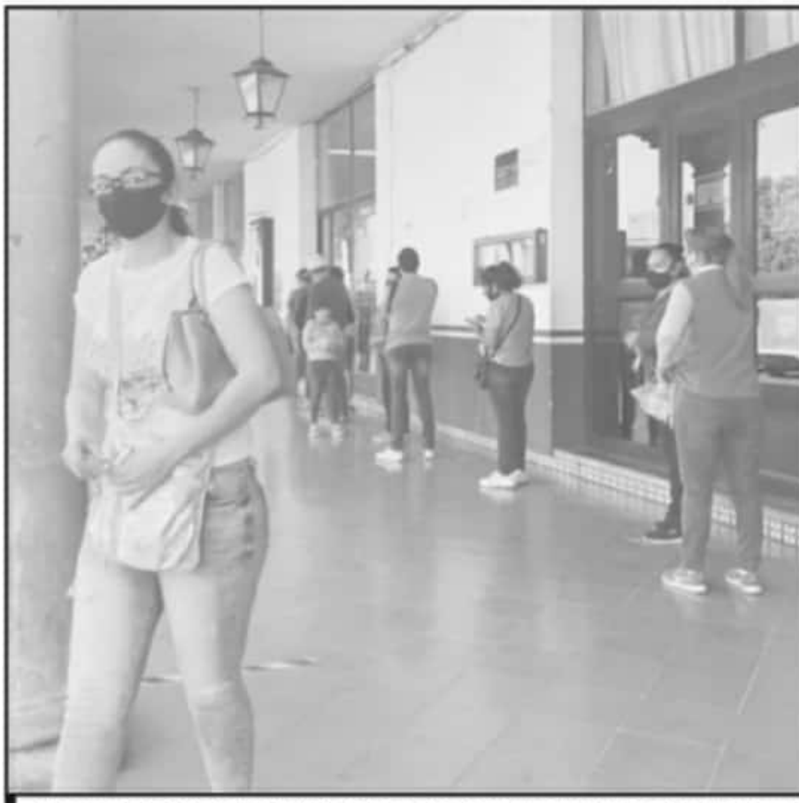
PESE A LA CONVOCATORIA DE NO PAGAR, LOS CONTRIBUYENTES DETERMINARON HACER FILAS EN LAS VENTANILLAS

En lo que hace a la convocatoria emitida para que el contribuyente no realizara los pagos