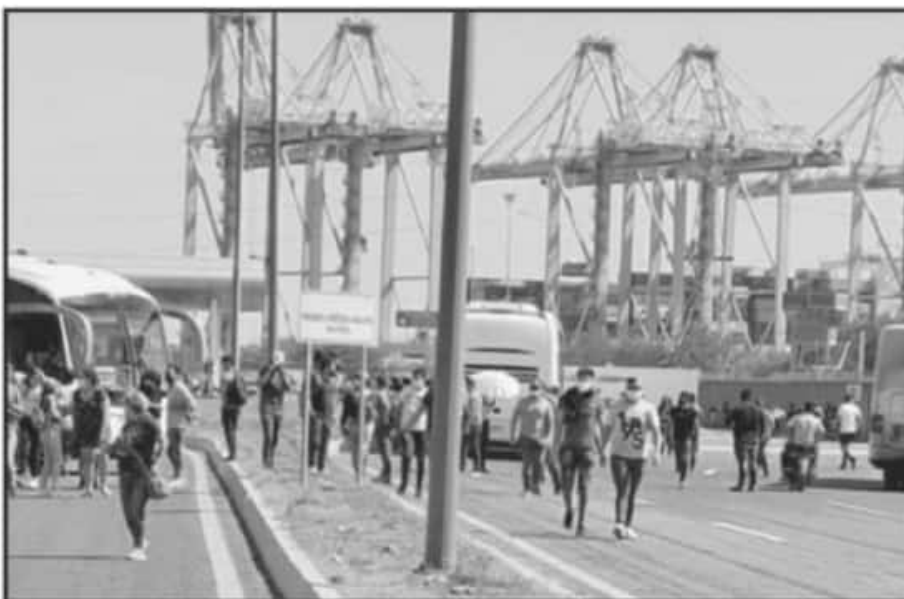
EL DESCONTENTO ENTRE EL SECTOR MAGISTERIAL VIENE CRECIENDO CADA DÍA MÁS, PORQUE VEN INCUMPLIMIENTO.

dad de trato y de sentarnos, pero ya no ocupamos de buenos tratos ocupamos que se resuelva lo que ya conoce el gobierno que es la estabilidad laboral para las maestras y para los maestros".