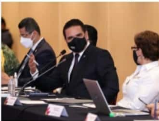
MORELIA, MICH.- El gobernador indicó que los 4 mil 192 casos activos y la alta movilidad colocan al estado en un nivel que riesgo y se deben tomar medidas.