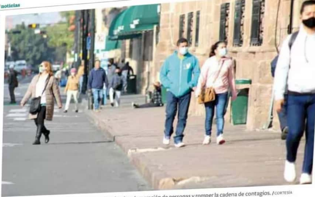
Pandemia. Con las nuevas medidas se pretende evitar la aglomeración de personas y romper la cadena de contagios.