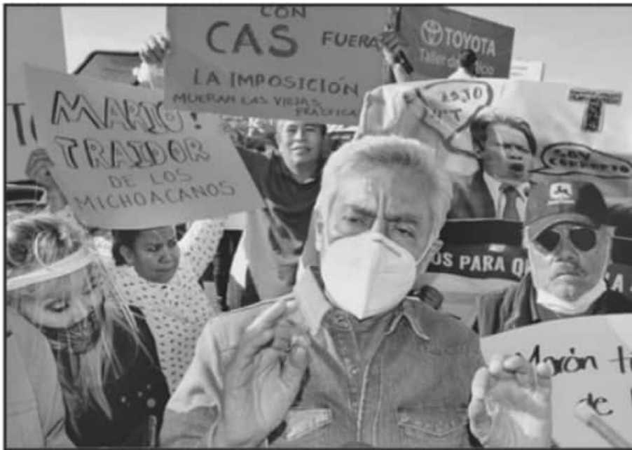
INSTITUCIONES COMO LA UMSNH EMITIERON POSICIONAMIENTO CON RESPECTO A LAS AGLOMERACIONES ELECTORALES.

mante, por lo que resulta crucial observar las recientes medidas emitidas tanto por el gobierno estatal, como por las administraciones municipales. Además de la suspensión de eventos de carácter social y las actividades no esenciales en los ámbitos públicos y privados, es imprescindible la voluntad de los actores sociales y políticos de acatar las normas establecidas en los decretos federales, estatales y municipales en materia de