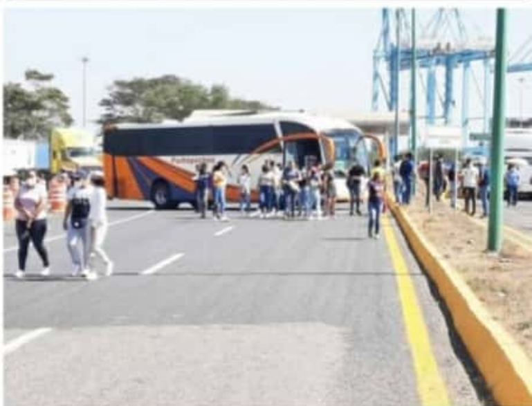
CD. LÁZARO CÁRDENAS, MICH.- Maestros de la Sección XVIII del SNTE-CNTE y normalistas egresados de las generaciones 2020 y 2019, advirtieron que de no cumplirse los acuerdos sostenidos en las mesas de negociación, las movilizaciones, como el bloqueo al recinto portuario, podrían ser indefinidos.