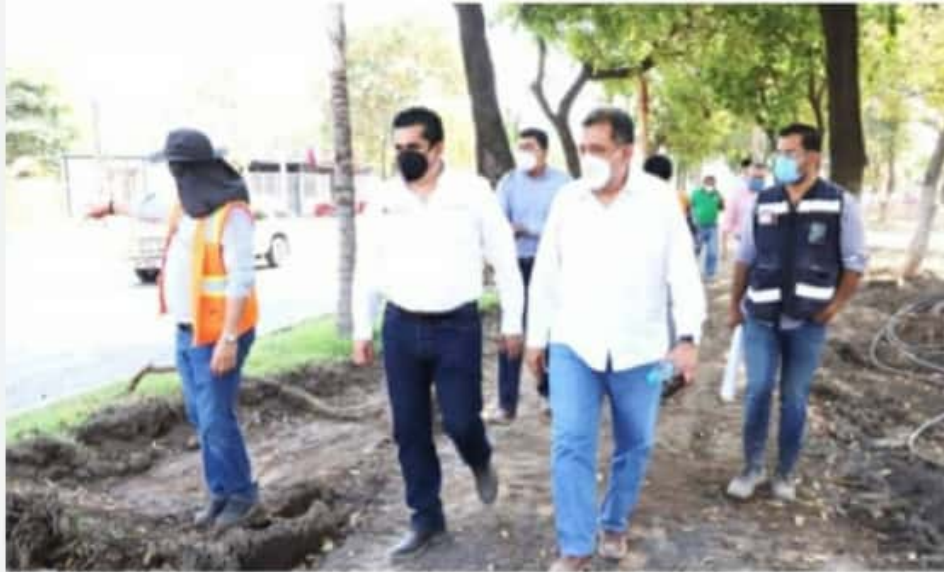
APATZINGÁN, MICH.- La obra integral forma parte de un proyecto ejecutado entre el gobierno del Estado y el gobierno Municipal.

En la segunda planta se contará con caseta de proyección, un módulo de baños, oficinas de gobierno, espacio para instrumentos, camerinos y aulas que podrán ser utilizadas para diversas actividades.