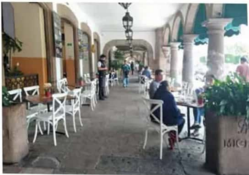
Cuidado. Los restauranteros aseguran que cumplen todos los protocolos sanitarios.