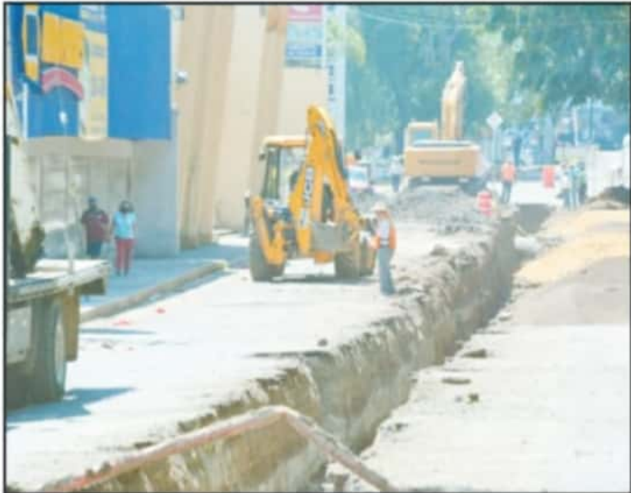
FOR MÁS DE UN AÑO LA OBRA ENTORPECIÓ CIRCULACIÓN Y PRÁCTICAMENTE MATÓ A TODOS LOS COMERCIOS DE LA ZONA.

Ya la Secretaría de Desarrollo Agrario Territorial y Urbano de la delegación de Morelia ya nos informó que está terminada al 100 por ciento, ya prácticamente es nada más de hacer la inauguración y abrirla al público