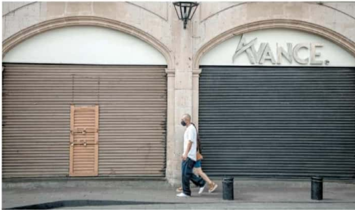
El cierre total en domingo, se mantendrá durante todo el mes de febrero.

SE VIOLARÍAN DERECHOS POLÍTICO-ELECTORALES, AFIRMA