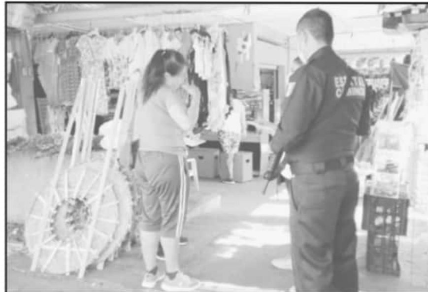
EN LÁZARO CÁRDENAS SE IMPLEMENTÓ UN PROGRAMA PARA PROMOVER EL USO DE CUBREBOCAS Y EVITAR CONTAGIOS.

todos los accesos al centro de abasto para hacer cumplir la ley en comento.