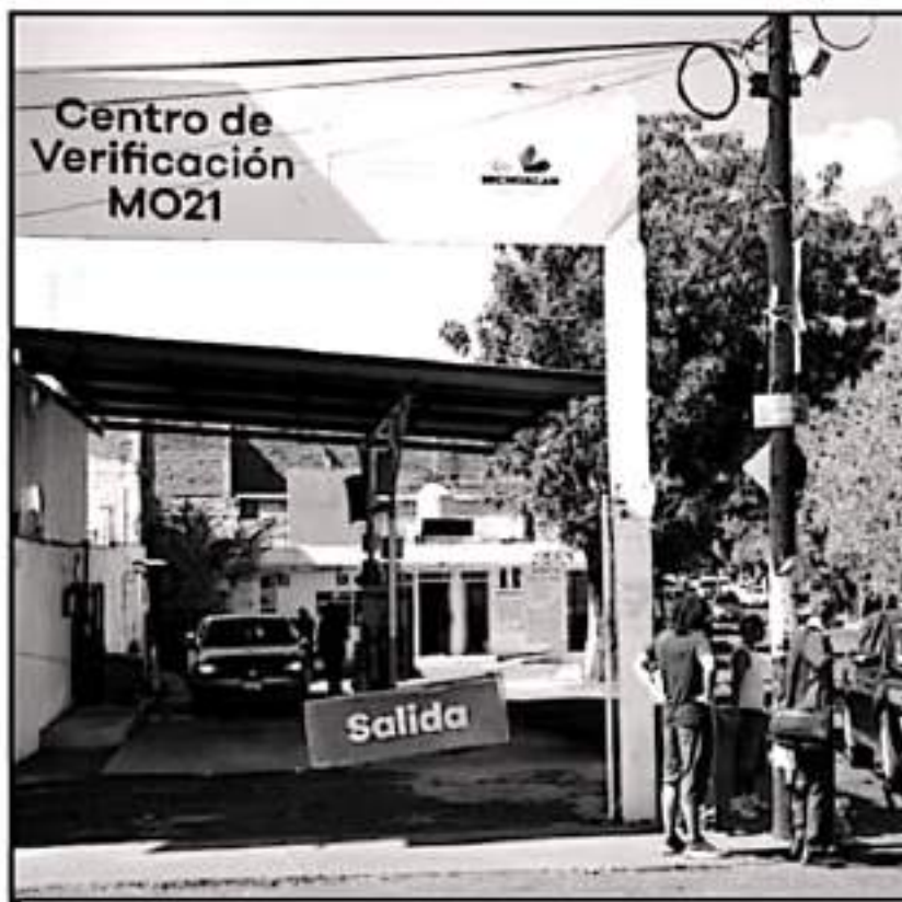
PARA ESTA ÚLTIMA SEMANA SON AL MENOS 3 CENTROS DE VERIFICACIÓN LOS QUE SE MANTIENEN SIN HOLOGRAMAS

con problemas diversos en los verificentros