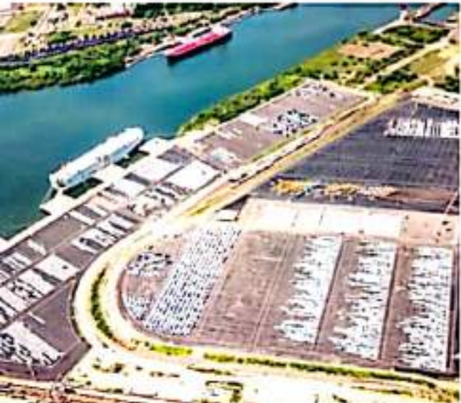
CD. LÁZARO CÁRDENAS, MICH.- Apilac reportó un incremento del 30% en el movimiento de carga total al mes de septiembre.

Como un puerto moderno y vanguardista, Lázaro Cárdenas cuenta con una gama de servicios, ocupando una posición estratégica en el Sistema Portuario Nacional, lo que lo convierte en un aliado de la producción, el comercio y el transporte.