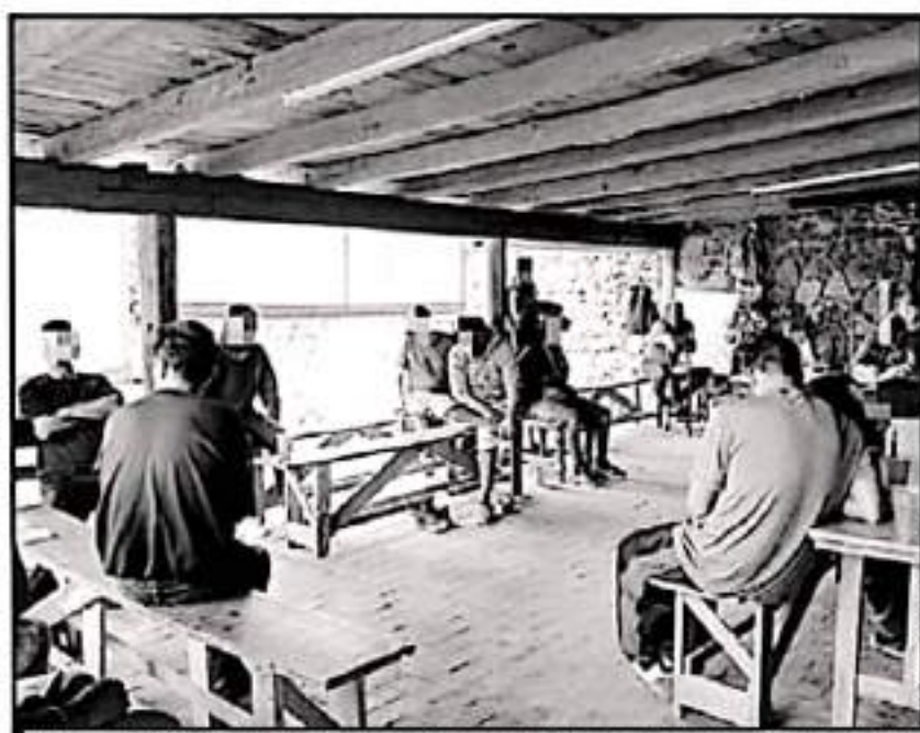
CENTROS QUE OFRECEN REHABILITACIÓN PARA ADICTOS SE REGULARIZARÁN PARA ESTAR VULNERABLES DERECHOS HUMANOS