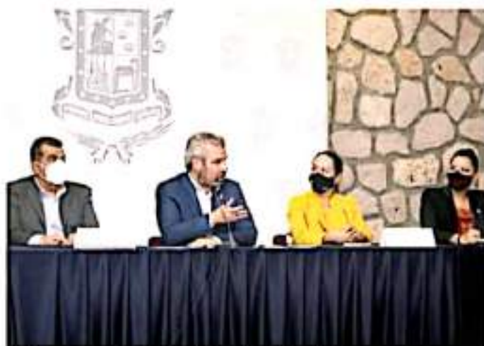
En el programa participarán 640 instancias a nivel nacional.

De acuerdo a Ramírez Bedolla, el proyecto que se tiene contemplado en el anti-