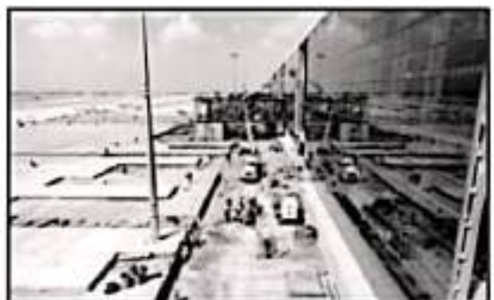
HASTA EL MOMENTO SÓLO VOLARIS Y VIVA AEROBUS COMENZARÁN A OPERAR EN EL NUEVO AEROPUERTO CON RUTAS NACIONALES

En cuanto al campo, Michoacán tuvo un alza del 2.66 por ciento y se quedó en el segundo puesto, solamente siendo superado el estado un punto porcentual por Quintana Roo.