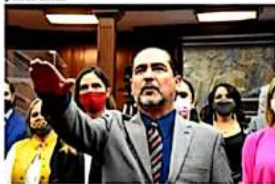
C. Leopoldo Romero Ochoa, Coordinador de Transparencia y Acceso a la Información Pública del Congreso del Estado.