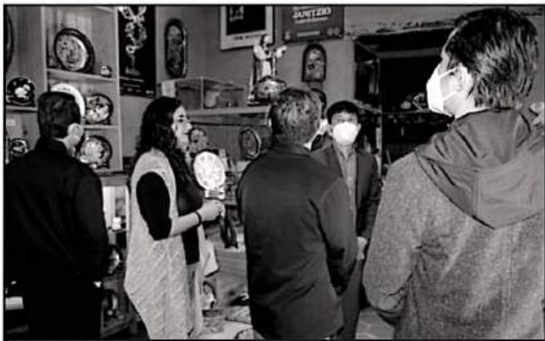
LOS INVITADOS A, DIFUNDIR AFECTAR LAS TRADICIONES, TANTO CULTURALES COMO GASTRONÓMICAS DE LA REGIÓN LA COSTA Y LA CAJADA DE LOS OCHO PUEBLOS.

piritas). (...) con el Día de los Altos Errantes que se celebra cada año, el 15 del Septimo mes lunar en Vietnam, así como con el Día de todos los Santos que se celebra el primero de noviembre en Filipinas".