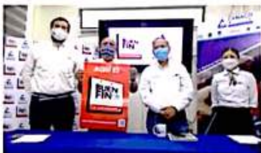
CD. LÁZARO CÁRDENAS, MICH.- La Canaco dio a conocer la undécima edición del Buen Fin 2021 en Lázaro Cárdenas, donde los negocios locales estarán ofreciendo descuentos del 20 al 50 por ciento.

Cabe señalar que la Canaco dispondrá de flyers con el logo del Buen Fin, además de canalizar las quejas que pudieran surgir entre los consumidores.