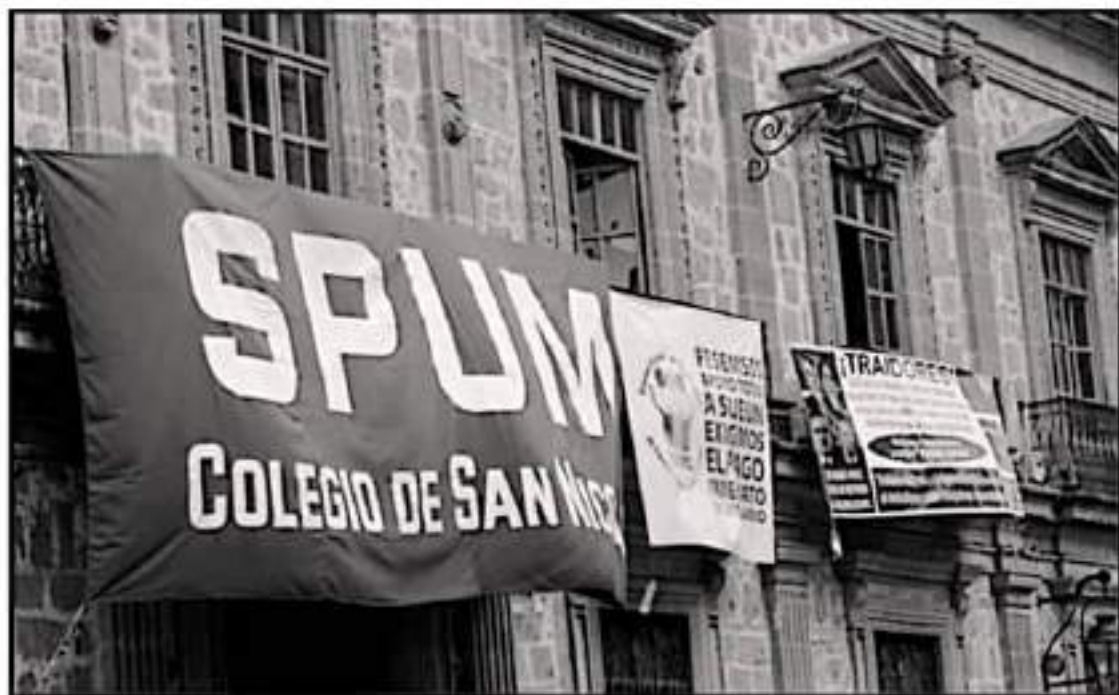
SE REALIZARÁ LA ELECCIÓN DEL COMITÉ EJECUTIVO GENERAL Y DE LAS COMISIONES AUTÓNOMAS CONFORME A LAS BASES ESTABLECIDAS EN EL REGLAMENTO

La solicitud de registro deberá especificar los nombres completos, dependencia de adscripción y cargos de los integrantes de la planilla, tanto para el Comité Ejecutivo General como para las Comisiones Autónomas, incluyendo aval y firma de cada uno de ellos; señalando el color(es), sello(s), nombre de la planilla y de sus representantes