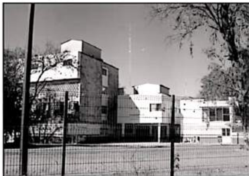
EN PRÓXIMAS SEMANAS SE PONDRÁ EN MARCHA EL PROCESO PARA REUTILIZAR EL ANTEZO HOSPITAL INFANTIL.

Según datos de organismos internacionales y autoridades sanitarias en México, la pandemia de COVID-19 ha traído también alza en los padecimientos mentales, a consecuencia del aislamiento social que se prolongó durante meses, la crisis económica y el estrés ante el