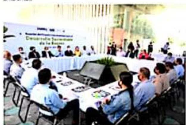
ZAMORA, MICH.- 18 alcaldes de los distritos 4 y 5 de Michoacán, coincidieron en señalar la importancia de generar sinergia, trabajar de manera conjunta.

Porque la región tiene vocación agrícola, fue la primera intención, pero que se especializará no solo en productividad, también en comercialización y capacitación administrativa, financiera y medio ambiental.