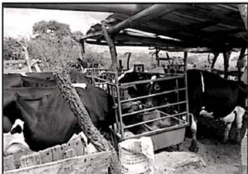
PESEA LA DESVENTAJA, LA GANADERÍA EN ESTA ZONA CLAVADA EN EL RUTERO, DE PRODUCTOS COMERCIALIZADOS

en las malas prácticas de ordeña, que incluso pudieran significar un riesgo de salud pública, y coincido con lo señalado por otros especialistas en diversos foros, en el sentido de que las malas prácticas usadas en la ordeña tradicional de los ganaderos no solamente van en detrimento de la calidad de la leche, sino que constituyen también un riesgo a la salud de la población como lo afirmó la