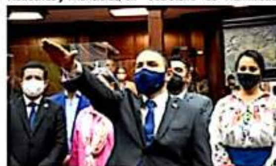
C. Alberto Chávez Sandoval, Contralor Interno del Congreso del Estado.