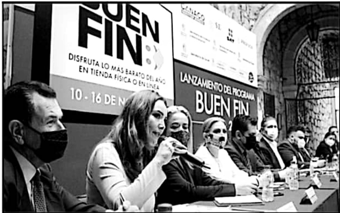
EN UNA RUEDA DE PRENSA, AUTORIDADES ESTATALES Y MUNICIPALES DIERON A CONOCER LAS OFERTAS QUE TENDRÁN PARA EL 'BUEN FIN'.