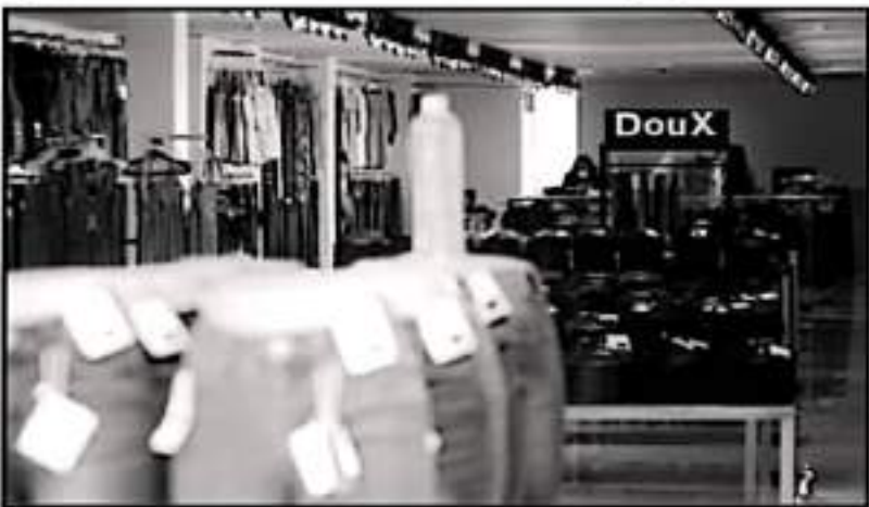
EL SECTOR DE COMERCIO Y SERVICIOS PRESENTÓ UNA RECUPERACIÓN DEL 12 POR CIENTO EN LA ENTIDAD

La Asociación Internacional de Transporte Aéreo (IATA, por su sigla en inglés) expresó esta semana sus dudas sobre la conectividad aérea y término del nuevo aeropuerto, que operará de forma simultánea con el actual Aeropuerto Internacional de la Ciudad de México (AICM).