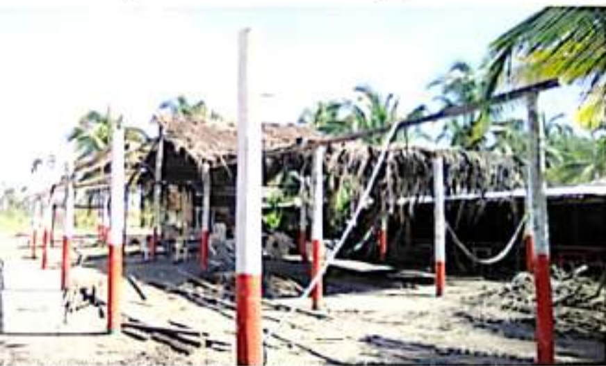
CD. LÁZARO CÁRDENAS, MICH.- El huracán "Rick", fue el "tiro de gracia" para los enramaderos y prestadores de servicios, pues afectó a en su caso acabó con sus negocios a orillas del mar.

Eduardo CHÁVEZ CD. LÁZARO CÁRDENAS, MICH.-