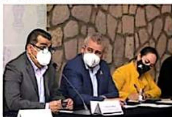
El gobernador Bedolla firma del acta constitutiva y reinstalación de la mesa de trabajo de la Estrategia Nacional de Prevención de las Adicciones. POLÍTICA CON LA.....