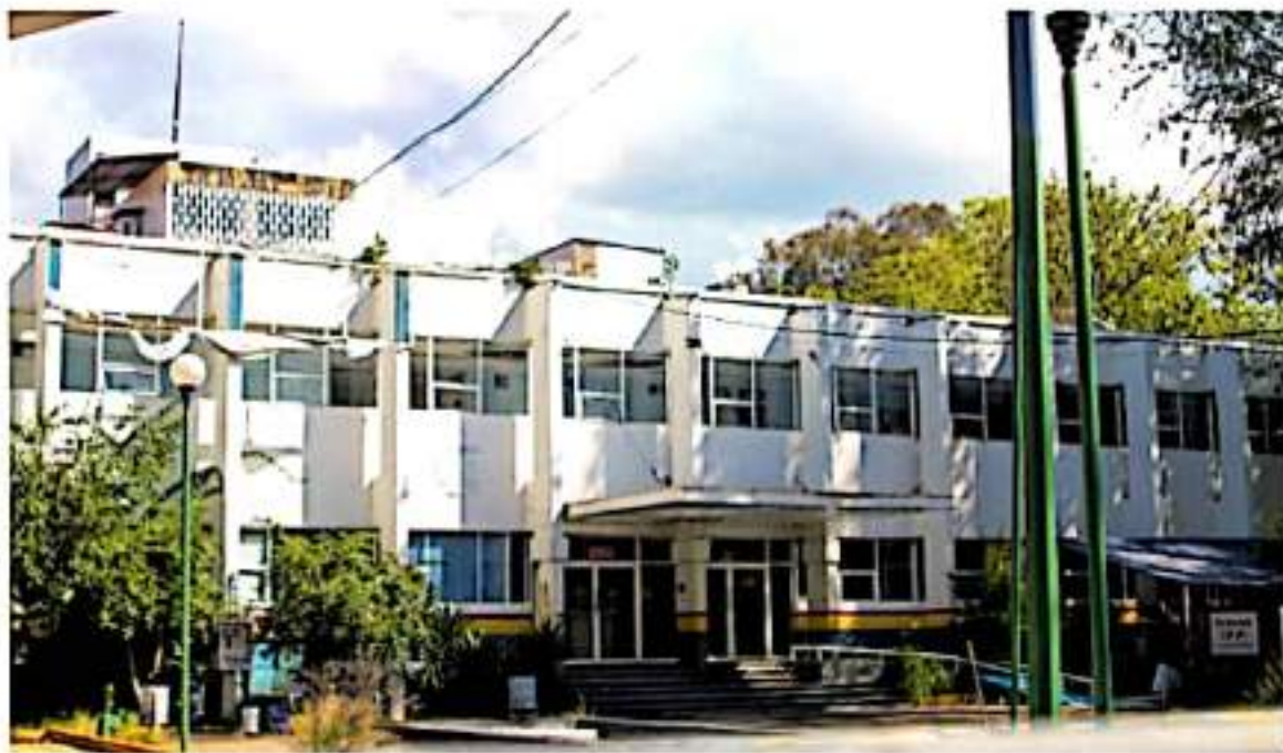
En su momento tuvo equipo médico de primer nivel.

EXHOSPITAL INFANTIL SERÁ CENTRO DE REHABILITACIÓN