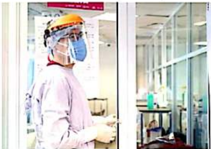
CD. LÁZARO CÁRDENAS, MICH.- El municipio de Lázaro Cárdenas registró solo un caso de Covid-19 el día de ayer, estadística que se ha mantenido desde hace varias semanas.

A nivel estatal se tienen reportados un total de 118,432 casos de Covid-19, 103,879 recuperados, 7,814 defunciones y 727 casos sospechosos.