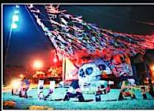
AUTORIDADES ENRIQUECERON LAS ALTERNATIVAS DE DIVERSIÓN Y ENTRETENIMIENTO PARA MILES DE PERSONAS QUE VISITARÁN ESTA CIUDAD.

Las plazas públicas Morelos, Mártires de Uruapan e Izazaga (la ranita), así como las instalaciones de la Casa de la Cultura, serán los escenarios principales para el desarrollo de talleres, obras de teatro, conciertos, muestras gastronómicas y desde luego el acto para anunciar el