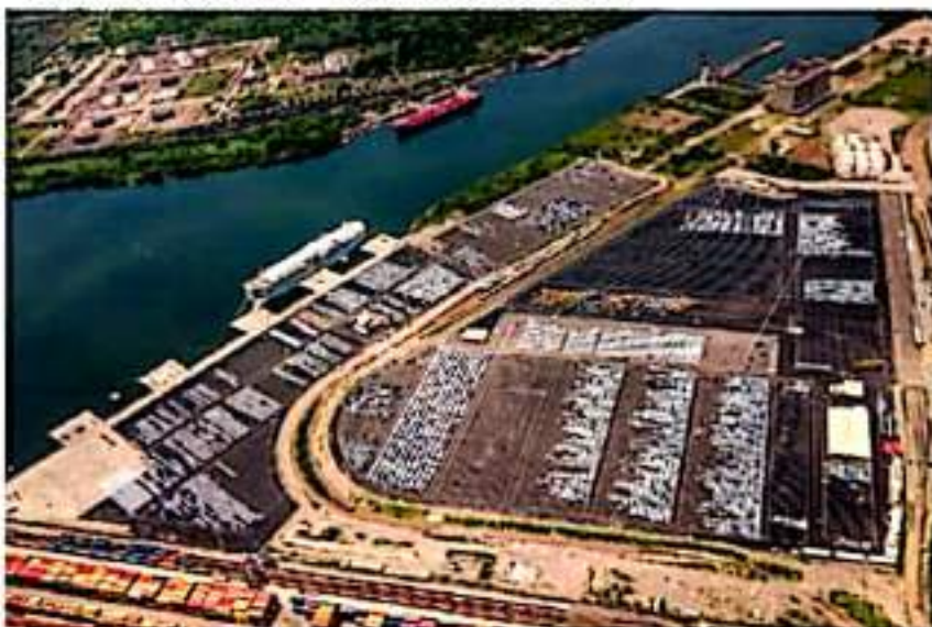
Según estadísticas de la APILAC, al mes de septiembre de este año, el puerto michoacano incrementó 30 por ciento el manejo de carga general.