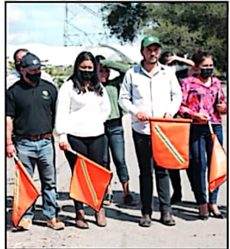
TRAS EL BANDERAZO, EL EDIL RESALTÓ QUE LAS PASADAS ADMINISTRACIONES LE DEJARON UN MUNICIPIO CON CAMINOS EN PÉSIMAS CONDICIONES.