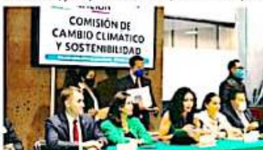
MORELIA, MICH.- La presidenta de la comisión aseveró que, "desde el Congreso de la Unión se propondrán iniciativas de Ley en pro del medio ambiente y, con ellas, prevenir el cambio climático y apuntalar la sostenibilidad en todo el territorio mexicano".

En esta comisión se buscará promover la coordinación de acciones de las dependencias y entidades de la administración pública federal en materia de cambio climático, además de formular e instrumentar políticas nacionales para la mitigación, adaptación al cambio climático, así como su incorporación en los programas y acciones sectoriales de