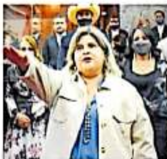
Protesta de Marín

Aunado a ello, destacó que revisará casos como el Teatro Mitimpony y la obra de la Presa El Maguey realizada por Odebrecht, y de encontrarse alguna observación o hallazgo al respecto se actuará en consecuencia. La abogada dijo que parte de la experiencia que tiene es haber defendido a funcionarios públicos que han sido señalados por responsabilidades, omisiones o errores,