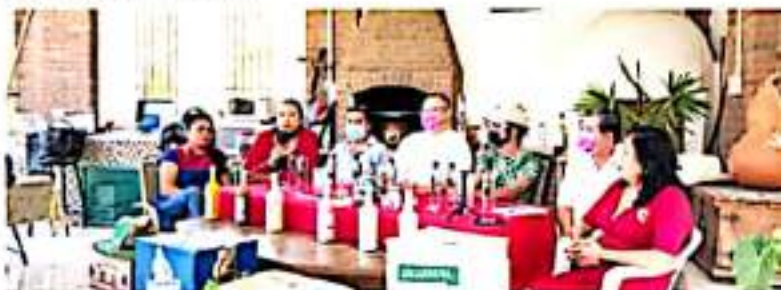
CD. LÁZARO CÁRDENAS, MICH.- Con la finalidad de detonar el turismo, una vez que el municipio esté en bandera verde, tras presentar un riesgo controlado de la pandemia por Covid-19, del 30 de octubre al 1 de noviembre se llevará a cabo el Oktoberfest.

participación de expositores de cerveza artesanal, mezcales y diversos productos artesanales elaborados en la ciudad portañera, un evento que se denomina 100% familiar con el que se pretende reactivar la