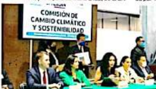
MORELIA, MICH.- La presidenta de la comisión aseveró que, "desde el Congreso de la Unión se propondrán iniciativas de Ley en pro del medio ambiente y, con ellas, prevenir el cambio climático y apuntalar la sustentabilidad en todo el territorio mexicano".

En esta comisión se buscará promover la coordinación de acciones de las dependencias y entidades de la administración pública federal en materia de cambio climático, además de formular e instrumentar políticas nacionales para la mitigación y adaptación al cambio climático, así como su incorporación en los programas y acciones sectoriales correspondientes.