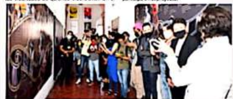
MORELIA, MICH.- Esta iniciativa es una muestra de la industria cinematográfica en el estado.