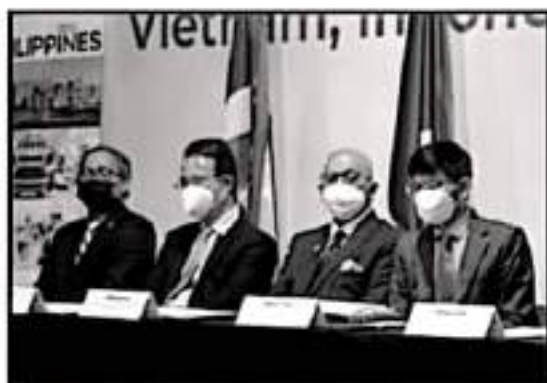
RECIBIERON DE LAS MANOS DEL ALCALDE UN PERGAMINO ELABORADO A MANO A LA VEZ, LOS INVITADOS LE ENTREGARON AL ALCALDE UN PRESENTE.