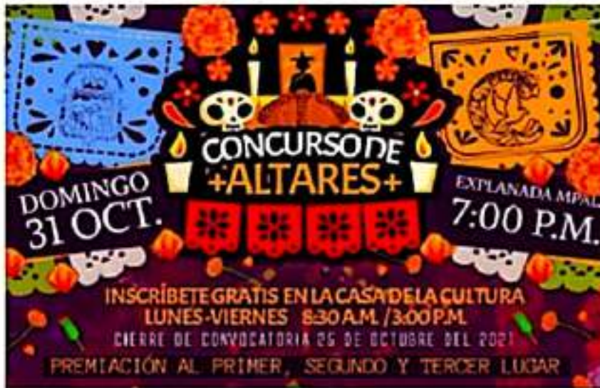
En Coahuayana, rescatan tradiciones populares.