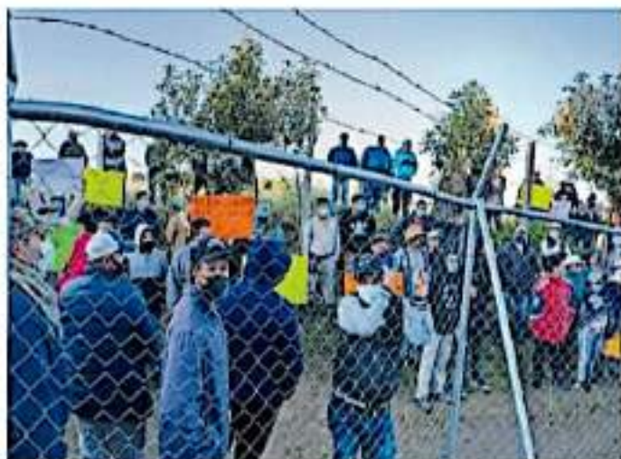
Los comuneros protestaron antes de que iniciara la consulta.