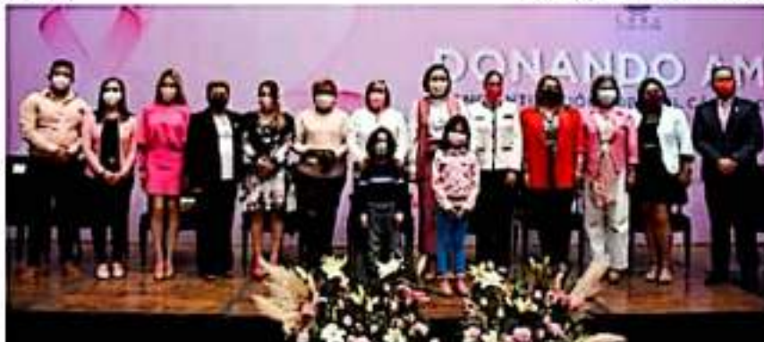
En el marco del evento Donando amor y esperanza. Concientización sobre el cáncer de mama, en el que se llevó a cabo la donación de cabello para la elaboración de pelucas oncológicas.