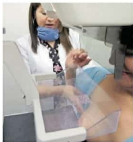
El objetivo de la prueba es prevenir y atender el cáncer de mama / CUARTOS CURO

Las autoridades planean llevar un control de preregistro para evitar aglomeraciones en los módulos de vacunación, y de esa forma reducir las posibilidades de contagio por Covid-19 de los asistentes. Por ello, durante las jornadas se implementará un despliegue de personal del ayuntamiento, de todas las áreas, para controlar la afluencia de gente, prevenir cualquier riesgo, y facilitar el acceso a las personas con la finalidad de evitar cualquier demora o contratiempo en la logística.