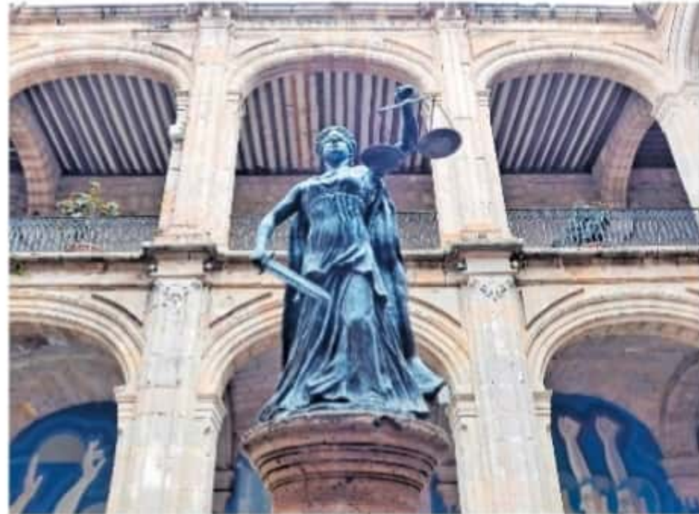
El proyecto brindará indicadores sobre el desarrollo de los alumnos / CARMEN HERNÁNDEZ

Este proyecto tendrá un impacto en la labor social, cultural y económica de Michoacán, además se tendrá el dato de indicadores como cuántos alumnos se tienen, cuántos egresados y dónde están ubicados puesto que resultan clave para el desarrollo personal de los actores y económico social de las instituciones. Aunado a esto se observará si los graduados cumplen con sus funciones pro-