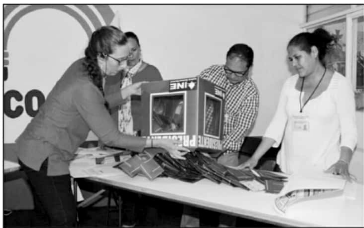
ESTE AÑO SERÁ "ESPECIAL" ANTE LA PANDEMIA Y POSIBLES COMPLICACIONES TÉCNICAS, SIN OLVIDAR UNA SATURACIÓN DE REDES U OTROS PROBLEMAS.

Este año será "especial" ante la Pandemia por COVID-19 y posibles complicaciones técnicas, sin olvidar una saturación de redes u otros problemas, aspectos