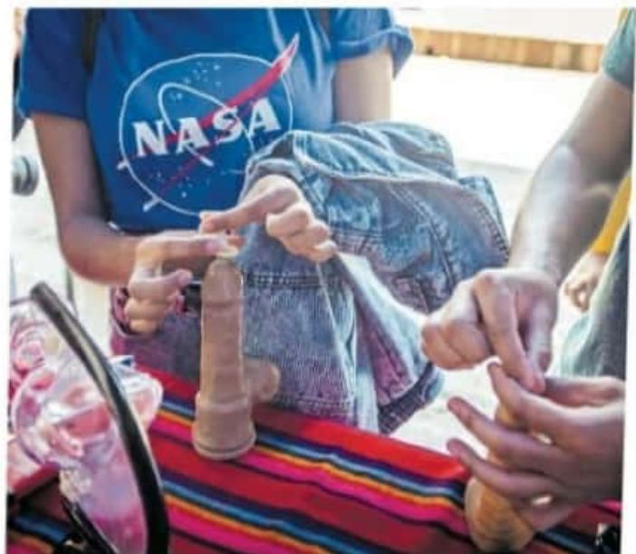
La educación sexual ha sido fundamental para bajar ciertos índices