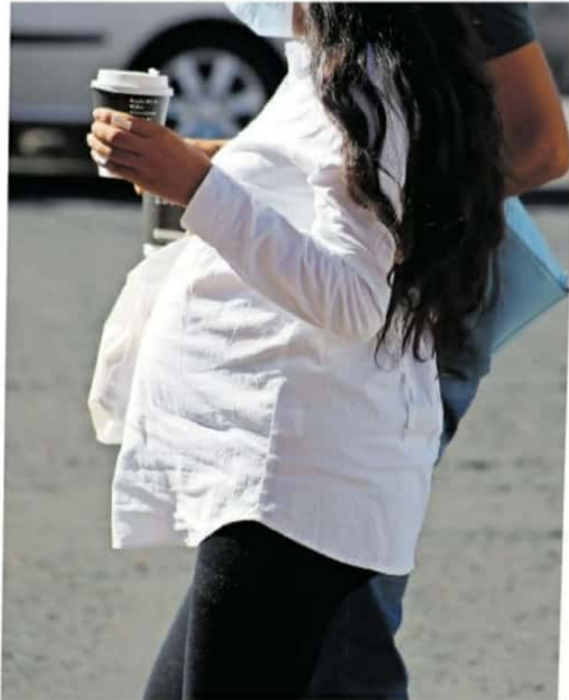
En Michoacán disminuyeron los embarazos adolescentes

El Informe de la SSM sobre el número de embarazos en adolescentes presentados en 2020 fue de cinco mil 42, lo cual representa 20 por ciento menos a lo registrado en el 2019; en contraste, los abusos sexuales denunciados ante la Procuraduría General de Michoacán superan los 250.