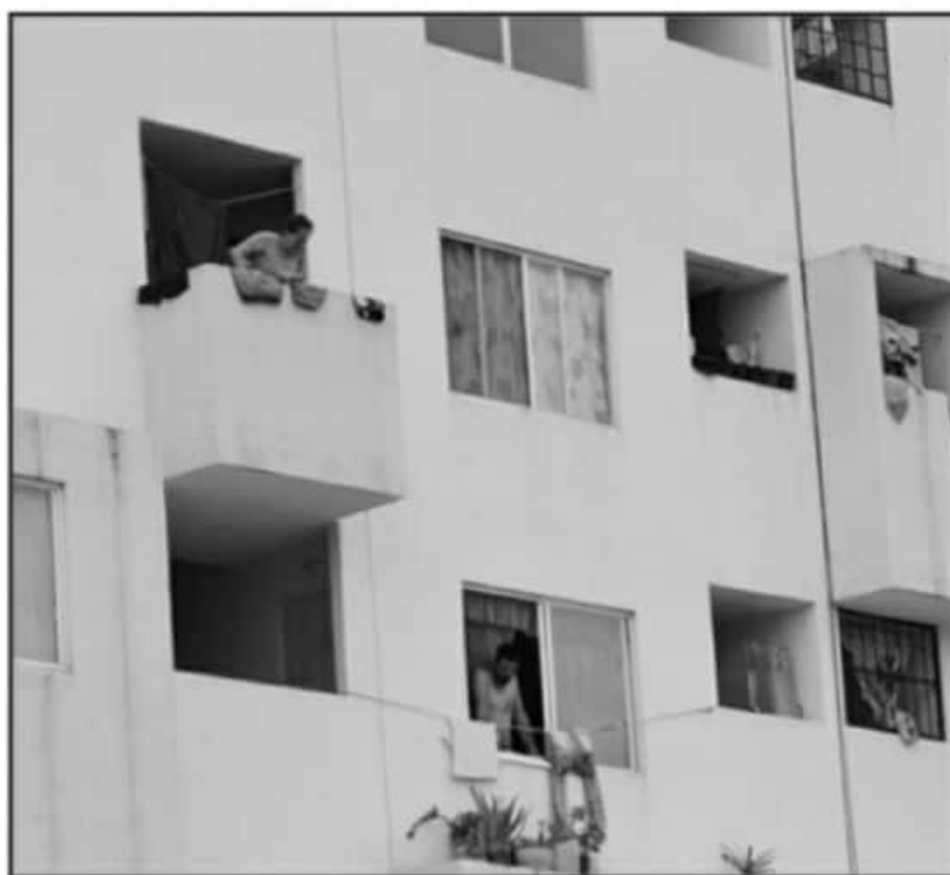
EL CASO DE VILLAS DEL PEDREGAL, SE PRESUME FUE UN INTENTO DE AGRESIÓN SEXUAL A UNA FAMILIA DE TRES MUJERES.

"Tenemos dos casos, uno es en el centro de Morelia y tenemos otro en Villas del Pedregal. Uno es de