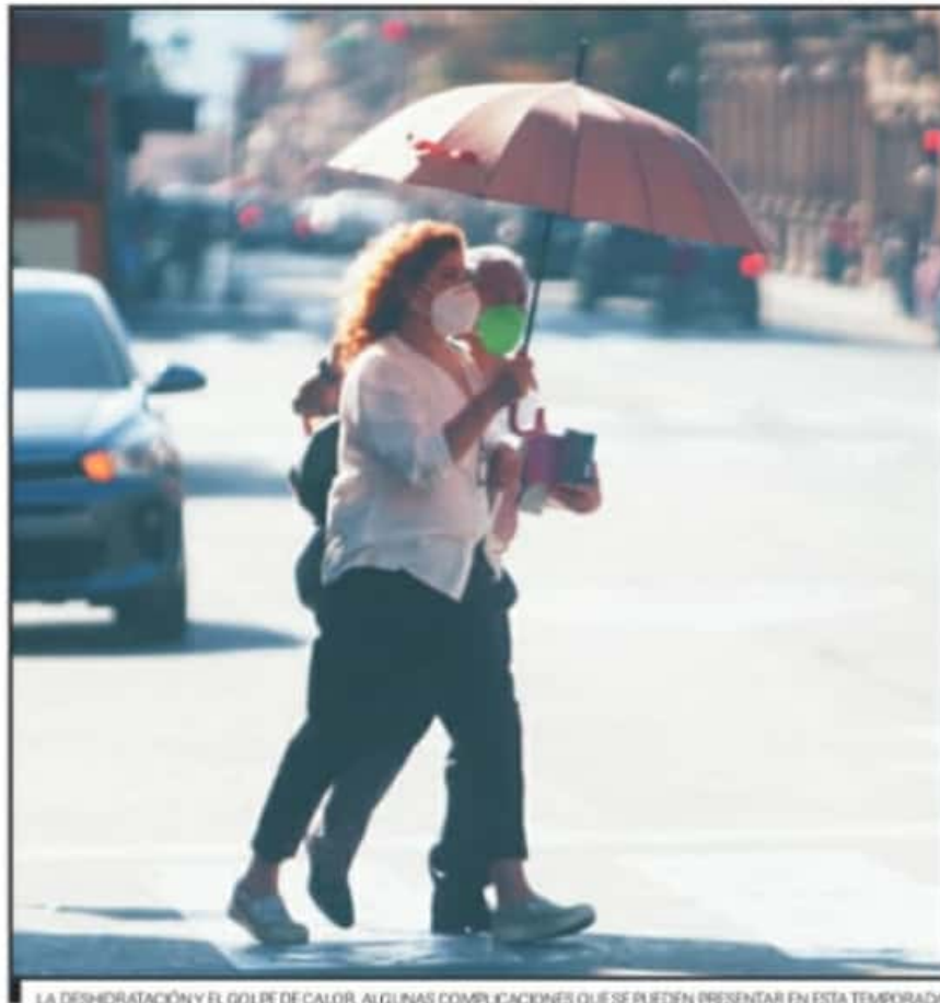
LA DESHIDRATACIÓN Y EL GOLPE DE CALOR, ALGUNAS COMPLICACIONES QUE SE PUEDEN PRESENTAR EN ESTA TEMPORADA.

Así como también advirtió que los "golpes de calor" propios de esta temporada se pueden identificar cuando una persona presenta mareos, seguidos de una excesiva sudoración en un primer momento, falta de sudoración posteriormente, a lo cual se suma entorpecimiento y sequedad de la piel, fiebre de entre 39 a 41 grados, aceleración del ritmo cardíaco con latidos débiles del corazón, dolor de cabeza, ataques con convulsiones y comportamiento inadecuado como querer quitarse la ropa sin importar el