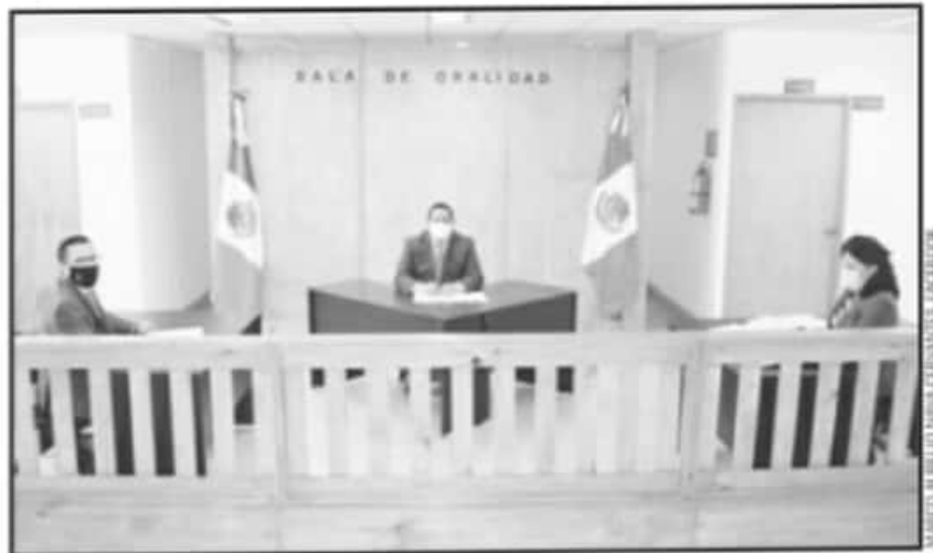
EL NUEVO SISTEMA DE JUSTICIA PENAL ES POCO CONOCIDO POR LA CIUDADANÍA, RECONOCE LA DEFENSORÍA PÚBLICA