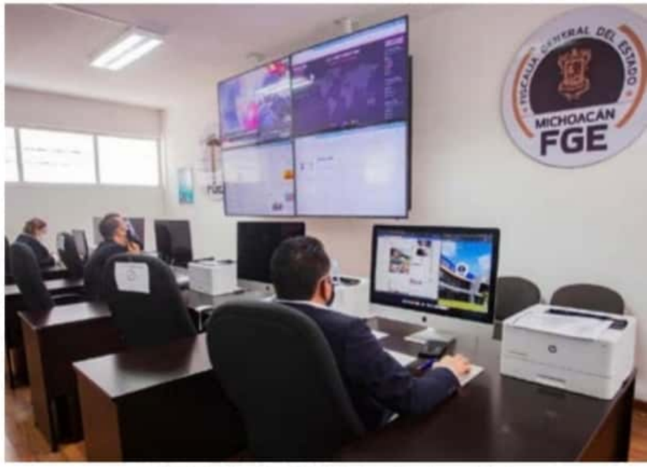
La Policía Cibernética de la FGE ha intensificado su actividad.