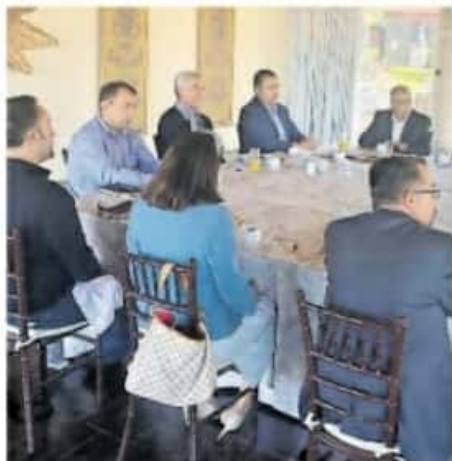
El aspirante se reunió con instituciones que pertenecen a Red Juntos por Michoacán

acuerdo a los tiempos electorales, en este periodo de pre campañas internas de todos los partidos políticos, está prohibido realizar proselitismo en cualquiera de sus formas, por lo que por el momento los aspirantes se ven limitados a presentarse ante la sociedad. Posteriormente deberán esperar las decisiones de sus partidos políticos, el cual es la única vía para avalar sus candidaturas. En este sentido, los órganos electorales han hecho importantes reglamentos y llamamientos para prevenir la violencia de género y la discriminación.