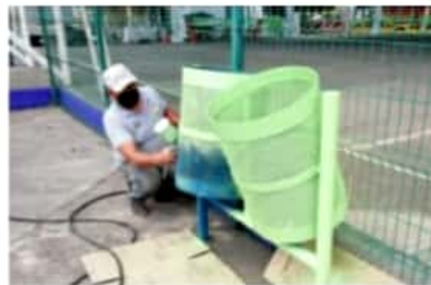
URUAPAN, MICH.- El DIF Municipal realiza labores de mantenimiento en los Centros de Desarrollo Comunitario.

Finalmente mencionó que los talleres que se ofrecen son: corte y confección, cocina y repostería, baile, educación básica para adultos, taekwondo, computación, manualidades y cultura de belleza, así como servicios médicos y psicológicos, entre otros.