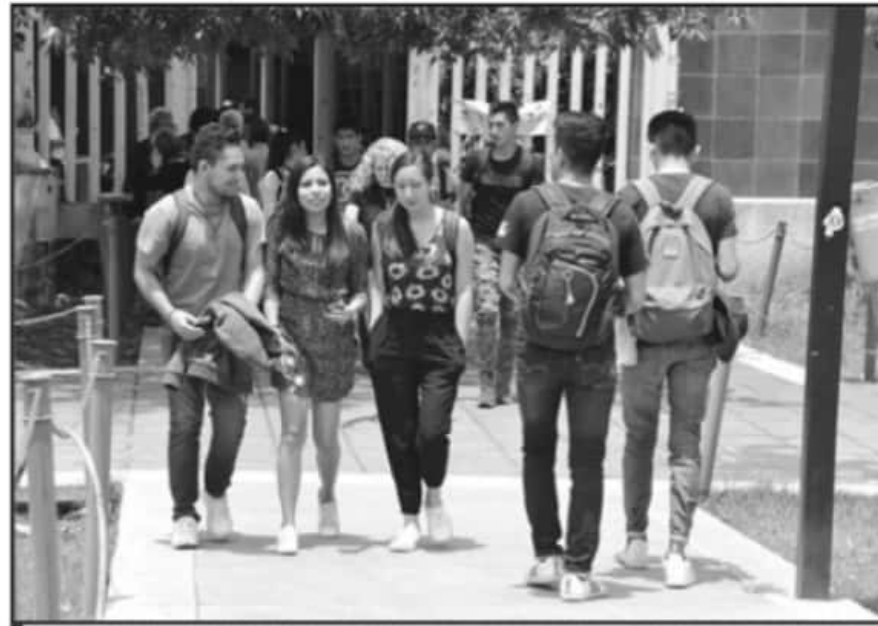
A TRAVÉS DE UNA PLATAFORMA DIGITAL SE PODRÁN REGISTRAR LOS EGRESADOS EN BUSCA DE UN TRABAJO.