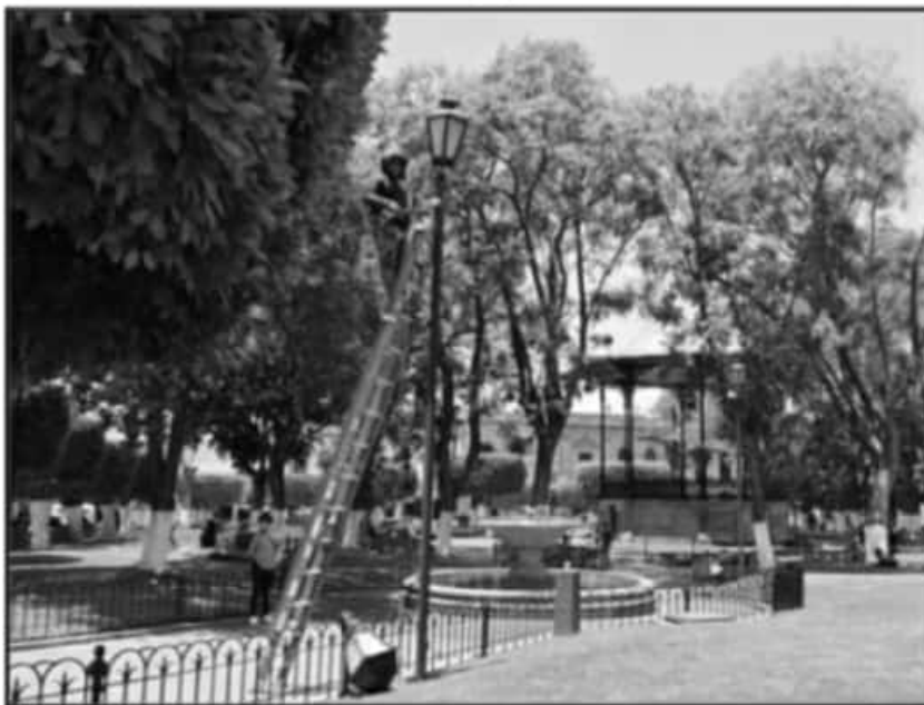
PESE A LA POLÍTICA DE AUSTERIDAD NO SE DEJÓ DE INVERTIR EN SERVICIOS, OBRAS Y MANTENIMIENTO.