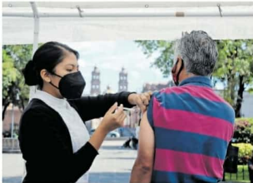
Las dosis están destinadas a adultos mayores

Para aquellos que pertenecen a El Duero, el módulo para asignar la cita de vacunación se encuentra localizado en Templo del Rosario. En cuanto a los de Arboledas, los habitantes de la primera sección pueden acudir a la Canchita donde está la Virgen; los de la segunda sección en el estacionamiento y los de la tercera sección en la Cancha de basquetbol (atrás del templo San Pedro y San Pablo).