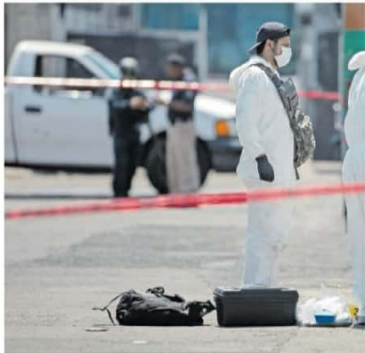
En la entidad se han registrado tres fallecidos víctimas de incidentes de violencia política

En el proceso electoral del 2018, en el estado se eligieron 24 presidentas muni-