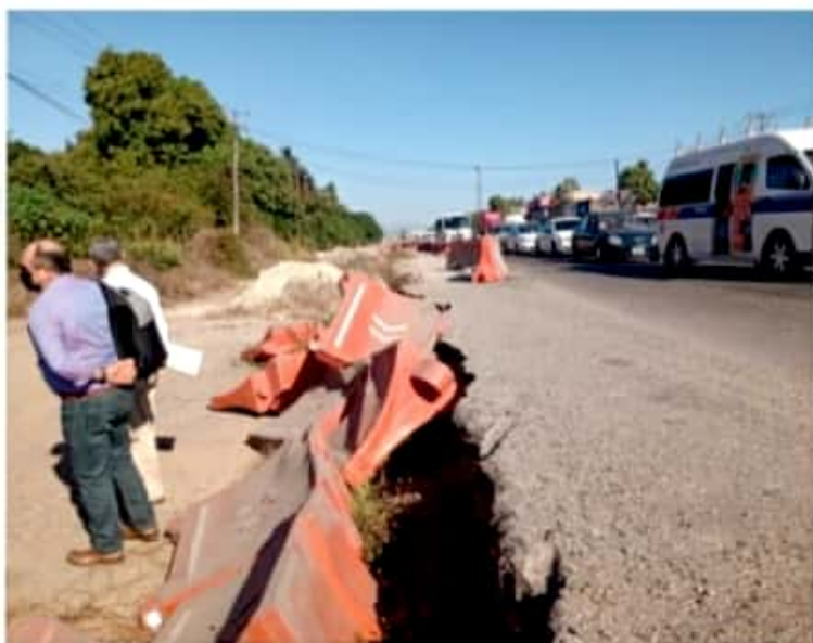
CD. LÁZARO CÁRDENAS, MICH.- Sin eco, peticiones a destrabar conflicto del distribuidor vial en Lázaro Cárdenas.