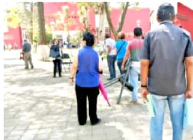
ZAMORA, MICH.- Un singular viacrucis vivieron adultos mayores al iniciar el registro para la vacunación contra el Covid-19.

Se dijo que abrirían a las 8:00 de la mañana y éstas iniciaron después de la hora señalada, causando molestia entre la población, algunas de ellas incluso no se instalaron hasta hoy, al recordar que será hasta el domingo de marzo cuando se concluya este registro. Las personas interesadas deben acudir con copia de su credencial de elector o alguna identificación con fotografía, su CURP y comprobante de domicilio, se llenará un formato que debe presentarse con toda la documentación al momento de recibir la vacuna. La aplicación del biológico será a partir del lunes 8 de marzo, a las 8:00 de la mañana, para ellos se tendrán 5 sedes que se han asignado en los diferentes puntos de la ciudad para abarcar toda, como son las unidades deportivas El Chamizal y Poniente, el Centro de las Artes, el Cedeco en Arroyo de Rayón y el IMSS de Romero.