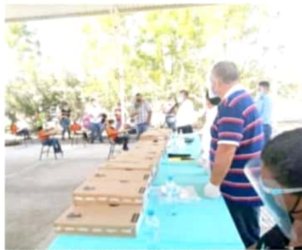
APATZINGÁN, MICH.- La titular de la URSE, informó que se entregaron 350 dispositivos a los estudiantes de 11 instituciones en todo el estado.

Finalmente Cisneros Sosa, destacó que el banco electrónico de donación continúa abierto en la Unidad Regional, para que la población aporte una computadora en buen estado que podrá ser utilizado por los pequeños que lo requieren.