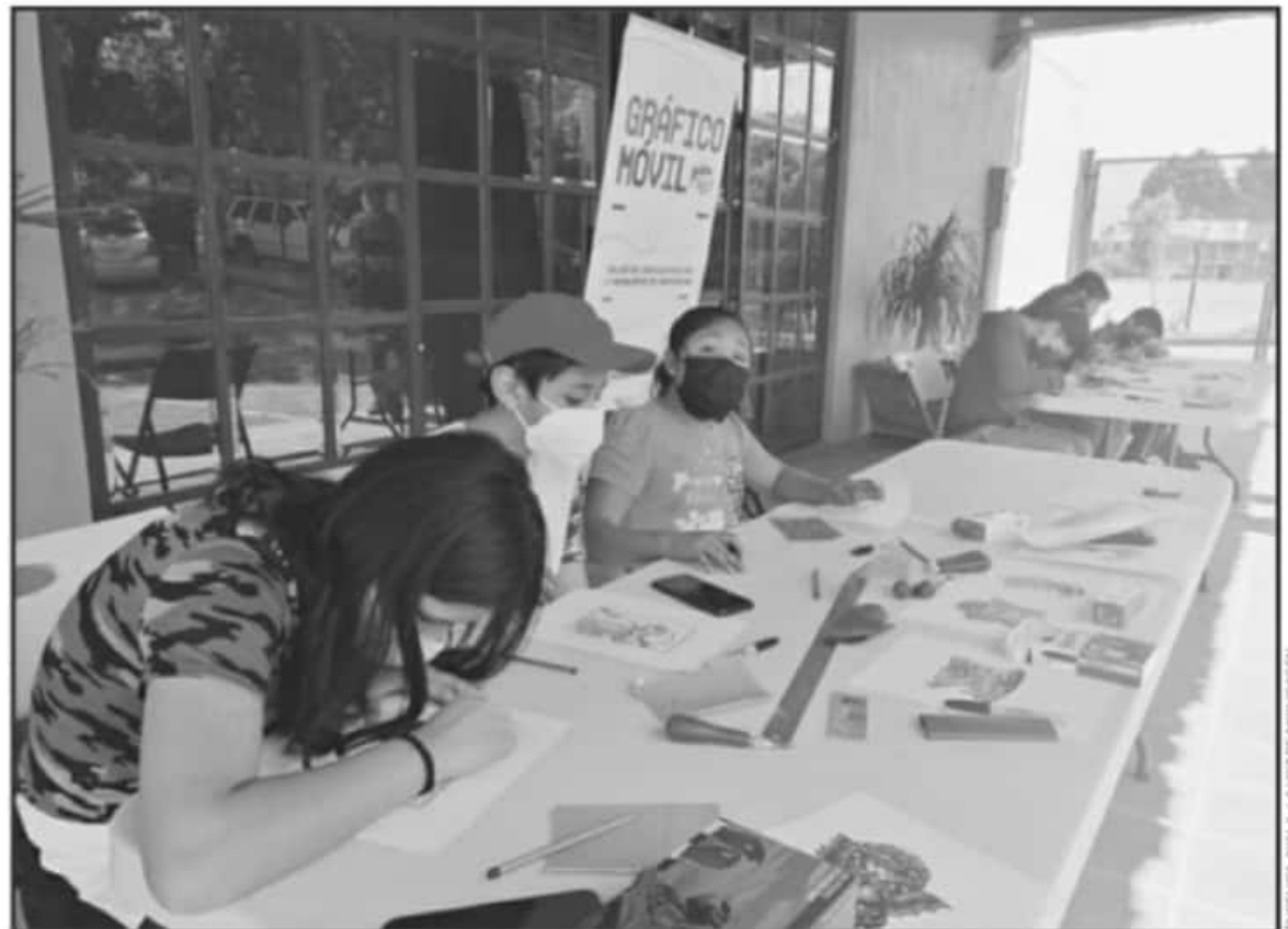
JÓVENES Y NIÑOS EN SANTA CLARA DEL COBRE RECREAN SUS HABILIDADES ARTÍSTICAS EN LOS TALLERES QUE SE REALIZAN SOBRE GRABADO.

Este proyecto, inició el pasado lunes en Tingambato, al día siguiente llegaron a Nocupetzo municipio de Erongaricuaru, y este miércoles en Santa Clara del Cobre, "iniciamos con una breve semblanza de la historia del grabado en México, y después les explicamos cómo