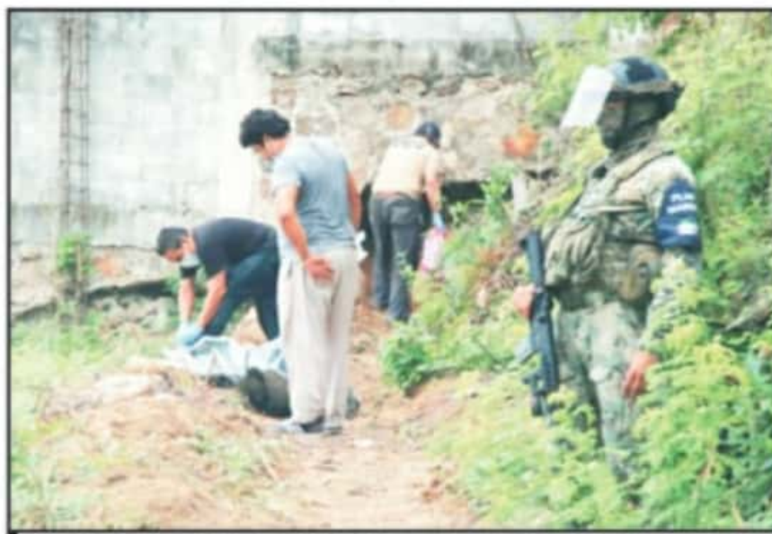
SE ESTIMA QUE LOS "AJUSTES DE CUENTAS" ESTARIAN RELACIONADOS AL CONSUMO O TRASIEGO DE SUSTANCIAS ILEGALES.

La incidencia de violencia extrema va al alza. Solo en el mes que recién concluyó, se registraron un total de 428 carpetas de investigación con esta especificación en donde la tortura fue el fenómeno más recurrente de esta situación,