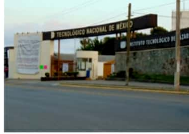
CD. LÁZARO CÁRDENAS, MICH.- Luego de la falta de información oficial de las dependencias responsables de la jornada de vacunación, y que cientos de personas de la tercera edad hicieran fila en el plantel educativo, las autoridades optaron por pegar dos letreros para notificar que aún no llegaban las vacunas a tierras porteñas.

Eduardo CHÁVEZ CD. LÁZARO CÁRDENAS, MICH.-