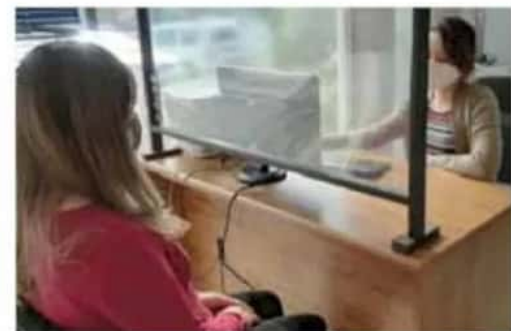
Morelia. La violencia se da en diferentes ámbitos.

Finalmente, respecto a la violencia económica, se encontró que el 22% de las parejas de las encuestadas evade sus responsabilidades y obligaciones con los hijos; el 28.4% evade responsabilidades domésticas o de crianza, y 16.6% les impide que trabajen. MARCO SANTOYO