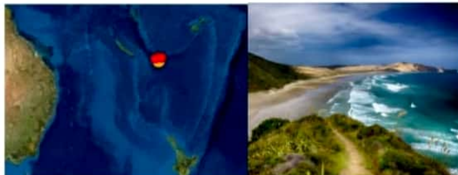
CD. LÁZARO CÁRDENAS, MICH.- Tras el sismo de 8.1 en Nueva Zelanda, el Centro Meteorológico del Pacífico, pronosticó un tsunami en playas de Lázaro Cárdenas, Michoacán; habría llegado a las 02:09 horas de la

Por ser menor, no se consideró un tsunami destructivo para México, puesto que las olas tuvieron un incremento por arriba de la cresta de hasta un metro; sin embargo, se pidió a las embarcaciones menores tomaran sus precauciones.