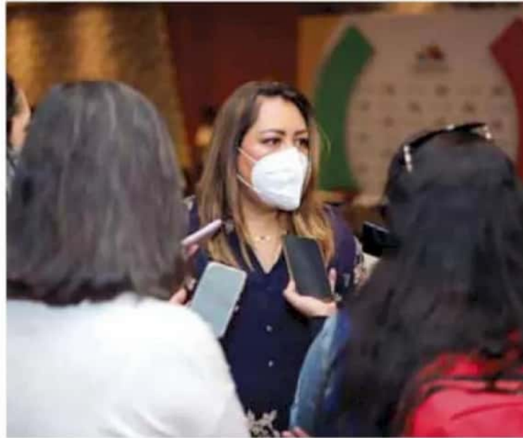
Violentadas. Las víctimas no quieren que se sepa, dice la titular de Seimujer.

En su intervención, Navarrete consideró que los partidos no han sido los principa-