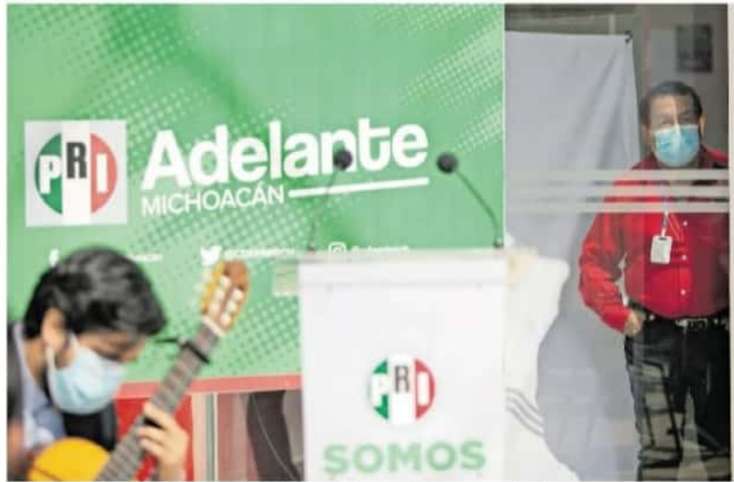
En su aniversario, el PRI recriminó la falta de institucionalidad que dijo encontrar en el gobierno actual / IMANARIAS