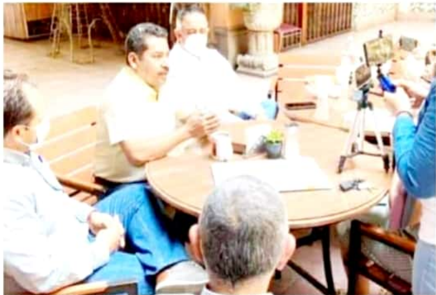
APATZINGÁN, MICH.- El legislador local se deslindó de la publicación que en redes sociales hizo una aspirante a la presidencia municipal por Morena.

otro proyecto que no sea el de mi partido PRD". En ese sentido señaló que desconoce cuál fue el motivo que llevó a la aspirante a la presidencia municipal por Morena a publicar una fotografía con él en donde argumentaba que se sumaba a su proyecto, "nosotros tenemos una relación de respeto y mis convicciones son muy claras, yo estoy con la alianza Equipo por Michoacán". Finalmente, dijo que no aspira a ningún cargo de elección popular, sino que continuará con su trabajo en el Congreso del Estado, "cumpliré con la encomienda que tengo como diputado, pero en la medida de mis posibilidades apoyaré a los candidatos de mi partido".