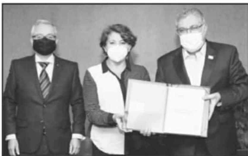
LÍDERES DEL SNTE SE REUNIERON CON LA TITULAR DE LA SEP, DELFINA GÓMEZ, PARA ENTREGARLE SUS DEMANDAS.