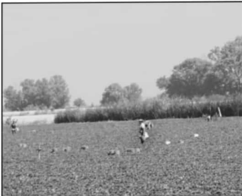
LOS MENORES DE EDAD TRABAJAN JORNADAS POR LAS MAÑANAS, CON EL CONSENTIMIENTO DE SUS PADRES.