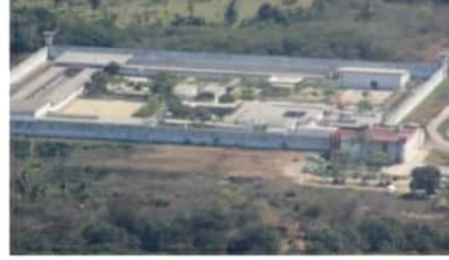
CD. LÁZARO CÁRDENAS, MICH.- Al sentirse violentados por el nuevo director interno del Cereso podrían llevar a cabo un motín al interior del Centro de Reinserción Social ubicado en El Bordonal, perteneciente al municipio de Lázaro Cárdenas.

Dado el poco tiempo que la persona al otro lado del teléfono tenía, me agradeció el tiempo que lo escuché y que esperaba que la información vertida fuera de mi utilidad, acto seguido, finalizó la llamada, no sin antes reiterarme que tendré noticias del Cereso próximamente.