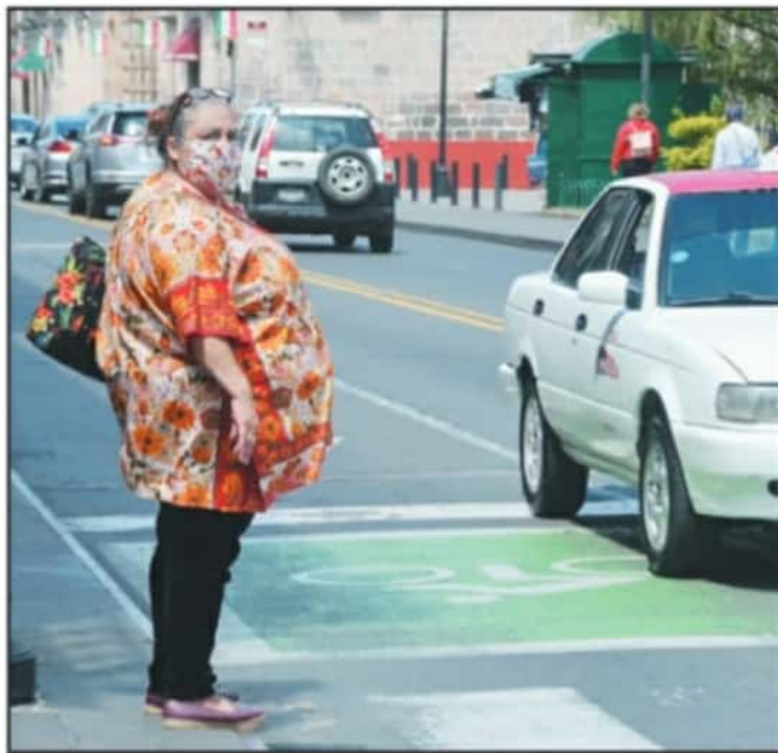
SE ASEGURA QUE SIETE DE CADA DIEZ PERSONAS CON OBESIDAD HAN EXPERIMENTADO EL RECHAZO Y LA CRÍTICA.