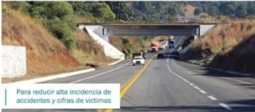
Para reducir alta incidencia de accidentes y cifras de víctimas