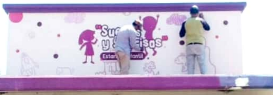
JACONA, MICH.- La estancia infantil del Ayuntamiento, "Sueños y Sonrisas", ubicada en la colonia El Aserradero, vendrá a beneficiar a madres trabajadoras y padres de familia de este municipio.