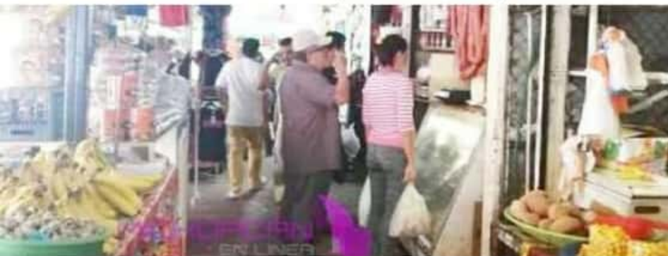
APATZINGÁN, MICH.- Diversas uniones de comerciantes informaron que de esta manera se pretende colaborar

Multinationales también anunciaron el cierre a la hora antes mencionada y cierre total los domingos. Y es que aunque las cifras oficiales de la Secretaría de Salud, colocan a Apatzingán por debajo de otros municipios en contagios por Covid-19, las medidas preventivas no deben dejarse de lado.