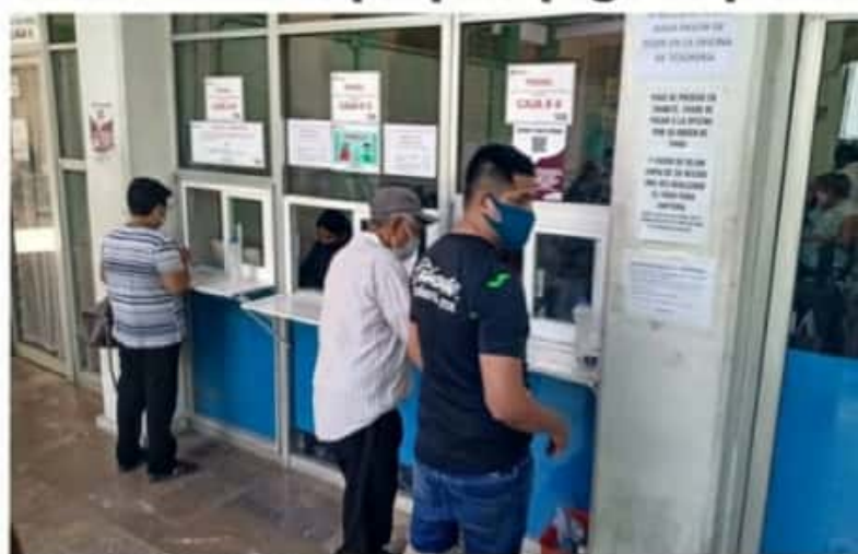
CD. LÁZARO CÁRDENAS, MICH.- Se amplió el horario de atención en cajas en el Departamento de Catastro, ubicadas al interior del Palacio Municipal, para realizar el pago del impuesto predial.