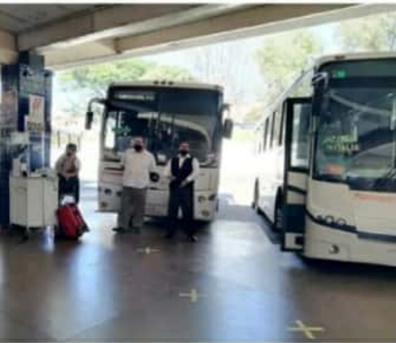
URUAPAN, MICH.- Un ligero repunte en sus actividades registraron durante diciembre las líneas de segunda clase para el transporte fónico de pasajeros, que operan en la central camionera de esta ciudad.