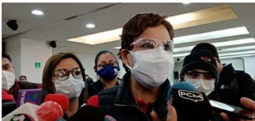
MORELIA, MICH.- Señaló que el tema también está dictado a nivel federal, "pues estamos en semáforo naranja".