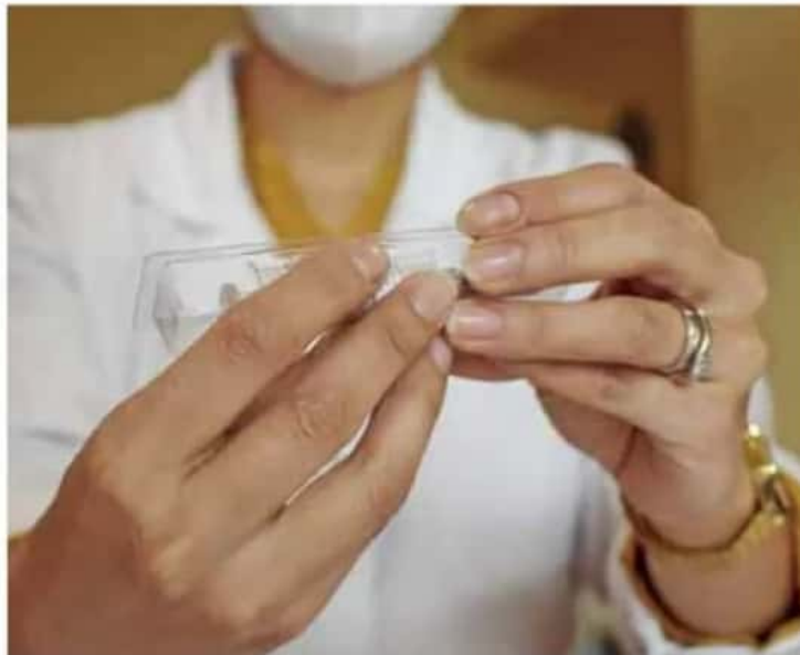
CanSino. La vacuna de origen chino aún no tiene aprobación de Cofepris.

"Cada persona, al momento de ser vacunada, debe recibir la información de su caso en particular, para que sepan el día exacto que deben regresar por la segunda dosis, para que cumplan con los tiempos. También se debe entregar una constancia en donde se ponga toda la