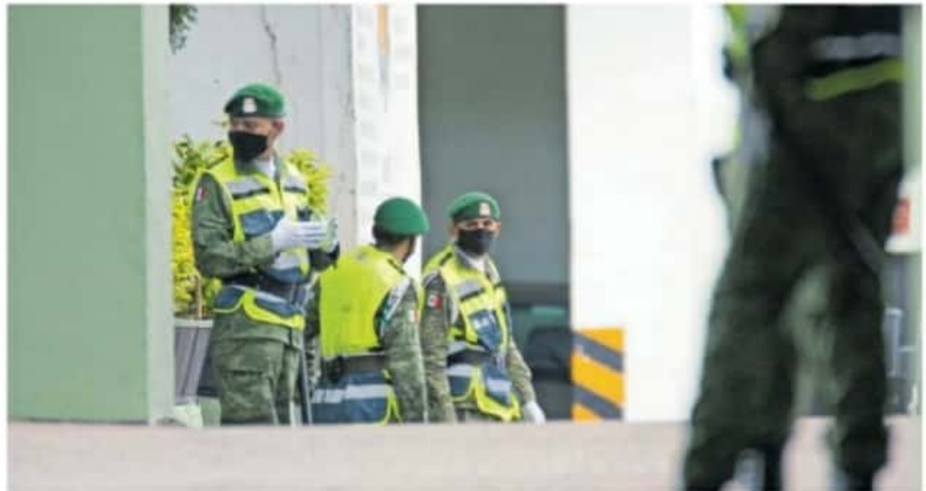
Será el quinto municipio en contar con la presencia de la Guardia Nacional de Michoacán