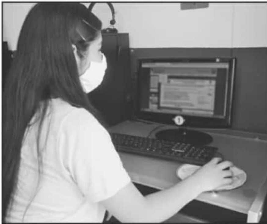
LAS CLASES A DISTANCIA CONTINUAN ESTE CICLO ESCOLAR, PERO SE BUSCAN ESTRATEGIAS PARA CONECTAR ALUMNOS.

En materia de transparencia y rendición de cuentas, el Cobaem fue calificado con el 100 por ciento de cumplimiento en materia de organización contable, por el manejo ordenado de sus recursos financieros.