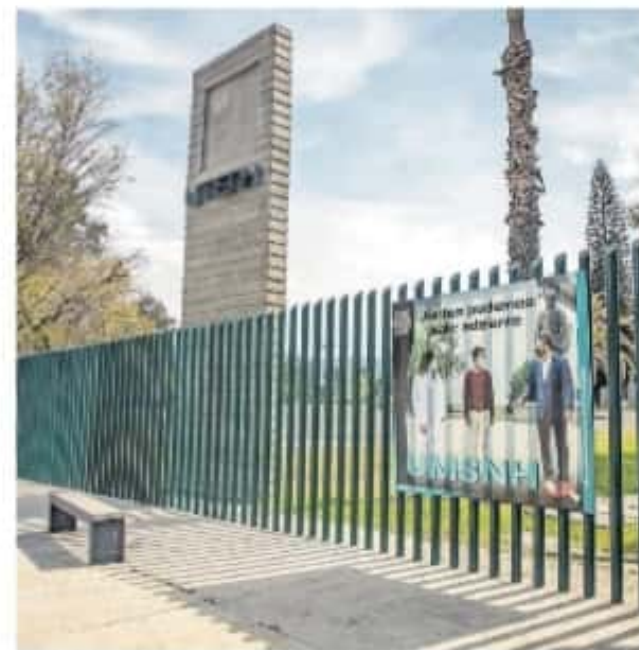
En diciembre pasado, el SPUM anunció la huelga para este 8 de enero

La UMSNH compartió en redes sociales un comunicado en el que señalaba que el día 11 iniciaría con las actividades admi-