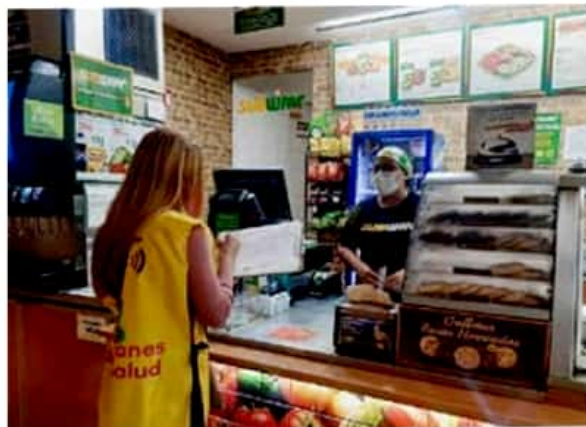
Cierres parciales en actividades no esenciales de jueves a sábado a partir

Hasta el corte del día de ayer, Morelia registra 8 mil 272 casos confirmados de COVID-19, 638 defunciones, y un promedio de ocupación hospitalaria del 92 por ciento, por lo que los integrantes del Comité acordaron seguir trabajando de manera conjunta para la contención de la epidemia.