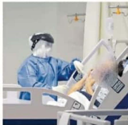
Los hospitales públicos tienen problemas de abasto de insumos.

Las multas son de 10 a 30 Unidades de Medida y Actualización (UMAS), es decir que oscilan entre los 896 pesos hasta los 2 mil 688, además de arrestos administrativos de hasta 36 horas. Mientras que la clausura podría ser temporal o definitiva para los negocios que incumplan los protocolos sanitarios.