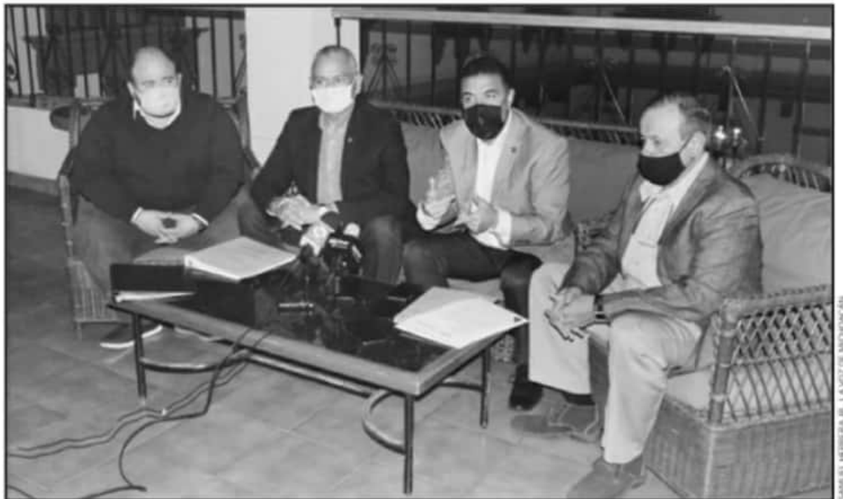
LÍDERES EMPRESARIALES DE LA ENTIDAD SE ANOTARON PARA FORMAR PARTE DEL COMITÉ DE PARTICIPACIÓN CIUDADANA DEL SISTEMA ESTATAL ANTICORRUPCIÓN