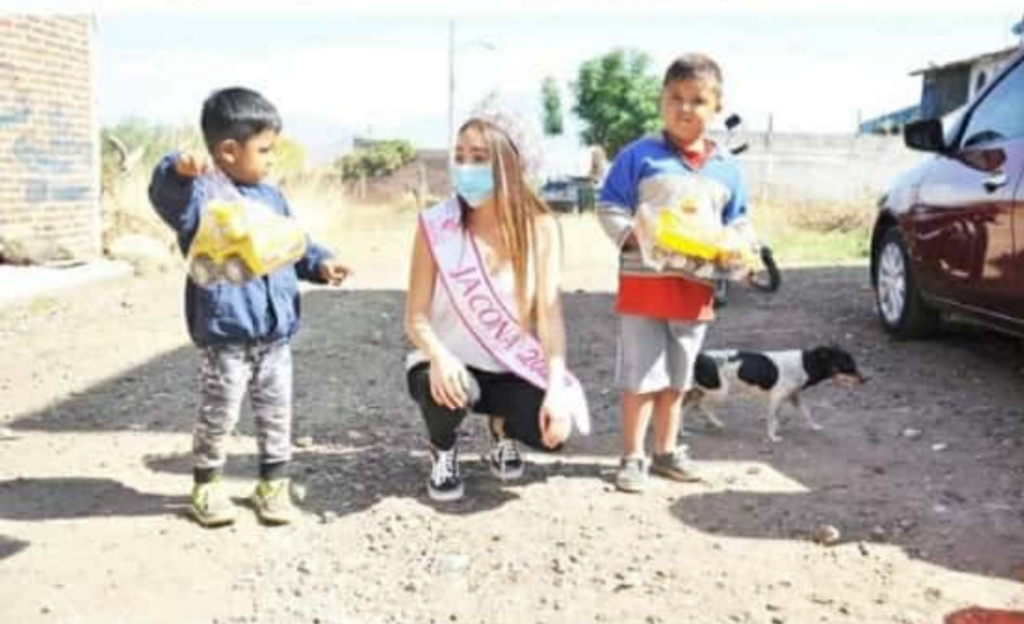
JACONA, MICH.- Con cuidado y atención a los protocolos preventivos ante la pandemia, personal del DIF y del

El reto para la presente administración ha sido impulsar las actividades, cumpliendo con las medidas sanitarias y desde luego, no dejar de apoyar a quienes más lo necesitan y en esta ocasión, no dejar perder la magia y la ilusión de los niños de este municipio.