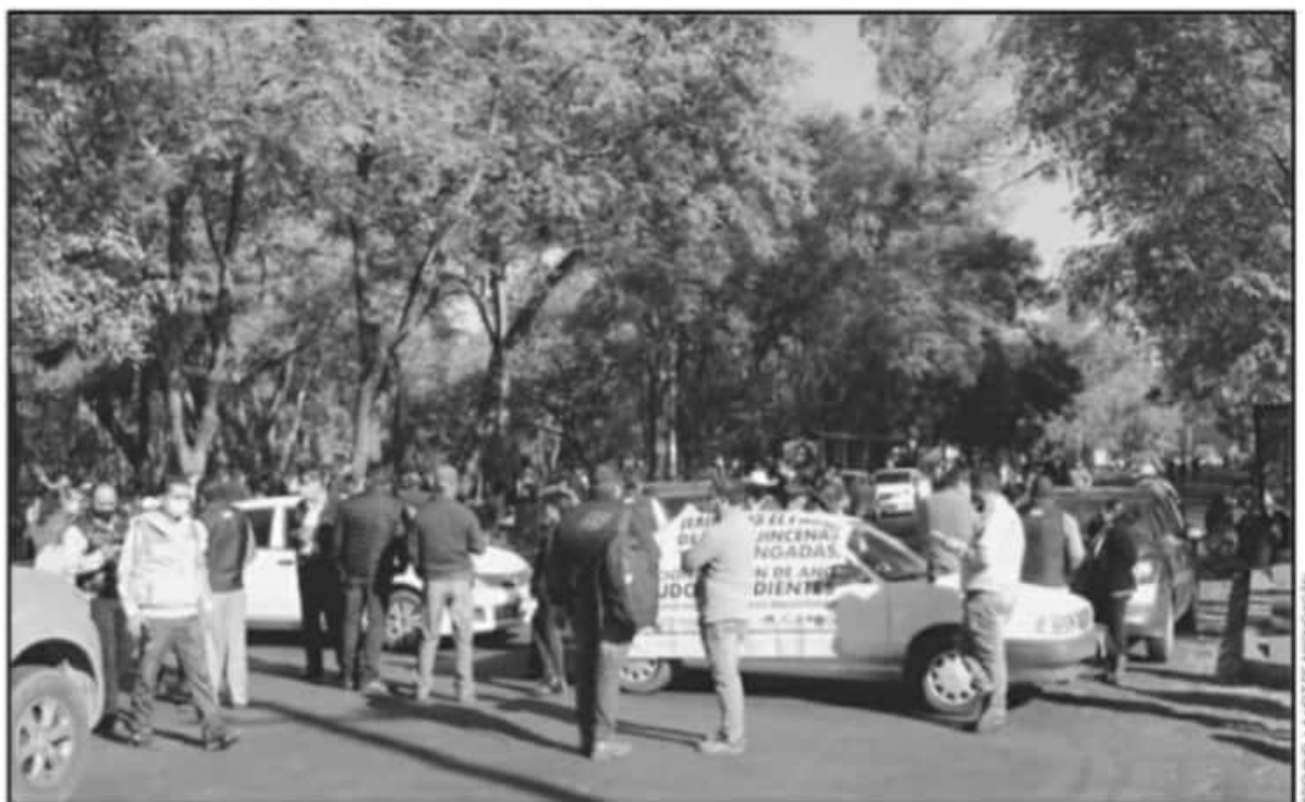
DESDE EL MES DE OCTUBRE SE HAN VENIDO MANIFESTANDO AGREMIADOS AL FESEMS, PROMETEN RETOMAR ACCIONES A PARTIR DE LA SIGUIENTE SEMANA.

El dirigente consideró que hay condiciones para comenzar a trabajar esta parte de los adeudos ya que se advierte un año complicado por el tema electoral y quisieran cerrar con el pago de una gran parte, si no es que la totalidad de los adeudos para que se les dé certeza a los trabajadores en medio de los relevos en las autoridades.