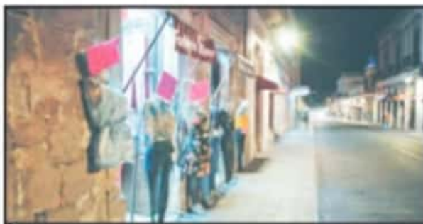
NO TODOS LOS ESTABLECIMIENTOS CERRARON A LA HORA ESTABLECIDA.