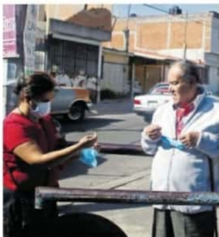
Titulares de Sedeco y la SSM pidieron hacer obligatorio el uso de cubrebocas. (MARIANA LUNA)

En ese sentido, ejemplificó que él ha recibido mensajes con información que le daría ventaja para participar en licitaciones para obra pública y adquisiciones, sin embargo aseguró que no ha sido participe de estas.