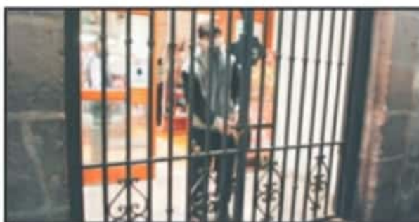
ALGUNOS COMERCIANTES SE RELINQUIAN CON EL EDIL PARA HABLAR DEL TEMA.