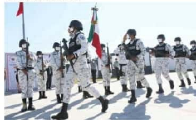
ZAMORA, MICH.- La obra será posible a la donación del terreno por parte del Cabildo, quien además ha brindado espacios y recursos.

El Cabildo zamorano autorizó en su momento la instalación de la Guardia Nacional en el fraccionamiento San José, al poniente del municipio, después se estableció una extensión en Linda Vista y por último en Altamira. Con esto se refrenda que Zamora trabaja en conjunto con el Gobierno Federal por la Seguridad y el bienestar de los zamoranos, finalizó el edil.