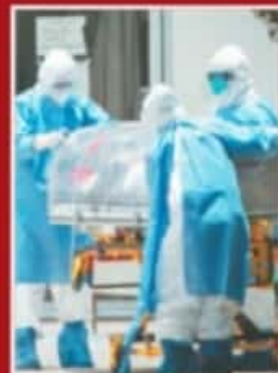
CADA VEZ HAY MENOS CAMAS.