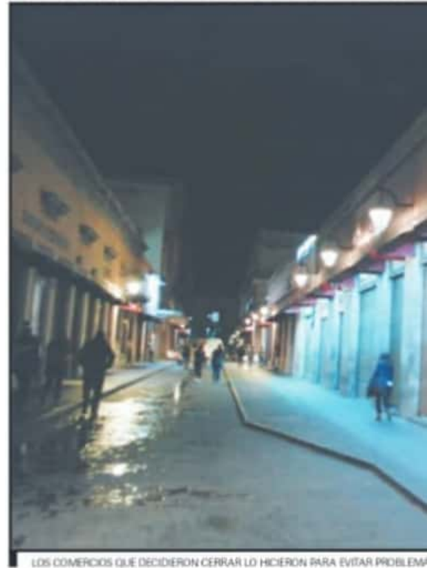
LOS COMERCIOS QUE DECIDIERON CERRAR LO HICIERON PARA EVITAR PROBLEMAS

Se va a cerrar jueves, viernes y sábado a las siete de la noche, eso está en el decreto. Y el domingo es un cierre total, lo que puede seguir funcionando son las actividades esenciales con comida para llevar