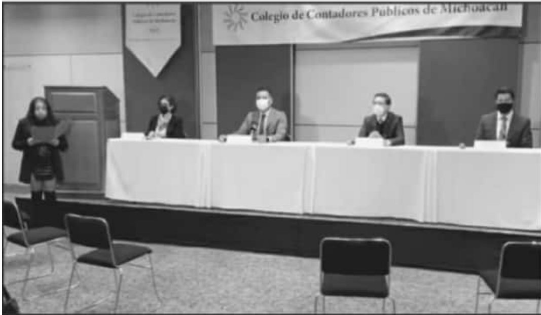
LA MESA DE CONTADORES DE MICHOACÁN LLAMÓ A LOS PROFESIONALES DEL ESTADO A ACTUALIZARSE EN MATERIA FISCAL.