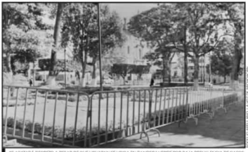
SE ACATARÁ DECRETO A PESAR DE QUE URUAPAN SE UBICA EN BANDERA VERDE POR BAJA PREVALENCIA DE CASOS.