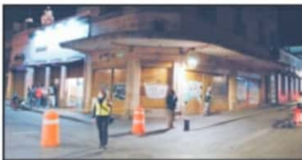
ESTE JUEVES SE LOGRÓ PERCIBIR UN CENTRO HISTÓRICO MÁS DESPEJADO.