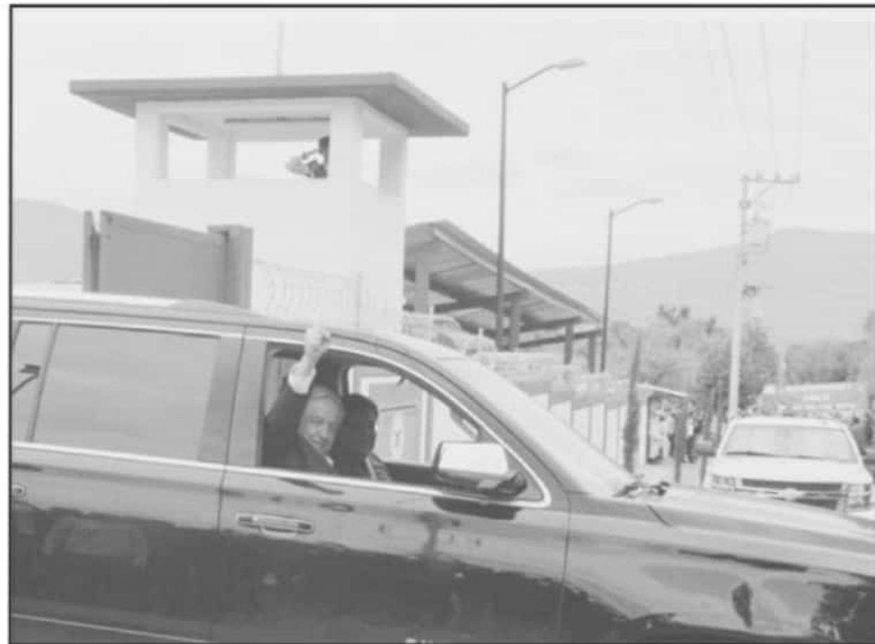
EL PRESIDENTE ANDRÉS MANUEL LÓPEZ OBRADOR, REALIZARÁ SU SÉPTIMA VISITA A MICHOACÁN PARA PONER EN MARCHA TRES CUARTELES DE LA GUARDIA NACIONAL.