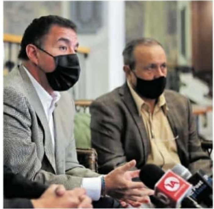
Michoacán ocupa los primeros lugares a nivel latinoamérica y el décimo a nivel nacional en corrupción. (FERNANDO MALDONADO)

Aseguró que si el Congreso los elige para formar parte del comité, ellos se comprometen a elegir a la persona más capacitada para presidir el Sistema Es-