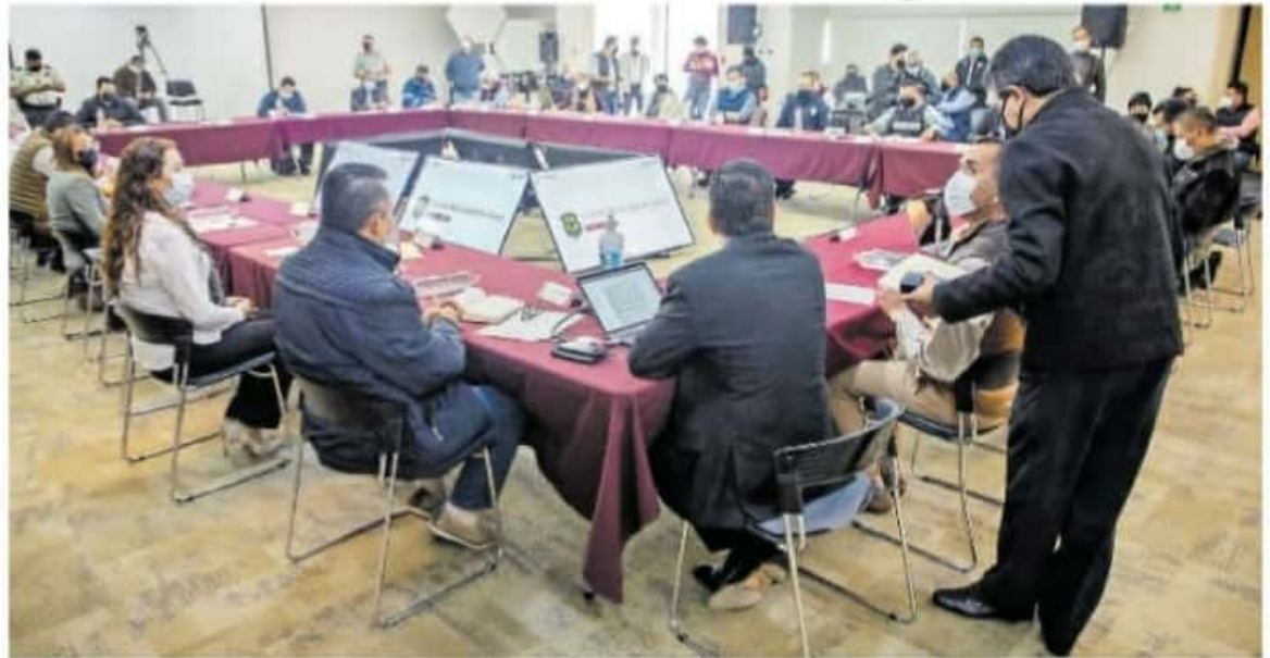
Este jueves, el Comité de Salud Municipal sesionó a puerta cerrada.