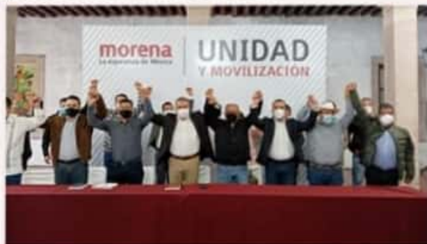
MORELIA, MICH.- El aún edil de Morelia, agradeció las muestras de apoyo a sus colegas y reconoció el liderazgo de cada uno de ellos en sus municipios.