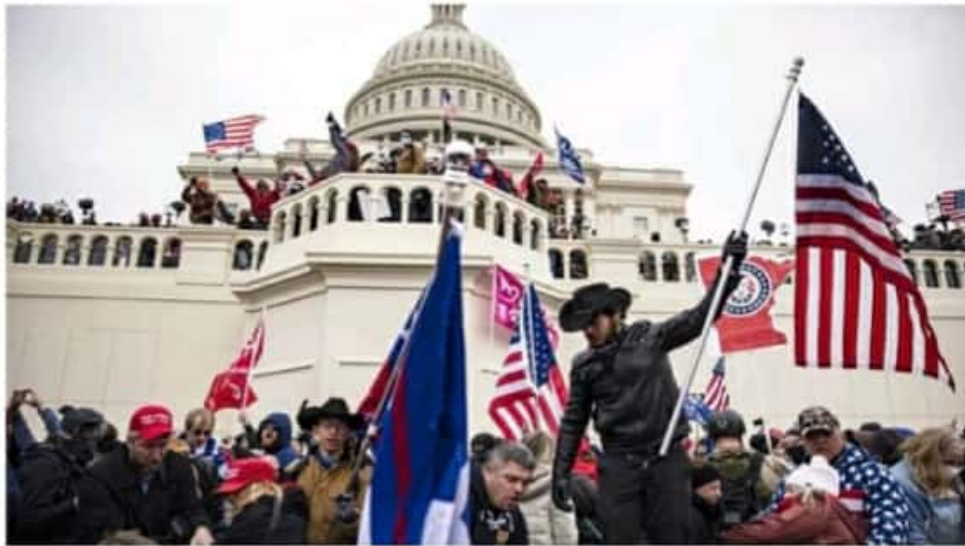
Condena generalizada el atentado al Capitolio de Estados Unidos.