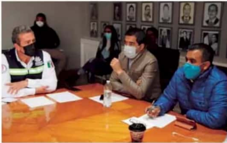
Sesión permanente. El Comité Municipal de Seguridad en Salud analiza la situación.