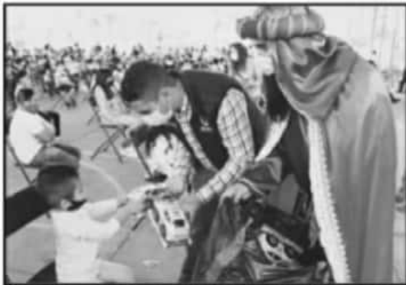
HASTA ESTE JUEVES LOS REYES MAGOS DEL DIF CONTINUABAN ENTREGANDO JUGUETES, PARA SEGUIR CON SU LABOR TAMBIÉN EL PRÓXIMO VIERNES.