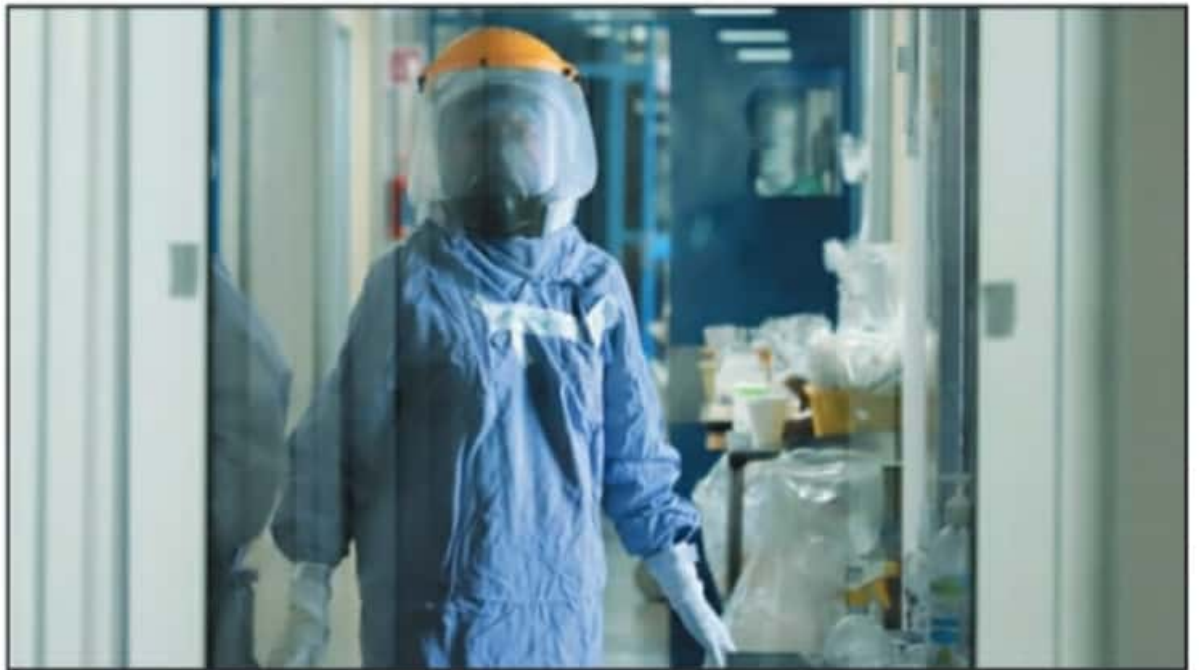
EL TEMA DE INSUMOS MÉDICOS ADQUIRIÓ NOTORIEDAD TRAS UNA FALLA DEL INES, EN MORELIA, QUE PROVOCÓ LA PRESUNTA MUERTE DE 38 PACIENTES DE COVID-19.

Cuestionada sobre el riesgo de un desabasto de oxígeno médico y medicamentos para pacientes de COVID-19, la titular de la SSM respondió que hasta el momento el único desabasto observado es el de los gases anestésicos ya mencionados, no obstante, de mantenerse una saturación de las camas