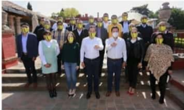
MORELIA, MICH.- El precandidato a la gubernatura afirmó que la cercanía con la ciudadanía ha sido fundamental para trabajar día a día por el estado.

El edil aludió al llamado Equipo por México, que consideró incongruente "como el agua y el aceite", al reunir a instituciones partidistas que nada tienen que ver la una con la otra. "¿cuándo habíamos visto derechas e izquierdas?, ¿su propósito es únicamente frenar la 4ta transformación?, que con el maestro Raúl Morón en Michoacán, está por llegar".