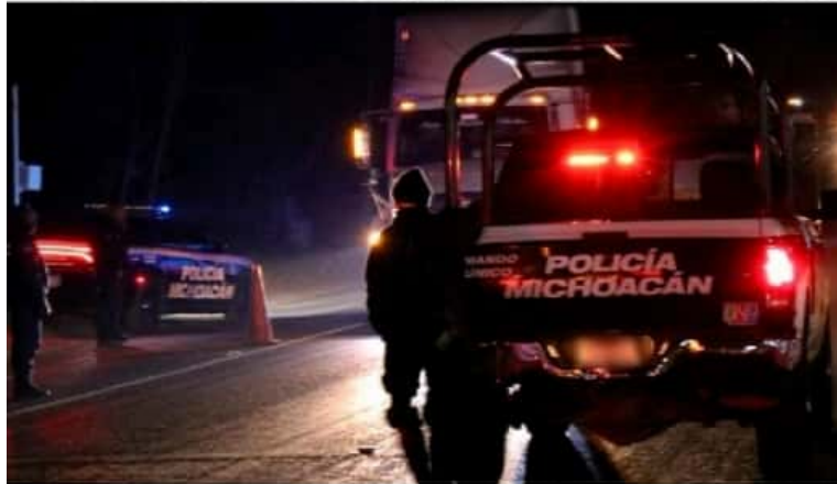
D. LÁZARO CÁRDENAS, MICH.- Según datos de la organización civil "Semáforo Delictivo", el municipio de Lázaro Cárdenas cerró el 2020 con más de 50 homicidios.