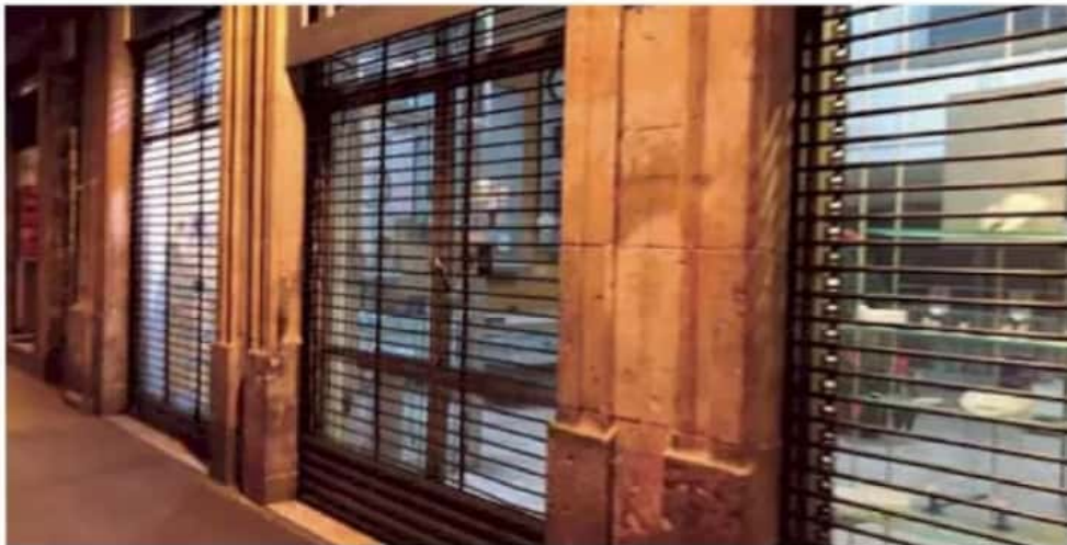
Negocios. Establecimientos no esenciales deberán cerrar a las 19:00 horas de jueves a sábado, y los domingos todo el día. /MARCOS.

En el documento oficial se especifica que las actividades que resultan no esenciales son aquellas que no fueron determinadas "esenciales" en tres acuerdos emitidos por la Secretaría de Salud federal.