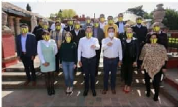
MORELIA, MICH.- El precandidato a la gubernatura afirmó que la cercanía con la ciudadanía ha sido fundamental para trabajar día a día por el estado.

El edil aludió al llamado Equipo por México, que consideró incongruente "como el agua y el aceite", al reunir a instituciones partidistas que nada tienen que ver la una con la otra "¿cuándo habíamos visto derechas e izquierdas?, ¿su propósito es únicamente frenar la 4ta transformación?, que con el maestro Raúl Morón en Michoacán, está por llegar".