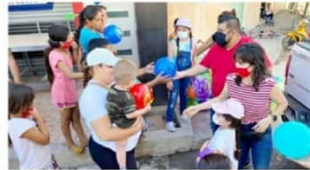
APATZINGÁN, MICH.- El representante popular y su equipo de apoyo se ocuparon de visitar a los niños que viven en colonias marginadas.

Ahora, al igual que en otros años, el Partido del Trabajo superó las expectativas y demostró una vez más su capacidad de liderazgo y compromiso para estar siempre presente en atención a las causas más sensibles y a uno de los grupos más vulnerables que existen en nuestra sociedad, como es en este caso al sector infantil.