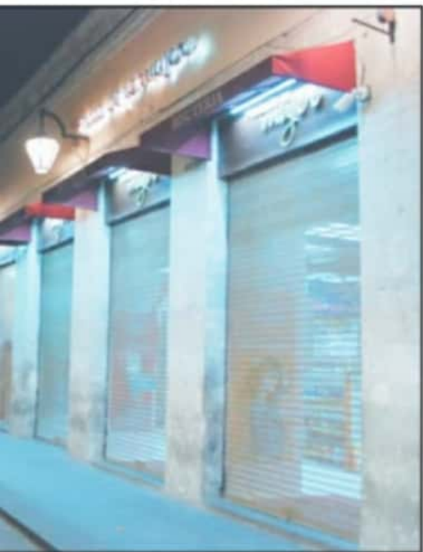
...TICAS POSTERIORES CON LAS AUTORIDADES Y PARA COLABORAR CON LAS MEDIDAS.

del cumplimiento de los puntos estará a cargo de la Secretaría de Salud del Estado y de las demás autoridades sanitarias competentes, que deberán ser asistidas por la Secretaría de Gobierno, Protección Civil y las autoridades en materia de Seguridad Pública, mismas que actuarán en coordinación con las instancias federales y municipales. El incumplimiento de las medidas será sancionado de acuerdo con la normatividad administrativa aplicable, que consistirán en: amonestación con apercibimiento;