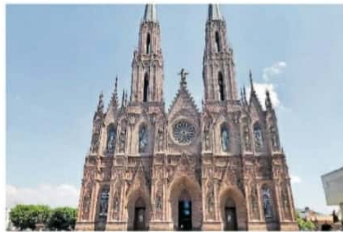
Zamora ha tenido que sufrir el azote de la incidencia delictiva

bre, periodo en que se hizo el último corte del Semáforo Delictivo, este tipo de delitos decreció a 32 y se tradujo en el 6 por ciento de la actividad delictiva por narcomenudeo a nivel estatal.