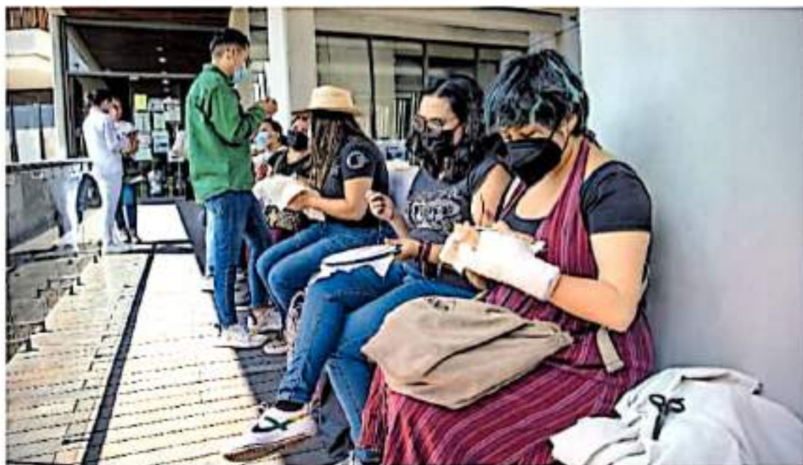
Activistas sociales se dieron cita y a manera de protesta, bordaron por la memoria, la dignidad y la justicia.

Al lugar arribaron elementos de la FGE quienes resguardaron el área e iniciaron las indagatorias. Posteriormente, el cuerpo fue trasladado a la morgue donde se le practicó la necropsia de ley.