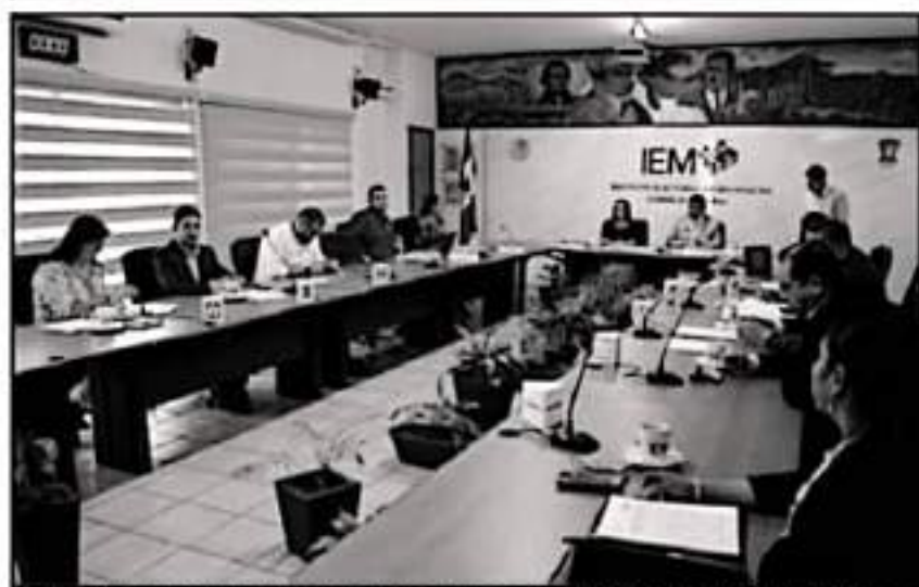
AUTORIDADES DEL IEM SEÑALAN QUE VA EN AUMENTO LA CRISIS Y CON ELLO TAMBIÉN LOS ADEUDOS ECONÓMICOS.