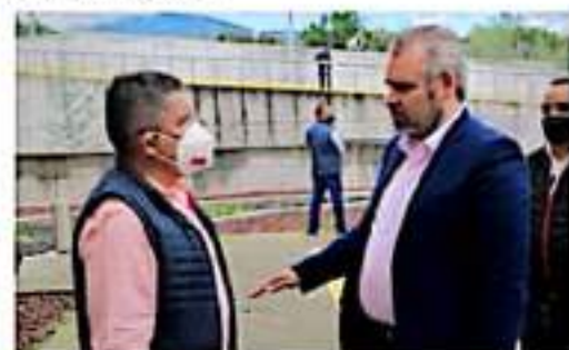
MORELIA, MICH.- El gobernador de Michoacán, Alfredo Ramírez Bedolla.