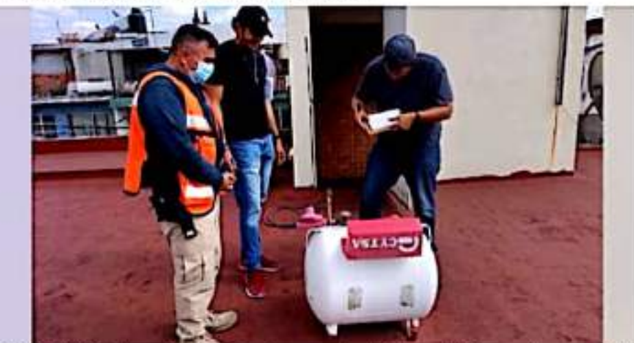
ZAMORA, MICH.- La inspección corresponde al programa de gestión integral del riesgo, en la que se realizó la evaluación de cada uno de los locales para corroborar que cumplan con las medidas de seguridad necesarias.

Al finalizar, recomendaron a los locatarios que no contaban con la totalidad de los requisitos a acatar las recomendaciones de la coordinación de Protección Civil municipal, para su propia seguridad y principalmente para los ciudadanos que acuden diariamente a estos centros de abasto popular.