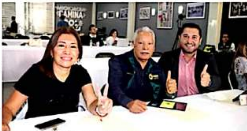
La nueva administración estatal debe asumir su responsabilidad, no culpar al pasado: integrantes de la dirección estatal colectiva del PRD.

Las y los integrantes de la DEE del PRD, exhortaron a las nuevas autoridades de la Secretaría de Seguridad Pública y la Secretaría de Gobierno a reforzar la seguridad en municipios y recorrer las diferentes regiones del estado.