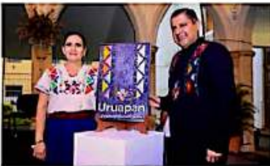
El presidente de Uruapan presentó la imagen institucional de la administración municipal