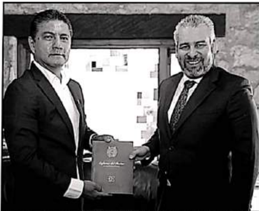
EL ENCUENTRO FUE CONSIDERADO COMO "FRUCTÍFERO" POR AMBAS PARTES, EN DONDE TOCARON TEMAS RELEVANTES.

Ramírez Bedolla, GOBERNADOR DE MICHOACÁN