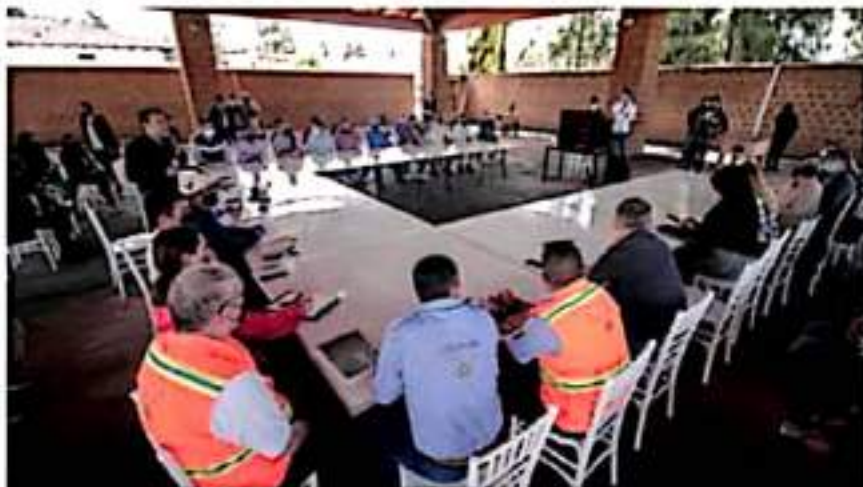
La Sectur afina detalles para el tradicional festejo de Noche de Muertos en Michoacán.

Por su parte, la Jurisdicción Sanitaria 08 dio a conocer que de los 7 nuevos casos de COVID-19 que se registraron ayer en este municipio, dos fueron en la ciudad, para un acumulado de 8,121; otros dos fueron en la tenencia de Guacamayas que llegó a 3,003 casos acumulados, en tanto que en la tenencia de Buenas Aires se documentó un caso más para sumar 511; en la tenencia de La Mira hubo otra más para 1,136 y en otro fue en la tenencia de Caleta de Campos, que llegó a 31 contagios acumulados en todo lo que va de la pandemia.