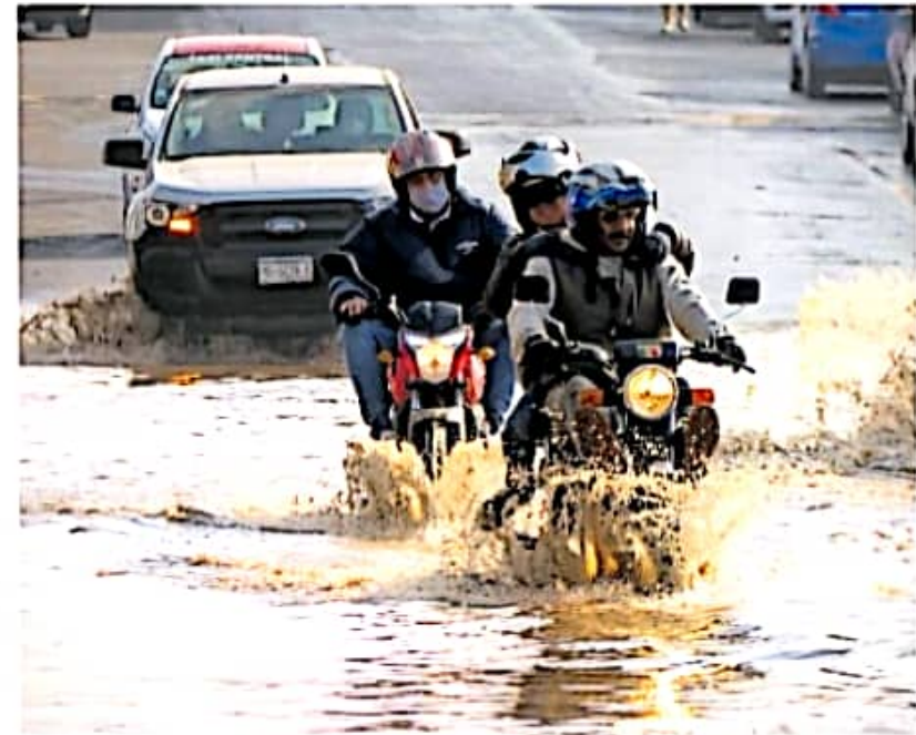
Se registraron encharcamientos en avenida Camelinas y Bulevard García de León

El último reporte de PC indicó que también se desbordó el canal de la avenida San José del Cerrito, donde el agua afectó a algunos domicilios. Los encharcamientos se registraron en los centros