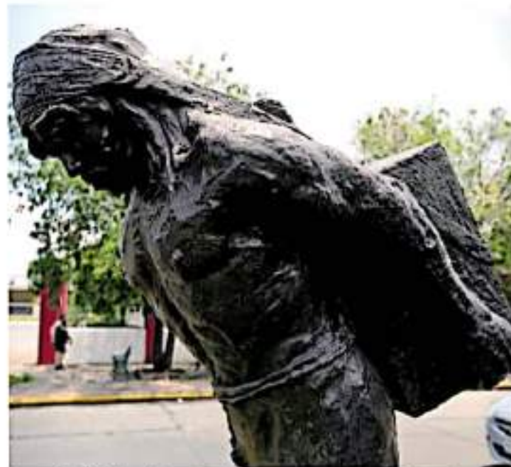
La organización ha reafirmado su deseo porque se retire la escultura denominada Los Constructores FRANCISCO

Por ende, el CSIM no propone ningún perfil para que ocupe la titularidad de la dependencia. No obstante, asintió que si pedirán que sea alguien de las comunidades indígenas, que hable el idioma, "estaríamos exigiendo al gobierno del estado, ya sea con el gobernador o el secretario de Gobierno, la mesa de diálogo. No vamos a entrar al juego con la comisión porque no tiene atribuciones y