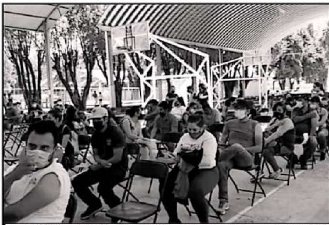
LA APERTURA DE MÓDULOS RURALES PARA LA APLICACIÓN DE LAS VACUNAS SE REALIZÓ EN LAS COMUNIDADES DE ANGAHUAN, CAPATZIARO Y SAN LORENZO

De esta forma, poco después de las 13 horas de este jueves se erradicó el panorama de excesivo congestionamiento de personas que se observó durante las últimas 72 horas en las inmediaciones de la Unidad Depor-