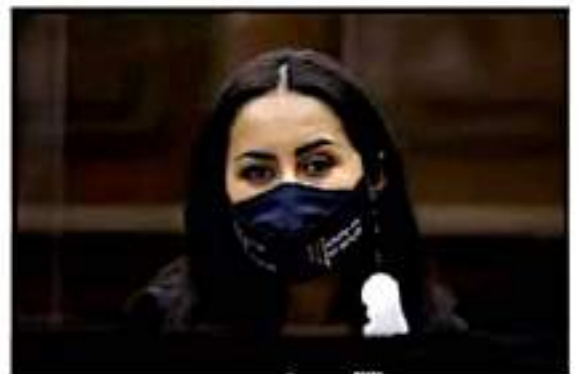
Gloria del Carmen Tapia Reyes, integrante del grupo parlamentario del PRI en el Congreso local.