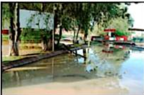
EL ACCESO A LAS CANCHAS EMPASTADAS, TOTALMENTE BAJO EL AGUA.