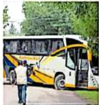
Aún no se ha determinado una ruta de pago

Como parte de las fiscalizaciones internas en el rubro de seguridad, el gobierno emanado de Morena señaló que se está investigando el tema de contratación de patrullas, y que luego de tener la información recabada la estarán dando a conocer.