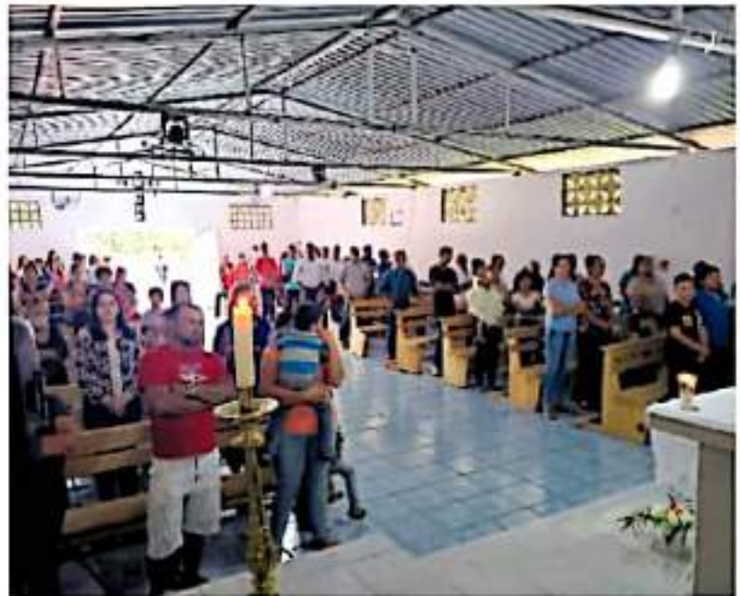
El padre indicó que muchos no volverán por temor. / CORTE MARINEROS DE ESQUILIMÁN

“No es que haya un cese del fuego, el fuego aún continúa en los límites de Coa-