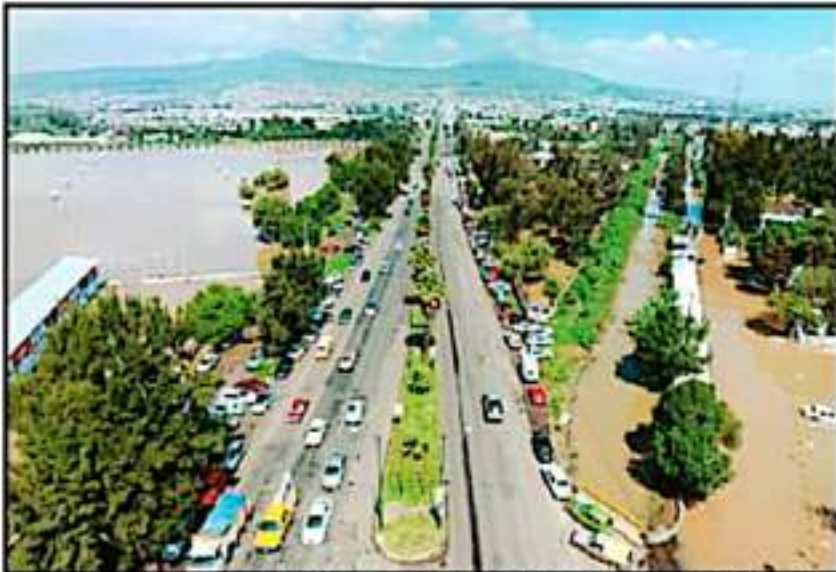
LA ZONA DE LAS CANCHAS DE POLICÍA Y TRÁNSITO Y LA FISCALÍA GENERAL DEL ESTADO SE ANEGÓ ANTE LAS LLUVIAS.