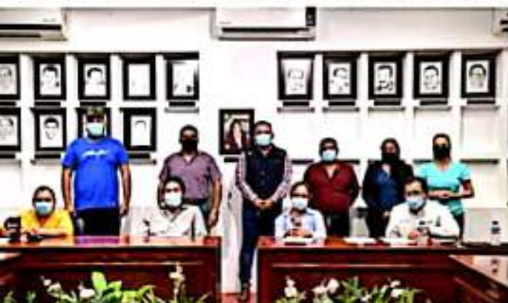
CD. LÁZARO CÁRDENAS, MICH.- Fue conformado el Comité Municipal de Salud correspondiente al periodo 2021-2024

Por último, se informó que el comité estará sesionando conforme a las problemáticas de salud que lleguen a suscitarse durante el año.