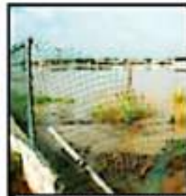
ESTA ZONA DE CANCHAS DESAPARECIÓ TOTALMENTE BAJO EL AGUA.