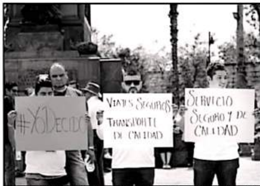
ENTÉRMINOS LEGALES. LAS PLATAFORMAS SE IMPUSIERON A LA AUTORIDAD Y LAS ORGANIZACIONES DE TRANSPORTISTAS.

quieros cambios en materia tributaria a nivel federal básicamente se legaliza y formaliza este tipo de servicio en todo el territorio.