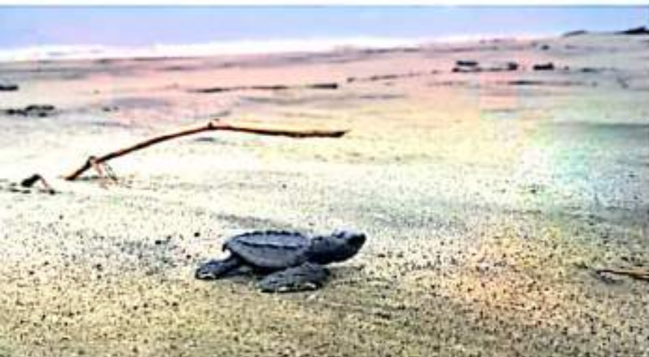
CD. LÁZARO CÁRDENAS, MICH.- El Campamento Tortuguero de Solera de Agua dio a conocer que durante la actual temporada de arribazón y anidación, los números que registran se mantienen positivos y a la alza.