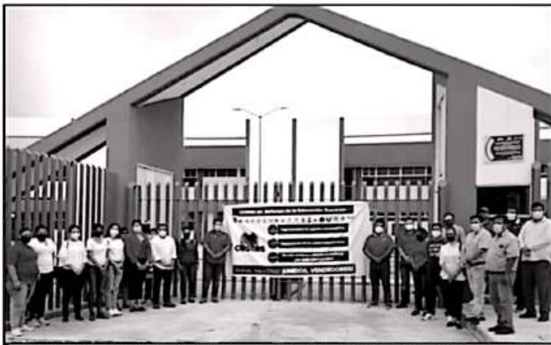
HACE UN MES QUE FUE DO CONFORMADO FORMALMENTE EL SINDICATO ÚNICO DE TRABAJADORES DE LA UNIVERSIDAD POLITÉCNICA DE LÁZARO CÁRDENAS.

En este contexto se informó por el SUTUPLC que el CESTES ya tuvo un acercamiento con el secretario de gobierno al medio