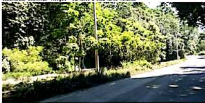
Ante la apatía oficial, voluntarios harán la limpieza de la maleza que impide buena visibilidad en la carretera costera.

casí morenistas je je je, estas gentes no son leales a un partido sino a sus intereses y sin ningún escrúpulo dejan las filas de otro partido con tal de seguir cobrando en el erario estatal, ya pronto saldrán los nombres y habrá sorpresas para beneficio de algunos y para el coraje de otros, de seguir las cosas en ese sentido veo difícil que Morena vuelva a repetir el triunfo en la elección del 2024, eso de tener puros oportunistas en cargos públicos no es nada bueno, al rato y de acuerdo a sus intereses están del otro lado, aaaaah y se me olvidaba comentarles ya en los próximos días empezarán a realizarse algunos cambios en las dependencias estatales de este municipio, y sigue el TUCI (todos unidos contra Itze) más activo que nunca, no le quieren dejar nada, se rumorea que algunos actores políticos del puerto ya se entrevistaron con Ramírez Bedolla y ya acordaron algunos espacios, incluso dentro de ellos van algunos aliancistas, lo cual no me causa sorpresa dadas las condiciones en que se repartieron las posiciones del gabinete ampliado. De casualidad jaste no tiene un amigo o amiga que lo recomiende para un trabajo?, le paso el dato que están contratando gente haya o no haya trabajado en la campaña de Morena, lo único que se necesita es tener un buen padrino o jurarle amor eterno al actual secretario de gobierno, que es la mano que mueve los hilos en el estado. Hasta la próxima.