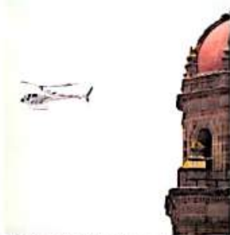
El gasto fue durante el anterior sexenio. SE/SECRETARÍA DE SEGURIDAD PÚBLICA

El contrato estipulaba que las aeromóviles sólo podían tener 50 horas efectivas de vuelo al mes, y si se necesitaban por más tiempo, se debía pagar horas extras de vuelo. Otra cláusula señalaba que el gobierno del estado se comprometía a cubrir el costo total de la aeromóvil si se perdía, era robada o sufría destrucción total.