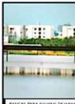
BANCAS PARA EQUIPOS DEJABAN VER NIVEL QUE ALCANZÓ EL AGUA.