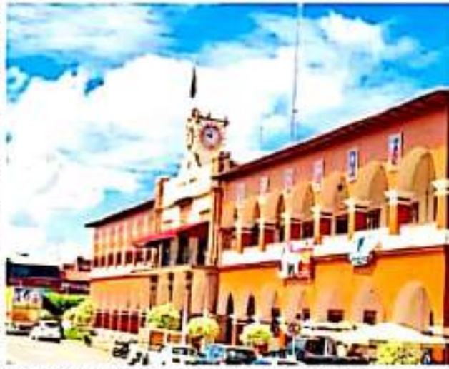
APATZINGÁN, MICH.- Asimismo, quienes terminaron sus funciones tienen la obligación de dar a conocer ante dicha instancia su última declaración.