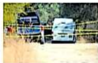
Elementos de la FGE resguardaron el área.

Mientras la audiencia se llevaba a cabo en la Sala de Criminal número 7, a la entrada del edificio del Poder Judicial, activistas sociales se dieron cita para acompañar a la familia de Del Toro Morales y a manera de protesta, bordar por la memoria, la dignidad y la justicia.