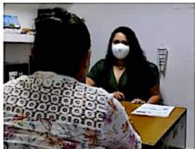
CD. LÁZARO CÁRDENAS, MICH.- Octubre es el último mes para el Programa "Soy México", el cual facilita la inscripción del registro de nacimiento en México de las niñas, niños y adolescentes de nacionalidad estadounidense.

■ Gobierno municipal invita a ser beneficiado