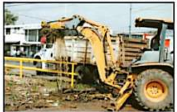
EL EXCESO DE BASURA PROVOCÓ DESBORDAMIENTO DEL DREN BARAJAS.