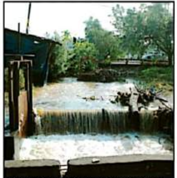
VERDADEROS RIOS FORMÓ LA FUERTE LLUVIA DEL PASADO MIÉRCOLES.