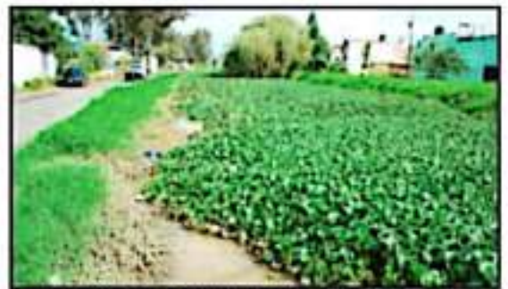
EL LIRIO, DENTRO DE LAS CAUSAS QUE PROVOCAN DESBORDAMIENTOS.

En un recorrido de La Voz de Michoacán se pudo constatar como el dren, a unos cuantos metros del Infonavit, se encuentra taponeado de basura y a punto de desbordarse, por lo que autoridades se dieron a la tarea de limpiarlo. Asimismo, en las laterales de la Madem, en las inmediaciones de la desviación a San Juanito Itzicuato, trabajadores del Ayuntamiento y del COAMIAS realizaron labores de desahogue.