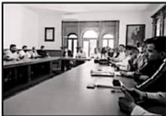
DESPUES DEL SINDICATO DE LA UNIVERSIDAD POLITÉCNICA Y REPRESENTANTES DE LA CESTES, SE REUNIERON EL SABADO CON EL SECRETARIO DE GOBIERNO.