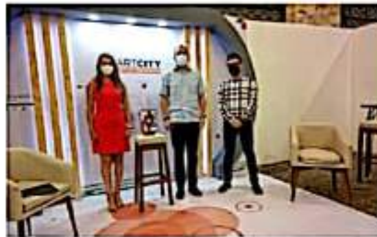
Como urbe inteligente que equilibre modernidad y desarrollo sostenible

En este sentido, remarcó que es prioritario continuar con el saneamiento del río, en coordinación con Capacu, ya que a lo largo de sus 11 kilómetros de caudal, al menos el 50% todavía recibe descargas de drenajes. Además, puntualizó que se debe