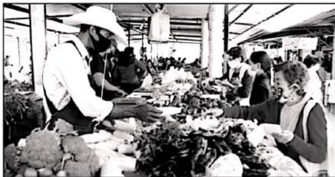
FAMILIAS ENTERAS HAN TENIDO QUE DEJAR DE CONSUMIR CIERTOS ALIMENTOS DE LA CANASTA BÁSICA DEBIDO AL INCREMENTO EN SUS PRECIOS

que presentó más ascenso en septiembre, con un incremento del 27.05 por ciento; lo sigue el chile serrano, con alza del 14.42 por ciento; el kilo de jitamate, un 13.06 por ciento; aceites y grasas vegetales comestibles, 5.26 por ciento; el mencionado gas LP, con un nuevo aumento del 4.73 por ciento; la leche pasteurizada, 1.31 por ciento; la carne de res, 1.11 por ciento y los refrescos envasados, con un 0.82 por ciento.