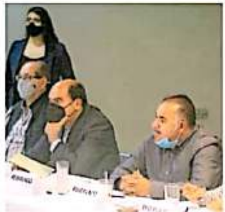
El aumento de recaudación se proyecta en más de un 50 por ciento.

El aumento de recaudación se proyecta en más de un 50 por ciento, así como un control de gastos y transparencia en un 90 por ciento. Algo que desde hace 10 años se vive en ciudades como Guadalajara donde los usuarios cuentan con una aplicación digital que permite pagos con pay-pago.