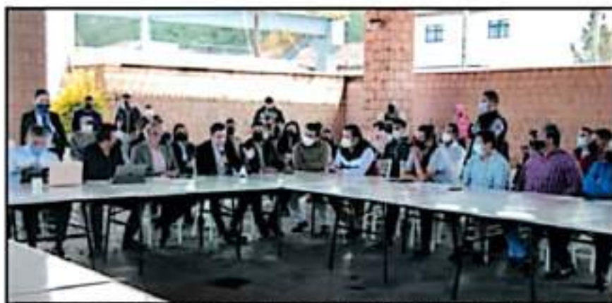
AUTORIDADES MUNICIPALES DE LA REGIÓN LACUSTRE Y DEL GOBIERNO ESTATAL TUVIERON AYER UN ENCUENTRO

Mencionó que si se realizará el banguis artesanal, al representante del Instituto del Artesano, informó que ya está la convocatoria para el concurso que se realiza en la explanada del antiguo Colegio Jesuita.