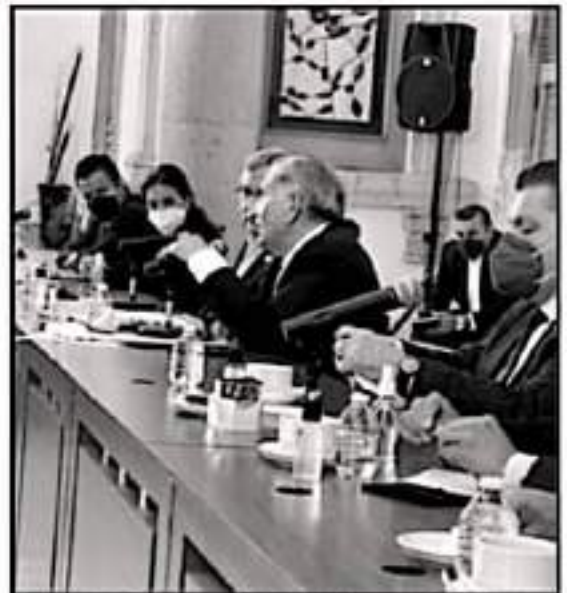
EN EL ENCUENTRO SE ABORDARON TEMAS DE LA AGENDA DE PENDIENTES CON EL SECRETARIO DE GOBIERNO FEDERAL, ADRIÁN AUGUSTO LÓPEZ.

Por ello, los miembros del sindicato reafirmaron con Torres Peña el compromiso de que sus gestiones y demás acciones se harán sin afectar al orden y con diálogo sindical para todos los trabajadores, sin distinción de trato por razones políticas o ideológicas.