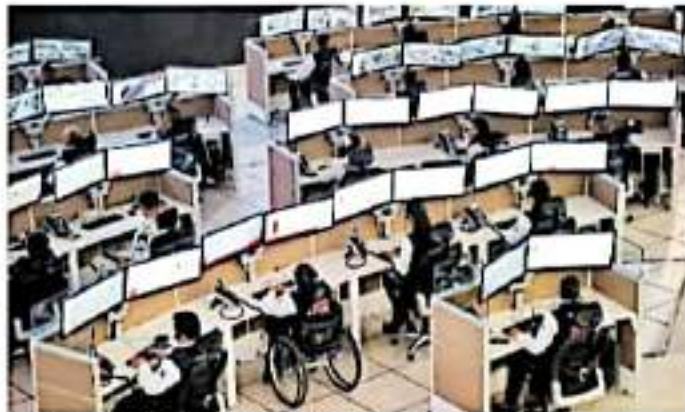
Se dijo que era el más grande de América Latina

Ante diversas irregularidades detectadas en la obra, así como en la operatividad, el actual gobierno estatal anunció que suspenderá contratos con la empre-