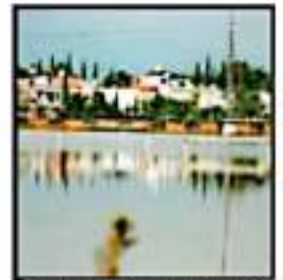
EN UN LAGO QUEDARON LAS CANCHAS DE POLICÍA Y TRÁNSITO.