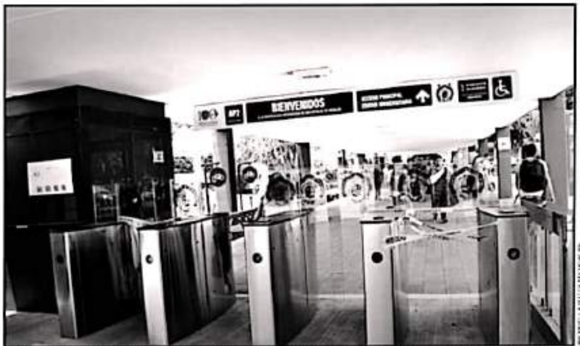
EN EL PASEO DEL SANITARIO ADICIONADO LA UMSNH PREPARA LA VUELTA A CLASES PRESENCIALES. EL LUNES REGRESA PERSONAL ADMINISTRATIVO

Agregarán las autoridades que toda persona que asista a las instalaciones universitarias debe