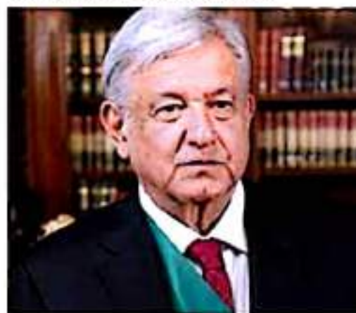
MORELIA, MICH.- El presidente de México, Andrés Manuel López Obrador.

Precisó que se está en revisión de los directores de Policía, por otro lado, indicó que tiene el conocimiento de que algunos presidentes municipales no pueden combatir al crimen a través de sus corporaciones, por lo que en coordinación con la Secretaría de Gobierno se determinará qué tipo de apoyo se requiere.