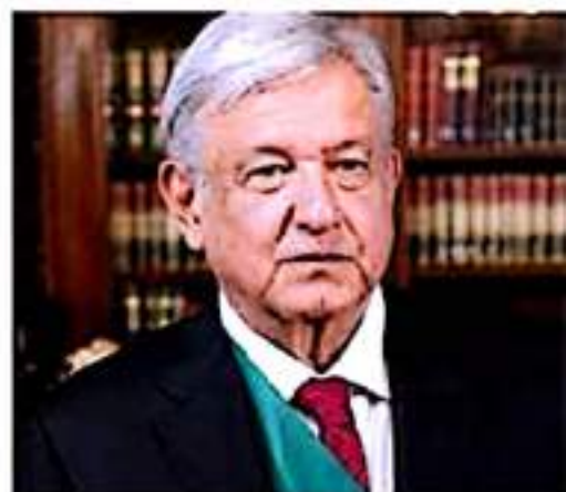
MORELIA, MICH.- El presidente de México, Andrés Manuel López Obrador.

Precisó que se está en revisión de los directores de la Policía, por otro lado, indicó que tiene el conocimiento de que algunos presidentes municipales no pueden combatir al crimen a través de sus corporaciones, por lo que en coordinación con la Secretaría de Gobierno se determinará qué tipo de apoyo se requiere.