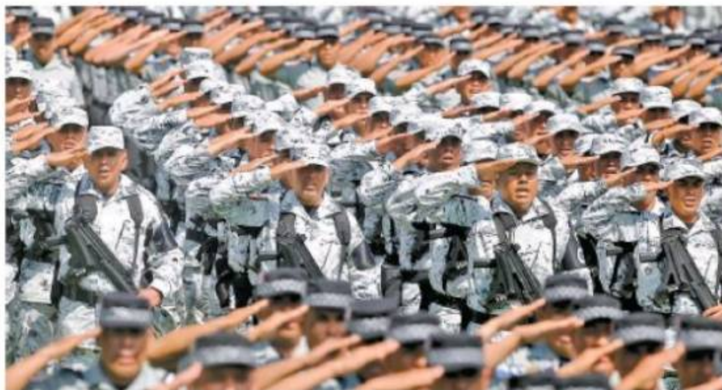
El Presidente encabezó en el Campo Marte el acto para el despliegue de 70 mil elementos en 150 regiones del país. ARIANA PÉREZ