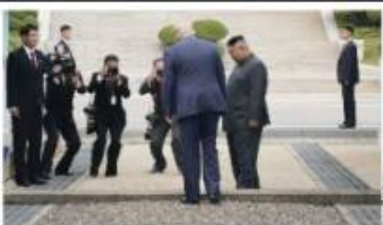
TRUMP Y KIM, ayer, en la zona desmilitarizada que une a las dos Coreas.