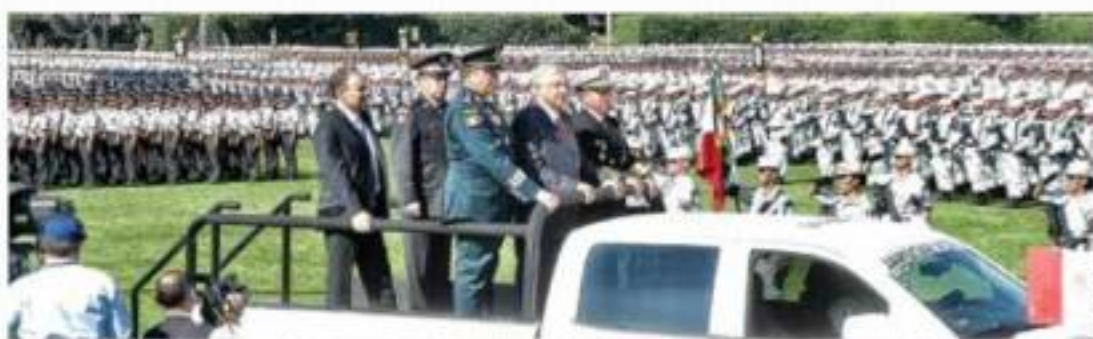
GUARDIA NACIONAL. El mandatario encabezó el despliegue de 70 mil elementos en 150 regiones del país.

MARCHAS SE MANIFIESTAN CONTRA AMLO EN VARIAS CIUDADES. PÁG. 50