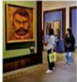
La Galería Nacional estuvo abierta desde 2010.

Los cambios ocurren a la par del anuncio de que el Presidente Andrés Manuel López Obrador no sólo des- pachará en Palacio Nacional,