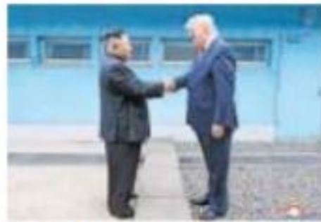
Kim (izq.) saluda a Trump, desde el lado norcoreano de la frontera.

EL RÉGIMEN CHAVISTA asesinó a golpes al capitán de corbeta Rafael Acosta detenido desde hace 8 días; fue trasladado en silla de ruedas al tribunal, visiblemente lesionado; murió horas después en el hospital. Pág. 21