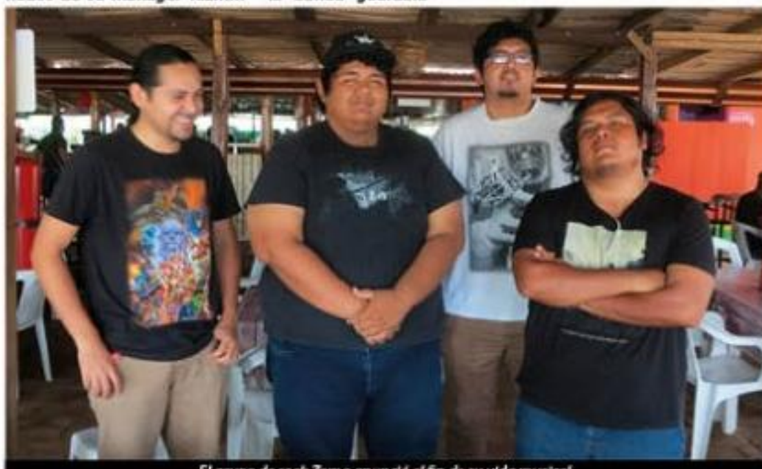
El grupo de rock Zoma anunció el fin de su vida musical.

Aunque los docentes ya estarán de vacaciones y ellos podrían aprovechar muy bien las herramientas de la oralidad para alternar en la enseñanza, el viernes y sábado de esta semana se llevará a cabo en este Puerto el Primer Encuentro Internacional. » 4