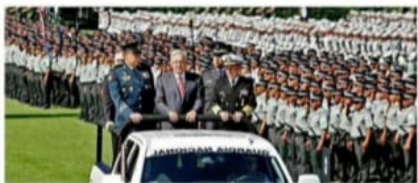
El Presidente pasó revista desde una de las camionetas de la Guardia Nacional, las cuales fueron pintadas de blanco y azul marino, con el escudo de un águila.