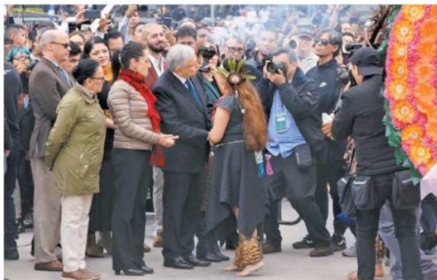
El titular del Ejecutivo viajó a Tabasco luego de inaugurar la ofrenda monumental en el Zócalo. JUAN CARLOS BAUTISTA