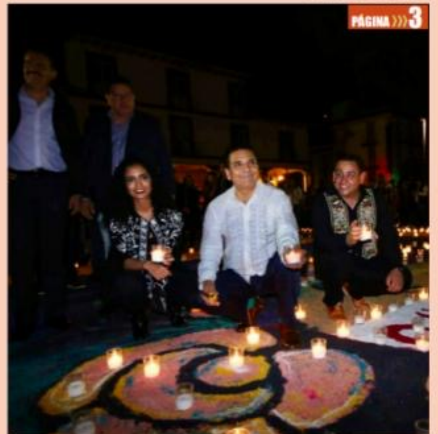
URUAPAN, MICH.- Más tarde llegó el gobernador del estado, Silvano Aureoles Conejo y tuvieron que repetir el encendido y posar para las fotografías.