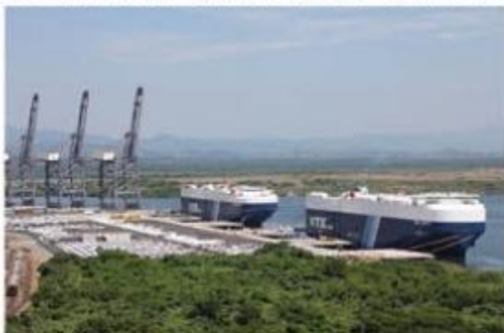
La APILAC planea la construcción de una segunda terminal especializada para el manejo de automóviles.

Se sabe que tres empresas concursaron, siendo Constructora Trainmar y Asociados, la ganadora del fallo, cuya propuesta económica >>> 8 para elaborar dicho