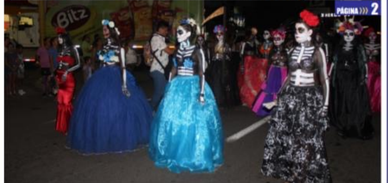
CD. LÁZARO CÁRDENAS, MICH.- Con una positiva respuesta inició el Festival de "Día de Muertos", que además de un desfile y programa artístico-cultural, enmarcó la inauguración de la fuente danzante.

Inicia arribo de visitantes a panteones del municipio