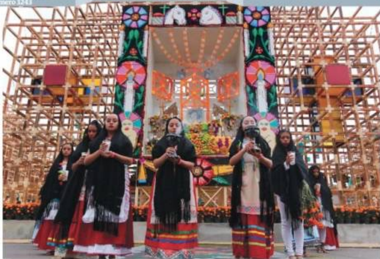
UNO de los altares instalados en la plancha del Zócalo, ayer.