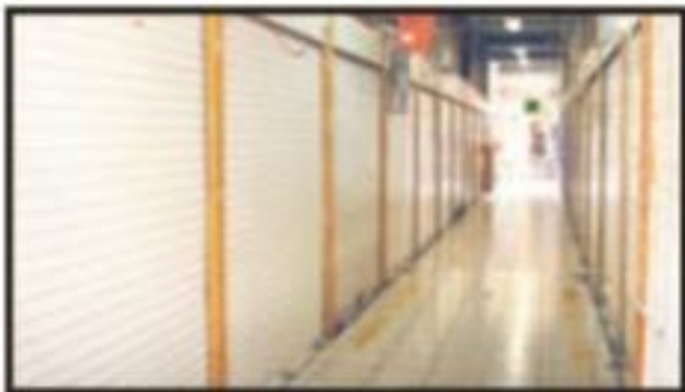
Locales abandonados en las plazas comerciales en el Centro Histórico serán rehabilitados.