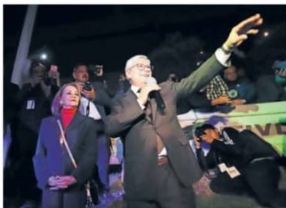
Entre aplausos y saludos de mano, Bocilla arribó al Congreso local para tomar posesión como gobernador de BC.