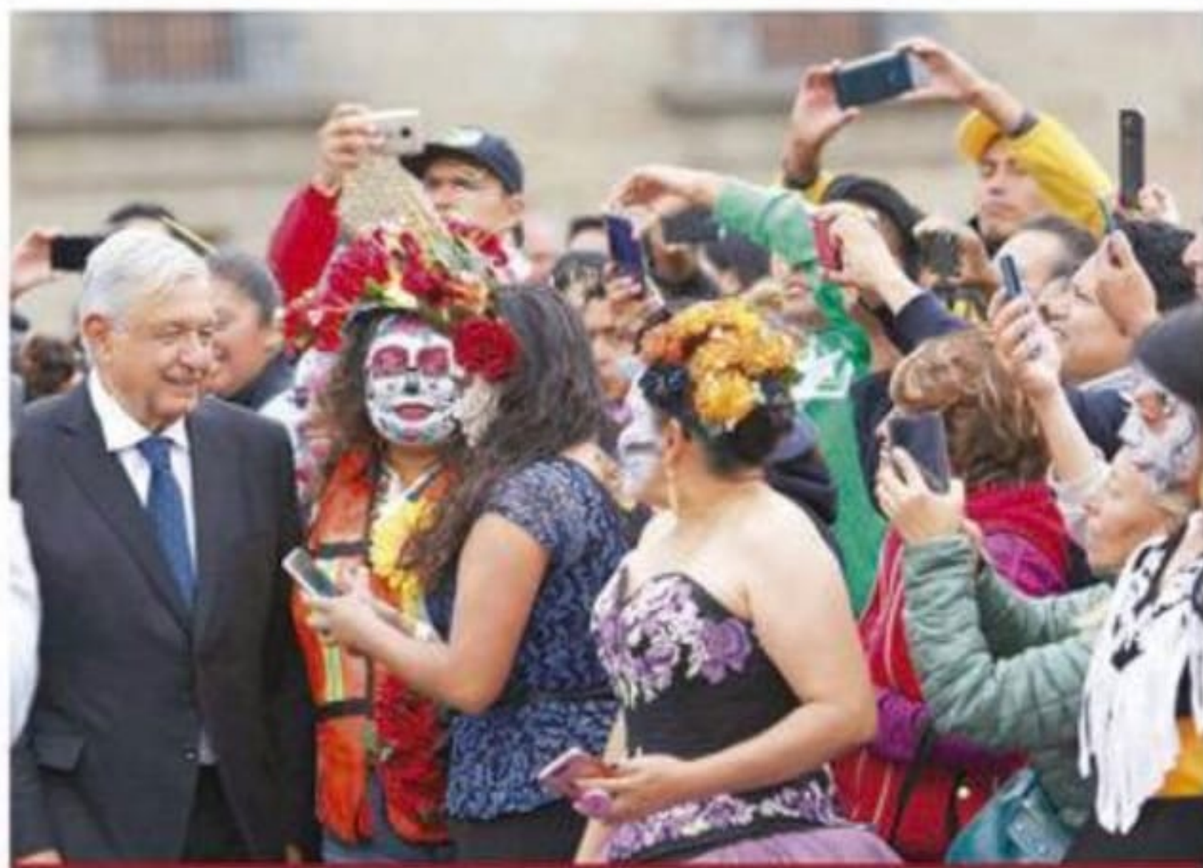
A la salida de Palacio, el presidente López Obrador fue rodeado por participantes de las festividades y conmemoraciones del Día de Muertos.