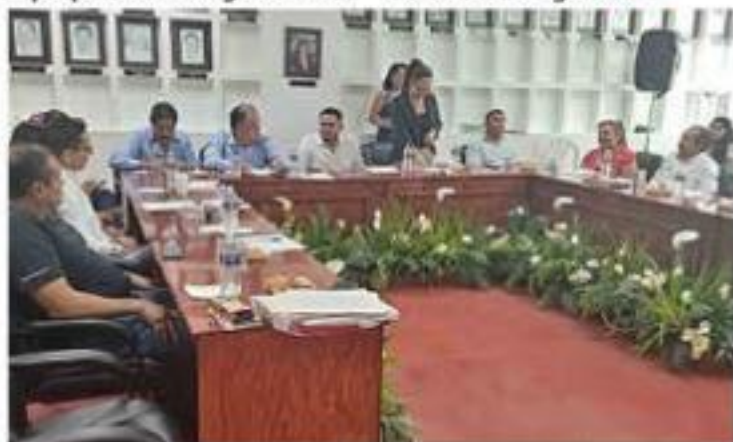
El pasado jueves se celebró en la sala de cabildo, el primer foro para la elaboración del nuevo Reglamento Municipal de Transparencia y Acceso a la Información.

una celebración mexicana que honra a nuestros difuntos. Esta tradición se arraiga desde la época prehispánica aunque hoy en día incorporan elementos tam->>> 5