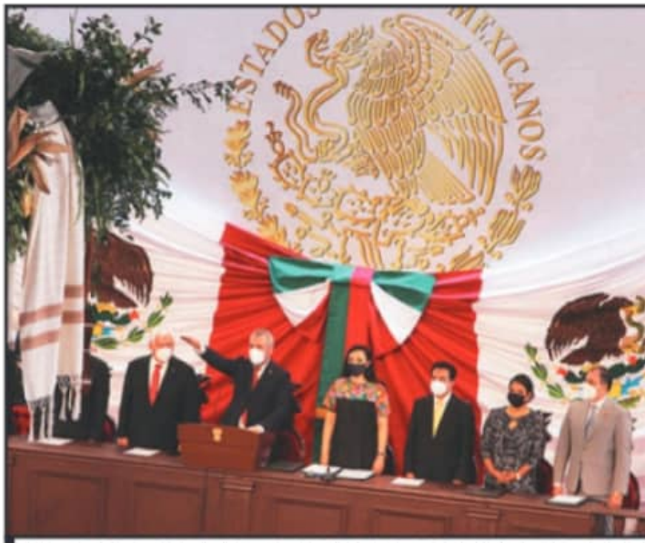
ALFREDO RAMÍREZ BEDOLLA RINDIÓ PROTESTA COMO GOBERNADOR DE MICHOACÁN ANTE DIPUTADOS LOCALES, EN EL PALACIO CLAVIERO HABILITADO COMO RECINTO OFICIAL ALTERNO DEL CONGRESO.