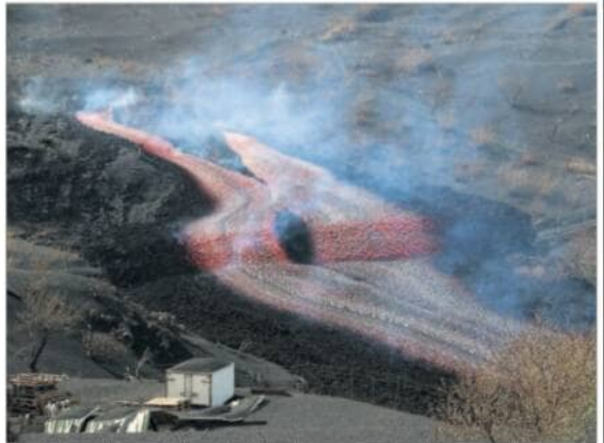
Boca doble surgida ayer en el volcán de La Palma, de la que emanan dos coladas muy líquidas.

El PSOE ofrece fijar incentivos fiscales a quienes bajen los precios de los alquileres tan grandes que empujen a todos a reducirlos, pero Unidas Podemos cree que, en vez de financiar a los propietarios reduciendo los ingresos del Estado, lo que hay que hacer es fijar máximos e intervenir directamente en el mercado para lograr una bajada. El PSOE insiste en que Unidas Podemos debe rebajar sus exigencias en esta materia porque, a cambio, está logrando importantes éxitos en los futuros Presupuestos, como fijar el mínimo del 15% de tipo efectivo del impuesto de sociedades. PÁGINA 14