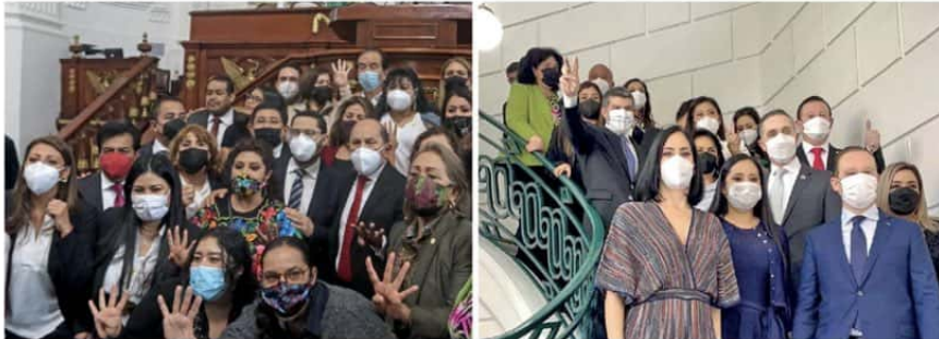
Ayer rindieron protesta los 16 nuevos alcaldes en la Ciudad de México. Aunque se pronunciaron por la unidad y dejar atrás las diferencias políticas, hubo morenistas (izquierda) que lanzaron el reto de la austeridad a la oposición, mientras que algunos gobernantes de la alianza PAN-PRI-PRD (derecha) dijeron que se les pone el pie. La jefa de Gobierno, Claudia Sheinbaum, les ofreció una relación institucional. | A14 |