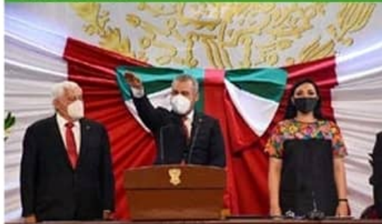
Alfredo Ramírez Bedolla, rindió protesta ayer como Gobernador Constitucional de Michoacán para el sexenio 2021-2027.

* Rescataremos Michoacán con honestidad y trabajo, afirma y llama a la reconciliación.