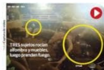
TRES sujetos roban alfombra y muebles, luego prenden fuego.

Baby'O : hay video de fuego provocado; no se puede atribuir al crimen: AMLO pág. 12