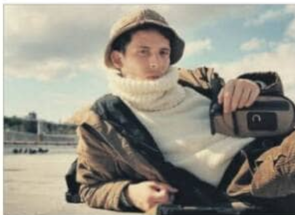
El actor Josh O'Connor, en Nueva York.