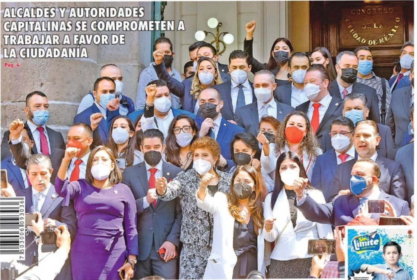
Celebran alcaldes de oposición al salir del Congreso local, son la mitad de la ciudad. DAVID DEOLARTE