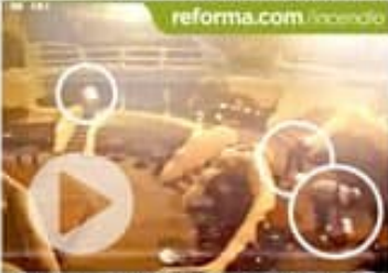
En el video se observa a tres personas riendo gasolina en el interior de la discoteca Baby'O de Acapulco.

En conferencia matutina desde Cuernavaca, el Presidente señaló que los medios quieren tratar el incendio como un asunto de inseguridad. "Es un incendio que no se