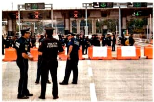
Policías federales tomaron la cuenta de Toluca y evitaron el paso vehicular; posteriormente fue liberada.

● Presidente ordena investigar a la corporación ● Negociaciones fracasan; mantienen protestas