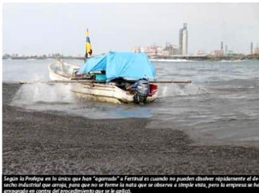
Según la Profepa en lo único que han "agarrado" a Fertinal es cuando no pueden disolver rápidamente el desecho industrial que arroja, para que no se forme la nata que se observa a simple vista, pero la empresa se ha emparado en contra del procedimiento que se le aplicó.