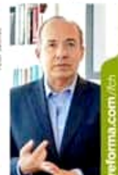
Calderón duró en las redes un video de 10 minutos.