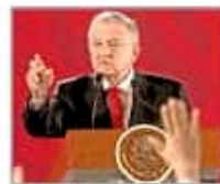
"NO HAY DESPIDOS" Protesta no tiene causa justa: AMLO.

Se respetarán los derechos de los uniformados, afirmó el secretario de Seguridad y Protección Ciudadana. Hoy, por segundo día consecutivo, hubo manifestaciones; se incorporaron familiares. Durazo acusó a Felipe Calderón de activismo; el ex Presidente exigió pruebas. Señalan a ex convicto, por secuestro, de encabezar las protestas. Los inconformes se deslindan de ese sujeto MÉXICO P. 4, 5 Y 6