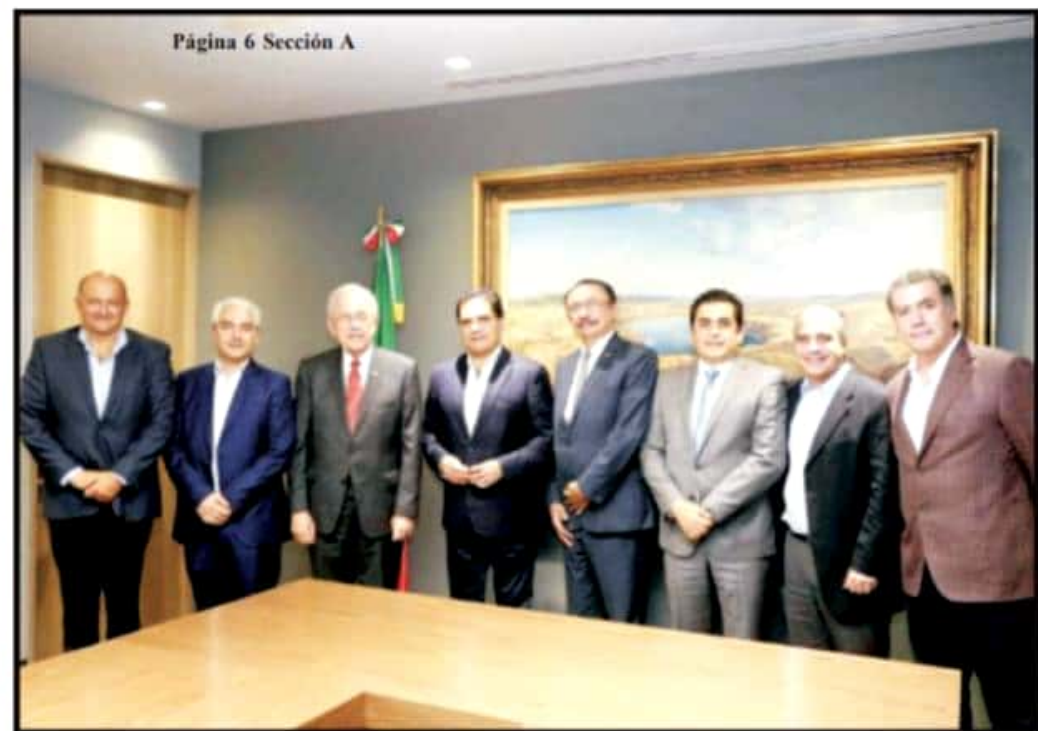
Página 6 Sección A

Dan seguimiento a proyectos prioritarios de infraestructura carretera para Michoacán