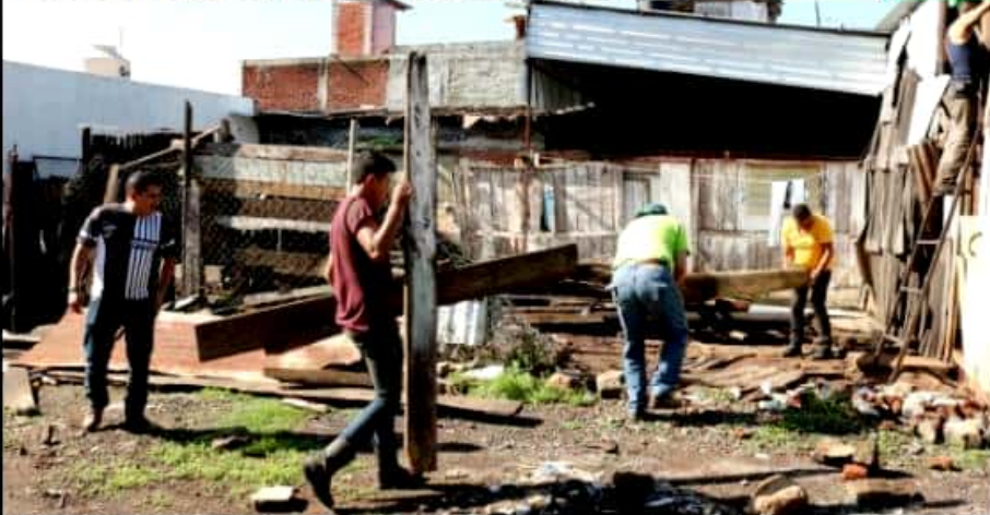
URUAPAN, MICH.- En un trabajo conjunto entre las secretarías municipales de desarrollo urbano y la de seguridad pública, entre otras, ayer se recuperaron dos espacios públicos que habían sido invadidos por particulares, en colonias de esta ciudad.

Actúa la Secretaría de Desarrollo Urbano, mediante el departamento de Inspectores