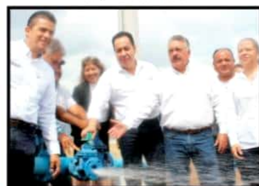
Página 3 Sección B

Inicia obra del colector pluvial de las calles Hidalgo Oriente y Rafael Landívar