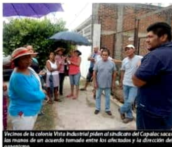
Vecinos de la colonia Vista Industrial piden al sindicato del Capalac sacar las manos de un acuerdo tomado entre los afectados y la dirección del organismo.

Sin embargo, al darse cuenta que interviene el Sindicato de Capalac que dirige Miguel Gutiérrez Tapia, exigieron que el organismo saque las manos del conflicto para evitar crezca y confronte a los vecinos de Vista Industrial y el fraccionamiento Brisas del Pacífico.