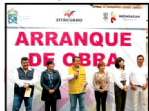
Página 3 Sección A

Inicia obra del colector pluvial de las calles Hidalgo Oriente y Rafael Landívar