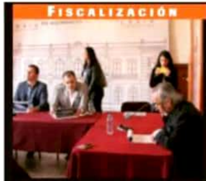
ASPIRANTES A DIRIGIR LA AUDITORIA SUPERIOR DE MICHOACÁN COMPARECIERON ANTE LEGISLADORES DEL CONGRESO LOCAL.