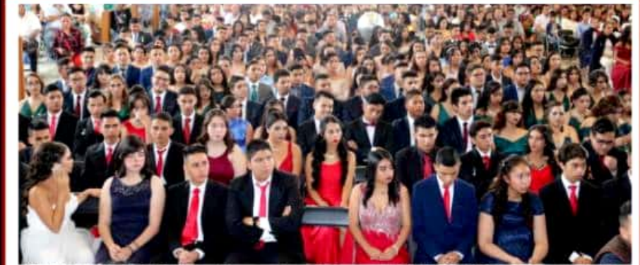
URUAPAN, MICH.- De 347 integrantes se conforma la generación 38 del Cetus 27, que ayer egresó de las diferentes especialidades que ofrece esa institución bivalente. (Inf. página 4).