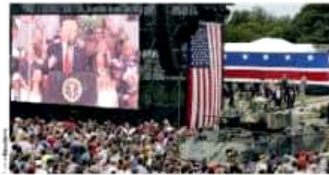
EL MAGNATE, ayer, con su exhibición militar en Washington

El presidente exalta a las Fuerzas Armadas como lo más grande de EU, llama a la unidad en momentos de frágiles equilibrios que amenazan la paz mundial pág. 31