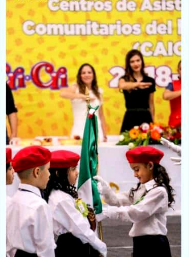
URUAPAN, MICH.- Este jueves fue oficialmente clausurado el ciclo 2018-2019 de los Centros de Atención Infantil Comunitarios del DIF Municipal, de los que egresaron 429 niños y niñas.