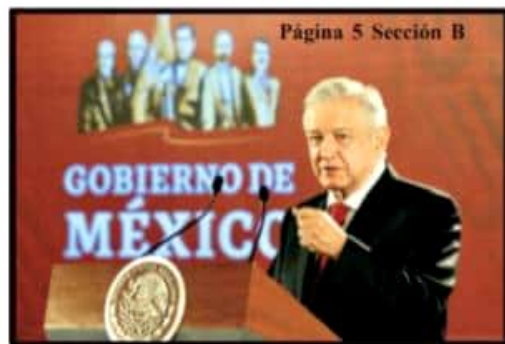
Página 5 Sección B

Protestas sin fundamento muestran que Policía Federal estaba echada a perder AMLO