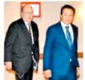
Abogado y defendido. O.HOTOS

No hay avances en la PF Los retos del país requieren cambiar mentalidad: Semar V. BAZQUEZ CASTILLO PÁG. 710