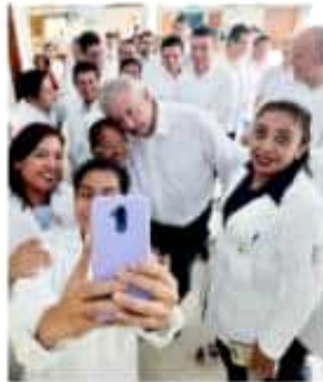
EL MANDATARIO, con personal de salud, ayer, en Mapastepec, Chiapas

Garantiza respeto a derechos y alza de salario, va por censo para saber si hay déficit de doctores e impulsar que se formen más