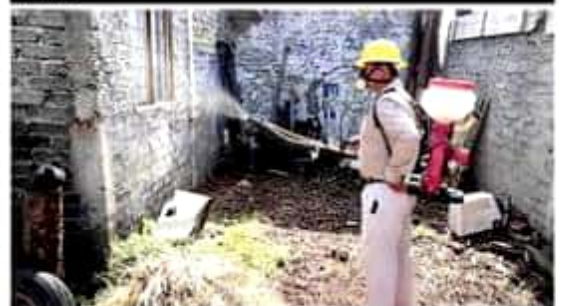
De acuerdo a datos del sector salud, Lázaro Cárdenas sigue siendo un municipio con alta incidencia en dengue.