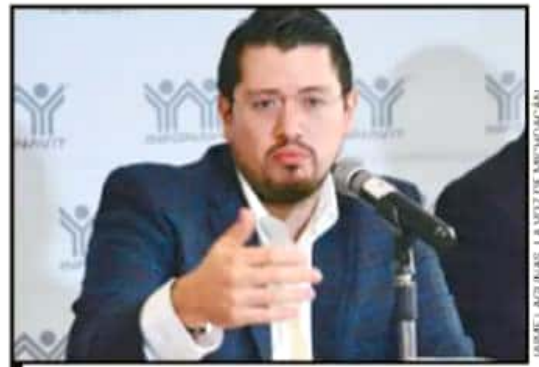
EL DIRECTOR NACIONAL DEL INFONAVIT, CARLOS MARTÍNEZ, ESTUVO EN MORELIA PARA ANUNCIAR UN AUMENTO DE MONTOS DE CRÉDITO.