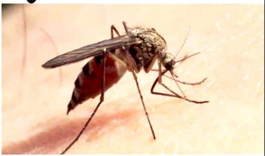
CD. LÁZARO CÁRDENAS, MICH.- Ziracuaretiro, la segunda región con dengue en Michoacán después de Lázaro Cárdenas, sigue estacionada en 7 casos, mientras en dos semanas Lázaro Cárdenas pasó de 115 a 127 contagios.

Se trata del mosquito que transmite el dengue, zika y chikungunya: SS Estadísticas ubican a LC como el segundo municipio con más casos en el estado Eduardo CHÁVEZ PÁG. 3