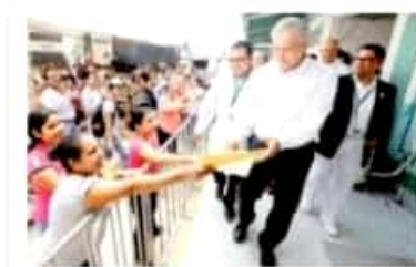
El personal del Hospital Rural de Miquetzapán le exhibió al Peto Dorado que requieren el más personal médico y farmacéuticos.

"Nunca más se les dará la espalda. Los abrazaremos y protegeremos para que no se sientan solos, no tengan vacíos y no toquen el camino de las conductas antihigiénicas", afirmó el presidente Andrés Manuel López Obrador al presentar la estrategia