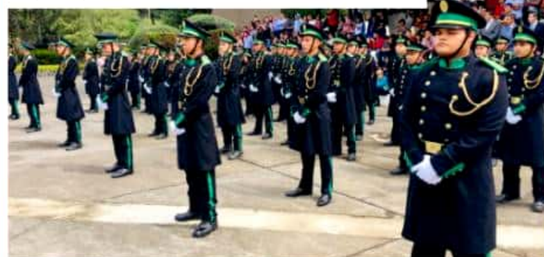
URUAPAN, MICH.- Egresó ayer la 67 Generación de la Escuela de Guardas Forestales de Uruapan, con emotivo y solemne acto.