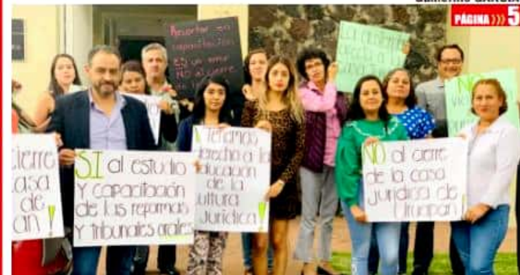
URUAPAN, MICH.- Estudiantes de las leyes se manifestaron ayer para protestar por el inminente cierre de la Casa de la Cultura Jurídica en Uruapan, derivado de los recortes presupuestales del gobierno federal.

Garantizan continuidad a los apoyos de Conafor a Cecfor