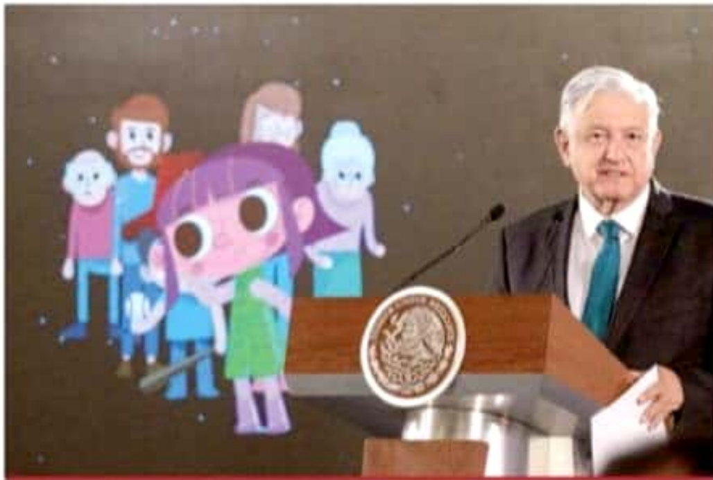
La campaña Unidos por la Paz, para combatir adicciones en niños y adolescentes, fue presentada por el presidente Andrés Manuel López Obrador; la estrategia se incluye en los libros de texto

Contra las adicciones, desde la infancia