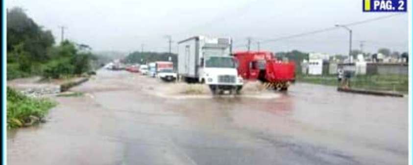
CD. LÁZARO CÁRDENAS, MICH.- Las bajadas de agua de barrancas, que provoca inundaciones en diferentes puntos de la carretera nacional en la tenencia de Buenos Aires son una prioridad que se busca atender durante la temporada de lluvias, ya que provoca la incomunicación del flujo vehicular.

Urge al desazolve en escurrimientos, para evitar se inunde tramo carretero PÁG. 2