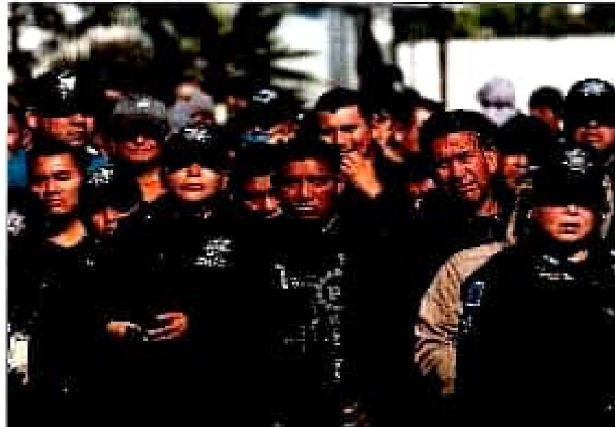
Agencia de la Prensa. Imágenes de la protesta policial en México. Los policías se enfrentan a la Guardia Nacional