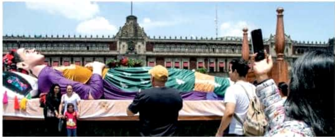
CIENTOS de capitalinos visitaron ayer la muestra de Frida Kahlo.

Con una exposición monumental, cuya figura central mide 12 metros, y miles de flores, celebran el 112 natalicio de la pintora; en el homenaje, que estará expuesto en la plancha del Zócalo hasta mañana, participan artistas nacionales y extranjeros de 23 países pág. 18