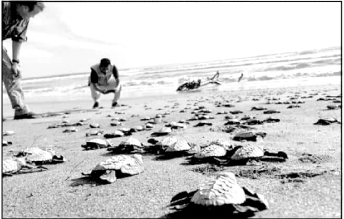
Las playas de maruata, Colola, Mexiquillo, Azul e Ixtapilla albergan campamentos tortugueros que, a la par con las actividades de conservación de estos ejemplares, permiten a los paseantes disfrutar del fenómeno migratorio de las tortugas marinas y la liberación de sus crías al océano

Luna García destacó que estas acciones suman varios años en la oferta turística de Michoacán y cuentan con gran aceptación, ya que posibilitan que los paseantes, principalmente los más jóvenes, se involucren en el cuidado de una de las especies emblema de la lucha contra el cambio climático, en un entorno lúdico y con un bajo impacto