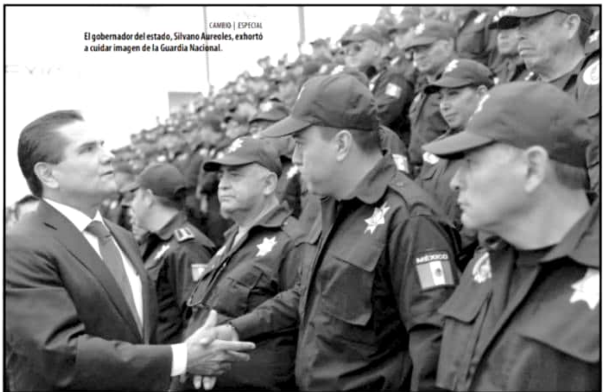
CAMBIO | ESPECIAL El gobernador del estado, Silvano Aureoles, exhortó a cuidar imagen de la Guardia Nacional.

Carlos Ramírez | 13 Salvador García Espinosa | 14