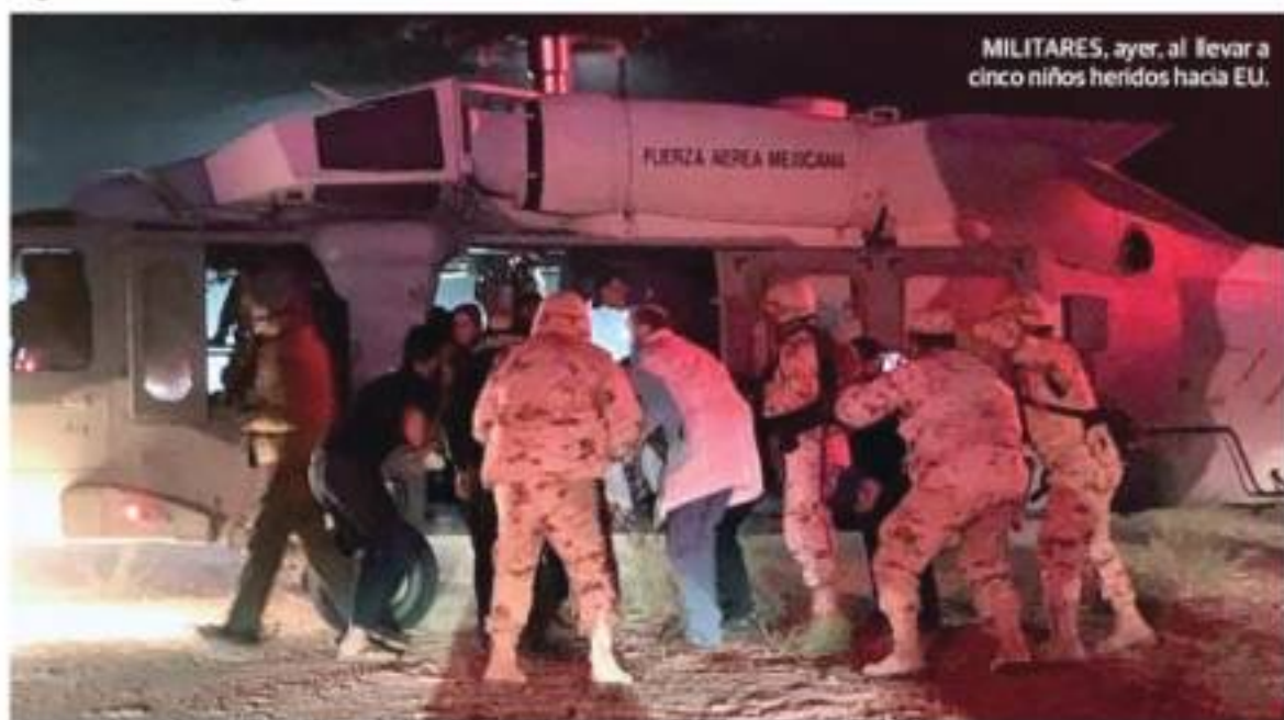
MILITARES, ayer, al llevar a cinco niños heridos hacia EU.