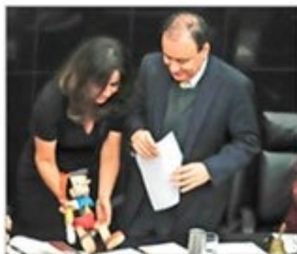
NO FUE UN DÍA DE CAMPO. Alfonso Durazo insistió, en el Senado, en que la inseguridad que se vive en este momento es herencia de gobiernos anteriores.

"Ya tenemos resultados", aseguró el Presidente después de la masacre en Sonora. El caso LeBaron se suma a Minatitlán, donde hubo 14 civiles asesinados; Coatzacoalcos, con 31 acribillados; Uruapan, 19 desmembrados y colgados; Tepochica, 15 muertos; Aguililla, 13 policías asesinados; y Culiacán, 13 muertos en operativo fallido. El presidente López Obrador habló con Donald Trump por teléfono para agradecer el apoyo y le dijo que la guerra no es el camino MÉXICO P.4 Y 5