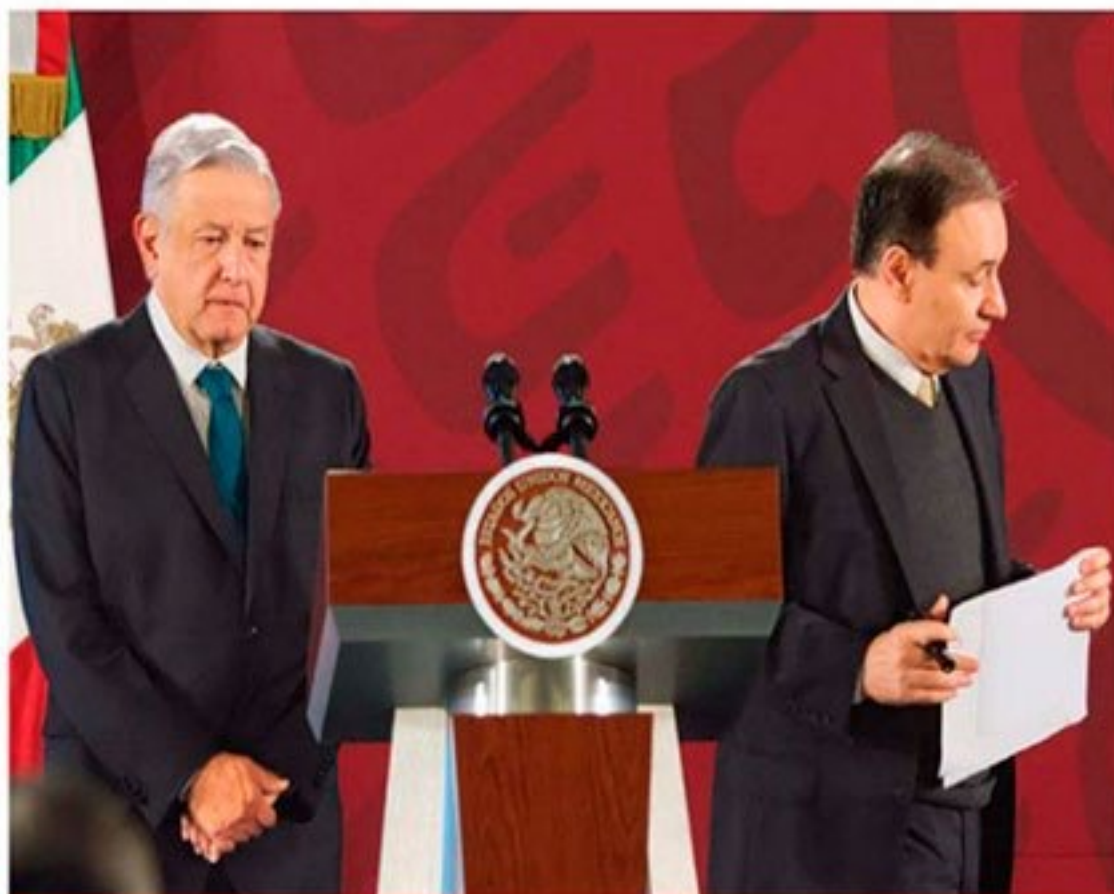
El presidente López Obrador y el secretario de Seguridad Alfonso Durazo, durante la conferencia mañanera en Palacio Nacional.

El presidente de EU tuiteó, tras los asesinatos a la familia LeBarón, que su país "tiene capacidad y voluntad para participar" y que "se necesita un ejército para derrotar a un ejército"