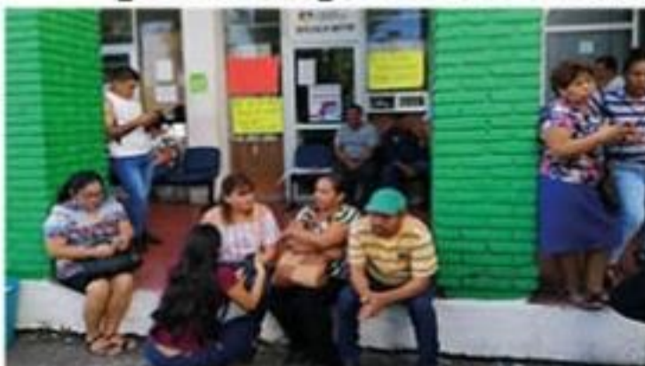
Trabajadores que en fecha reciente fueron despedidos por la administración municipal, apoyados por la dirigencia sindical de los empleados municipales, bloquear ayer las instalaciones de Oficialía Mayor, lo cual podría repetirse hoy.