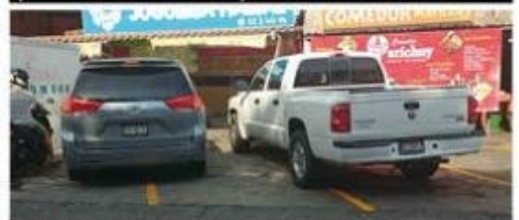
Luego del balizamiento que se hizo en calles aledañas al mercado Cuauhtémoc de esta ciudad, que incluyó los estacionamientos que hay a su alrededor, algunos conductores no tienen nada de cultura vial, y estacionan sus unidades invadiendo dos cajones en lugar de uno, como se muestra en esta gráfica.