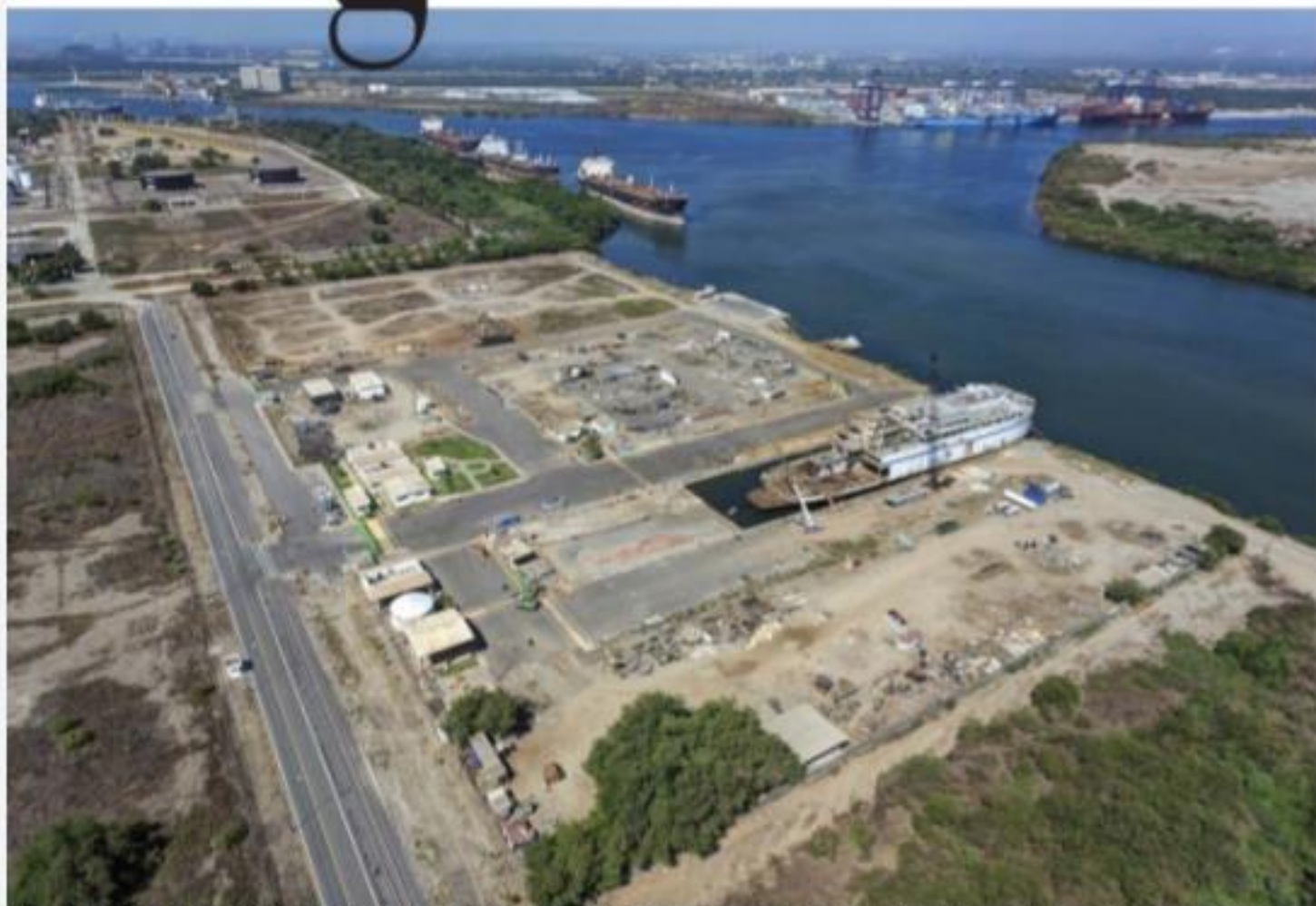
CD. LAZARO CÁRDENAS, MICH.- La Semarnat aprobó una segunda solicitud para el desguazado de barcos dentro del recinto portuario, por un plazo de 10.5 años.

▶ Semarnat le autorizó operaciones por 10.5 años más