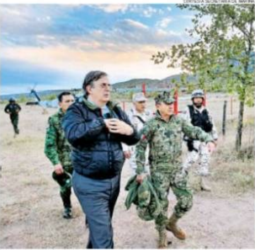
El canciller Marcelo Ebrard recorrió la zona donde se cometió el multihomicidio.

Reitera que no renunciará, pero se muestra abierto a reformar la Constitución y promete investigar abusos, mientras el país sufre otro revés y no será sede de la final de la Copa Libertadores. Pág. 38