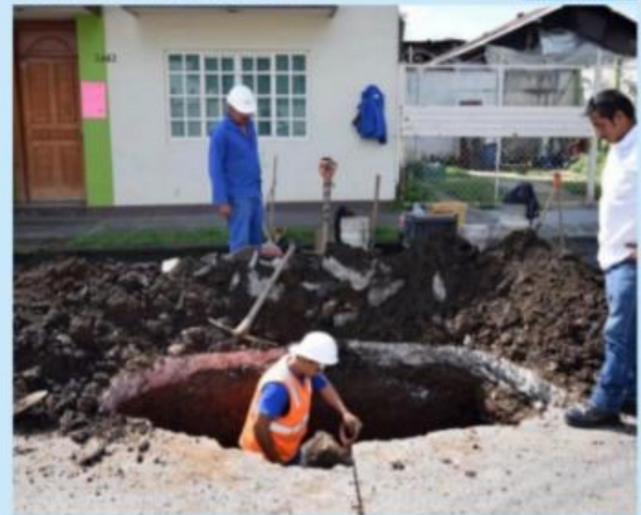
URUAPAN, MICH.- Más de 700 reportes fueron atendidos oportunamente por personal de Capasu.