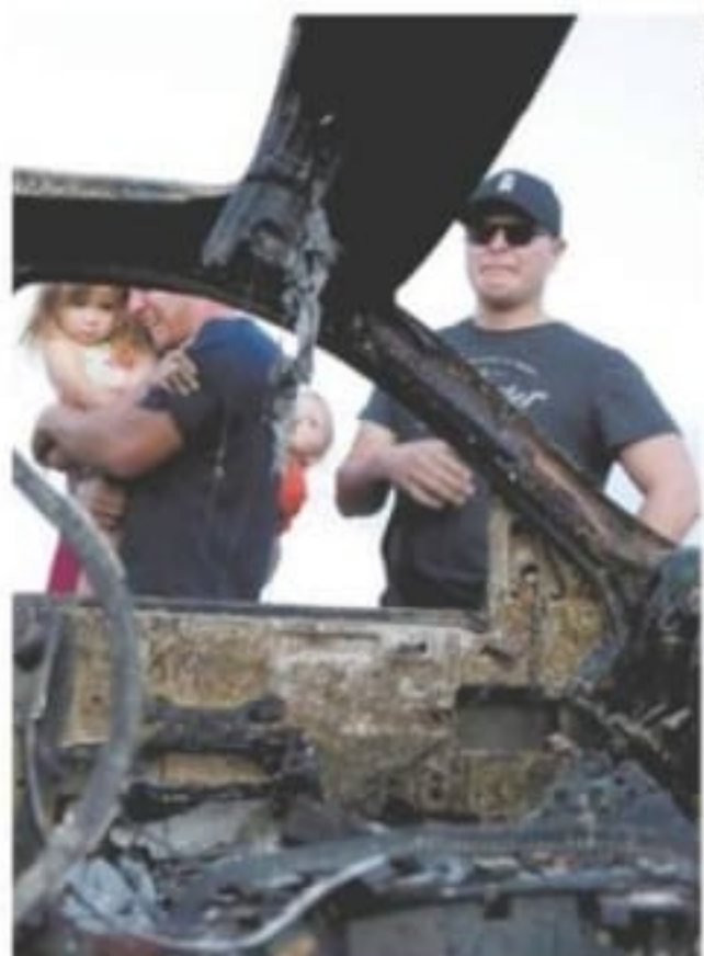
Familiares de las víctimas visitaron ayer el lugar del ataque, donde murieron nueve personas y una camioneta fue calcinada.