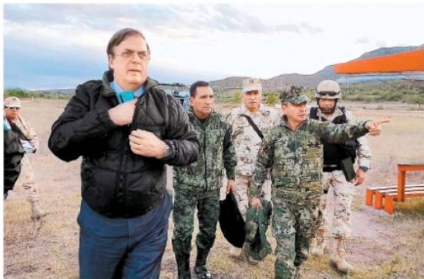
El titular de la SRE, Marcelo Ebrard, llega a la comunidad de San Miguel Bavisco, Sonora.