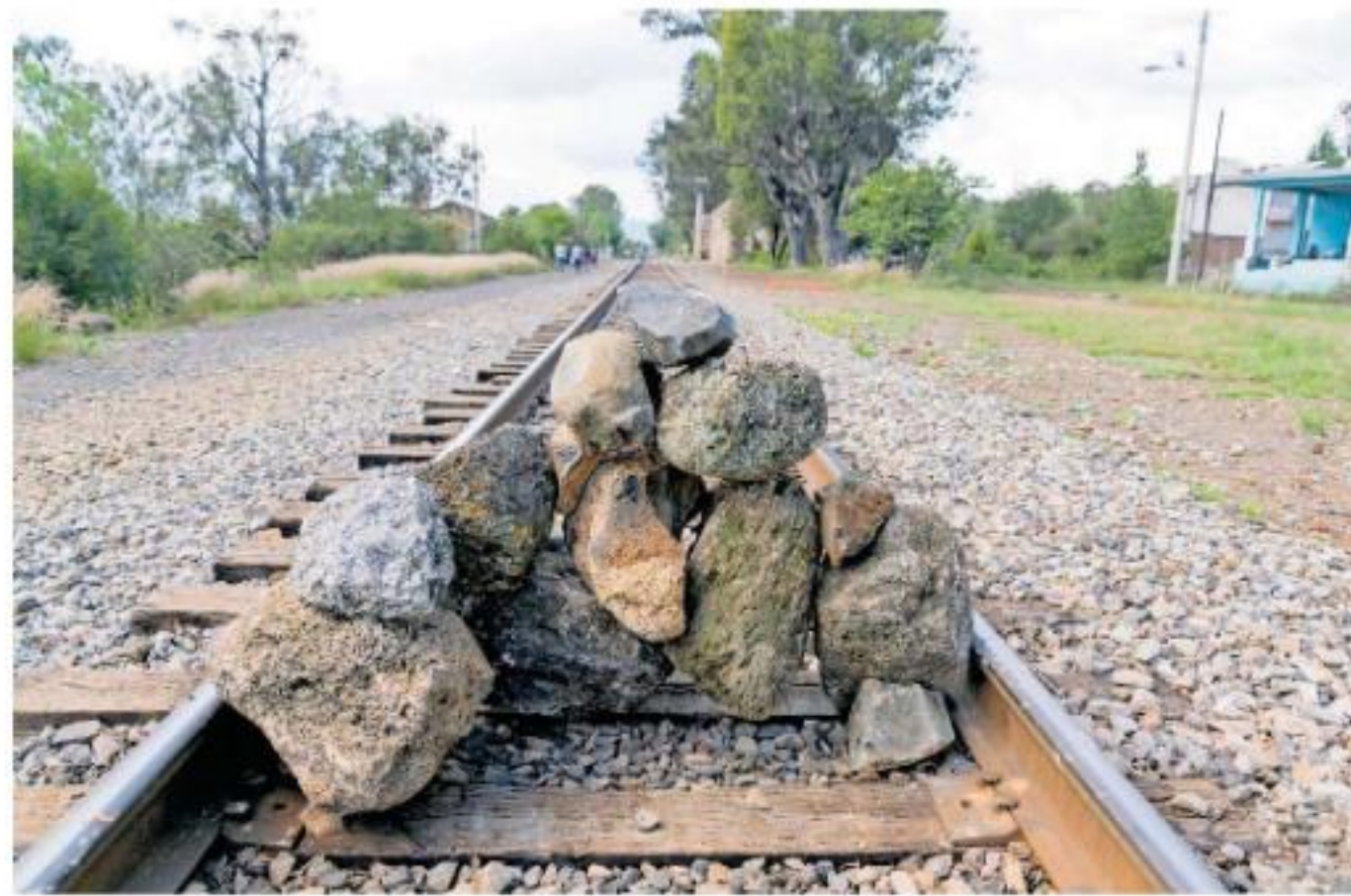
Estudiantes inconformes volvieron a bloquear las vías del tren que pasan por Tiripetío; lo hacen a modo de protesta para obtener plazas automáticas para los recién egresados

Los delitos por los que se presentaron las denuncias ante la FGE en contra de los normalistas son de carácter patrimonial, toda vez que en algunos casos hay el robo total de la unidad o cuando la mercancía que transportan es sustraída, y para lo cual se presume ya existen resultados de algunos procedimientos, sin que dicha