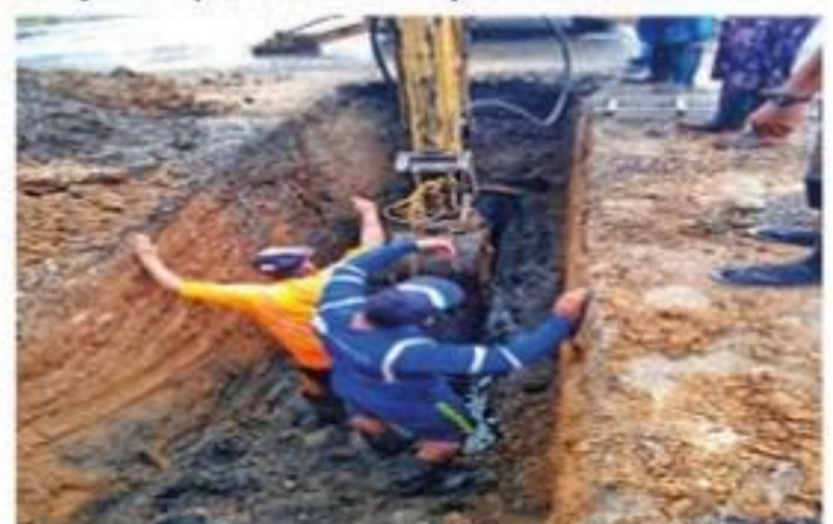
Personal del Capalac durante la reparación de uno de los tres socavones que se hicieron sobre la avenida Ejército Mexicano de esta ciudad.

El Comité de Agua Potable y Alcantarillado de Lázaro Cárdenas (Capalac) lleva a cabo los trabajos de reparación de tres socavones que se formaron a consecuencia de las últimas lluvias en la avenida Ejército Mexicano.