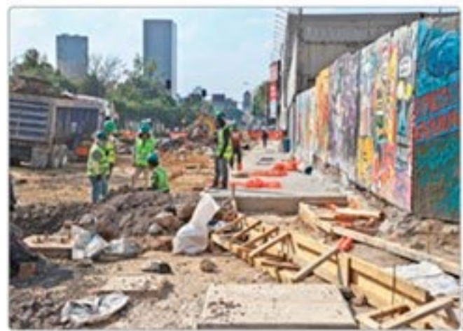
CIERRAN HIDALGO POR OBRAS. El lado norte de la avenida fue cerrado a la altura de la Alameda Central, mientras que el lado sur operará sólo en sentido oriente-poniente.