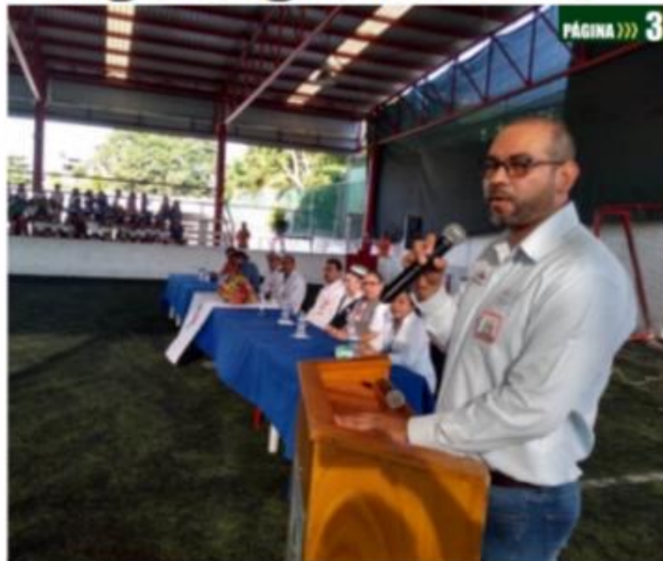
CD. LÁZARO CÁRDENAS, MICH.- Fue inaugurada la Primera Jornada de Salud Pública en el Colegio Anglo Mexicano de Ciudad Lázaro Cárdenas.

Realizan balizamiento en las inmediaciones del mercado Cuauhtémoc