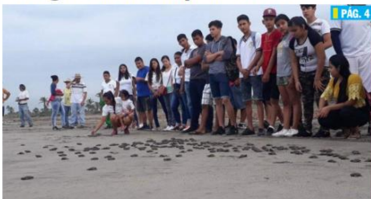
CD. LÁZARO CÁRDENAS, MICH.- En lo que va de esta temporada, el Campamento Tortuguero El Habillal ha reportado la liberación de más de 2 mil crías de quelonio.