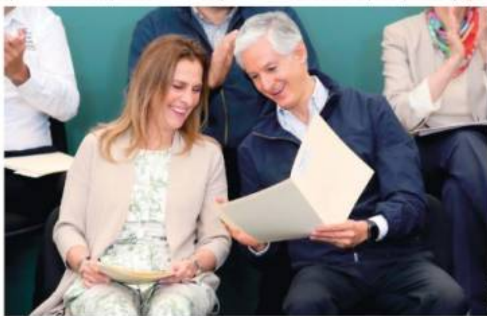
BEATRIZ Gutiérrez Müller y Alfredo del Mazo, ayer en Ecatepec al presentar la iniciativa.

El gobernador Alfredo del Mazo empuja estrategia para fortalecer el plan Crece leyendo: presentarán libros, promoverán círculos y maratones de lectura en espacios públicos. pág. 7