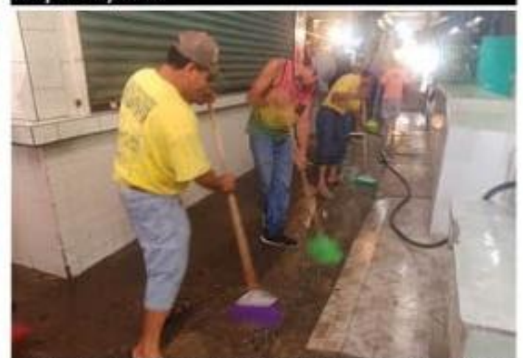
La mesa directiva del mercado Cuauhtémoc, en coordinación con la Regiduría de Salud del cabildo porteño y de la Jurisdicción Sanitaria número 08, llevaron a cabo ayer la limpieza de todos los pasillos del inmueble.