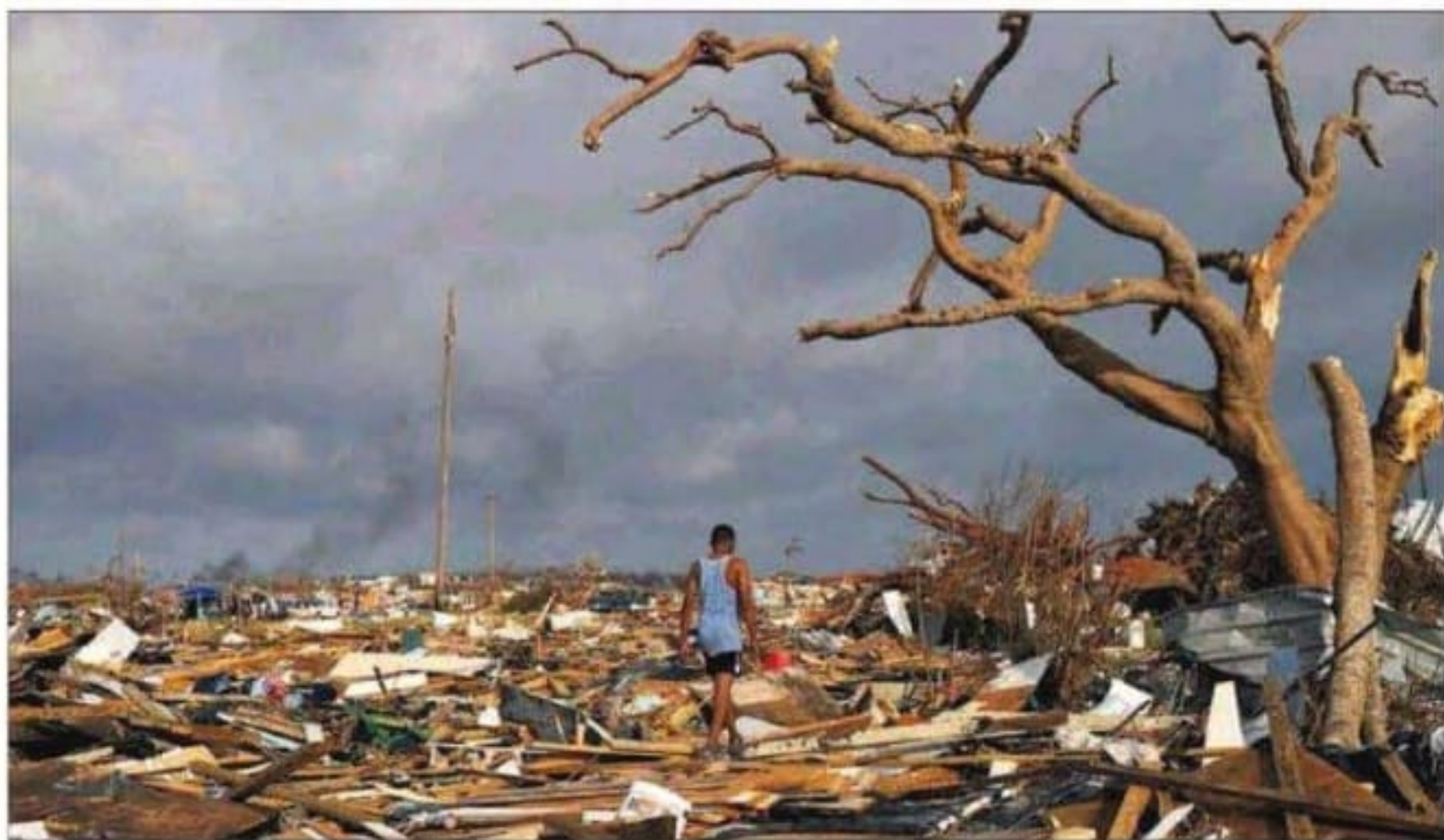
LA DEVASTACIÓN DEL DORIAN EN BAHAMAS. El Gobierno de las islas teme una "estremecedora" cifra de muertos tras el paso del ciclón por el territorio caribeño. En la foto, un hombre camina entre las ruinas de la ciudad de Marsh Harbour.