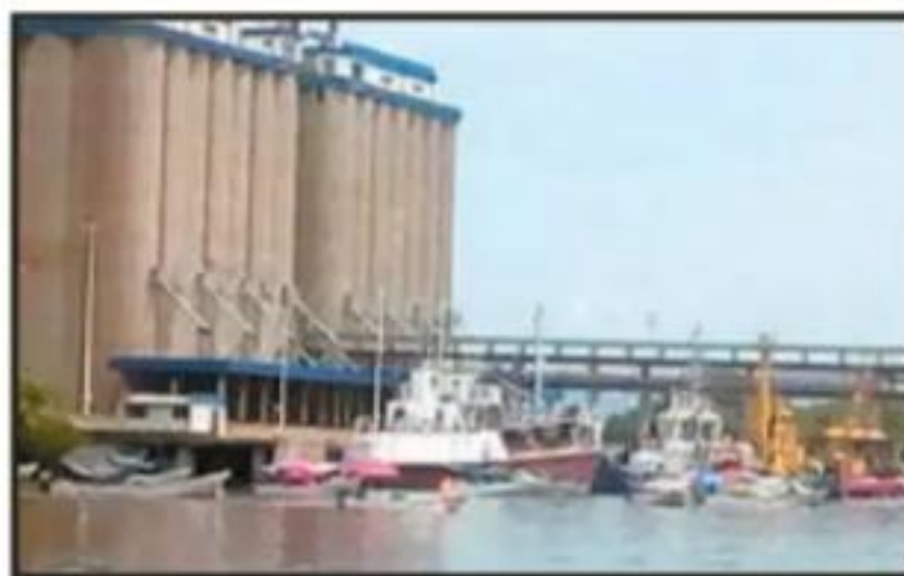
Pescadores hacen bloqueos a la empresa, en protesta.