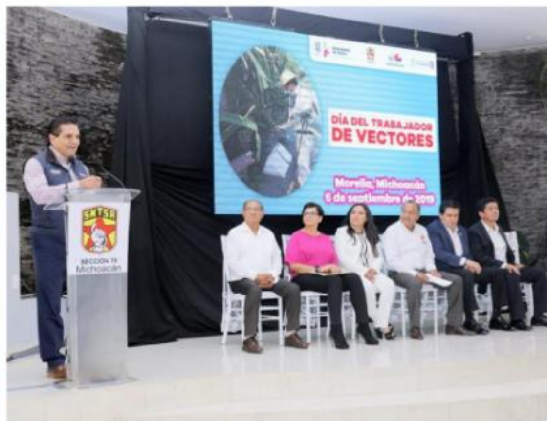
MORELIA, MICH.- Por su amplia trayectoria, entrega los primeros reconocimientos en la historia, a rociadores del Estado.

De este modo, fue como ayer en el Teatro José Rubén Romero de forma inicial se anunció el Programa Estatal de Prevención del Cáncer.