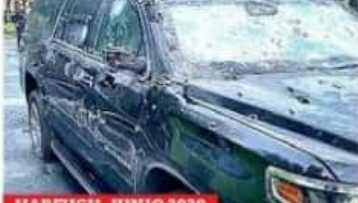
HARFUCH, JUNIO 2020