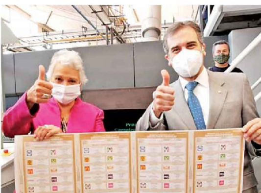
SONRIÉN SÓLO PARA LA FOTO Sánchez Cordero y Lorenzo Córdova encabezaron el inicio de la impresión de las boletas electorales que se usarán el 6 de junio.