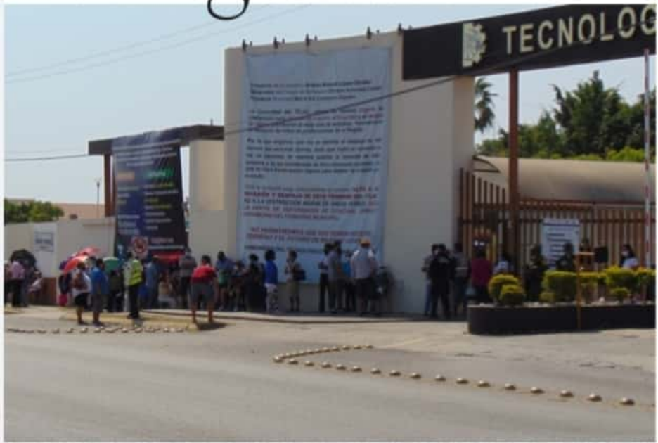
CD. LÁZARO CÁRDENAS, MICH.- Ayer arrancó la segunda etapa de la Jornada Nacional de Vacunación en adultos mayores de 60 años de edad, en el municipio de Lázaro Cárdenas.

► En el Itlac se vieron largas filas PÁGS. 2 Y 4