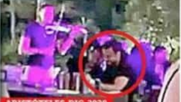
ARISTÓTELES, DIC. 2020

El Departamento del Tesoro de EU señaló ayer a los integrantes del Cártel Jalisco Nueva Generación implicados en el atentado contra el titular de la SSP en la CDMX, Omar García Harfuch, y en el asesinato del ex Gobernador de Jalisco, Aristóteles Sandoval.