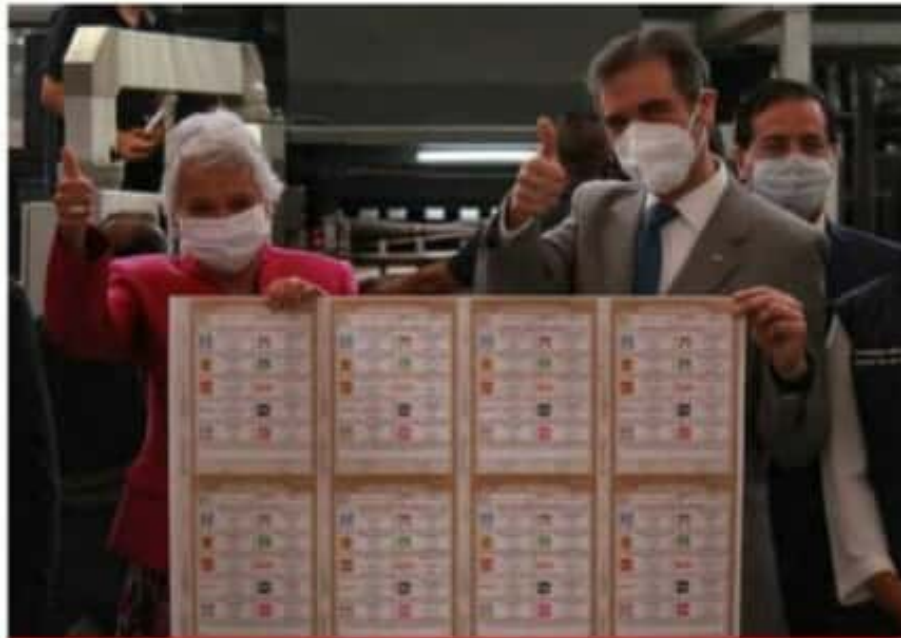
Olga Sánchez Cordero, titular de Gobernación, y Lorenzo Córdova, consejero presidente del INE, supervisaron ayer el arranque de la impresión de boletas en los Talleres Gráficos de la Nación.