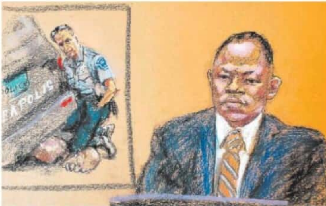
El policía Jody Miller de Los Ángeles comparece en el juicio por el asesinato de George Floyd en Minnesota.