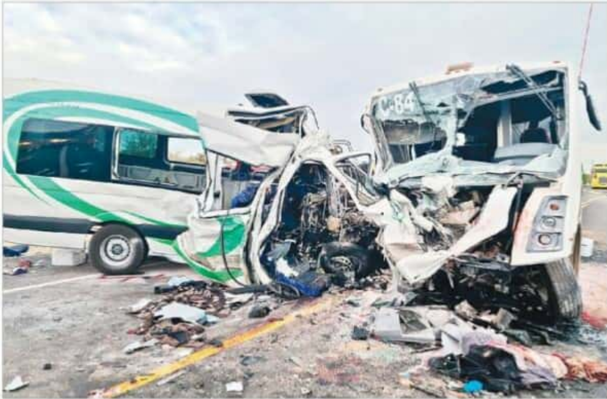
▲ La colisión entre un autobús de la compañía Movimex, que llevaba empleados de la mina Noche Buena, propiedad de Penmont, y una camioneta de la firma Transportes Ejecutivos Premier, ocurrió