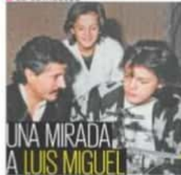
Su edición reciente, amor, carrera y su vida actual son parte del nuevo libro Oro de rey | A25 |