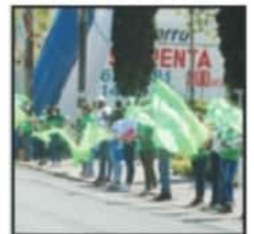
EN LAS CALLES SE VEN GRANDES GRUPOS ENTREGANDO PROPAGANDA.

El Ayuntamiento de Morelia, afirmó que ante el incumplimiento de las normas sanitarias dictadas en los actos de campaña por parte de prácticamente todas las fuerzas políticas, hará un levantamiento de evidencias ante los hechos que entregará posteriormente al Comité Estatal de Seguridad en Salud, quien está facultado para emitir las sanciones pertinentes.