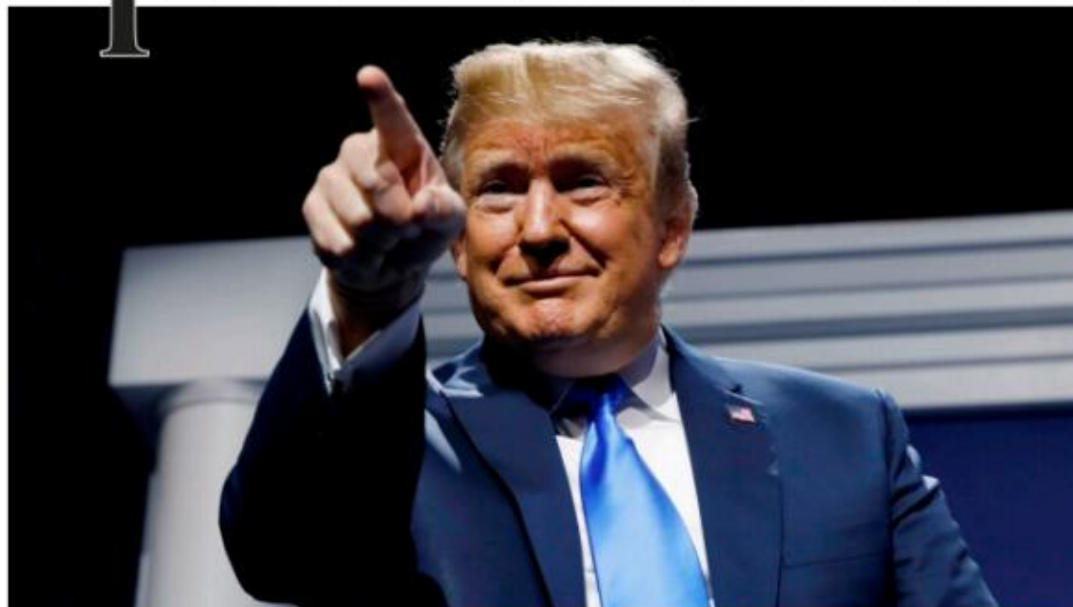
WASHINGTON, D.C.- El presidente Donald Trump, aseguró ayer que el Gobierno mexicano y su administración llegaron a un acuerdo en el tema arancelario, suspendiendo los gravámenes de forma indefinida.

De acuerdo a evaluación de Cimtra, Uruapan debe mejorar su transparencia administrativa