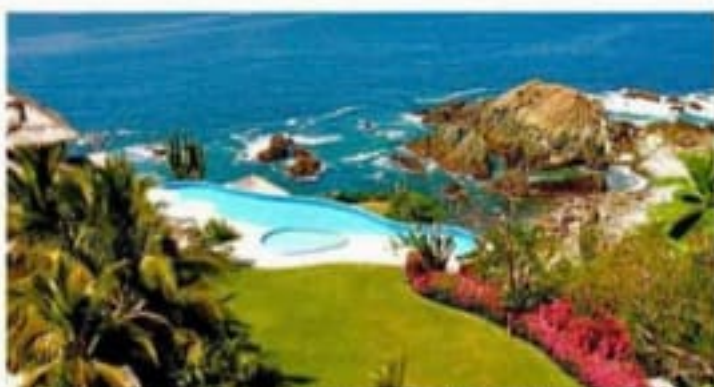
La mansión de los Lozoya está ubicada en un acantilado en el condominio "Quinta Mar" con vista al mar y playa privada.