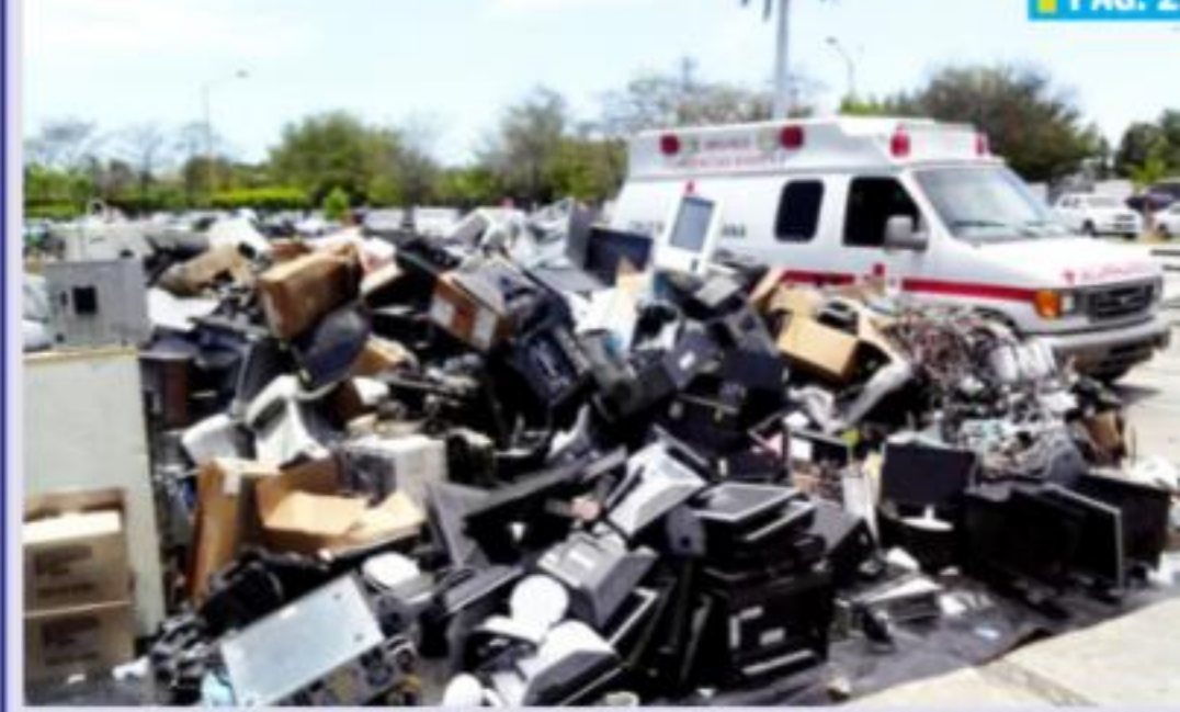
CD. LÁZARO CÁRDENAS, MICH.- Este sábado, en la explanada municipal, tendrá lugar una nueva edición del "Reciclatrón", el cual también marcará el cierre de las actividades que, en esta semana, se llevaron a cabo por el "Día Mundial del Medio Ambiente".