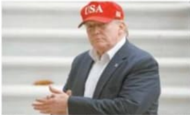
El presidente Donald Trump regresó ayer a Estados Unidos, luego de un viaje a Europa. Dijo que el acuerdo con México es reducir la inmigración ilegal.

El canciller mexicano, Marcelo Ebrard, detalló que entre los principales puntos del acuerdo están que los migrantes que cruzan hacia Estados Unidos para pedir asilo serán retornados sin detener a México, en donde podrán esperar sobre sus solicitudes, se les autorizará la entrada y se les ofrecerán oportunidades laborales y acceso a la salud. La Guardia Nacional tendrá prioridad en 11