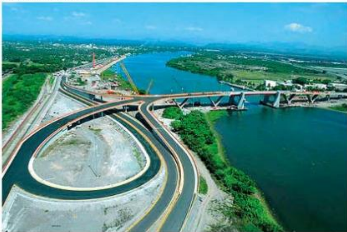
El puente Albatros, el pasado 6 de junio cumplió nueve años de haber sido inaugurado por el entonces presidente de México, Felipe Calderón Hinojosa.