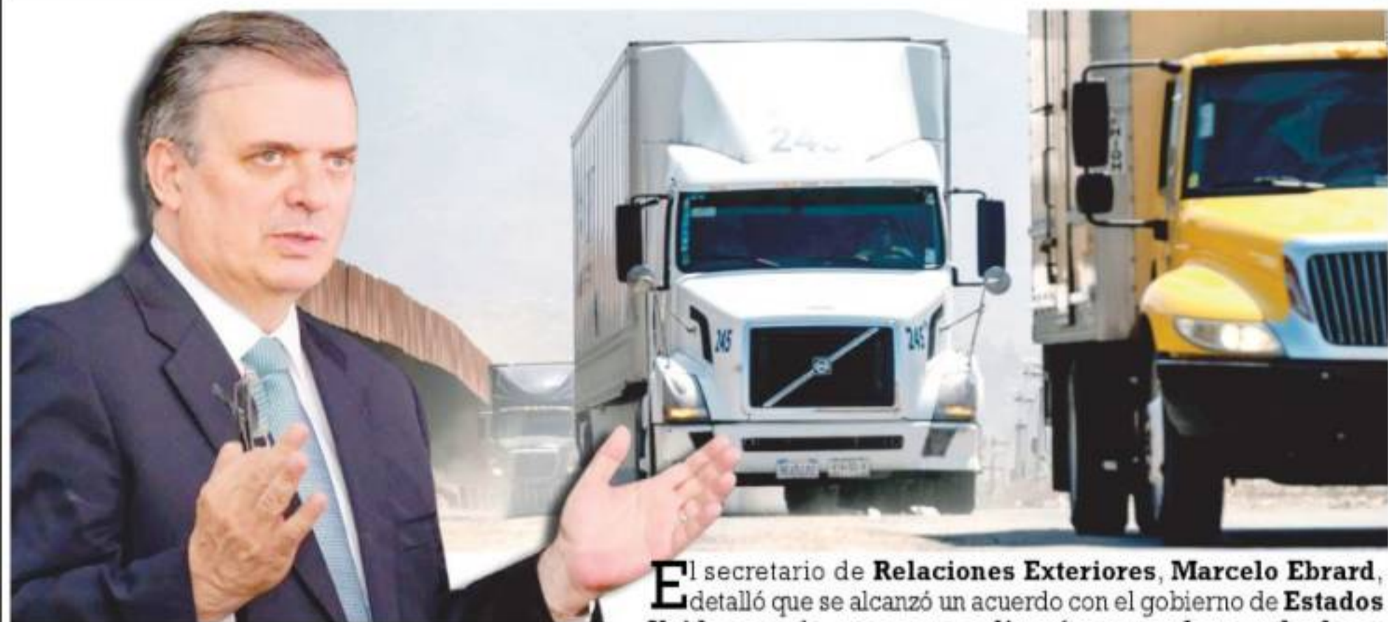
Marcelo Ebrard Casaubón

El secretario de Relaciones Exteriores, Marcelo Ebrard, detalló que se alcanzó un acuerdo con el gobierno de Estados Unidos, por lo que no se aplicarán aranceles graduales a partir del lunes a productos mexicanos.