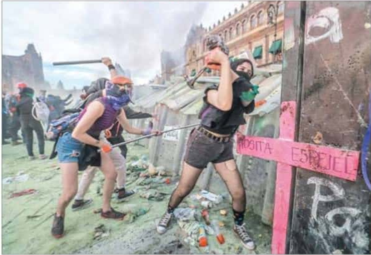
▲ Con martillos, tubos y otros objetos, varias mujeres golpean los escudos de policías desplegados donde fueron derribadas siete vallas. En un comunicado, Presidencia destaca la labor de los cuerpos de