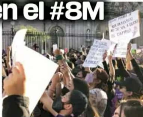
/ MARCO SANTORO

Mujeres. Con la instalación de una "antimonumenta" en Las Tarascas y una marcha, mujeres se manifestaron para exigir justicia y equidad. Pág. 03