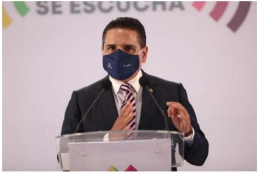
MORELIA, MICH.- El gobernador, Silvano Aureoles, señaló que un tercer rebrote de Covid-19 impactaría fuertemente la economía del estado.