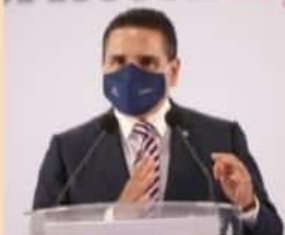
MORELIA, MICH.- El gobernador Silvano Aureoles, señaló que un tercer rebrote de Covid-19 impactaría fuertemente la economía del estado.