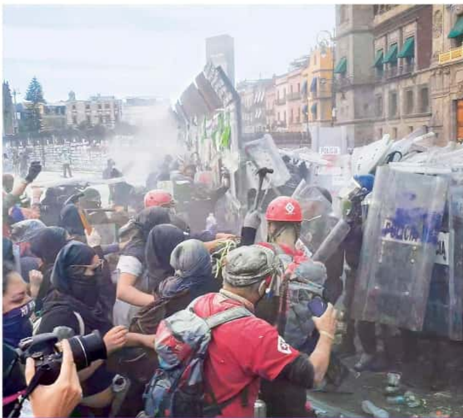
LUCHA POR EL PALACIO. Las protestas de ayer culminaron con una brecha en la valla de seguridad colocada por el Gobierno para proteger el Palacio Nacional. De inmediato, un contingente de antimotines formó otra muralla, pero de escudos. El saldo de la jornada fue de 62 policías y 19 civiles lesionados.

EN EL ESTADO DE MÉXICO SE EXPULSARÁ A AGRESORES DE SUS HOGARES: DEL MAZO ESTADOS P. 11