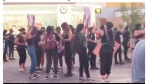
Grupo de feministas en uno de los accesos del palacio municipal.