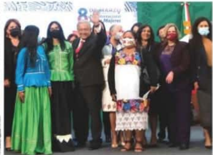
EL PRESIDENTE, ayer, con las mujeres de su gabinete en el Salón Tesorería.