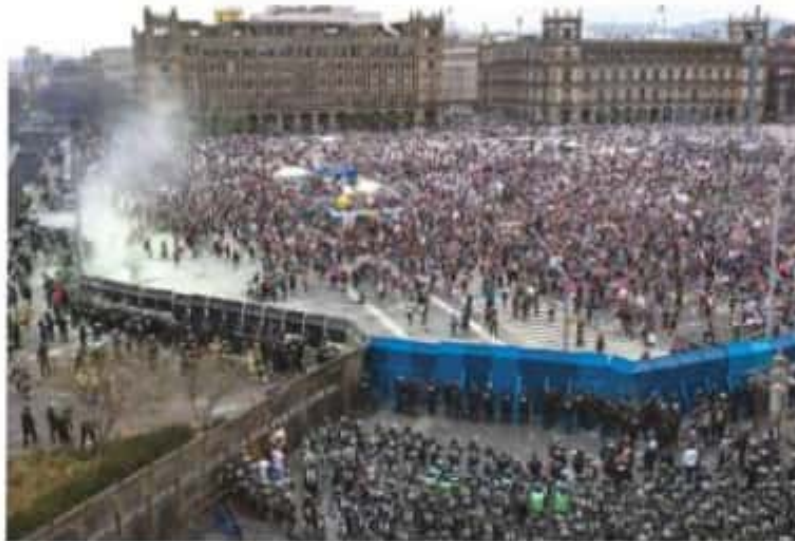
MUJERES de un lado y policías del otro, ayer, en el Zócalo, a la izquierda la muralla de Palacio vulnerada.