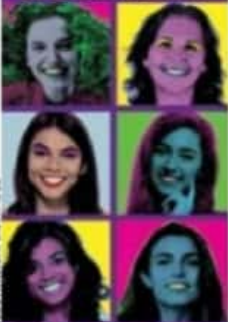
ILUSTRACIÓN: EDP, KNOW