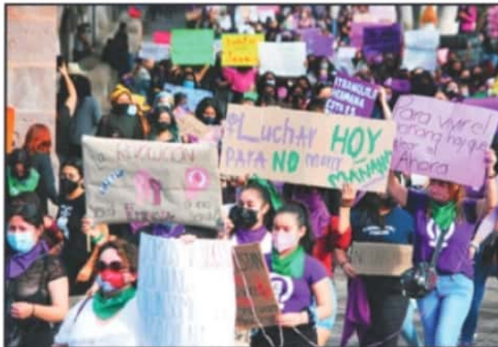
En el marco del Día Internacional de la Mujer, miles de féminas se manifestaron en el Centro Histórico de Morelia, lanzando consignas contra la inoperancia de las autoridades y realizando pintas en edificios.

■ EL GOBERNADOR SILVANO AUREOLES ACEPTA: HAY UNA DEUDA HISTÓRICA DE LOS GOBIERNOS CON LAS MUJERES