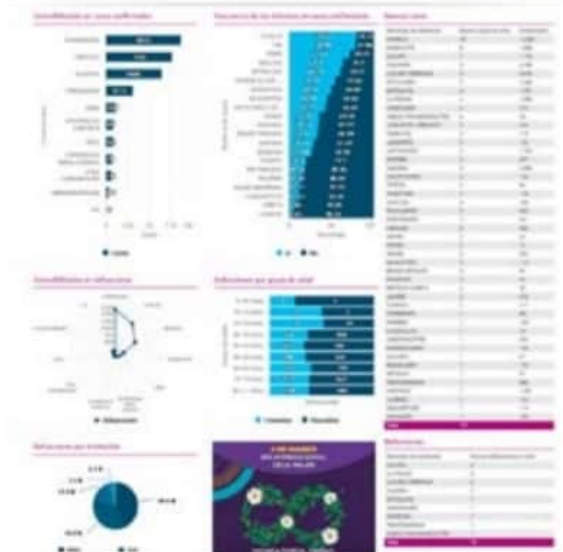
El municipio porteño inició la segunda semana con 5 nuevos casos de COVID-19 y dos nuevos decesos también.