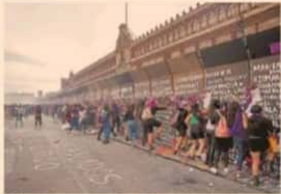
Mujeres piden consignas en la valla frente a Palacio Nacional. ■ PÁG. 45

Off pide prioridad en empleo para las mujeres.