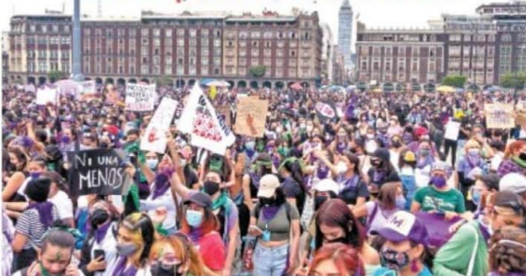
Miles de mujeres llegaron al Zócalo durante las jornadas, gritando consignas que se han convertido en símbolos. "La policía no me cala, me calan más amigas", "¡Basta con la violencia!" y "¡Ni una menos!".

Hartas de la violencia y la impunidad, las mujeres de México inundan el país con su ola morada para reclamar al gobierno la indiferencia ante feminicidios, acoso sexual y laboral, e inequidad de género