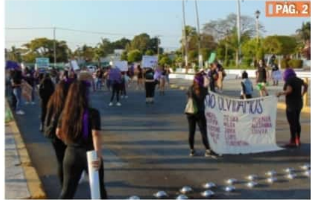
CD. LÁZARO CÁRDENAS, MICH.- Integrantes del colectivo Diosas del Hueyatl, se manifestaron, en el marco del Día Internacional de la Mujer.