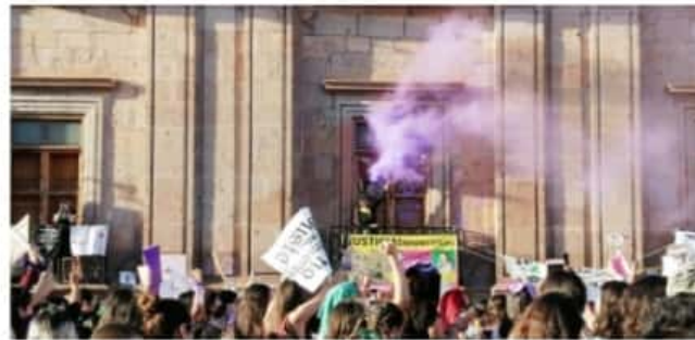
MORELIA, MICH.- En Morelia, se registró una marcha en la que participó una gran cantidad de mujeres; la mayoría utilizaba prendas de colores verde morado.

Una vez que las mujeres se constituyeron al exterior de Palacio de Gobierno hicieron diferentes actividades de protesta. En cuanto a la Policía, los oficiales apoyaron para abrir pasó al contingente y después se mantuvieron expectantes a una distancia prudente.