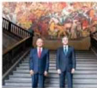
Los ministros de Justicia de México y Estados Unidos, Alfonso Ruira y Jeffrey Rosen, en un momento de su reunión en Washington.

Los gobiernos de México y los Estados Unidos han firmado el paradigma de su lucha conjunta contra el crimen organizado que opera en ambos países.