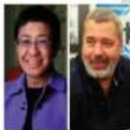
Maria Ressa y Dmitri Muratov.

Indito. El Nobel de la Paz reconoció este viernes por primera vez la libertad de expresión e información con un premio a dos periodistas, la filipina Maria Ressa y el ruso Dmitri Muratov. Ressa y Muratov fueron premiados "por sus esfuerzos para defender la libertad de expresión, condición previa para la democracia y la paz duradera", señaló el Comité Nobel. PM13