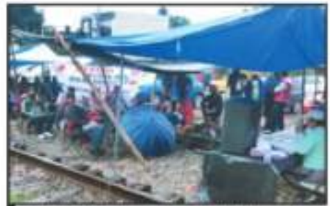
LAS DESTRUCCIONES A LAS VÍAS FÉRREAS POR PARTE DE PROFESORES SON EN PROTESTA POR LA FALTA DE PAGOS DEL GOBIERNO FEDERAL.