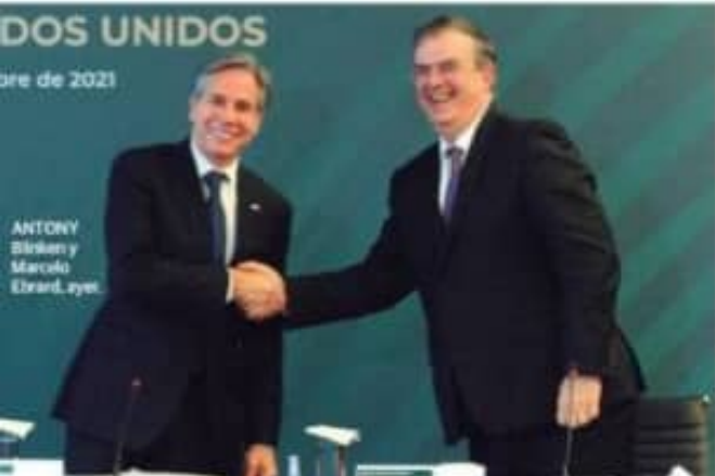
ANTONY Blinken y Marcelo Ebrard, ayer

ÉXITO se medirá por baja de homicidios y menos consumo de drogas. Ebrard, adicciones y armas, nuevos ejes de "alianza" págs. 3 y 5