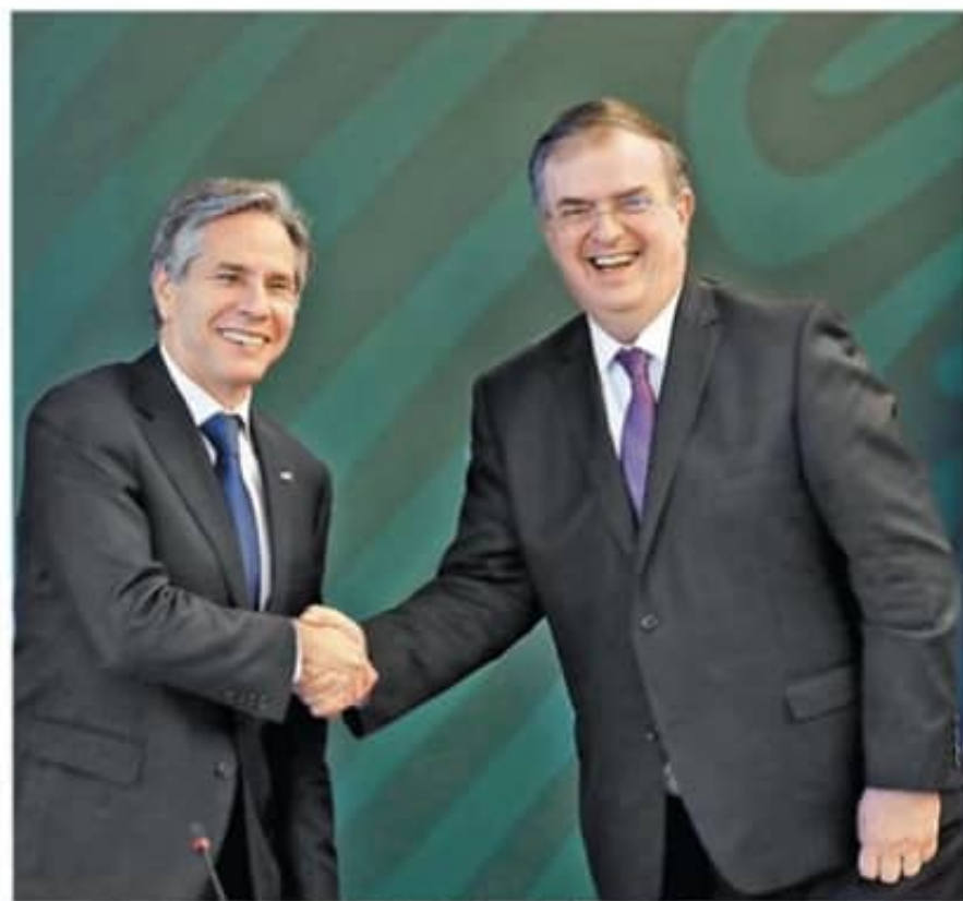
El secretario de Estado de EU visitó a Marcelo Ebrard en el edificio de la SE.