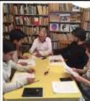
Talleres de creación literaria en Zitácuaro