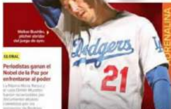
Walker Buehler, pitcher ganador del Juego de hoy.