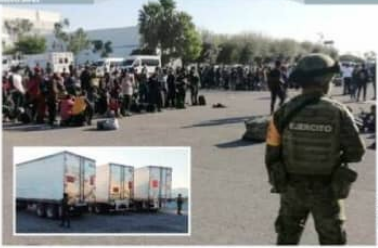
LOS MIGRANTES, en la carretera Ciudad Victoria-Monterrey, ayer

EU busca frenar muro fronterizo en Laredo, El Centro y el Valle de Rio Grande; va por "medidas inteligentes" pág. 6 y 14