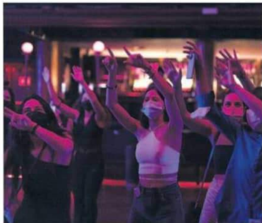
Jóvenes bailaban en la madrugada de ayer en la sala Apolo de Barcelona. 1 de octubre de 2021