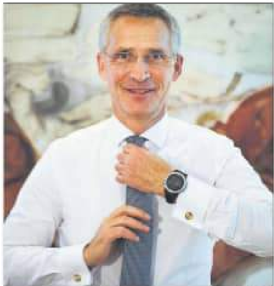
JENS STOLTENBERG SECRETARIO GENERAL DE LA ALIANZA ATLANTICA