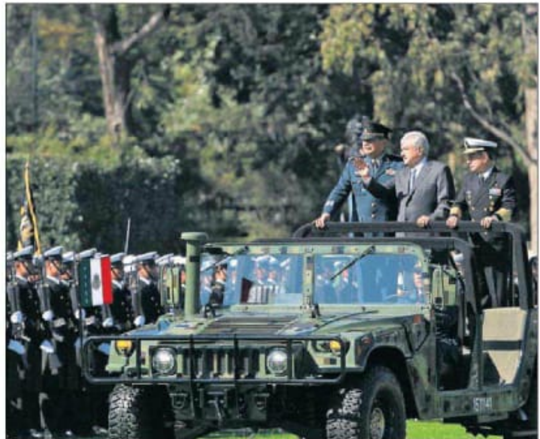
López Obrador pasa revista a las Fuerzas Armadas, ayer en Ciudad de México.

La magnitud y violencia de las protestas de los chalecos amarillos , el movimiento sin líderes ni programa que nació contra el impuesto al diésel en Francia, ha evidenciado la falta de reacción del presidente francés, Emmanuel Macron, justo en su peor momento de popularidad al frente del Elíseo. Macron reunió a su gabinete de crisis y pidió al primer ministro Édouard Philippe que reúna a los representantes del movimiento para iniciar el diálogo. PÁGINA 6