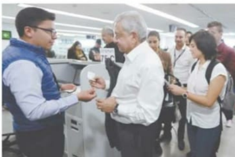
El presidente Andrés Manuel López Obrador abrió ayer un vuelo rumbo a Veracruz, desde el Aeropuerto Internacional de la Ciudad de México. El titular del Ejecutivo federal viajó en una aeronave de la empresa Aeromex.