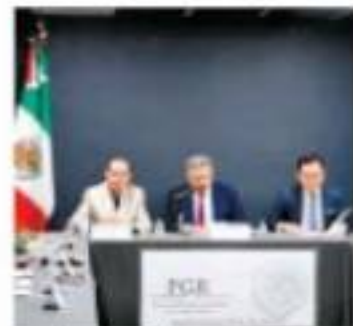
Sin Enrique Alfaro.