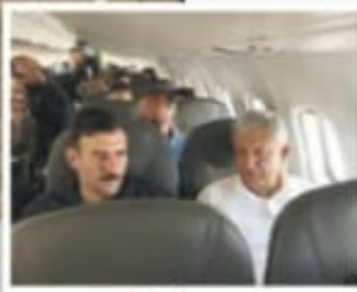
El TP 01 será exhibido en California por Boeing, para venderlo. Mientras, AMLO viajó ayer a Veracruz en vuelo comercial.