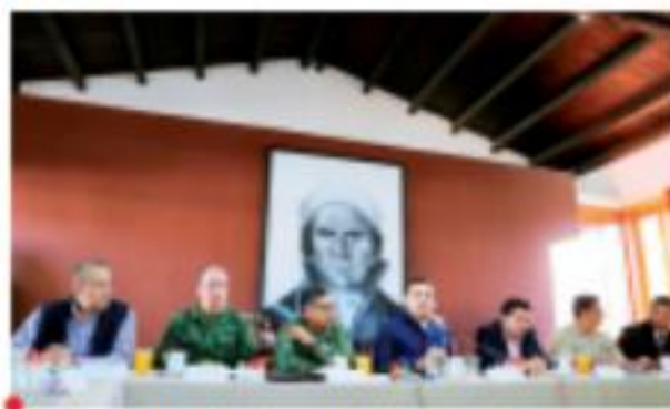
En la reunión celebrada ayer, el GCM conoció los particularidades de la estrategia federal con el objetivo de coordinar esfuerzos.