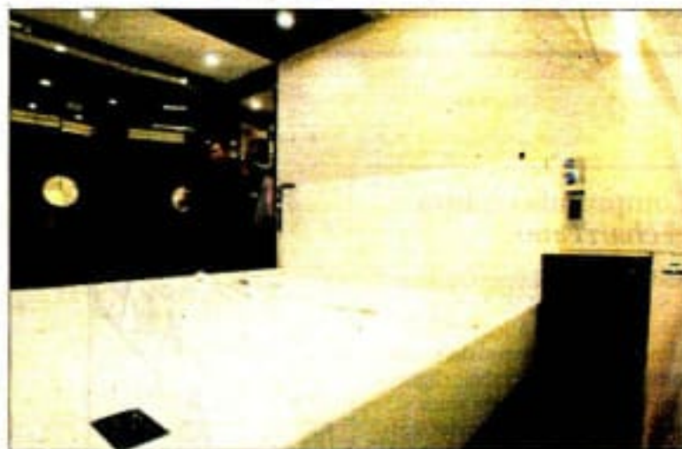
▲ La nave presidencial TP01 Boeing 787-8, José María Morelos y Pavón, tiene una longitud de 57 metros y una capacidad para 80 pasajeros; fue utilizado en 214 viajes por el ahora ex presidente