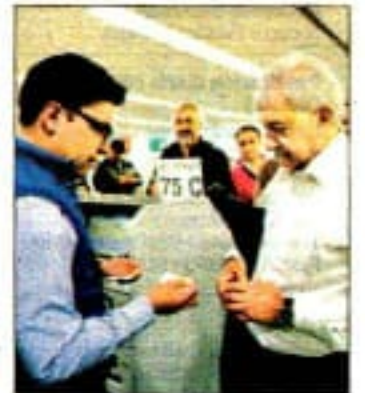
Andrés Manuel López Obrador se registra en el mostrador de Aeromar para viajar a Veracruz.