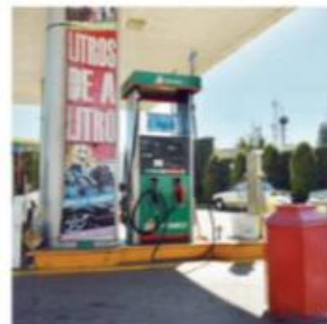
Los dueños de las estaciones descartaron una crisis como la de 2016.

Prieto Gómez mencionó que la situación no será una crisis de gasolineras, como la que Michoacán y otros estados del centro y bajo del país padecieron en 2016, por lo que "aunque no hay bastante producto para satisfacer la demanda, no nos vamos a quedar sin combustibles"; lo anterior, porque Pemex les informó que en breve restablecerá el servicio.