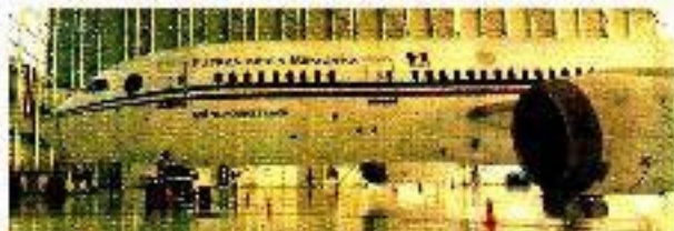
MUDAN AVIÓN A CALIFORNIA

El presidente Andrés Bello López Obrador pidió a los militares que trabajen con el pueblo para resolver el problema de la inseguridad y la violencia. El presidente dijo que el pueblo necesita a sus militares y que todos deben trabajar juntos para resolver el problema de la inseguridad y la violencia.