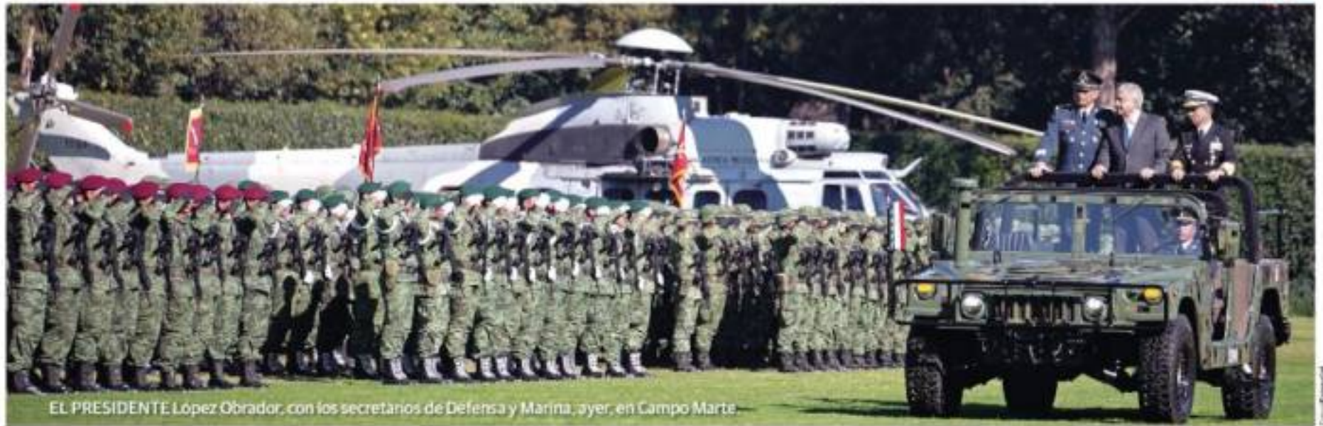
EL PRESIDENTE López Obrador, con los secretarios de Defensa y Marina, ayer, en Campo Marte

Encabeza primera ceremonia de salutación; refrenda petición de apoyo para crear Guardia Nacional contra inseguridad. pág. 4